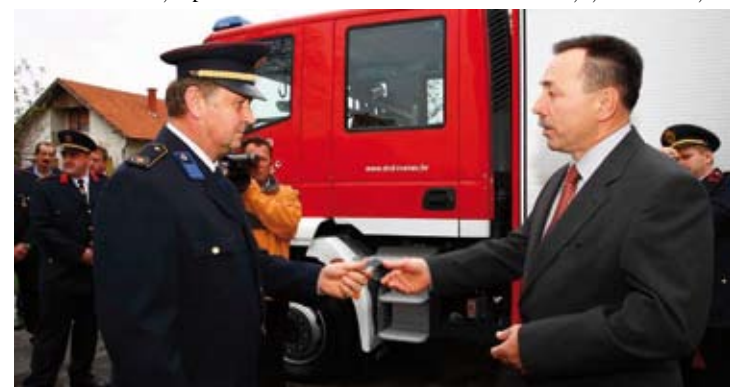
Predani ključevi vozila

Središnja svečanosti održana je u amfiteatru Srednje škole. Nakon odavanja počasti svim