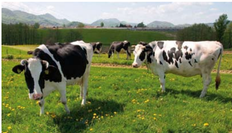
Stočari mogu dobiti upute o pripremi kvalitetne silaže

Naglasio je da, otkako je resorno ministarstvo donijelo odluku da će država, radi stimuliranja sitnih poljopri-