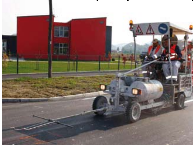
Na županijskoj cesti kroz Salinovec položen je novi asfaltni sloj

KAPITALNI PROJEKTI U tijeku su pripreme za gradnju spoja ulice Rajterova-Malezova, kao preduvjeta za zatvaranje špice od prometa i njeno pretvaranje u pješačku zonu