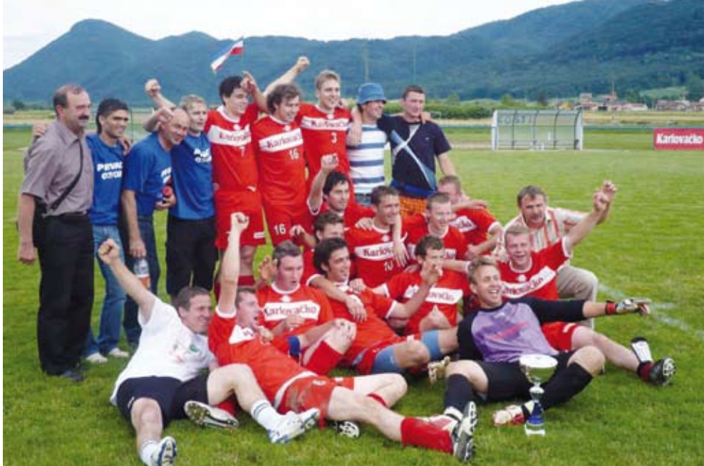
Radost nakon osvajanja naslova prvaka u ŽNL Varaždin i plasmana u 1. županijsku ligu

U finalu Ivančani su u gostima pobijedili Grafičar sa 60:58 i osvojili naslov pobjednika Županijskog košarkaškog kupa. (nn)