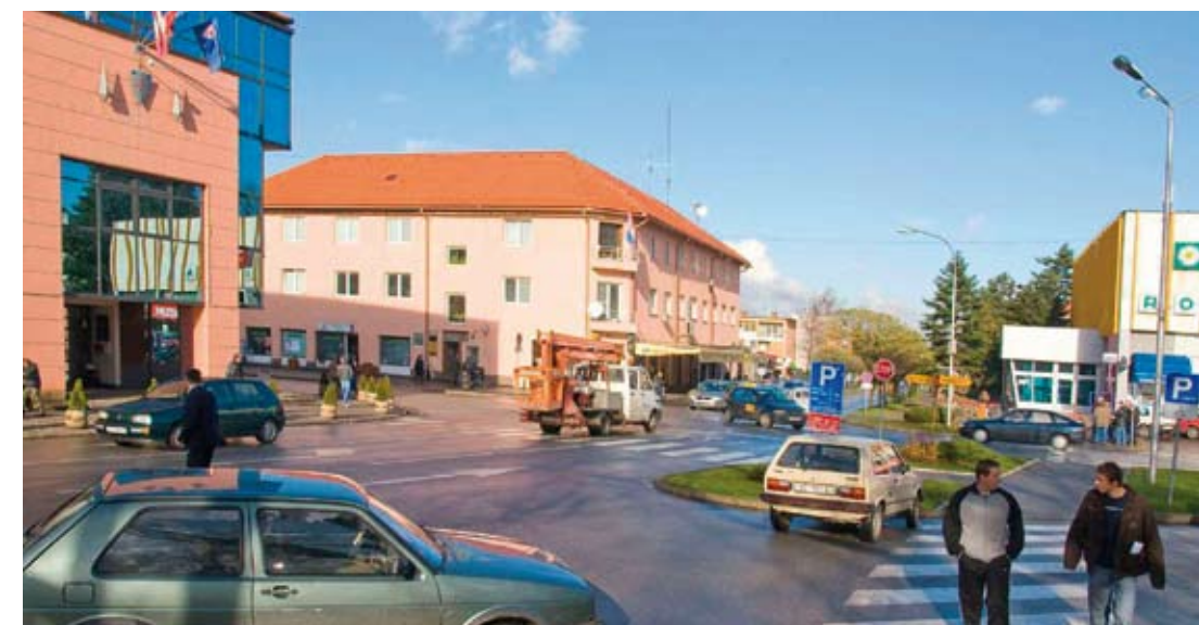
Ivanečko središte u prometnom je kolapsu

razvoju lokalne zajednice. Riječ je o vrlo zahtjevnom projektu, koji obuhvaća regulaciju i cjelovito uređenje Bistrice, gradnju prometnice te djelomično rješavanje problema vodoopskrbe. Projektna dokumentacija za to već je dovršena – kaže gradonačelnik Batinić.