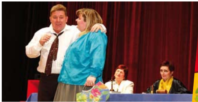
Članovi KUD-a Strahoninec sjajno su zabavili publiku predstavom Fačuk, a i uoči početka zbivali su šale iza kulisa

Te večeri, sasvim sigurno u cijeloj Hrvatskoj nije bilo namijanijeg kraja od ivanečkog, a o tome svjedoči podatak da se na predstavama okupilo više od 2000 posjetitelja. To ujedno znači da je Rega sjajno uspjela, pa stoga i ne čudi zadovoljstvo njegovih organizatora iz