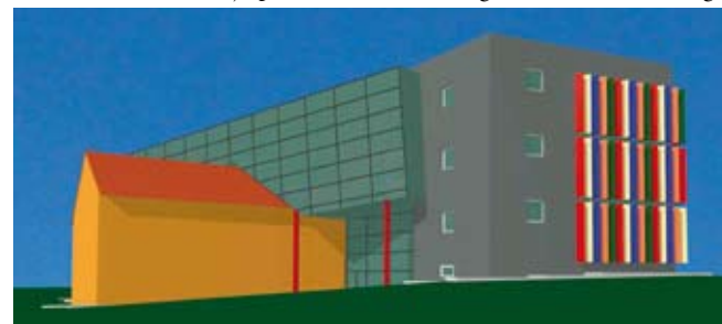
Računalna projekcija: Ovako bi trebao izgledati budući Centar za kulturu

Realizaciju pojedinih programa, za koje tržište pokazuje interes, Učilište zbog spomenutih razloga mora „kočiti“. Stoga