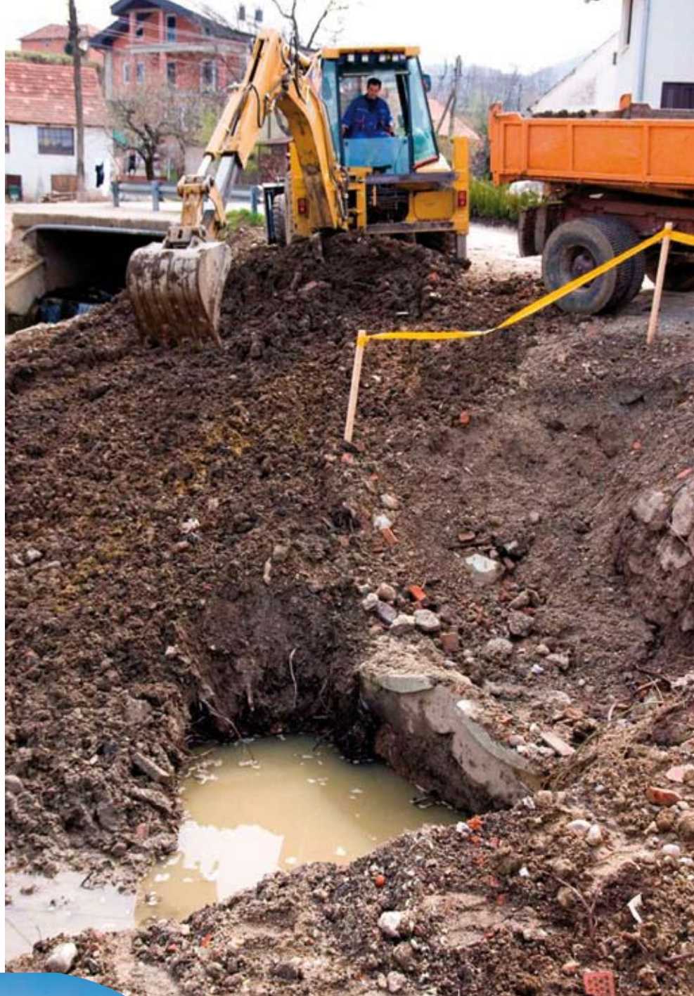
...komunalci su najprije strojem otkopali zatrpan izvor