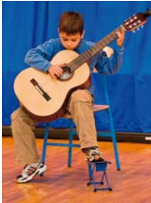
Učenici su nastupima izazvali ponos roditelja

Djeca će tijekom školske godine 2008./09. imati još barem tri javne produkcije, a češći javni nastupi i snimanje