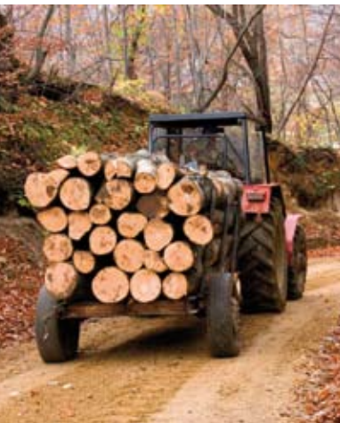
Centar brine i o privatnim šumama

Centar su zajednički u listopadu lani osnovali Grad Ivanec, Ministarstvo znanosti, obrazovanja i športa, Ministarstvo poljoprivrede, Varaždinska, Koprivničko-križevačka, Krapinsko-zagorska i Medimurska županija te Hrvatske šume. Osnovan je u cilju što uspješnijeg povezivanja znanja i usluga na programima i projektima u području šumarstva. Tako će zaposlenici Centra, među ostalim, surađivati i na izradi istraživačkih, znanstvenih, stručnih i savjetodavnih programa i