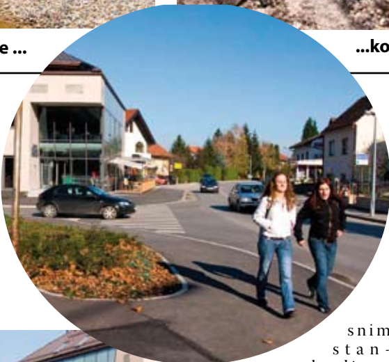
s n i m s t a n d a r d i m a .

Usto, na ulaznom dijelu uređena i lijepa cvjetna površina asimetrična oblika. Prethodno je u Kumičićevoj sagrađen i nogostup, a nakon toga Grad je inicirao radove na gradnji novog parkirališta. Temeljem natječaja, radovi su povjereni varaždinskom Poduzeću za ceste. Na parkiralištu je uređeno dvadesetak parkirnih mjesta, namijenjenih isključivo stanařima triju stambenih zgrada u toj ulici. Gradnja nogostupa i parkirališta stajala je 134.000 proračunskih kuna. Svim tim zahvatima Kumičićeva je uvelike osuvremenjena i urbanizirana i pretvorena u modernu gradsku ulicu. (ljr)