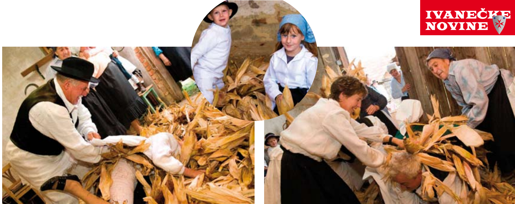
Tko kaže da se odrasli ne znaju zabavljati?

Centar za urbane i privatne šume zapošljava dva djelatnika, a sjedište mu je u Varaždinu, u prostorima Koprivničke podružnice Hrvatskih šuma. Osnivanje i šestmesečni rad dva zaposlenika u Centru Grad Ivanec će, prema zaključenom sporazumu, sufinancirati s 20.000 kuna. (ak)