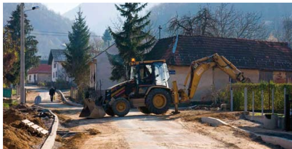
U Rajterovoj ulici u tijeku su vrlo složeni i skupi rekonstrukcijski radovi

će stajati daljih 89.000 kuna. U Rajterovoj ulici rješava se i vodoopskrba. Polaganje novih vodovodnih cijevi na pravcu dugom 1000 metara koštat će gotovo milijun kuna, a Grad Ivanec te radove pokriva svotom od 620.000 kuna. Tome još treba dodati i troškove rekonstrukcije NN-mreže, čija je vrijednost 520.000 kuna.