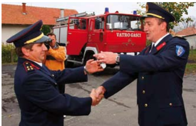
Ključevi rabljenog vozila za susjedni DVD u Gaćicama

Na žalost, ivanečki vatrogasci ni u večeri svoga slavlja nisu bili bez brige. Već u 2 sata nakon ponoći oglasila se sirena, pa su odmah krenuli na tehničku intervenciju na cesti Trakošćan-Cvetlin. Tamo su iz vozila izvlačili muškarca stradalog u prometnoj nesreći, koji je potom zbog teških povreda prebačen na liječenje u Zagreb. (ljr)