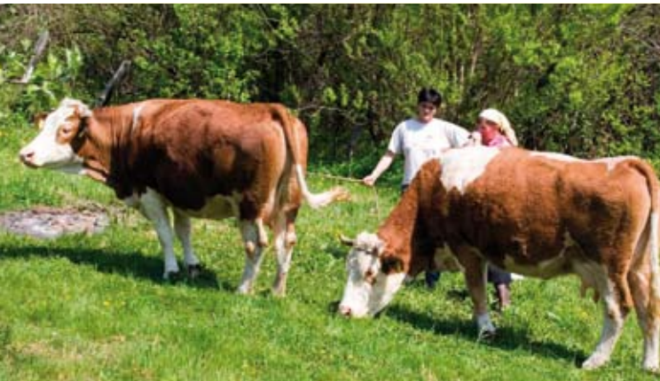
Glavni cilj je pomoć seljacima s malim brojem grla

MLIJEKO U Poslovnoj zoni Ivanec-istok sve spremno za minimljekaru