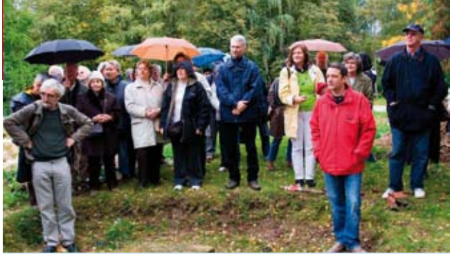
Ugledni stručnjaci i sveučilišni profesori iz cijele Hrvatske smještaju Ivanec među ključna otkrića na području staroslavenskih studija

STARI GRAD IVANEC Što arheolozi, arhitekti i povjesničari umjetnosti kažu o lokalitetu nekadašnjega Kukuljevićeva grada?