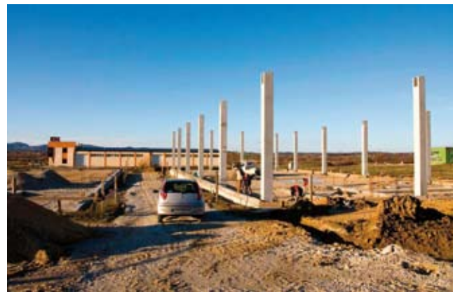
Poslovna zona Ivanec-istok postaje veliko gradilište