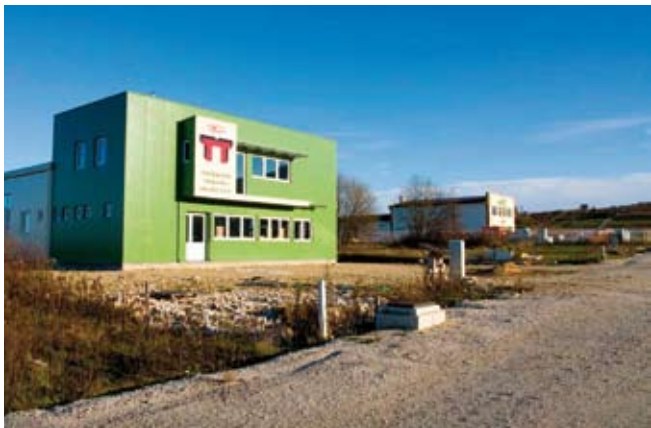
U Poslovnoj zoni Ivanec-istok svoje su poduzetničke aktivnosti dosad aktivirale četiri tvrtke

Iako je bilo planirano da se cijela zona opremi do 2007. godine, to, na žalost, nije ostvareno. Glavni razlog tome je smanjivanje novca. Ministarstva, mjerodavni državni fondovi i Varaždinska županija nisu u značajnijoj mjeri podržali projekt Poslovne zone Ivanec-istok, dok su gradska proračunska sredstva premala za realizaciju tako ozbiljnog projekta. Unatoč očitoj zainteresiranosti poduzetnika i mogućnosti da se u zoni pokrene razvitak gospodarskih djelatnosti, ali i unatoč toliko proklamiranoj potrebi razvitka gospodarstva, iz takozvanih viših instanci nije uslijedila odgovarajuća potpora Gradu Ivancu. Stoga se Grad oslonio na vlastite snage.