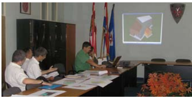
Prva verzija budućeg Centra svim zainteresiranim stranama već je predstavljena u Gradskoj vijećnici

Kako bi se „zatvorila“ financijska konstrukcija budućeg, vrlo suvremenog Centra za kulturu, građevinski vrijednog 20 milijuna kuna, Grad Ivanec prodat će poslovne prostore gradskih ustanova, te dio svojih nekretnina. Konkretno, riječ je o poslovnom prostoru Gradske knjižnice i čitaonice Gustav Krklec u Šabanovoj ulici, zatim, o kinodvorani Pučkog otvorenog učilišta Đuro Arnold u strogom centru Ivanca, o zgradi Glazbene škole u Nazorovoj ulici 46 (nekadašnja knjižnica i vrtić), te o dvije nekretnine u vlasništvu Grada Ivanca, i to dijelu prostora u stambenoj zgradi u Gajevoj ulici, te staroj zgradi sa zemljištem na atraktivnoj parceli u ivanečkoj Malezovoj ulici, koja je pogodna za gradnju stambeno-poslovnog objekta.