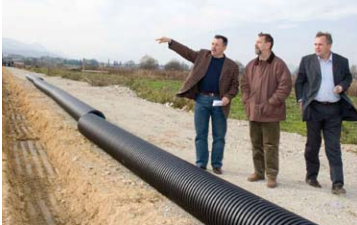
Ivanec je zonu uglavnom opremio vlastitim sredstvima

Potpuno opremanje cijele zone komunalnom i drugom infrastrukturom planira se realizirati zaključno s 2009. godinom, a za njihov dovršetak potrebno je osigurati još 8,7 milijuna kuna. (lir)