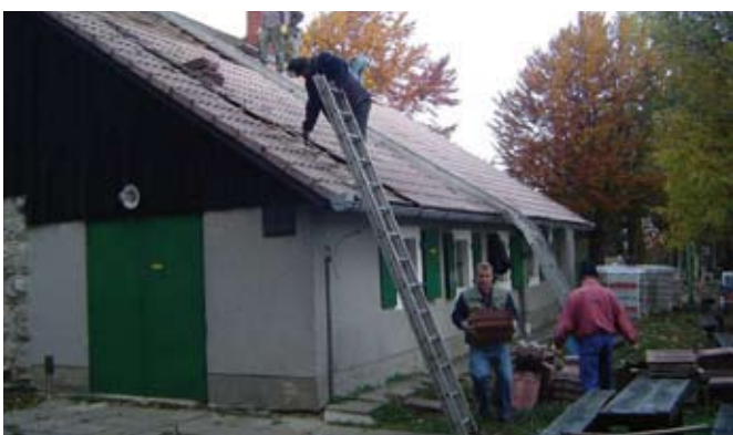
Članovi HPD-a priskočili su u pomoć

Članovi ivanečkog HPD-a Ivančica nakon višemesečnih su priprema u listopadu kraju priveli velik posao – sagradili su novi krov na objektu Planinarskog doma na Ivančici. Iako je postavljanje nove „kape“ bilo povjereno iskusnom majstoru Franji Habeku, u pomoć su, ne žaleći truda i vremena, priskočili i brojni članovi HPD-a. Ukupno ulaganje planinare je stajalo 85.000 kuna, a dom je obnovljen o ovogodišnjem obilježavanju 110. obljetnice organiziranog planinarstva u Ivancu.