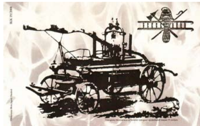
Dopisnica je kolekcionarske vrijednosti, s motivom povijesne štrcaljke ivanečkih vatrogasaca s kraja 19. stoljeća

– Uz znatna sredstva, koja se iz gradskog proračuna izdvajaju za redovitu djelatnost ivanečkog vatrogastva (ukupno 450.000 kuna za potrebe Gradske vatrogasne zajednice), moram naglasiti da u Poglavarstvu nije bilo nikakvih kolebanja o tome da li se odazvati zamolbi DVD-a Ivanec za pomoć u nabavi novog navalnog vozila. Znaajući za što će ga vatrogasci rabiti, odobrili smo 114.000 kuna udjela za odobravanje leasinga, te smo se opredijelili da kroz kapitalne donacije tijekom idućih pet godina svotom od 95.000 kuna na godinu otplaćujemo leasing. U ime Poglavarstva, mogu samo izraziti nadu da smo time DVD-u pomogli u obavljanju njegove humanitarne aktivnosti te pokazali opredjeljenje da vatrogastvu pomognemo na najkonkretniji način – kazao je na svečanosti gradonačelnik Milorad Batinić. (ljr)