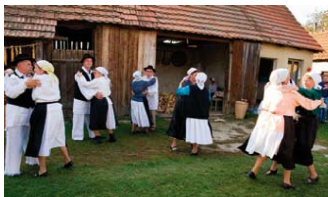
Nakon jezdjenja, valja i zaplesati

kurušnjake. A za to vrijeme prizori konjskih zaprega, koje teško vuku kola s ubranim kukuruzom, topli ivanečki običaji komušanja na kojima se radošno okupljalo cijelo susjedstvo, jezdjenje, stare žetvene pjesme, guširanje mošta i specijaliteta domaće ivanečke kuhinje, sve to gotovo je palo u zaborav.