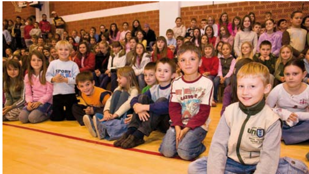
Roditelji su vrlo senzibilizirani za razinu školskog standarda i sigurnosti djece

To su samo neka od brojnih pitanja što su ih na svom prvom sastanku u novoj školskoj godini postavili članovi Vijeća roditelja Osnovne škole Ivana Kukuljevića Sakcinskog u Ivancu, tijela koje čine predstavnici ukupno 43 razredna odjela iz matične škole u Ivancu te područnih škola u Prigorcu, Kuljevčici i Salinovcu. Da su roditelji jako senzibilizirani za pitanja poboljšanja učeničkog standarda i sigurnosti djece, pokazuje i to da je bilo i pitanja o tome može li se oko igrališta u PS Kuljevčica postaviti zaštitna