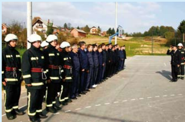
Smotru vatrogasaca izvršio je glavni vatrogasni zapovjednik RH Mladen Jurin

O djelovanju DVD-a u prošlih pet godina govorio je njegov predsjednik Ivan Vresk: