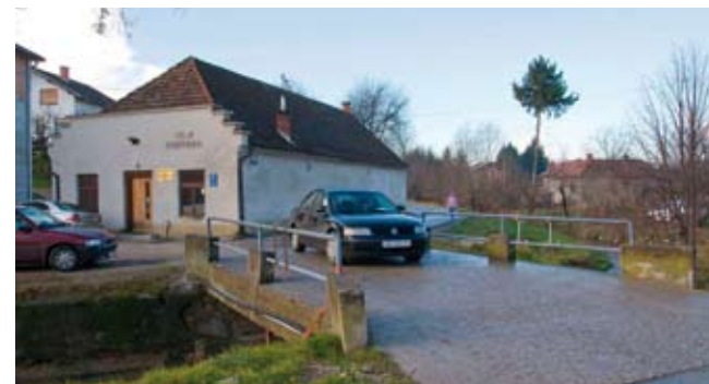
Trasa buduće ceste prolazi pokraj Obrtničkog doma

Sporazumom je predviđeno da ministarstvo i Grad ulaganje financiraju u omjeru 60:40 posto. - Grad Ivanec za to će ulaganje izdvojiti 2,5 milijuna kuna, dok ostatak osigurava resorno ministarstvo iz programa EIB II, namijenjena integralnom