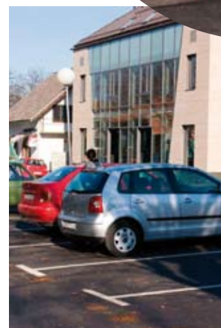
Kumičićeva ulica pretvorena je u modernu gradsku prometnicu

Podsjećamo, počeli su opsežnim radovima na rekonstrukciji ulaza u Kumičićevu iz Varaždinske ulice. Budući da je Kumičićeva u gradskoj nadležnosti, dok je Varaždinska ulica županijska cesta, ulaganje su zajedno financirali Grad Ivanec i Županijska uprava za ceste. Pritom je raskrižje, koje je dotad bilo vrlo opasno, jer su vozači na dijelu neuređena kolnika i na nogostupu masovno parkirali vozila, osuvremenjeno po najvišim sigurno-