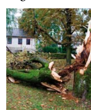
Program gospodarenja što ga izrađuje Šumarski institut, stručno će odgovoriti i na pitanje – kako riješiti problem malog parka u Ivancu?

Dok dio građana toga kvarta smatraju da stare kestene i breze u njemu treba srušiti, jer su potencijalno opasni za prolaznike, drugi se tome protive, smatrajući da bi sječa zrelih sta-