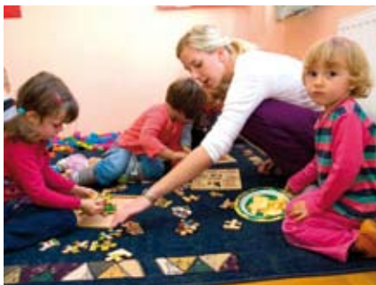
Popularne programe pedagoških igraonica Učilište provodi u nizu malih naselja bivše ivanečke općine

To potiče i Općina Bednja, koja roditeljima za sve polaznike programa subvencionira školarinu s 50 posto novca, a za drugo dijete 75 posto. Usto, Općina je pokrila i troškove nabave tepiha za igru djece, a