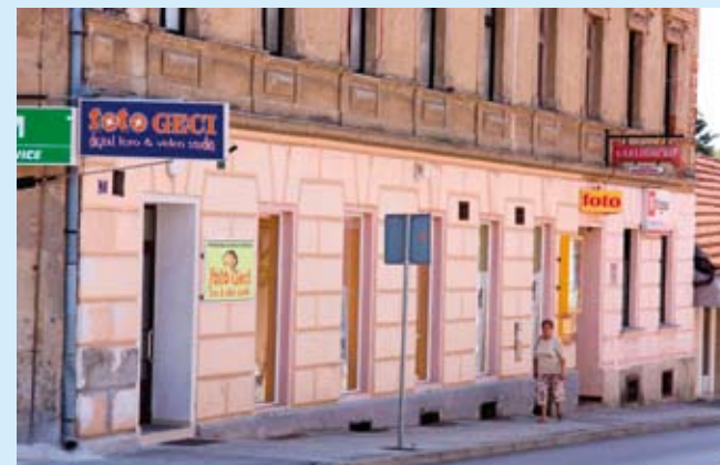
Za dogradnju ili preuređivanje starijih građevina, kao što je ova u Malezovoj ulici, ubuduće morat će se tražiti posebne smjernice i dozvole

Dio medijskog prostora u prvom broju Ivačkih novina posvećujemo i vrlo važnoj temi, Detaljnom planu uređenja zone užega centra Ivanca, što ga je usvojilo Gradsko vijeće. Važno je reći da je riječ o jednom od ključnih prostorno-planskih dokumenata, na čiju se izradu i donošenje čekalo tri godine. Usvajanjem Detaljnog plana je, nakon tri godine faktičke blokade i nemogućnosti da se izvode bilo kakvi radovi i zahvati u prostoru, ponovno omogućena gradnja u centru.