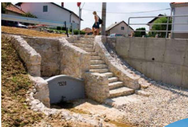
Da bi Pavlinjak uredili kao odmoriste ...

Lijepa gesta Ivkoma naišla je na odobravanje građana, to više što je izvor pri Pavlinjakima, uređen davne 1928. godine, jedan od simbola Vulice, najstarije i najduže ulice u Ivancu. Stariji mještani tvrde da nikad nije presušio, te da se vodom s njega nekad snabdijevalo „pol Vulice i cijeli Ropasov brijeg“. (ljr)