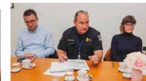
D. Leskovar: Ivanec je siguran grad

stiti o predmetnoj tematici. Nakon pogovora u javnosti i