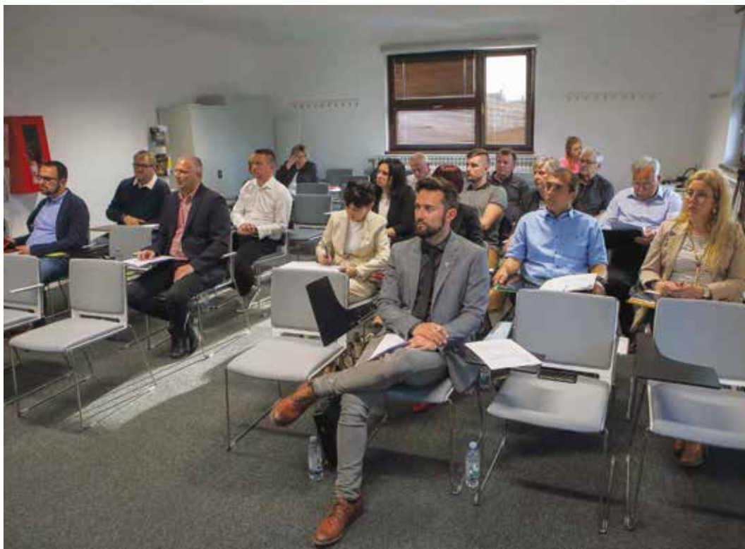
S 35. sjednice Gradskog vijeća Ivanec

Grad Ivanec, istaknuo je, još se uvijek bori s posljedicama lanijskih poplava i bujica, a najveći su problem klizišta (od kojih je najkritičnije u Margečanu). Iako je Grad Ivanec lani