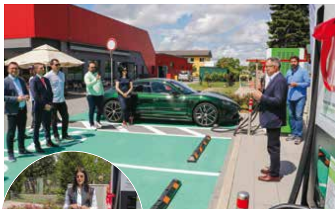
Batinić: Puna podrška razvoju infrastrukture za ostvarenje nisko ugljične mobilnosti

–Izuzetna nam je čast da je GreenWay, kao najveći CPO u Slovačkoj i Poljskoj, prepoznao našu lokaciju i otvorio svoju prvu ultra brzu punionicu u RH upravo u Ivancu. Kao dugogodišnji