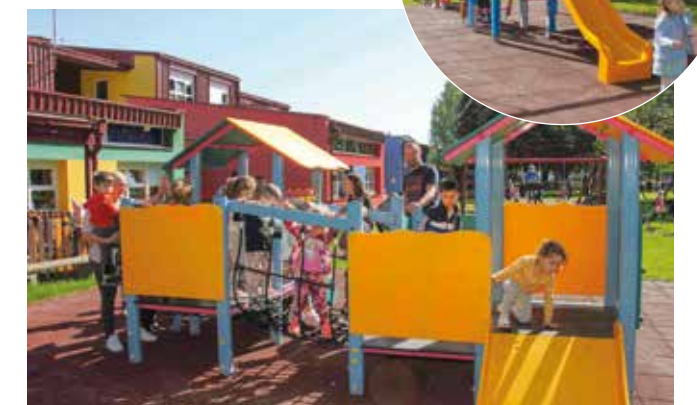
Mala kula za najmlađe polaznike vrtića