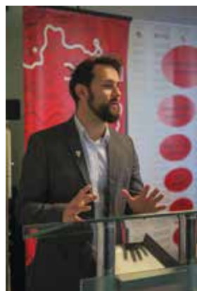
Friščić: I dalje povećana sredstva Grada za vatrogastvo

U 2023., naglasio je Putarek, nije bilo DVD-a na području grada a da u njemu nije došlo do kvalitativnih pomaka u gradnji i opremanju.