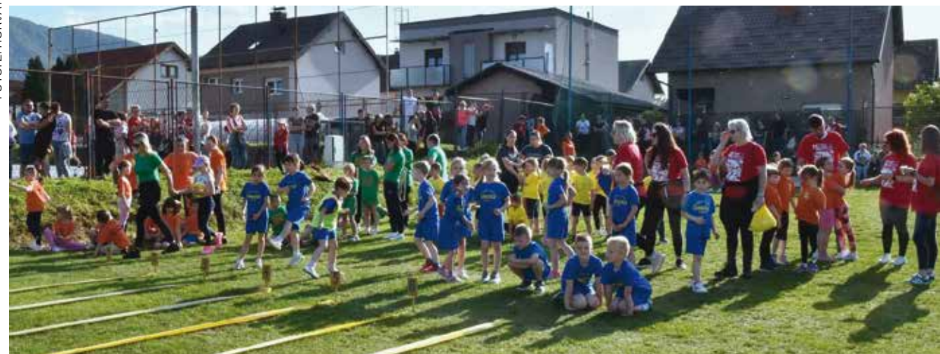
U niskom startu za natjecanja

DJEČJA OLIMPIJADA IVANCU Sudjelovalo više od 310 mališana iz 10 dječjih vrtića