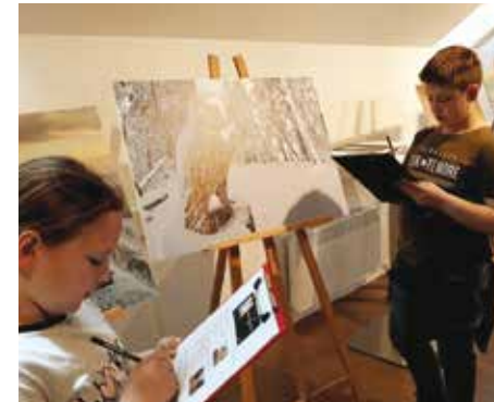
U potrazi za muzejskim predmetima