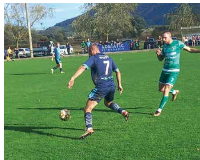
U Ligi za prvaka serija poraza Mladosti

Mladost je pružila velik otpor prvoplasiranoj momčadi lige. Nakon što je u 65. minuti domaćin poveo s 1:0, Mladost je pokušavala izjednačiti, ali strijelci