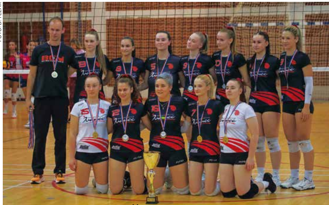
Sjajna generacija ivanečkih odbojkašica – pobjednice 1. B HOL Sjever

♦♦ Kvalifikacijske utakmice za plasman u 1. HOL ŽOK je igrao s Ferivi Višnjevcom