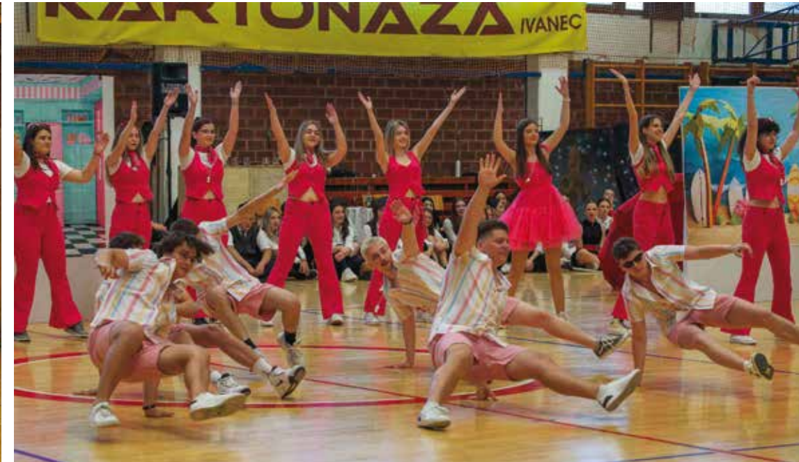
Inspiracija gimnazijalcima 4. G1- vječno mladi Barbi i Ken

SREDNJA ŠKOLA IVANEC Mi-mohodom ivanečkim ulicama i plesno-scenskim programom