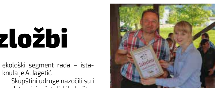
Zahvala Gradu na dugogodišnjoj potpori