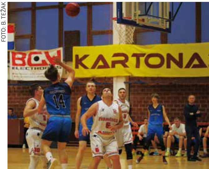
Zasluzena pobjeda ivanečkih košarkaša u Otvorenoj ligi KOŠARKAŠKI KLUB IVANČICA