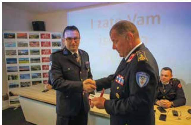
Priznanje ŽVZ-a u povodu 30 godina rada VZ GI