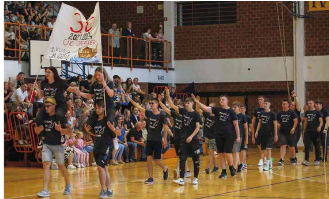
CNC operateri: Zvuni, ja idem!