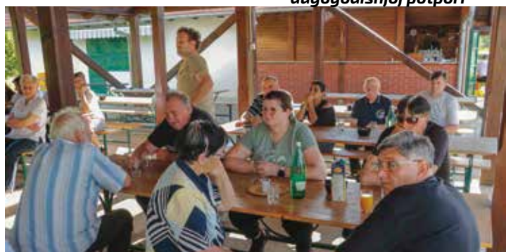
Sa skupštine udruge u Ribičkom domu Ivanec