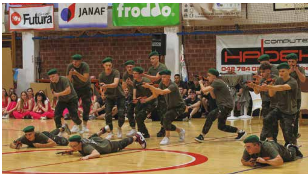
Točka odlično uvježbanih vojnika iz S/D odjela

zahvale na strpljenju, razumijevanju i znanju koje su im prenijeli. Ovogodišnja Norijada u Ivanec bila je dio projekta „Dance, no stress“, koji podržava MZO. Program maturanata pratio je i zamjenik gradonačelnika Marko Friščić (aj)