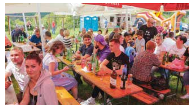
Sjajna proštenjarska atmosfera u Prigorcju