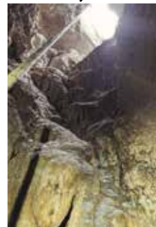
Pogled odozdo: Paklenička luknja