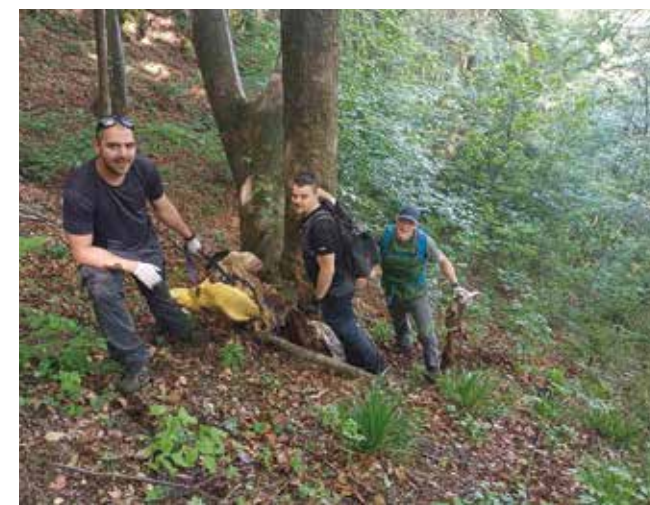
Članovi PK Ivanec u eko akciji na Ivančici

Nakon završetka akcije, dru- ženje sudionika nastavljeno je u pravom prirodničkom tonu, uz pečenjarenje, sokove i gemište. (nn)