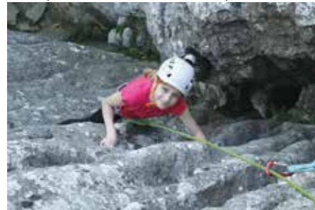
Ova princeza očito uživa u adrenalinskoj avanturi visoko na stijeni

Iako im je to bilo prvo takvo iskustvo, penjači su pokazali zavidnu vještinu u svladavanju prirodnog smjera stijene. Osim penjanja u tzv. smjeru Frodo, koji i odraslim penjačima zadaje Prva avantura na prirodnoj penjačkoj stijeni