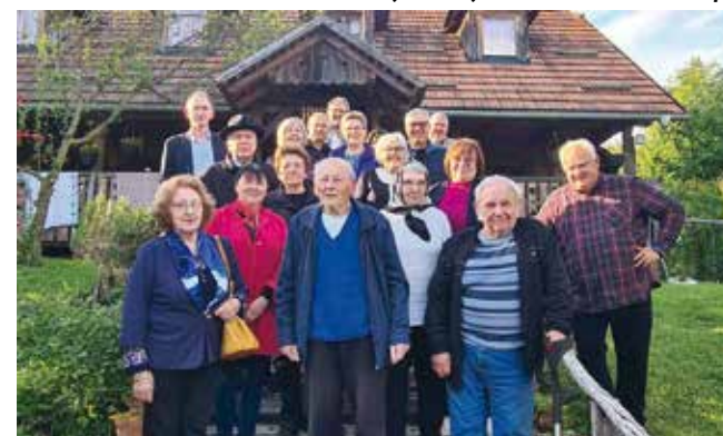
Mala, ali vrijedna udruga širokog interesnog spektra