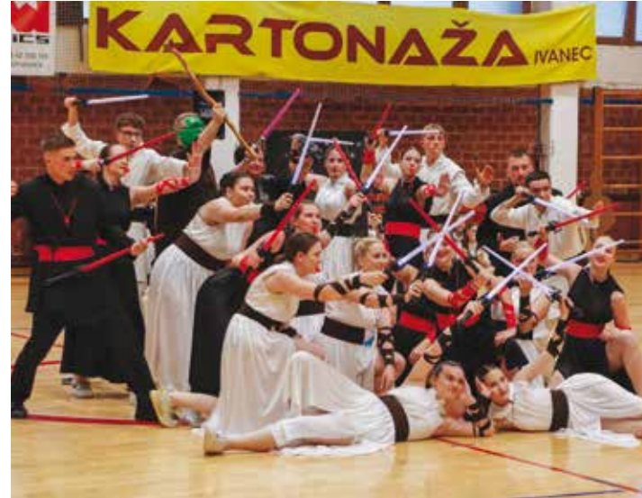
Pobjednički kostimi gimnazijalaca G2 u Star Wars izdanju