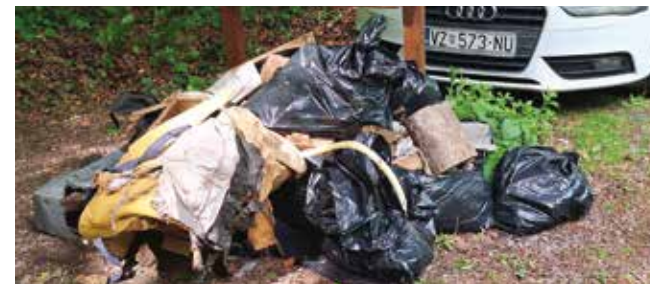
Tužno svjedočanstvo nečije nebrige i bezobrazluka