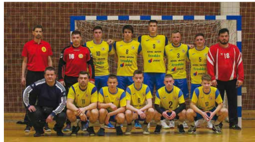
Momčad RK Ivančice peta u 2. HRL Sjever