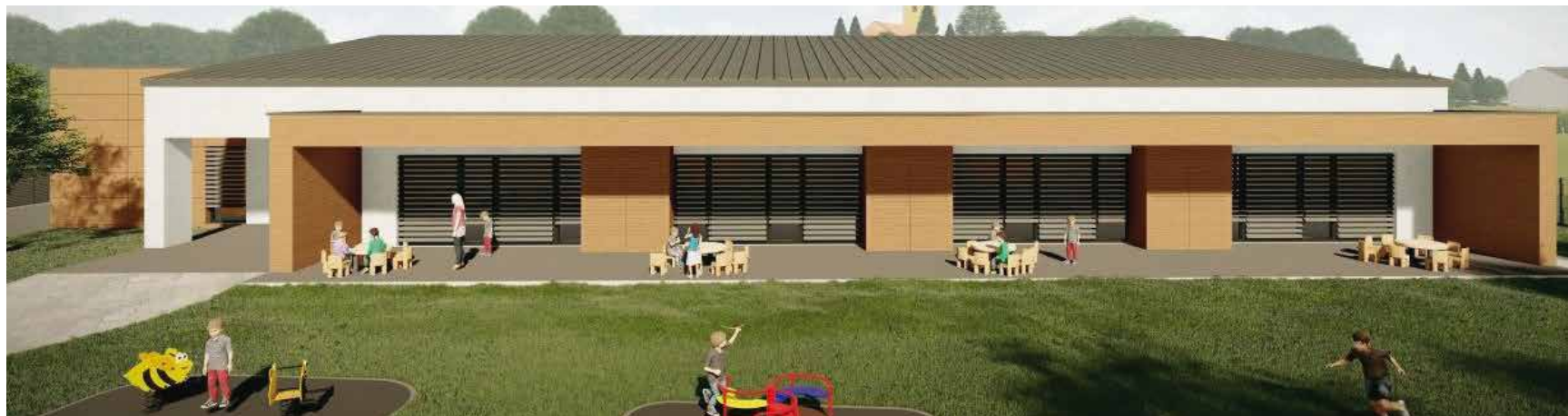
Ovako će izgledati novi dječji vrtić u Radovanu

Na velikom gradilištu na po- vršini koju je još prije nekoliko godina za potrebe gradnje vrtića otkupio Grad Ivanec, u srijedu je, 8. svibnja, simbolično položen kamen temeljac novog objekta dječjeg vrtića Radovan.