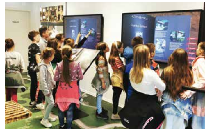
Uz „listanje“ digitalnih albuma, zanimljivo učenje o povijesti ivanečke fotografije