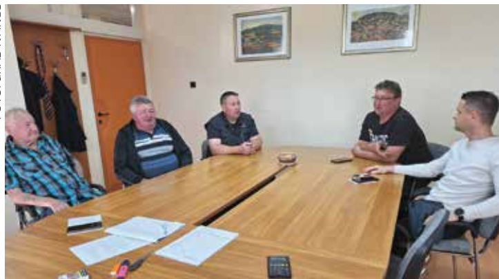
Ogorčeni mještani na sastanku u Uredu gradonačelnika

Ogorčenje mještana je veliko. S obzirom na ocjenu da je riječ o osobama s poremećajima u ponašanju, koje su u odgojnu ustanovu radi počinjenih kaznenih djela smještene temeljem pravomoćne sudske odluke, preseljenje takve populacije u svoje susjedstvo ocjenjuju apsolutno neprihvatljivim. Istaknuli su kako će protiv toga pokrenuti sve moguće pravne postupke te