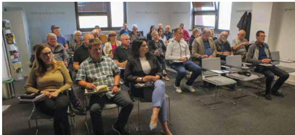
Na novoj edukaciji za udruge u Poduzetničkom inkubatoru Ivanec