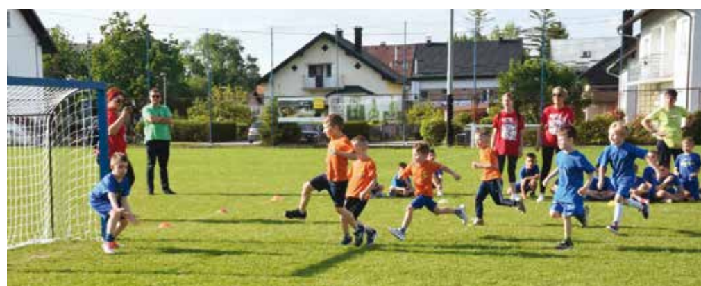
Kao što se kaže – ostavili su srce na terenu!