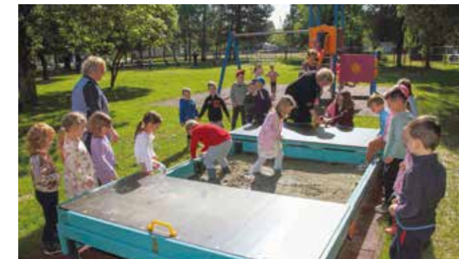
Moderni pješčanik nakon korištenja se zatvara

DV IVANČICE IVANEC Kraju priveden projekt vrijedan 64.700 €