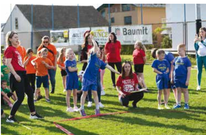
Dobar stil zlata vrijedi!