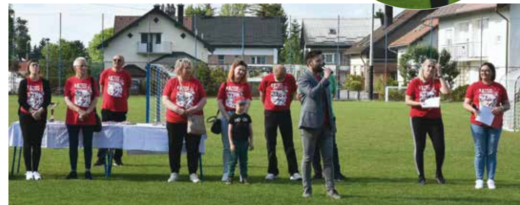
Na otvaranju: Neka natjecanja počnu!

Pobjednici ovogodišnje olimpijade su maleni iz DV Čarolija iz Biljevca, drugi je DV Ivančice Ivanec, a treći DV Bambi Ivanec. Nagradu za fair play osvojili su klinci DV Runolist Žarovnica. (aj)