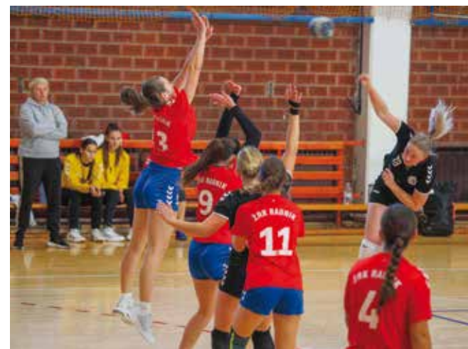
SŽRK Ivanec protekla sezona u znaku uigravanja mladih igračica

Ekipa ŽOK Ivanec 2 osvojila je naslov prvakinja 3. HOL Sjever s 34 osvojena boda, 4 više od drugoplasiranog OK Totovec. Ivanečke odbojkašice su iz 18 odigranih utakmica izborile 17 pobjeda, uz 52 dobivena i 13 izgubljenih setova. Potvrda je to potpune dominacije u ovom rangu natjecanja pod vodstvom iskusnog trenera Ivana Hrga. Ekipa ŽOK Ivanec 2 stekla je pravo igranja kvalifikacija za ulazak u 2. HOL Sjever. (nn)