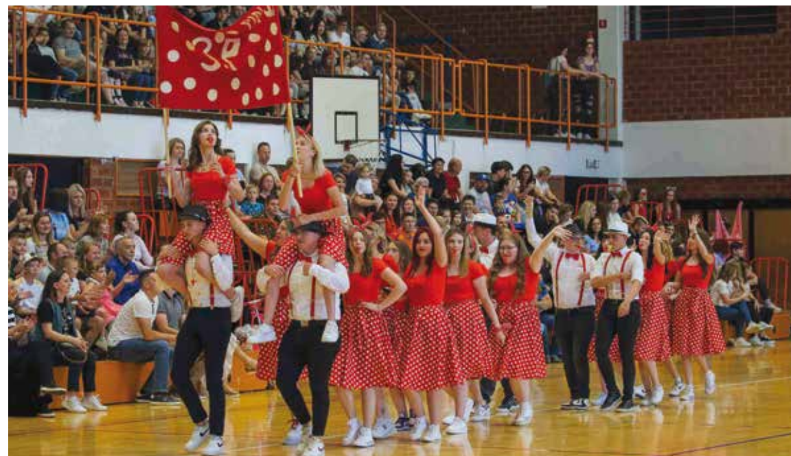
Povratak ekonomista u 20. st. u veselim pin up kombinacijama