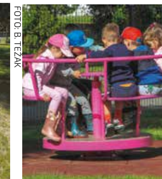
Ajmo, ukrcaj se!