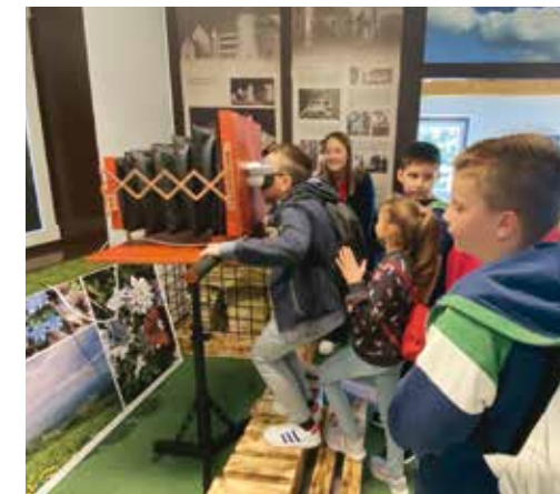
Camera obscura „skriva“ virtualne naočale i zanimljiv posjet Starome gradu