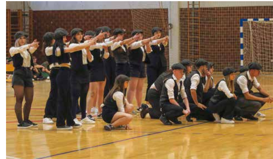
Nastup inspiriran poznatim serijalom Peaky Blinders

NA DUHOVE U PRIGORCU Veliko slavlje ivanečkog glazbenog brenda