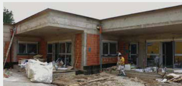
Grad dograđuje i vrtić u Ivancu, vrijedan daljnjih 1,3 mil. €, a od čega 50% osigurava Grad, a ostalih 50% je iz NPOO

DV IVANČICE IVANEC Kraju priveden projekt vrijedan 64.700 €