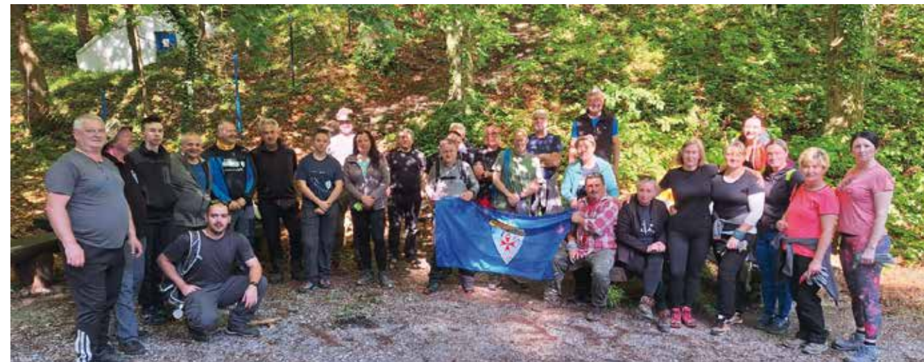
Uklanjali smeće koje su za sobom u prirodu ostavili vrlo „planinari“

IVANEČKI KLUB KOLEKCIONARA Održana skupština kolekcionara