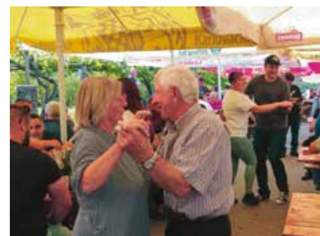
Uz Faringaše i Kavalire pjevalo se i plesalo

U organizaciju cijelog slavlja uključili su