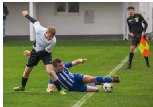
NK Ivančica: Promjenljivo, iz poraza u pobjede