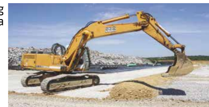
Ministarstvo i Fond predlažu nastavak odlaganja otpada na već zatvorenoj i saniranoj kazeti otpada, koja bi se za te potrebe ponovno morala otvoriti

Odluku o statusu odlagališta potrebno je donijeti što prije, kako bi se na vrijeme mogle provesti sve propisane aktivnosti kao što su izrada projektne dokumentacije za zatvaranje deponija, ishođenje dozvola, osiguranje sredstava i dr.