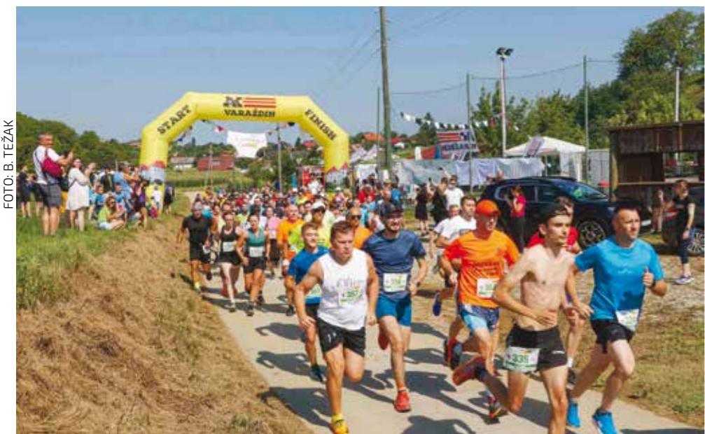
Utrka u Gačicama iz godine u godinu postaje sve masovnija