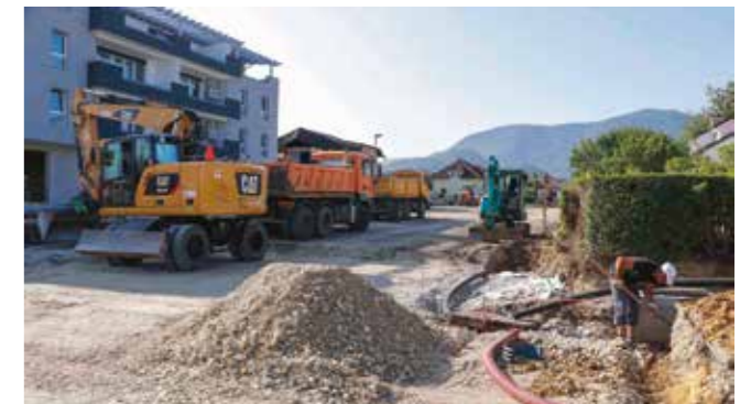
Rekonstrukcijski radovi i u južnom dijelu, od rotora do Varaždinske ulice

KLIZIŠTE Na nerazvrstanoj gradskoj cesti u Margečanu