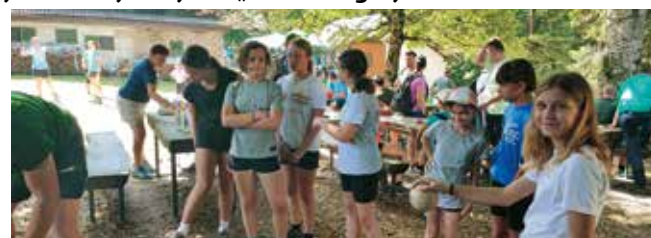
Sa svih strana – djeca i mladi na visećoj kuglani