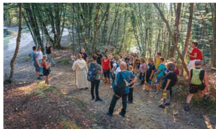
Stotinjak izletnika uputilo se u goste Črlenom fratra

UG MARGARETA Održana najpopularnija manifestacija margečanskog kraja