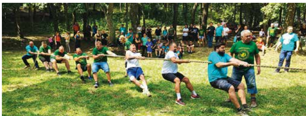
Lančić-Knapić uvjerljiv je pobjednik natjecanja na „krovu“ Zagorja

Na vrhu su održana natjecanja na visećoj kuglani, skoku s mjesta, pikadu i u potezanju