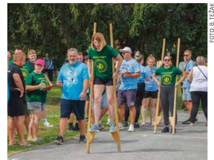
Uzbudljivo u natjecanju u hodanju na štulama