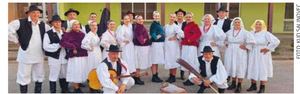
KUD Salinovec sjajan na državnoj smotri u Županiji

KUD SALINOVEC Odličan nastup na državnoj smotri folklor-nih ansambala i izvornih skupina