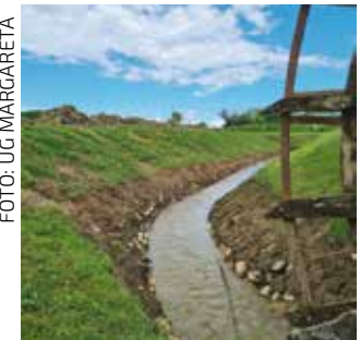
Uz potporu Margetju i čišćenju kanala uz Bednju...