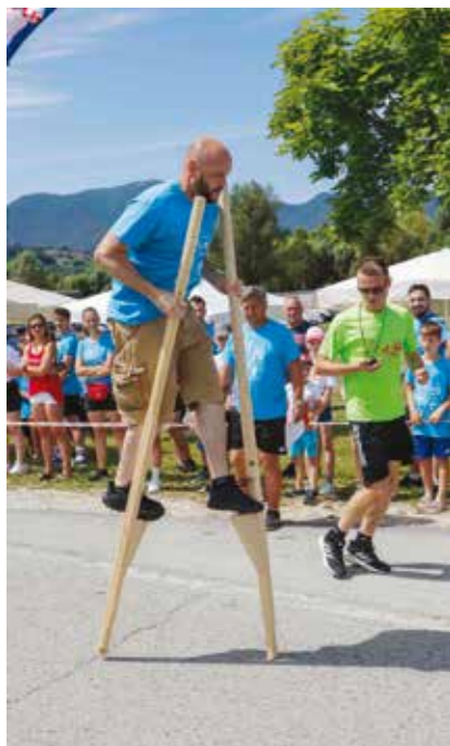
Hodanje na štulama

UŠR Stažnjevec dvije godine zaredom pobjednik državnog festivala sportske rekreacije na selu