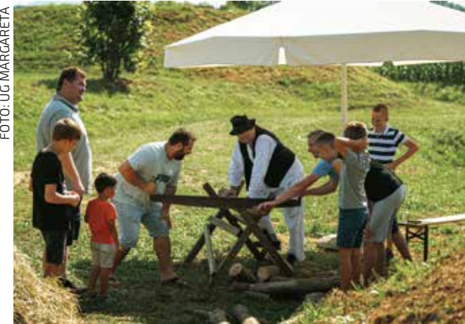
Kak su se negda pilila drva...