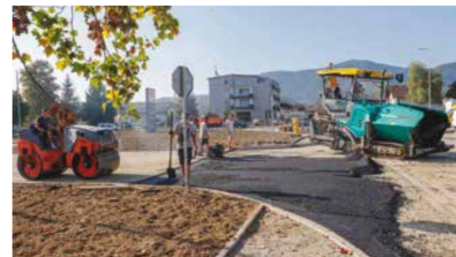
Početak asfaltiranja novouređenog sjevernog dijela ulice, od rotora do Vite

lan prilaz novom trgovačkom centru Kaufland, čije je otvaranje najavljeno za ovaj mjesec.