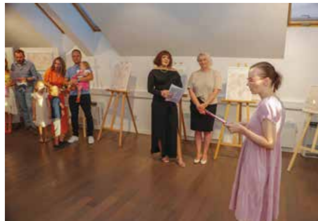
Na otvorenju izložbe slika „Vinoreli s pogledom na Ivančicu“