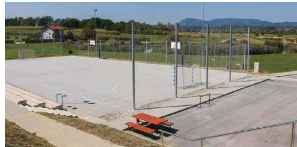
Finaliziraju se pripreme za početak radova na RC-u Lančić-Knapić

LANČIĆ-KNAPIĆ Pripreme za završnu fazu gradnje i uređenje Rekreacijskog centra