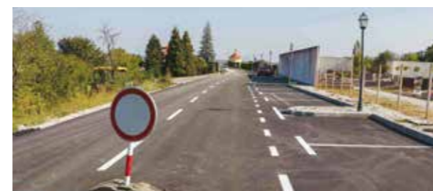
Novouređene cesta je iscrtna, označena su i nova parkirna mjesta

CESARČEVA ULICA Grad Ivanec završio s modernizacijom ključne gradske prometnice