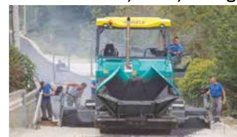
Cesta je proširena na 5,5 metara i omogućava nesmetan dvosmjerni promet