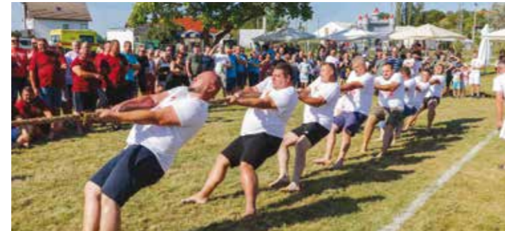
Do zadnjeg atoma snage!