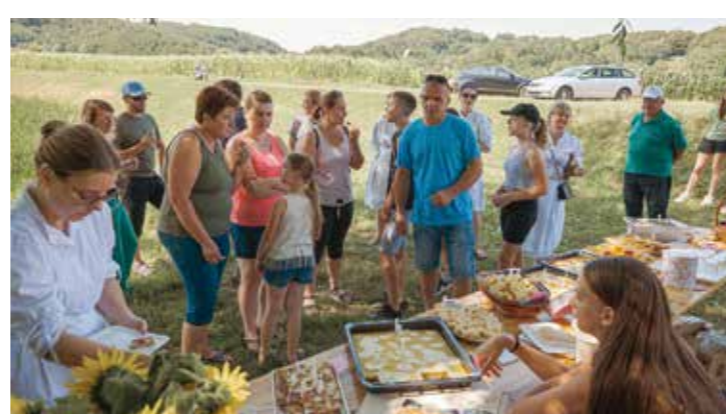
Uopće nije loše uz stol prepun domaćih delicija

Na središnjem trgu bogat zabavni program, a bogatstvo tradicije na – Črnoj ribi