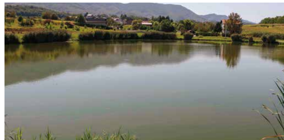
Čeka se dozvola ministarstva za izlov i preseljenje ribe, a nakon toga kreće izmuljivanje

Završetak ugovorenih radova planiran je za ožujak 2025., kada će Ivanec i Lančić dobiti atraktivnan SRC namijenjen sportu i rekreaciji svih dobnih skupina. Njegova posebnost bit će Matišićev bajer, vodena površina oko koje će biti uređene pješačke i biciklističke staze i svi drugi nabrojani sadržaji, a koji će ovom lokalitetu dati poseban šarm te, sasvim sigurno, potaknuti stambenu gradnju u ovoj zoni. (aj,ljl)