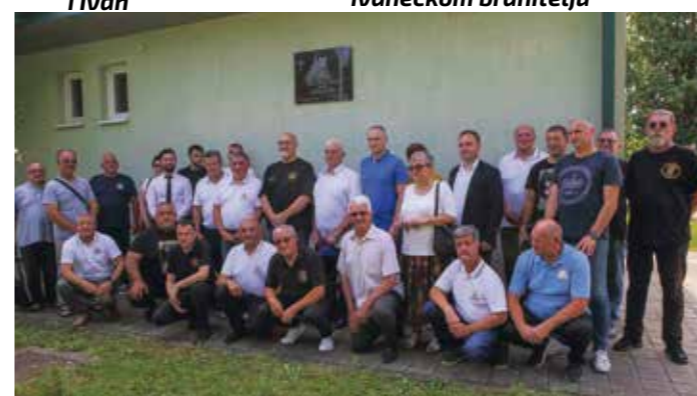
Na svečanosti otkrivanja spomen ploče poginulom ivanečkom branitelju