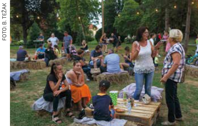
Opušteno na balama sijena