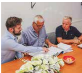
Na potpisivanju ugovora za investiciju vrijednu blizu 400.00 €

Projektom energetske obnove predviđena je zamjena kompletne stolarije, izvedba termo fasade i instalacija novog sustava grijanja i hlađenja te nova rasvjeta. Na krovu će biti postavljena fotonaponska elektrana. Adaptirat će se i unutrašnjost zgrade. Uredit će se društvene prostorije, nova kuhinja i sanitarni čvorovi, uključujući i toalet za osobe s invaliditetom. Salinovec će time dobiti suvremeno uređen prostor za svoje udruge civilnog društva, a veli-