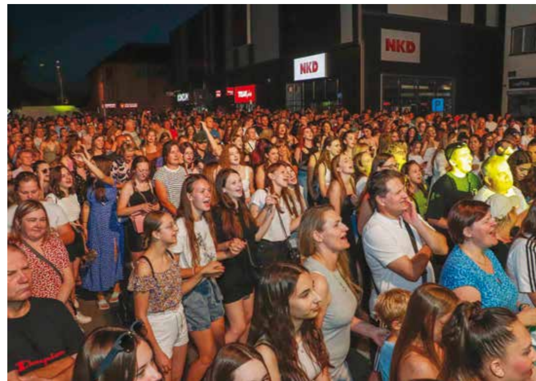
S koncerta Magazin

Tako je 12-ero djece od 6 do 10 godina, pod vodstvom informatičarke Petre Polančec, pohađalo radionice robotike, što je odličan projekt usmjeren ranoj popularizaciji STEM zanimanja. U Knjižnici je pod vodstvom Maje Čretni održan i niz dječjih pričaonica i radionica Kreativko, kao i razne društvene igre te foto natjecaj „Male slobodne knjižnice i ja“.