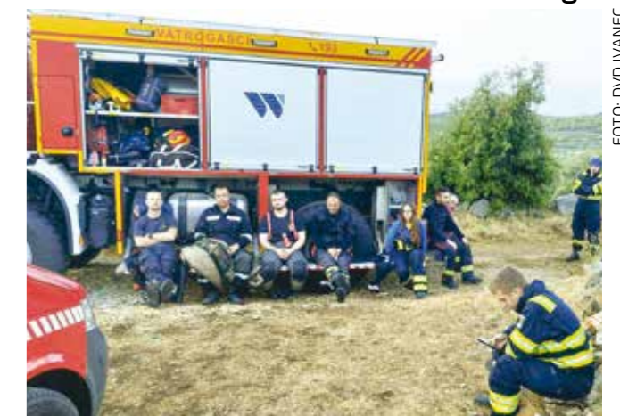
Umorni vatrogasci u predahu od borbe s vatrenom stihijom