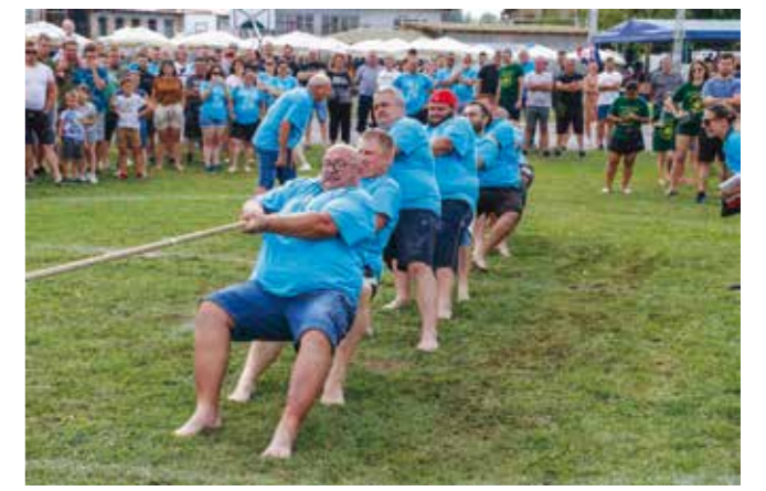
Mišići pucaju, ali predaje nema!