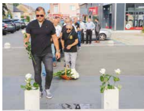
Bijela ruža za sjećanje na oca, poginulog vukovarskog branitelja