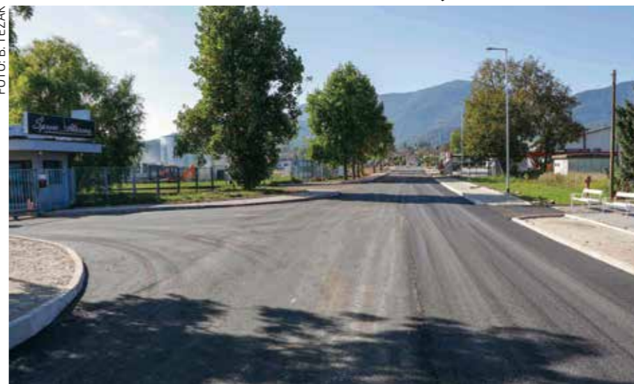
Gundulićeva postaje moderna gradska prometnica

Ivanec time dobiva još jednu urbanu prometnicu, koja će