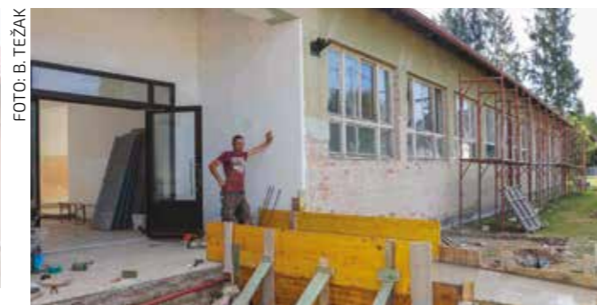
Sagrađena je pristupna rampa za osobe s invaliditetom