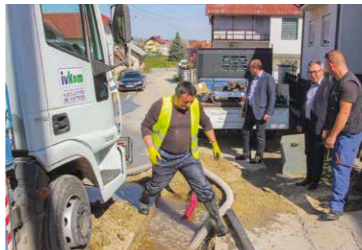
Posljedica Vladine Uredbe: Ubuduće će se odluke o cijeni vode, vodnim investicijama i radovima donositi u Varaždinu

–Iako ništa drugo nisam ni očekivao od Ustavnog suda kao proizvedene ruke HDZ-a i pukog izvršitelja Vladinih političkih odluka, tužan je ovo trenutak za Ivanec. Tužan je to trenutak i za 10.000 Ivnčanana i građana sudjednih sredina, koji su se peticijom borili za svoje poduzeće i vodovode, a i za mene osobno. Iako je cijelo vrijeme neka nada nitala, pravo i pravdu Ivanec nije dočekao. Ovo je brodolom pravne države i ustavnih načela na