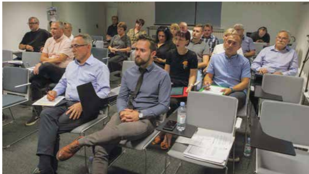
Sa 36. sjednice Gradskog vijeća Ivanec

Uvođenjem Riznice zatvaraju se računi proračunskih korisnika – Dječjeg vrtića Ivančice, Gradske