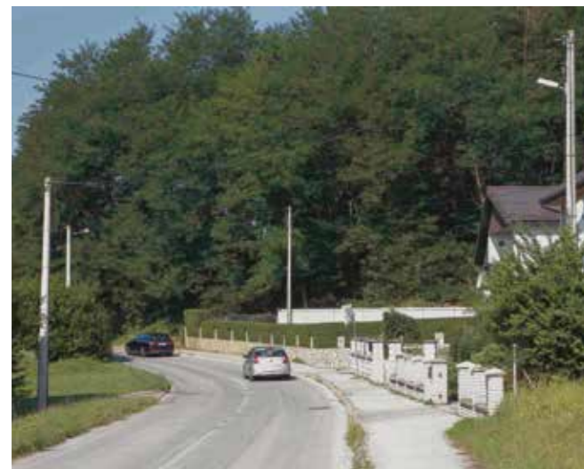
Sve stare svjetiljke bit će zamijenjene novim LED-icama, a bit će montirane na svaki stup

S obzirom na to da je sadašnja javna rasvjeta na cijelom gradskom području dotrajala i pri kraju, cilj je da se modernizacijom ostvare uštede u potrošnji električne energije i „srežu“ sadašnji visoki troškovi održavanja. Prema izračunima, godišnje će se utrošiti oko 600.000 kWh manje el. energije, što će za gradski proračun rezultirati uštedom od 130.000 do 160.000 €.