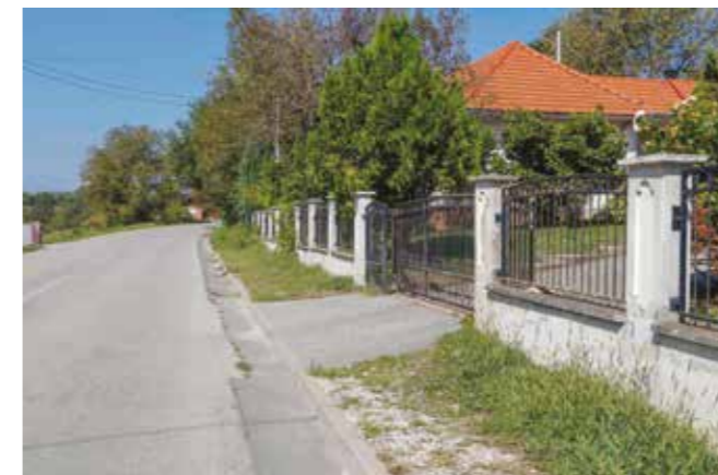
Za dovršetak nogostupa u Bedencu Grad je osigurao novac, na potezu je ŽUC

Lj. Cikač: Sugestija većine nas koji smo bili na obilježavanju