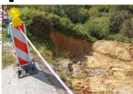
Klizište je opasno ugrozilo cestu i sigurnost na njoj

S obzirom na to da je klizište opasno, a sigurnost prometa ugrožena, te da mještani koji tu žive nemaju neki drugi pravac kojim bi mogli doći do svojih kuća, Grad Ivanec po hitnom je postupku dao izraditi projektnu dokumentaciju, raspisao postu-