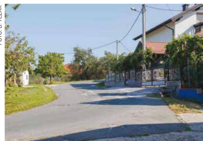
Mještani upozoravaju da cesta Kučeji-Bitoševlje nije obnavljana desetljećima