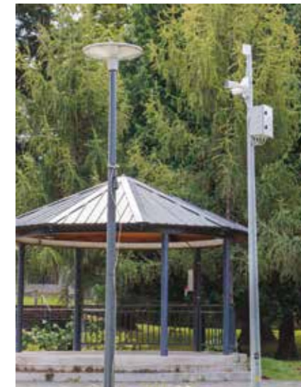
Pod nadzorom i gradski park