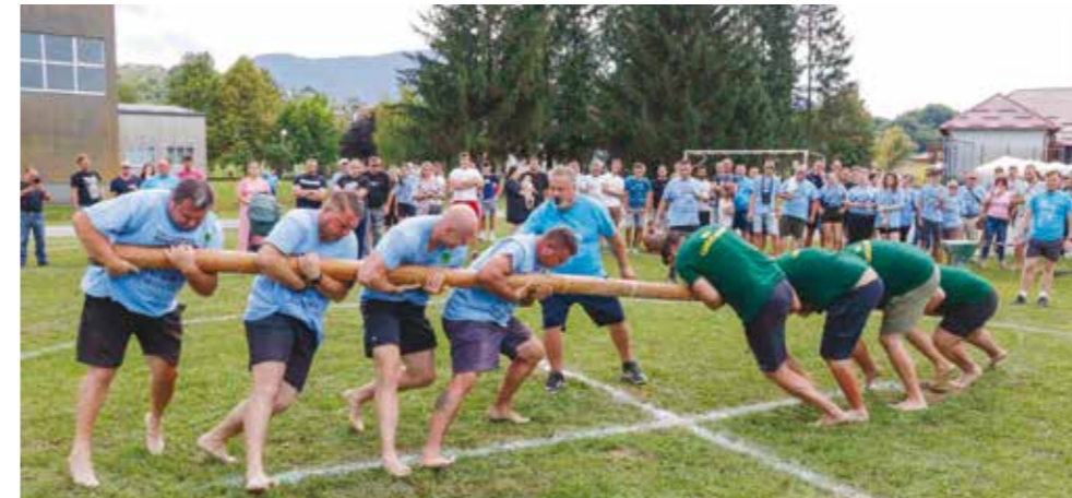
Nadmetanje najjačih muževa u bikovanju