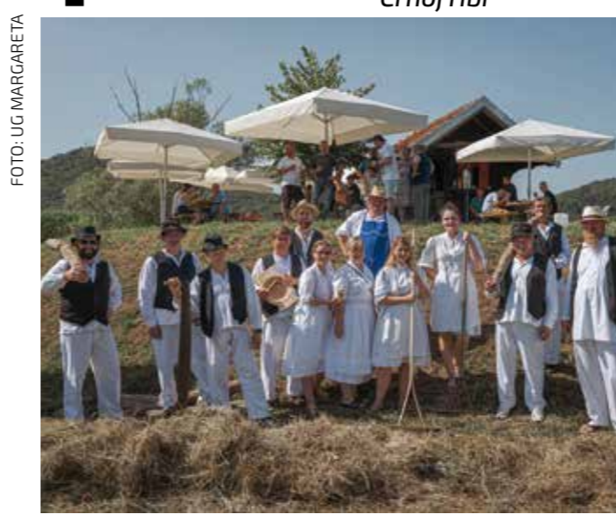
Margečanske puce; kak se negda natepalo sijeno

Na središnjem trgu bogat zabavni program, a bogatstvo tradicije na – Črnoj ribi