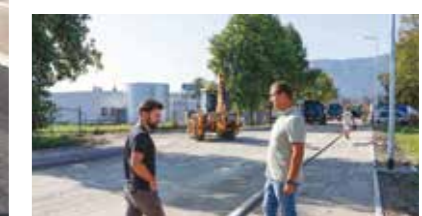
U obilasku asfaltnih radova