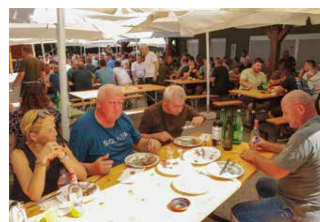
Mnoštvo posjetitelja u gostima kod Šumskog zeca