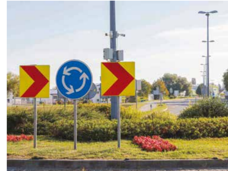
Kamere na zapadnom rotoru; jedna od njih prepoznaje registracijske oznake i boju vozila