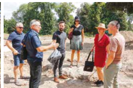
Gradski čelnici s predstavnicama Konzervatorskog zavoda i izvođačem u obilasku lokaliteta