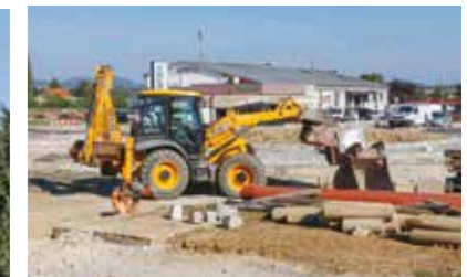
Radovi u Gundulićevoj usklađeni s radovima na rotoru, čiju gradnju financira Kaufland

na uređenje ivanečkih ulica, a u čijem su sklopu dosad rekonstruirane Kukuljevićeva, Gajeva, Kumičićeva i Preradovićeve ulica s odvojcima.(lir)