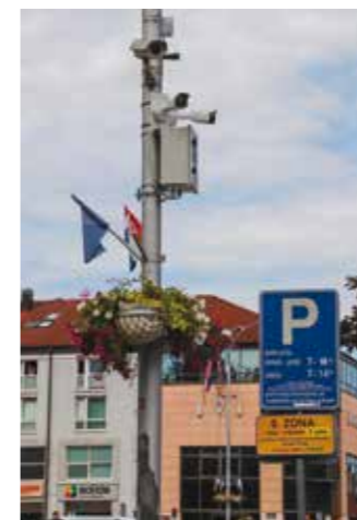
Pristup snimkama strogo ograničen, a policiji samo uz nalog

Oni uključuju ključne ulazne i izlazne pravce u grad i iz grada te javne površine na kojima se okuplja veći broj ljudi, a na koji-