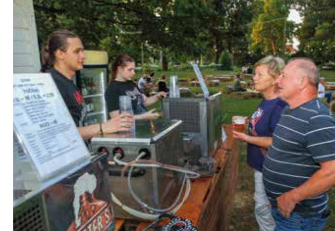
Guštiranje u craft pivima u opuštajućoj atmosferi gradskog parka

LJETO U IVANCU U suradnji Grada Ivanca s gradskim ustanovama i udrugama