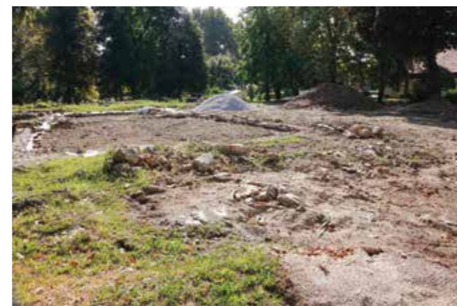
Lokalitet Stari grad Ivanec proglašen je zaštićenim kulturnim dobrom od nacionalnog značaja