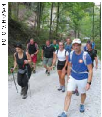
Na pohodu do „krova“ Zagorja

HPD IVANČICA Ljetna planinarska avantura 2. noćni uspon na Ivančicu