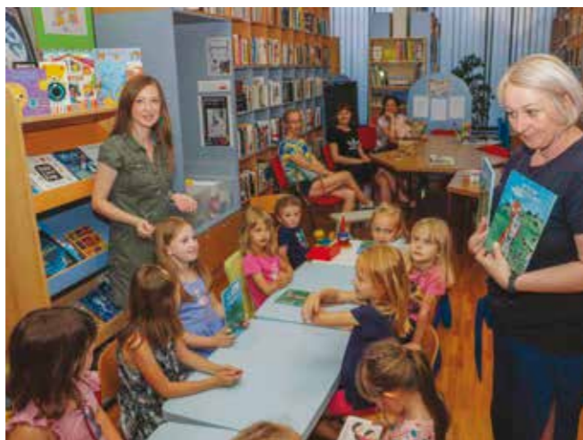
Niz dječjih radionica u Gradskoj knjižnici