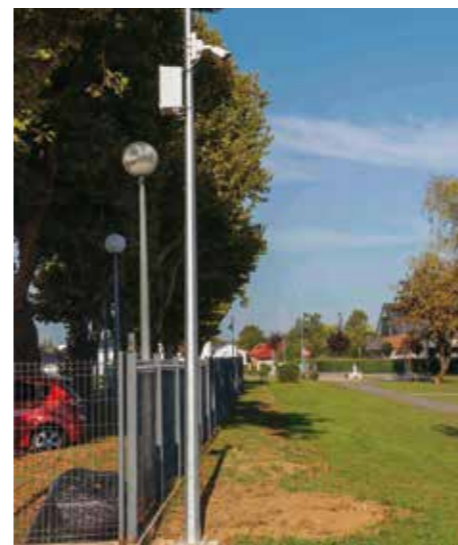
Kamere nadziru i skate park, koji je često bio meta devastacije

IVANEC U rad puštena prva faza sustava videonadzora Grada Ivanca