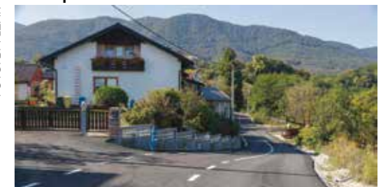
Projekt je najvećim dijelom (83%) financiran iz proračuna Grada Ivanca