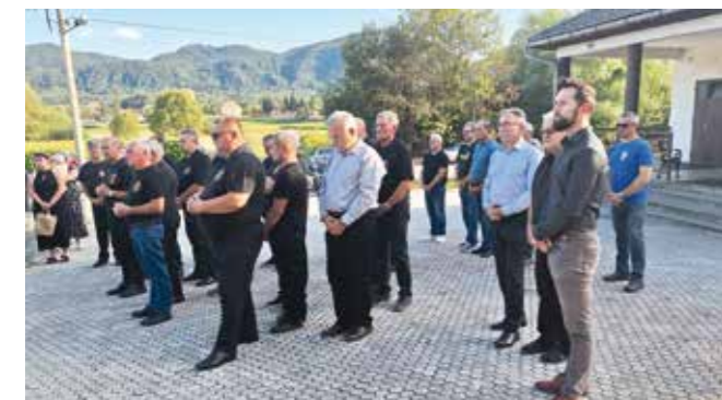
Mnogi su se okupili na odavanju počasti Draženu Šešetu