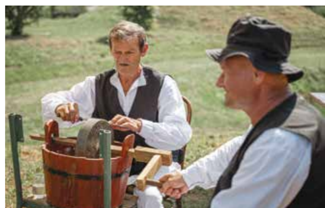
Demonstracija vještina koje su nekad bile sastavni dio svakodnevice zagorskoga sela