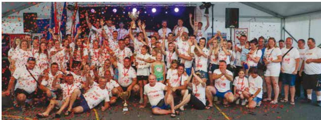
Zahvala Gradu Ivancu i svima koji su pomogli u održavanju festivala