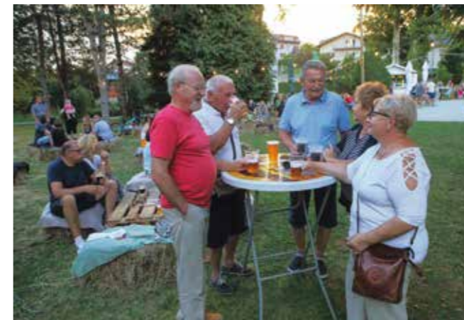
Sve je ljepše uz dobro društvo i odlično pivo!