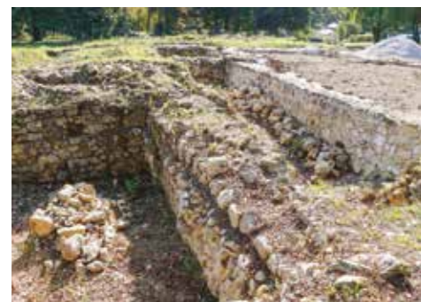
Arheološka istraživanja rezultirala su otkrićima nepoznatih detalja davne ivanečke povijesti