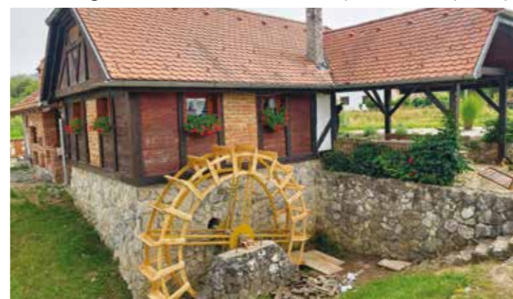
... je financirao i obnovu kotača na vodenici