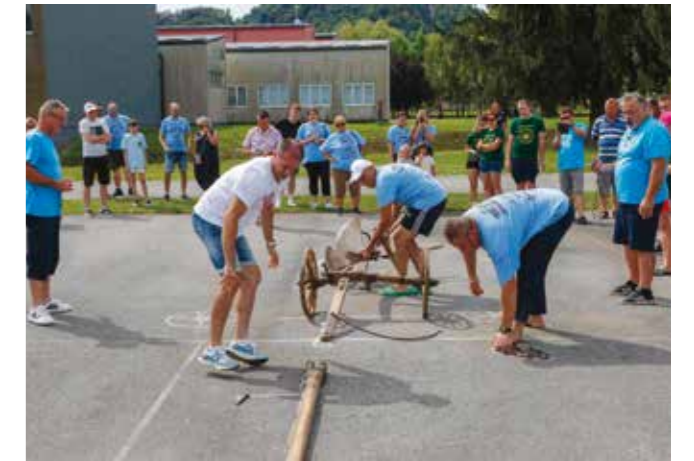
Tko (još) zna sastaviti plug?