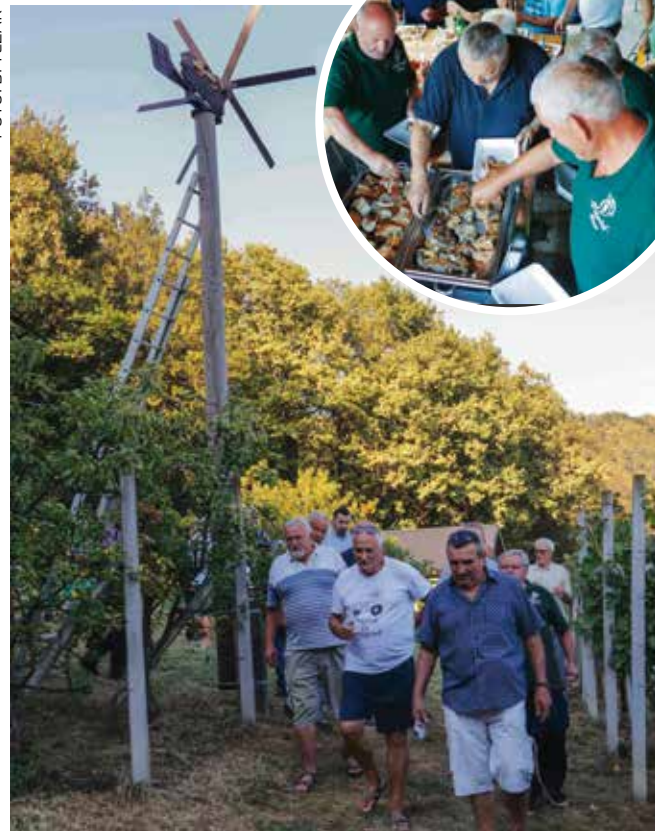
Klopotec je podignut - veselica kod Peharčeka može početi