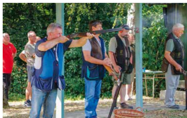
LD Jelen Ivanec: Natjecanje letećih meta na Tiglinu