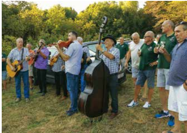
U dobrom raspoloženju sa Starim zajcima

Tradicionalno postavljanje klopoteca gromkim su pucnjem iz kubura „začinili“ članovi Glasne kubure iz Kamenice, a do-