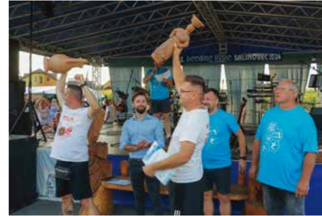
Radost pobjednika, UŠR-a Stažnjevec

–Četrdeset godina od prvih igara respektabilna je brojka