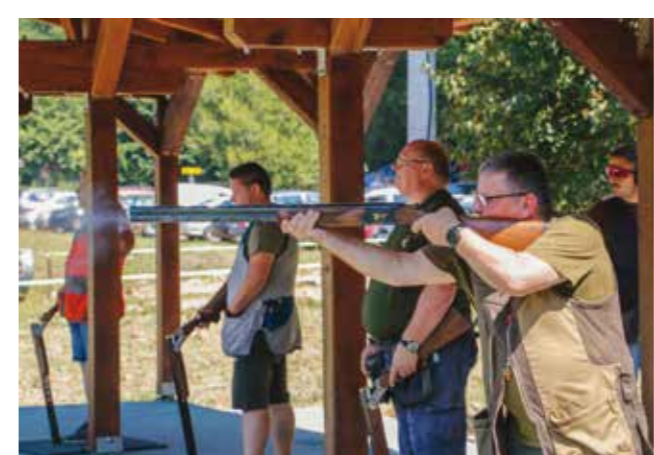
Čak 318 lovaca na turniru kod LD Šumski zec