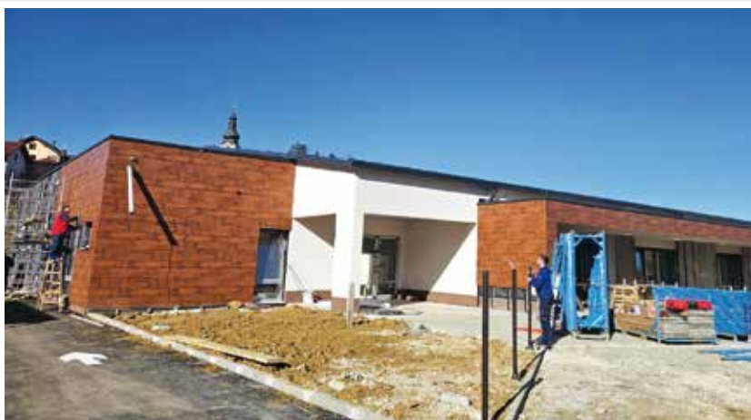
Ove godine otvaranje novog dječjeg vrtića u Radovanu