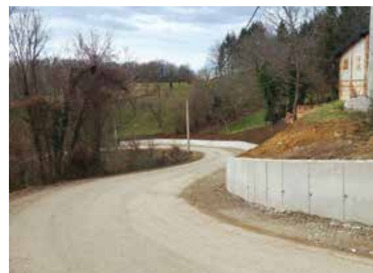
Proširenje ceste Osečka - Gačice URBANIZAM (37.000 €)