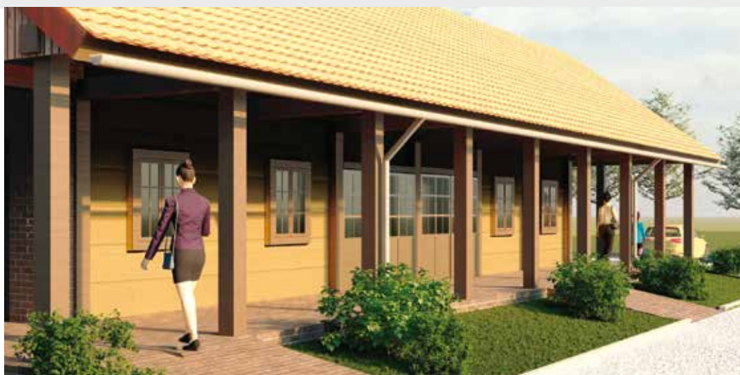
Ove godine dogradnja objekta u produžetku Etno kuće Bedenec za čuvanje lončarske tradicije