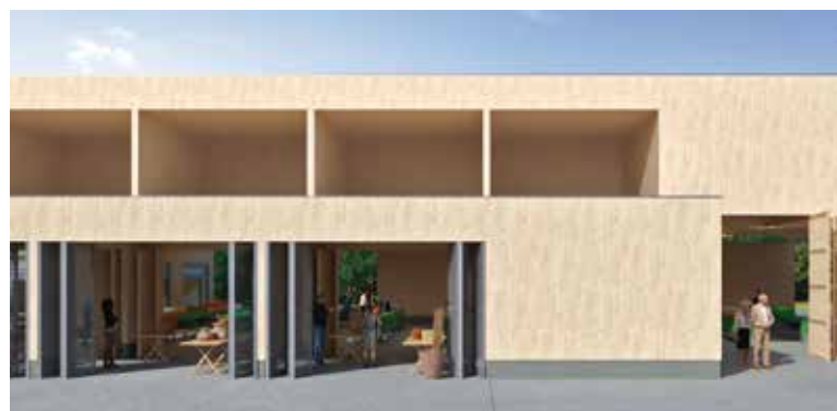
Predviđeni izgled nove gradske tržnice u Ivancu

Ivanču, ostale kulturno-zabavne manifestacije), sanacija Arheološkog nalazišta Stari grad Ivanec, izgradnja pomoćnog objekta kod Etno kuće Bedenec