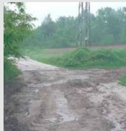
Bujice oštetile su nerazvrstane ceste