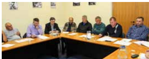
U otvorenom razgovoru članovi Izvršnog odbora ZSU iznijeli su probleme koji tište sport