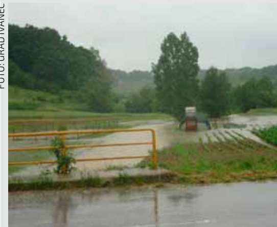
Dio nasada završio je pod vodom