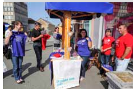
Aktivisti udomiteljskih udruga u akciji Činim pravu stvar

Centralne aktivnosti održane su u petak, 29. svibnja, kada je Udruga Nada svoju 10. obljetnicu rada proslavila druženjem u zelenoj oazi svog eko vrta u Malezovoj ulici. Jubilara,