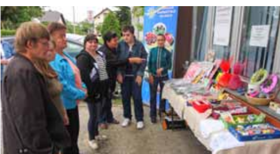
Volonteri pomažu uključivanju članova Sunca u život lokalne zajednice

U četvrtak, 28. svibnja, članovi i vodstvo Ivanečkog sunca dočekivali su svoje goste na Danima otvorenih vrata. Posjetiteljima su predstavili rukotvorine, nakit, keramičke medaljone i ukrase što ih izrađuju na svojim kreativnim radionicama, a potom su se bavili igranjem badmintona i bacanjem lopatica u koš. Bila je to i prilika da goste podsjetite na četrnaest godina svoga rada, da ih informiraju o svom dosadašnjem radu i planovima za budućnost i ponovno podsjetite na neprocjenjivu potporu koju radu udruge daje nekoliko desetaka volontera.(me)