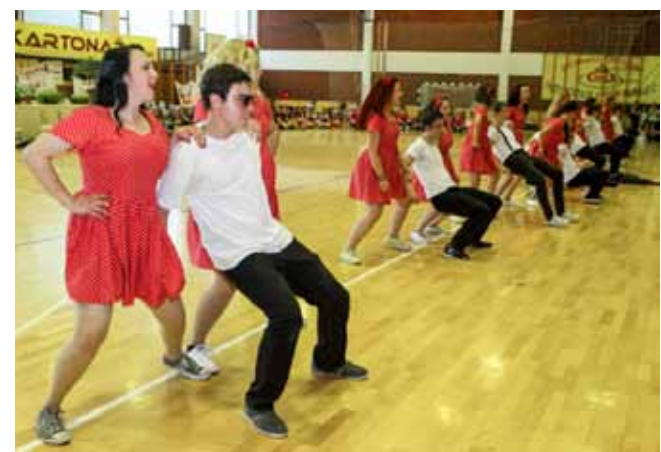
Vatromet boja, plesa i mladenačke bezbrižnosti