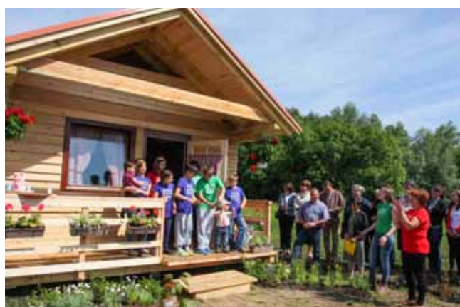
Otvaranje eko-kućice u povodu 10. rođendana ivanečke Nade

„okrugla“ godišnjica okrunjena je otvorenjem vrtno kućice za čiju su gradnju zaslužni brojni donatori. Okoliš je uredila Srednja škola Arboretum opeka iz Vinice. Nakon što su djeca prerezala crvenu vrpцу i kućicu i službeno proglasila otvorenom, počela je velika fešta uz mnoštvo slastica.