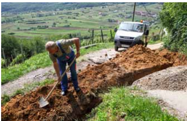
Sagrađeno je 500 metara novog vodovoda

Nakon što je gradonačelnik Milorad Batinić na Zboru građana Mjesnog odbora Prigorec u veljači ove godine opravdanim ocijenio prigovore građana zbog činjenice da u grobnoj kući u Prigorcu ispod Sv. Duha nema vode te kazao da se to mora riješiti jer je voda na takvom mjestu osnovni higijenski standard, problem vodoopskrbe riješen je već prošlog mjeseca. U suradnji Grada Ivanca i Ivkoma nađeno je rješenje za gradnju priključnog vodovoda, pa je na potezu od Babinih gorica do grobne kuće sagrađeno oko 500 metara novog vodovoda.