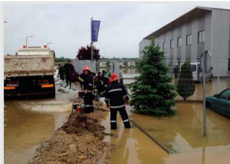
Vatrogasci iz čak osam društava gradili su zečje nasipe i ispumavali vodu iz hala i kruga Wenker – Križanec

Zahvaljujući na kraju svim građanima na odazivu, gradonačelnik ih je pozvao na suradnju s Gradom te da se ubuduće aktivnije uključe u savjetovanja o pitanjima od važnosti za život građana. Skupu u Srednjoj školi nazočila su i oba zamjenika gradonačelnika, Branko Putarek i Čedomir Bračko. (ljr)