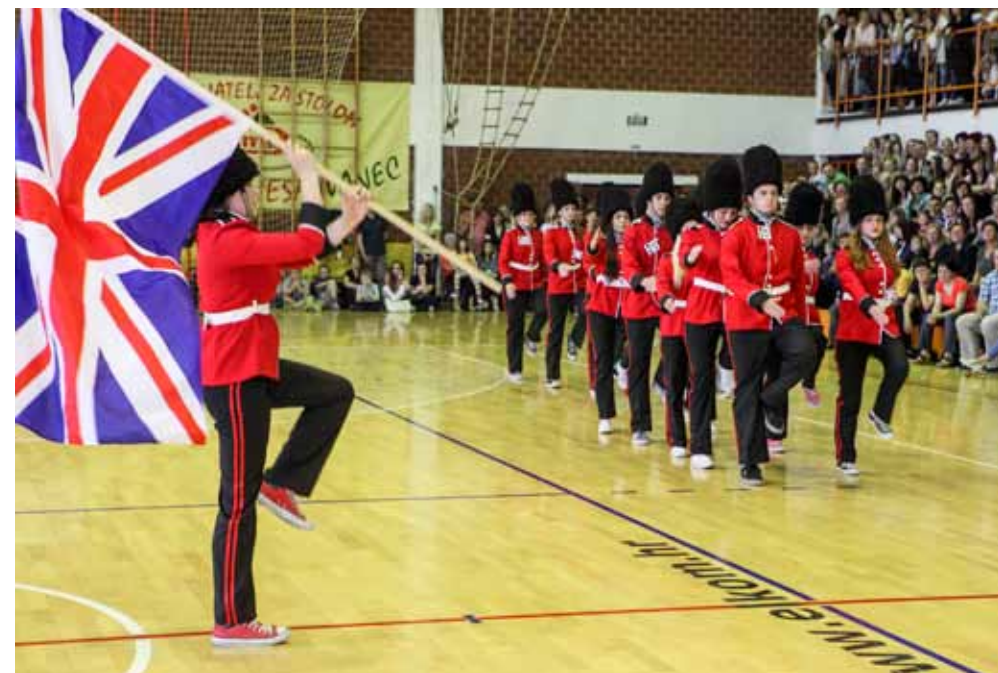
Svaka generacija maturanata originalna je i neponovljiva