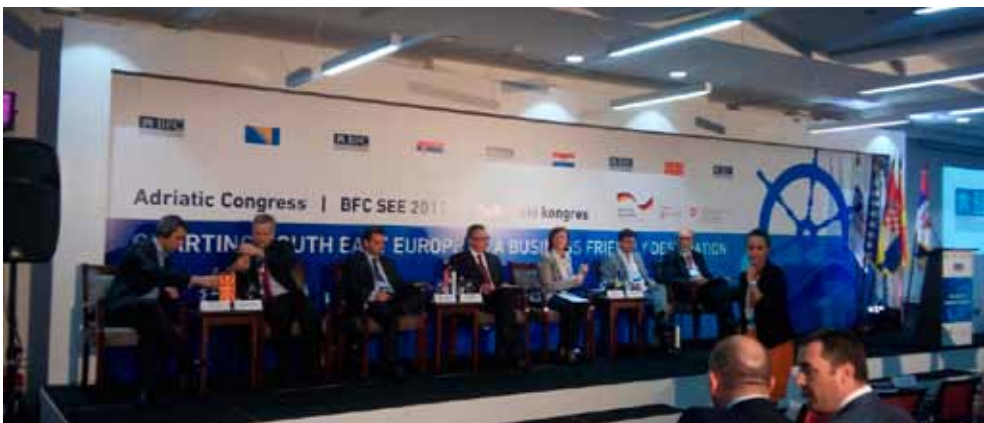
Gradonačelnik M. Batinić s najvišim državnim dužnosnicima zemalja iz regije na kongresu u Neumu

ja te u Komitetu za ekonomske odnose s istočnom Europom.