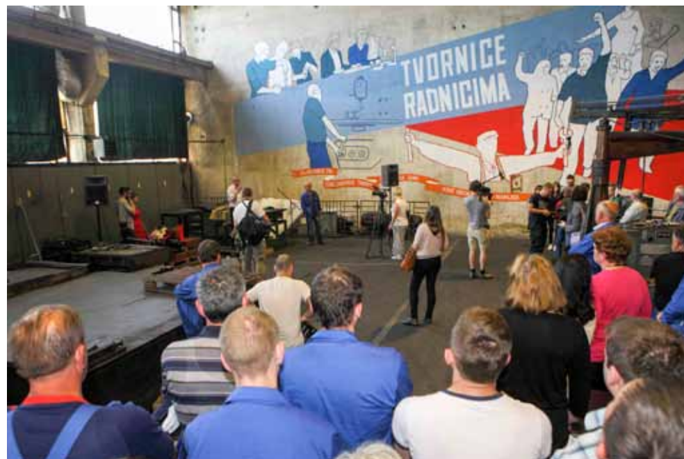
Mural podsjeća radnike na njihovu borbu za spas tvornice i radnih mjesta

Ovaj projekt, jedinstven u Hrvatskoj, podržali su Ministarstvo kulture, Grad Zagreb i Zaklada „Kultura nova“(ljr)