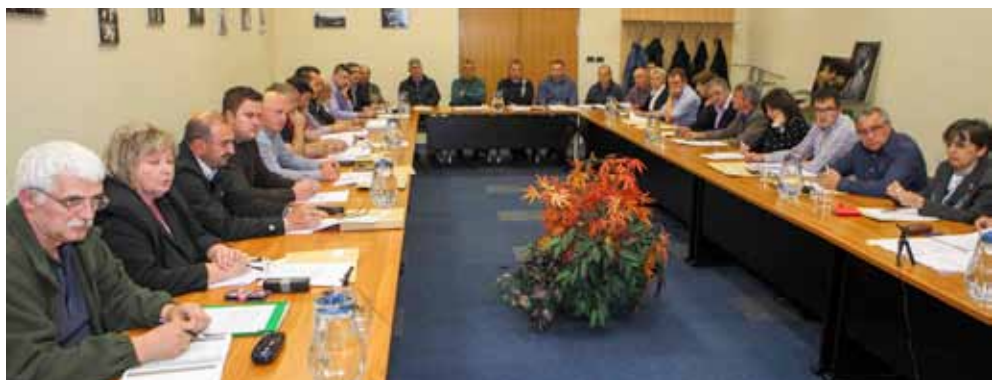
Svima je cilj da sport na području grada Ivanca napreduje kvalitativno i kvantitativno

Situacija s financiranjem sportskih aktivnosti i klubova sve je teža. Potrebno je sagledati opcije pristupa novim izvorima novca i financiranja gradnje sportskih objekata i infrastrukture iz fondova EU. Ova sjednica te vaša