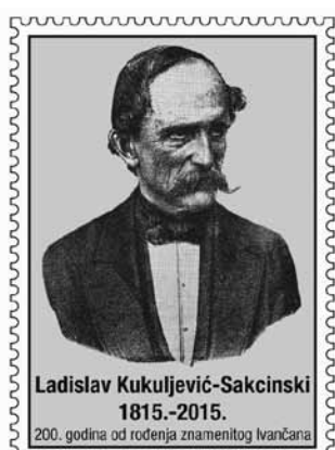
Ladislav Kukuljević Sakcinski

Ladislav je znao govoriti: „Dobar gospodar je onaj koji ima tri žetve: jednu na polju, drugu u ambaru, treću u ormaru. Gospodaru koji tako postupi ne