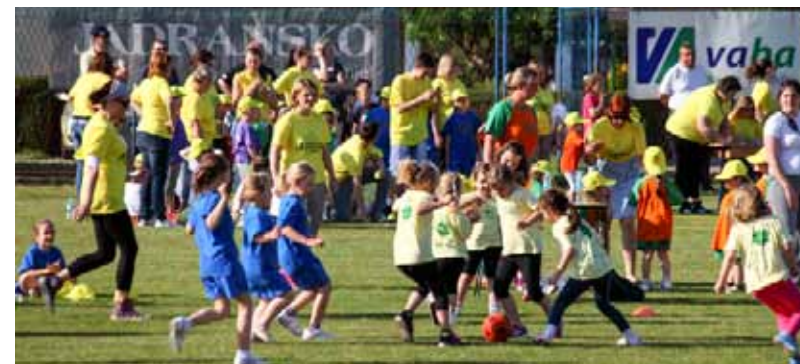
Nogomet još uvijek drži titulu najbolje sporedne stvari na svijetu!