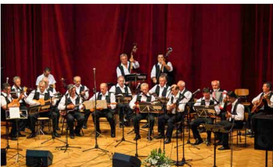
Itasovi tamburaši i njihovi gosti na godišnjem su koncertu prepunili kinodvoranu