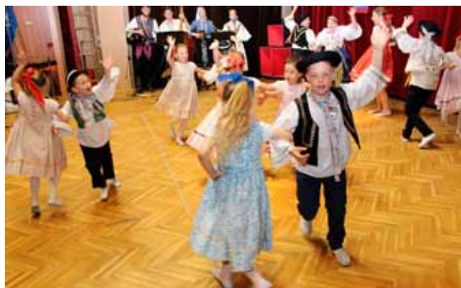
Raspjevana dječica iz Bratislave osvojila su simpatije publike

Teško je reći koji je ansambl bio zanimljiviji: da li raspjevana dječica iz HKD-a