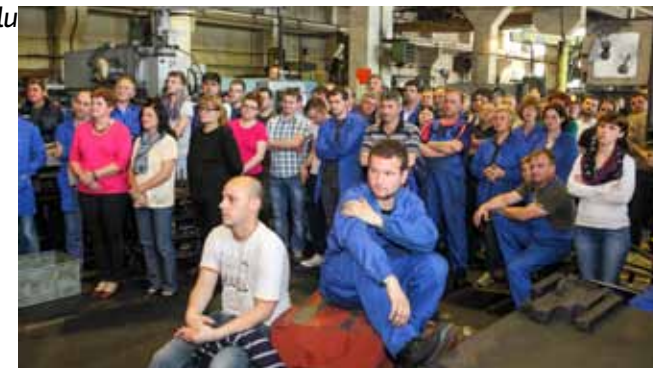
Bunt Itasovih radnika prije 10 godina postao je inspiracija za umjetnički i politički aktivizam novih generacija

razdoblje socrrealističke umjetnosti koja je radničku klasu veličala kao „motor“ društvenog razvoja. Upravo to zapravo i jest umjetnička i politička – aktivistička poruka umjetnika, koji su njome ovoga puta na svoj način dali potporu vrlo konkretnoj borbi Itasovih radnika za spas svoje tvornice. Jasno se to ističe i na