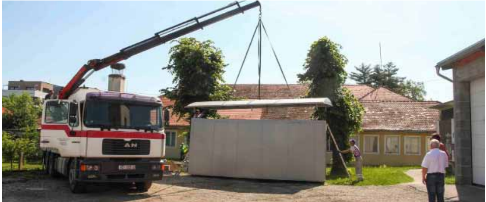
Kontejner je postavljen u dvorištu vatrogasnog doma