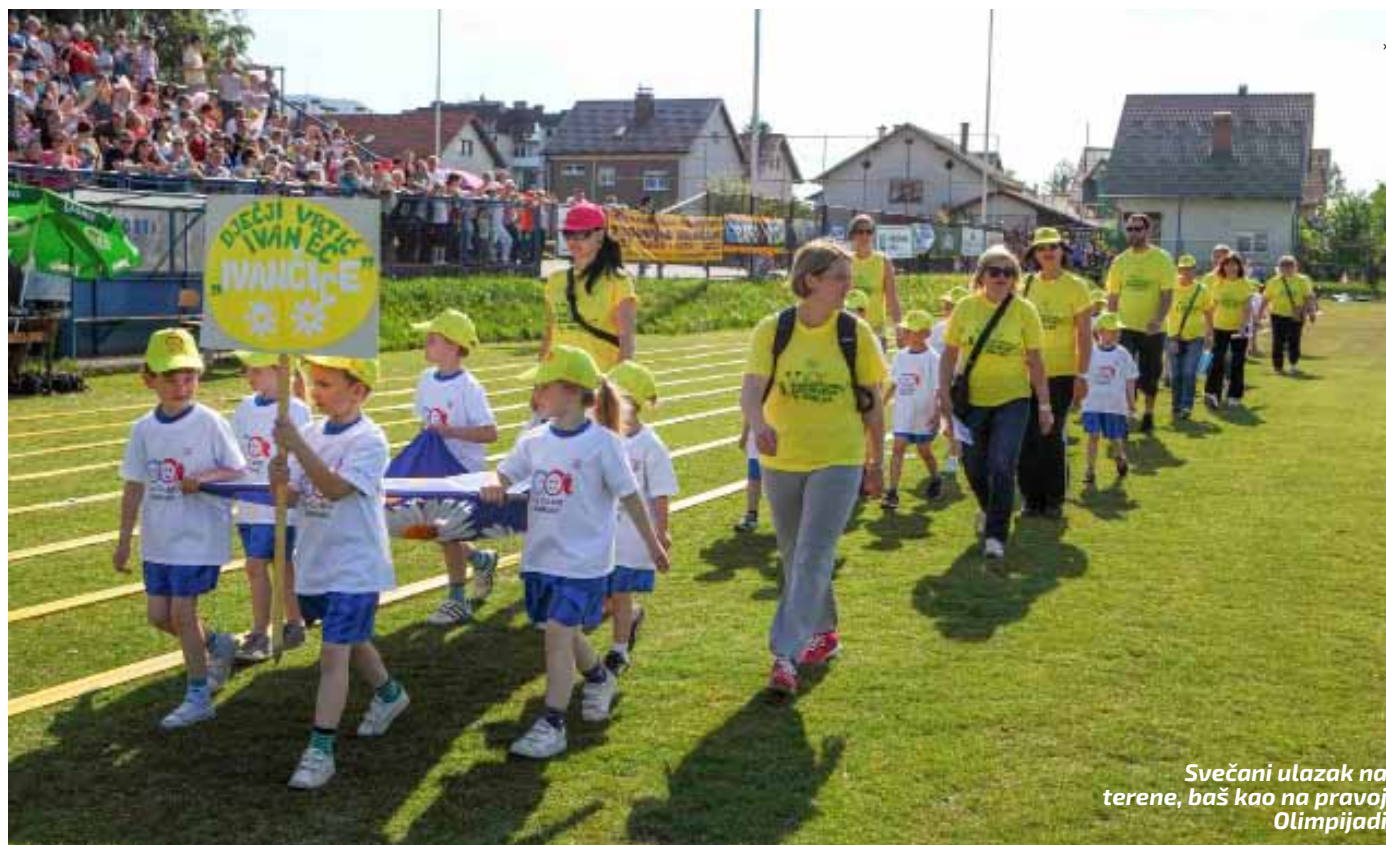
Svečani ulazak na terene, baš kao na pravoj Olimpijadi

OLIMPIJSKI DUH 5. olimpijski festival dječjih vrtića u organizaciji Dječjeg vrtića Ivančice