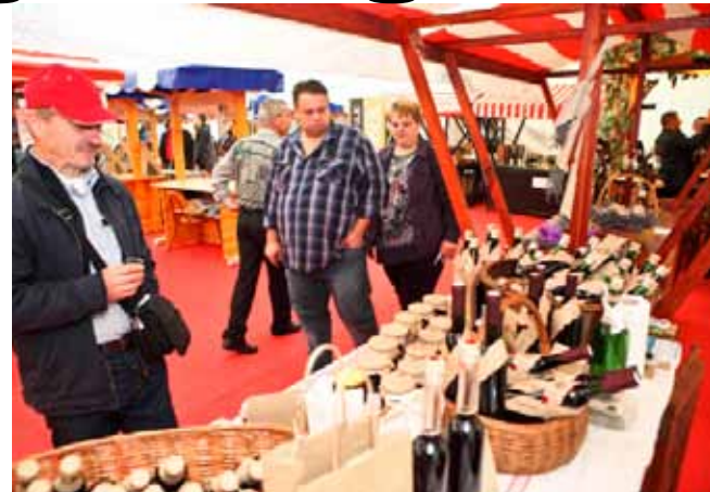
Bogat fond vrlo vrijednih i atraktivnih nagrada za posjetitelje koji trebaju samo ispuniti nagradni bon

da im izložbeni asortiman bude pretežito prodajnog karaktera. Dobrodošli su svi poduzetnici, tvrtke, obrtnici, OPG-i i udruženja iz cijele Hrvatske i inozemstva. Dosadašnji partneri