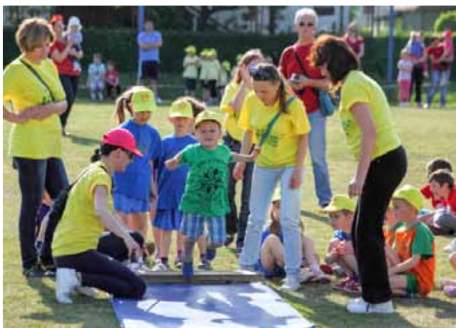
Skok u dalj? Nije problem!

Olimpijski festival održan je pod pokroviteljstvom HOO-a i uz veliku potporu ZSU koja im je i ove godine pružila svu potrebnu organizacijsku pomoć i osigurala sudačku logistiku. Dječja olimpijada u Ivcu ponovno se potvrdila kao popularna dječja manifestacija, ali i vrijedan pedagoški projekt koji promiče izvorne vrijednosti olimpiзма. (me,ljr)