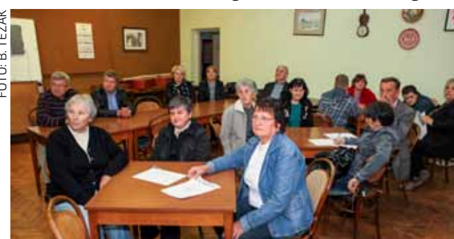
S izborne skupštine Ivanečkog sunca

Istaknuto je da će tijekom ove godine sve aktivnosti udruge biti