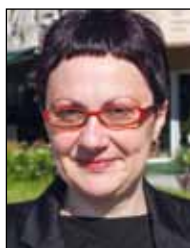
Piše: dr. sc. Suzana Jagić

Naseljavanje Židova u sjevernu Hrvatsku i Slavoniju dio je općih migracija u 18. i 19. stoljeću. U sjevernu Hrvatsku, osobito nakon patenta o vjerskoj toleranciji krajem 18. stoljeća, dolaze aškenaški Židovi iz srednje Europe i naseljavaju manja trgovišta, gradove i sela. Dolaze ponajprije kao putujući trgovci, a postepeno, specijalnim dozvolama, postaju stanovnici pojedinih naselja. Dozvolu naseljavanja u Hrvatsku, osim u rudarska naselja, dobili su 1840. godine. Carskim patentom od 1860. dozvoljeno je Židovima posjedovanje nekretnina i zemljišta, ako ga sami obrađuju. Punu ravnopravnost Židovi su stekli 1873. kada je Hrvatski sabor izglasao Zakon o građanskoj i političkoj ravnopravnosti.