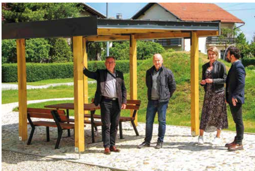
U sklopu barefoot parka i nadstrešnica za odmor i druženje

Barefoot park je jedinstven prostor osmišljen s ciljem da djeca kroz bosonogo igranje razvijaju osjetilne i motoričke sposobnosti. Park je opremljen posebno dizajniranim didaktičkim spravama i stazama različitih tekstura koje potiču senzorni razvoj djece – telefonom Zvukoplov, hodalicom Stepenko, njihalicom Cvijet, ksilofonom Mali glazbenik, umjetnim humcima za