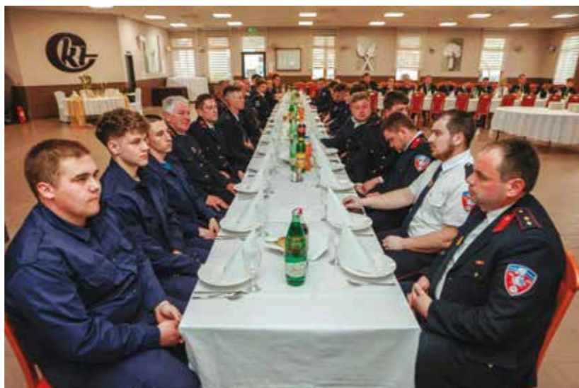
Sa 137.godišnje skupštine ivanečkih vatrogasaca

ZAKLADA GRADA IVANCA Odborene nove pomoći potrebitim građanima