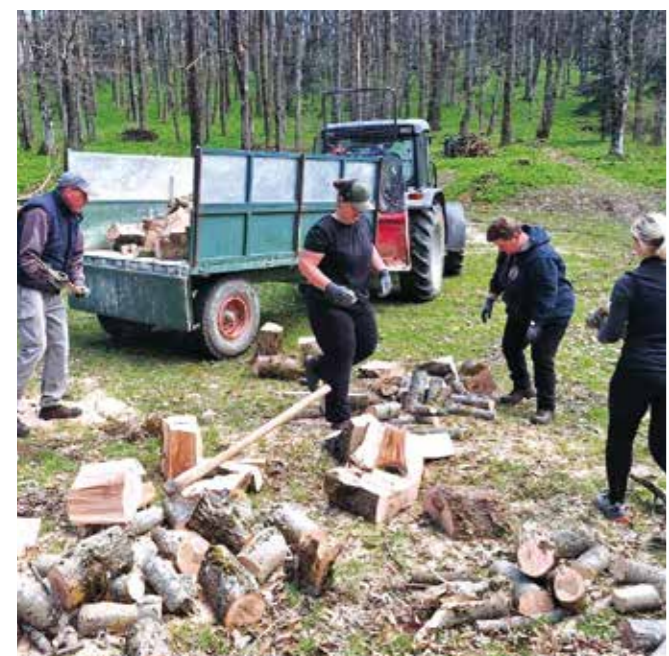
Uputrebljivo drvo pripremljeno je za ogrjev

KOMEDIJAŠI Pobijedili na županijskoj smotri kazališnih amatera