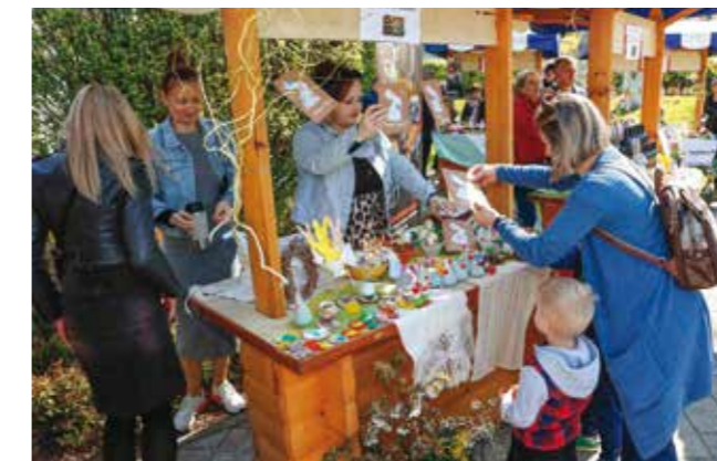
Šareno na štandu Dječjeg vrtića Bambi