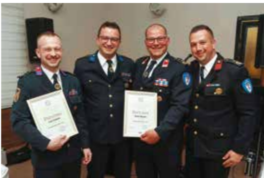
Priznanja novim višim vatrogasnim časnicima

I ove godine u planu je mnoštvo aktivnosti, od redovitih, operativnih, do javnih pokaznih vježbi,