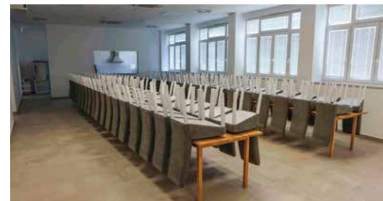
Velika dvorana s novim stolovima i stolicama

U nastavku su program uljepšale dječja folklorna sekcija KUD-a Salinovec te sekcija odraslih te svojim nastupima oduševili publiku. Nakon završetka, svi nazočni su razgledali objekt te se nastavili družiti uz domjenak, kolače koje su ispekle domaće žene te uz glazbu tamburaša, a druženje je potrajalo i poslije ponoći. Program je vodila Magdalena Lepoglavec.(ljr)