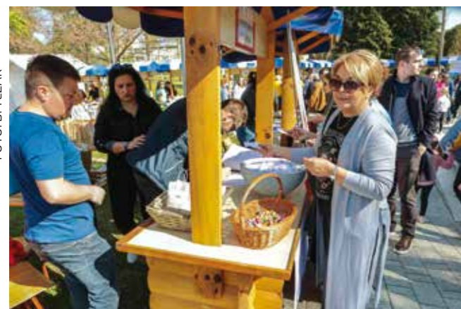
Na prodajni tombola – gužva

Manifestaciju je organizirao Grad Ivanec u suradnji s Poslovnom zonom, TZ-om, svim gradskim ustanovama, udrugama i školskim zadrugama