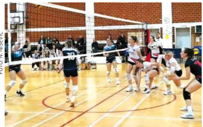
Solidan plasman pomlađene seniorske ekipe

Ekipu ŽOK Ivanec vodi trener Vladimir Gruđenić, dok se trener Ivan Hrg posvetio treniranju mladih uzrasta i vodi ekipu ŽOK Ivanec 2 u 3. HOL Sjever (nn)