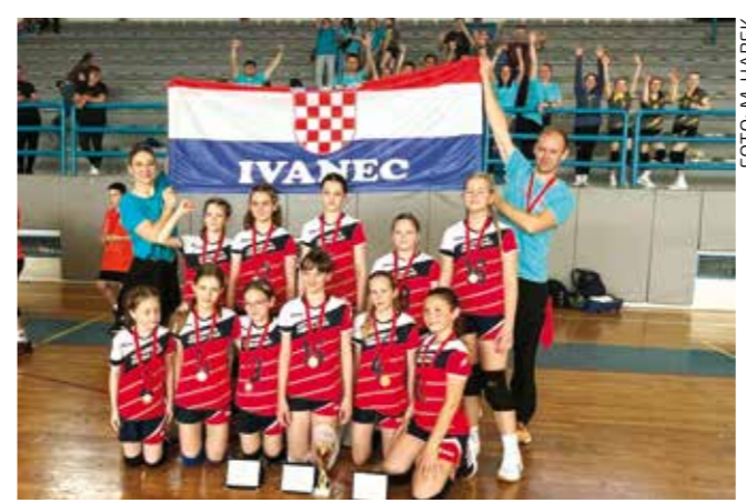
Tri najbolje igranje prvenstva - iz Ivanca

vodstvu, na kraju je prevladala Ivančica. Domaćin je dobro odigrao obranu i skok, a u zadnjih 10 minuta utakmice uspješno je odgovorio na sve taktičke promjene gostujuće momčadi i na vrlo agresivan zonski pressing u posljednjim minutama te svoju prednost uspio povećati na plus 10 koševa. Prvo ime utakmice bio