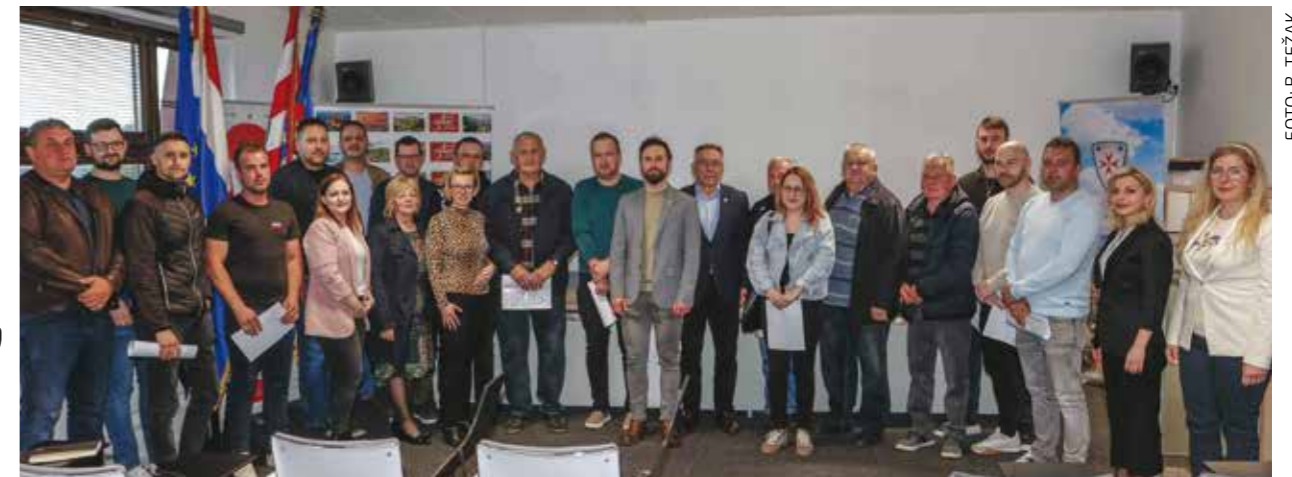
Građanima Grada Ivanca uručeno je novih 25 ugovora o korištenju gradskih poticaja

–Ugradnjom ove odredbe u prijedloga Zakona osiguralo bi se da se na jasan i nedvosmišlen način kroz pravni okvir definiraju namjera zakonodavca da unutar Parka prirode nije dozvoljeno otvaranje kamenoloma. Također, jasno je da bi otvaranje kamenoloma unutar zaštićenog područja bilo konfliktno u odnosu na samu definiciju parka prirode! I to je ono što ističemo, dokazujemo i protiv čega se borimo već tri godine! A to je da kamenolomu nema mjesta u Parku prirode – naglašava Batinić.