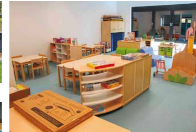
Nabavljena je kompletna nova didakta

Uz veliko uzbuđenje malenih, a kojima su se pridružili i odgojiteljice i većina okupljenih, potom su u zrak pušteni baloni, koji su tako nadaleko pronijeli sreću djece otvaranjem njihova prekrasnog vrtića. Svečanost je nastavljena obilaskom i razgledavanjem prostora, pri čemu su svi