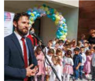
M. Friščić: Moderni i vrhunski uređeni prostori za malene