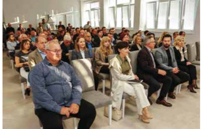
Na svečanosti otvaranja društvenog centra Salinovec