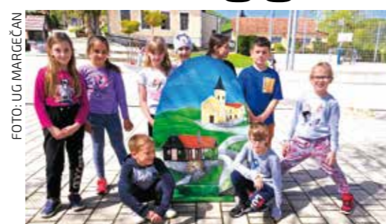
Pisanici su se razveselili i učenici PŠ Margečan

Makete su izradili učenici-stolari Srednje škole Ivanec, a prepoznatljivim motivima našega kraja oslikala ih je N. Bujanić