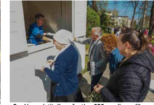
Grad je posjetitelje počastio s 500 porcija vrućih sardelica

U USKRSNIM DANIMA Na Kinotrgu Ivanec, u Salinovcu i Margečanu