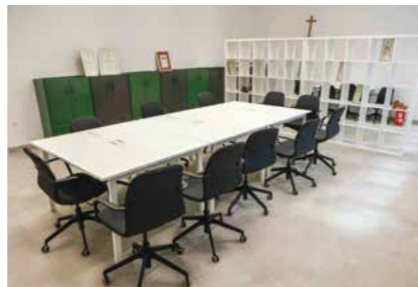
Prostor za rad udruga i MO-a