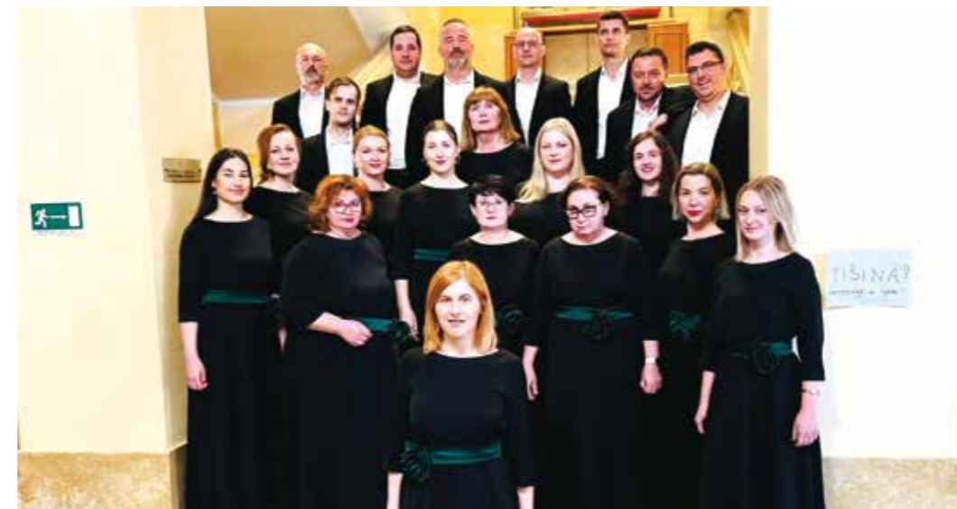
Ivanečki zborasi presretni osvojenim zlatom u Puli