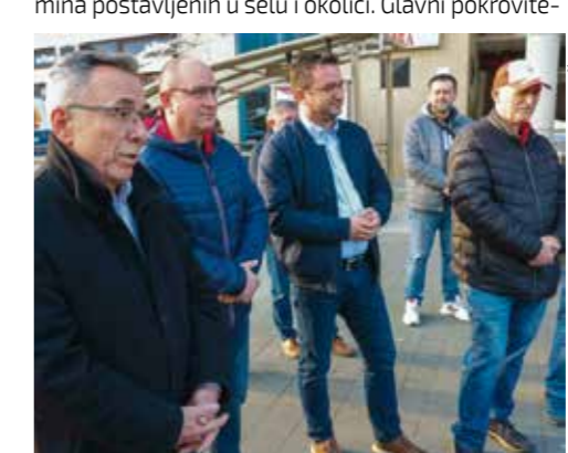
S ispraćaja Martana u Ivancu

liji ovoga pohoda bili su Grad Ivanec i Varaždinska županija, a organizaciju potpisuje UDVDR Ivanec.