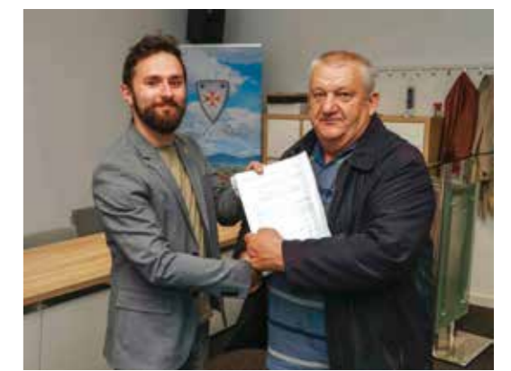
15 novih ugovora za energetska obnovu obiteljskih kuća

Razmišljamo i o drugim oblicima participacije Grada u provedbi mjera energetske učinkovitosti, no primjena toga ovisit će i o tome u kom smjeru će ići europske zelene inicijative – zaključio je Friščić. Inače, vlasnici obiteljskih kuća mogu od Grada ostvariti bespovratna sredstva koja, ovisno o mjeri koju izvode, iznose od 663,61 do 1.990,84 eura. (ljr)