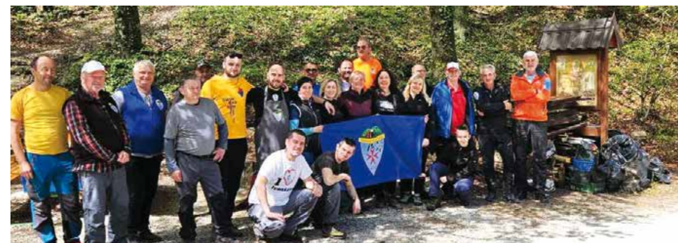
Članovi PK Ivanec u akciji Proljetni sjaj 2025.

PROLJETNI SJAJ Eko akcija članova Planinarskog kluba Ivanec