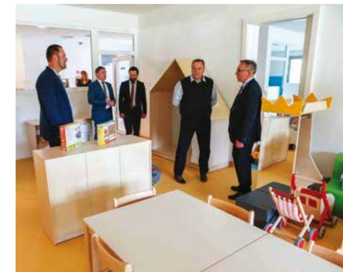
U obilasku novog objekta

POVIJESNI DAN ZA RADOVAN U nazočnosti razdragane djece, odgojiteljica i gostiju