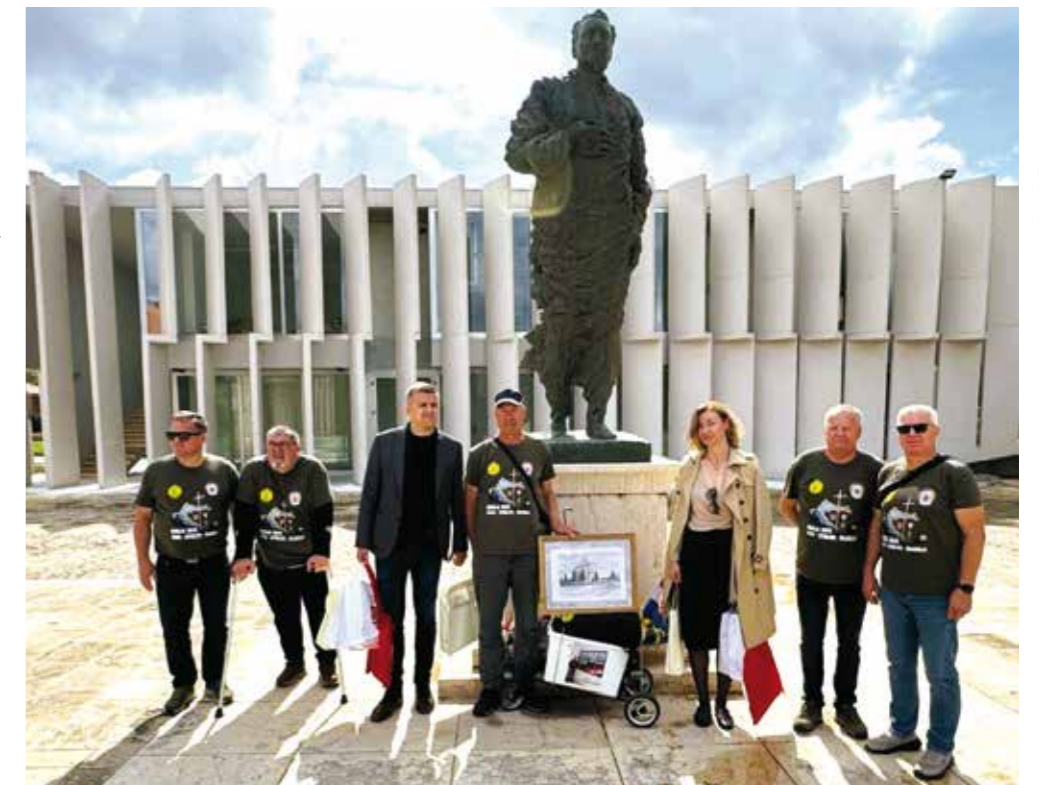
S gostima i domaćinima u Škabrnji