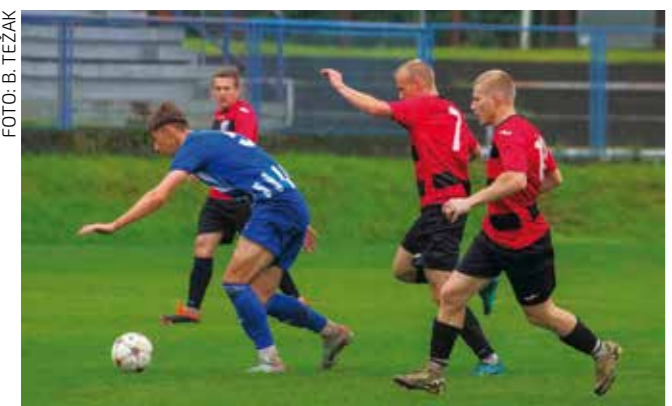
Zasluzena pobjeda NK Mladosti nad NK Ivančicom u Ivancu