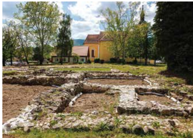
Sanacija istraženog lokaliteta preduvjet je za uređenje arheološkog parka Stari grad Ivanec