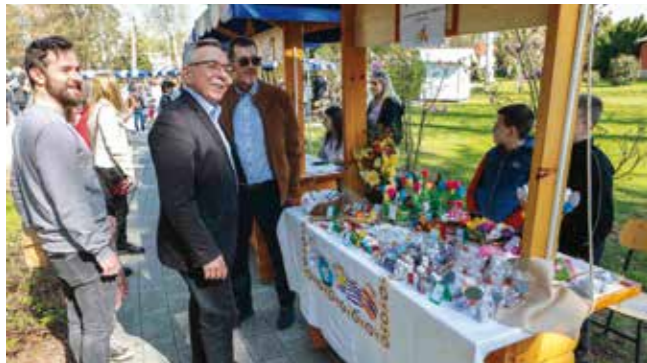
Zanimljivo na štandu Učeničke zadruge „Igllica“ OŠ Radovan