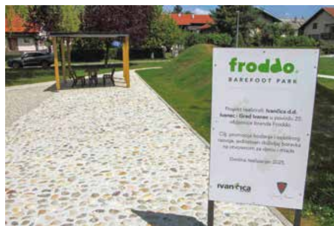
Službeno otvaranje s atraktivnim programom – za Dane grada