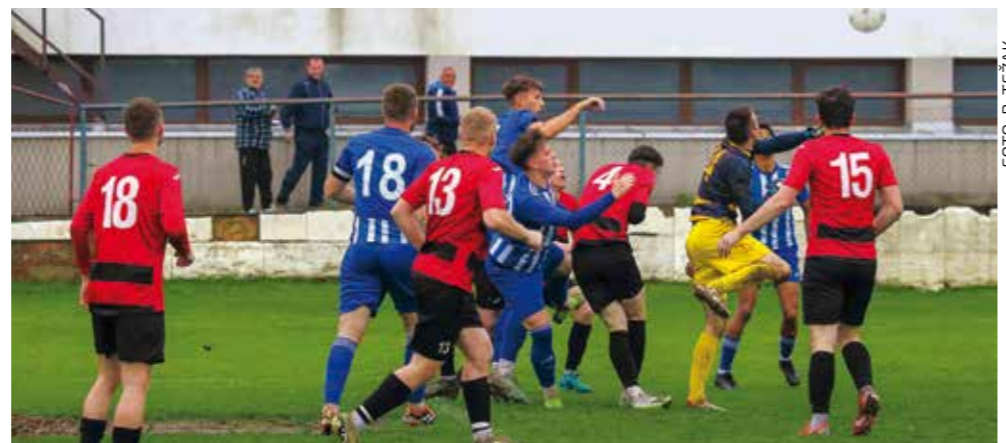
Neočekivani poraz Ivančice na domaćem terenu u lokalnom derbiju s Margečanom

U trenutku zatvaranja ovog novinskog izdanja Ivančica je na prvenstvenoj tablici bila 8., s 25 bodova, i nije uspjela izboriti plasman među šest prvoplasiranih momčadi koje će igrati Ligu za prvaka, već će igrati Ligu za ostanak. Vodeća momčad lige je Bednja iz Beletinca (nn)