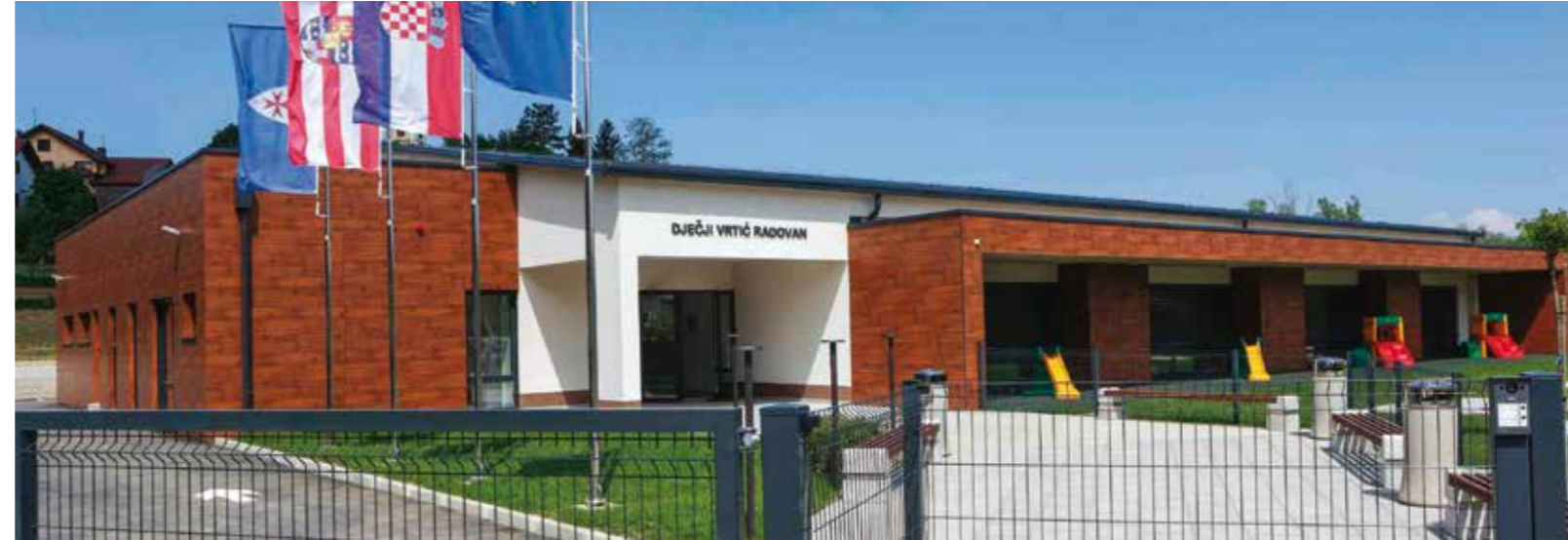
Novi dječji vrtić Radovan