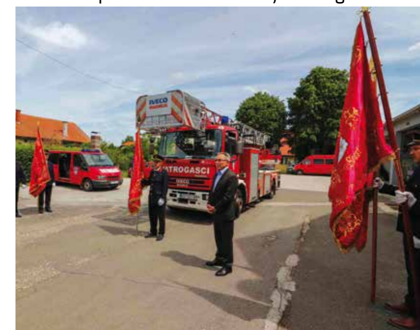
Uz milijun kuna za ljestve 2024., DVD-u Ivanec i 500.000 € za navalno vozilo

GRAD IVANEC I VATROGASNA ZAJEDNICA Potpisani novi Sporazum o financiranju vatrogastva