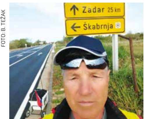
Zadnje skretanje do cilja