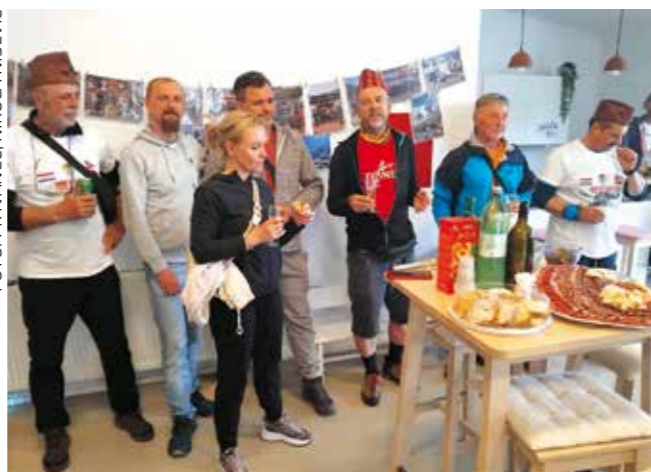
Na dočeku u članova ekspedicije u klupskim prostorima u Retru