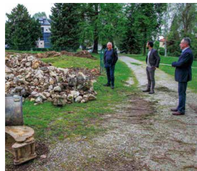
Gradski čelnici u obilasku završnih radova

Ovom fazom radova izvedena je nužna priprema za potpuno uređenje arheološkog nalazišta i njegovo otvaranje za javnost. Grad Ivanec trenutno je u postupku javne nabave za izradu projektne dokumentacije koja će definirati način prezentacije nalaza, a za čiju izradu je Grad ostvario 15.000 € potpore od Ministarstva kulture i medija.