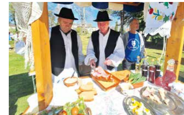
Za prste oblizati: Na štandu Maske rezala se uskrsna šunka