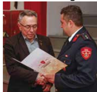
Batinić: Grad visokim izdvajanjima nastavlja pratiti rad dobrovoljnih vatrogasaca