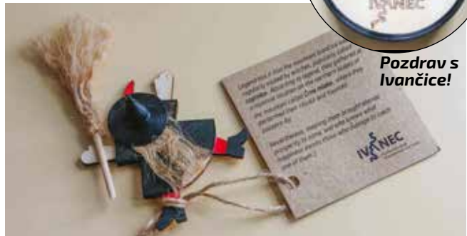
Nepažljiva coprnica se zabila u zid!

IZ SUVENIRNICE MUZEJA PLANINARSTVA Simpatični suveniri iz Planinarskog grada