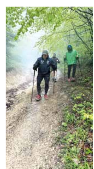
Utrku otežali kiša i vjetar