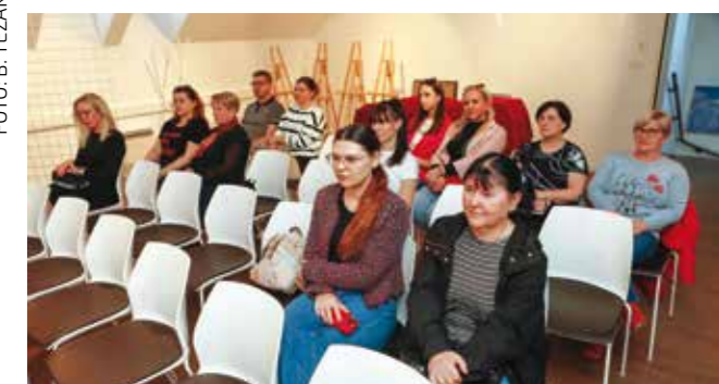
S promocije zbirke „Tragovima mašte“

Autor je s publikom podijelio brojne anegdote i doživljaje s planinarenja, među kojima su i noćenja u starim gradinama na Ivančici. Nakon službenog dijela, publika je razgledala slike koje je autor snimio na svojim planinarskim pohodima po Ivančici, Velebitu i drugim planinama. (aš)