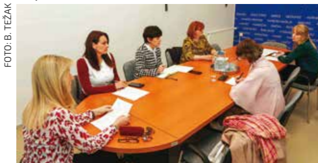
Sa sastanka Upravnog odbora Zaklade Grada Ivanca