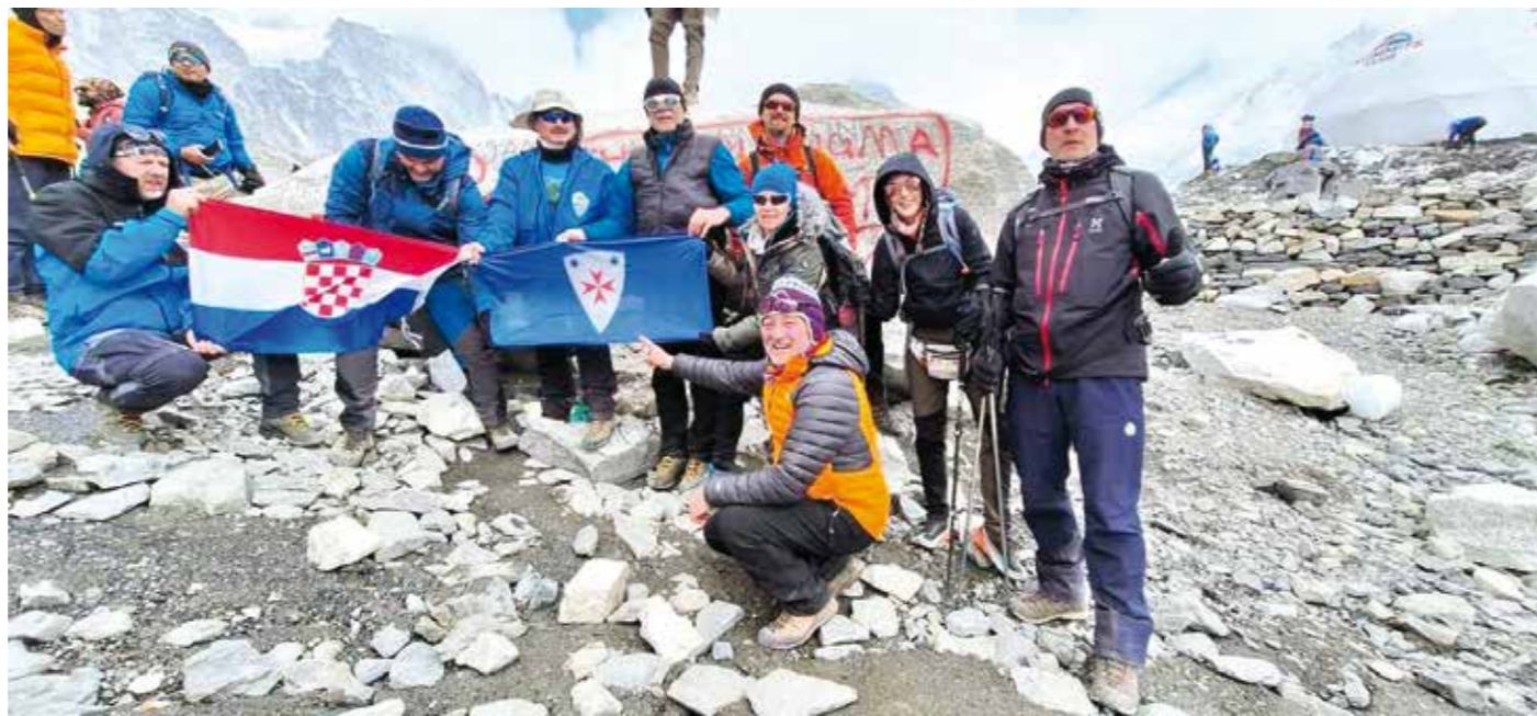
Ivanečka zastava na Himalaju

PLANINARSKI KLUB IVANEC Članovi ivanečke ekspedicije na Himalaju vratili se u Ivanec