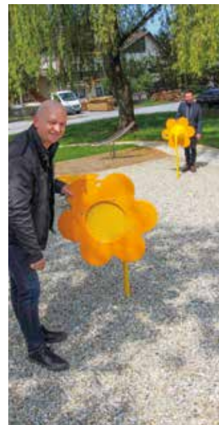
Zvukoplov omogućuje razgovor „na daljinu“