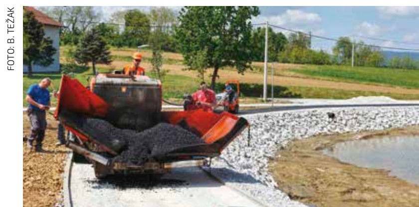
Asfaltiranje biciklističke staze oko bajera