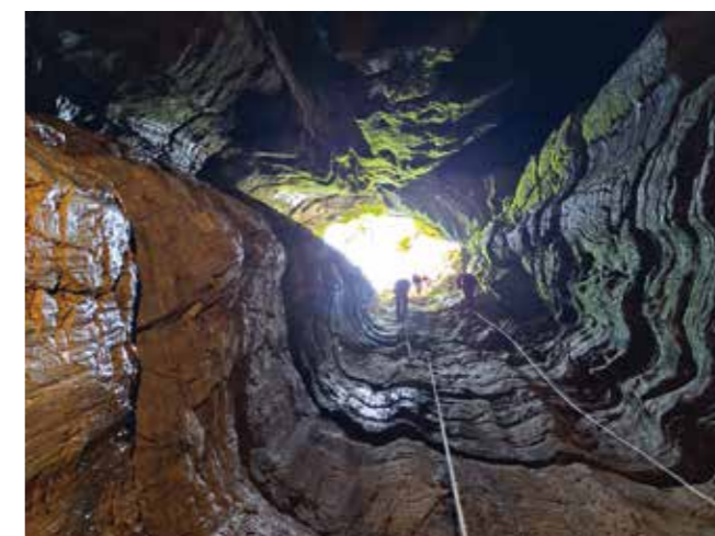
Ovako izgleda spuštanje u dubinu

–Udruga je dosad odradila 13 speleo škola te osposobila 115 speleologa pripravnika. Speleo škola i ovoga se puta potvrdila kao prilika za ojačavanje starih i sklapanje novih prijateljstva, a iz koje svi izlazimo bogatiji za nova iskustva – priopćeno je iz SU K. zviru.