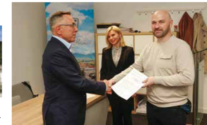
Sretno s rješavanjem stambenog pitanja!

◆◆ Sve više raste interes građana i za energetske poticaje pa je u ovom, petom krugu podjele, s korisnicima zaključeno 15 novih ugovora; ; najveći interes građana je za fotonaponske sustave