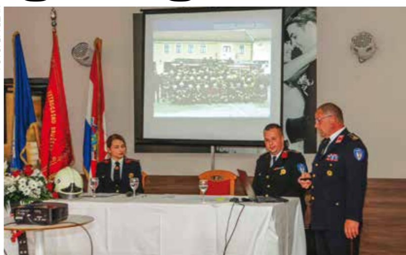
DVD Ivanec perjanica je vatrogastva Grada Ivanca i cijele Županije