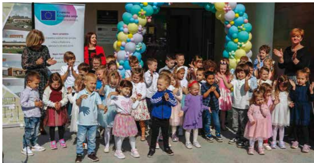
Čekaju ih prekrasni dani u novome vrtiću!