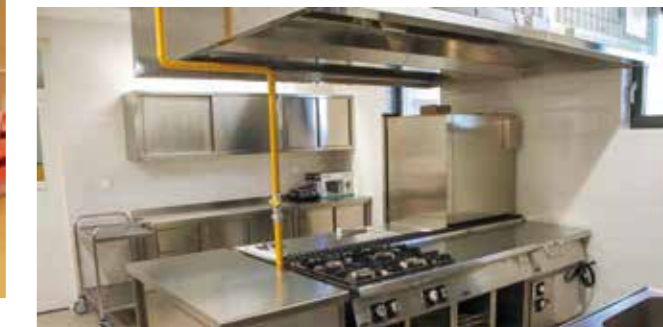
Moderna vrtićka kuhinja

mogli konstatirati samo jedno: Radovanski vrtić je prekrasan! Otvaranju novog vrtićkog objekta nazočili su vijećnici Gradskog vijeća Ivanec u mandatu 2021.-2025., svi gradski pročelnici i drugi predstavnici gradskih službi te Poslovne zone Ivanec, članovi Upravnog vijeća DV Ivančice, kolegice iz DV Ivan-