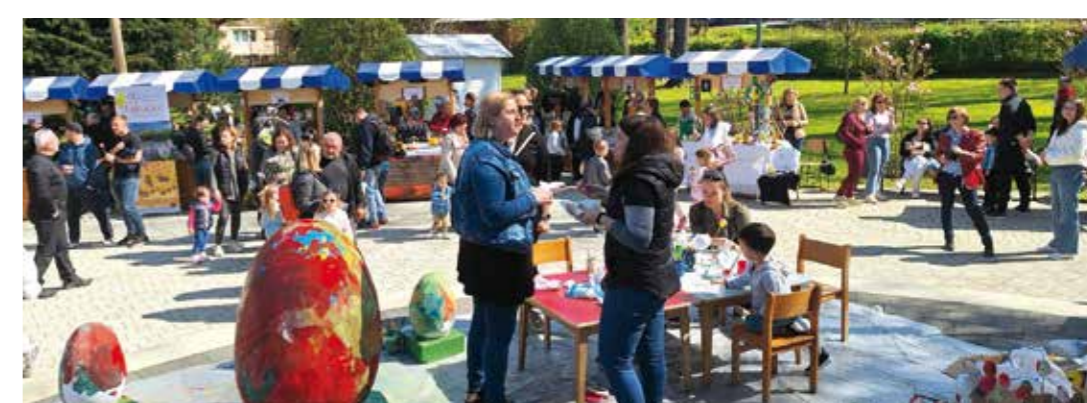
Atmosfera na manifestaciji Uskrs u Ivancu