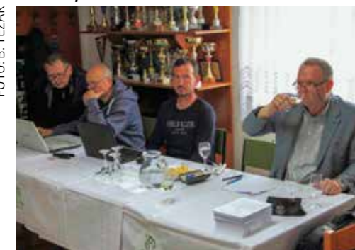
Ocjenjivanje vina berbe 2024. godine

Ocjenjivanje vina i ove je godine novčano podržao Grad Ivanec. Priznanja najboljim podrumarima bit će uručena na središnjoj svečanosti koju Peharček tradicionalno priređuje u lipnju, u povodu Dana grada Ivanca. (Ijr)