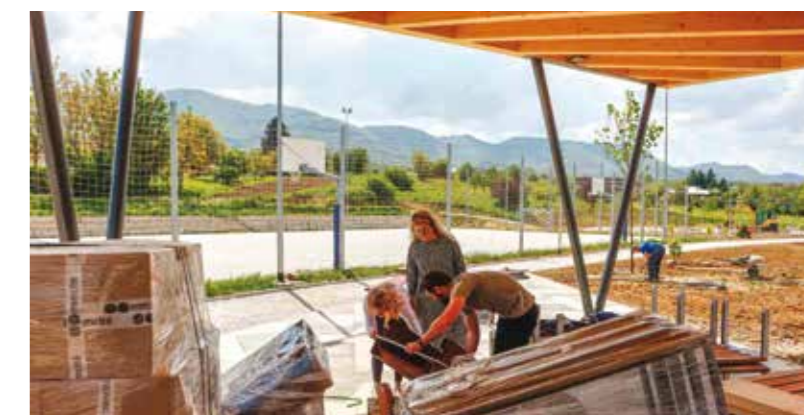
Slatke brige: Oprema se raspakirava...

Grad u suradnji s Mjesnim odborom i DSR-om Lančić-Knapić već obavlja pripreme za otvaranje ovog, u svakom pogledu prekrasnog i atraktivnog rekreacijskog centra, kakvog nema nadaleko, a na otvorenje će već ovih dana biti pozvani svi građani Grada Ivanca.(ljr)