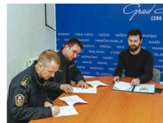
Grad Ivanec do 2030. god. nastavlja financirati sve DVD-ove kroz VZ

–Uz redovita sredstva koja je Grad za vatrogastvo dužan izdvajati temeljem Zakona o vatrogastvu (sada je to 101.000 € na godinu), i u sljedećih pet godina nastavljamo s dodatnim izdvajanjima u iznosu od 14.000 € godišnje za opremanje svih DVD-ova tehničkom i osobnom opremom za vatrogasce. U 2026. i 2027. ovaj ćemo iznos još i pojačati s dodatnih 70.000