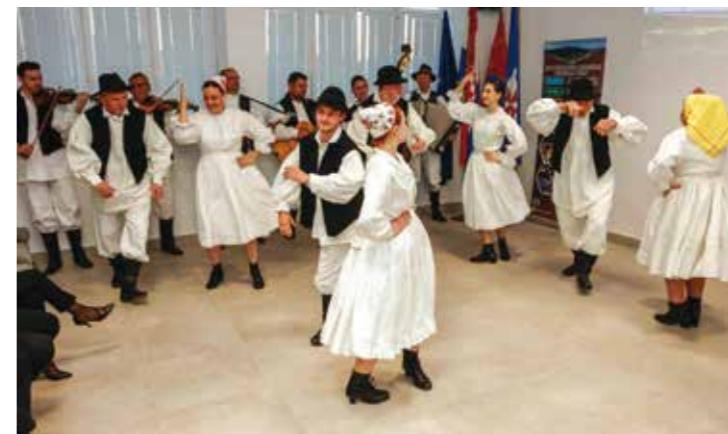
Odrasli folklorišti – sjajni!