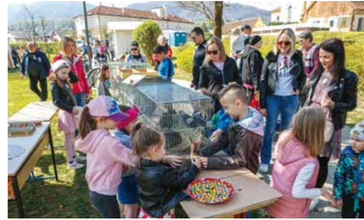
Baš u duhu Uskrsa: Kod Faune i (živi!) uskrsni kunići