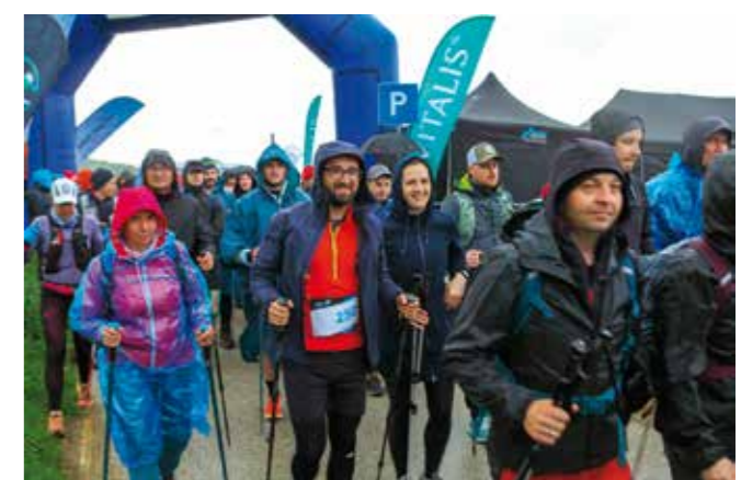
Startalo 200 sudionika iz zemlje i inozemstva

s 11 uspona. Puni dojmova i ohrabreni velikim brojem pozitivnih komentara, iz SRD 315 Sjeverozapad najavili su i 7. izdanje ove utrke, čija popularnost sve više raste u Hrvatskoj i diljem Europe. (aj)