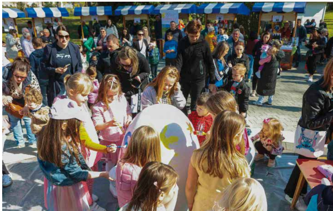
Pune ruke posla s bojanjem pisanica!