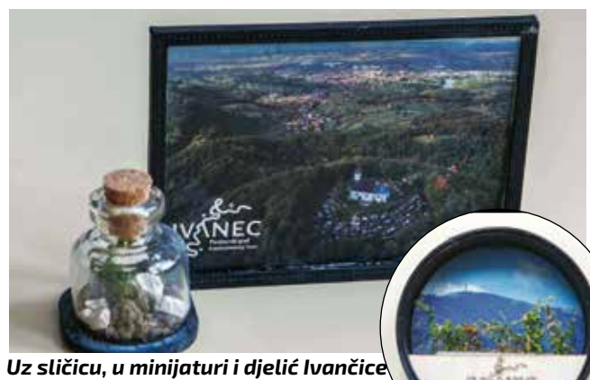
Uz sličicu, u minijaturi i dijelić Ivančice