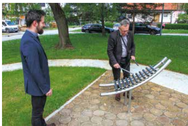
Prostor je obogaćen i ksilofonom

Službeno otvaranje barefoot parka, s atraktivnim programom za djecu i roditelje, Ivančica d.d. priredit će za vrijeme Dana grada Ivanca. Park je slobodan za korištenje svima koji žele iskusiti prednosti bosonogog hodanja po različitim teksturama.