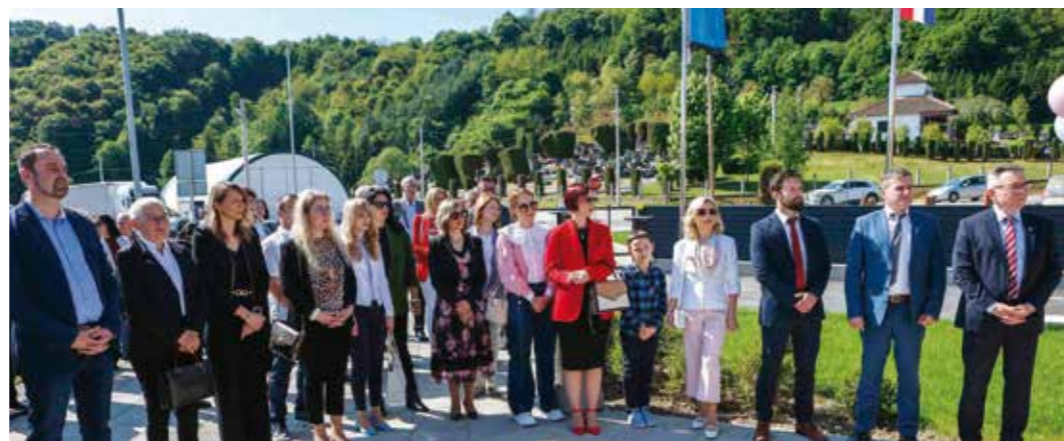
Gosti i uzvanici na otvaranju vrtića u Radovanu