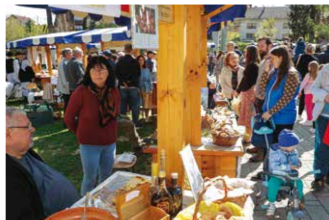
„Moving“ na „Uskrsu u Ivancu“