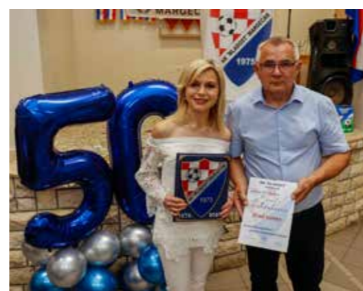
Za potporu, zahvalnica i Gradu Ivancu