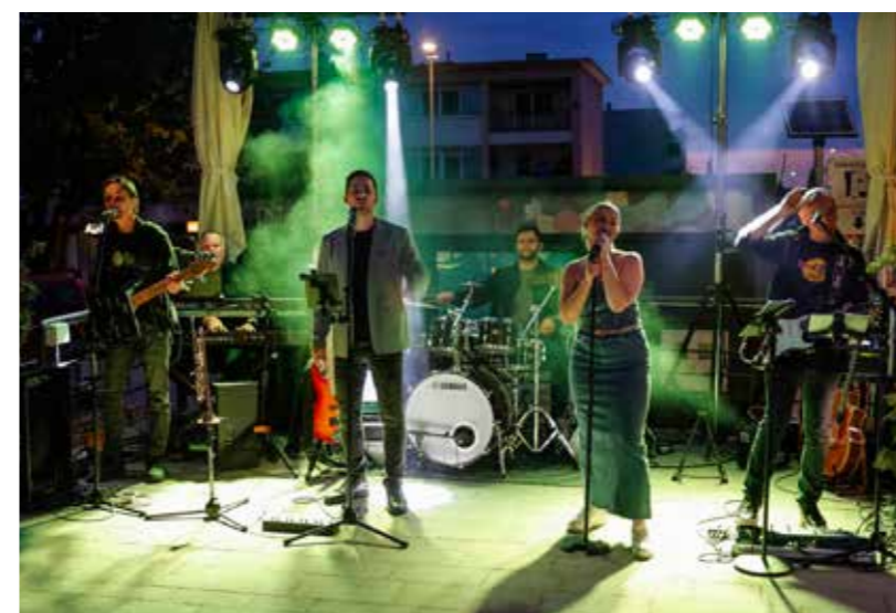
Sjajna zabava uz odličan Ex Zodiac band