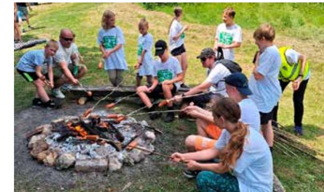
Mnoga djeca svoje su dojmove o planinama izrekla u stihovima