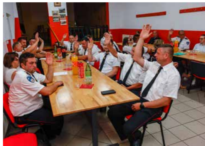
Na skupštini su sudjelovali predstavnici svih 6 DVD-ova

KLIZIŠTE U tijeku sanacija velikog klizišta na nerazvrstanoj gradskoj cesti u Prigorcu