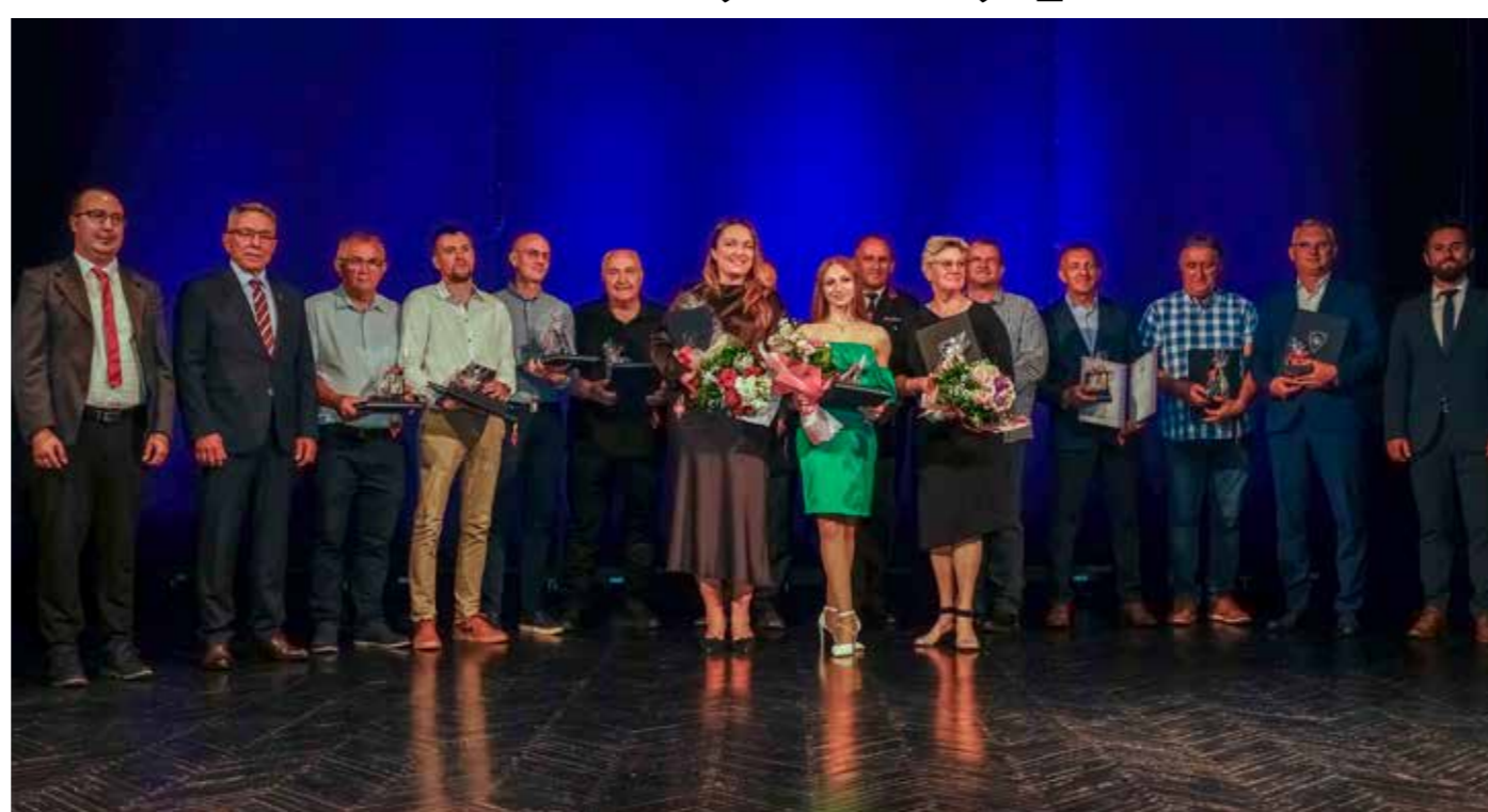
Dobitnici javnih priznanja 2025.

-No, isto tako očekujem više podrške i razumijevanja središnje i županijske vlasti nego što je to bilo do sada. I to ne za moje potrebe, nego za potrebe vas, građana. Vjerujem da će biti suradnje, ja sam optimist. Jednako