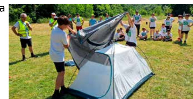
Praktično znanje – kako podići šator