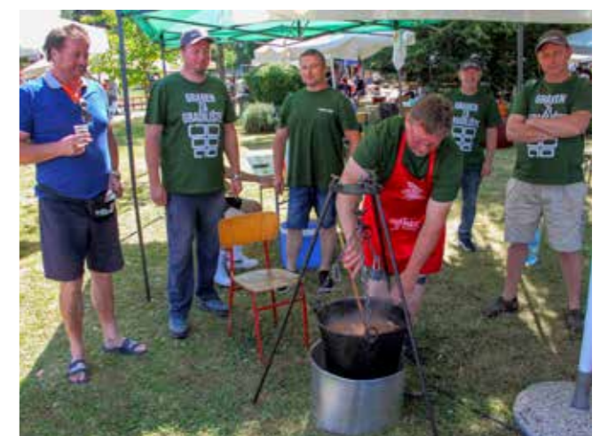
Možda i jesu „građeni za gradilište“, ali gulaš im je prva liga!

potvrdio kao najveće zabavno druženje Ivančana i njihovih gostiju. Atmosfera je bila za pamćenje, a sjajan glazbeni štimung priredili su Fingaši iz Prigorca. (Ij)