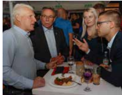
Debata: Što su donijeli protekli izbori?

U središtu svake odluke Gradskog vijeća ne smije biti ni ideologija, ni politika,