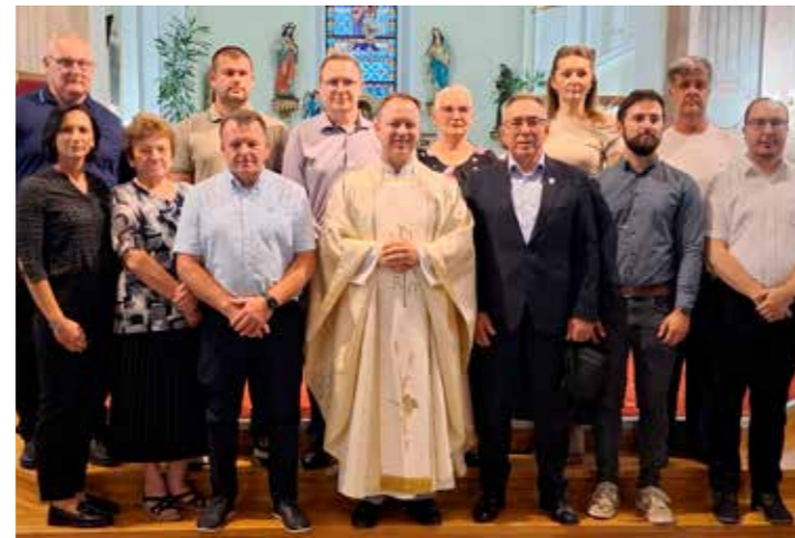
Za uspomenu na 629. rođendan našega Ivanca