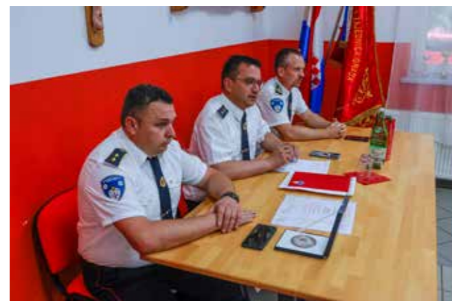
Naglasak na dobru suradnju Vatrogasne zajednice i Grada Ivanca

◆◆ Lani su, istaknuo je, DVD-ovi imali 34 požarne i 22 tehničke intervencije. Iako se javlja problem s pomanjkanjem operativnih članova, primijećen je porast broja vatrogasnog pomlatka i mladeži, što posebno veseli.