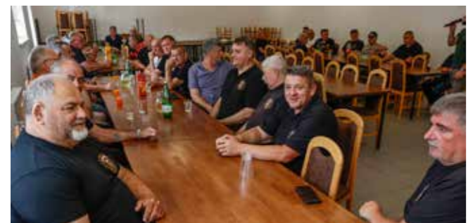
U dobroj atmosferi

TUŽNA OBLJETNICA Uz 33. obljetnicu pogibije hrvatskog branitelja