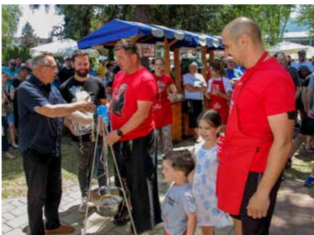
Brončani kotlić kvartovskoj ivanečkoj ekipi Z brega!