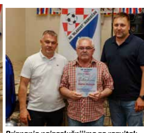
Priznanja najzaslužnijima za razvitak nogometnog sporta