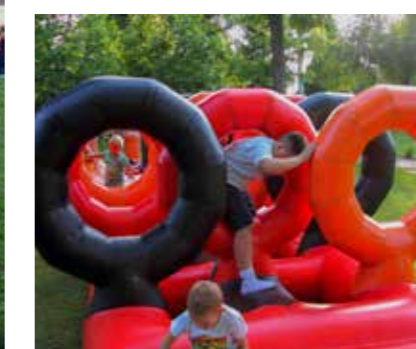
Zabava s kolutovima