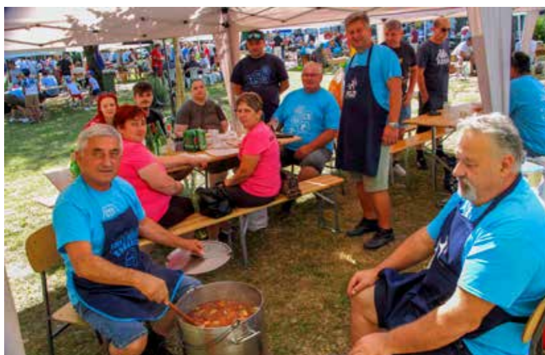
Uvijek je dobro svratiti do ekipe Salinovčana