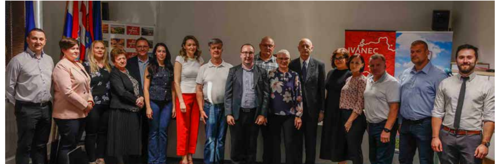
LOKALNI IZBORI Konstituirano novo Gradsko vijeće Ivanec u mandatu 2025.-2029. Novo Gradsko vijeće Ivanec u mandatu 2025.-2029.