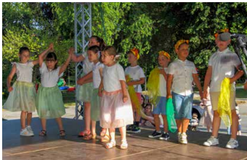
Tete, doviđenja! Najesen nas čeka škola!