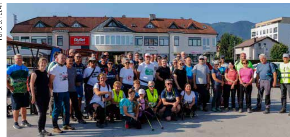
Sudionici jubilarnog 15. pohoda „Tragom vitezova ivanovaca“

PREDAVANJE PK Ivanec predstavio održao putopisno predavanje