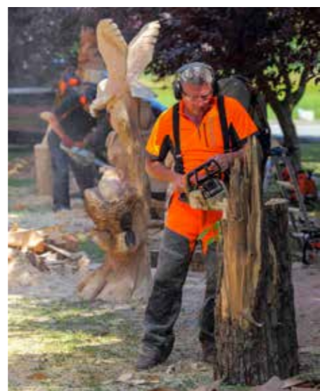
Pila u akciji