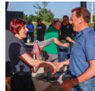
Čestitke za zlatna vina!