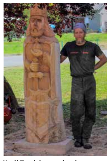
Kralj Tomislav - prigodno uz 1.000. obljetnicu proglašenja hrvatskoga kraljevstva