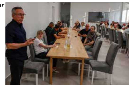
Batinić: Grad vaš rad i dalje nastavlja podupirati novčano i logistički

Nakon službenog dijela, vinogradari su druženje nastavili u dobroj atmosferi, uz meso s roštilja, koje su zalili biranom kapljicom z ivanečkih bregov.(Ijr)