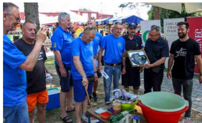
Natjecanju se pridružila i ekipa branitelja iz Grubišnog Polja