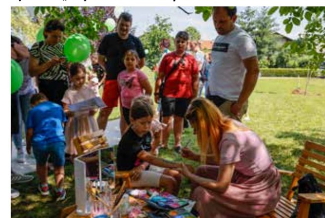
Male princeze uživale su u maštovitim ukrasima svojih lica

šenom desecima zelenih batorna, djecu su zabavljali klaun, animatorice pčelice i veliki žuti Medo. Dječji DJ puštao je zabavnu glazbu za klinge. Dijelile su se besplatne kokice, zelena šećerna vata, a djeca su uživala uz facepainting, razne kreativne radionice, bubble mašine s oblacima mjehurića i sl. Uz mnoštvo igara, na kraju su ostavili i otiske svojih obojenih stopala na zastavi koja je onda i podignuta te se zavijorila na ugodnom povjetarcu!