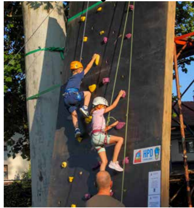
HPD Ivančica razveselio je klince penjačkom stijenom

DVD Ivanec za najmlađe je pripremio zabavne vatrogasne igre pa su djeca s veseljem ispro-