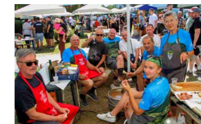
Ako mogu do Nepala, mogu i do srebrnog kotlića – PK Ivanec!