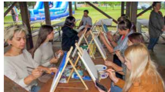
Mladi su vrijeme proveli na likovnim radionicama

UDRUGA UMIROVLJENIKA IVANEC Održana izborna i izvještajna skupština