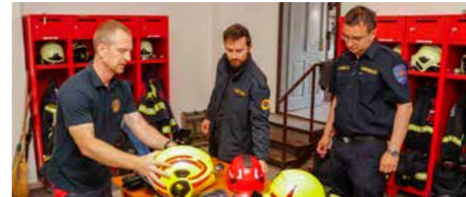
Sredstva za opremanje svakog DVD-a osigurao je Grad

Također, Grad će u 2028. god. osigurati 500.000 € za nabavu navalnog vozila za DVD Ivanec, kao središnju vatrogasnu postrojbu. Zahvaljujući tome, omogućava se visok standard ulaganja i viša kvalitativna razina opremanja vatrogasaca.(ljr)