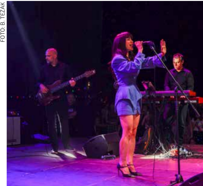
Glazbena ikona hrvatske glazbene scene oduševila je svoje fanove