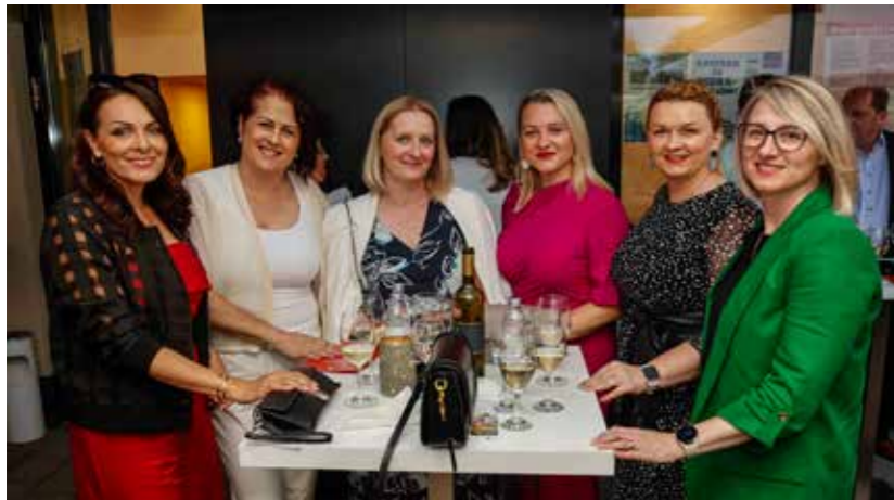
Druženje u dobrom štimungu