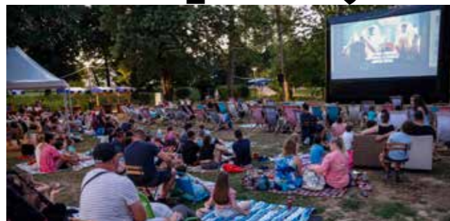
Kino pod zvijezdama u gradskom parku

U punom pogonu bili su i volonteri HPD Ivančica, koji su imali pune ruke posla s malim penja-