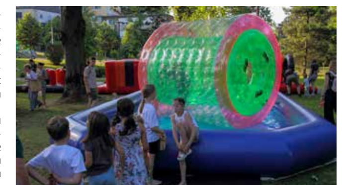
Čega li sve nema! Na valjcima...