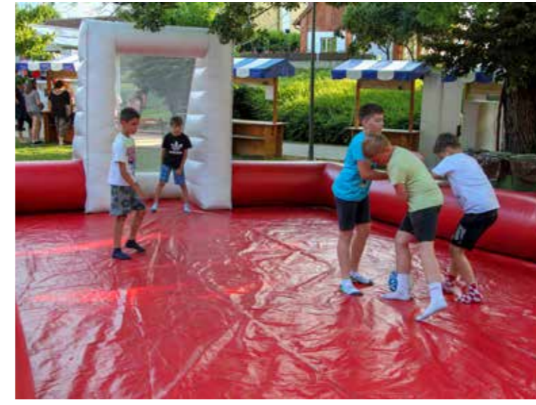
Nema prave zabave bez najvažnije sporedne stvari na svijetu!