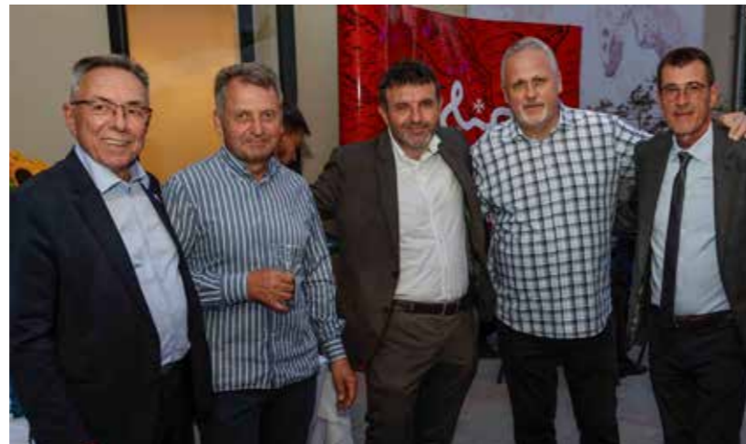
U društvu s novim čelnicima Grada Lepoglave i drugim suradnicima

Na sjednici su zaslužnima uručena javna priznanja Grada Ivanca. (Ijr)