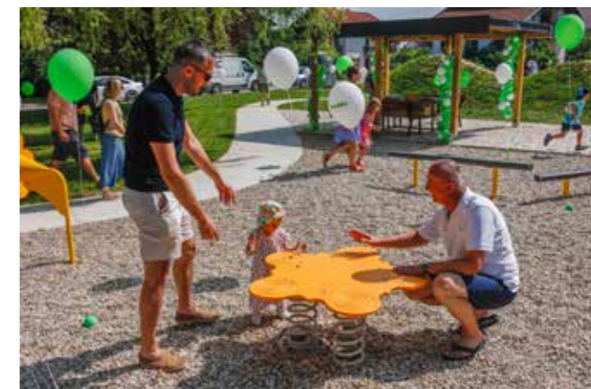
Njihalicu „Cvijet“ obavezno isprobati!

Novi park poklon je Ivančice d.d. svim klincima u povodu 25. obljetnice Froddo cipelica