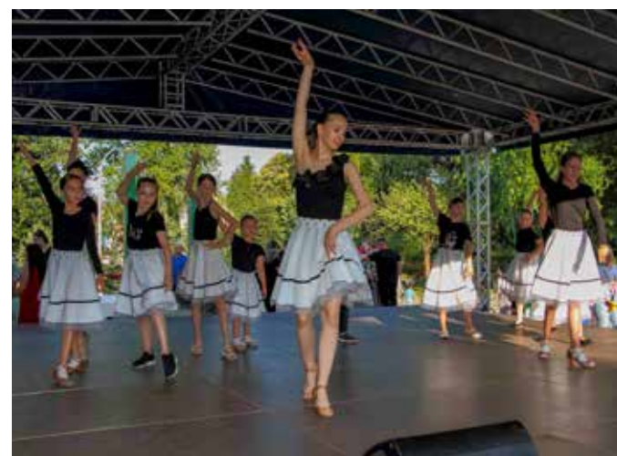
Plesna sekcija Ivanec