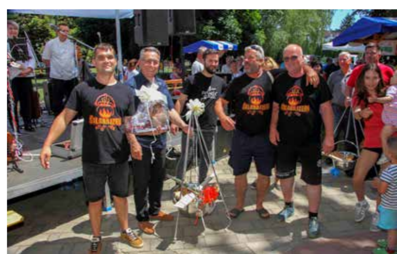
Šalabajzerima kotlić za fair play!