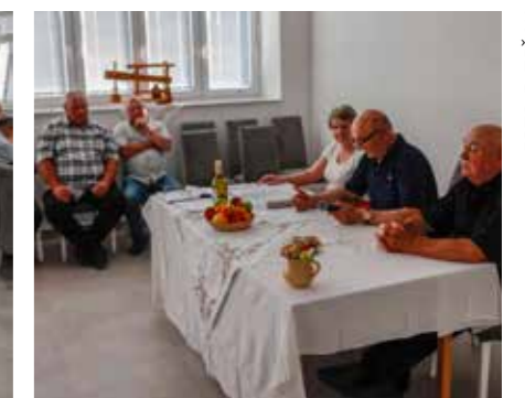
Sa skupštine Udruge vinogradara Skrajski pajdaši