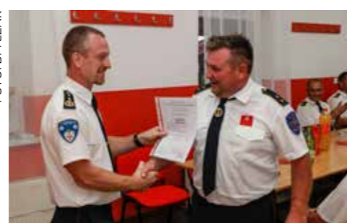
Priznanja zaslužnim vatrogascima