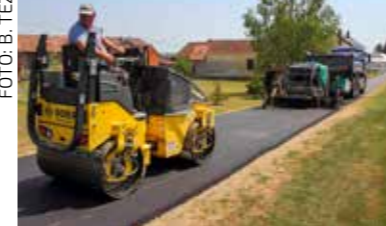
Polaganje asfalta u Salinovcu na dionicu kod sportskog igrališta

Radove vrijedne 515.500 € u cijelosti financira Grad Ivanec