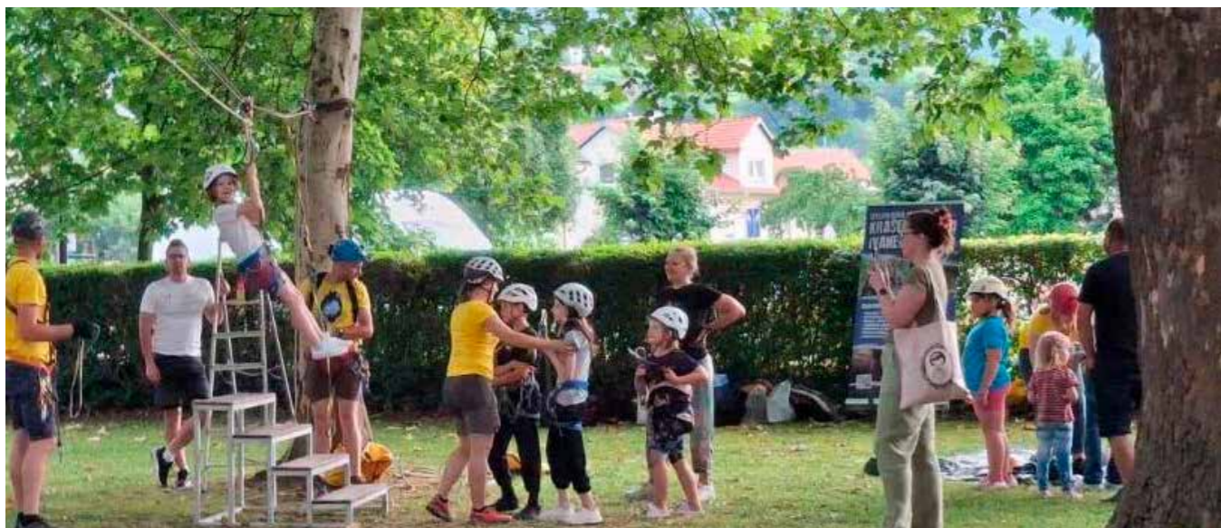
Ivančki speleolozi za najhrabrije su organizirali zip line