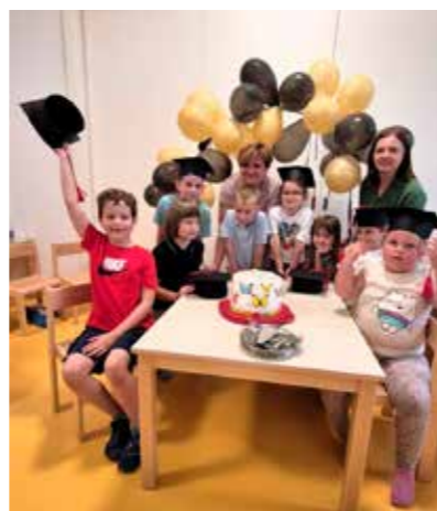
I djeca iz Radovana oprostila su se od vrtića

Oduševljen dječjim programom, Friščić je zahvalio i djelatnicima vrtića i roditeljima što su podigli i do škole ispratili još jednu novu generaciju. A mališani iz Podružnice u Radovanu svoj su oproštajni program izveli dan prije, kada se, uz puno emocija, od vrtića oprostilo desetero djece iz skupine Mravičić (Ij)