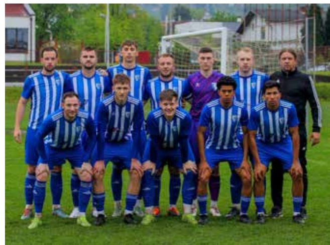
NK Ivančica na 8. mjestu u prvenstvenoj sezoni 2024./2025.