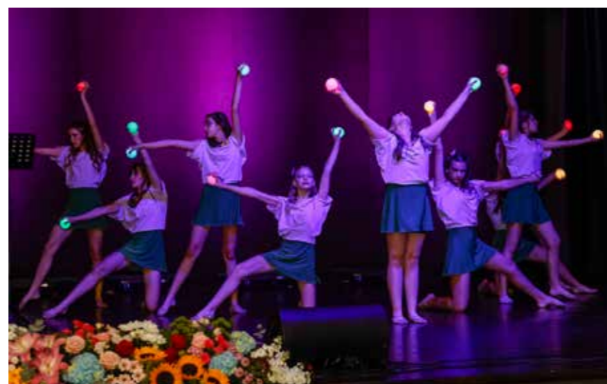
Plesni klub Ivančica: Legenda o Ivančici