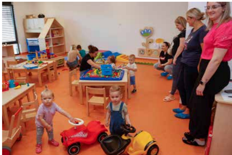
Prvi dan u novome vrtiću; nasmijani i djeca i roditelji

VATROGASTVO Održana skupština Vatrogasne zajednice Grada Ivanca