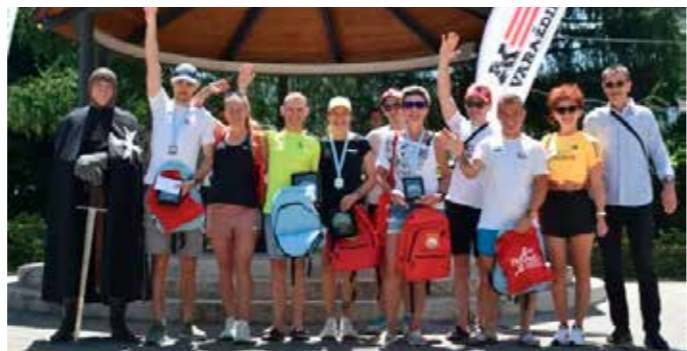
S dodjele priznanja pobjednicima ovogodišnjih utrka