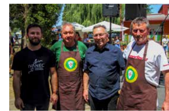
Poklon bon od 100 € Mesnica Vugrinec Gljivarskom društvu Ivanec