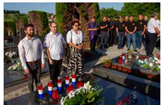
Poklon sjeni poginulog člana 2. ivanečke bojne

♦♦ Biškop je poginuo 19. lipnja 1992. na pakračkom bojištu, kao pripadnik 2. ivanečke bojne 104. brigade HV