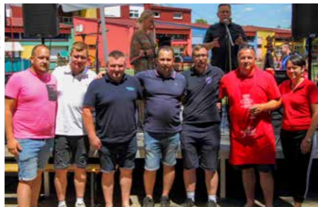
Zlatni kotlić ekipi DVD-a Margečan!