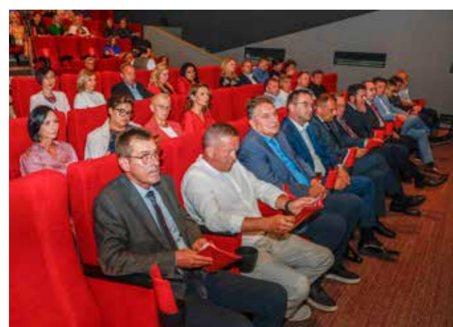
Gosti i uzvanici na svečanosti u povodu Dana grada Ivanca