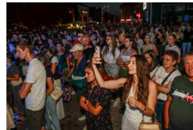
Oduševljena publika na koncertu Vesne Pisarović