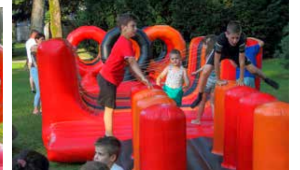
Sjajna zabava na - tuljcima