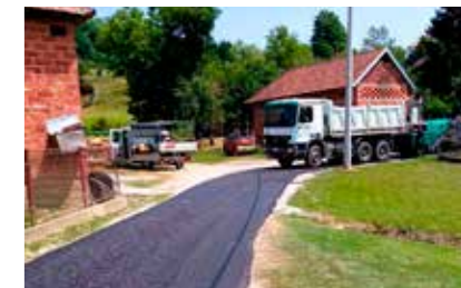
Asfaltirana dionica gradske ceste u Lukavcu

će se i u MO-ima Lančić-Knapić, Vuglovec, Horvatsko, Stažnjevec, Lovrečan, Ivanečka Željeznica, Jerovec, Ribić Breg, Seljanec i Margečan. Strme dionice asfaltirat će se u MO-ima Bedenec, Škripljevec, Salinovec, Vi-tešinec i Ivanec. Ukupna duljina cesta koje će se uređivati iznosi 5.400 metara. Radovi su povjereni najpovoljnijem ponuđaču, Niskogradnji Hudek iz Majerja, a vrijednost ugovorenih radova iznosi 515.500 €.