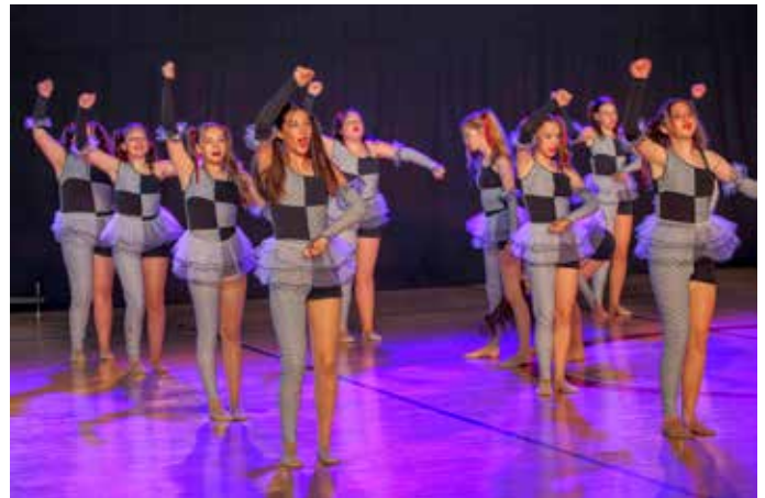
Dojmljiv nastup u sivo-crnim kombinacijama

PLESNI KLUB TAKT Efektnim programom na centralnoj gradskoj bini