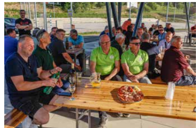
U dobrom društvu