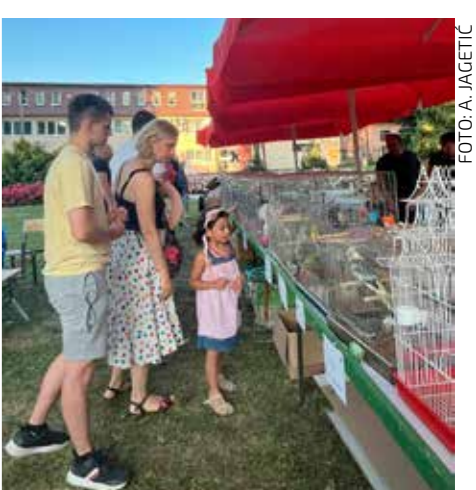
U društvu s pticama