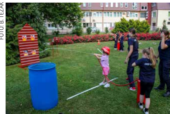
Ovako se odgaja vatrogasni pomladak

bavala vatrogasne brentače i gašenje označenih meta vatre, a okušala se i u igrama spretnosti na vatrogasnom poligonu, u igri križić-kružić te u radionica crtanja i bojanja. Na stolicima u parku igrao se i šah, sve u organizaciji Šahovskog kluba Ivanec.