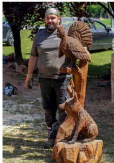
Iz nezgrapnog trupca ovaj je umjetnik na svjetlo dana izvukao pravo remek djelo