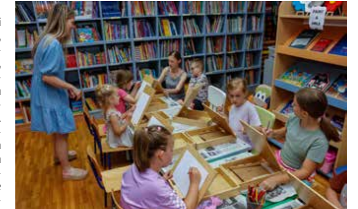
Gradska knjižnica za najmlađe je imala niz poučnih igraonica

Spomenimo također da je u sklopu Dana grada Gradska knjižnica i čitaonica za naše najmlađe priredila cijeli ciklus pričaonica i likovnih radionica posvećenih kraljevskim dvorcima i gradinama, Starom gradu Ivanec itd. (ljf)