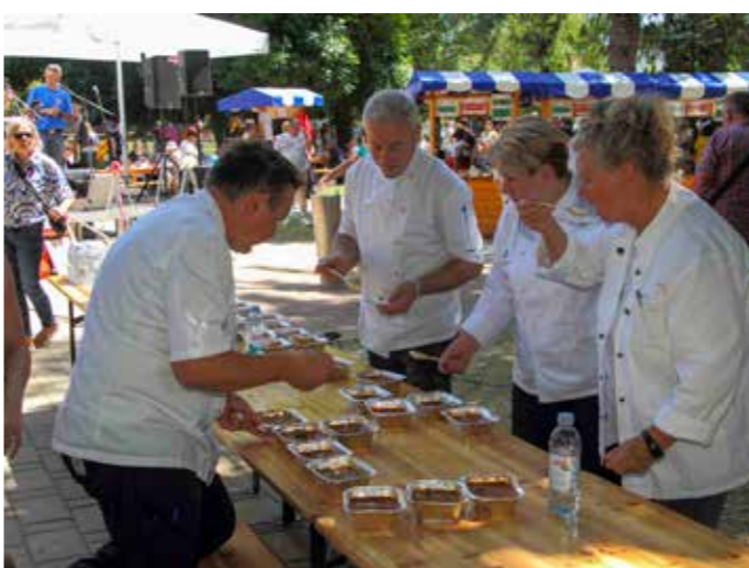
Šefovi su imali dobrog posla u ocjenjivanju 57 gulaša