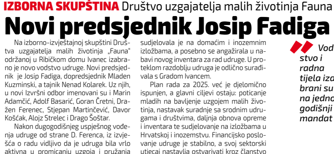
U društvu s pticama