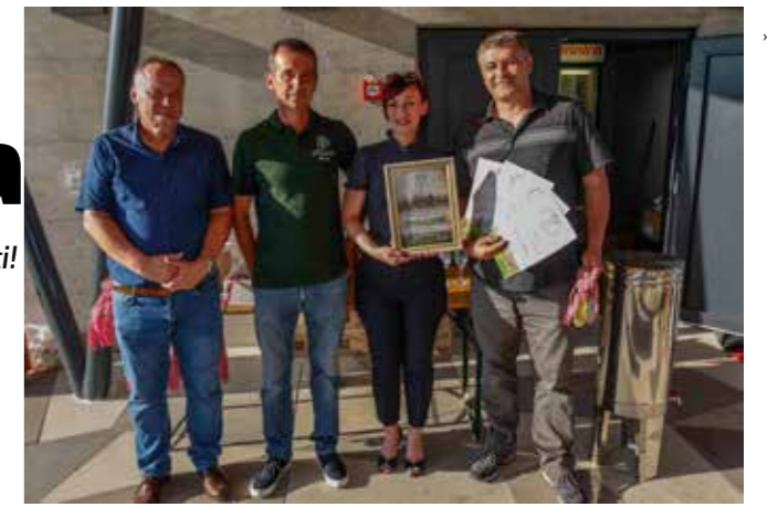
Šampionska titula zaslužno sauvignonu M. Meseca

Vinogradarstvo nije samo posao, ono je način života. Zahvaljujem vam na trudu koji ulažete u obradu vinograda, na očuvanju vinogradarstva, ali i na njezi vinskih tradicija. Hvala i na ljubavi koju pokazujete prema svakom vinskom trsu koji tako strpljivo nježete – poručila je