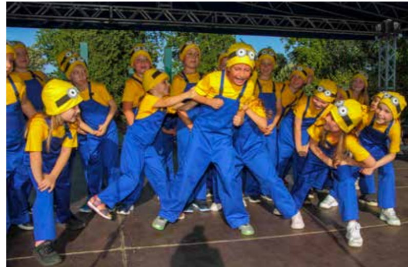
Ovi majstori iz DV Ivančice „prestari“ su za vrtić; vrijeme je za školu