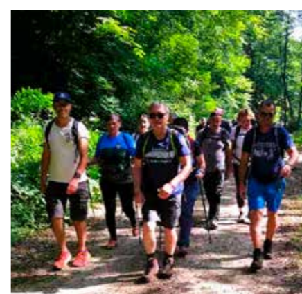
Kratki predah prije nastavka pješačenja stazom dugom 14 km

Na jubilarnom 15. planinarskom pohodu „Tragom vitezova ivanovaca“ koji je, uz tradicionalno pokroviteljstvo Grada Ivanca, održan u organizaciji Planinarskog kluba Ivanec, sudjelovalo je 145 sudionika iz Zagreba, Krapine, Radoboja, Varaždina, Čakovca, Maruševca, Pođevčeva, Brodarevca i drugih mjesta, a najbrojniji su, naravno, bili članovi PK Ivanec. Pješačilo se dvjema stazama – kraćom, rekreativnom (oko 1,5 sati hoda), te dužom (14 km), za čiji je obilazak potrebno oko 4,5 sati. Točka okupljanja bila je na izvoru Šumi, gdje su sve sudionike dočekali planinarski grah, kličići, krafne i osvježenje, a sve to uz druženje u dobroj atmosferi.(nn)