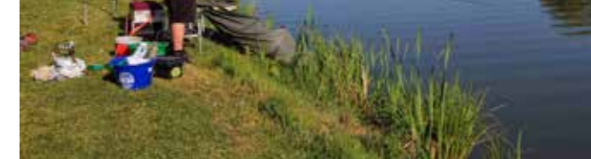
S ribolovnog Kupa Grada Ivanca 2025

Natjecanje je održano pod pokroviteljstvom i uz financijsku potporu Grada Ivanca. (nn)