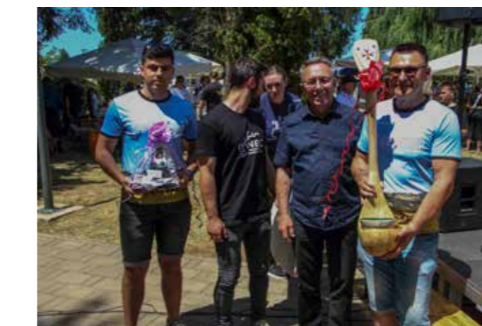
Najšeflja Ivanca OPG-u Smontara!