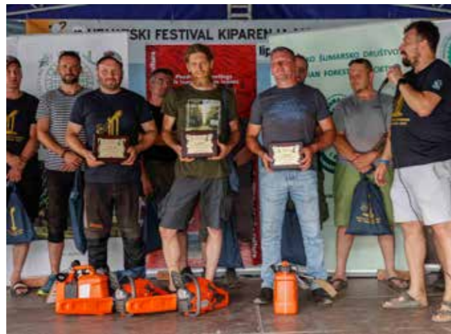
Pobjednici jubilarnog 10. festivala kiparenja motornom pilom

Svim sponzorima uručene su zahvalnice. U Društvenom centru Salinovec otvorena je i izložba "Suma okom šumara".