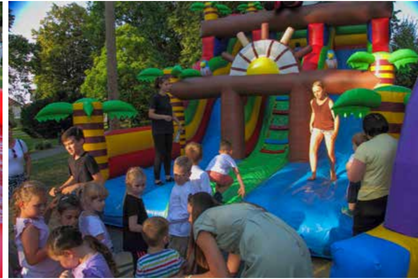
Za najmlađe- napuhanci su "zakon"!