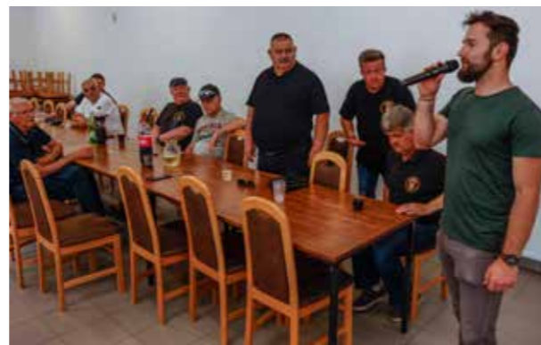
Friščić: Ovim druženjem pokazujete da je prijateljstvo stečeno na bojištu dragocjeno