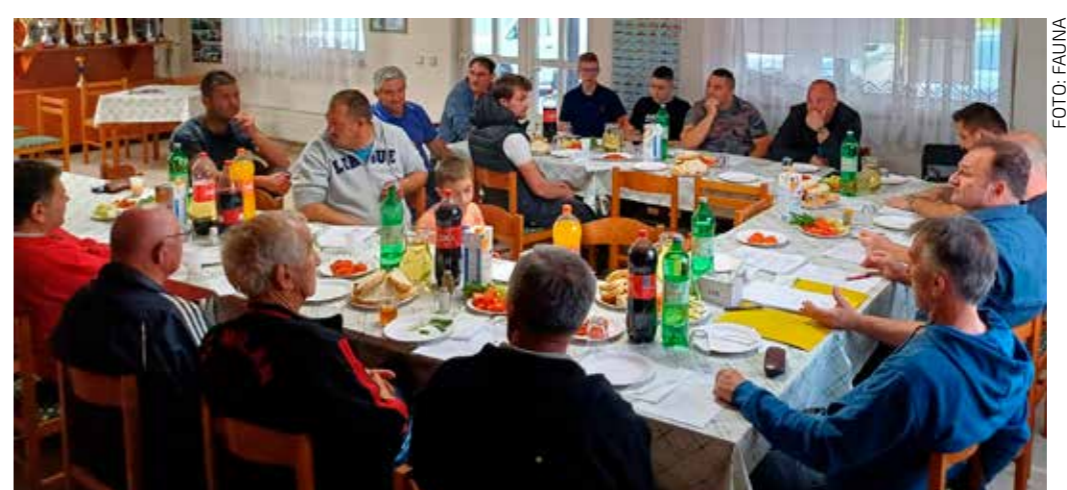
U društvu s pticama