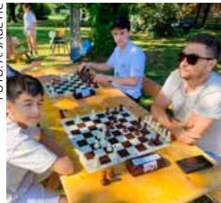
Šah na otvorenom u organizaciji Šahovskog kluba Ivanec

čima te ih i ove godine pažljivo osiguravali u penjanju na 6 metara visok vrh penjačke stijene.