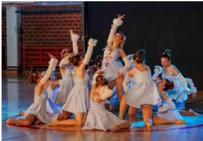
Bajkovita plesna prezentacija