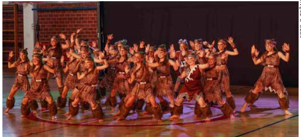
Egzotični ritmovi u odgovarajućoj kostimografskoj prezentaciji

Plesnu produkciju i ovoga je puta novčano podržao Grad Ivanec, a uz brojnu publiku, pratili su je i predstavnici gradskih službi na čelu sa zamjenikom gradonačelnika Markom Friščićem.(aj)