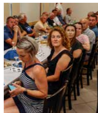
Na svečanosti NK Mladost

U nastavku je podsjetio na natjecanja NK u općinskim nogometnim ligama, pa u Međuopćinskoj ligi Varaždin kao i na uspješnu sezonu 1984./85., kada je osvojio Kup Općinskog nogometnog saveza Ivanec. Osvrnuo se i na gradnju svlačionice koja je počela 1985., na svoj dolazak na čelo kluba 1987./88.,