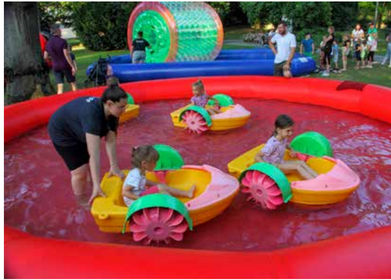
E, ovo treba doživjeti...