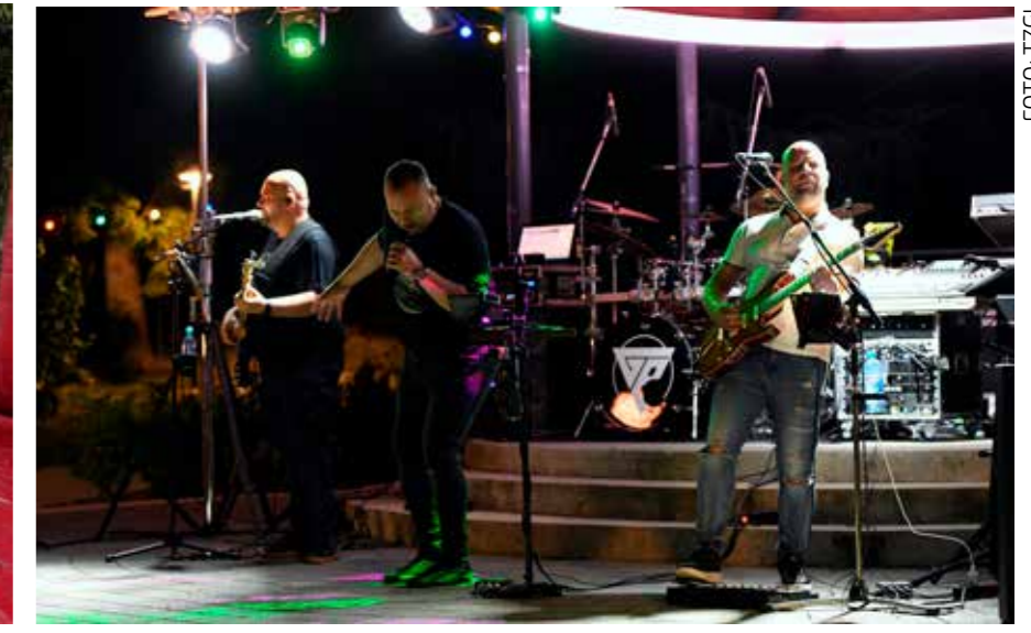
Gloria band u paviljonu u gradskom parku