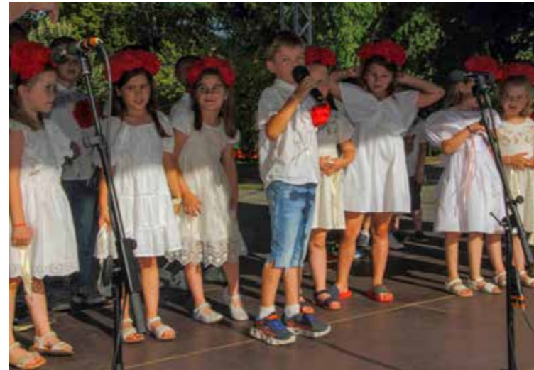
Dirljiv oproštaj od vrtića malenih "bambija"