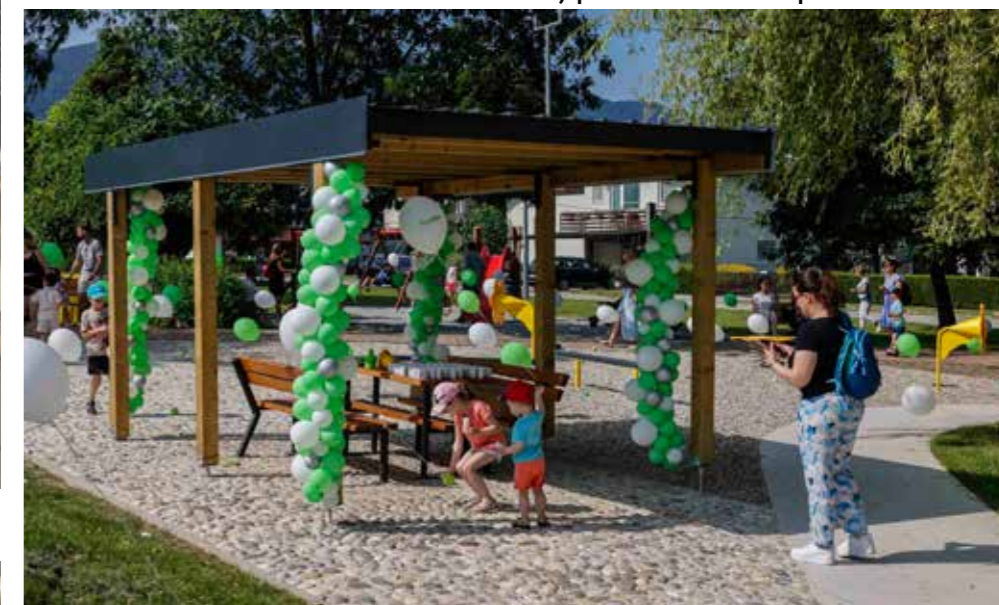
U parku je i nadstrešnica za odmor te hodne plohe po kojima je zdravo hodati bos!