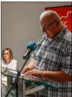
Četrtek na čelu Mandatne komisije