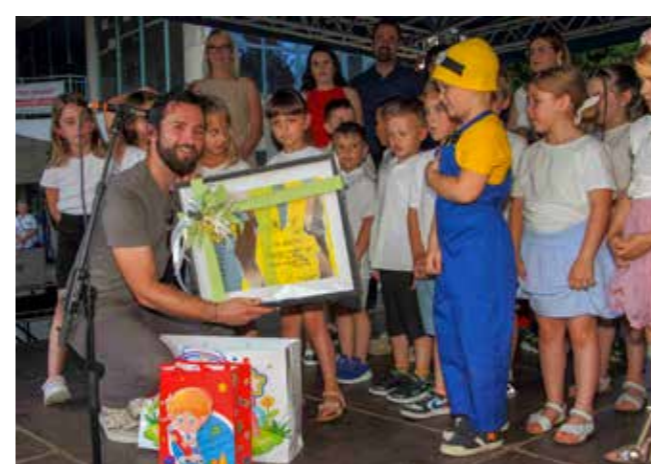
Mališani DV Ivančice Gradu su poklonili sliku koju su sami izradili