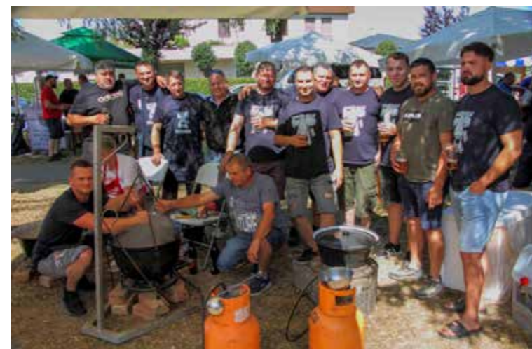
U dobrom raspoloženju, baš kako i treba