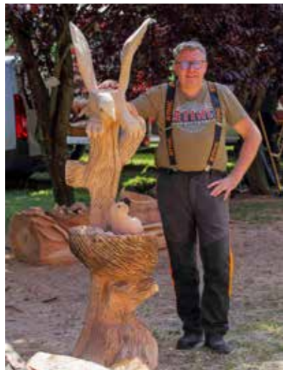
Majstori su iz komada drva izvukli nesevakidašnje animalističke motive