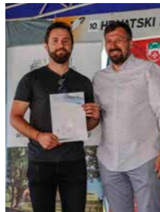
Zahvalnica Gradu za dugogodišnju podršku festivalima kiparenja u Salinovcu