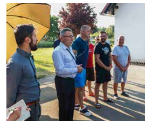
Batinić: Ivanec će iduće godine biti dostojan domaćin Svjetskog ribičkog prvenstva

ve uspjeh, ova osvojena bronca zlatnog je sjaja! – poručio je Batinić.