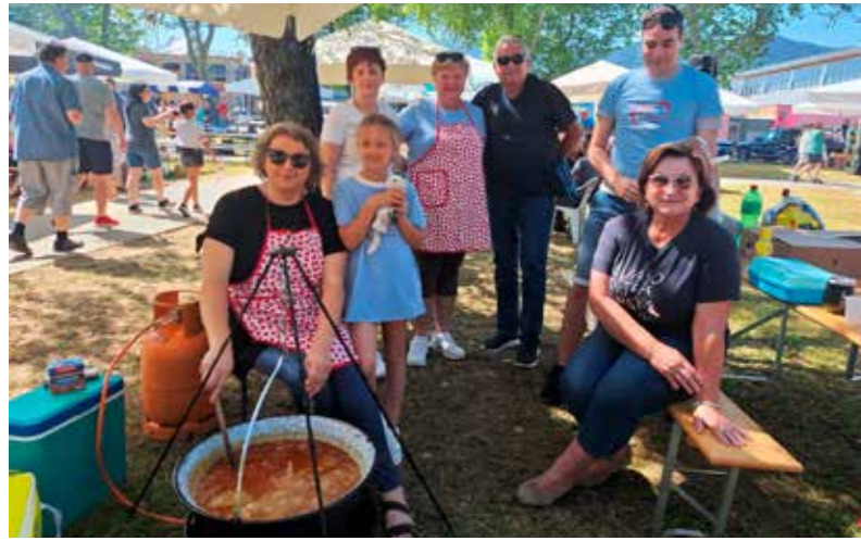
Opušteno uz kotlić Udruge udomitelja "Nada" Ivanec