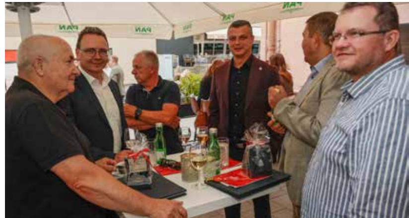
Druženje sa suradnicima i prijateljima