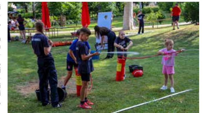
Dječje vatrogasne igre