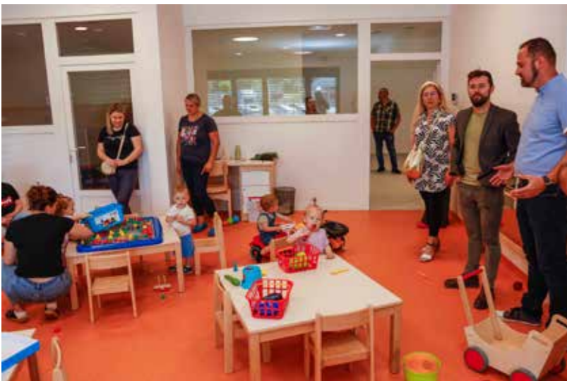
U obilasku; sve je baš kako treba biti!