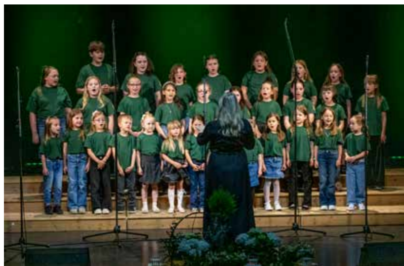
Festival je pjesmom otvorio dječji zbor

U programu su nastupili zborovi iz Zadra, Konjščine, Šenkovca, Varaždina i Ivanca