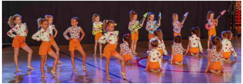
Razigrani dječji ples