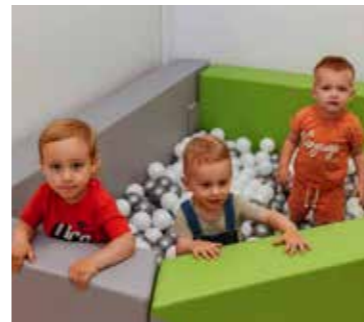
O, pa nitko nije rekao da će biti baš tako „kul“!

datne vrtićke skupine od 16-ero djece i ona će s radom početi čim od nadležnih tijela stignu sve dozvole i rješenja. A to znači da će tada vrtić u Radovanu zbrinjavati ukupno 84-ero djece.