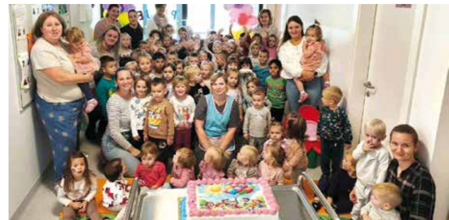
Uživali su i mališani Dječjeg vrtića u Radovanu