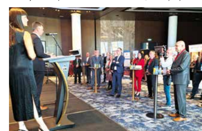
Prijam dobrodošlice u Kristalnoj dvorani Grand Hotela Plaza

Riječ je o specijaliziranim stručnjacima, koji s pažnjom prate doprinos razvoju poduzetništva ne samo velikih i gradova s velikim fiskalnim kapacitetom, već i mikro sredina poput Ivanca, koje već niz godina ulažu izvanerske napore u gradnju business friendly okruženja.