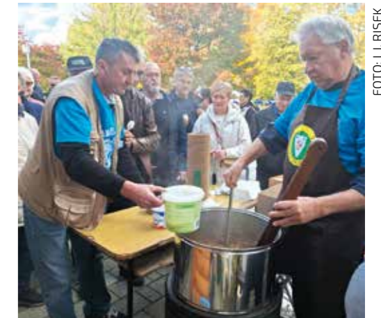
Gužva kod kotlića od mesa i 30-ak vrsta gljiva Gljivarskog društva Ivanec

JESEN U IVANCU Sjajna atmosfera i masovan odziv na veliko jesensko druženje generacija Ivančana i njihovih gostiju