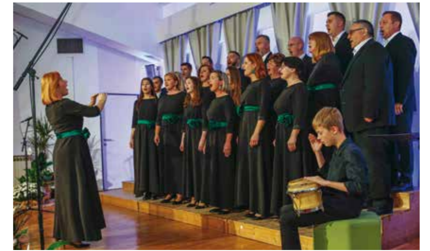
Ivanečki zbor ponovno u samom državnom vrhu zbornog pjevanja