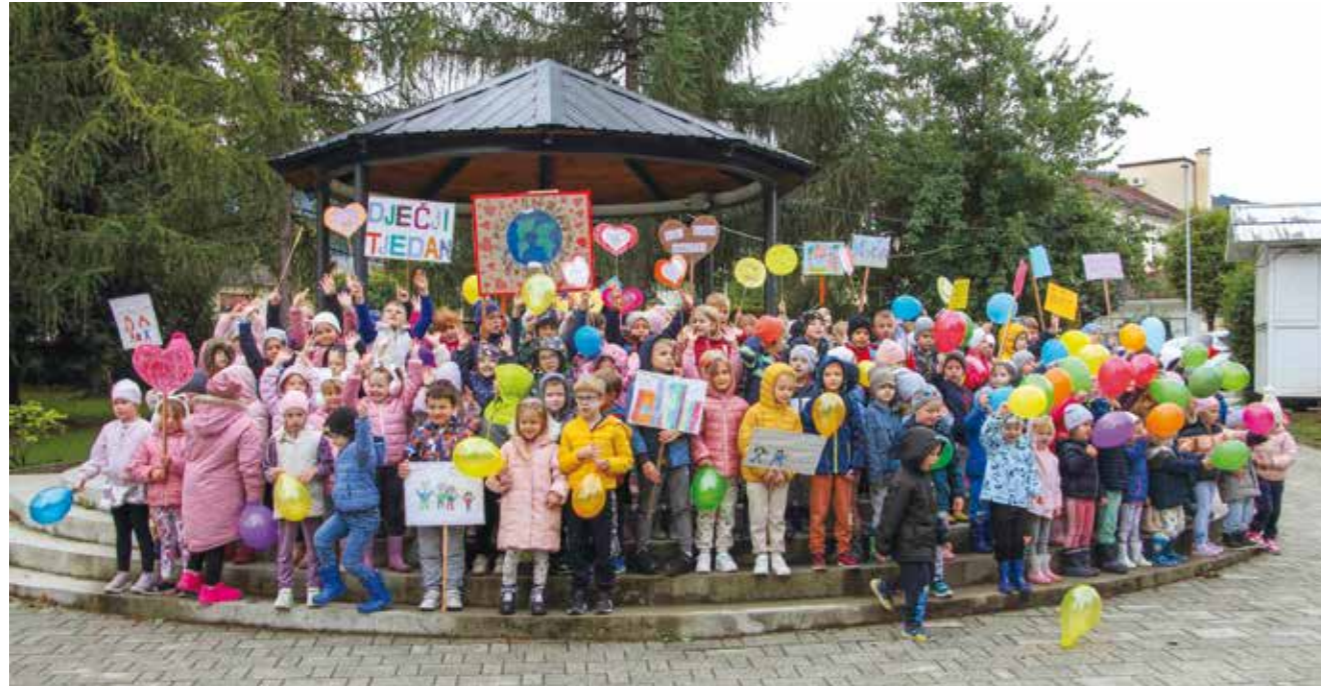
Na pikniku ivanečkih mališana u gradskom parku

Brojne zabavne i poučne aktivnosti za svoje polaznike su tijekom Dječjeg tjedna priredili i vrtići sami te ga ispunili lutkarskim predstavama, radionicama, kestenijadom i nizom igara. Priređen je i piknik DV-a Ivančice u gradskom parku, gdje je u nogometu, natjecanjima na zabavnim poligonima te u plesu i pjesmi uživalo 120 klinaca i klinceza iz Laviča, Bubamara, Jabučica, Žireka, Zmajica, Iskrice i Ribica. Maleni, sretno vam djetinjstvo! (aj, ljr)