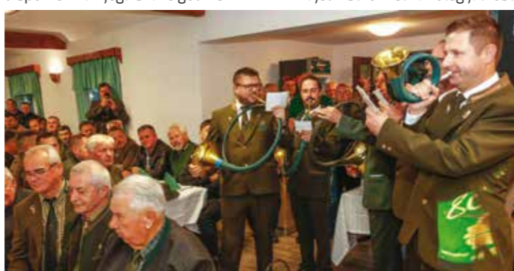
U skladu s prilikom – nastup lovačkih rogista

GLJIVARSKO DRUŠTVO IVANEC Održana jubilarna 10. međunarodna gljivarijada