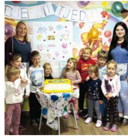
Torta i za malene Svijeta mašte u I. Vrhovcu