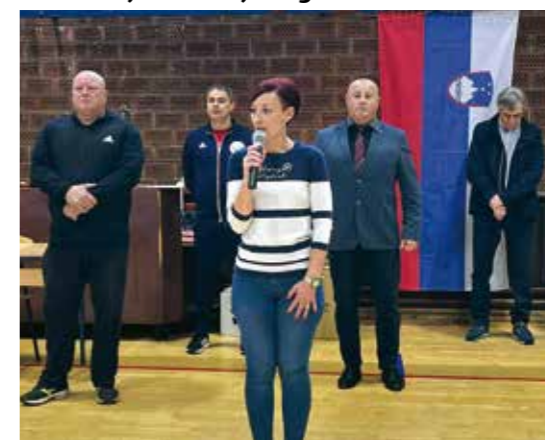
Turnir je otvorila izaslanica gradonačelnika D. Cerovčec