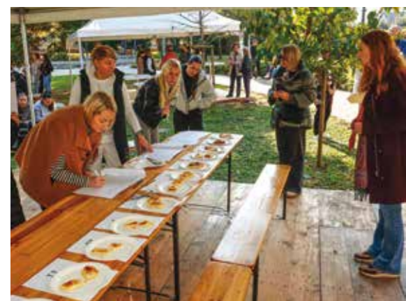
I srednjoškolci su imali svoje natjecanje u pripremi najboljih štruklji