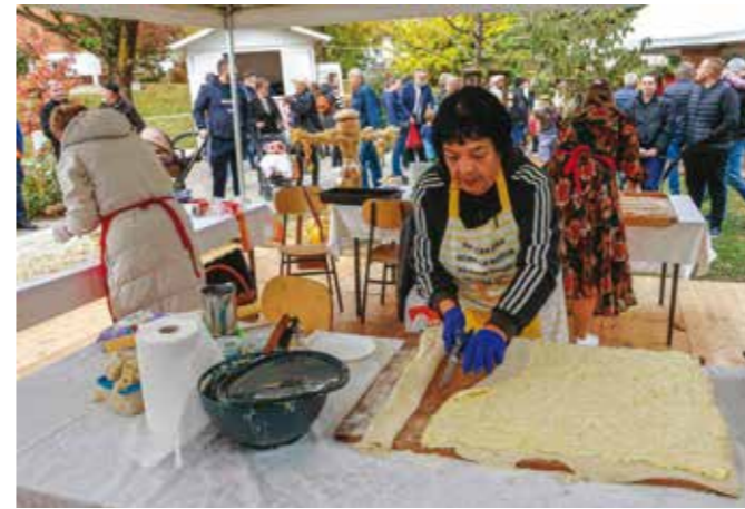
Štruklji po receptu Biserke Anđel; tajna – u kosanoj masti