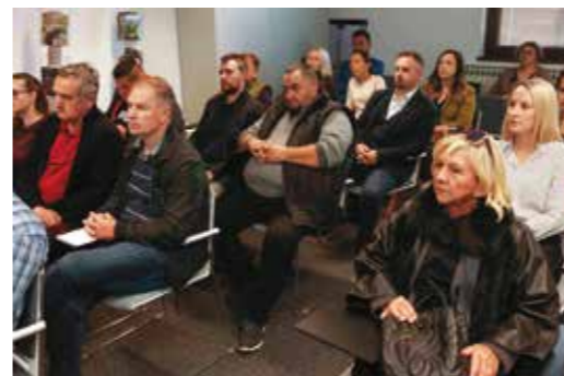
Poduzetnici na predstavljanju Provedbenog plana Grada Ivanca

SVJETSKI KONGRES PODUZETNIKA Gradonačelnik M. Batinić govorio na prijemu dobrodošlice (Ljubljana/R. Slatina 14.-18. X.)