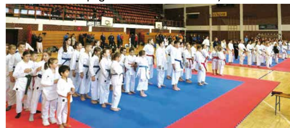
S otvaranja Memorijalnog turnira u Ivancu