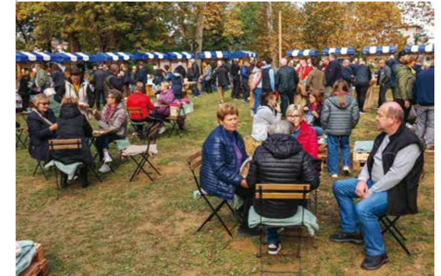
Odlično raspoloženje u prepunom gradskom parku