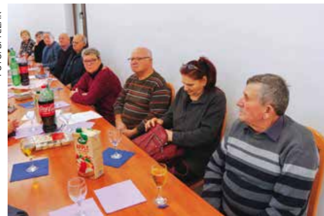
Poziv Grada: Podnesite zahtjev za božićnicu, a ako još niste, i za jednokratnu novčanu potporu za 2025.

POZIV Grada Ivanca umirovljenicima i socijalno ugroženim skupinama