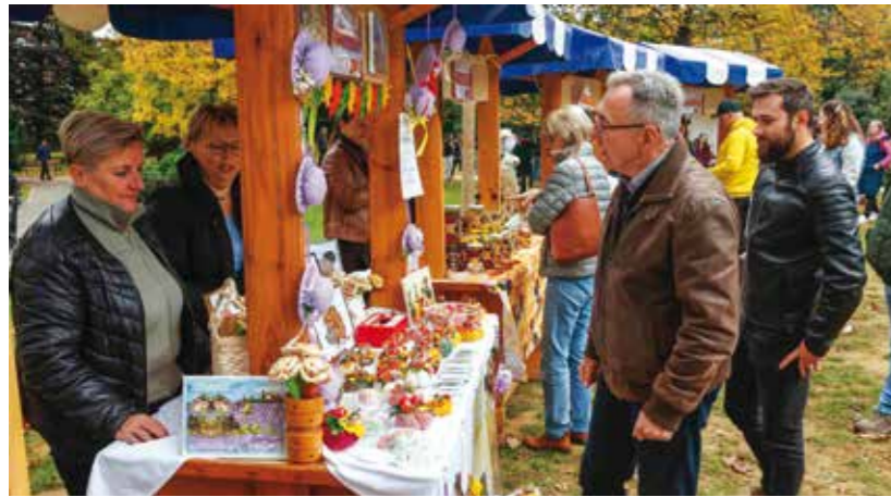
Gradski čelnici u obilasku izložbenih štandova