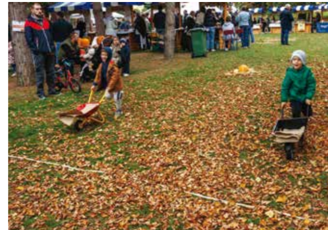
Vrtičke jesenske dječje igre – Tikva v tačku