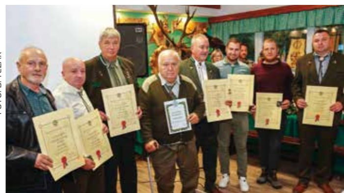
Priznanja Hrvatskog lovačkog saveza najzaslužnijim lovcima

Sve okupljene pozdravio je predsjednik Hrvatskog gljivarsko-mikološkog saveza Branko Bartolić te istaknuo kako je Ivanečka gljivarijada jedna od najposjećenijih i najbolje organiziranih, i to ne samo u Hrvatskoj nego i šire. -Ponosni smo što smo ove godine prikazali tako puno razli-