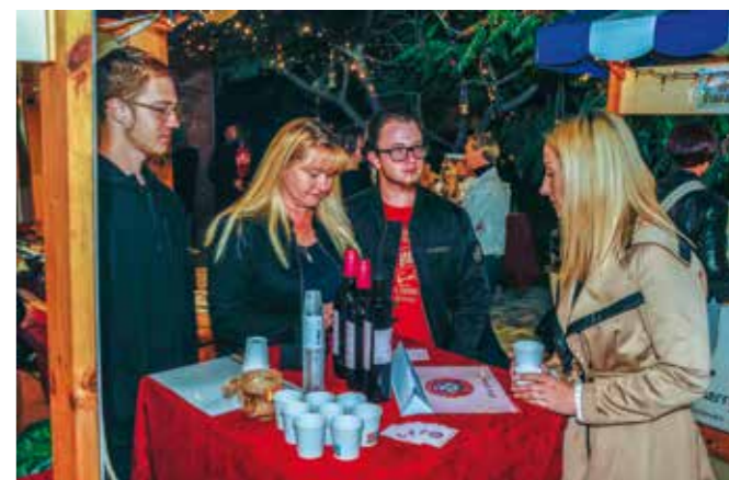
U turističku priču uključeni i domaći proizvođači prirodnih likera i sokova