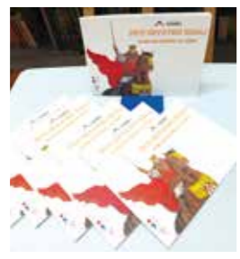
Antistres bojanke na temu kralja Tomislava djeca su kreirala sama

U sedam radionica uključilo se više od 130-ero djece