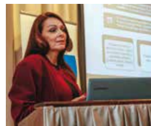
Ravnateljica Srednje škole L. Kozina

Edukacija je održana u sklopu EU projekta „Poboljšanje kvalitete usluga poduzetničkih potpornih institucija s naglaskom na kompetencije iz područja istraživanja i razvoja, digitalizacije i primjene zelenih principa poslovanja uključujući jačanje kapaciteta članova uspostavljene mreže – BOND 3“. Nositelj projekta je HAMAG – BICRO, dok je Poslovna zona zadužena za provedbu edukacija, informiranja i savjetovanja poduzetnika na svom području.