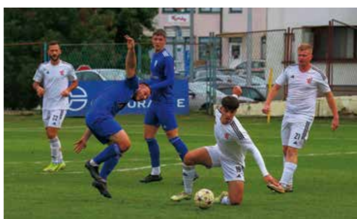
Utakmicu s Poletom Ivančica je neočekivano izgubila s 2:0

Vodeća momčad lige je Medimurje iz Čakovca sa 6 bodova, dok se Ivančica trenutačno nalazi na šestom mjestu sa 4 boda.(nn)