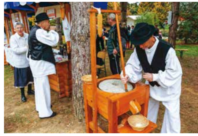
Stari običaji kod štanda Društva Maska Ivanec