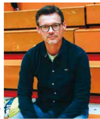
Poraz Ivančice od Virke iz Virovitice