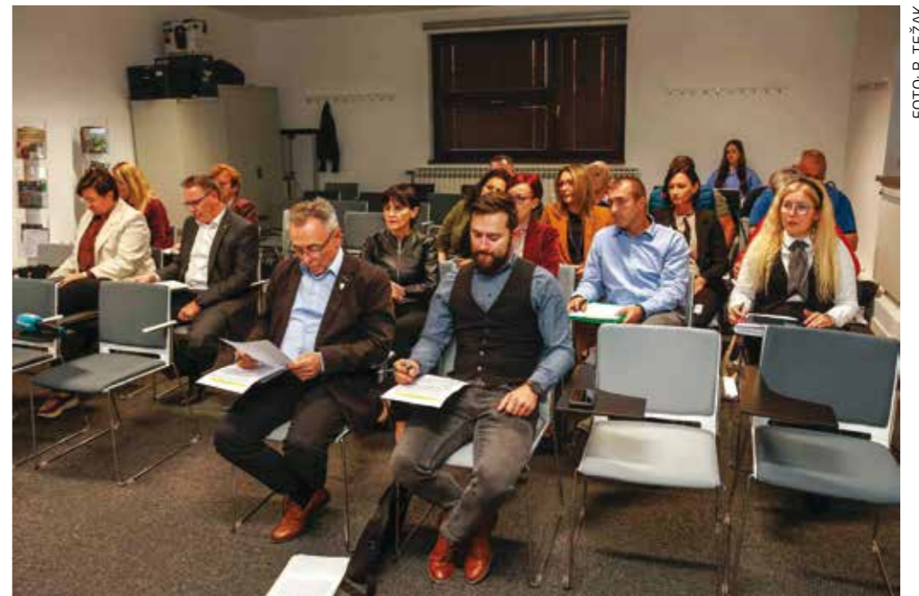
Gradsko vijeće jednoglasno je donijelo novi Prostorni plan Grada Ivanca

bi mogli urediti još 20-25 parkirnih mjesta. Time ćemo se baviti kad gradnja doma bude pri kraju. Procjenu vrijednosti zemljišta već imamo, nije riječ o nekim dramatičnim troškovima, a puno će pridonijeti funkcionalnosti doma.