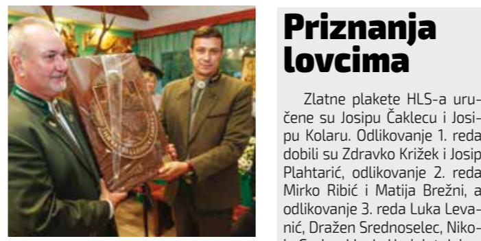
Priznanje Hrvatskog lovačkog saveza LD-u Jelen Ivanec