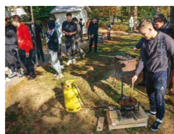
Tko može odoljeti vrućim kestenima?