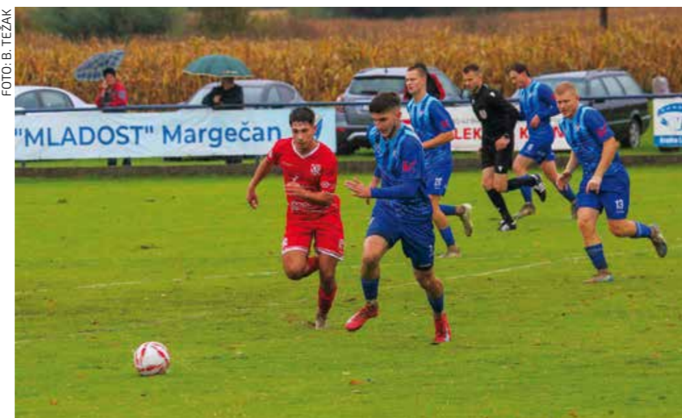
Poraz od Beletinca, unatoč početnom vodstvu od 3:0

u 36. minuti. Strijelci za Mladost bili su Domagoj Šantek, Valentino Bečeheli i M. Kovačić. Mladost je u 8. kolu s Ivančicom Ivanec odigrala 0:0, a u 7. kolu je poražena od Poleta Tuhovec s 2:4. U 6. kolu Mladost je s Nedeljancem odigrala 1:1, a strijelac je bio Bečeheli. Vodeća momčad lige je Polet iz Tuhovca s 25 bodova, a Mladost je šesta, s 14 bodova.(nn)