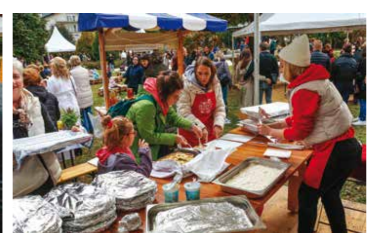
Pune ruke posla sa štrukljima, treba to izdržati!