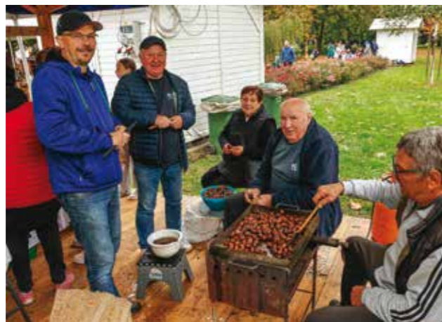
Prometno kod pečenih kestena KUD-a Salinovec i Skrajskih pajdaša