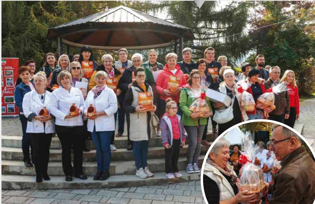
JESEN U IVANCU Sjajna atmosfera i masovan odziv velikoj manifestaciji u gradskom parku