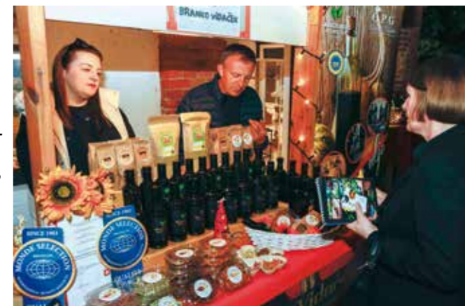
Na terasi Centra „Kukuljević“ predstavljena i bogata ponuda OPG-ova