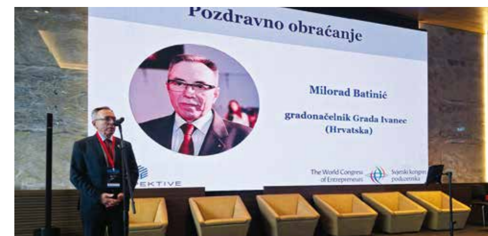
Pozdravno obraćanje - znak velikog ugleda koji i Batinić i Grad Ivanec uživaju u upućenim poslovnim krugovima

SVJETSKI KONGRES PODUZETNIKA Gradonačelnik M. Batinić govorio na prijemu dobrodošlice (Ljubljana/R. Slatina 14.-18. X.)