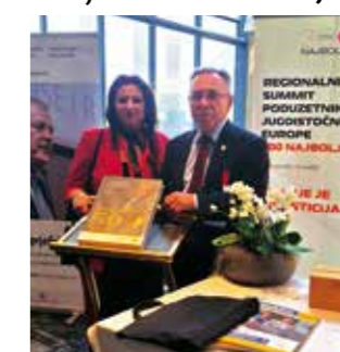
I Grad Ivanec u Monografiji „500 najzaslužnijih za razvoj poduzetništva u Srednjoj i JI Europi“

brovniku dodijeljeno još jedno, novo priznanje za posvećenost razvoju poduzetništva.