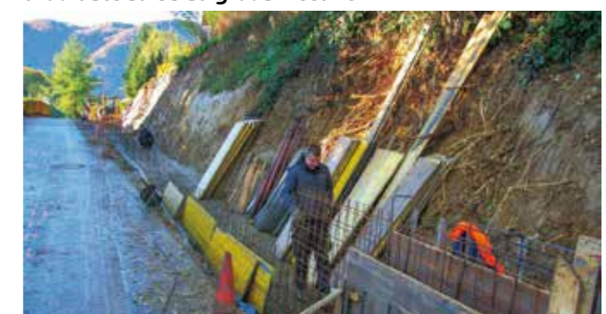
Sanacija klizišta u Ivanuševcu, koje je ugrozilo sigurnost prometa i privatnu kuću

GRADSKÉ CESTE Modernizacija cesta iz programa za 2025.