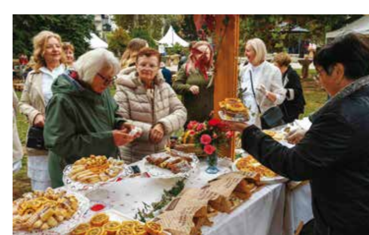
Kod štanda Udruge umirovljenika Margečan sa specijalitetima