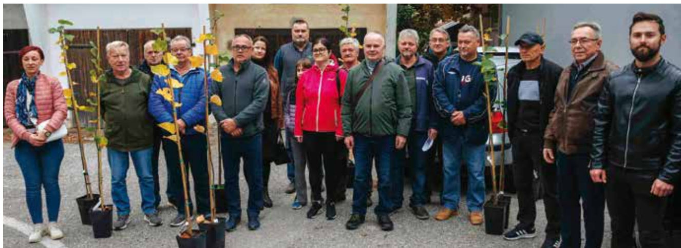
Pedeset mladih lipa darovano je članovima Pčelarske udruge „Ivanščica“ Ivanec

IVANEČKA LIPA U cilju očuvanja najstarije ivanečke prirodne dragocjenosti