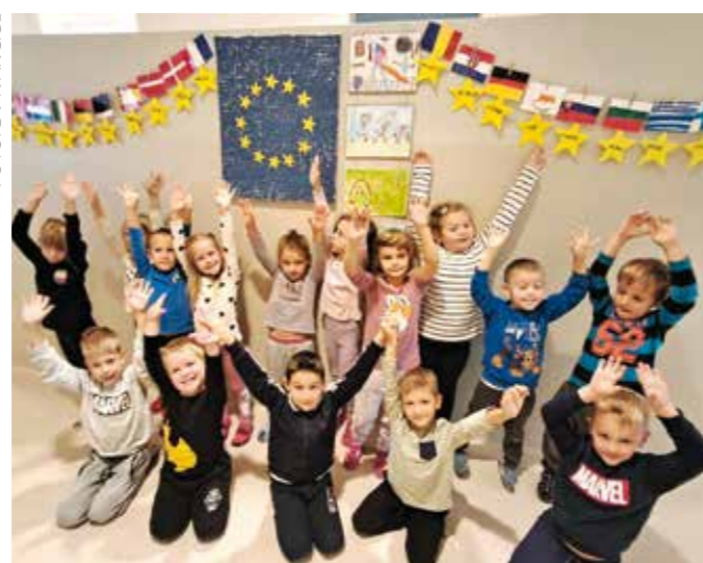
Mališani u Radovanu crtali zastave zemalja EU

Ivanec uspješno proveo prošle šk. godine, kada je ujedno djeci - polaznicima radionica financirao sudjelovanje. Nastavak projekta planiran je i ove godine u ponedjeljku, odnosno izmijenjenoj formi, odnosno kroz kampove tijekom zimskih i ljetnih praznika.