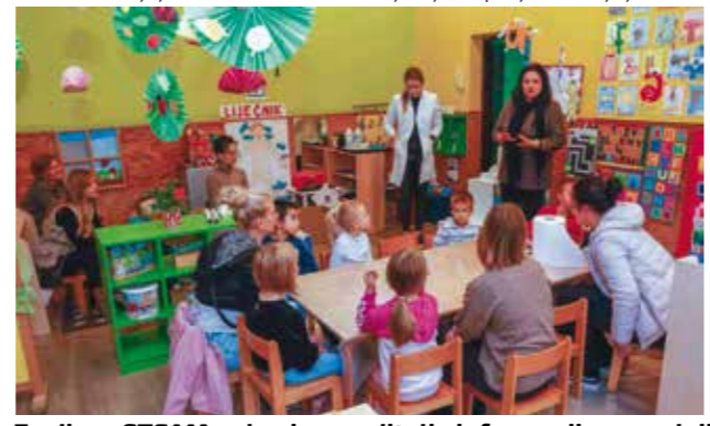
Za djecu STEAM pokusi, za roditelje informacija o gradnji i dogradnji vrtića u Ivanču i Radovanu iz EU fondova

Ivanec uspješno proveo prošle šk. godine, kada je ujedno djeci - polaznicima radionica financirao sudjelovanje. Nastavak projekta planiran je i ove godine u ponedjeljku, odnosno izmijenjenoj formi, odnosno kroz kampove tijekom zimskih i ljetnih praznika.