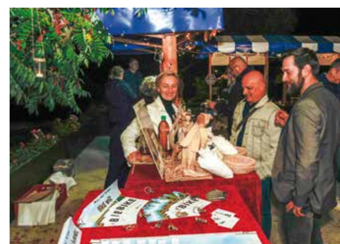
Od brašna z Friščićevo melina do najma električnih bicikla