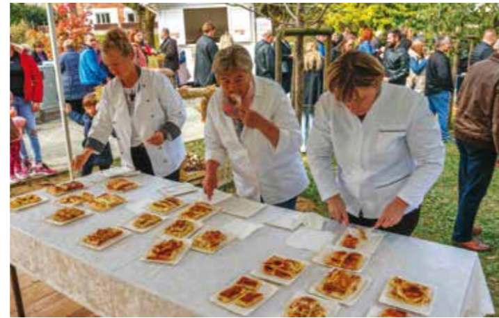
Svi su fini! Pa sad ti procijeni koji su najbolji!