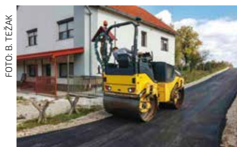
Asfaltiranje nerazvrstane ceste u Horvatskom

♦♦ Zbog potrebe hitne sanacije naknadno je ugovorena modernizacija prometnica u Gačicama, Ivancu, Lovrečanu i Ivanečkom Naselju