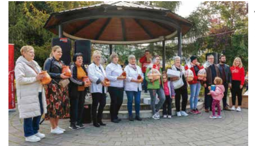
Najbolje štrukelj-majstorice s prosudbenim povjerenstvom i predstavnicima Grada i TZ

Hvala svim sudionicima i natjecateljicama te organizacijskom timu Grada i Turističke zajednice sa suradnicima, koji se pobrinuo da manifestacija prođe uz puno dobrih emocija i odlično druženje uz glazbu Faringaša iz Prigorca (Ij)