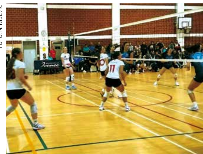
Promjenljiva igra ŽOK-a u novoj prvenstvenoj sezoni