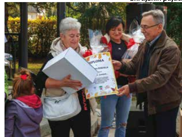
Nagrade najboljim majstoricama zagorskih štruklji