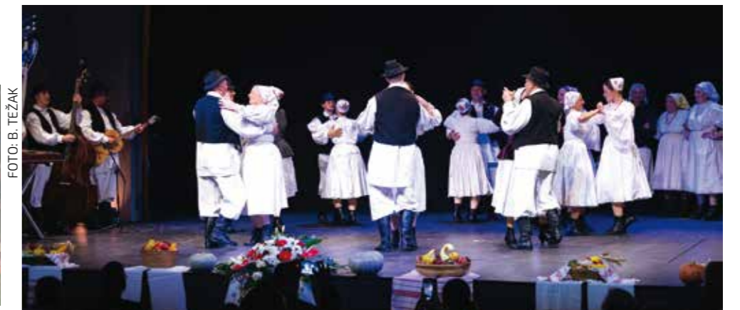
KUD Salinovec na državnoj je smotri nastupio već sedmi put!

KUD-u Salinovec ovo je bio već sedmi (!) nastup na državnoj smotri u kategoriji izvornog folklor (i treći put zaredom), što naše folkloriške svrstava u sam vrh nacionalnog stvaralaštva. (ljr)