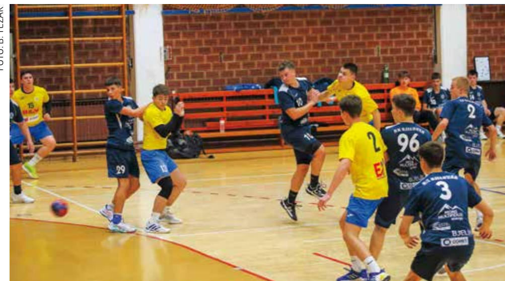
Uvjerljiva pobjeda Ivančice nad Bjelovarom