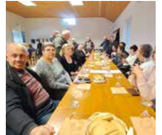
POZIV GRADA IVANCA