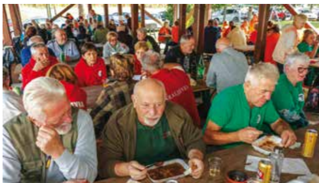
Rekordan odaziv gljivara iz Slovenije, Srbije i Hrvatske

Gljivarsko društvo Ivanec na Gljivarijadi kod Ribičkog doma