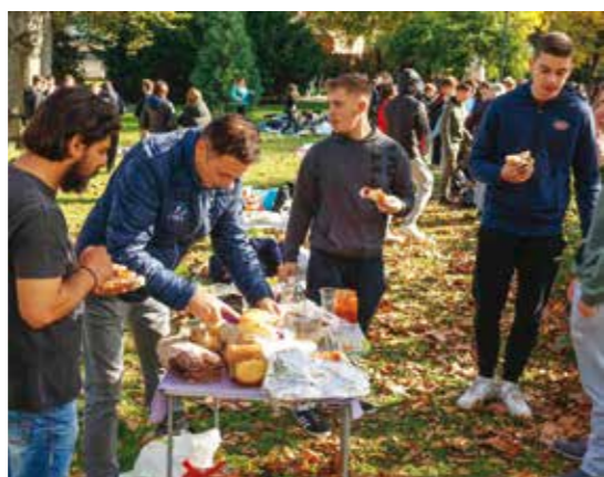
Sve bolje prija na svježem zraku!