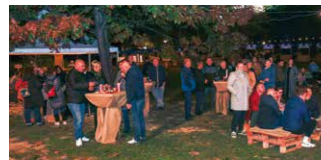
Publika se zabavljala uz hitove uz koji su odrastale i starije i novije generacije

Jesenski ugođaj u gradskom parku, osim što je okupio velik broj ljubitelja novog vala, ugodno je iznenadio i same glazbenike. Ovacije i povici publike „Svirajte još!“ gostima iz Bjelovara bili su najbolja pozivnica za ponovni dolazak u Ivanec. (aj)