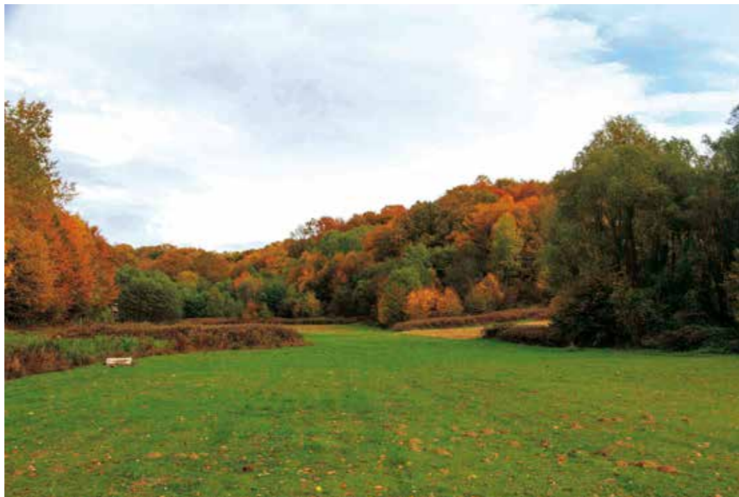
Glinište na 300 m od prvih kuća, u nedirnutoj šumi između četiriju naselja na području Grada Ivanca!?

♦♦ Resorno ministarstvo na nedirnutom šumskom prostoru između naselja Lukavec, Cerje Tužno, Osečka i Lovrečan daje dozvolu za početak istraživanja rezervi i kvalitete ciglarske gline