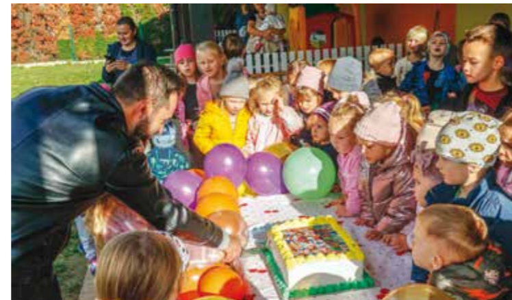
Veselo i u Dječjem vrtiću Bambi