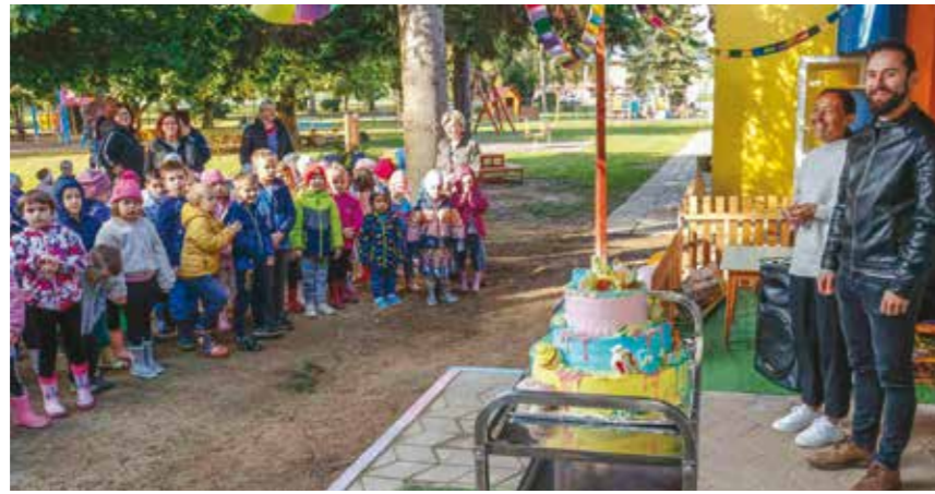
Dječji vrtić Ivančice: Stigla je torta!