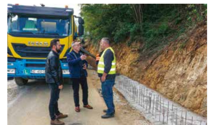
Gradilište su obišli gradski čelnici

Ovo klizište bilo je jedno od njih 15-ak, koja su se prije 2,5 godine aktivirala na širem gradskom području. Dio ih je saniran tijekom proteklih godina, dok su ove godine radovi završeni na gradskoj cesti na području Babinih gorica u Prigorcu te u Radničkoj ulici u Radovanu. U pripremi je i početak radova u Škriļjevcu.