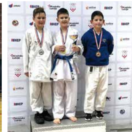
Medalje za ivanečke karataše na Državnom prvenstvu