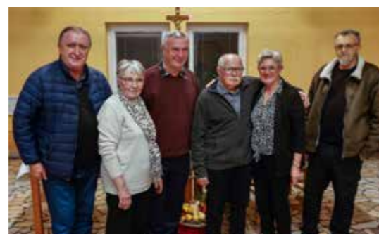
Bilo ih je puno više, ovo su tek neki od osnivača Društva Maska