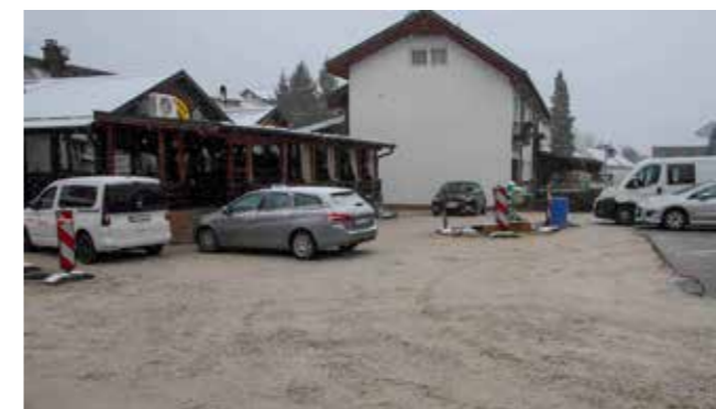
Uređenje javnog parkirališta i nerazvrstane ceste u Malezovoj