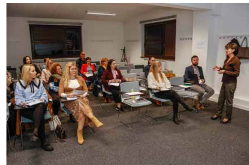
Na koordinacijskom sastanku s predstavnicima ivanečkih udruga i ustanova