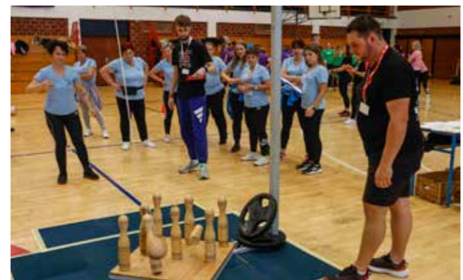
Natjecanja i na visećoj kuglani