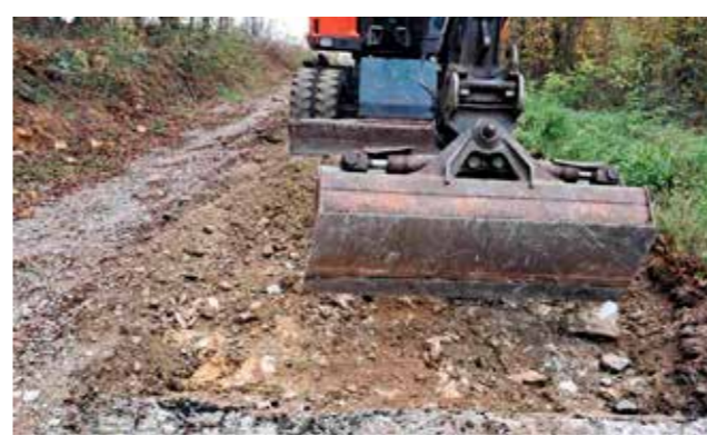
Skida se stari, dotrajali sloj, stiže novi asfalt na 2,5 km ceste

Unatoč tomu što sredstva za to nisu bila osigurana u proračunu, Grad Ivanec našao je način da isfinancira potrebne radove i sam riješi cijelu cestu, najprije proširenje, a sada i asfaltiranje, a sve u cilju povećanja sigurnosti svih sudionika u prometu.