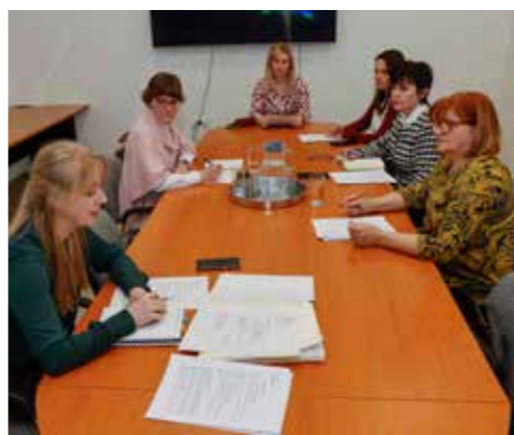
Sa sastanka Upravnog odbora zaklade Grada Ivanca

Članice Zaklade na sastanku su obaviještene i o tome da je Grad Ivanec našao rješenje za rješavanje stambenog pitanja za jednu obitelj i samca, koji sada žive u izuzetno teškim stambenim uvjetima. Riječ je o slučajevima s kojima je Zaklada već otprije upoznata, a pri kojima je uključivanje Grada bilo neophodno, budući da Zaklada nema dovoljno sredstava da bi sama mogla rješavati takve kompleksne slučajeve.