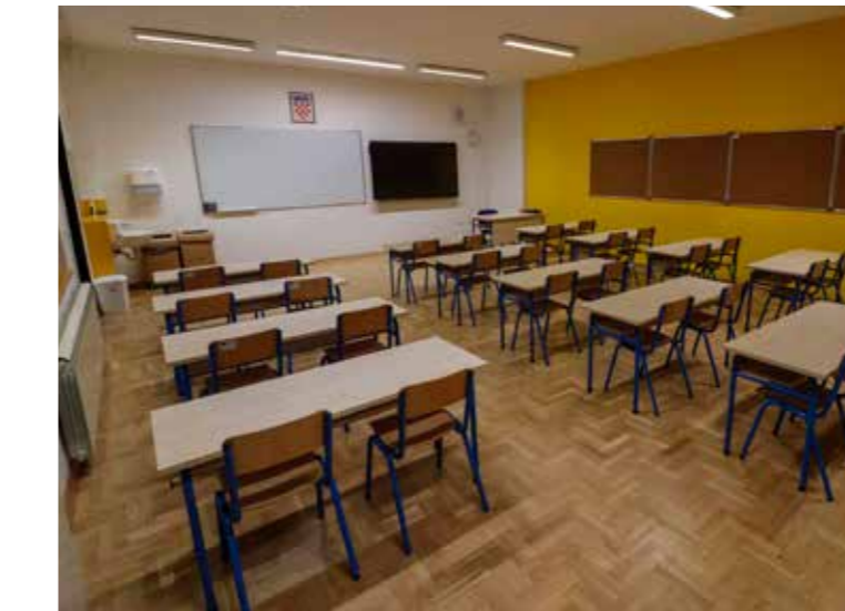
Moderne učionice za školu 21. st.