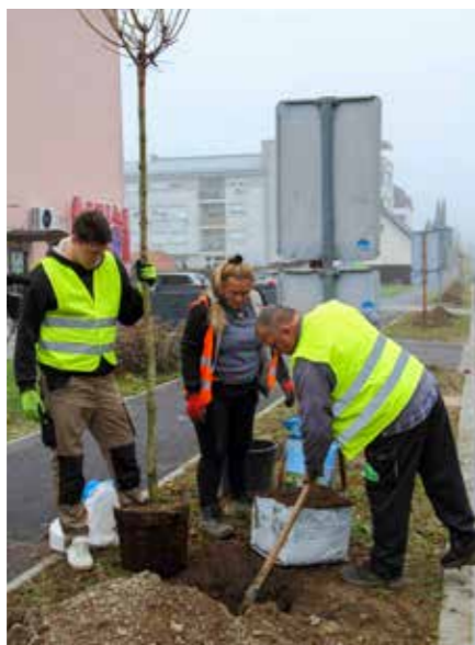
Sadnja je povjerena Hrvatskom šumarskom institutu iz Jastrebarskog

Još deset javora zasaden je pokraj nogostupa kod novog parkirališta u Gajevoj ulici, nasuprot košarkaškog igrališta kod Srednje škole. Ovi javori nabavljeni su iz novčane donacije koju je Turistička zajednica Grada Ivanca povukla u sklopu projekta „Hrvatska prirodno tvoja – Croatia Naturally Yours“, koji provodi u suradnji s Ministarstvom turizma i sporta i HTZ-om. Glavni cilj projekta je sadnja stabala diljem turističkih destinacija, čime se doprinosi očuvanju okoliša i promociji održivog turizma.(lir)