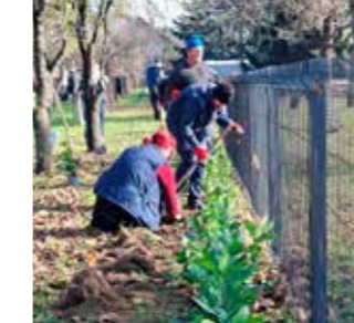
Lovor višnja uz ogradu Pesek parka