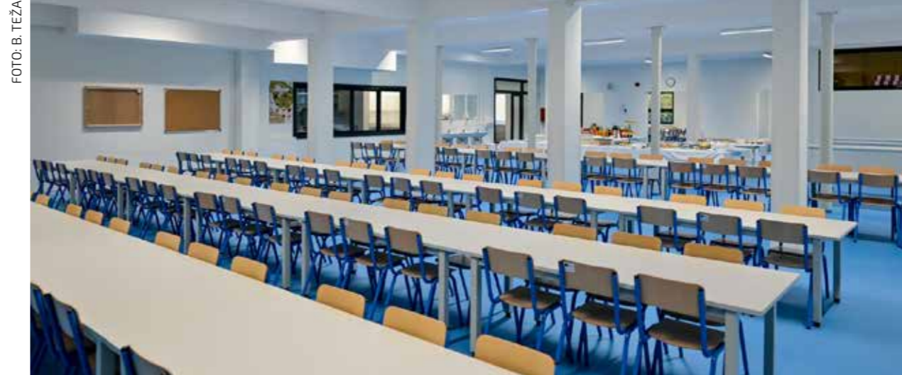
Blagovaonički prostor triput je veću u odnosu na prije