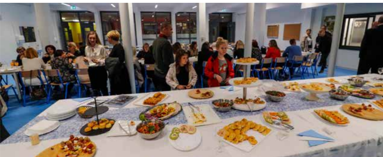
Druženje malih i velikih u novom blagovaoničkom prostoru OŠ I. Kukuljevića Sakcinskog

-Dogradnja škole će omogućiti produženi boravak, a u budućnosti i cjelodnevni boravak, što će omogućiti učenicima da kvalitetnije koriste slobodno vrijeme nakon što završe obvezni dio. Bit će gužva kada djeca dolaze u školu jer dio roditelja ih dovozi u automobilima i zato Grad već priprema rješenja za proširenje i povećanje parkirnog prostora i uređenja komunalne infrastrukture – poručio je Batinić.