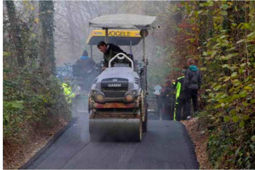
Asfaltiranje u Bedencu