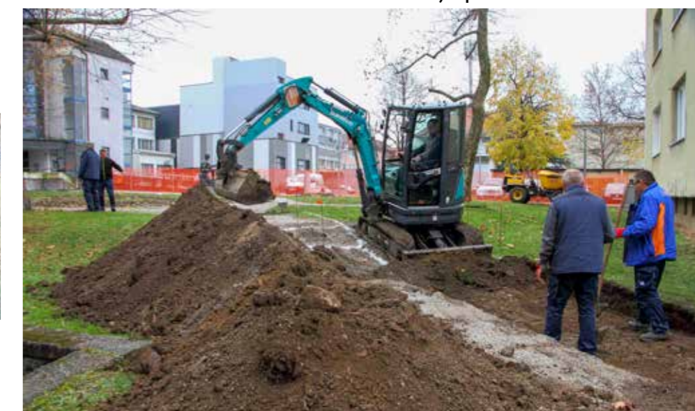
Stare staze se iz temelja rekonstruiraju

PARKOVNE POVRŠINE Rekonstrukcija parka u Ul. Đ. Arnolda