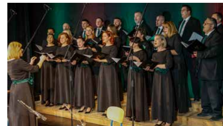
Nastup zbora KUD-a R. Rajter, najboljeg hrvatsko zbora