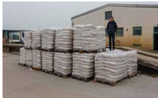
Za posipavanje nabavljeno 150 t rize i 50 t soli

Čišćenje i posipavanje prometnica odvijat će se u skladu s Planom zimске službe, prema definiranim stupnjevima prioriteta. Režim zimске službe traje do 15. travnja iduće godine. (Ijr)