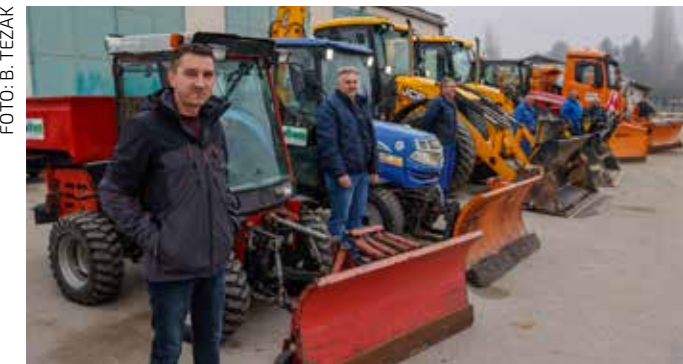
U srijedu, 12. studenog, u krugu Ivkoma d.d. „postrojena“ kompletna zimsku službu

STIGLA JE ZIMA Ivkom d.d. obavio sve pripreme za zimsku službu 2025./2026.