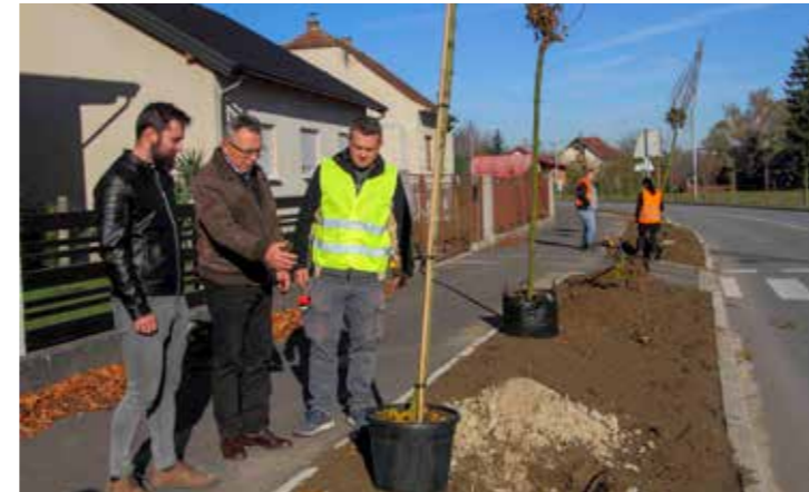
Gradski čelnici u obilasku radova na sadnji novog drvoređa

Sadnjom drvoređa od ukupno 85 ivanečkih lipa Grad na najbolji način čuva originalni genetski materijal najstarijeg živućeg „stanovnika“ Ivanca (koji „pamti“ dolazak vitezova Ivanovaca na naše prostore) te ujedno, jednog dana kada lipe porastu, osigurava međnu pašu za sve ugroženije pčelinje zajednice.(lir)