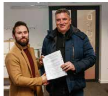
Ugovor za poticanje energetske učinkovitosti obiteljskih kuća