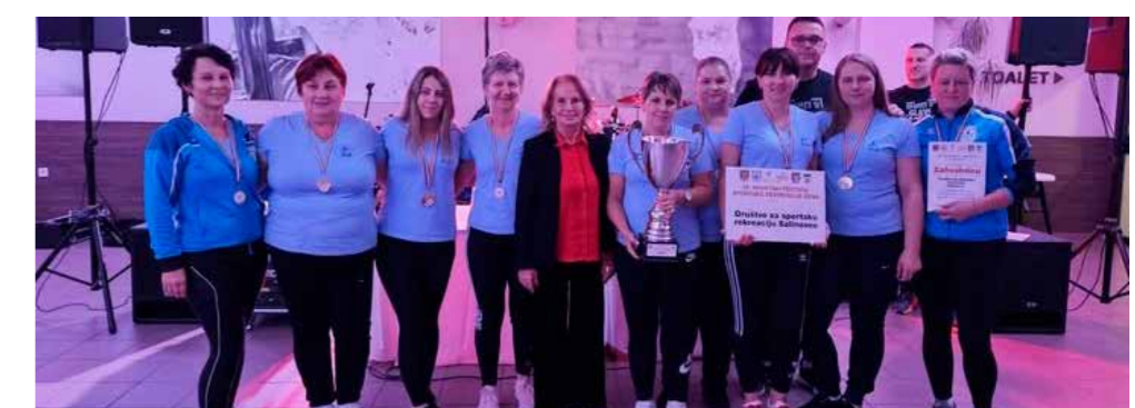
Ekipa DSR-a Salinovec pobjednica državnog festivala

istaknuo je da je UŠR Stažnjevec najnagrađivanija ivanečka udruga u sportskoj rekreaciji te da je Grad Ivanec iznimno ponosan na domaćinstvo ovoga festivala. Svim rekreativkama poželio je da se kući vrate s dobrim rezultatima i lijepim uspomena.