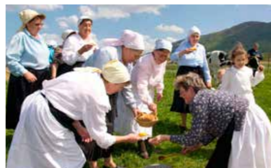
Pogled u prošlost: Jurjevo 2010.

MARTINJE Krštenje mošta u organizaciji Udruge vinogradara Skrajski pajdaši