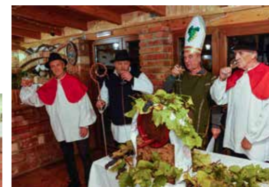
Daj Bog da se si skupa tak veseli i više pot najdemo!

objavljenom na zadnjoj stranici ovog izdanja Ivanečkih novina. Uz napomenu da su, zbog prostornih ograničenja, u programu pobrojane samo veće manifestacije, dok je integralni program Adventa u Planinarskom gradu dostupan na webu i FB Grada Ivanca. Dobro došli i sjajno se zabavite!