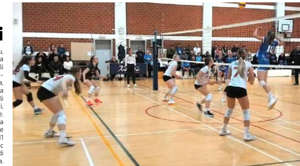
Seniorke u utakmici s gošćama iz OK Velika Gorica

Ivančanke su odlično otvorile utakmicu te prvi set dobile s 25:15, drugi s 25:21 i treći s 25:18. Utakmica je trajala samo 62 minute, a trener Nikola Grbić dao je priliku svim igračicama da iskoriste svoju minutažu i daju svoj udio u pobjedi. U utakmici 4. kola Ivanec 2 je u Varaždinu poražen od Cratisa 2 s 0:3. Vodeća ekipa 2. HOL Sjever je Kaštel iz Pribislavca, dok se ŽOK Ivanec 2 nalazi na šestom mjestu.(nn)