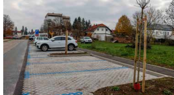
Novi drvoređ u Gajevoj ulici