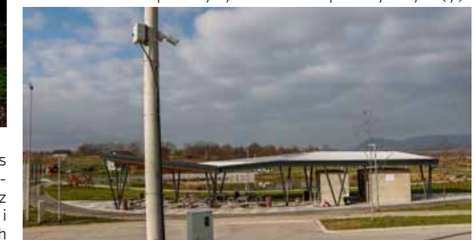
Red na RC-u Lančić nadziru četiri kamere

Da efekata od postavljanja kamera ima, pokazuje i podatak da više nema šteta na pojedinim javnim lokalitetima, koji su ranije bili česta meta življavanja vandala. Također, video nadzor olakšava rad i policiji kod prikupljanja dokaza i identifikacije počinitelja kaznenih i prekršajnih djela. (ljr)