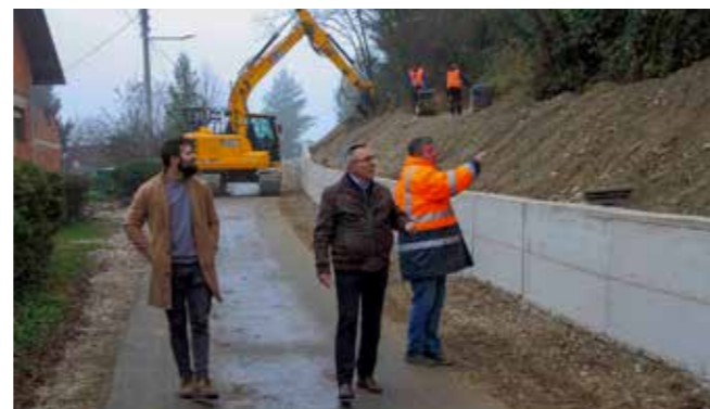
Gradsko vodstvo u obilasku završnih sanacijskih radova

Podsjećamo, ovo klizište se aktiviralo za vrijeme velikih kiša i poplava koje su Ivanec pogodile prije dvije godine, pri čemu su kolnik zatrpale velike količine odronjene zemlje te ugrozile promet, ali i sigurnost jedne obiteljske kuće.