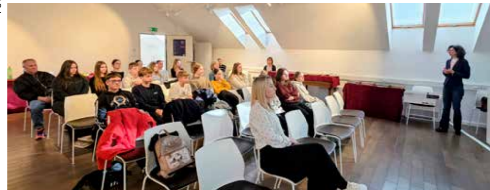
Predavanje o važnosti matičnih knjiga

Sudionici su kroz predavanje i praktične primjere saznali više o arhivskom vođenju župnih matrica, njihovoj povijesnoj vrijednosti te pravilnom korištenju u istraživačke i obrazovne svrhe. Ova edukacija bila je jedna u nizu aktivnosti koje učenici 8. razreda provode zajedno sa svojom učiteljicom u sklopu projekta, istražujući povijest svog grada i korijene zajednice. (mh,aš)