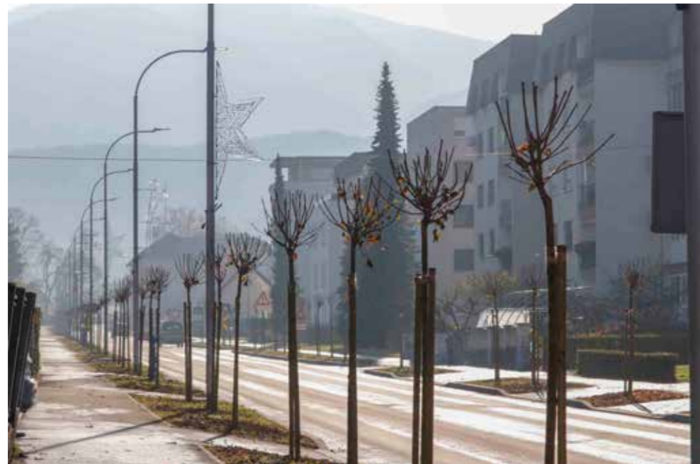
Drvoređ kuglastih javora – reprezentativni ukras Ivanca