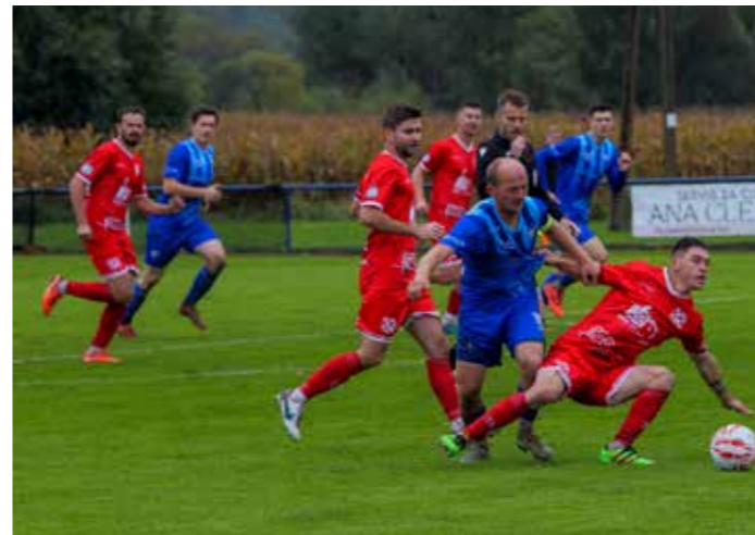
Pobjede Mladosti nad Poletom, Plitvicom i Budućnosti