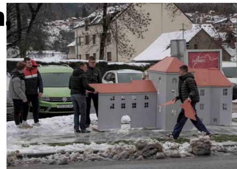
Početak blagdanskog ukrašavanja: Stari grad na gradskoj špići!

tinjskoj veselici leta Gospodnjega 2025., koju su Peharčeki priredili u petak, 8. studenog, u Šumskoj vili u ugodnom martinjskom