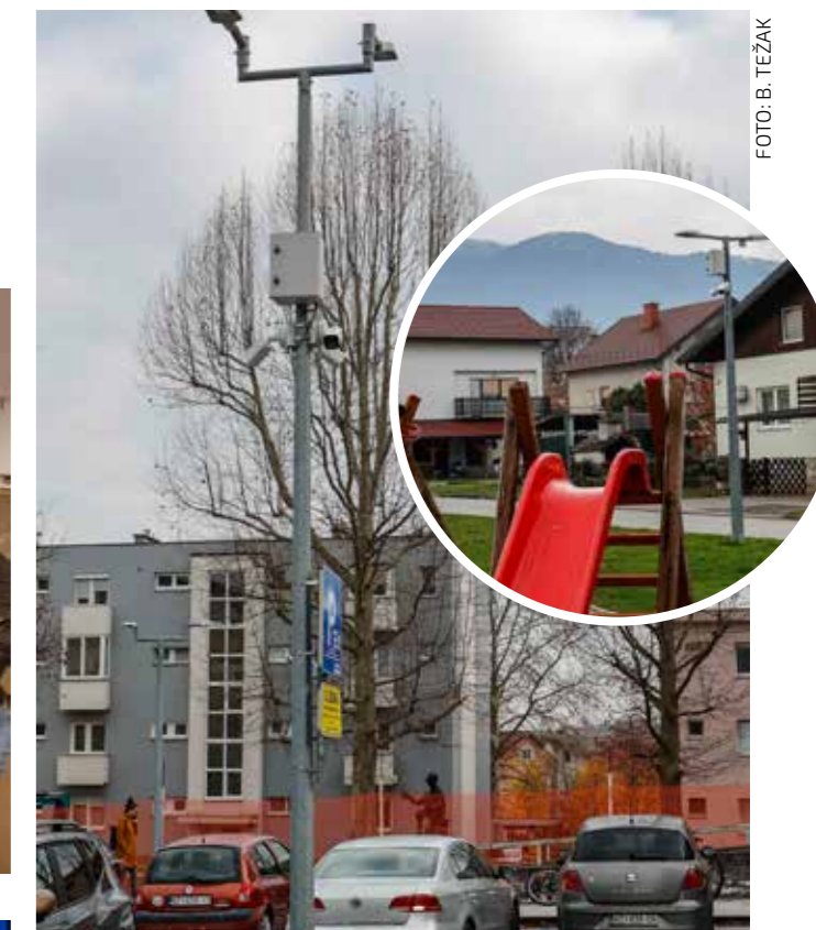
Video nadzor nad parkom i parkiralištem iza FINA-e u Ivancu

IVANEC U rad puštena treća faza sustava videonadzora Grada Ivanca