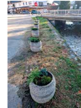
U žardinjere u Radićevoj trajno grmoliko bilje

Zelenom uređenju Ivanca ovime još nije kraj. Slijedi i rekonstrukcija Malog parka te zamjena cijelog sadašnjeg neadekvatnog drvoređa japanskih trešanja u Malezovoj ulici novim drvoređom.(lir)