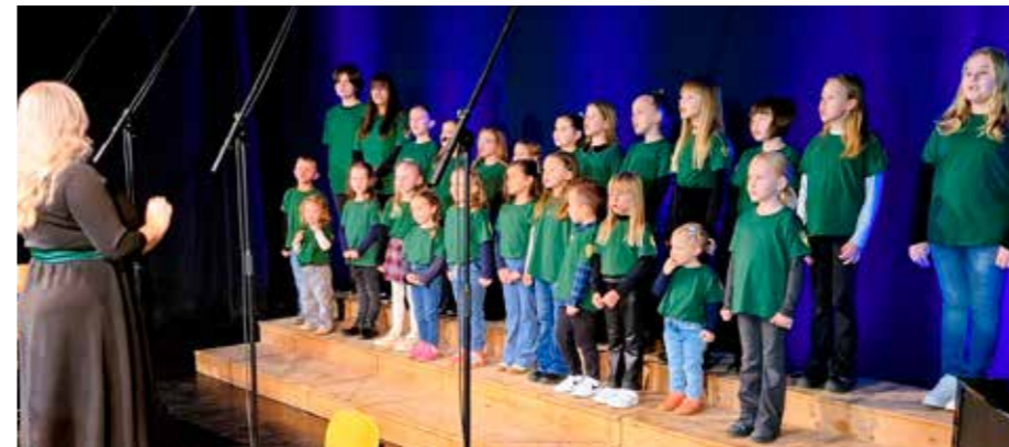
Ova dječica zlatnih glasova budućnost su ivanečkog zbornog pjevanja

PUTOPIŠNO PREDAVANJE U organizaciji Gradske knjižnice „Gustav Krklec“