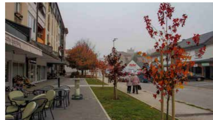
Drvoređ likvidambara i uređene terase ispred zgrada u Malezovoj