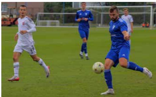
Ivančica šesta na prvenstvenoj tablici

Zbog snijega, momčad Ivančice nije odigrala utakmicu 14. kola Elitne ŽNL Varaždin u Cestici s Poletom pa će igrati naknadno. U utakmici 13. kola odigranoj u Ivancu pred oko 150 gledatelja, Ivančica je pobijedila Plitvicu Gojanec s 2:1. Iako je na terenu cijelo vrijeme dominirala domaća momčad, čije je napade uspješno branio gostujući vratar Šaravanja, Plitvica je povela u 31. minuti. Domaći trener Ivica Čikač izvršio je tri izmjene igrača, od kojih su dvojica postigli pogotke i to najprije Marget Piskač u 80. minuti za izjednačenje, a onda, u 87. minuti, i Darko Jagić koji je postigao euro pogodak s udaljenosti od oko 30 metara. U utakmici 12. kola Ivančica je u Vidovcu svladala Budućnost s 3:1. Prvi pogodak postigao je David Varga, a drugi da Silva Gon-