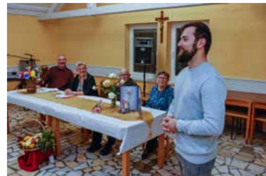
Najveće čestitke i poticaj za daljnji rad - od Grada Ivanca i zamjenika gradonačelnika M. Friščića

–Društvo je osnovano prvenstveno kako bi se organizirale maškare i povorke te izvodile razne huncutarije, no s vremenom je preraslo u mnogo više od toga. Ivanečke običaje i tradiciju širili smo diljem Hrvatske i izvan nje. Posebno se ponosimo 2000. godinom, kada smo na gradskoj špići okitili bor s 2000 jabuka božićnica, a reportaža o tome je putem