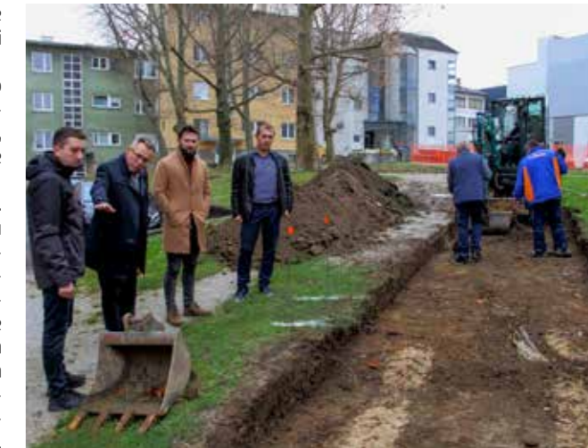
U obilasku početka radova u novome parku

hrvatske speleoarheologije, koji je uklonjen u oblikovanje prostora. Aktualnim rekonstruk-