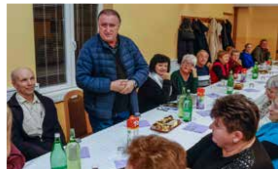
Pozdravne riječi i čestitke suradničkih udruga