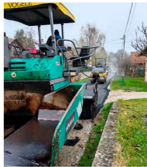
Asfaltirana i dionica u Lovrečanu