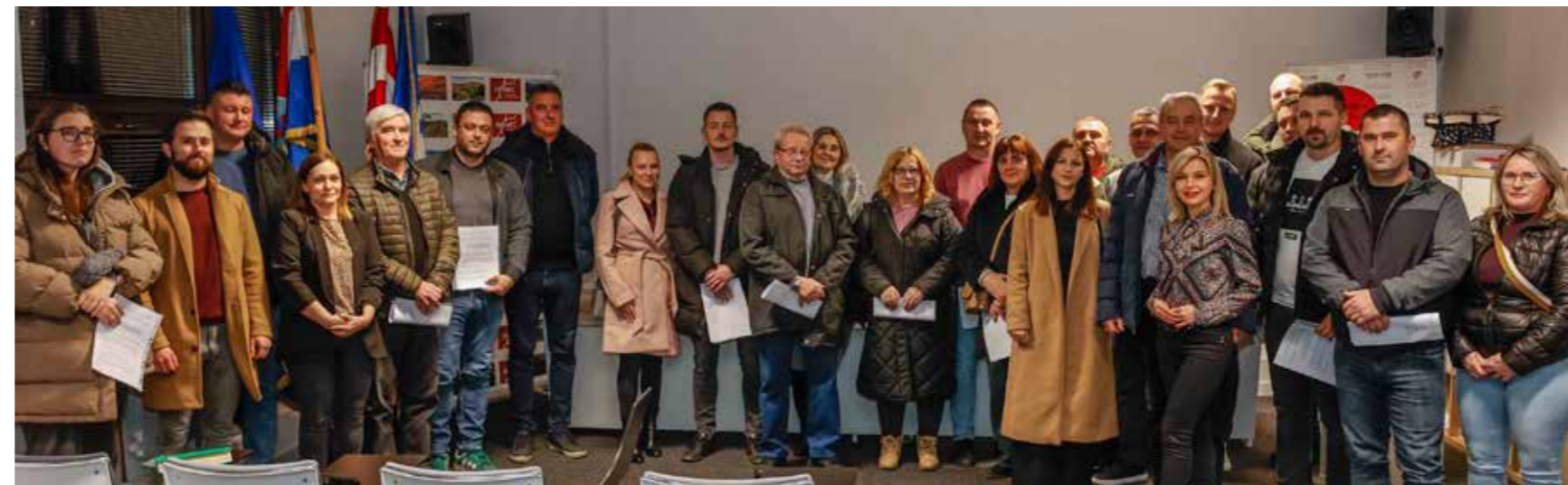
Korisnici gradskih poticaja za stambeno zbrinjavanje i energetske učinkovitost obiteljskih kuća

Osvrćući se na gradske potpore za podizanje energetske učinkovitosti obiteljskih kuća, koje su u ovom krugu odobrene 15-orici vlasnika, Friščić je istaknuo da najveći interes vlada za