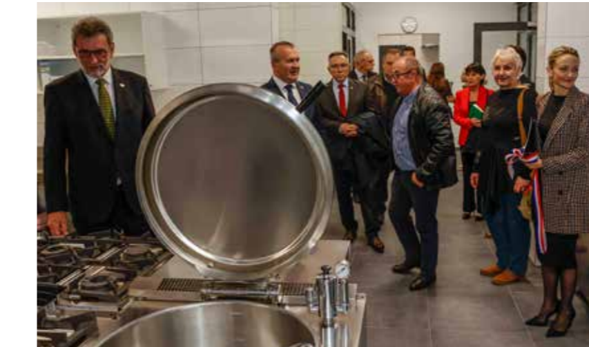
Suvremena školska kuhinja

Svečanosti je nazočio i ministar znanosti, obrazovanja i mladih Radovan Fuchs, koji je naglasio da je ivanečka škola