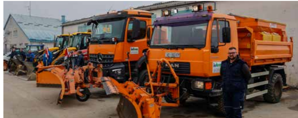
Moćne ralice spremne za čišćenje 190 km gradskih cesta i trgova