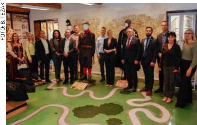
U obilasku Centra „Kukuljević“

MEĐUNARODNA SURADNJA Izaslanstvo Ptuja u prvom službenom posjetu Ivancu