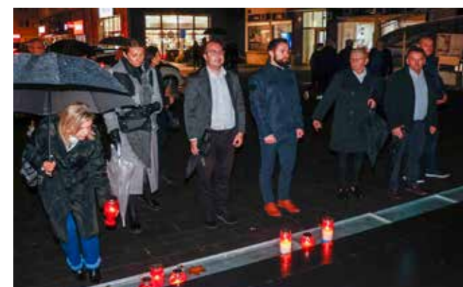
Počast poginulima odali su i predstavnici Grada Ivanca

Dan sjećanja obilježen je i u Margečanu, u organizaciji Udruge građana Margareta, DVD-a, LD-a Šumski zec, Udruge umirovljenika i NK Mladost. Sjećanje na sve poginule i nestale osvijetlilo je gotovo 500 lampaša koje su djeca i mještani zapalili po cijelom naselju. Posebno svečano bilo je kod spomenika obilježja poginulima, gdje je molitvu predvodio župnik vlč. Damir Tito Šmintić, a okupljanje je pjesmom uljepšao zbor župe sv. Margarete.