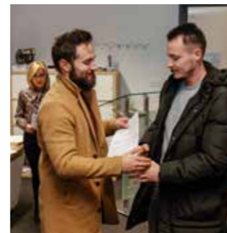
Šetno s rješavanjem stambenog pitanja!

fotonaponske sustave. Pozvao je sve korisnike da s pozicija energetske održivosti i dostatnosti proizvedu najmanje onoliko energije koliko im treba za zadovoljenje njihovih potreba te da im što prije počnu stizati manji računi za struju.