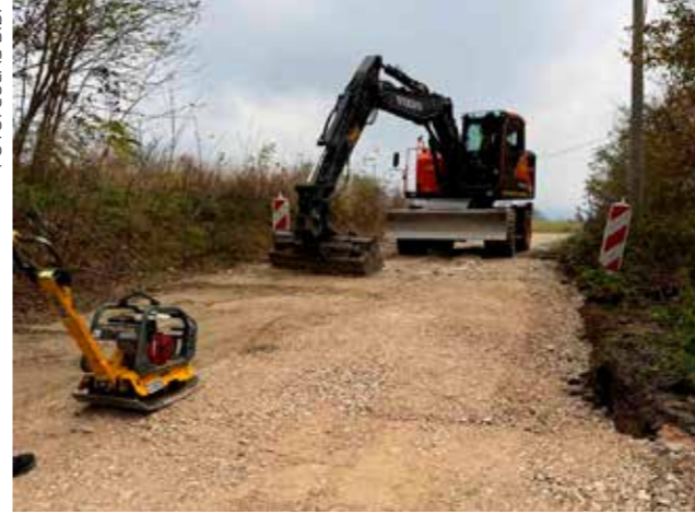
Počeli su radovi na pripremi za asfaltiranje

Sada kreću pripremi radovi, a onda i asfaltiranje ceste, s time da je ugovoreno presvlačenje asfaltom u punoj širini od najmanje 4,5 metra, na dionici dugoj cca 2,5 km. Radove izvođač Colas Hrvatska d.d. Varaždin, vrijednost radova iznosi 245.720 €, a financira ih Grad Ivanec.