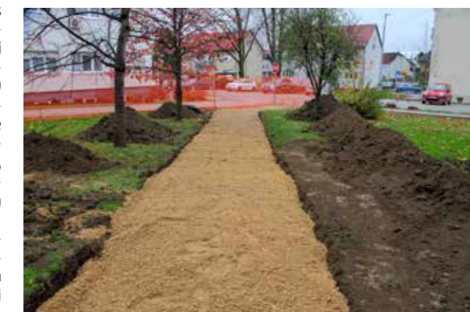
Nasipavanje i uređenje novih staza i prilaza zgradama

Podsjećamo, prije godinu dana u ovome parku otkriven je spomenik jednom od najznačajnijih ivančana, Mirku Malezu, geologu, paleontologu i pioniru