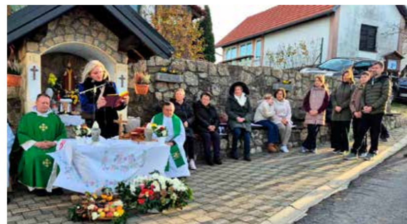
Misa kod kapelice sv. Martina na Šatornjaku

A to je i bio razlog što je nakon toga cijela veselica preseljena u novi Društveni centar Salinovec, gdje je i održana ceremonija krštenja mošta koju je predvodio vlč. Piskač. Ostajući vjeran dugogodišnjoj tradiciji, on je i ove godine zahvalio svim vinogradarima što ne posustaju u mucu i poslu vezanom uz obdelavanje i držanje gorice. Pozvao ih je da nikako ne prekinu tradiciju, da i dalje poštuju, njeguju i „drže“ nekadašnje običaje jer oni su dio identiteta ovoga kraja i svega onoga što ovdješnjeg čovjeka veže uz njegovu korijenu na domaćoj grudi.