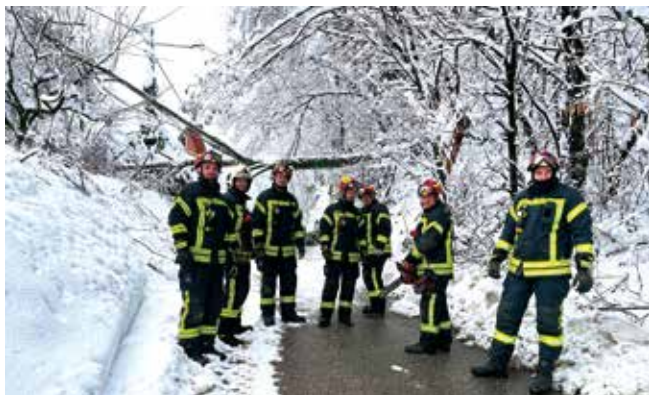
I dalje ulaganja u vatrogastvo