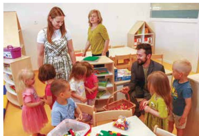
U fokusu Grada i dalje ulaganja u dječje vrtiće