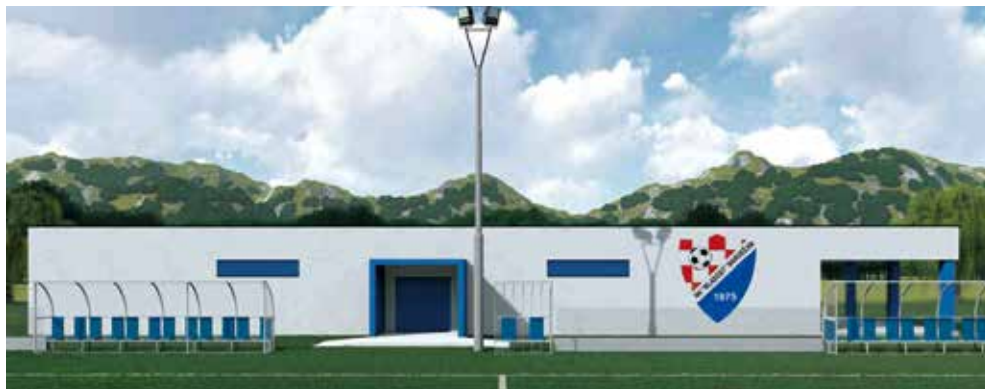
Budući objekt na igralištu NK Mladost Margečan