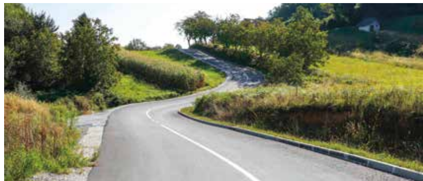
U Cesarčevu stiže javna rasvjeta