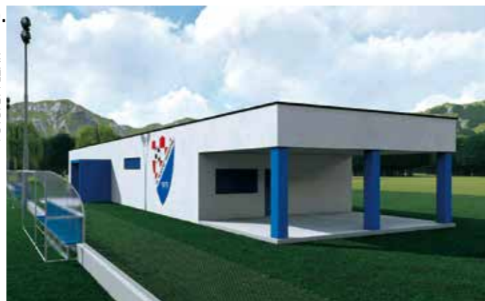
OVAKO će izgledati novi sportski objekt NK Mladosti Margečan

Za pokrivanje troškova najma školskih sportskih dvo-