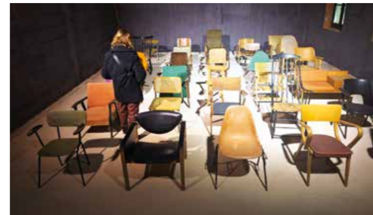
Čak 80 restauriranih stolaca, naslonjača, polunaslonjača...