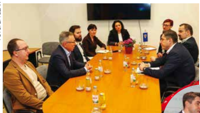
Na sastanku u Gradskoj vijećnici

Glavne teme razgovora bile su vezane uz poljoprivredu s naglaskom na pomoć malim OPG-ovima, kao i na važeću indeksaciju razvijenosti JLS-ova u Hrvatskoj, koja se na sredine svrstane u viši indeks (poput Ivanca) odražava diskriminacijski, na način da im onemogućuje prijavu na većinu javnih poziva za sufinanciranje projekata, a samim time i ravnopravan pristup EU sredstvima. Na taj moment pozornost je skrenuo gradonačelnik Batinić, koji je istaknuo da je