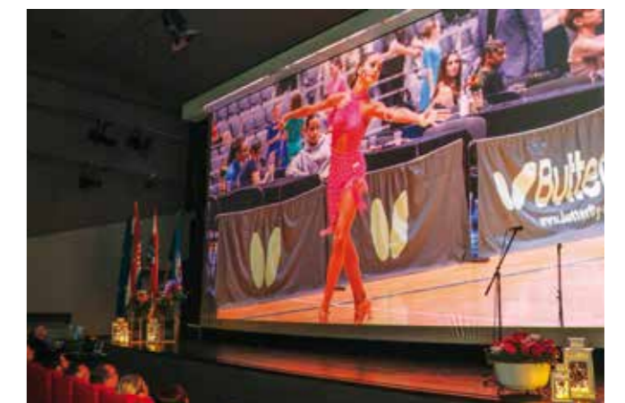
Videom kroz uspjehe sportaša i rekreativaca u 2025.