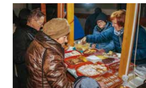
Obilježavanje na štandu vrijednih članica Maske