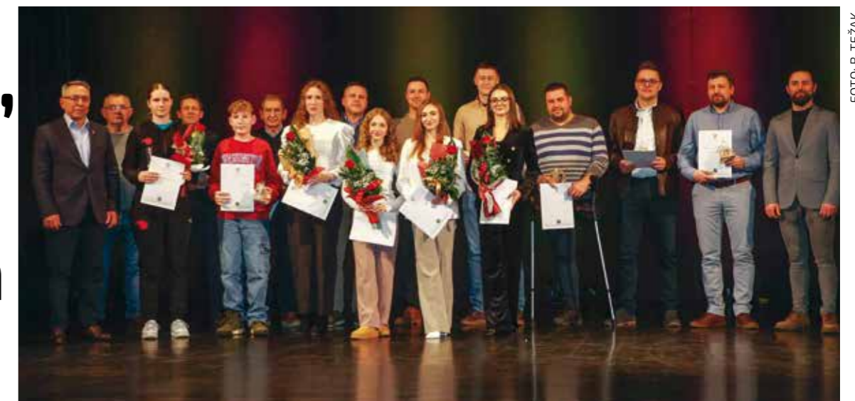
Petnaest sportaša, klubova i DSR-ova nagrađenih za doprinos razvitku sporta i rekreacije

– Nastojat ćemo i „podebljati“ i budžet za sport, ne samo radi