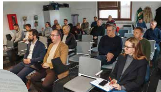
Vešligaj je održao i sastanak s OPG-ovima

Po pitanju OPG-ova istaknuo je da su već donesene odluke