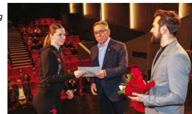
Nagrada i ženskom odbojkaškom klubu Ivanec