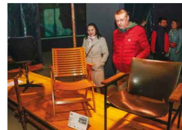
U obilasku nesvakidašnje izložbe