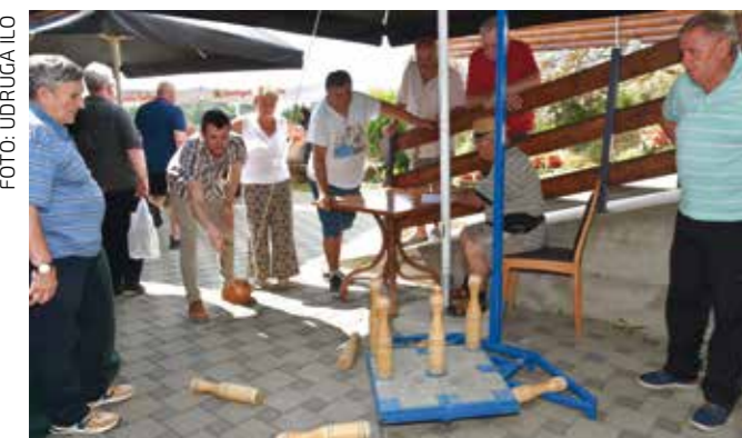
I u 2026. Grad će biti potpora udrugama koje okupljaju najosjetljivije kategorije naših građana

♦♦ Za isplatu božićnica Grad je osigurao 150.000 €, a za isplatu jednokratnih novčanih pomoći 120.000 €