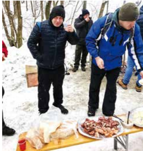
Valja povratiti snage...