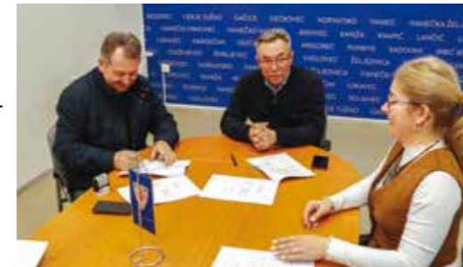
Na potpisivanju ugovora u Gradskoj vijećnici

Prva faza završena je u prosincu, kada je u nastavku stare kuće izgrađena prelijepa nova kuća od hrastovine, izvedena u tradicionalnom „štihu“ i prekrivena biber crijepom. U drugoj fazi Etno kuća će građevinski biti dovršena, a nakon toga slijedi opremanje. U međuvremenu je