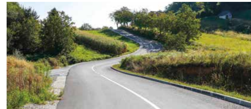
U Cesarčevu stiže javna rasvjeta