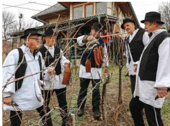
Prvim orezivanjem trsova simbolično je otvorena nova vinogradarska sezona