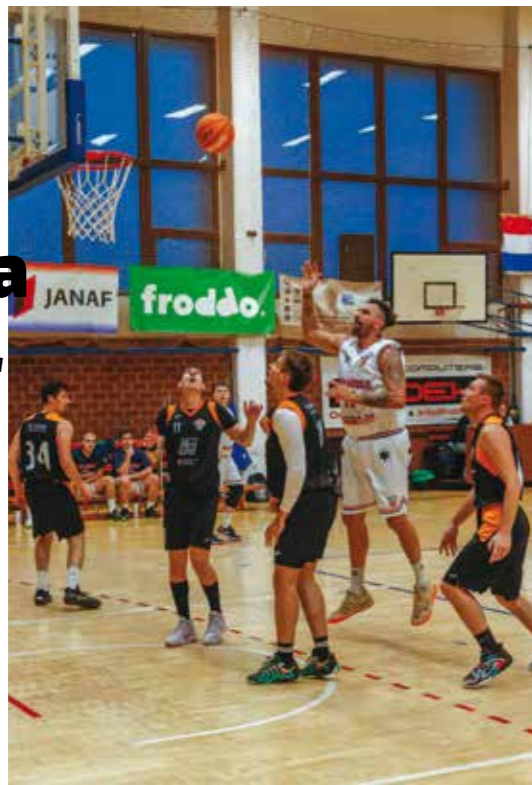
Bit će promjena u igračkom kadru u novoj sezoni