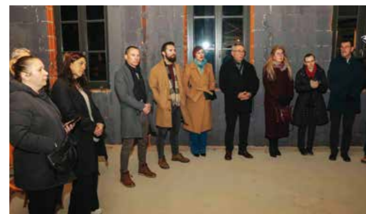
Izložbu su organizirali Grad Ivanec i Muzej planinarstva