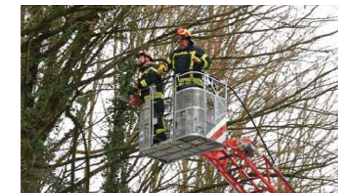
Težak posao na visini i pod debelim minusima

nost na javnim površinama, kao i na uklanjanju dijela stabala u Malom parku koja su, temeljem procjene stručnjaka Hrvatskog