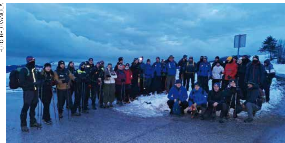
Planinari na Rapikovcu, uoči polaska na vrh