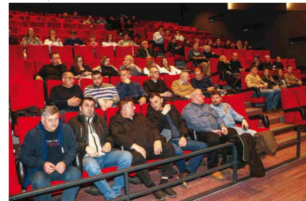
U publici članovi velike ivanečke sportske obitelji i ponosna rodbina laureata