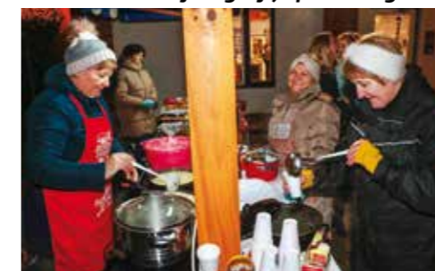
Članice KUD-a Salinovec pekle su palačinke