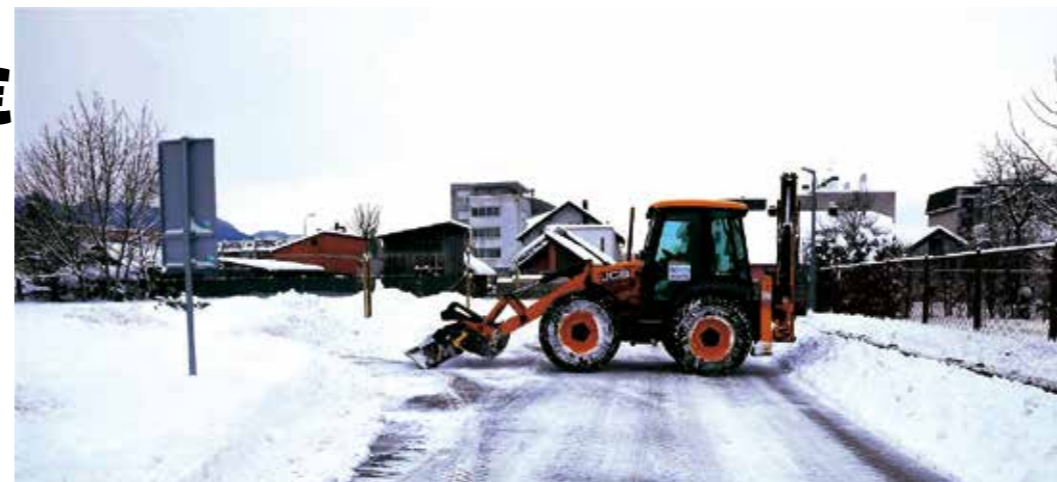
Troškovi zimske službe ove će sezone biti višestruko veći u odnosu na planirana sredstva

Daljnjih 145.000 € planirano je za održavanje javne rasvjete i utrošene el. energije. Osigurana su i sredstva za čišćenje i održavanje sustava oborinske odvodnje, za održavanje groblja, spomenika i spomen obilježja, za blagdansko uređenje grada itd.(lir)