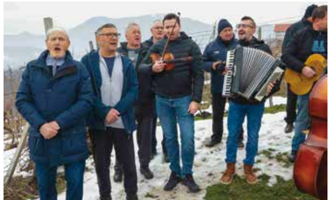
Vincekovo uz domaće vinske pjesme