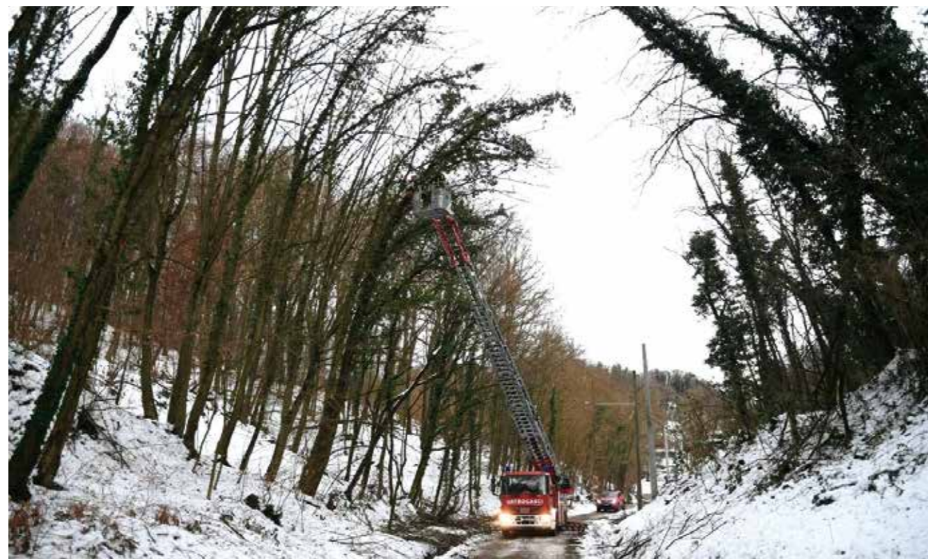
Ivanečki vatrogasci u Pecama, gdje je prijetilo rušenje stabala na el. vodove

Ova donacija predstavlja kompenzaciju DVD-u za opsežan posao koji je odradio prilikom snježnih havarija krajem prosinca i u siječnju. Riječ je o radovima na sječi stabala na strmim predjelima, koje je Grad Ivanec naručio od DVD-a Ivanec. Naime, stabla su zbog mokrog i teškog snijega na više lokaliteta prijetila rušenjem na električne vodove i njihovim uništavanjem, a što bi rezultiralo prekidom opskrbe dijela naselja električnom