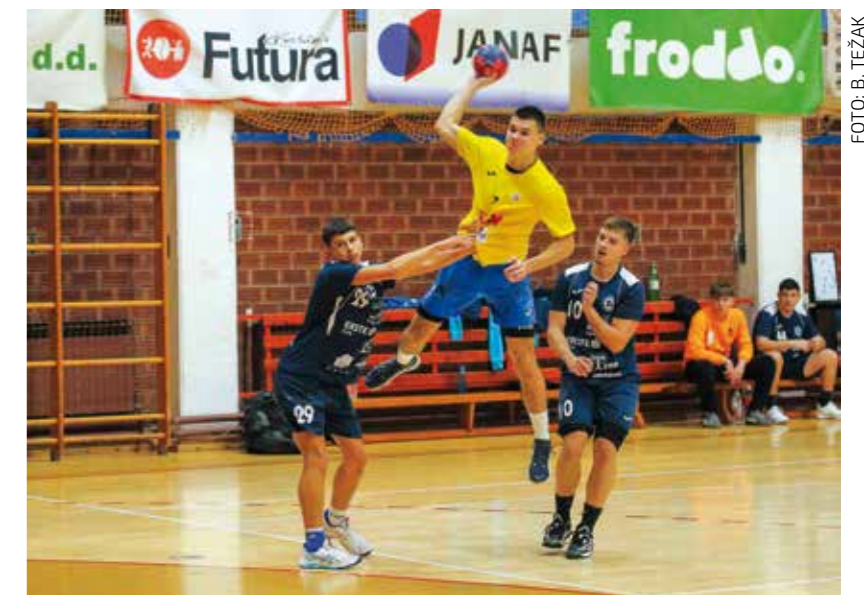
U sklopu priprema odigrano je i nekoliko utakmica s domaćim i slovenskim momčadima