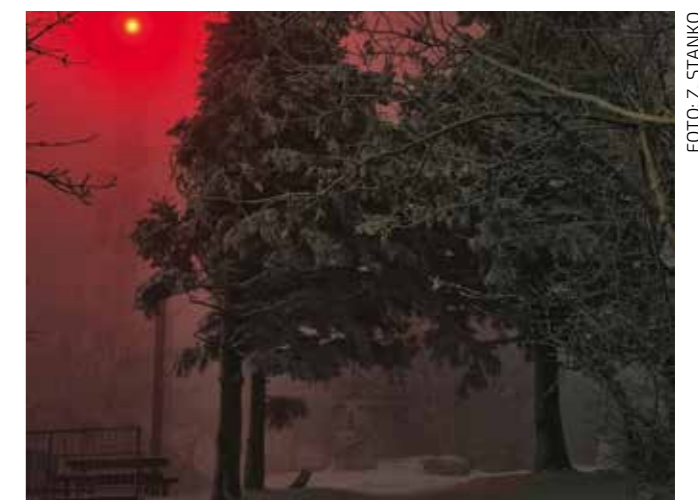
Impresivan noćni prizor na vrhu Ivančice

–Vrijeme je bilo idealno za uspon; temperature optimalne, oko -1,5 stupnjeva, snijeg suh, vidljivost do 800 metara odlična. Dobra organizacija i angažman svih aktivista HPDI omogućili su siguran uspon, a onda i spuštanje s Ivančice preko Prekrižja – poručio je B. Kušen.(lir)