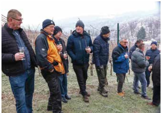
Svaki ima svoju kupicu...

Vinska ophodnja završila je u društvenom domu u Knapiću, uz gulaš i domaću kapljicu koja je, slažu se svi, vrhunske kvalitete. E, kad bi samo i ovo