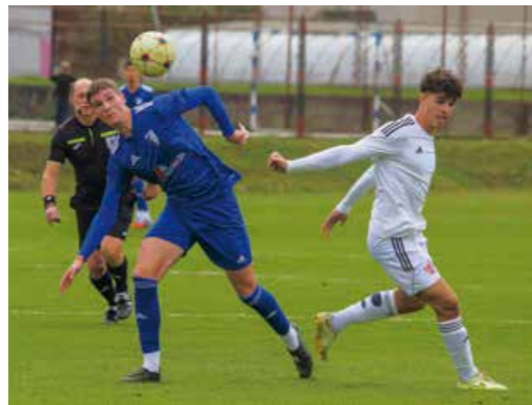
Ivančica se muči s napadom i realizacijom

Ivančica se muči s napadom i realizacijom jer postigla je samo 23 pogotka i nije „izbacila“ svog najboljeg golgetera. Problem je bio i s povratnikom u