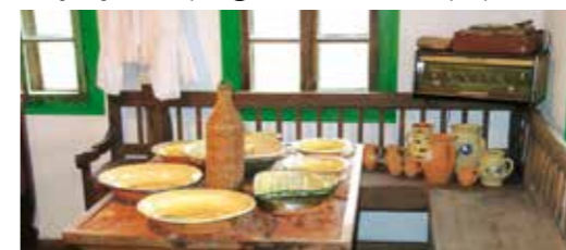
Lončarski zanat nekad je prehranjivao obitelji Bedenca, Jerovca i okolice

izvođač uveden u posao, a radovi su u tijeku. Investitor je Grad Ivanec, koji je projekt dogradnje pokrenuo radi očuvanja ovdajšnje duge lončarske tradicije Bedenca i Je-