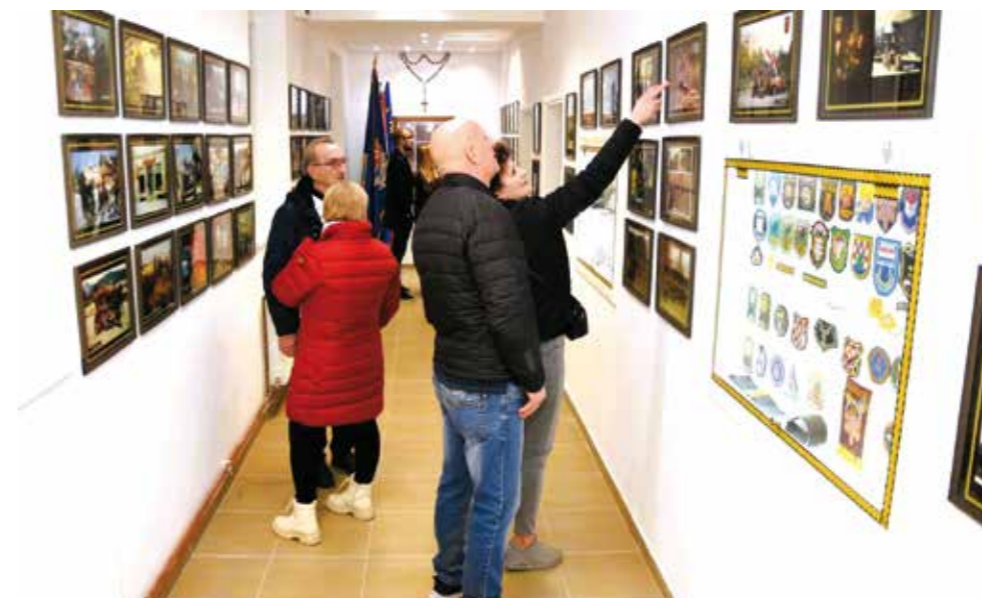
Je li to netko koga poznam?

Uz brojna druga gostovanja i natjecanja, zbor ove godine planira i nastup na 8. županijskoj razglednici u Ludbregu te na međunarodnom natjecanju Choral Pop u Križevcima.