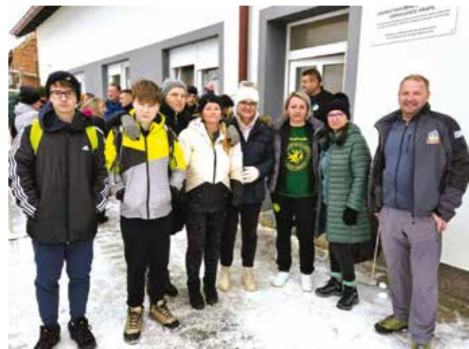
U dobrom raspoloženju!

Ovom manifestacijom DŠR Lančić-Knapić otvorio je ovogodišnji kalendar svojih rekreativnih manifestacija za sve generacije. A rekreativno pješačenje, dobrodošlo nakon obilja proteklih blagdanskih dana, i ovoga puta podržali su Grad Ivanec i Turistička zajednica. (Ijr)