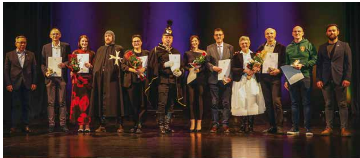
Laureati u kulturi Grada Ivanca 2025. godine

–lako se često rad Grada gleda pretežito kroz prizmu asfaltiranja cesta, nije sve u betonu i asfaltiranju! Ako nema pjesma i plesa, ako nema nečega „za dušu“, onda grad ne živi. A upravo vi ste ti koji svojim radom, pjesmom, glazbom i glumom pokazujete da Ivanec diše punim plućima! Dodijeljene nagrade tek su mali znak pažnje kojim vam želimo poručiti da Grad prati vaš rad i dati vam poticaj da na jednak način nastavite i ubuduće. A Grad će vas i dalje i podupirati koliko god to bude mogao! – istaknuo je gradonačelnik.