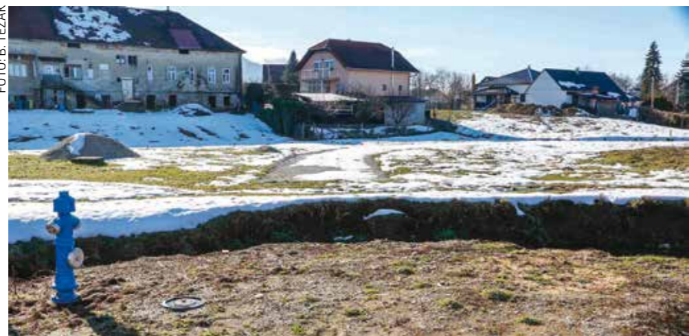
Kreće gradnja mosta u Radićevoj, koja time postaje spojna cesta Malezova-Gajeva

Od većih projekata u tom segmentu izdvajamo: gradnju prometnice u stambenoj zoni Gmajna Ivanec; gradnju mosta preko Bistrice i uređenje UL braće Radića; sanaciju klizišta Skradnjak II i Škriljevec; sufinanciranje uređenja lokalnih cesta (u nadležnosti ZUC-a) u Bendencu, Horvatskom i dr.; gradnju autobusnih stajališta u Jerovcu i Osečkoj; projektnu dokumentaciju za uređenje novog odvojnica Gajeva-vatrogasni dom Ivanec, za gradnju parkirališta u Gajevoj ul. (uz ogradu pokraj OŠ), za prometnice u Industrijskoj zoni, za projekte prometne infrastrukture nove stambene zone Domjanićeva-Jezerski put, geodetski projekt za