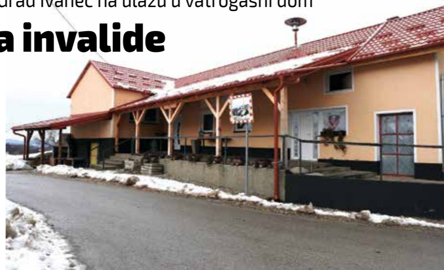
Radovi na ugradnji rampe trebaju biti izvedeni do početka svibnja

Kako bi Grad ovaj projekt mogao prijaviti na Javni poziv resornog ministarstva, prethodno su Grad Ivanec i DVD Gačice zaključili Sporazum o partnerstvu, pri čemu je DVD izrazio Gradu punu podršku u provedbi svih projektnih aktivnosti. Prilaz domu uredit će sami članovi DVD-a Gačice. Po ugovoru, svi radovi trebaju biti završeni do početka svibnja. (Ijr)