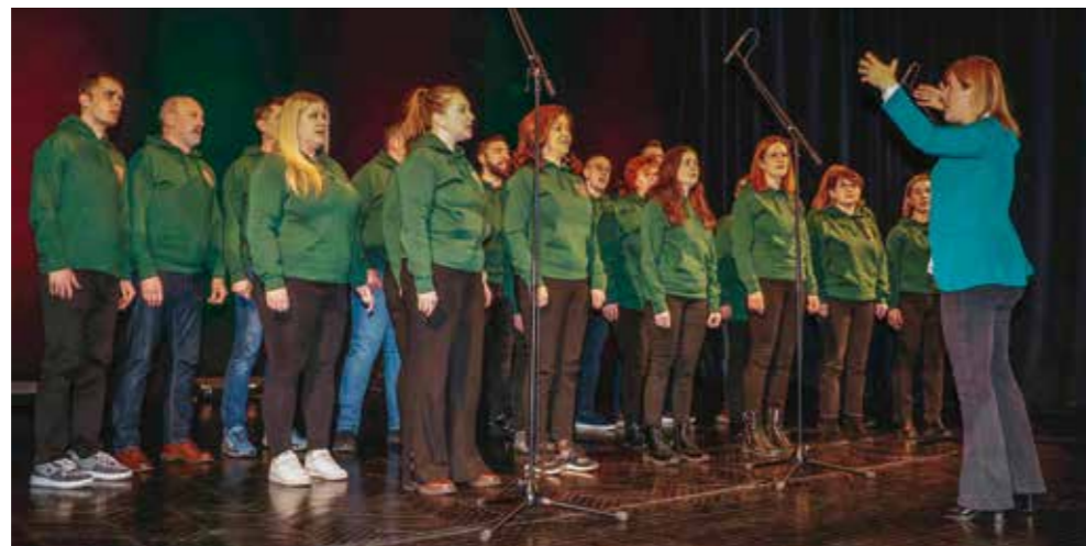
Kad zapjeva zlatni ivanečki zbor