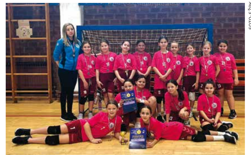
Mlada ekipa vraća rukomet u Ivanec