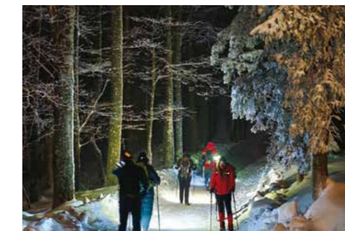
Na noćnom pohodu

greba, Čakovca, Stubičkih Toplica, Lobora i drugih mjesta, koji su na uspon krenuli organizirano, s parkirališta na Rapikovcu. Još barem toliko planinara na Ivančicu je krenulo i prije toga, u vlastitom aranžmanu.