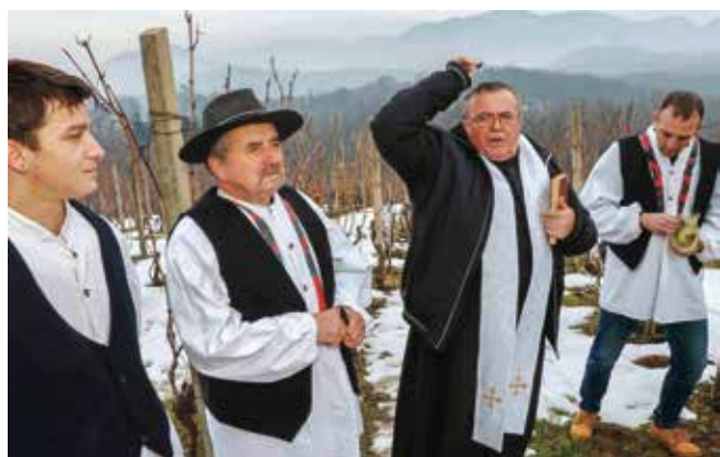
Vlč. M. Piskač: Nek Bog blagoslovi trud i rad težaka v goricama