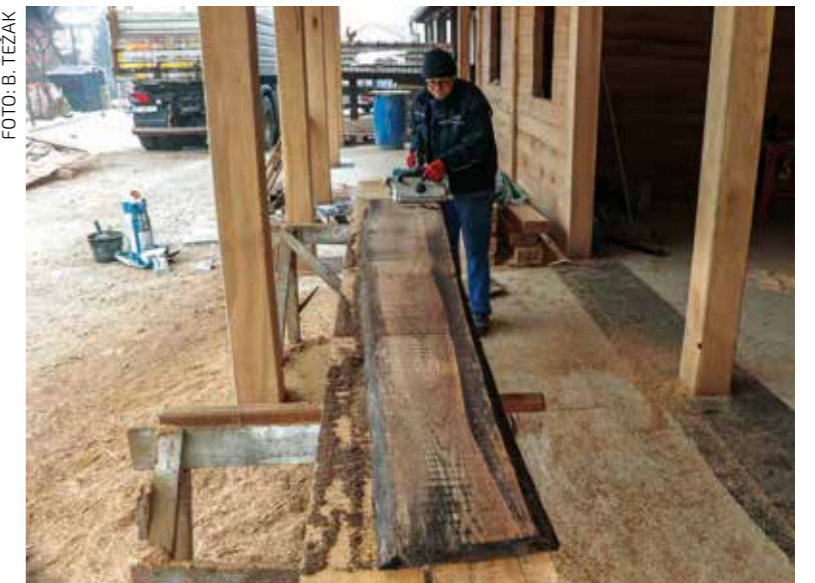
Radovi u drugoj fazi već su krenuli

rovca. Namjera je da se u novoj kući opreme prostori za održavanje lončarskih radionica i tako sačuva ovo drevno umijeće od kojeg su nekad živjele brojne obitelji ovoga kraja, a poznato