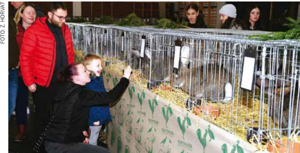
Dječji osmijeh govori baš sve!

Batinić najavio je i buduću potporu Grada Društvu Fauna te kazao da su im vrata Gradske vijećnice uvijek otvorena. (Ijr)