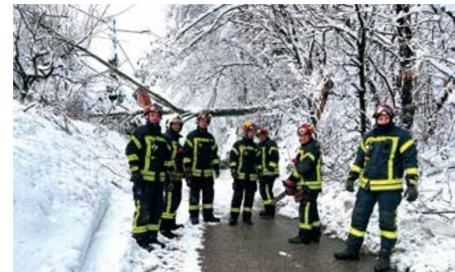
I dalje ulaganja u vatrogastvo