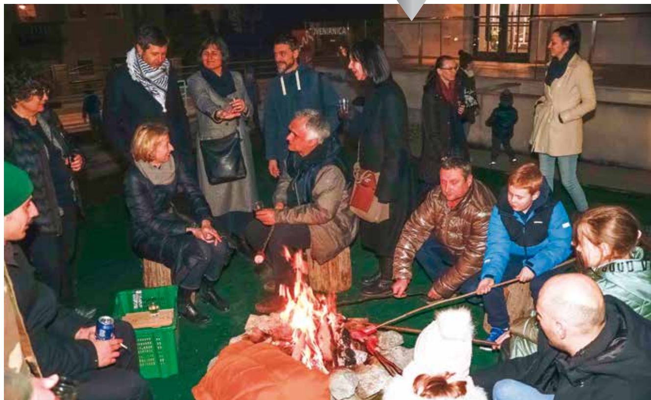
NOĆ MUZEJA Velik posjet Muzeju planinarstva i Centru "Kukuljević" str. 15.