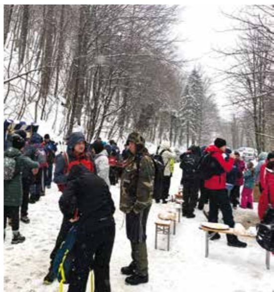
Predah i okrepa na Žganom vinu