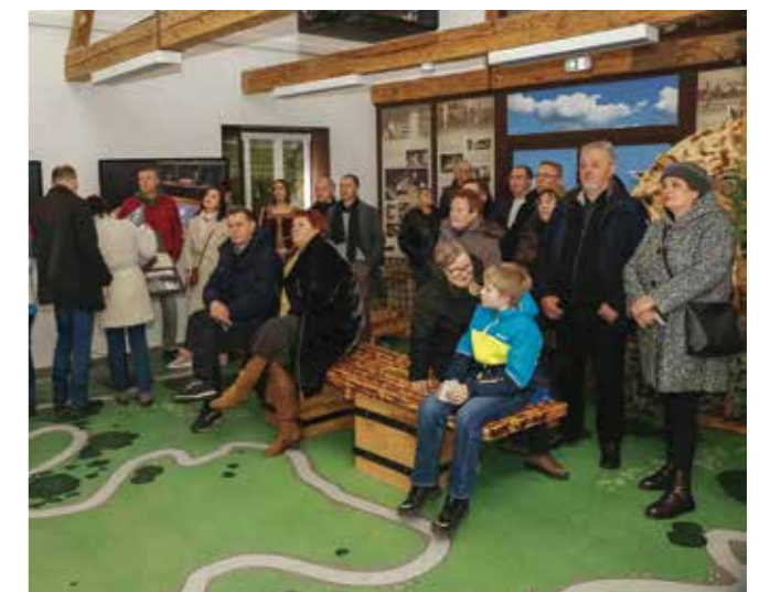
Video o povijesti Ivanca u Centru „Kukuljević“