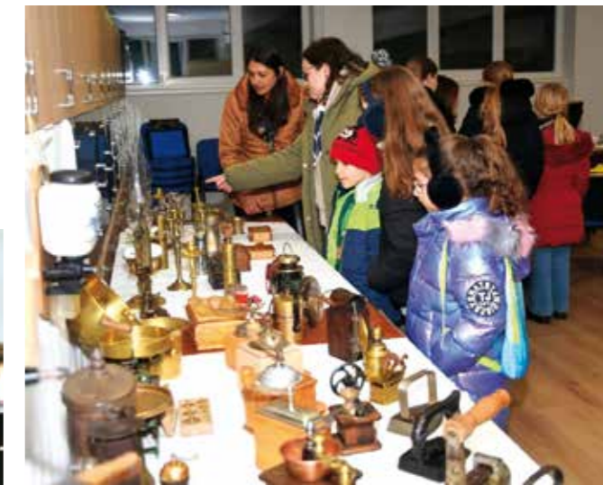
Izložba etno predmeta kao popratni program Noći muzeja MC Ivanec