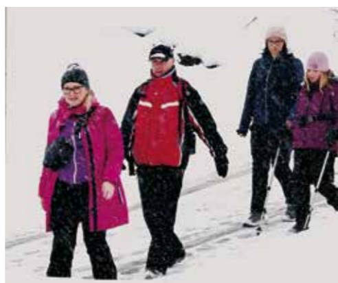
Obiteljski pohod snježnom stazom

DVD GAČICE Ministarstvo hrvatskih branitelja i Grad Ivanec na ulazu u vatrogasni dom