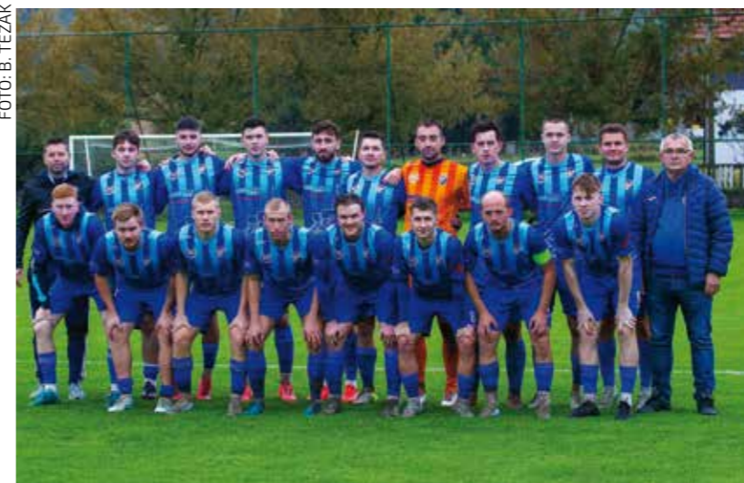
Bez promjena u sastavu momčadi u proljetnom dijelu prvenstva

Inače, momčad je nakon prvog dijela prvenstva u EL bila 6. i u nastavku prvenstva morat će uložiti dosta truda da u preostalim osam utakmica izbori plasman među prvih šest momčadi koje joj