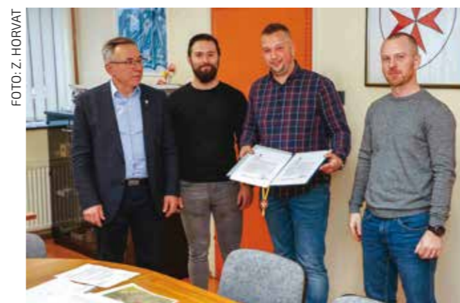
Dodijeljena donacija utrošena je na nabavu specijalne opreme za tehničke intervencije

riti samo jedanput na godinu, a zahtjev možete predati tijekom cijele godine, zaključno s 31. prosinca 2026.