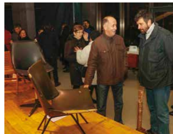
Odbačeni stolci – izazov za umjetnika

od njih nekad su se nalazili u bolnicama, tvornicama i drugdje, a nakon toga su odbačeni kao bezvrijedna potrošna roba.