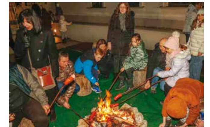
Planinarska vatra HPD-a Ivančica i pečeni jeger