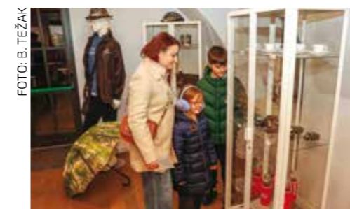
U muzejskoj suvenirnici

Noći muzeja nazočio je i gradonačelnik Milorad Batinić sa suradnicima iz gradske uprave,