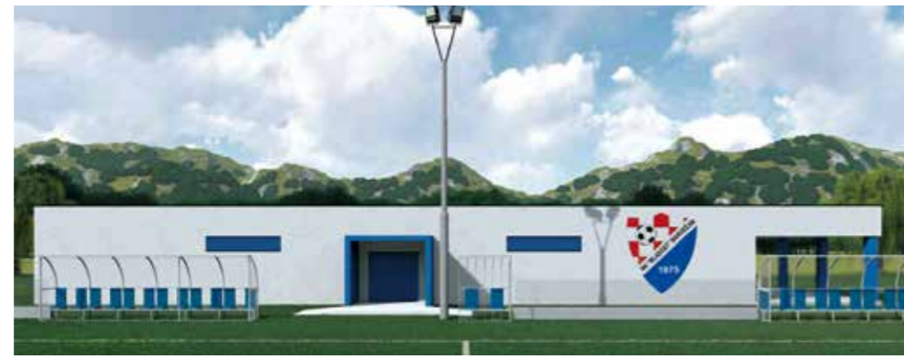
Budući objekt na igralištu NK Mladost Margečan