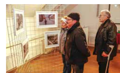
Izložba zimskih fotografija pok. P. Jagetića