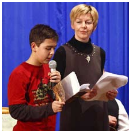
Pjesnički prvijenci ivanečkih učenika

- U 29. ogrlicu Drage domaće rieči nanizane su pjesme koje karakterizira različitost tema i bogatstvo motiva, a ujedinjuje ih kaj. Kaj u svim varijantama i nijansama ovoga našeg zagorskog podneblja: od ivanečkog preko zagrebačkog, koprvničkog, vidovečkog, novomaro-