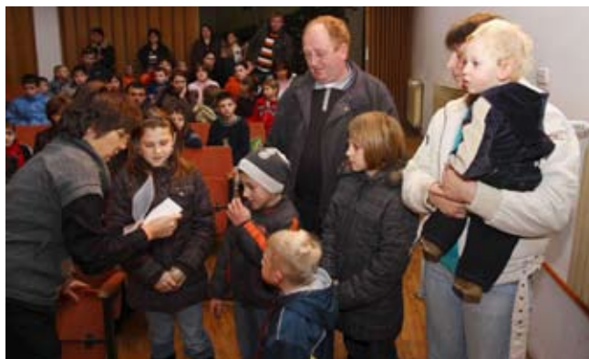
Sretan Božić dječici i roditeljima!

ATRAKCIJA Motorizirani djedovi ponovno na ivanečkoj špici