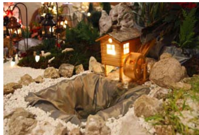
Svakom detalju Ivan je pridao posebnu pažnju

su mi gosti. Uvijek im je zanimljivo, jer štalica nijedne