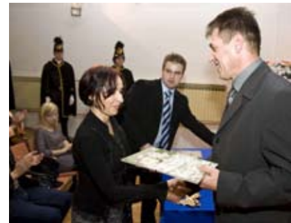
Priznanja i nagrade vlasnicima najljepših okućnica

Postoje i dodatna, tj. pomoćna sredstva u provođenju