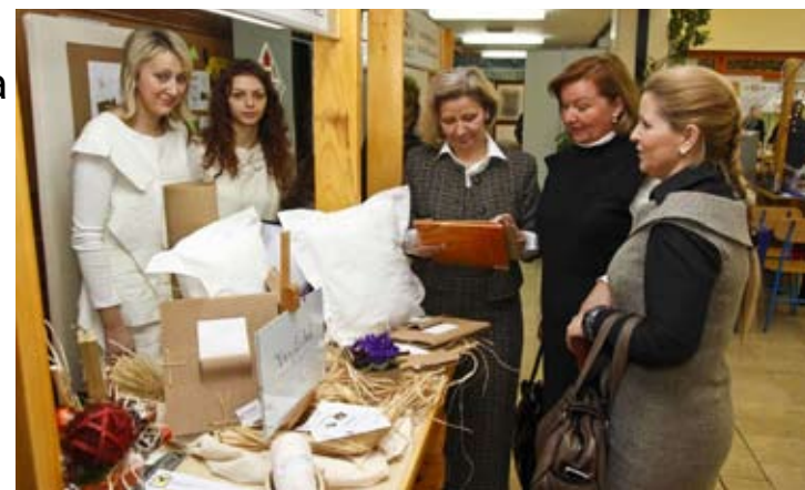
Srednja škola Ivanec već je pokrenula postupak za nove obrazovne struke

– Kao najveći proizvođač masivnih lijepljenih ploča u Europi i izvoznik koji neprestano ima potrebu zapošljavanja kvalificiranih stolara, kojih na tržištu