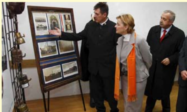
Priređena je atraktivna izložba rudarske baštine

Te je pohvalne riječi, otvarajući u petak, 4. prosinca, Ivanečke rudarske dane i 1. sajam ivanečkog gospodarstva, domaćinima uputila Vesna Pusić, predsjednica Nacionalnog odbora za praćenje pregovora o pristupanju Hrvatske EU. Osvrćući se na podatak da bi Hrvatska 2012. godine iz EU trebala dobiti