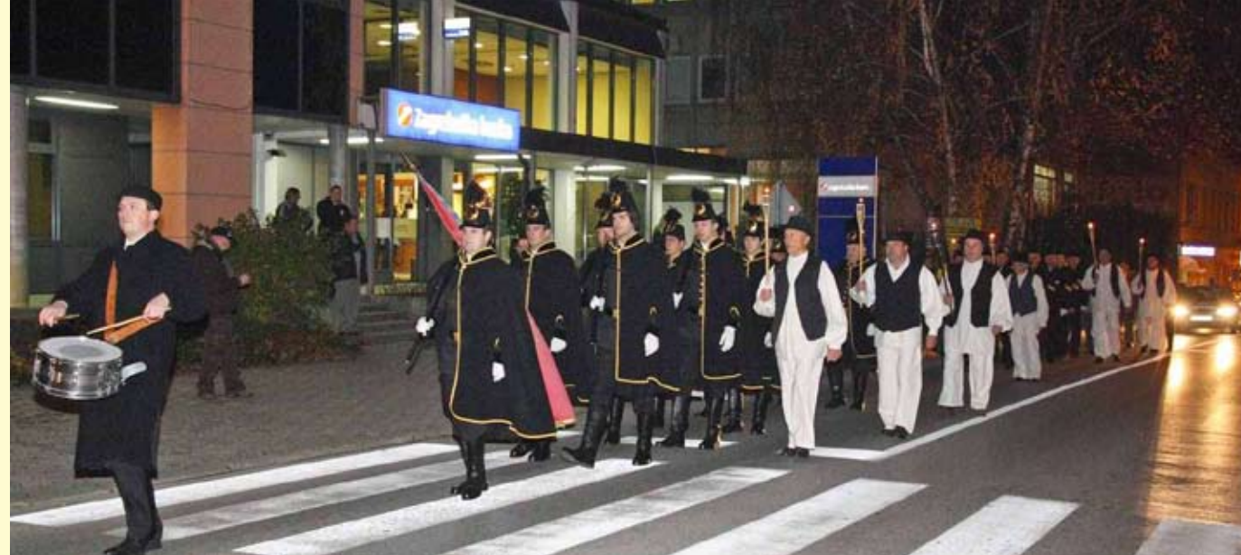
Mimohod rudarskih postrojbi i bivših rudara ulicama Ivanca