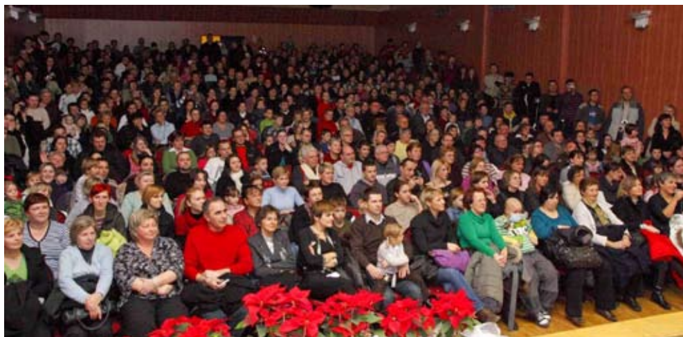
Prepuno gledalište ivanečkog kina

Dječjeg vrtića Ivančice i njegova područnog odjeljenja u Radovanu. Iz svega su glasa pjevali