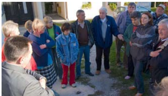
Godina 1997: Stanari Frankopanske gradonačelniku Batiniću - U centru grada smo, a Frankopanska je infrastrukturno posve neuređena!

nijeli realizaciji ovog projekta – Ministarstvu regionalnog razvoja, šumarstva i vodnog gospodarstva, izvođaču radova Cesti i njenim kooperantima, te ZUC-u, Hrvatskim vodama, Ivkomu, nadzornim stručnjacima, projektantima, županijskim uredima, nadasve gradskim