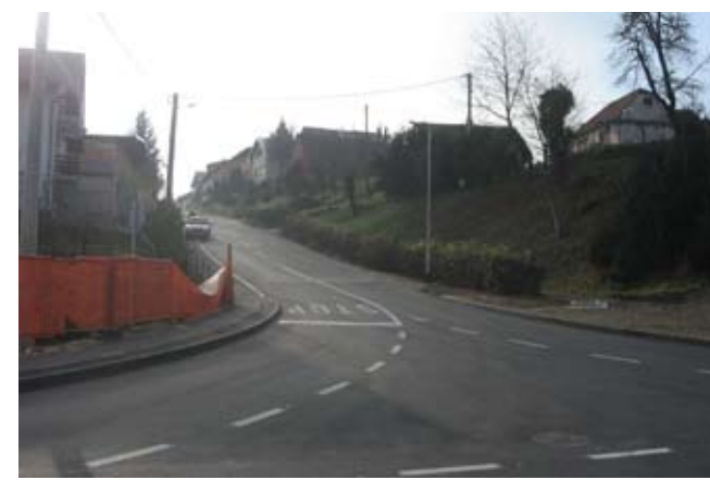
Moderno raskrižje na ulazu u Frankopansku ulicu

POHVALNO Nova manifestacija na središnjem gradskom prostoru