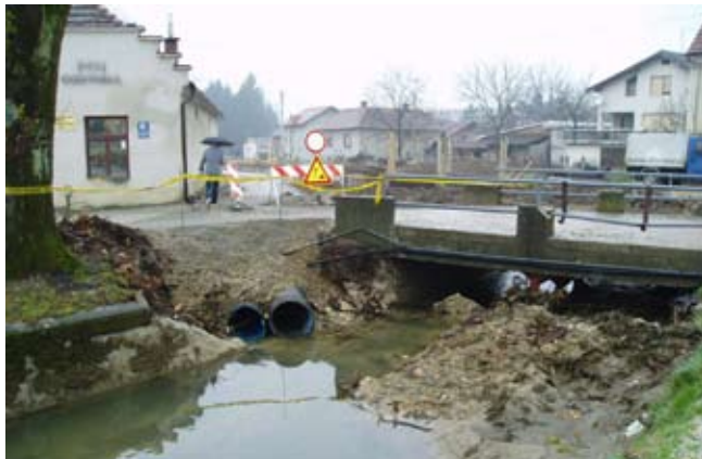
Donedavna stvarnost, a danas tek dio ivanečke povijesti

službama, posebno Upravnom odjelu za urbanizma, komunalne poslove i zaštitu okoliša. Zahvaljujem građanima, koji su pokazali veliko strpljenje i razumijevanje za sve teškoće i probleme u vrijeme izvođenja složenih radova – naglasio je gradonačelnik.