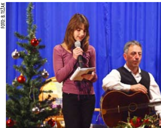
Hrabar nastup pred velikim auditorijem