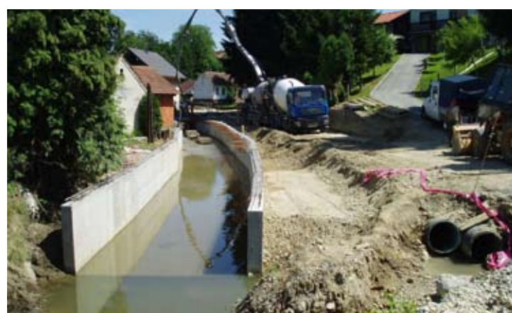
Naziru se konture buduće spojne ulice