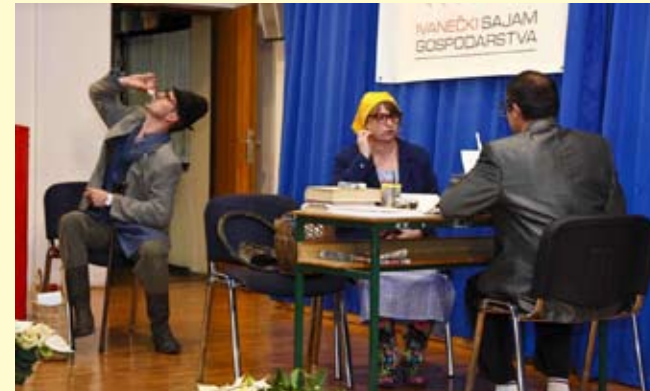
Uz gospodarske teme i prigodan skeč – Poticaji, u izvođenju glumaca iz Stažnjeva

KONZUM U Ivancu otvoren najveći objekt Super Konzuma u Varaždinskoj županiji