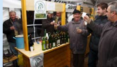
Bilo je veselo uz štand Peharčeka

sreće, jer im je velik snijeg porušio kućicu! Također, Udruga vinara i vinogradara Peharček ponudom vina oko sebe je okupila brojne Ivcance, a dva je dana pod šatorom svirao i band Andromeda. Organizatori već razmišljaju o tome da ove godine, kada se bude organizirao 2. sajam, nabave grijani šator i pod njim organiziraju ugostiteljsku ponudu. (lir)