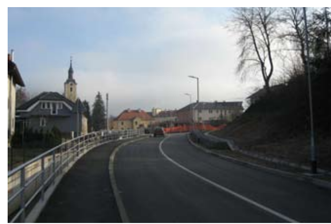
Prilaz u pravcu Rajterove