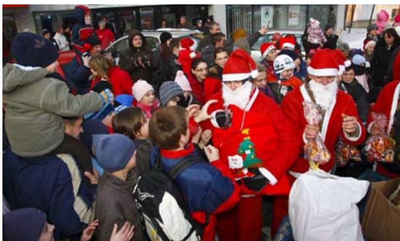
Djedice-bajkere na ivanečkoj je špici dočekalo mnoštvo djece