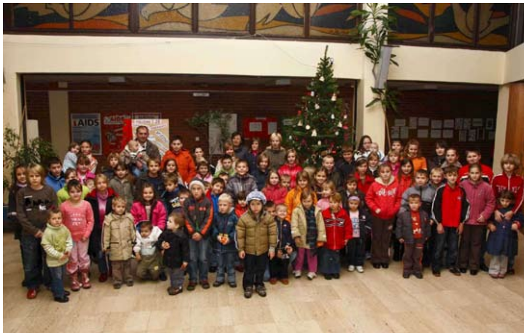
Novčane darove dobilo je 117 djece