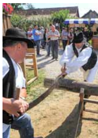
Dečki su pokazali da znaju piliti „amerikankom“