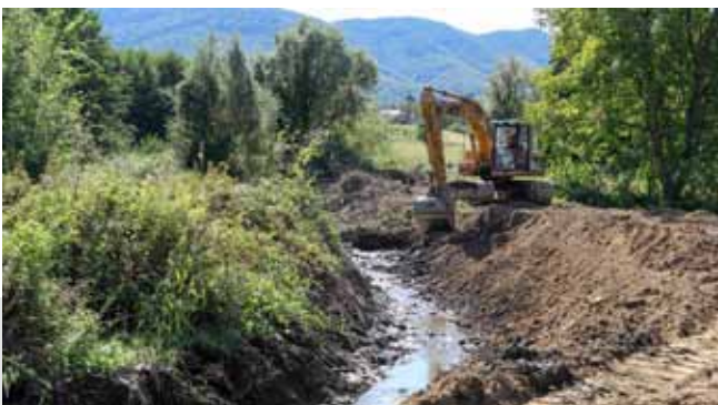
Radovi na potoku Vuglovčak

ju velik broj članova. U Stažnjercu se održavaju i popularni Dani glume koje „nosi“ Glumačka družina Komedijaši. Novouređeni prostori