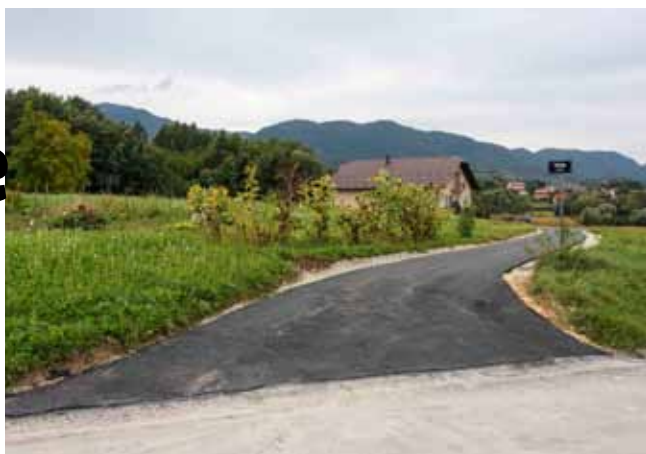
Asfaltiran je i dio nove Vrtne ulice u Ivanju