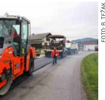
Asfalt na 400 metara županijske ceste u Salinovcu

Za te radove potrebno je izraditi projektnu dokumentaciju i ovisno o proračunu ŽUC-a, s tim se poslom namjerava krenuti iduće godine. (ljr)