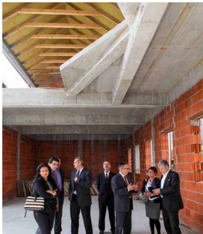
Šipuš: Potpore ministarstva ivanečkim projektima podići će razinu kulturne ponude Ivanca

Prilikom obilaska Muzeja planinarstva, domaćini su ministru izvijestili o načinu na koji će se ovaj projekt, jedinstven u Hrvatskoj, razvijati u daljnjim fazama. Batinić je naglasio da s tri spomenuta kapitalna i s nizom manjih društvenih projekata Ivanec „oštrije“ ulazi u fazu modernizacije i poboljšanja standarda u društvenoj nadgradnji, s obzirom na to da se prethodnih godina vrlo intenzivno radilo na komunalno – infrastrukturnim projektima i gradnji gospodarske infrastrukture. Svi spomenuti projekti u kulturi provode se u skladu sa Strategijom razvitka grada Ivanca od 2014. do 2020. godine.(ljr)