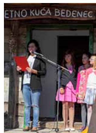
Program djece iz Prigorca i članica Udruge T. Težak

ma namještenim „po starinski“ te zahvalio Gradu Ivancu i Ministarstvu kulture na pomoći. Nakon otvaranja manifestacije, svi nazočni pozvani su da u pećnicu, na žgonje, donesu sirove