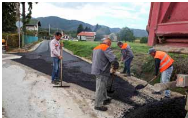
Ubuduće sigurnije dionicom asfaltirane ceste prema Lančiću

Istog dana je asfaltiran i odvojak Ulice Stjepana Vukovića te stotinjak metara Vrtne ulice kao i jedan odvojak kod trafostanice u Ivanečkom Vrhovcu (Knapić). Asfaltirane su i nerazvrstane ceste u Kirinima i Đundekima u Mjesnom odboru Lovrečan. Radove financira Grad Ivanec iz Programa gradnje objekata i uređaja komunalne infrastrukture kojim je za modernizacijske radove osigurano 535.000 kuna. (ljr)