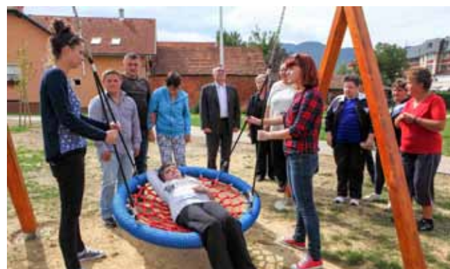
Igralište u Šabanovoj opremljeno je i spravama prilagođenim osobama s posebnim potrebama

Usto, u petak, 18. rujna, ispod dvije sprave postavljene su i antitraumatske podloge. One su također nabavljene iz donacijskih sredstava Udruzi Sunce od Regionalne zaklade ZAMAH (11.000 kuna) i od tvrtke Kunzmann, a štite djecu od povreda kod padova. Budući da je riječ o akciji koja