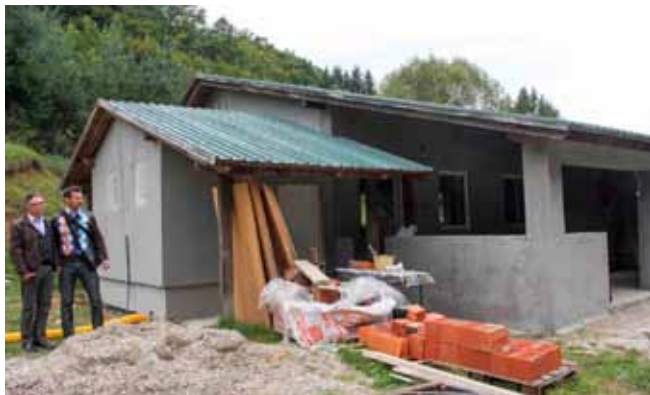
Na objektu je već obavljen znatan dio predviđenih radova

Temeljem natječajnog postupka koji je proveo Grad Ivanec, radove izvode četiri tvrtke – GEP iz Ivanca (građevinsko – obrtničke), Termo tim iz Cerja Tužnog (strojarske), Instalacij-