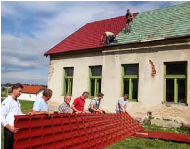
Objekt je dobio novu „kapu“ – limeni krov u imitaciji crijepa

– Ovdje vrlo aktivno rade dvije udruge – KUU Stažnjever i Udruga za sport i rekreaciju koje okuplja-