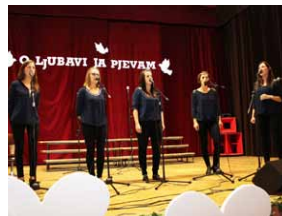
Nastupio je veliki broj mladih izvođača