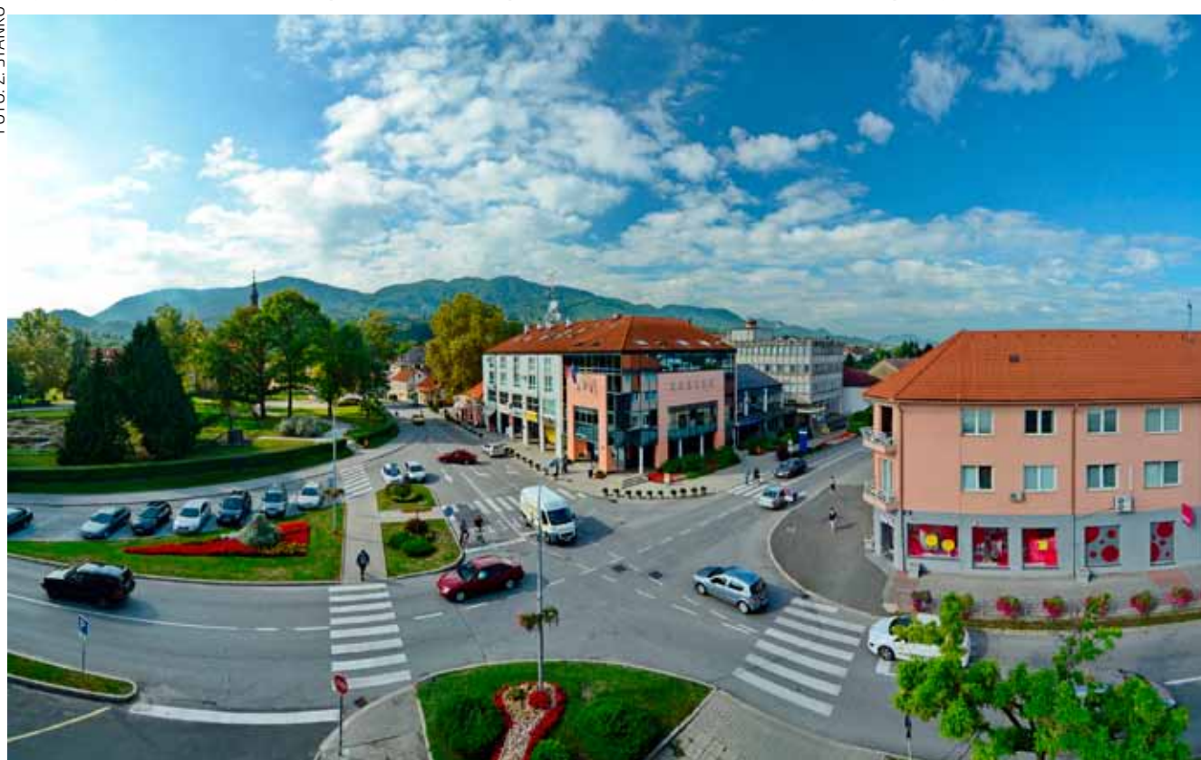
Grad Ivanec pruža šansu za zapošljavanje desetero mladih stručnjaka