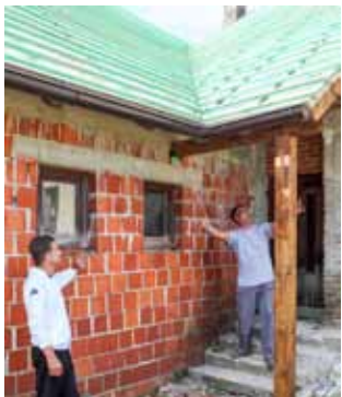
Svojom konstrukcijom krov štiti i prostor na ulazu u nekadašnji učiteljski stan, što je dosad bio velik problem

odavno dao svoje. Škola je sagrađena daleke 1912. godine, a nastava u njoj izvodila se sve do