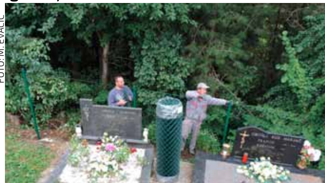
Postavljeno je 210 metara ograde oko cijelog groblja

PRIGOREC Iz gradskog Programa gradnje infrastrukture