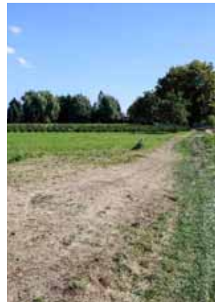
Prostor buduće nove građevinske zone u Ivancu

♦♦ Ukupni dosadašnji troškovi Grada i Ivkoma na realizaciji ovog projekta iznose oko 840.000 kuna