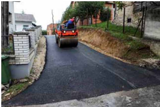
Novi asfalt u odvojku ivanečke Vukovićeve ulice