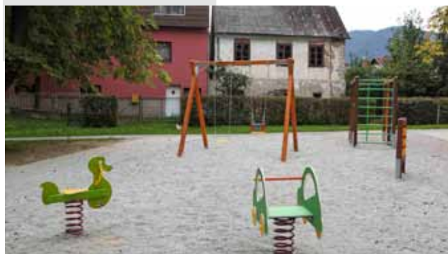
Novo igralište u Malom parku

Na igralištu u Malom parku u Malezovoj izvedena je prva faza radova. Uređen je središnji dio parka s dvije nove pješačke staze te s prostorom za igru na šljunčanoj površini. Opremljeno je s više sprava, a jednu od njih, ljuljačku s dvije sjedalice, od kojih je jedna namijenjena bebama, također je nabavljena iz donacijskih sredstava Sunca. U uređenje igrališta utrošeno je 85.500 kuna, a novac je osigurao Grad Ivanec. Radove je izveo Ivkom. U Malom parku u idućoj fazi radova predviđen je nastavak uređenja ostalih pješačkih i zelenih površina, uključujući i sadnju živice te postavljanje novih klupa i rasvjete. (ljr)