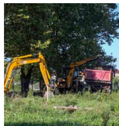
Teškim strojevima obavljani su pripremni zemljani radovi

Dotrajali kolnik novim je asfaltom obnovljen i na cesti u Salinovcu, gdje je ŽUC obnovu dionice duge 400 metara financirao s oko