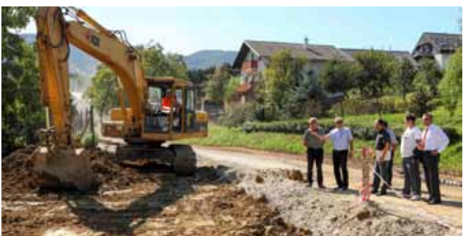
Oborinske i kanalizacijske vode usmjeravaju se u cijevi profila 1000 milimetara