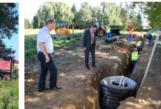
Položena je kanalizacija na dvije dionice duljine 315 metara, a tom trasom gradit će se i pristupne ceste

vedbe u zemljišnim knjigama, u ukupnoj vrijednosti 250.000 kuna. Vlasnici su na to pristali, pa su zauzvrat dobili formirane pravilne parcele pogodne za gradnju – obrazlaže gradonačelnik.