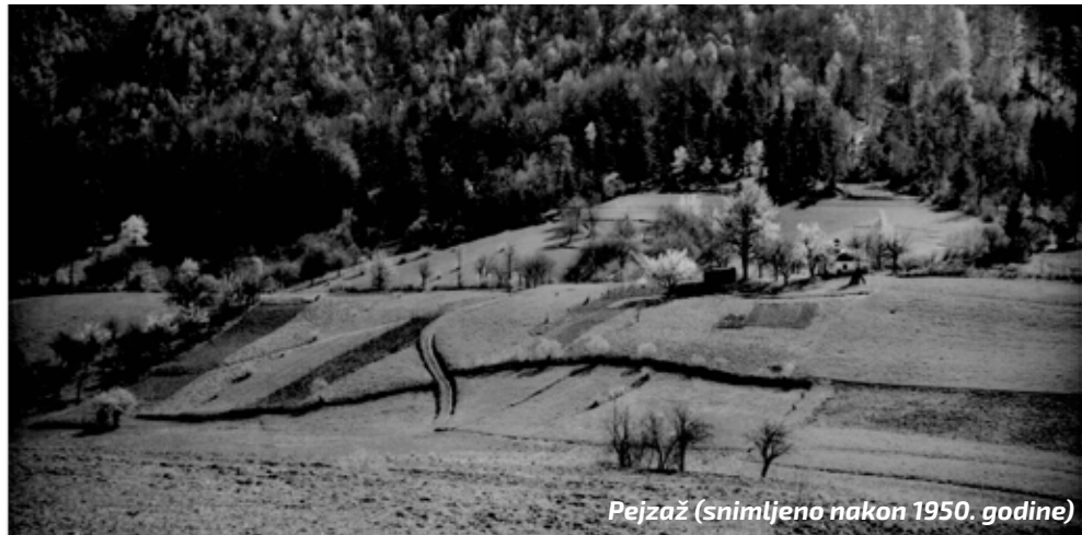
Glad, bijeda, siromaštvo

Problem nedostatka zemlje bio je prisutan i prije Prvoga svjetskog rata, a situacija se još više pogoršala pred kraj 1918., kada su se s bojišta počeli vraćati seljaci koje su u selima dočekale siromašne i gladne obitelji te zapuštena zemljišta. Narodni zastupnik za kotar Ivanec Cesar Akačić izložio je 6. srpnja 1918. pred Hrvatskim saborom problematiku o opskrbi i zdravstvenim prilikama kotara Ivanec i Pregrada istaknuvši kako je opskrba veoma loša te u kotarevima vlada glad.