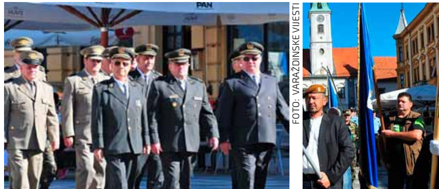
I ivanečki časnici bili su dio ponosne povorke

Među pripadnicima petnaestak ratnih postrojbi koji su prošli od Starog grada do Kapucinskog trga, toga dana ponosno su koračali i naši branitelji. Iako su im godine u međuvremenu posrebrile kosu i na lice urezale više bora, njihov ponos je, s razlogom, bio vidljiv i neupitan, jer upravo branitelji bili su ti koji su dali najveći doprinos i žrtvu