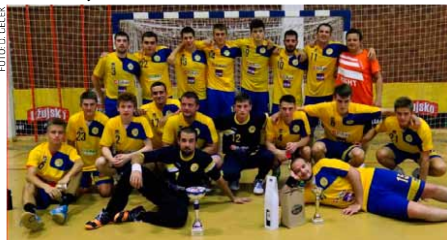
Sjajnom igrom na memorijalu je oduševila cijela momčad RK Ivančice