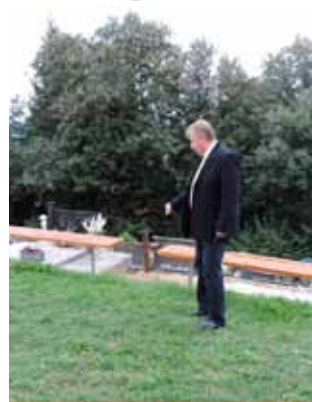
Postavljanje klupa oko kapele Sv. Duha

Desetak klupa oko kapele Sv. Duha u suradnji Udruge građana i Ivkoma