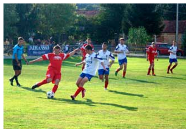
Juniori Ivančice u 5. su kolu slavili s 3:1

U nastavku je Ivančica zaigrala bolje te preko Sekola i Darka Jagića imala odlične priloge za povećanje vodstva, no kada su se našli oči u oči s gostujućim vratarom, nedostajalo im je i preciznosti, a i mirnoće. Zasluženo povećanje vodstva stiglo je u 73. minuti, kada je Sekol „povaljao“ cijelu gostujuću obranu i praktički se s loptom ušetao u gol za konačnih i zasluženih 2:0. U četvrtfinalu, koje se igra 8. listopada, Ivančica na stadionu u Ivancu dočekuje Zadrugara iz Hrastovskog. (ljc)