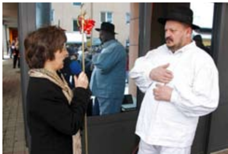
Ako je ključ toliki, kolika li je tek gradska blagajna...

pa i jednom lijom iz Mesopu- snog društva Pauše. Društvo im je pravila i grupa Robin Hoodova iz Kneginca, koji su, na zadovoljstvo ženskog svijeta, izveli urnebesni kan-kan u tajicama. Pravu scensku igru priredili su Snjeguljica i 39 patuljaka iz Vidovca, a Fašničku republiku huncutarijom i šalom proglasila je i Udruga slatkih srdaca iz Vrbovca te maskirane skupine iz Margečana, Prigorca, Vuglovca i drugih mjesta.