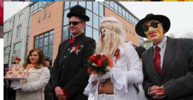
Vjenčanje u režiji KUD-a Salinovec

maskare su čvrsto obećale da je budu ispraznile. Nakon što je Zemaljski sud osudio Fašnika, više od 500 lafri iz 24 skupine fašničko su veselje, uz urnebesni ples i zabavu, nastavile u dvorani KTC-a.