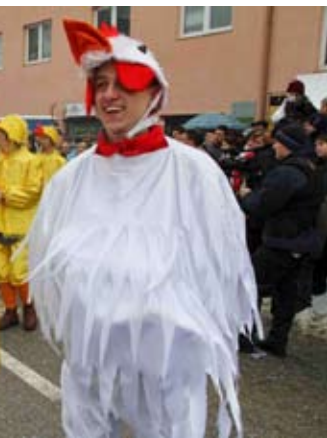
Kokodak! Negdje otraga skriva se i lija...

Domaćin im je bilo Društvo Maska, koje je ovogodišnji Ivonjski fašink priredilo uz financijsku i organizacijsku pomoć Grada Ivanca i Turističkog društva. (ljr)