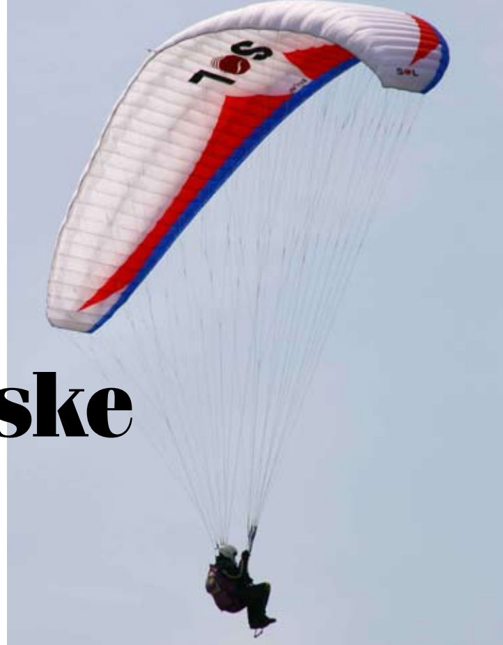
S Ivančice polijeću paraglideri