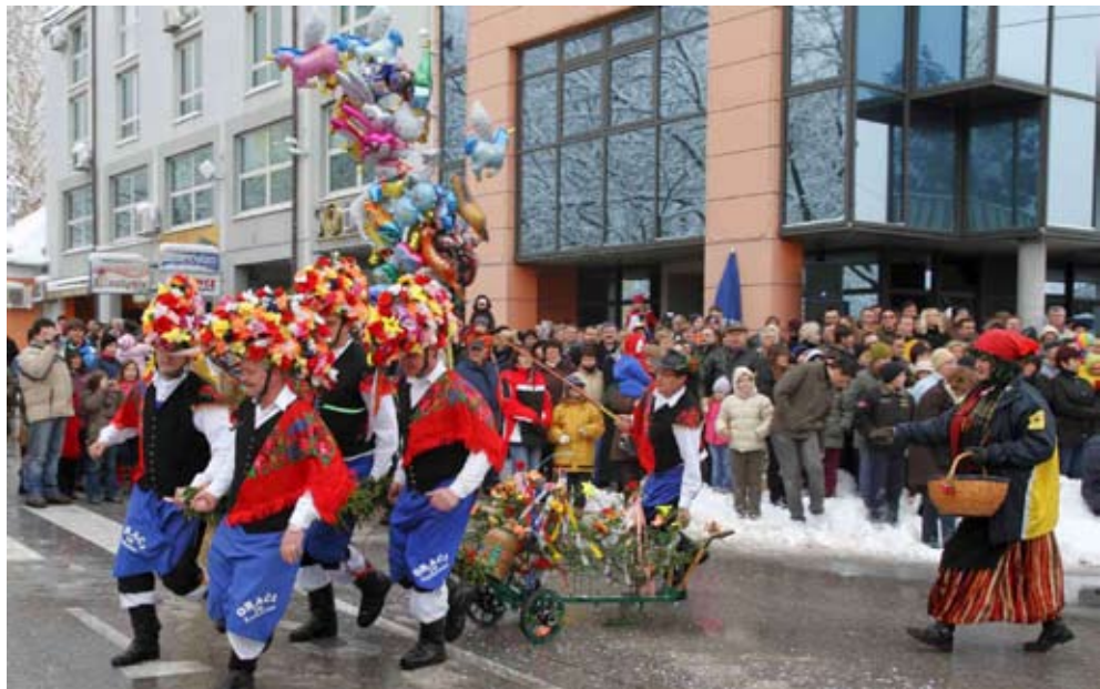
Urnebes na Ivonjskom fašinku

Na središnji trg domukale su i Medimurske krave iz Novog Sela na Dravi, a dokokodakao je i cijeli Delnički kokošinjac s kokošima, pilićima,