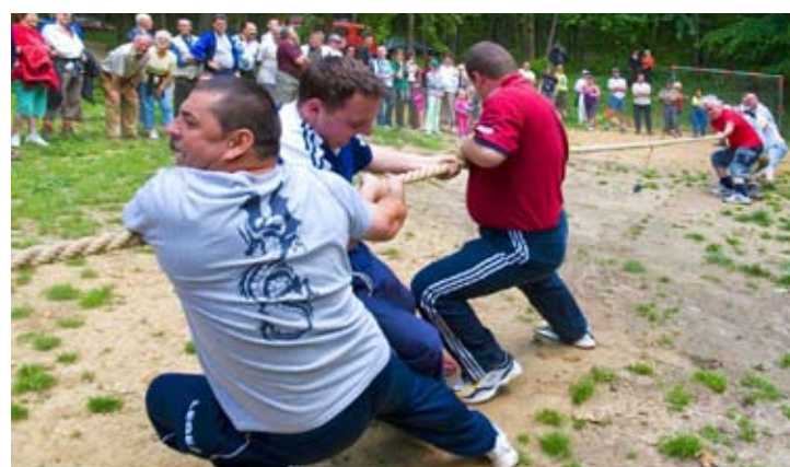
Rekreacija i zabavne igre kao dio redovite turističke ponude