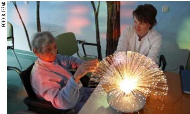
Umirujuće terapijsko djelovanje

Od ukupnog broja korisnika usluga Caritasova doma, tri četvrtine je žena. Kako bi im se sadržajno obogatio život u domu, novi ravnatelj Jalšovec uveo je niz novina. Svi koji žele, dan mogu početi vježbom u teretani, a na raspolaganju im je angažman u recitatorskoj i glumačkoj sekciji, izrada rukotvorina od gipsa i papira, vise-