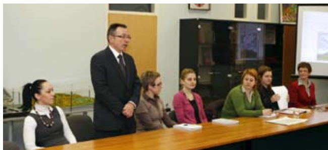
Batinić: Ivanečka rješenja mogu se „preslikati“ na masiv

To su osnovni naglasci sa skupa što je, na inicijativu Grada Ivanca, u utorak, 16. veljače, održan u ivanečkoj Gradskoj vijećnici. Tom je prilikom prvi put predstavljena objedinje-