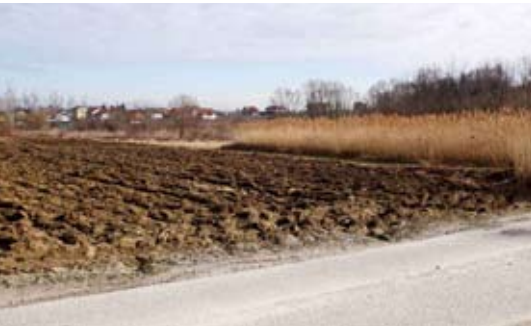
Sada zapušten prostor predviđen je za stadion

za male sportove i pomoćna igrališta, a dio površina namijenjen je gradnji bazena. Planiran je i prostor ugostiteljsko-turističke namjene, odnosno za gradnju hotela do 40 ležajeva u kategoriji tri zvjezdice i izletišta s restoranom. Detaljnom namjenom propisan je i obuhvat javnih zelenih, vodnih, infrastrukturnih i parkirališnih površina – objasnio je Varga.