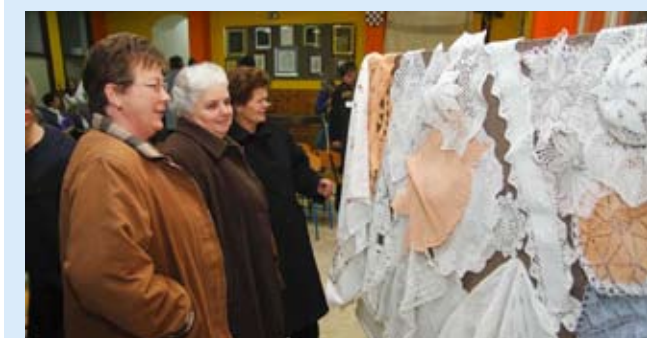
Žene su izložile rukotvorine što su ih dosad čuvalе u ladicama i ormarima