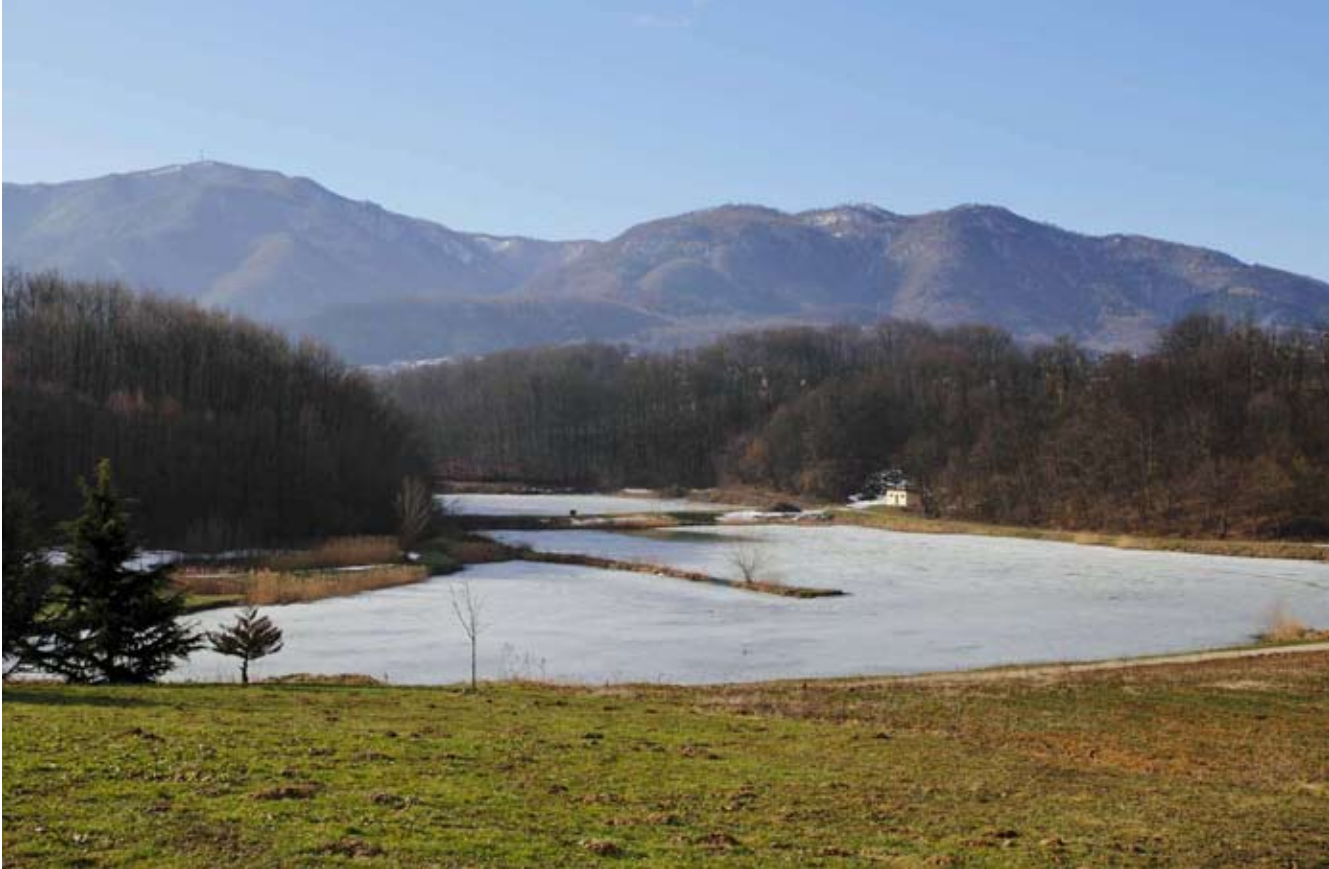
Buduća zona sporta i rekreacije određena je Detaljnim planom zone Jezera