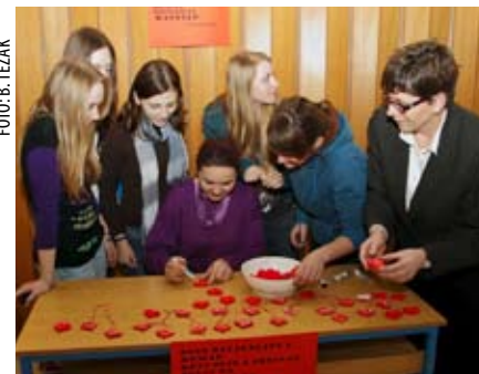
Srce za Haiti