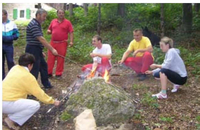
„Roštiljanje“ na vatrici dio je izletničke tradicije

– Neophodno je pritom strategijom precizno utvrditi obuhvat planinskih turističkih i izletničkih zona te Ivančicu zaštititi. Uvjeren sam da način na koji se Ivančica danas koristi uvelike doprinosi njevoj devastaciji – izjavio je gradonačelnik te predložio da obje agencije izrade projektni zadatak kojim će se definirati kapaciteti i potencijali Ivančice i način njihova aktiviranja i iskorištavanja.