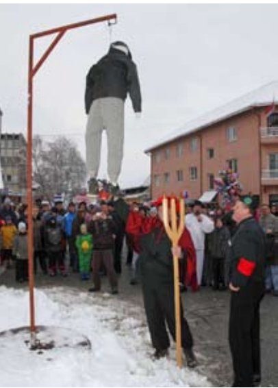
Fašnik ove godine baš i nije htio gorjeti

Čaplje i štrki iz Podturna, Giganice i napuhanci iz Turčiča, gumile iz Ivanca, kurenti i orači iz slovenskog Leskovca i Draženaca, sve to tek je dio pernatog i kosmatog svijeta što je u nedjelju, 7. veljače, u neopisivoj halabuci dolarmao na ivanečku špicu.