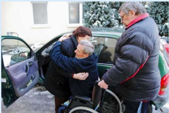
Težak je život osoba s invaliditetom

- Kako bi invalidima olakšale, sestre iz krvnog laboratorija silaze s kata u ambulantu hitne pomoći da im izvade krv. Toli-