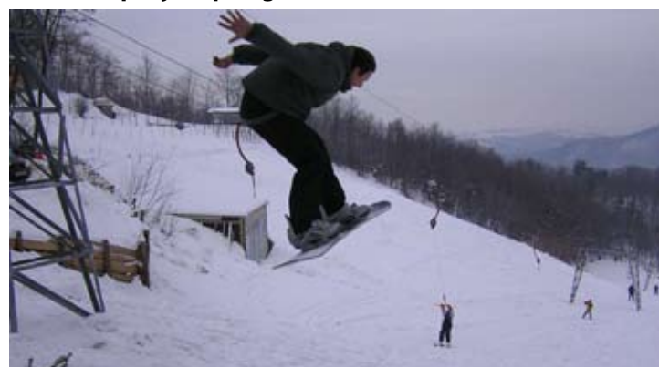
Snježni sportovi na Ivančici već su godinama stvarnost njena zimskog turizma