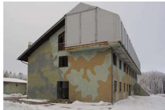
Rak-rana Ivančice devastiran je objekt na vrhu koji prokišnjava