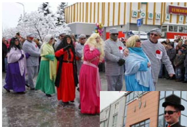
Menadžeri iz Remetince

maskare su čvrsto obećale da je budu ispraznile. Nakon što je Zemaljski sud osudio Fašnika, više od 500 lafri iz 24 skupine fašničko su veselje, uz urnebesni ples i zabavu, nastavile u dvorani KTC-a.