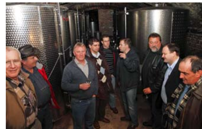
U podrumu na Čardaku vinari su kušali zlatna, nagrađena vina PZ Ivanec

če, odazvalo godišnjoj skupštini na Čardaku, vinorodnu imanju Poljoprivredne zadruge Ivanec kod Klenovnika. Nakon što su