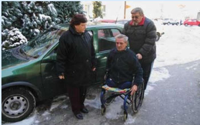
Molba: gdje je moguće, uredite prilaz za invalidne osobe