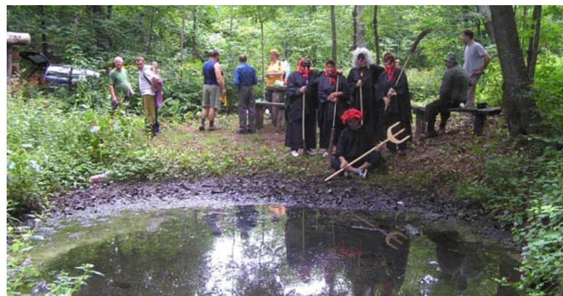
Turističku priču vezanu uz Černe mlake tek treba ispričati...