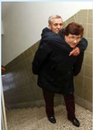
Ivanečki Dom zdravlja hitno treba dizalo