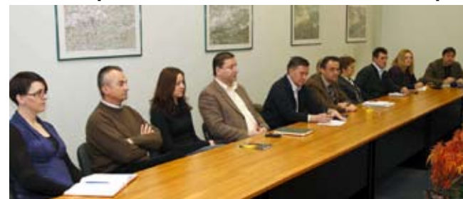
Sudionici skupa iz gradova i općina s obje strane Ivančice