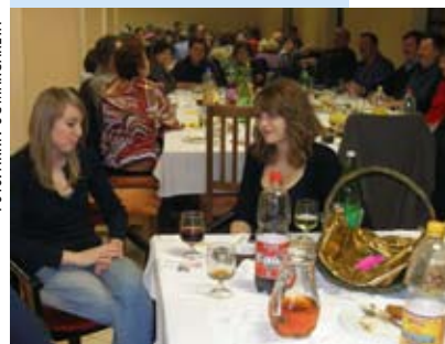
Ugodna večer u valentinovskoj atmosferi

No, prije toga sve je nazočne duhovitom predstavom naslovljenom Poticaj, nasmijala Dramska skupina Udruge za sport i kulturu iz Stažnjevca. Iznenađenje večeri potom su priredile klupske Coprnice na koturaljkama, koje su izvele koreografiju što su je uvijekdale s tamburaškim sastavom Lirika. Dakako, ugodnom glazbom tamburaši su goste zabavljali i u nastavku večeri, dok su se za gastronomski doživljaj pobrinuli kuhari iz KTC-a. (ljr)