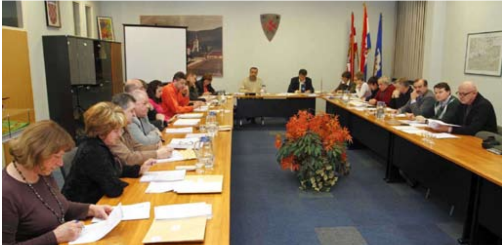
Gradski vijećnici na sedmoj sjednici Vijeća

– Površine sportsko-rekreacijske namjene predviđene su za gradnju nogometnog stadiona s atletskom stazom i tribinama na zapadnom dijelu. Ispod tribina planirani su prostori za ugostiteljski objekt i klupske potrebe. Također, predviđeni su i prostori