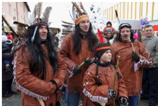
Izvorni zagorski Indijanci