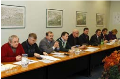
Aktualizirano je rješavanje niza problema