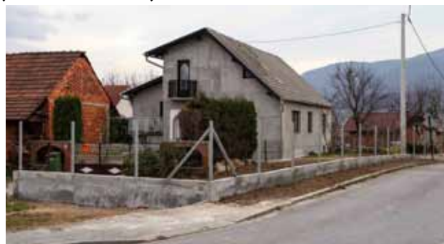
Stari objekt je srušen, a na dijelu nekretnine ostavljen je prostor za budući nogostup

NA TERENU Gradski čelnici obišli radove u Mjesnom odboru Ivanečka Željeznica