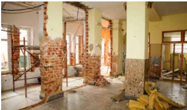
Radovi u holi kinodvorane

Bit će preinaka i u rasporedu prostora pa će se tako, primjerice, novi sanitarni čvorovi urediti na mjestu sadašnjih loža (ispod balkona). Što se tiče površine ispred kina, na njoj je zamišljeno uređenje velike ugostiteljske terase, a to znači da će se kiosci premjestiti na novu lokaciju. (lir)