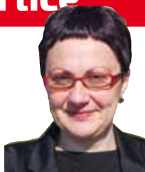
Piše: dr. sc. Suzana Jagić

♦♦ Za kolonizaciju u Slavoniju se tijekom 1919. prijavilo 356 osoba iz općine Ivanec