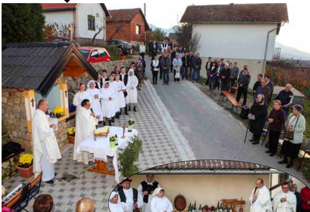
Misa kod lijepo uređene kapelice Sv. Martina na Šatornjaku kod koje je priređeno krštenje mošta