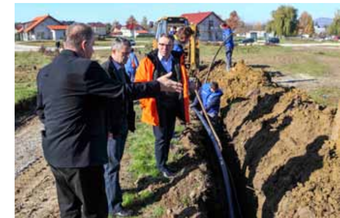
Ivkom vode i Ivkom plin u novoj su zoni sagradili vodovod i plinovod

Na 35.000 četvornih metara otvoreni su prilazi prema 16 gradilišta