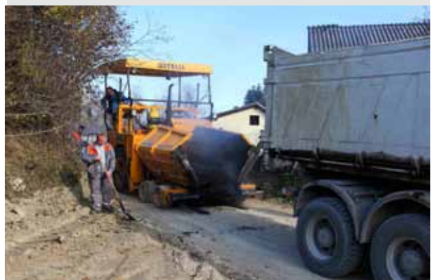
Asfalt je položen na najkritičnijem dijelu ceste

KOMUNALNO OPREMANJE Završena je gradnja plinovoda, vodovoda i cesta u novoj zoni urbane komasacije