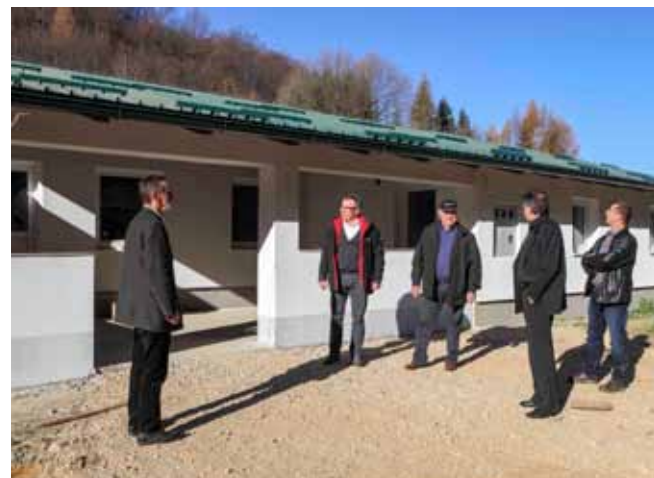
Grad Ivanec i Ministarstvo gospodarstva energetsku obnovu doma financiraju s gotovo 400.000 kuna

No, ono što građane Željeznice zacijelo najviše veseli jest njihov društveni dom čije uređenje i energetska obnova ulaze u završnu fazu. Zahvaljujući blizu 400.000 kuna vri-