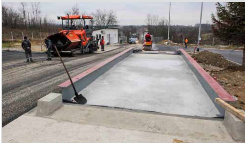
Ugrađena je električna teretna za vaganje tereta koji ulazi na prostor deponija

U sklopu dodatnih radova sagrađena je betonska konstrukcija na koju je ugrađena električna mosna (teretna) vaga za potrebe vaganja tereta koji ulazi na odlagalište. Usto, postavljeni su i rasvjetni stupovi, sve potrebne instalacije i videonadzor te priključak struje. U ponedjeljak i utorak, 23. i 24. studenog, cijeli prostor je asfaltiran, a asfalt je položen