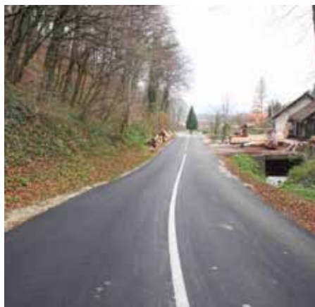
Zbog konfiguracije tla, otežana je gradnja nogostupa od Pilane do Prigorca