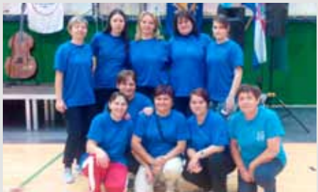
Salinovčanke četvrtu u konkurenciji 25 ekipa iz cijele Hrvatske