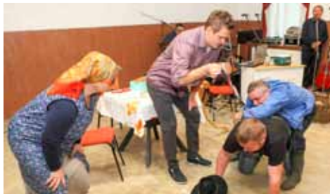
Komedijaši su nasmijali publiku svojom verzijom Dijete

Prigodnom svečanošću i kulturno – zabavnim programom, mještani Stažnjevca sa svojim su gostima u nedjelju, 29. studenog, proslavili završetak radova na energetskoj obnovi objekta stare mjesne škole. Zahvaljujući 383.700 kuna vrijednim radovima koje su financirali Grad Ivanec i Ministarstvo gospodarstva, nekad dotrajali objekt posve je obnovljen i pretvoren u funkcionalne zdanje u kojemu će djeca, mladež i građani ubuduće u adekvatnim uvjetima moći održavati svoje kulturne i srodne programe i sastanke te razvijati svoj društveni život.