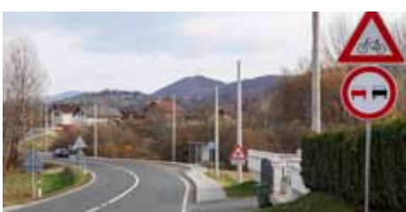
Nova rasvjeta uz nogostup

Ovi radovi planirani su Programom gradnje objekata i uređaja komunalne infrastrukture za 2015. godinu, a financira ih Grad Ivanec koji pokriva troškove izrade projekta, ugradnje stupova i montaže svjetiljki. Ovaj projekt Grad Ivanec realizira s HEP-om koji je ustupio stupove. Temeljem postupka javne nabave, izvođenje radova povjereno je Elektro Golubu iz Horvatskog. (lir)