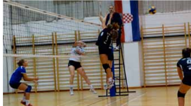
Ivanečke odbojkašice još uvijek bez pobjede u 2. A ligi

no iskustva. Među ključnim faktorima jest i visina igračica, a tu su Ivan-