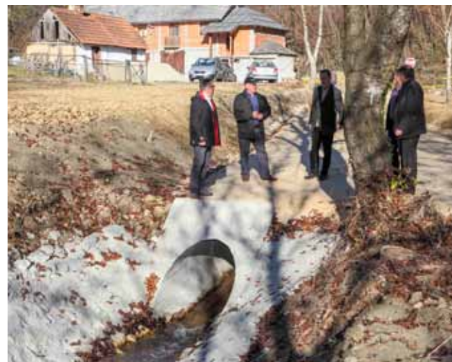
Divlja Željeznica „ukroćena“ je cijevima i premošćena čvrstom makadamskom cestom

jednim ulaganjima od strane Ministarstva gospodarstva i Grada Ivanca, dom je dobio vodu, struju, nove sanitarne čvorove i stolariju, uvedeno je plinsko grijanje, uređena je fasada pa se već sada vidi da će ovdašnji dom biti jedno od građevinski najljepših zdanja takve vrste na području grada Ivanca.