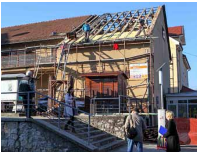
Kinodvorana dobiva novi krov s toplinskom izolacijom

KINO Radovi na rekonstrukciji i obnovi kinodvorane u Ivancu