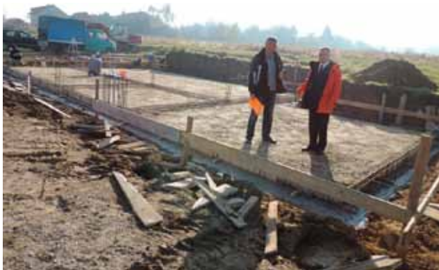
Temelji su položeni, nastavak slijedi iduće godine

KANIŽA Sagrađeni su temelji budućeg društvenog doma