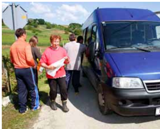
Donesena je nova Odluka o pokretnim trgovinama (ilustracija)