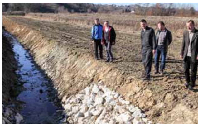
Mještani su zadovoljni kvalitetom uređenja Vinskog potoka i okolnih kanala

– Zbog nevolja koje je Vinski potok prouzročio u svibnju ove godine, kad se razlio i poplavo dvorišta i gospodarske objekte građana, ovaj smo interventni zahvat dogovarali s Ispostavom Hrvatskih voda u Varaždinu i drago mi je vidjeti da je ovdje obavljen jako dobar posao.