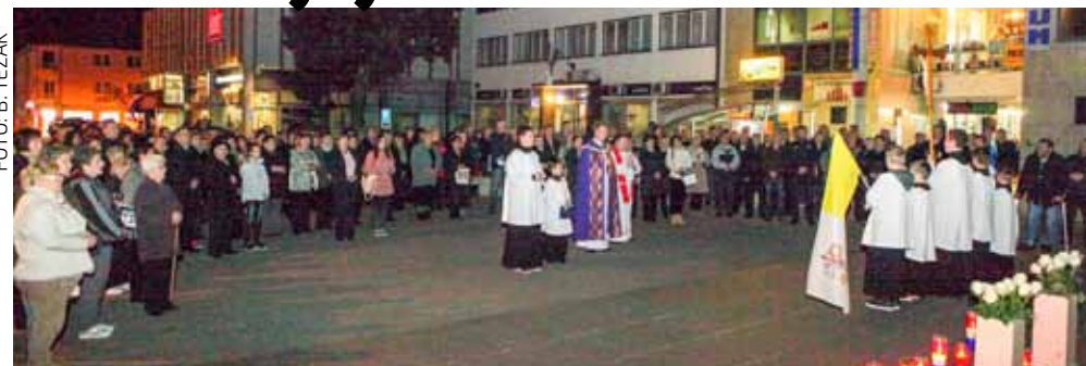
Molitva pred spomenikom poginulim ivanečkim braniteljima

U utorak, 17. studenog, i građani Ivanca s pijetetom su odali počast Vukovaru, gradu koji je postao simbol otpora, velikog stradanja i žrtve te paradigma prkosa i borbe našeg naroda za slobodnu i neovisnu državu. Obilježavanje Dana sjećanja na Vukovar počelo je misom koju je u župnoj crkvi Sv. Marije Magdalene predvodio župnik vlč. Zoran Gložinić. Nakon mise, brojni vjernici u procesiji su krenuli prema