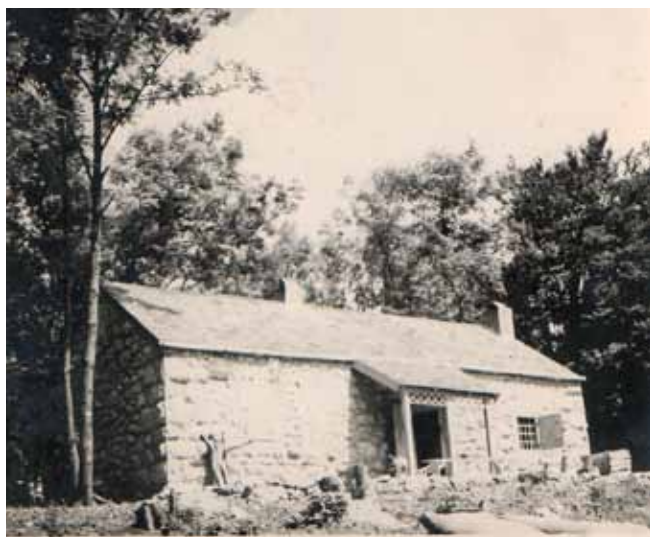
Planinarski dom na Ivančici (Franjo Hafner)

U tom kontekstu osjećam potrebu da posebno istaknem osobe koje su uvelike zaslužne za spas brojnih povijesnih