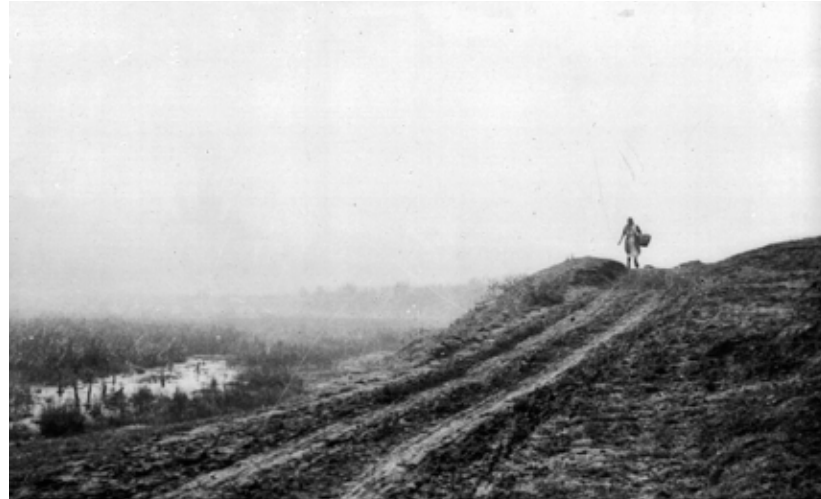
Siromaštvo: U Zagorju je više od 2.000 obitelji živjelo na posjedima od pola jutra zemlje

Pitanje kolonizacije bilo je teško tehničko pitanje. Međutim, prva je na red za