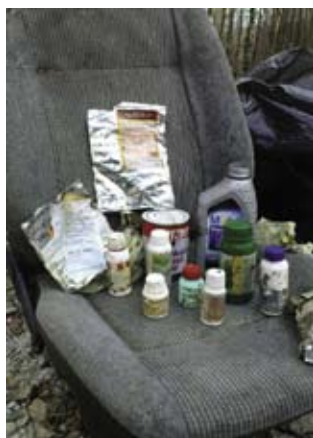
Ove otrove preostale od prskanja netko je bacio u potok ispod Žganog vina

i vatrogasci i druge udruge iz Ivanca i susjednih mjesta, speleolozi, šumarska savjetodavna služba, Gorska služba spašavanja, osnovne i Srednja škola, gravitirajući mjesni odbori, a