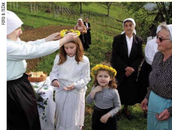
Vjenčići od livadna cvijeća u kosi djevojčica

Ne želeći čekati komunalac da skupljeno smeće odveze, lovci su otpad natrpali u traktore i sami ga prevezli na smetlište. (ljr)