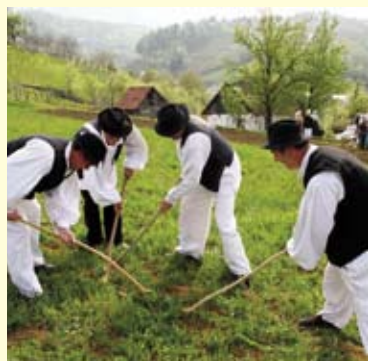
Štapovima udri po gici!

- To je drevna igra kojom su se nekad momci bavljali na pašnjacima. Drvenu „loptu“, oblikovanu od odebljala dijela starog čokota, ganjali su štapovima – rekla je glasnogovornica Maske Vesna Štruklec. Mukarci su potom malim nožićima, „federmeresima“, prionuli izradi rogova od kore