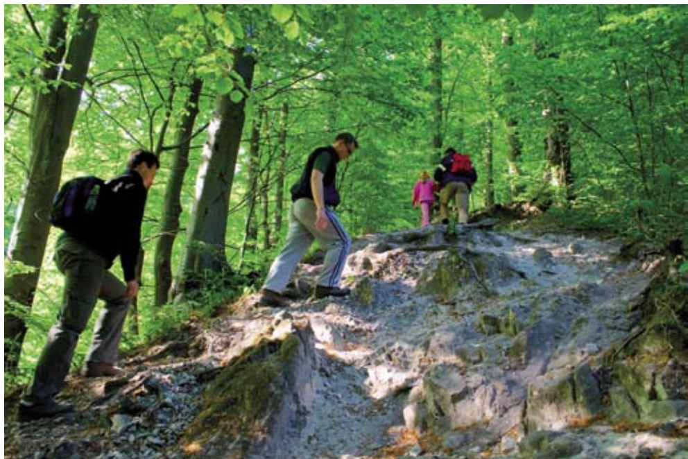
U spas Ivančice pozvani su svi koji „dišu“ zeleno

Dakako, na pridruživanje Zelenoj akciji bit će pozvani