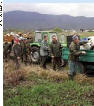
stičnih kanti i drugog smeća.

U akciji čišćenja okoliša, što je provode svakog proljeća, članovi ivanečkog Lovačkog društva Jelen u nedjelju su, 11. travnja, od krupnog otpada očistili okoliš željezničke postaje u Kuljevčici i Lovačke kuće u Tiglinu. U akciju što se tradicionalno provodi pod motom „Lovci i okoliš“, tridesetak sudionika iz grmlja je i vrbika izvuklo više desetaka automobilskih guma, odbačenih hladnjaka i štednjaka, auto-stakala, pla-