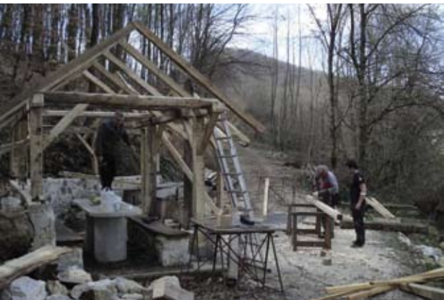
To je entuzijizam! Gradnja nadstrešnice kod izvora Cukovca