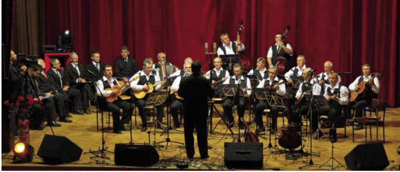
Godišnji koncert Itasovih tamburaša

Nakon pjesničkog sijela u Ivancu, svi sudionici autobusom su krenuli prema vrhu planine. Ekološku poruku u stihovima svijetu su ponovno uputili s izvorišta Žgano vino, dok je središnji pjesnički susret priređen na vrhu Ivančice. I ove godine pridružili su mu se i članovi neformalne skupine Ivanečki pjesnički krug.(ljr)