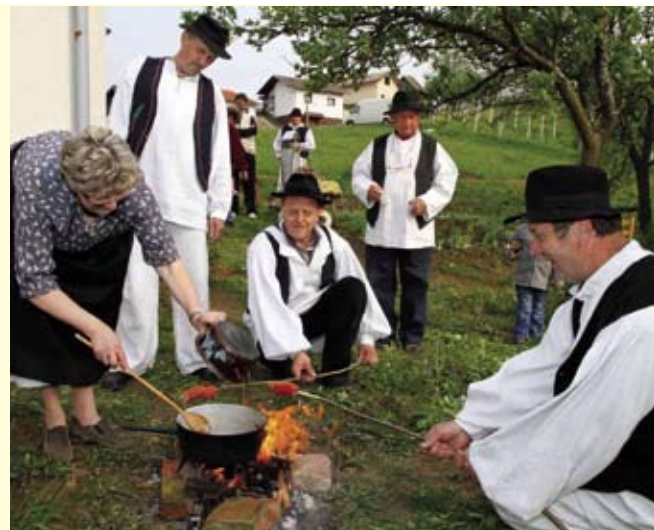
Kako prija cvrtje, jaja pečena na domaćoj kosanoj masti...

Da sve bude veselije, dečki su na šibama iznad vatre okrenuli i jeger. (ljr)