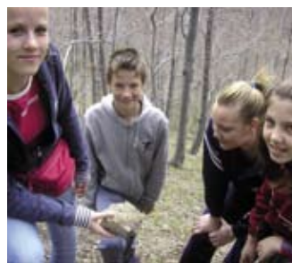
Djeca su naučila prepoznati lavu i minerale

Djeca je najzanimljivije bilo tražiti narančaste kristale. Va-