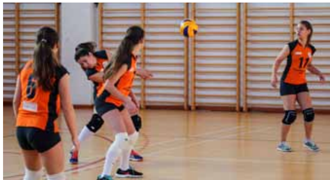
Mlade ivanečke odbojkašice na utakmici s Centrometalom