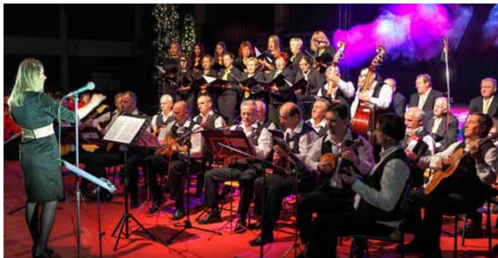
Zbor KUD-a R. Rajter i tamburaši KUD-a Itas

Nastupila su sva društva koja „nose“ kulturni život Ivanca