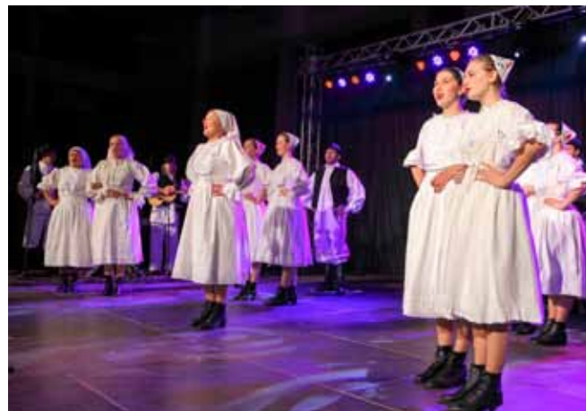
Sjajni folklorasi KUD-a Salinovec

KONCERT U prepunoj srednjoškolskoj dvorani u Ivancu