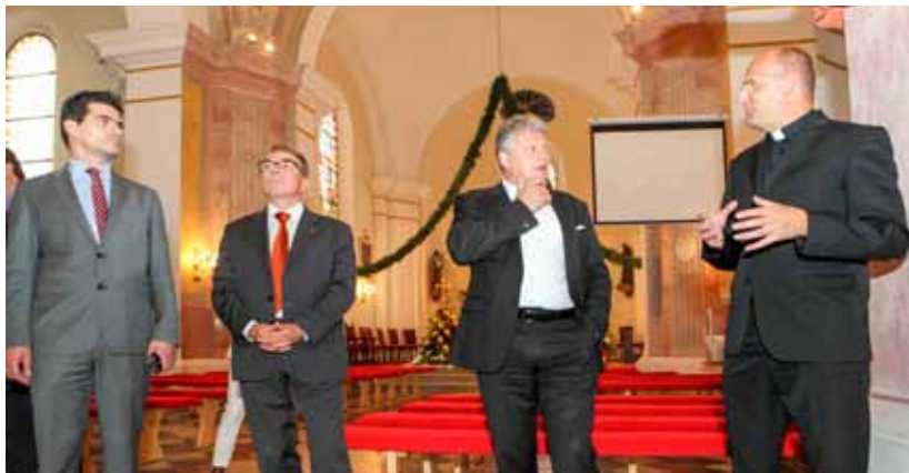
U tri godine u Ivanu su bila dva ministra kulture i pomoćnik ministrice kulture

–U proračunu su planirane pomoći od 6,4 milijuna kuna za kapitalne projekte upravo iz EU fondova. Bez obzira na to hoćemo li ih uspeti realizirati ili ne, Grad ih u proračunu mora planirati. Ukoliko sredstva iz EU fondova ne uspijemo privući, proračun će biti manji, što je i logično. No, moramo biti optimisti i vjerovati da ćemo u tome uspeti – poručio je Batinić te naglasio da je proračun za 2016. planiran s daleko više pažnje nego ikoli dosad i to je vidljivo iz pažljivijeg uvida u prihode i rashode.