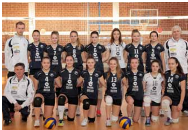
Prva ekipa ŽOK-a Ivanec