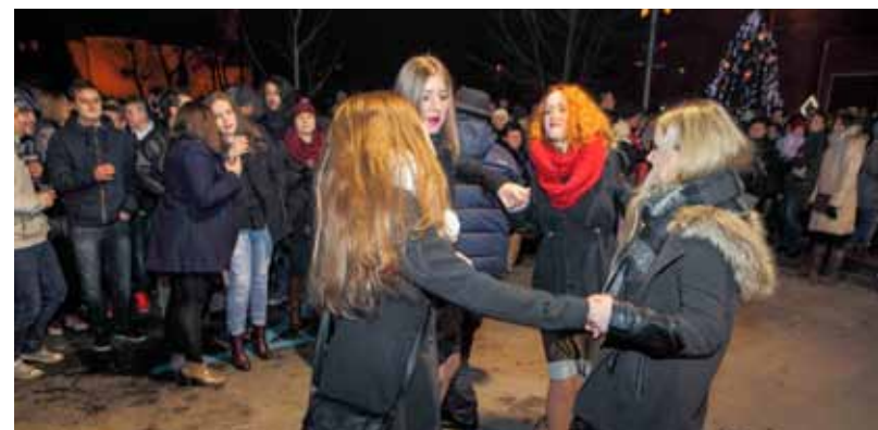
Nema zime dok mladost dočekuje Novu!