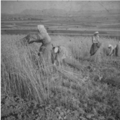
Zbog straha od gladi, na malim posjedima uglavnom su se sijale žitarice (ilustracija)

Određene grupacije rješavanje problema prenapučenosti Zagorja vidjele su u kolonizaciji koja bi se trebala urediti agrarnom reformom, međutim, Zagorci su općenito veoma teško trajno napuštali svoj rodni kraj i radije su se izlagali strukturalnoj (skrivenoj) podzaposlenosti. Radi se o tome da je previše ljudi gospodarski obrađivalo mali zemljišni posjed pa su stoga radili manje, ali su dobivali i manji prihod. Umjesto kolonizacije i ponudeno prijedloga ministarske uredbe o kolonizaciji Zagoraca u Makedoniju i Staru Srbiju, krajeve koji hrvatski seljak upoće nije poznavao, radije su prihvaćali privremene poslove u Zagrebu.