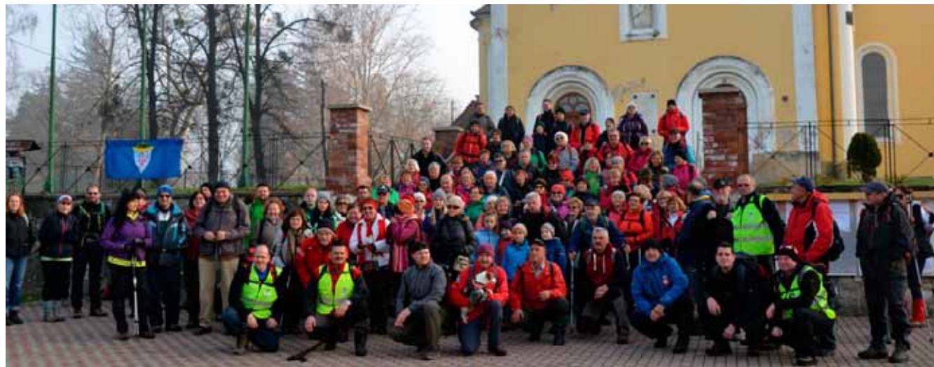
Ovo je tek dio od ukupno 250 planinara i izletnika koji su pješačili Planinarskom obilaznicom