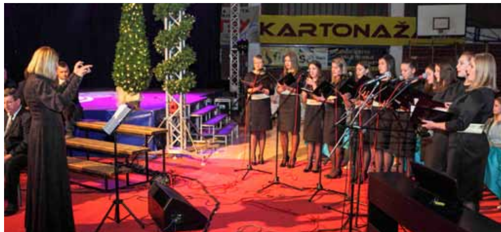
Vokalni ansambl Sakcinski i ovoga je puta oduševio publiku