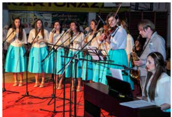
Kariope u božićnom ozračju