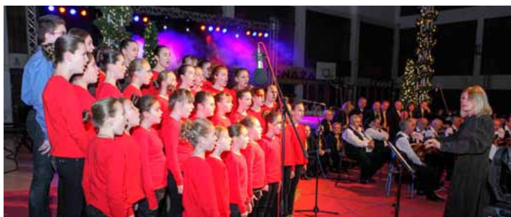
Čestitke odličnom Pjevačkom zboru OŠ Ivanec

Koncert je završio zajedničkom izvedbom Tihe noći i Narodi nam se te Radetzky maršem. Svi sudionici koncerta potom su se neformalno nastavili družiti u predvorju Srednje škole Ivanec gdje im se, oduševljen koncertom i visokom kvalitativnom i umjetničkom razinom programa, obratio gradonačelnik Milorad Batinić te im uputio čestitke. (lj)