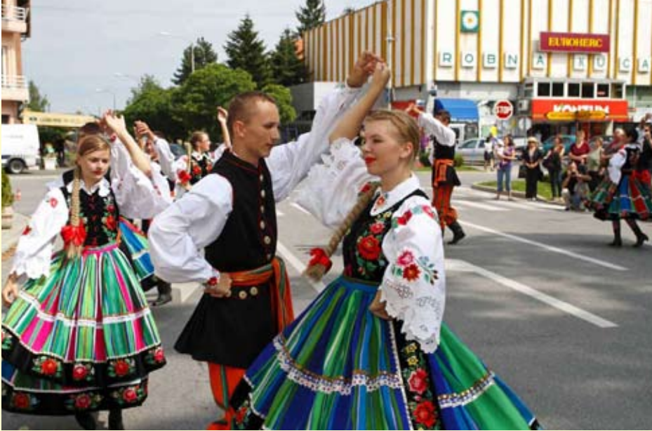
Gosti iz Poljske ispred Gradske vijećnice izveli su atraktivan plesni program

Natjecanje se pretvorilo u pravi društveni događaj za mještane Margečana, Željeznice, Gačica i okolice