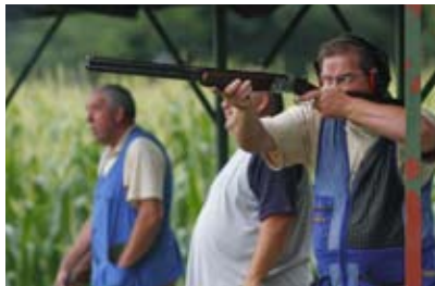
Više od 200 lovaca natjecalo se u gađanju letećih meta

- U natjecanjima je sudjelovalo više od 200 lovaca. U ekipnom poretku prvi su lovci LD-a Zelendvor, drugi je Lug iz Šašinovca kod Sesveta, a treće mjesto osvojili su članovi LD-a Vepar iz Ljubešćice. I u pojedinačnoj konkurenciji pehare su osvojili gostujući lovci – kazao je Grdan. Pohvale