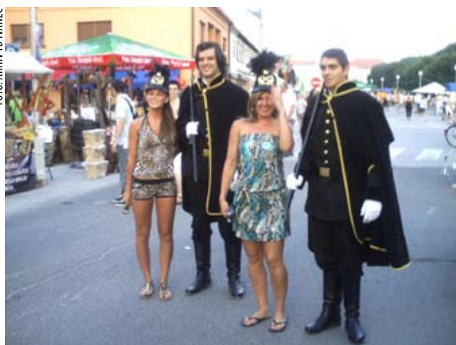
Članovi Rudarske čete u društvu koprivničkih ljepotica