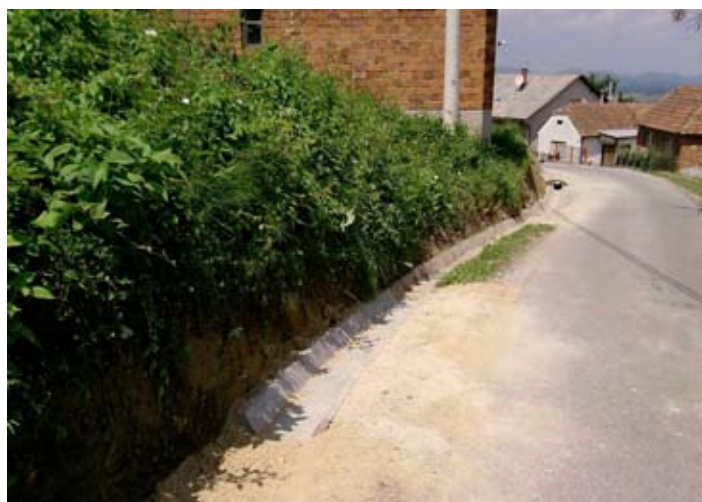
Uređena cesta kroz Vitešinec

NOVI ASFALT Asfaltirano je 1,5 kilometara ceste od Salinovca do Vargovca