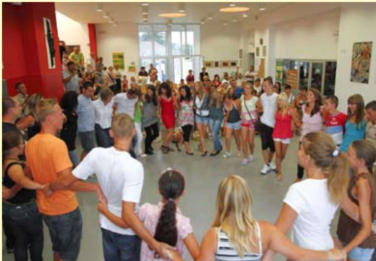
Poljski folklorši spontano su zaplesali sa svojim domaćinima u salinovečkoj školi

šćicevu mlinu, Trakošćanu i Lepoglavi, a do kasno u noć družili su se i plesali u Ribičkom domu.