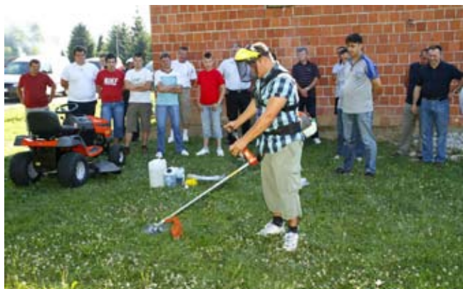
Kosilice i trimere servisirat će Ivkom, a troškove goriva i održavanja financirat će Grad Ivanec