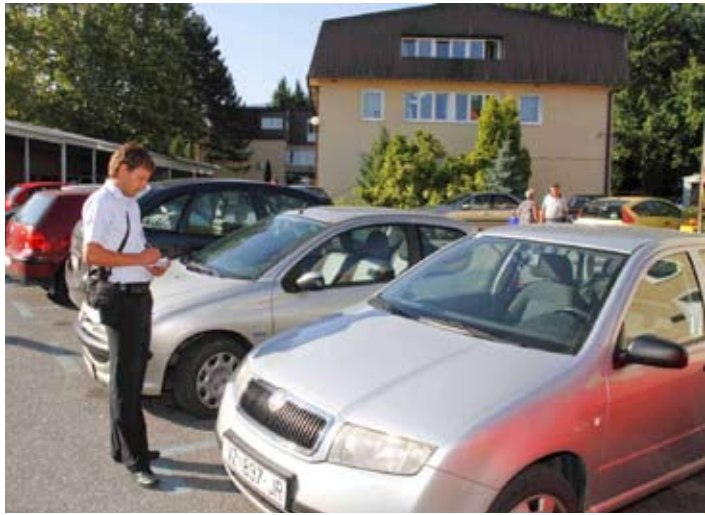
Vozači moraju početi poštivati prometne znakove i pravila

Za razliku od kontrolora parkiranja (te poslove obavlja ju djelatnici Ivkomove Radne jedinice Parking) koji vode brigu o naplati parkiranja, posao prometnog redara je kontrola prometa u mirovanju. Riječ je o vozilima nepropisno parkiranim na pješačkim prijelazima, na kolnim ulazima, raskrižjima, na mjestima za invalide i drugdje. U slučaju potrebe, obavlja i regulaciju prometa u gradu. Šmerek posao prometnog redara obavlja na pola radnog vremena, dok u drugoj polovici radi kao kontrolor parkiranja, a