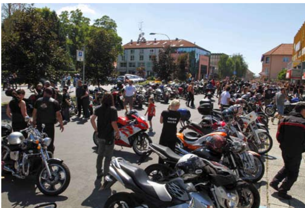
Motociklisti su se okupili na ivanečkoj špici