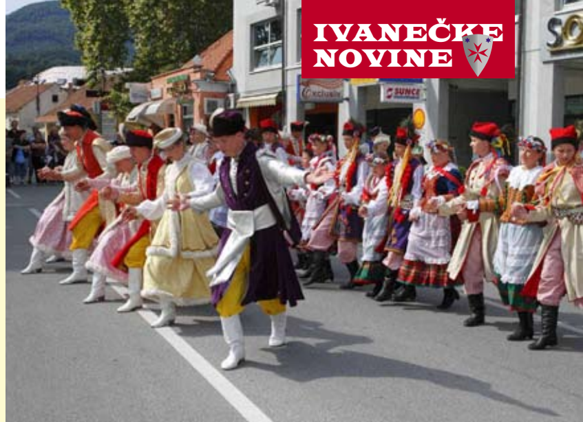
Ivančani su uživali u raskošnim nošnjama gostiju iz Soleca