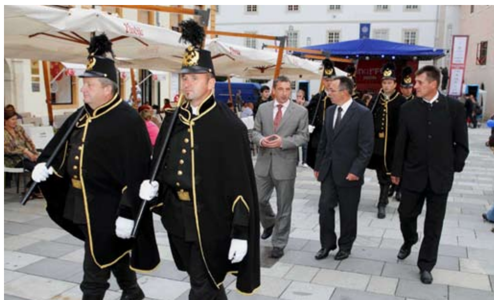
Španciranje u društvu članova Rudarske čete