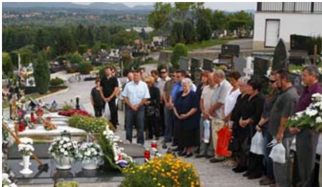
Molitva kod grobova poginulih

oslobodena naša domovina – naglasio je Bračko, kazavši da okupljanjem odaju počast svim poginulim braniteljima, kao i onima koji su umrli u međuvremenu.