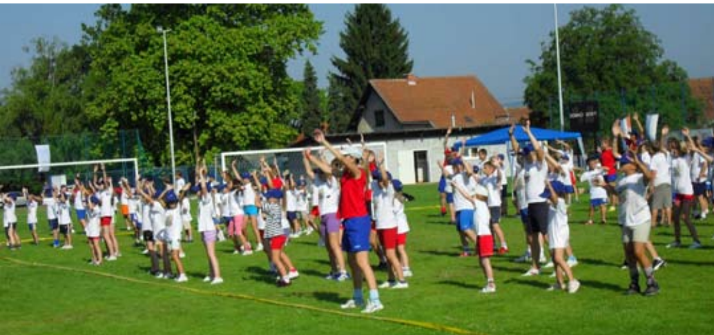
Zabavnu školu nogometa Grad Ivanec pomogao je s 30.000 kuna

Predzadnjeg dana na iva-nečkom igralištu za sve sudi-onike održan je Bombon cup, jedan od najatraktivnijih sadr-žaja Otvorene zabavne škole nogometa. Dječaci i djevojčice usporedo su igrali nogomet na svih osam manjih igrališta, po sustavu tri na tri. Otvorena škola nogometa održana je pod pokroviteljstvom Grada Ivanca, koji je njeno održavanje pomo-gao s 30.000 kuna.(nn)