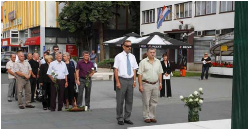
Bijele ruže za poginule branitelje

- Naša je obveza da se svake godine prisjetimo akcije u kojoj je