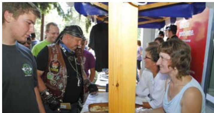
Kontrast: suvremenost i tradicija