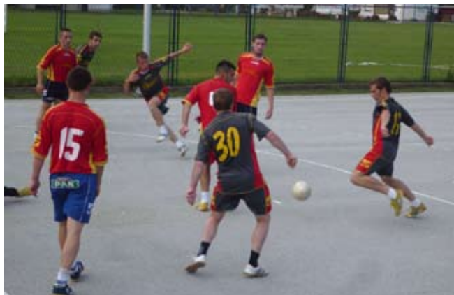
Na turniru je snage ogledalo 11 ekipa

Finalna utakmica odigrana je poslije ponoći pred oko 250 gledatelja i igrača, između dvi-ju najjačih ekipa, CB-a Gool (Ivanec) i Eurotransporta Ko-stanjevec (Hrašćica). Pobjedi-la je momčad Eurotransporta Kostonjevec s 2:0. U utakmici za treće mjesto Elkom je svla-dao ekipu Hudek trgovtransa