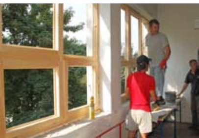
U učionicama i hodnicima stavljena je nova stolarija

Na žalost, problematičan je i krov novog dijela škole i sportske dvorane, a to će biti predmet budućih ulaganja. Budući da je riječ o zahvatima koja se procjenjuju na tri do četiri milijuna kuna, oni će se izvoditi po etapama. (ljr)