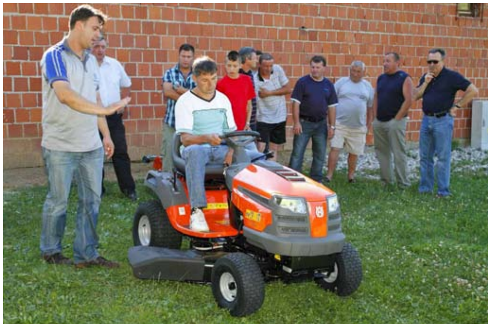
Kosilica je stigla i u Lukavec