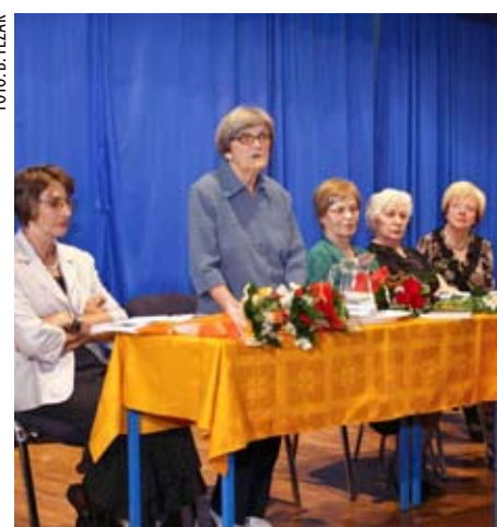
Na svečanosti predstavljanja Oživljenih sjećanja u ivanečkoj Srednjoj školi

Svečanost predstavljanja priredili su Grad Ivanec i Gradska knjižnica i čitaonica Gustav Krklec. (ljr)