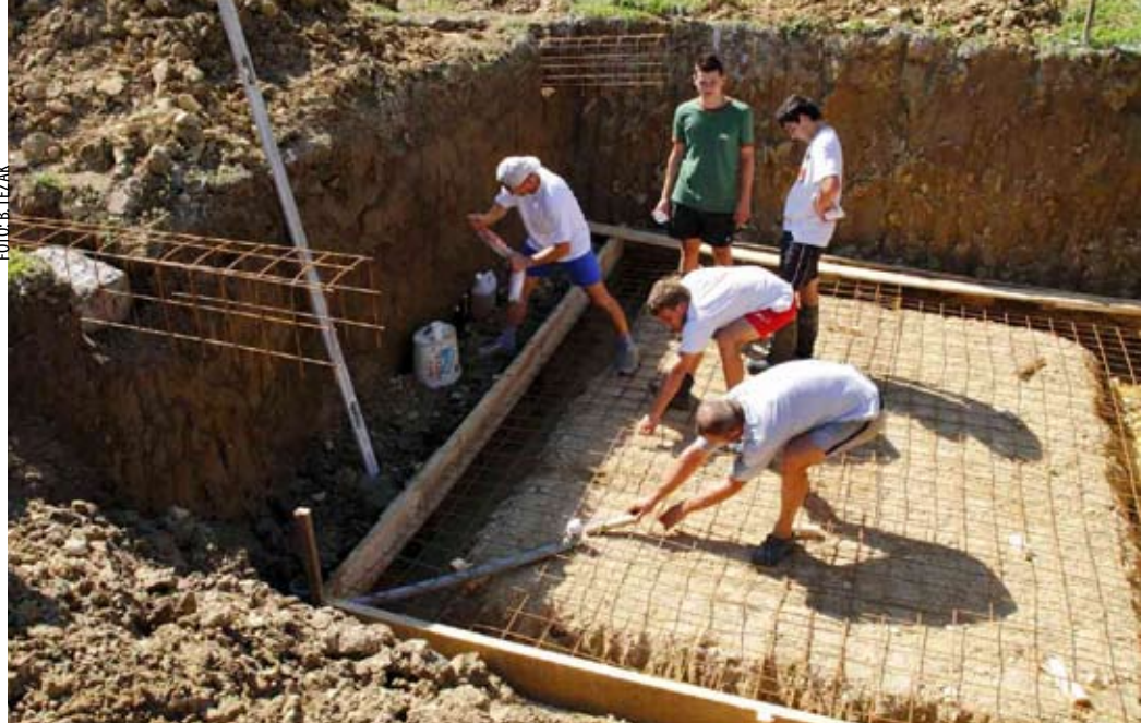
Mještani Bedenca pomažu u gradnji etnokuće

ETNOKUĆA Počela je gradnja etnokuće u Bedencu