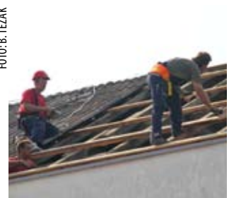
Umjesto salonitnih ploča - novi, limeni krov