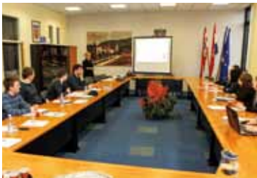
Sudionici radionice učili su i o tome kako pregovarati o - cijeni

FINANCIAL TIMES Gradu Ivanču u Cannesu uručena pobjednička nagrada u kategoriji europskih mikro gradova (do 100.000 stanovnika)