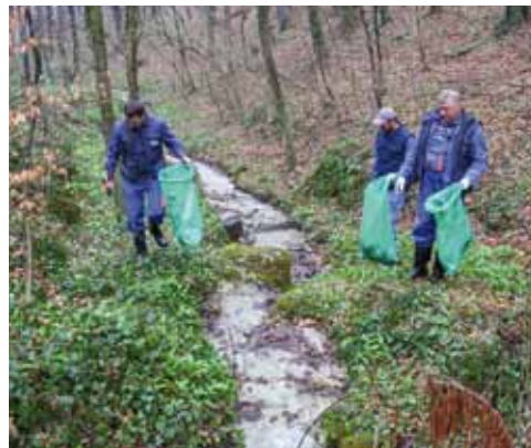
Radnici Ivkoma od otpada su očistili okoliš izvorišta