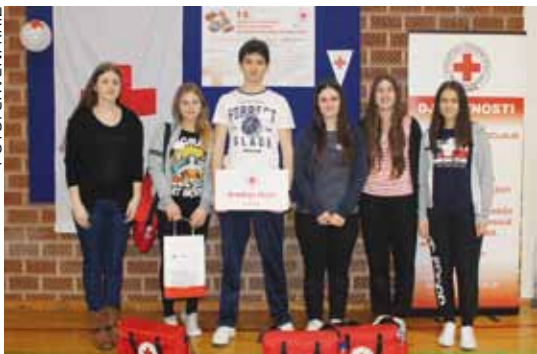
Na natjecanju je sudjelovala i ekipa Područne škole Salinovec

PRVA POMOĆ Na 14. gradskom natjecanju ekipa prve pomoći