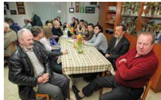
Zbor će ove godine sustavnije raditi kako bi izborio nastup na državnoj smotri