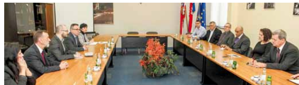
Na sastanku s gospodarstvenicima u Gradskoj vijećnici