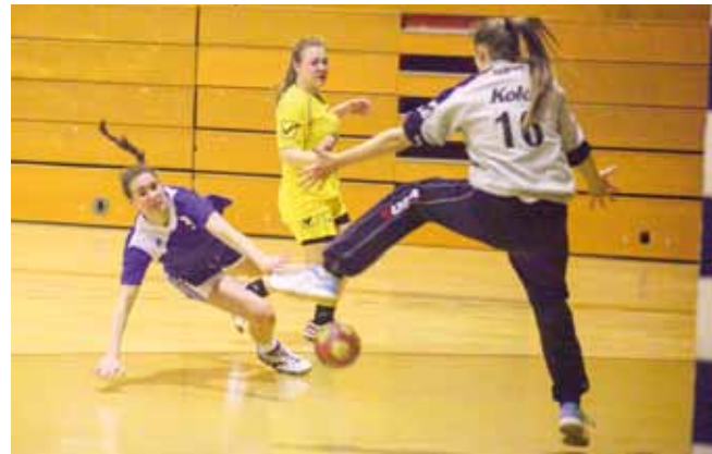
Ivanečke rukometašice igraju s promjenljivim uspjehom