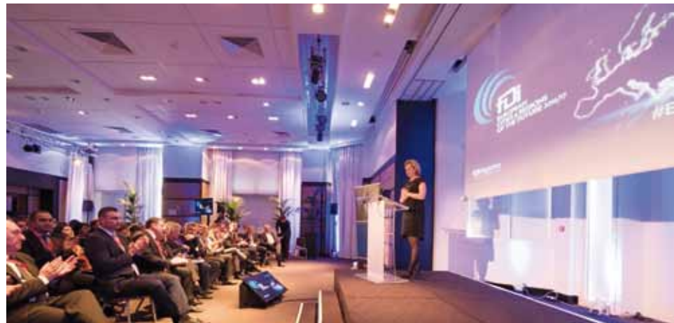
Proглаšenje najboljih u Europi prilika je za vrhunsku promociju i stoga ga ne propuštaju ni predstavnici europskih megalopolisa (u prvom redu je i gradonačelnik Kijeva Vitalij Kličko)