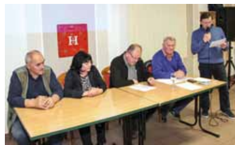
I ove godine Peharček će provesti ocjenjivanje kvalitete vina ivanečkih podrumara

pojedine projekte. Iako svjesni problema s kroničnim pomanjkanjem prostora za udruge u Ivancu, naglasili su da će u suradnji s Gradom pokušati naći rješenje za prijeok potreban radni prostor. Vinogradari će, nadalje, i ove godine provesti tradicionalno ocjenjivanje kvalitete vina ivanečkog vinogorja, a poticati će i izlaganje domaćih vina u drugim županijama te u Sloveniji. Također, najavili su i skori edukacijski izlet u Baranju i Kneževu Vinograde te aktivno uključivanje u proslavu Dana grada, u Gospodarski sajam i Ivanečke rudarske dane.