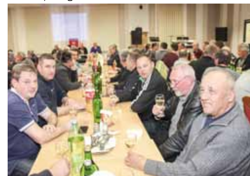
Ivanečka vina sve su bolja pa udruga apelira da ih proizvođači testiraju izlaganjem u drugim županijama

Kao otegotnu okolnost u svom radu, vinogradari su naglasili nepostojanje vlastitog prostora u kojem bi se mogli družiti, održavati sastanke i edukacije, organizirati razne radionice te realizirati