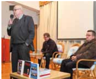
Predavanje prof. dr. Z. Tomca organizirano je u sklopu Plana i programa ivanečkih braniteljskih udruga

Ugledni hrvatski politolog i pisac, potpredsjednik Vlade nacionalnog jedinstva 1991. i 1992. godine prof. dr. Zdravko Tomac održao je u amfiteatru Srednje škole tribinu pod nazivom "Memoari." Govorio je o vremenima stvaranja hrvatske države početkom 90-tih, o stanju u današnjem društvu s naglaskom na položaj branitelja te o drugim temama.