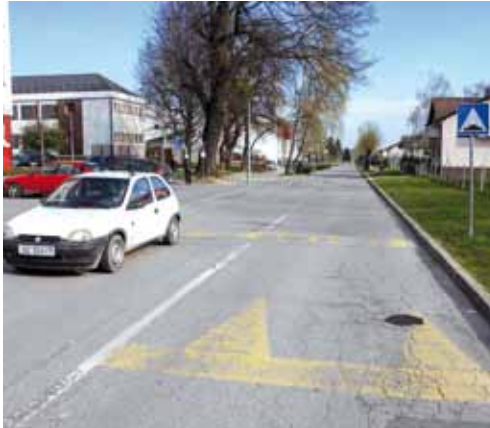
Jedan od ovogodišnjih prioriteta - gradnja oborinske kanalizacije u Kumićičevoj ulici