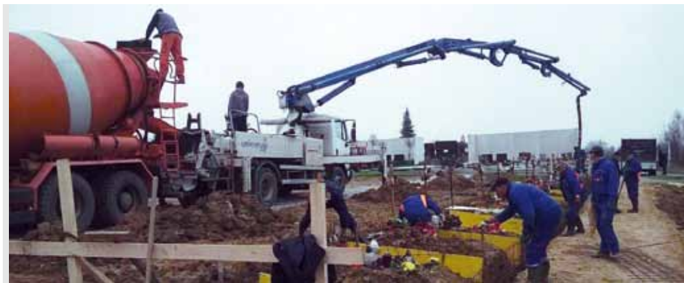
GROBLJE Radovi na proširenju novog groblja u Ivanu

M. Batinić: Grad je izradio kompletnu projektnu dokumentaciju i studiju utjecaja zahvata na okoliš. Daljnji koraci ovise o Hrvatskim cestama kojima smo krajem prošle godine predali cjelokupnu dokumentaciju. Oni trebaju raspisati natječaj, a mi se nadamo što skorijem odabiru izvođača i početku radova.