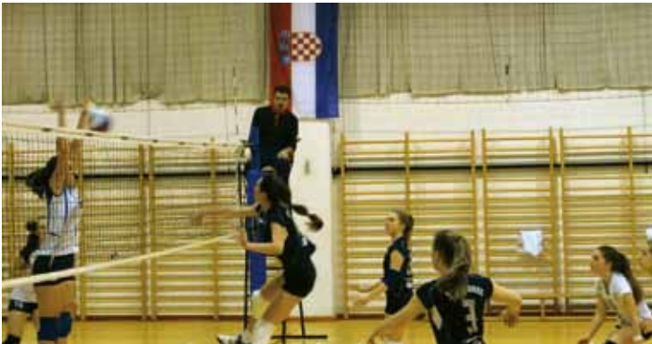
ŽOK Ivanec igra za poredak od sedmog do dvanaestog mjesta

Konačnih 3:1 domaćoj je momčadi otežalo situaciju, gurnuvši je na 13. mjesto prvenstvene tablice s 11 osvojenih bodova. (nn)