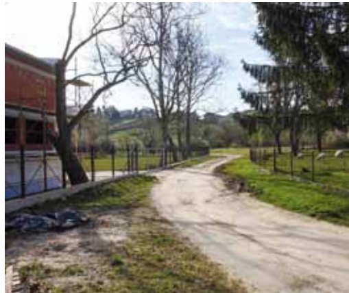
Ove godine sagradit će se makadamski spoj između Varaždinske ulice i Jezerskog puta