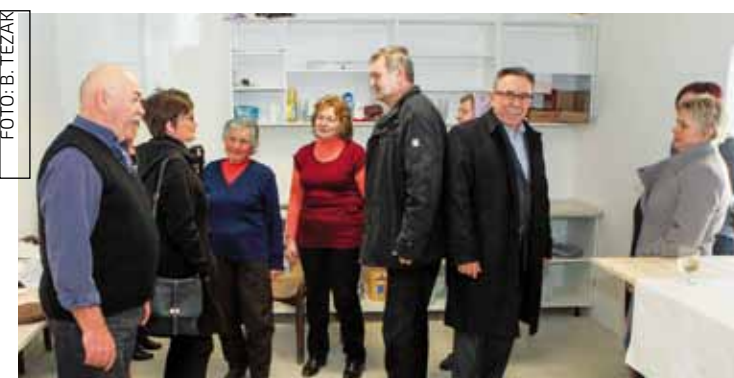
Gradski čelnici razgledali su i novu kuhinju društvenog doma

Budući da je objekt bio u visokoj fazi izgrađenosti i da je bilo šteta što stoji neiskorišten, „kormilo“ njegova dovršetka preuzeo je Grad. Nakon što je legalizirao objekt, projekt njegove energetske obnove prijavio je Ministarstvu gospodarstva te za njegovu realizaciju povukao 81.000 kuna.