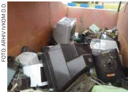
U krugu Ivkoma u Ivancu svi građani mogu nesmetano odložiti elektronički otpad iz svojih kućanstava

Osim opasnih komponenti, EE otpad sadrži plastiku i metale koji, kada se oporabe, mogu biti korišteni kao sekundarne sirovine u proizvodnji novih proizvoda. Svi oni dijelovi koji se ne mogu iskoristiti zbrinjavaju se na ekološki prihvatljiv način. (Nastavak u idućem broju: Kako zbrinuti električni i elektronički otpad?)