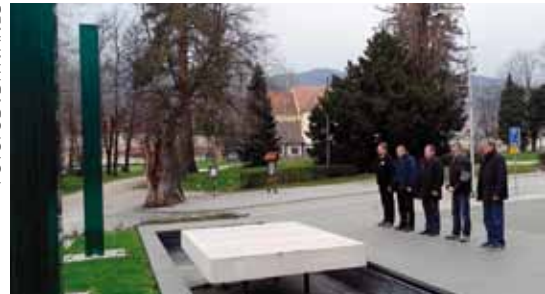
iz PP Ivanec, pripadnici 2. bojne 104. brigade HV te 7. gardijske brigade Puma. U članstvu ogranka bilo je

Obilježavajući 18. obljetnicu osnivanja UDVDR-a – Ogranka Ivanec, članovi predsjedništva su kod spomen obilježja i kod središnjeg križa na gradskom groblju odali počast poginulim i umrlim braniteljima. Prisjetili su se osnivačke skupštine održane 28. ožujka 1998. te na ključnu ulogu u osnivanju ogranka koju su imali branitelji