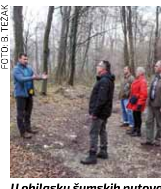
U obilasku šumskih putova

S obzirom na to da se na području između Ivanca i Prigorca nalazi velik kompleks šuma te da je gospodarenje njima uvelike otežano zbog neprohodnosti ili teško prohodnih putova, Grad Ivanec