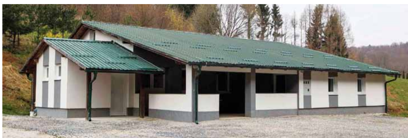
Društveni dom u Željeznici jedno je od najljepših takvih zdanja na gradskom području Ivanca

Projektirani cjevovod ukupno je dug 3.900 metara. Projektna dokumentacija već je izrađena, a tvrtka je predala i zahtjev za izdavanje građevinske dozvole. (ljr)