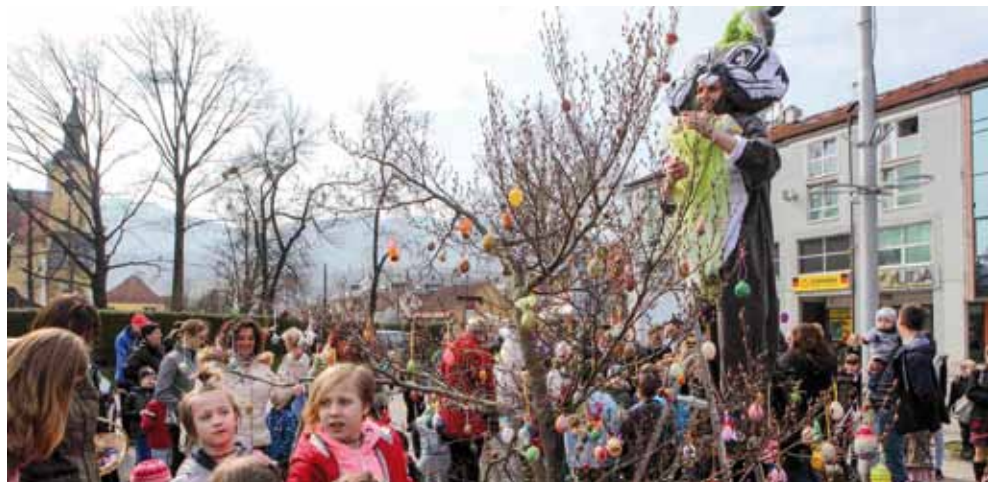
VESELI USKRS Na ivanečkoj gradskoj špici S Uskrnim zecom kićenje stabla je veselije