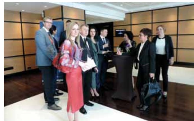
Uoči glavne svečanosti, susret s članovima tima Grada Zagreba i Jastrebarskog

S obzirom na to da su strategije analizirali vrhunski ekonomski analitičari specijalizirani za vrednovanje svega što se odnosi na direktna strana ulaganja, očito je da je ivanečki model prepoznat i izdvojen na prvo mjesto kao primjer na koji se u izrazito snažnoj internacionalnoj kompeticiji