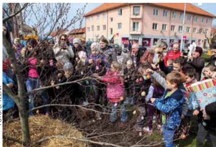
Uz brojne mališane, stalbce su pisanicama ukrasili i članovi više ivanečkih udruga