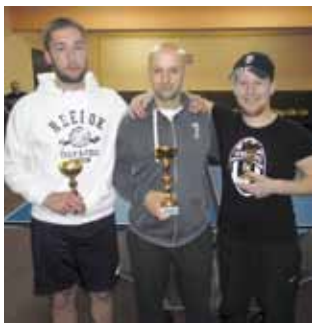
Najbolji tenisači Lančica i Knapića