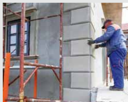
Izvođenje štukatura na staroj školi

No, time će završiti samo prvi dio projekta gradnje i uređenja Muzeja planinarstva. Naime, u daljnjoj fazi predviđeno je proširenje muzejskog prostora gradnjom posve novog di-