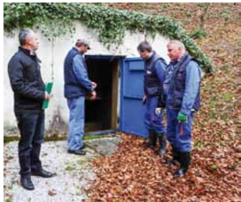
Žgano vino – prvorazredna voda iz „srca“ Ivančice

–Danas se Žgano vino sastoji od izvorišta s kaptažom kapaciteta 15 litara vode u sekundi (na nadmorskoj visini 430 metara) i dobavnog cjevovoda kojim se voda doprema u vodu, dospremnik Pahinsko, na 300 metara nadmorske visine. Iz tog vodospremnika voda do središta potrošnje u Malezovoj ulici teče cjevovodom profila 150 milimetara. Međutim, postojeći vodovod je dotrajavao i na njemu se često događaju kvarovi, puknuća i propuštanja slojeva, zbog čega dolazi do velikih gubitaka vode – ističe tehnički direktor Ivkom voda Ranko Zbodulja.