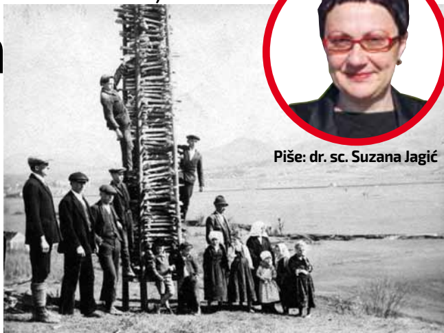
Fotografija vuzelnice iz Bedenca u Etnografskom muzeju u Zagrebu

vuzelnice neki su na kraju okitili nakitom od „pantlika“ i šarenog