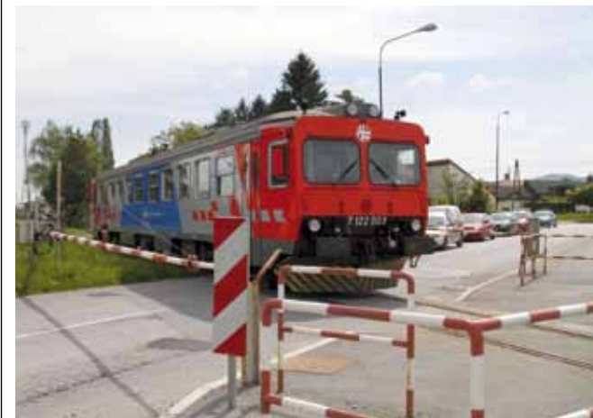
Prvorazredni sigurnosni problem: U kasnim noćnim satima brani na putnom prijelazu u Nazorovoj se ne spuštaju

Također, Grad je apelirao da se, ako ništa drugo, kritični putni prijelazi kod željezničkog stajališta u Kuljevičici, Cerju Tužnom i u Stažnjecima barem opreme uređajima za davanje svjetlosnih i