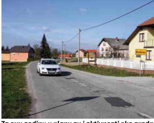
Za ovu godinu u planu su i aktivnosti oko gradnje sanitarne kanalizacije u Bedencu, čeka se otvaranje EU fonda za ruralni razvoj