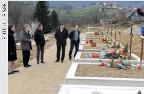
Na proširenom dijelu prednost će se dati uređenju većeg broja mjesta namijenjenih zemljanim ukopima

Proširenje na susjedne parcele bilo je potrebno zato jer je na novouređenom dijelu groblja ponestalo mjesta za ukope pokojnika u tzv. slijepe grobnice, odnosno, u grobna mjesta s okvirima namijenjena zemljanim ukopima. Poznato je da su u prvoj fazi na novom dijelu groblja bile sagrađene 63 grobnice i 33 mjesta za zemljane ukope. I dok klasičnih grobnica ima još na raspolaganju, kritična su bila mjesta za zemljane ukope, koja građani više kupuju zato jer su im jeftinija pa će se stoga u ovoj fazi proširenja prednost dati uređenju većeg broja upravo takvih mjesta.