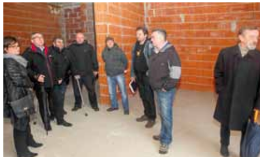
Vlastitim snagama Grad Ivanec i branitelji kreću u uređenje prostora u zgradi u ivanečkoj Gajevoj ulici

Pritom je naglašeno da je itekako dobrodošla