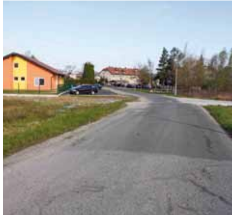
Već su pokrenute aktivnosti oko gradnje nogostupa u ivanečkoj Rudarskoj ulici