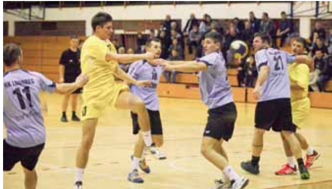
Rukometaši u zadnje su četiri utakmice izborili dvije pobjede