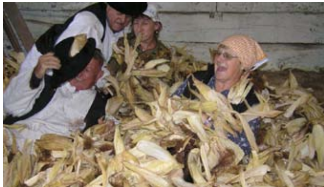
Veselo u komušinama

u sjećanjima nas, starijih – uzdahnulo je Geček. Vjerojatno bi i posve pali u zaborav, da ih već godinama ne obnavlja čuvar ivanečkih narodnih običaja i navada, Društvo prijatelja narodnih običaja Maska. Ono je i ovoga listopada priredilo tradicionalnu trebitvu te djeci i mladima pokazali običaje koji su nekad pratili jesensku berbu kukuruza.