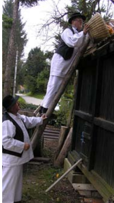
Plodove rada ruku čovječjih valja spremiti u stari kurušnjak

A cijela gostoljubiva obitelj Turčin učinila je sve da trebitva