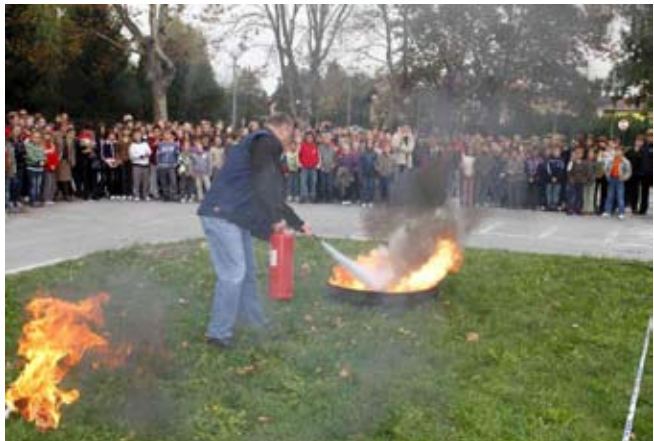
Vatrogasci su demonstrirali tehnike gašenja požara