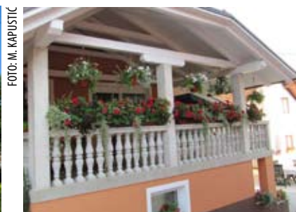
Nagrađeni balkon Vere Mendaš