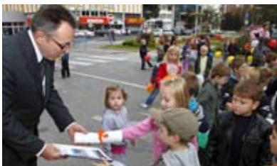
Zvezdice i Bubamare gradonačelniku su poklonili program Lijepi moj Ivnjec

se zaposleni u Gradskoj vijećnici i ustanovama u centru grada, zasvirala je i glazba s razglasa. A to je i bio cilj – da u povodu početka Dječjeg tje-