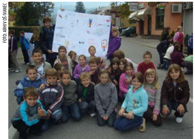
Osnovnoškolci su svoje želje i preokupacije prenijeli na plakate