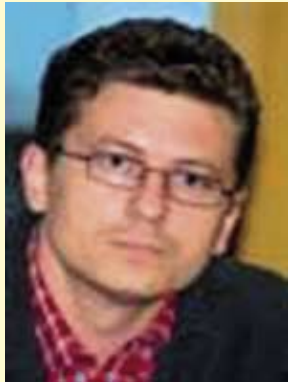
Piše: dr. sc. Dragutin Vincek, dipl.ing.agr., v. d. pročel- nika za poljoprivredu

Budući da njene sjemen- ke mogu preživjeti u zemlji i po nekoliko godina, a vrlo su otporne i na smrzavanje, vrlo ju je teško iskorijeniti. Usto, u cijeloj poljoprivrednoj strukturi došlo je do izrazitih promjena. Intenzivno i selek- tivno suzbijanje štetnika te prelazak s uporabe stajskog gnojiva na gnojnicu doveli su do narušavanja strukture tla. Tako su se stvorili dobri uvjeti za dalje širenje ambrozije, jer