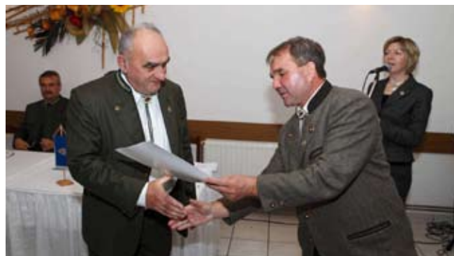
Priznanja zaslužnim lovcima