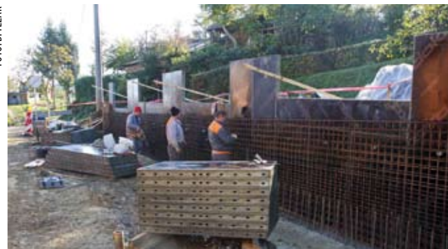
Duž cestovne dionice grade se potporni zidovi