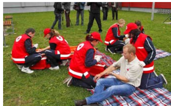
Na terenu su aktivne bile ekipe mladeži GD Crvenoga križa

Varaždina u suradnji s domaćinima detaljno analizirali.