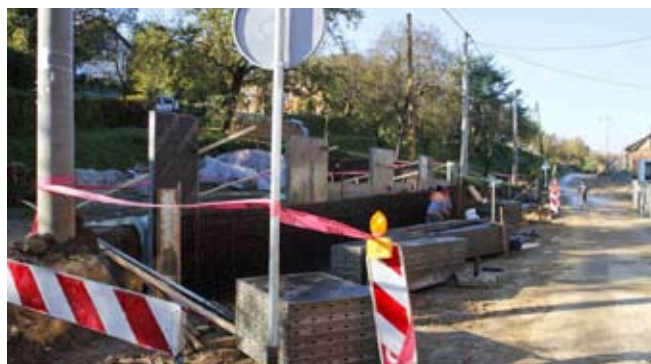
Radovi su složeni, na nekim mjestima treba micati stupove javne rasvjete

Radovi u Lančiću kapitalna su gradska investicija, vrijedna više od 863.000 kuna, a popola je financiraju Grad Ivanec i Županijska uprava za ceste. Što se tiče komunalne infrastrukture, komunalna tvrtka Ivkom još u lipnju ove godine rekonstruirala je vodovod od društvenoga doma u Lančiću do raskrižja za Knapić, a iduće godine na dijelu dionice postaviti će i novu kanalizaciju.(ljr)