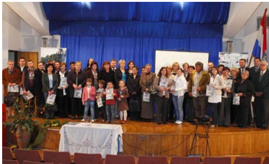
Nagrađeni sudionici ovogodišnje akcije Cvijet za ljepši grad 2010.