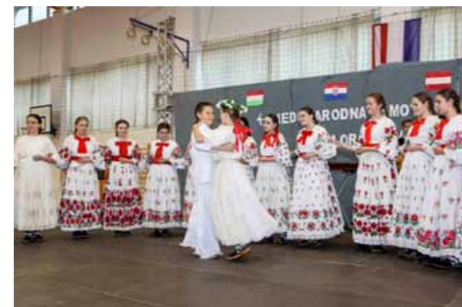
Bogatstvo nošnji, boja i narodnih običaja

ci iseljenih Hrvata iz Slavonije i Bosne, čuvaju tradiciju krajeva iz kojih su potekli njihovi očevi. Nakon glazbenog uvoda Vараždinske glazbene udruge, na bini su prvi nastupili mali folklori KUD-a Salinovec te koreografiom Teče, teče bistra voda ubrali buran aplauz publike. U nastavku su nastupili izvođači iz