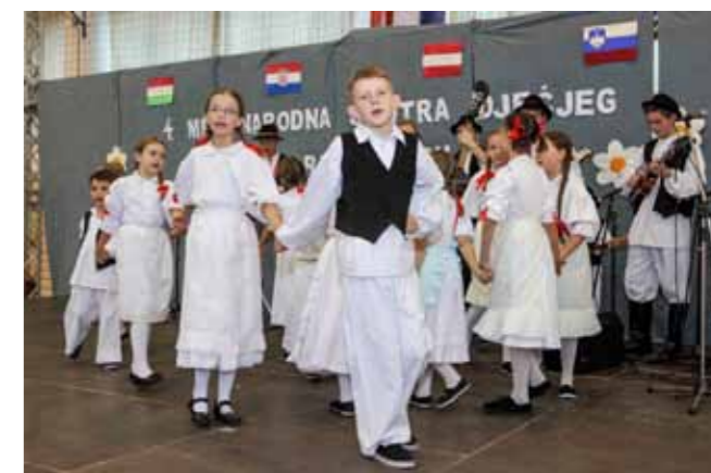
Nastup mladih folklorista KUD-a Salinovec