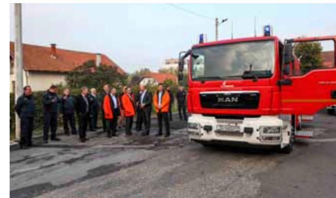
Neraspoloženje je veliko, vatrogasci smatraju da nije slučajno što se vozila sele u Dalmaciju i južnu Hrvatsku

Razumljivo je da ovakav postupak izazvao neraspoloženje u gradskoj upravi te ogorčio vodstvo i članove DVD-a Ivanec.