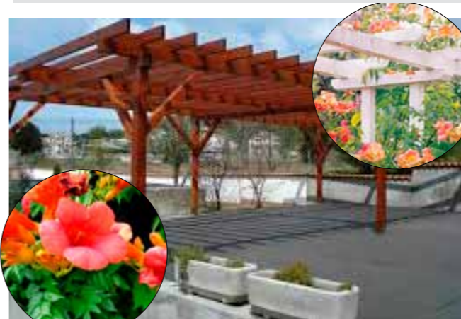
Pergole će krasiti raskošni cvjetovi klematisa, kozje krvi, jasmina i tekome

Pergole će se urediti na sljedećim mjestima: u Ulici Đure Arnolda – nasuprot zgradi kbr. 3 i kod DVD-a Ivanec; u Kumičićevoj ulici – između zgrada kbr. 1 i 3; u Šabanovoj ulici – između novog dječjeg igrališta i zgrade kbr. 3, između zgrade kbr. 8 i 13, dok po jedna pergola idu kod zgrade kbr. 1 – 5, zatim, kbr. 2, kbr. 3, kbr. 9, kbr. 11, kbr. 13 i kbr. 15. U Gajevoj ulici jedna će se pergola za smještaj kontejnera urediti nasuprot Udruge umirovljenika, druga će se podići na zelenoj površini kod zgrade kbr. 10, a treća će biti također na zelenoj površini kod zgrade kbr. 12. U Malezovoj ulici pergola će se urediti za potrebe stanara u zgradama od kbr. 14 do 20. (ljr)