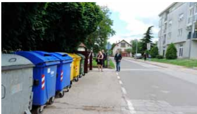
S obzirom na to da dio Gajeve ulice ove godine ide u rekonstrukciju, nađeno je rješenje i za smještaj pergole nasuprot Udruge umirovljenika

Sve navedeno osnova je novog gradskog projekta koji je inicirao gradonačelnik Milorad Batinić, a čiji su detalji utvrđeni u ponedjeljak, 16. svibnja, prilikom višesatnog obilaska terena, a u kojem su se pridružili i pročelnik