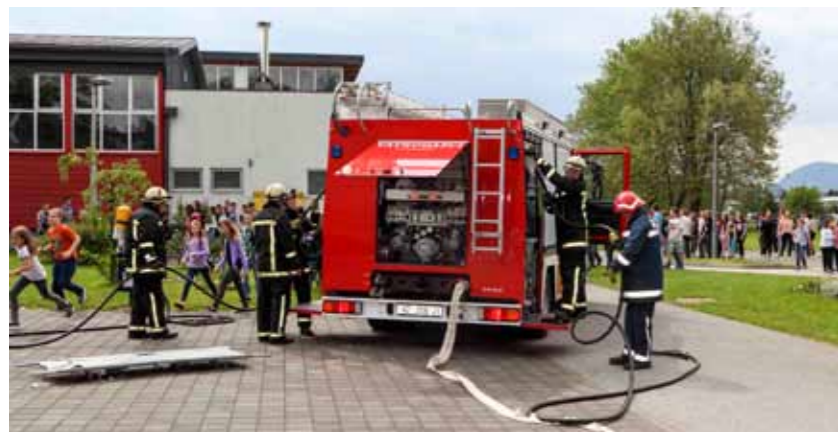
Vježba evakuacije u Osnovnoj školi Ivanec