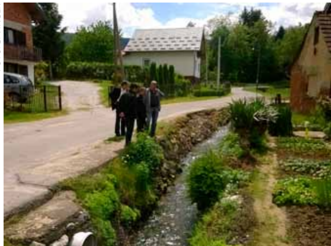
Potok Vukovec u Kaniži je „nagrizao“ županijsku cestu

VODOTOCI Predstavnici Grada Ivanca, Hrvatskih voda i Hidroinga u Kaniži i Ivanečkoj Željeznici