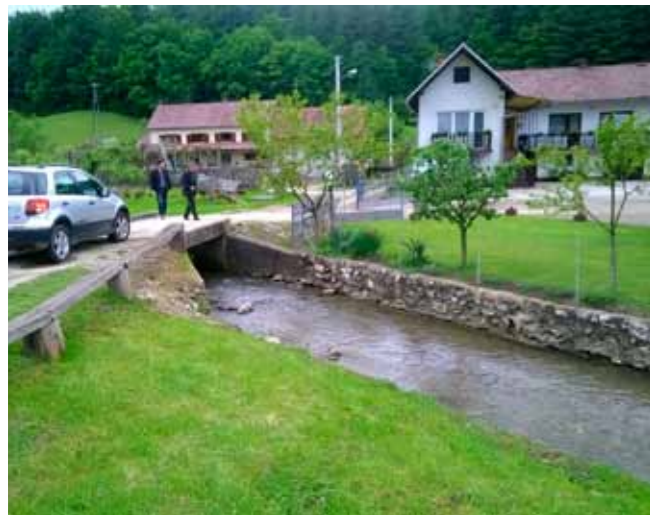
Na licu mjesta tražila su se i rješenja problema za kritične dionice uz potok Željeznicu

Oni su obišli potok Željeznicu, kod kapelice, gdje je zadnjih godina došlo do većih odrona