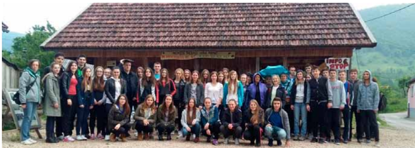
Izlet za sjećanje za 43 učenika i 11 mentora Srednje škole Ivanec

NAGRADNI IZLET Grad Ivanec učenicima poklonio nagradni izlet u NP Sjeverni Velebit