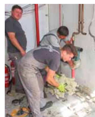
Počeli su radovi na energetskej obnovi zgrade Dječjeg vrtića Ivančice

Podsjećamo, Grad Ivanec je sredstva za cjelovitu obnovu vrtićke zgrade povukao prijavom na europski pilot projekt, a koja je temeljem kandidiranih