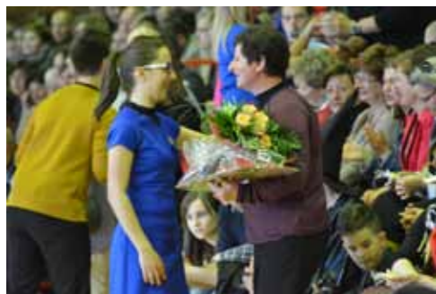
Hvala za trud, strpljenje, znanje...

A nakon toga publika je samo mogla uživati u programu što su ga izveli Hogwarts (4. G1), Izba-