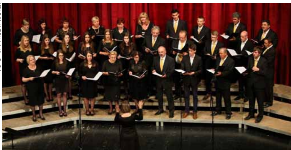
U društvu najboljih u Europi zapjevao je i zbor KUD-a Rudolf Rajter

REKREACIJA Susret ekipa Caritasova doma Ivanec i Doma umirovljenika Varaždin