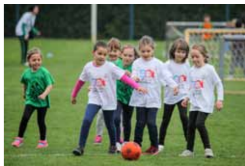
Male olimpijke ogledale su se i u nogometu