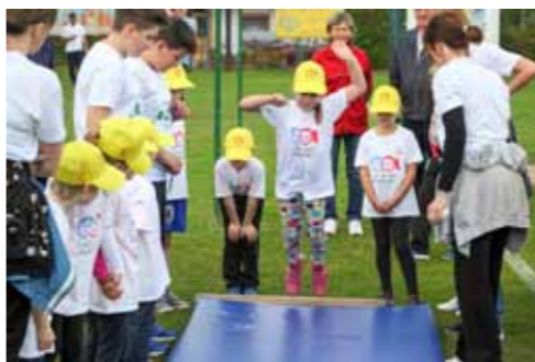
Tko će više, tko će dalje

Odjeveni u dresove i tipične boje svojih vrtića i svečano postrojeni na stadionu NK Ivančice, maleni su jedva čekali da završi kratka svečanost službenog otvaranja Olimpijade pa da mogu krenuti na „borilišta“. Njihovo nestrpljenje i želju za pobjedama shvatili su i organizatori pa ih je stoga, nakon intoniranja himne i paljenja olim-