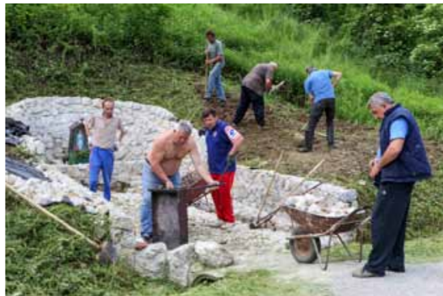
Skupina mještana uzorno je uredila izvor Curek uz cestu Ledinec- Škriljevec - Završje

Curek je izvor koji ima svoju povijest, a ona seže davnno, još u doba Kraljevine Jugoslavije, kada je ovdje kaptiran izvor s kojeg su se ledenom vodom snabdijevali mještani te radnici koji su radili u obližnjim ugljenokopima, ali i vojska, hodočasnici te mnogi putnici – namjernici. Smješten na