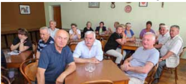
Udruga umirovljenika Ivanec, s podružnicom u Klenovniku, ima 503 člana

ma pa i desetljećima, uplaćivali sredstva za posmrtnu pripomoć. Problem je to čije rješenje zacijelo neće biti jednostavno i s kojim će se vodstvo udruge svakako