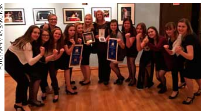
Članice Sakcinskog natjecateljski repertoar otpjevale su savršeno

U konkurenciji vrlo jakih zborova iz Švedske, Latvije, Estonije, Poljske, Slovenije i Hrvatske