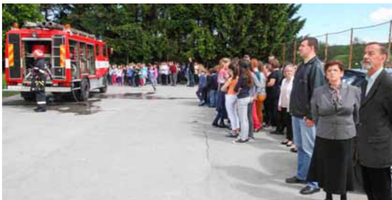
I u radovanskoj školi provjereno je funkcioniranje protokola predviđenog za krizne slučajeve

U drugom dijelu godine bit će provedene još dvije velike vježbe u ivanečkim tvrtkama i to u Drvodjelcu i HEW-u, uz simulaciju požara i evakuaciju radnika.(ljr)