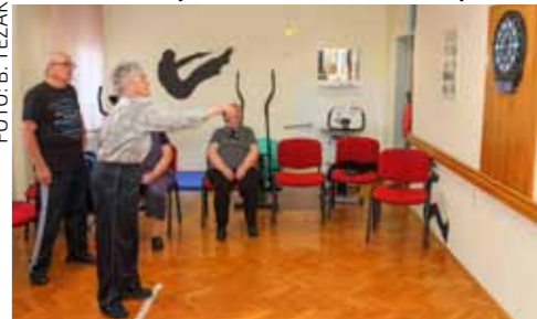
Natjecatelji nisu dopustili da im podmakla dob bude prepreka za zabavu

se, natjecanja su u dobrom rasporedu nastavljeni u prostorijama Caritasova doma. U ukupno pet disciplina pobijedili su (generacijski mladi) gosti iz Varaždina pošto je logistika Doma ocijenila da bi vjetar mogao „otpuhnuti“ šah i Čovječe, ne ljuti