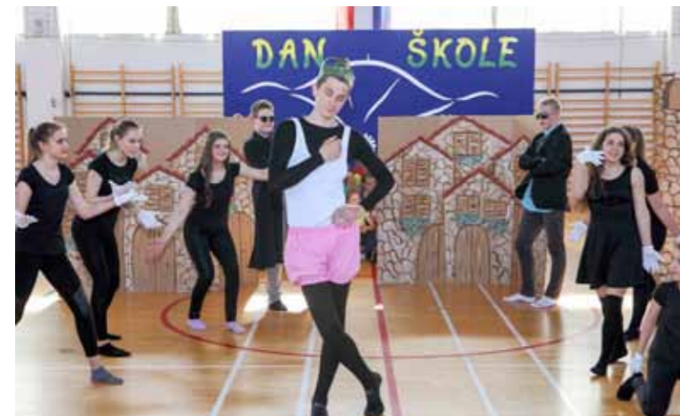
Duhovit program učenika zabavio je publiku