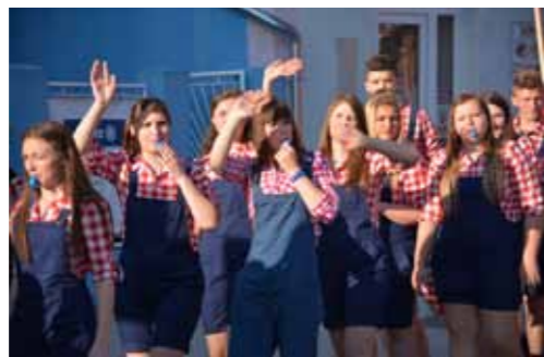
U mimohodu ivanečkim ulicama

ŠKOLSTVO Obilježen je Dan škole u Ivancu