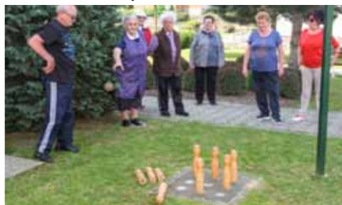
Na višecoj kuglani oboreni su čunjevi pažljivo registrirani

Nakon što su na vanjskom „terenu“ odradili natjecanje na višecoj kuglani, a pošto je logistika Doma ocijenila da bi vjetar mogao „otpuhnuti“ šah i Čovječe, ne ljuti