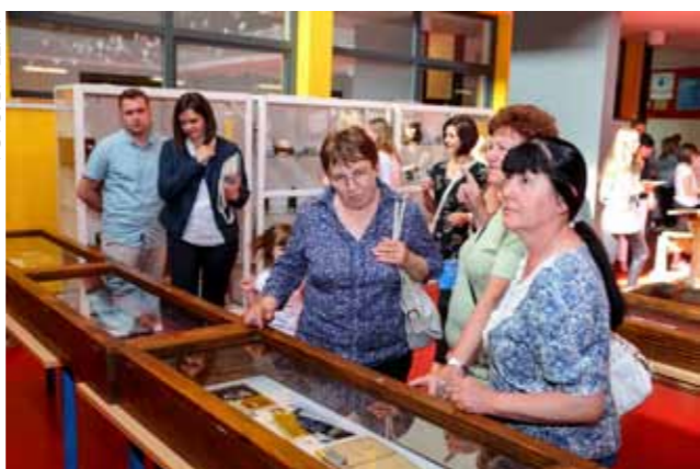
U suradnji s Klubom kolekcionara, otvorena je izložba Grad i ljudi – gradu za rođendan