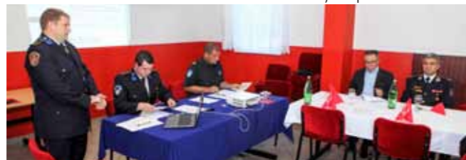
Upućene su zahvale članovima svih DVD-ova koji su svoje slobodno vrijeme i rad uložili u spašavanje života i imovine građana

ženje mogućnosti nabave odgovarajućeg vozila uložio mnogo truda i vremena, proizlazi kako su iscrpljene sve mogućnosti – obraćanje raznim instancama na državnoj razini za pružanje pomoći, lobiranje, traženje povoljnog i po godištu optimalnog vozila koje udovoljava važećoj Procjeni ugroženosti i Planu zaštite od požara, uz naglasak da rješavanju ove situacije treba pristupiti drukčije.