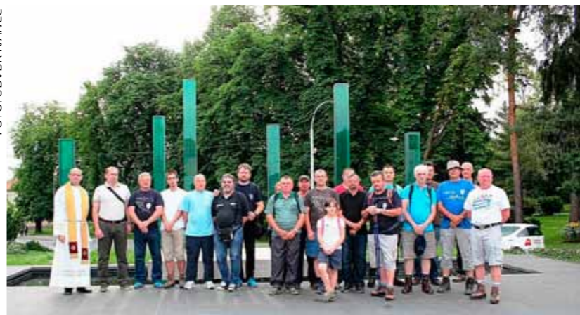
Prije polaska, molitva i blagoslov kod spomen obilježja u Ivancu

ZA BRANITELJE U spomen na poginule i umrle branitelje s područja grada Ivanca