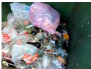
Ne odlažite komunalno smeće u otpad za recikliranje

Stoga apeliramo na građane da to ne čine te da PVC otpad odlažu u žute, papir u plave, a otpadno staklo i boce u zelene kontejnere. Oni će idućih dana