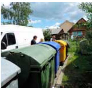
U Šabanovoj ulici podići će se cijeli niz pergola

♦ ♦ Oko pergola će se zasaditi biljke penjačice koje će biti lijep cvjetni ukras i zaštita koja će skrivati pogled na kontejnere