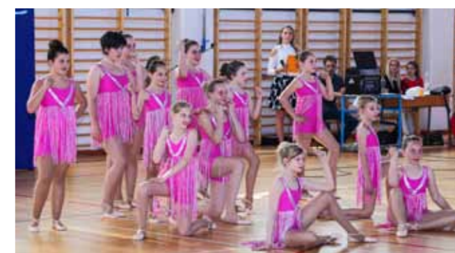
Natjecateljska kadetska grupa u dojmivim ljučastim trikoima sa srebrnim resama