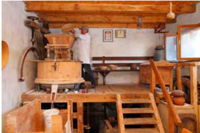
Unutrašnjost obnovljenog Friščićeve mlina

U tom cilju već godinama istražujem povijest ivanečkih mlinova i prikupljam raznu građu. A to uključuje terenska snimanja, razgovore s nasljednicima mlinova, prikupljanje fotografija, raznih dokumenata i sl. Projekt je prihvaćen i od strane Turističkog vijeća, Skupštine TZ-a i Grada Ivanca, a s njim su upoznate i Hrvatska i Županijska TZ. Ciljevi projekta su višestruki, od toga da se njime doprinosi razvitku turističkih tokova i unapređenju turističkog proizvoda destinacije pa sve do posebnih