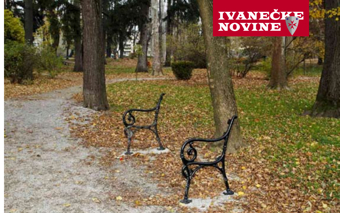
Uništeno je sedam klupa, od nekih su ostali samo metalni „kosturi“

žiti nadoknadu štete za uništenu javnu imovinu. Ako odbiju, Grad Ivanec podnijet će kaznene prijave, jer riječ je o djelima uništavanja javne imovine, koja se smatraju kaznenim djelom – izjavila je dogradonačelnica Jasenka Friščić.