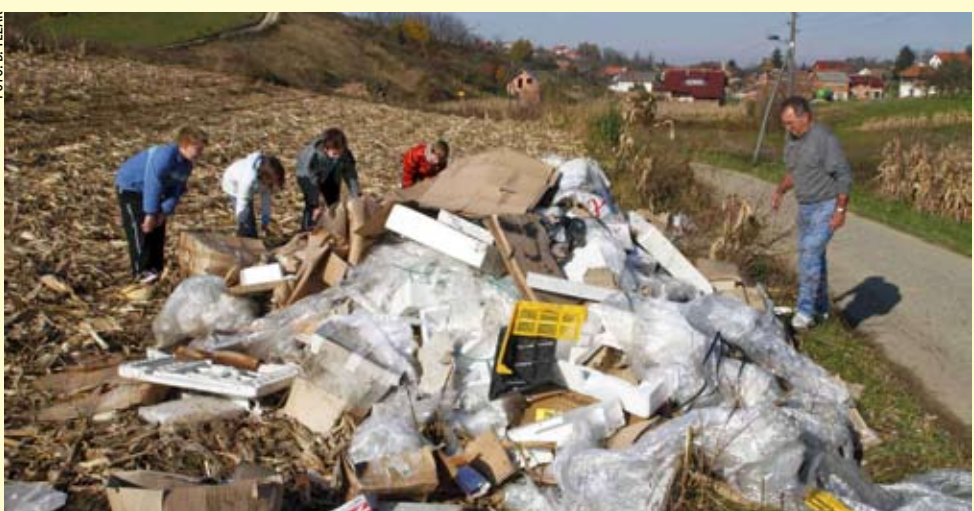
Bezobrazluk: svoj otpad netko je istovario pokraj sportskog igrališta u Gačicama

Gradske službe znaju do kojeg objekta vodi trag ovog otpada, odložena u Cerju Tužnom