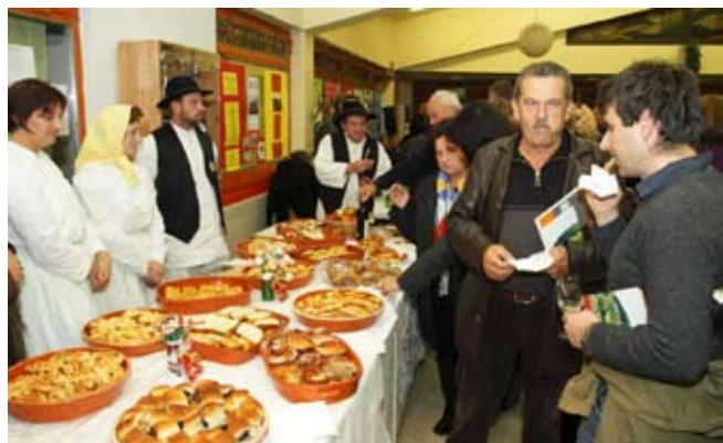
Udruge su prikazale potencijalnu gastronomsku ponudu ivanečkih klijeti

građana da saznaju više o tome kako da rentaju svoje klijeti i aktiviraju ih kao vinotočja ili za pružanje ugostiteljskih usluga