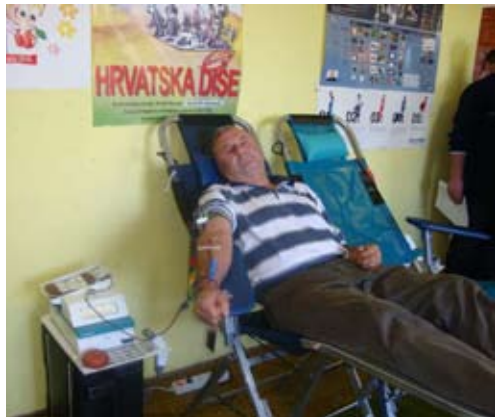
Skupljeno je novih 99 krvnih doza