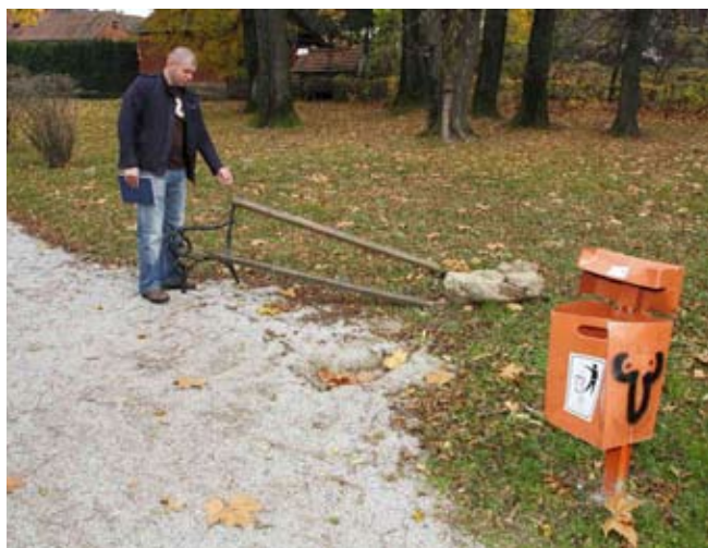
Klupa u gradskom parku iščupana je s betonskim temeljima

Počinitelji su je, među ostalim, pokušali i prevrnuti, jer je posve naharena, neupotrebljiva za igru i opasna. O tome koliko je daleko sezala objest mladih razbijača, pokazuje i podatak da su stepenice s čavlima iščupali i razbacali ih. Razbili su i okvir ulaza u kućicu, a gredu smo uočili nekoliko metara dalje, u travi. Potrgane su daske na