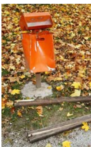
Koševi za smeće su demolirani

Samo nekoliko dana kasnije – nov slučaj u gradskom parku. Preneraženi građani s nevje-