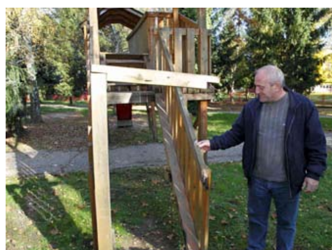
Stepenice su iščupane, okvir ulaza razbijeni, vire čavli

Takav postupak u skladu je i sa zahtjevima građana, koji učestalo traže da se huliganima i razbijačima ne gleda kroz prste, već da ih sudovi primjereno kazne. Hoće li visoke novčane odštete, koje će po džepu udariti roditelje, mladim razbijačima biti dovoljna kazna i upozorenje da im na početku životna puta ovakva avantura nije bila potrebna?