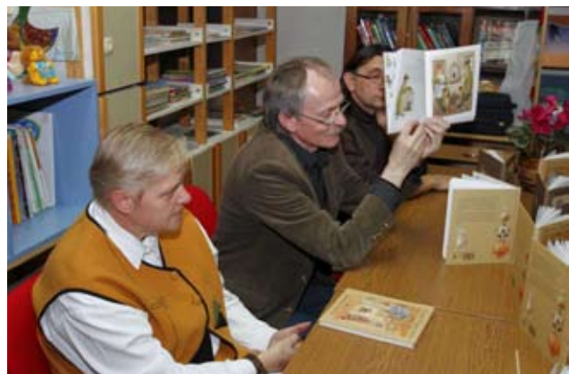
Publika je sa simpatijom pratila autorove duhovite komentare i odličan prijevod prof. M. Bračko

višom prevoditeljskom Nagradom sv. Jeronima. I te večeri ona je prevodila s litavskog, pa su posjetitelji mogli uživati u izravnoj komunikaciji s gostujućim piscem, koji se pokazao kao neposredan, jednostavan i vrlo duhovit sugovornik.