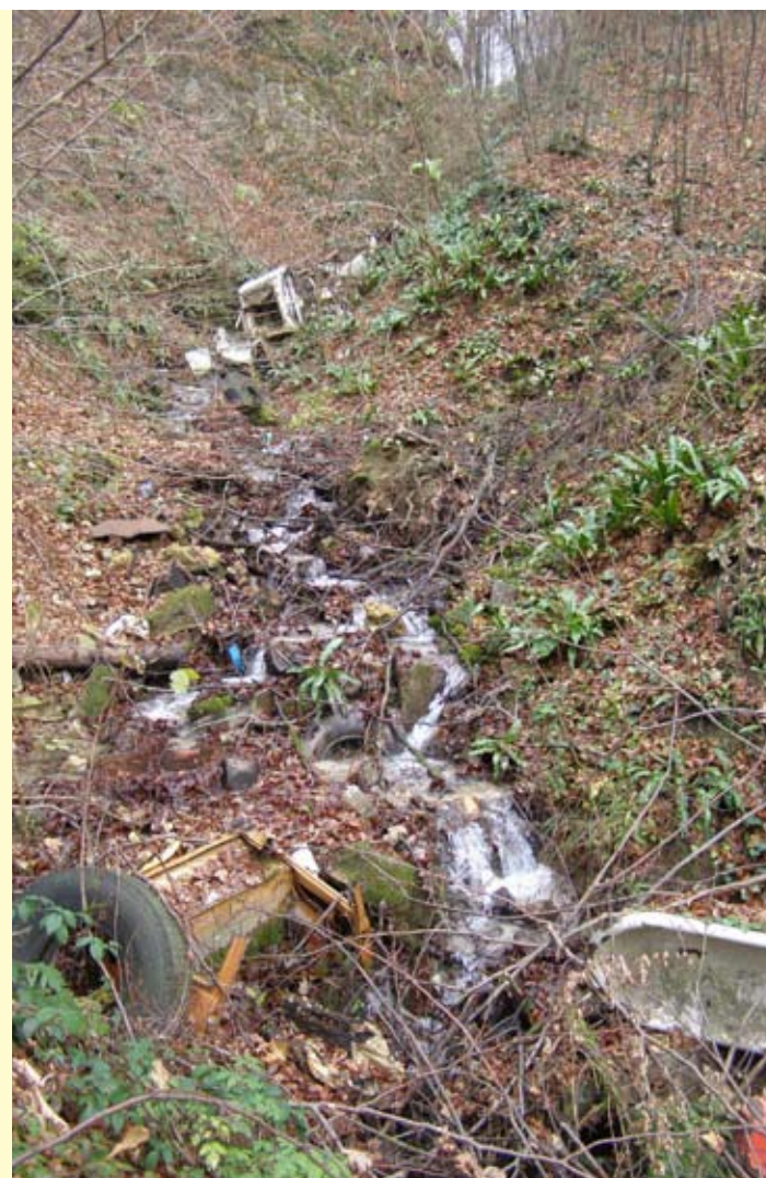
Tko je čisti gorski potok pretvorio u smetlište? Gume, lonci, namještaj, boce...

- Budući da takvi slučajevi nisu u nadležnosti komunalnog redarstva, prijavu i skupljeni dokazni materijal uputili smo inspekciji zaštite okoliša, koja će dalje voditi postupak u skladu sa Zakonom o otpadu. Za ovakvo kršenje zakona propisane su vrlo visoke novčane kazne, od 200.000 do 300.000 kuna! Posebno ćemo inzistirati na tome da nas inspekcija povratno informira o provedenom postupku, uključujući i slučaj u Gačicama, jer očito je da samo novčane kazne mogu spriječiti da se ovakvi slučajevi učestalo ne ponavljaju – izjavio je pročelnik Upravnog odjela za urbanizam i komunalne poslove Stanko Rožman. (lir)