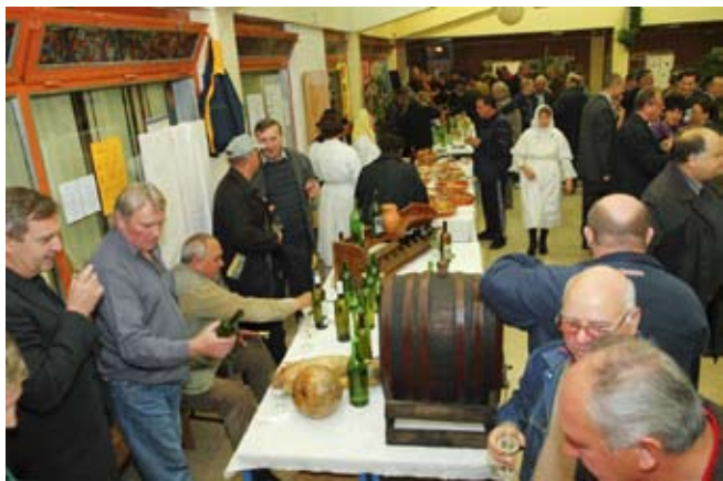
Nakon predstavljanja vodiča, udruge su priredile prigodno druženje uz mošt, slatke delicije, glazbu i specijalitete Industrije mesa

■ - Koliko vas je, od prisutnih vinogradara, aktiviralo klijeti za prodaju vina ili najam soba za noćenje? – upitao je Batinić. Među više od stotinu nazočnih, u zraku je bila samo jedna ruka