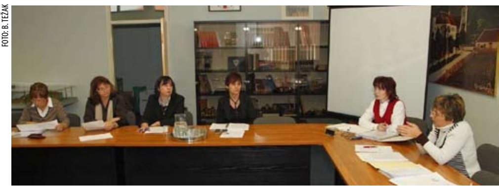
Upravno vijeće odobrilo je roditeljima bolesne djece prve novčane pomoći

Nakon što je nedavno upisana u Zakladni registar i Registar fundacija Republike Hrvatske, čime su ispunjeni i formalni uvjeti za početak njena rada, Upravno vijeće je odmah razmotrilo sve zahtjeve što su u međuvremenu pristigli. Pritom se ustanovilo da su sve među njima molbe za pomoć bolesnoj djeci. Ovisno o težini i hitnosti, nekoj djeci priskočilo se u pomoć odmah, a nekima će se odobriti naknadno, nakon što se obave dodatni razgovori s roditeljima.