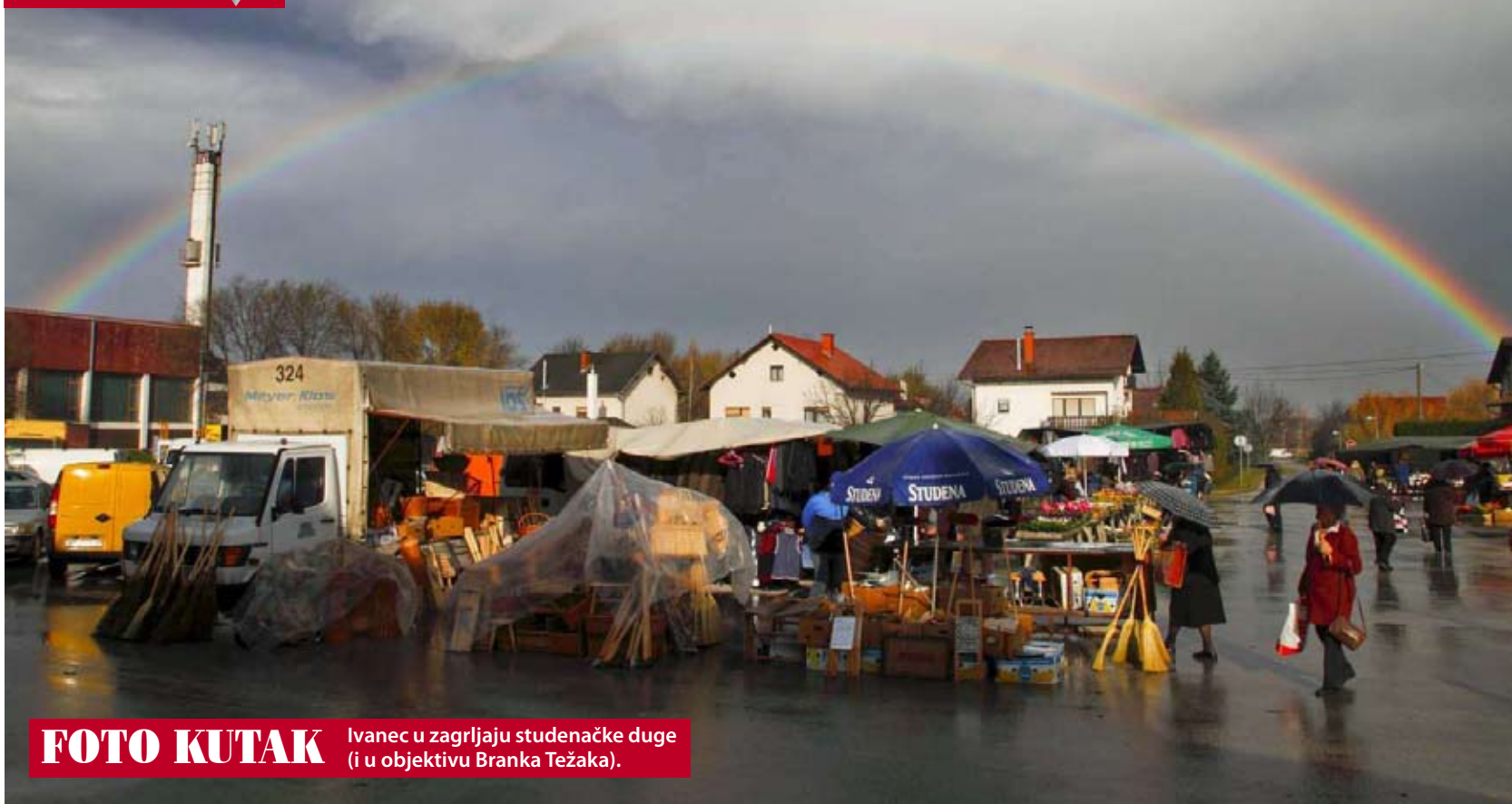
FOTO KUTAK Ivanec u zagrljaju studenačke duge.