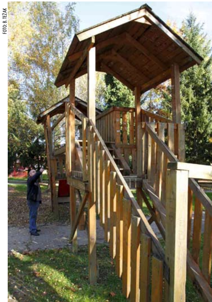
Letve sa strane su razbijene i pobacane, a cijela kućica je naharena, jer su je razbijači pokušali prevrnuti

- Policija nas je izvjestila o identitetu počinitelja. S njima je u međuvremenu policija razgovarala u nazočnosti roditelja, a o svemu je obaviješten i Centar za socijalnu skrb. Budući da je riječ o maloljetnicima, u gradske prostore na razgovor ćemo pozvati njihove roditelje i tra-