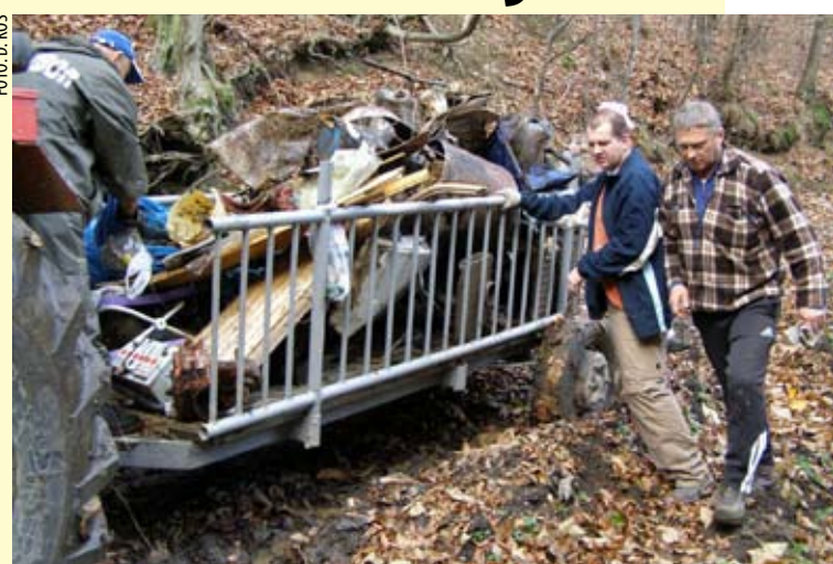
Planinari su iz Mrzljaka izvukli neočekivano velike količine smeća

- Zgrozili smo se kad smo vidjeli što su sve nemarni građani „pospremili“ u potok! Očito je da im sve moguće ekološke poruke što ih već godinama upućuju svi koji vole Ivančicu, ne znače ništa. No,