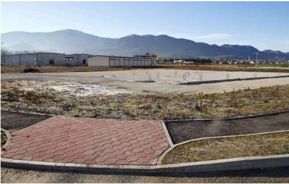
Do polovice ove godine završit će komunalno opremanje Poslovne zone

- Na žalost, Ivanec su i prošle godine ponovno zaobišle značajnije financijske potpore s državne razine. Slijedom kvalitetnih projekata što ih je Grad kandidirao ministarstvima i fondovima, očekivali smo 3 do 3,5 milijuna kuna potpora. Dobili smo daleko manje, 500.000 kuna od Ministarstva gospodarstva za Poslovnu zonu, 50.000 kuna od Ministarstva