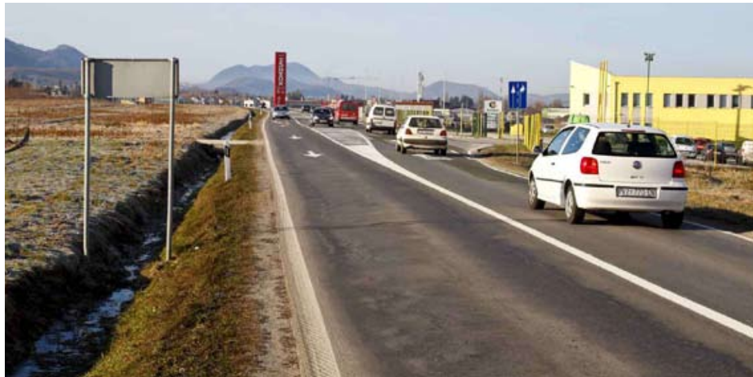
Od Ivanca do Ivanečkog Naselja gradit će se pješačko-biciklistička staza

i oborinske odvodnje kroz Bedenec te rekonstrukciju ostalih cesta i gradnju pješačkih staza u skladu s programom ŽUC-a. Ove godine počinje i postavljanje autobusnih nadstrešnica, a prve stižu u Margečan, Salinovec i Bedenec. Nakon nebrojenih zahtjeva i požurnica, u prosincu smo ponovno uputili dopis Uredu za državnu imovinu da riješi zamolbu Grada Ivanca za dodjelom bivših vojnih objekata na Ivančici. Budući da je u međuvremenu došlo do promjena u ustroju toga tijela te da su deseterostruko vrijedniji slični objekti već dodijeljeni nekim susjednim gradovima, ne vidim razloga da se ne