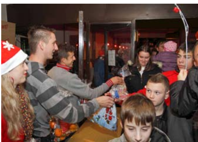
Gužva na izlazu

STAŽNJEVEC Veselo Nikolinje u stažnjevečkoj staroj školi Sv. Nikola darivao 75 stažnjevečke djece Djeca su priredila program ispunjen pjesmom i stihovima