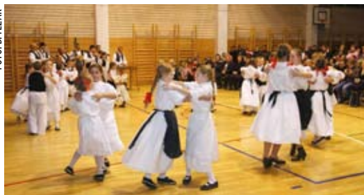
Plesači su stvorili ugodnu predblagdansku atmosferu