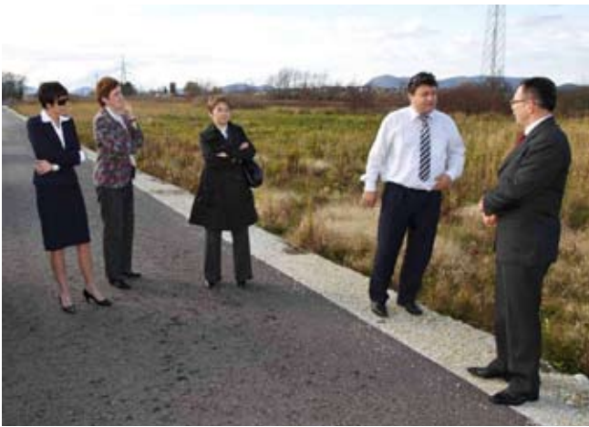
S mogućnostima ulaganja u Industrijsku zonu, gradski čelnici nedavno su upoznali i predstavnike slovenskog veleposlanstva u Hrvatskoj i Štajerske gospodarske komore