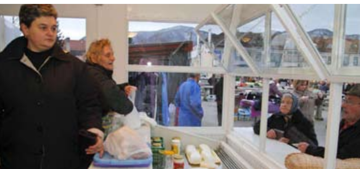
Kumice: Hvala svima koji su se toga zmislili

NIŠTA BEZ DOMAĆEG SIRA Kumice na ivanečkom placu uoči Božića sir i vrhnje počele prodavati iz rashladne vitrine