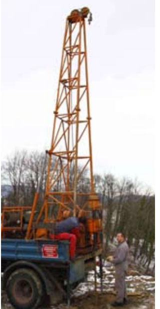
Istraživački radovi na klizištu u Vuglovcu

jemo da bi se moglo proširiti i napraviti još veće štete. Vjerujemo da na tom mjestu tlo klizi zbog podzemnih voda. Mjestani su ga tijekom prošlih godina pokušali „zaustaviti“ navozom otpadnog građevinskog materijala. I Grad je organizirao njegovo nasipavanje zemljom s raznih gradilišta, tla, a rezultati istražnih radova bit će temelj za izradu rješenja i projekata sanacije klizišta. Sličan problem je i u Margečanu, dok je klizište pokraj nerazvrstane ceste u Prigorcu ugrozilo klijeti. (ljr)