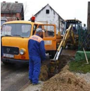
Više od trećine proračuna ove će se godine utrošiti u gradnju komunalne infrastrukture

- Po komunalnoj opremljenosti Jerovec je odskočio pred drugim naseljima. Samo 2008. u gradnju kanalizacije i ceste uloženo je više od 1,5 milijuna kuna, a uskoro se sprema i početak sanacije smetlišta. Jerovec