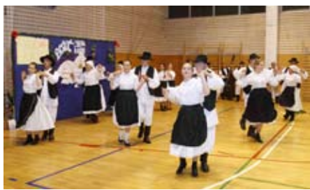
KUD Salinovec: Zaslužno im pripada naslov prvaka županijske smotre

Šaljivom predstavom Tko tu koga vara, gledatelje je nasmijala Glumačka udruga Komedijaši iz Stažnjevca