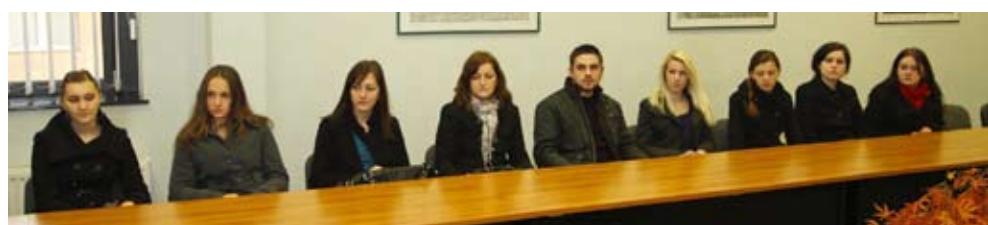
U novoj akademskoj godini Grad stipendira 36 studenata

- Vjerujemo da će vama i vašim roditeljima gradske stipendije barem djelomično olakšati teret studiranja. Nadamo se da će barem dio vas nakon završetka školovanja ostati u Ivancu, jer na vas gledamo kao na intelektualni kolektiv koji će sutra nositi razvitak grada – poručio je gradonačelnik, obraćajući se studentima. Naglasio je da će ubrzo sve studente s područja Ivanca pozvati na poseban sastanak, radi formiranja baze podataka o stručnim kadrovima.