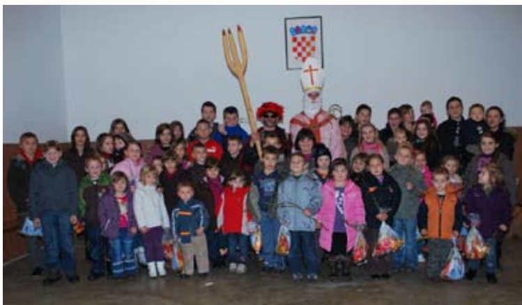
Sv. Nikola darivao je i 75 djece stažnjevečkog kraja