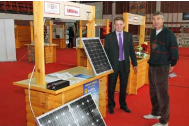
Gospodarski sajam održan je u sportskoj dvorani Srednje škole