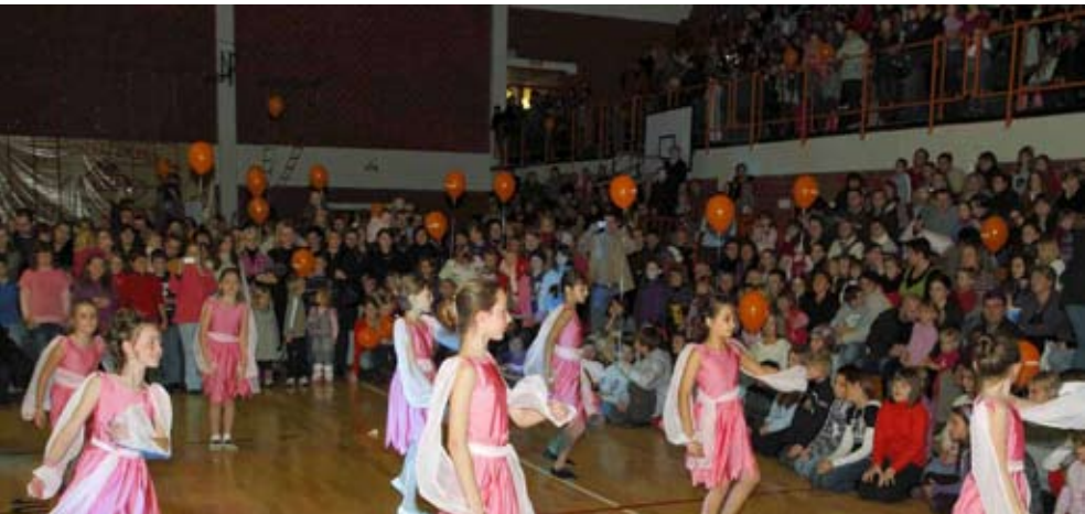
Sv. Nikolu plesom su dozvale i dječje plesne radionice Društva Naša djeca