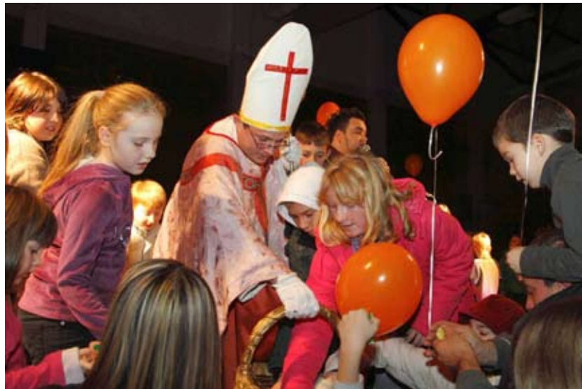
Što je fino donio sv. Nikola?