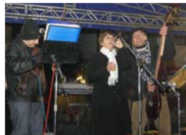
Zadnje sekunde Staroga ljeta...