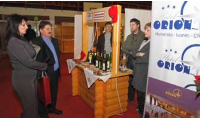
Sudjelovalo je četrdesetak izlagača