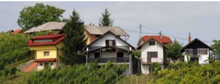
Pravo na poticaje i novčanu pomoć u programu aktiviranja klijeti i kuća za odmor mogu ostvariti samo građani i OPG-i čiji su objekti na području Grada Ivanca

Potom se osvrnuo i na ostala tri glavna županijska projekta, a to je projekt Specijalizacija zona, koji obuhvaća gradnju komunalne infrastrukture u poddišnje Hrvatske. Njime gospodarstvenici očito pokazuju da su im manifestacije sajamskog