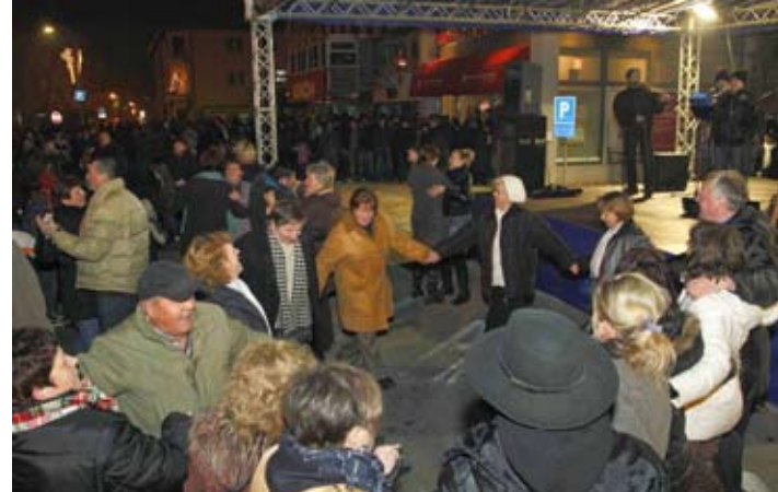
Dobar štimung na gradskoj špici uz Faringaše

pridružili tisućama građana Hrvatske koji su dolazak Nove godine dočekali na trgovima, ujedinjeno u želji da im bude bolja i mirnija od prošle godine, pune nevolja i nedaća. Zahvaljujući odlično raspoloženim Faringašima koji su s bine na špici neumorno svirali svima dobro poznate pjesme, a i vrućem vinu što su ih građanima podijelile članice Društva prijatelja Maska, građani su barem za kratko ostavili probleme postrani i prepustili se veselju. A pjesme i urnebesnog plesa nije nedostajalo. Sretno svima u Novome ljetu!