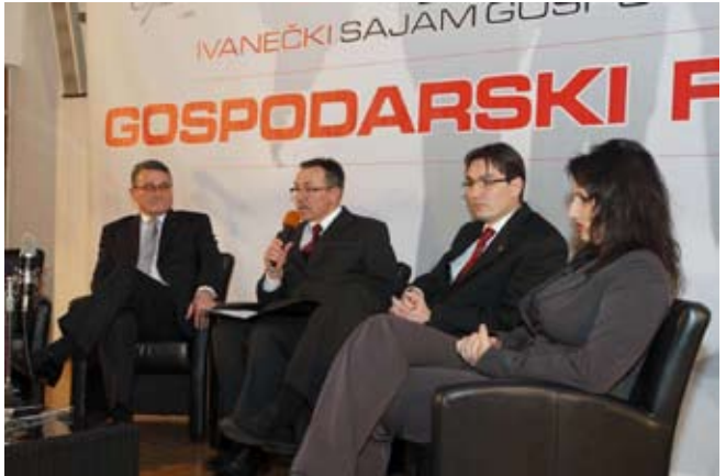
U srednjoškolskom amfiteatru održan je gospodarski forum