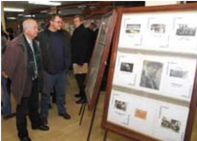
Izložba fotografija o rudarima

U predvorju Srednje škole otvoren je 1. sajam rukotvorina i suvenira, na kojemu su svoje proizvode izložila 34 izlagača iz Petrinje, Sesvetskog Kraljevca, Gornjeg Stupnika, Zagreba, Varaždina... Posjetitelji su iznenadili raskoš i bogatstvo rukotvorina, kojima su autori iz svih krajeva pokazali svoju kreativnost i domišljatost u stiliziranju izvornih suvenira svojih