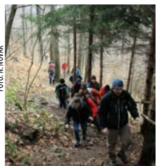
Mlade su u pohodu na vrh predvodili iskusni članovi PK Ivanec

Vodstvo Društva za sportsku rekreaciju iz Lančica-Knapića za sve je svoje članove, rekreativce i sportaše na blagdan Bogojavljenja organiziralo grupno rekreativno pješačenje, s ciljem „nabijanja“ kondicije nakon blagdanskih dana.