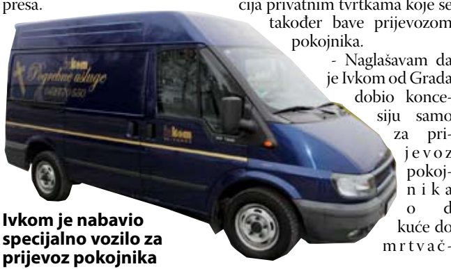
Ivkom je nabavio specijalno vozilo za prijevoz pokojnika

nja groblja i zelenih površina, Ivkom u vlastitom krugu već zasađio oko 300 mladih čempresa.