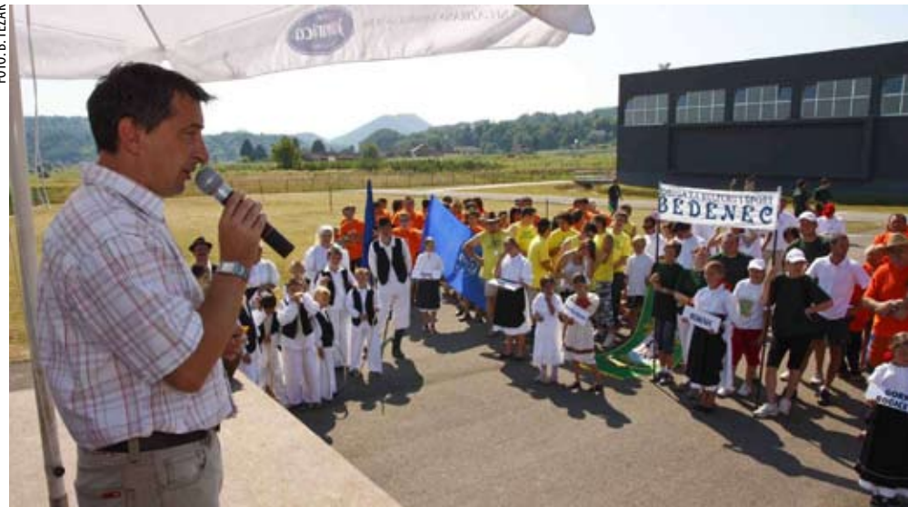
Župan se rado odaziva pučkim manifestacijama u našem kraju

Lanjska godina nije bila laka. Pratila ju je stagnacija gospodarstva s povećanjem broja nezaposlenih, što je rezultiralo smanjenjem prihoda od poreza na dohodak. Zbog općih gospodarskih prilika, ali i izmjena stopa poreza na dohodak, uslijed kojih su smanjeni prihodi jedinica lokalne samouprave, sredinom prošle godine došlo je do značajnog pada izvornih prihoda županije. Prihodi u srpnju bili su čak 38 posto manji nego prije godinu dana. Stoga su mjere štednje obuhvatile troškove informiranja i promidžbe, dnevnica, prodan je i dio službenog voznog parka. Krenulo se i u rezanje troškova službenika, namještenika i dužnosnika, koji će donijeti uštedu od 2 milijuna kuna. U sklopu reorganizacije upravnih tijela, njihov broj smanjen je s deset na osam, a pokrenut je i program zbrinjavanja za osmero službenika. Pri izradi proračuna za 2011. vodili smo se samo štednjom, to više što je županijsku blagajnu opterećivao manjak od 15 milijuna kuna iz prethodne dvije godine. U ovogodišnjem proračunu planiran je i dodatni manjak od 10 milijuna kuna. Kako su prihodi od poreza i prireza drastično pali, a slično se očekuje i ove godine, morali smo odustati od većine novih razvojnih projekata. Osim toga, Županija dobiva sve manje novca i iz državne blagajne, pa smo za ovu godinu planirali 32 posto manje