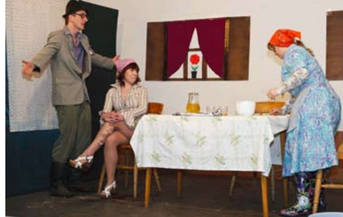
Scena iz predstave Što tu koga vara

A nastavak programa, kojeg su domaćini otvorili novom predstavom naslovljenom Štefa ide u autoškolu, tijekom idućih sat vremena bio je obilježen sjajnim humorom pučkih družina i gromoglasnim smijehom publike. Dok su u nastavku još jedne nove priče o već legendarnom