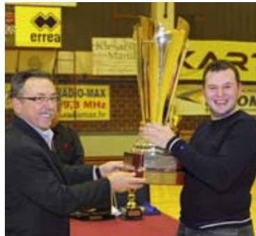
Zlatni pehar pobjedničkoj momčadi

Osvrnimo se na tijek turnira. Nakon razigravanja