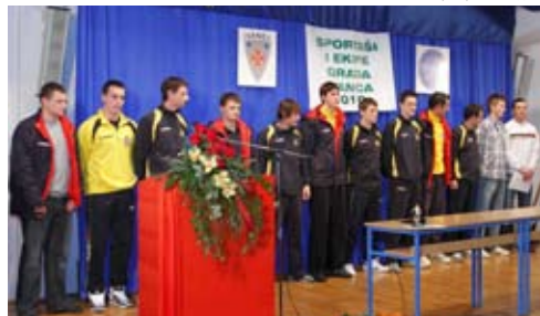
Seniorska ekipa RK Ivančice najbolja je muška sportska momčad 2010.

najboljeg igrača utakmica (prosjek od 18 obrana po utakmici). Uvelike je zaslužan za plasman seniorske ekipe RK Ivančice na 4. mjesto u 1. HRL.