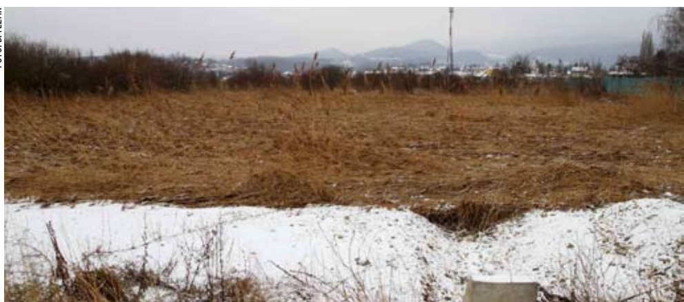
Zahtjevi građana da im se zapušteno zemljište plati od 10 do 40 eura smatraju se posve nerealnima

devinskog i komunalno-opremljenog zemljišta u Ivancu.