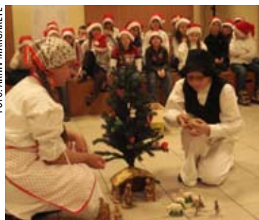
Margečanski klinci, na ponos roditeljima...