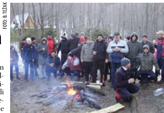
Ugodno druženje uz vatru, čaj i kuhano vino

- Svi sudionici potom su se ulogorili ispod Skradnjaka, gdje su založili veliku logorsku vatru i družili se uz čaj, kuhano vino i jeger na vatrici – izvijestio je tajnik DSR-a Mario Surjak. (ljr)