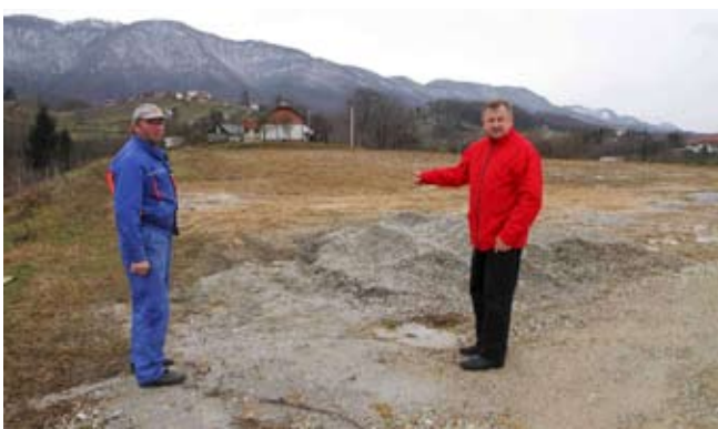
Radovi na uređenju novog dijela groblja počet će odmah nakon proljepšanja vremena

nja groblja i zelenih površina, Ivkom u vlastitom krugu već zasađio oko 300 mladih čempresa.