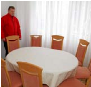
Grobna kuća odgovara juće je opremljena