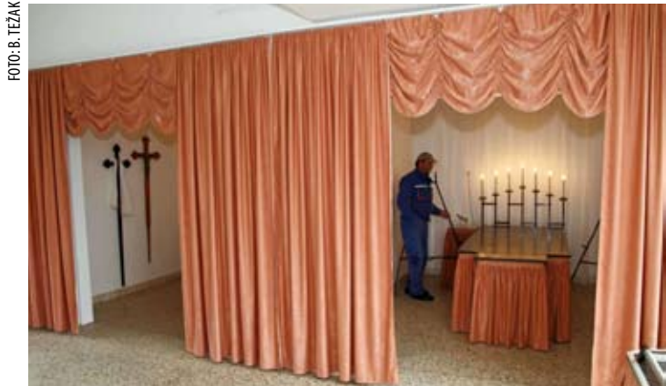
Uređen je interijer grobne kuće u Ivancu

alnog izgleda budućeg groblja, ono će biti vrlo suvremeno uređeno, s klasičnim grobnicama, grobnicama za urne, mjestima za klasične ukope, fontanom i skladnim hortikulturnim uređenjem. Također, groblje će biti ograđeno novom ogradom, a srušit će se i sadašnja stara, potrgana žičana ograda, koja sadašnje groblje dijeli od budućeg, novog dijela.