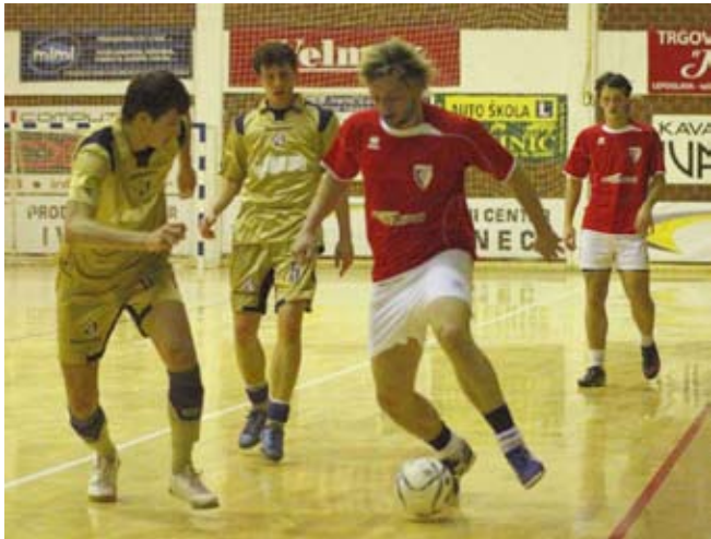
Igrači se na terenu nisu štedjeli

Ivanečki turnir poznat je kao jedan od najstarijih i najorganiziranijih zimskih turnira u Hrvatskoj. Ujedno, on je među najvećim sportskim manifestacijama u našoj županiji. Potvrđuju to i podaci o 680 igrača iz 52 ekipe u natjecateljskom dijelu turnira. Najviše momčadi, 16, bilo je iz Varaždinske županije, devet iz Krapinske, a dvije iz Zagrebačke.