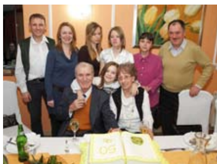
Proslava u krugu najdražih

- Naše prvo „da“ pred Bogom i ljudima rekli smo si prije pola stoljeća u crkvi sv.