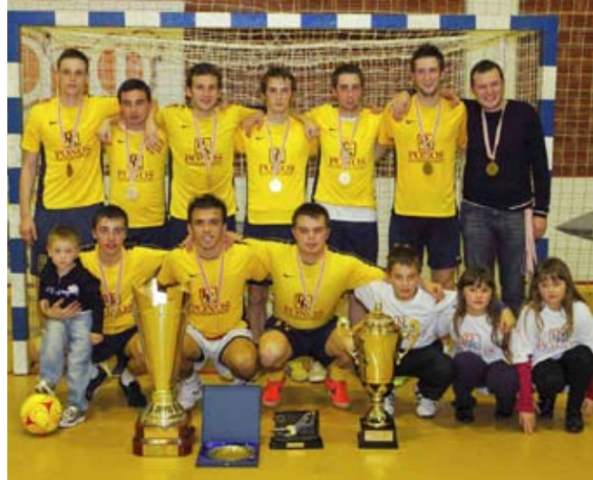
Krapinski ASO Ponos slavodobitnik je 28. zimskog turnira Elkom kup 2011.

U utakmici veteranskog dijela, momčad PP Ivanec je utakmicu četvrtfinala porazila ekipu Tvornice obuće Ivančica&RIS s 5:4, koja je zatim, u polufinalnoj utakmici,