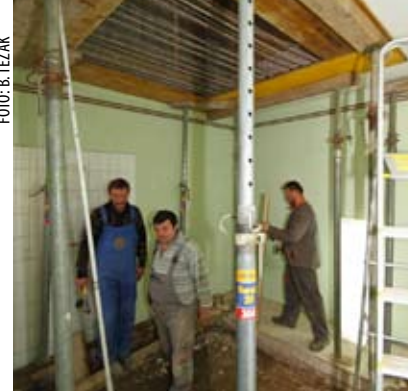
Gradnja podizne platforme u Domu zdravlja Ivanec

- Dok se na razini Grada problem arhitektonskih barijera nastoji riješiti, neki drugi na svoju se obvezu oglašuju, a o tome ćemo više govoriti na našoj godišnjoj skupštini – poručio je Putarek. (ljr)