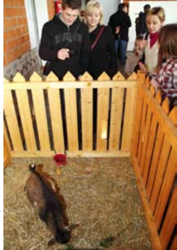
Pospana afrička patuljasta kozica izmamila je smijeh posjetitelja

■ Izložba je održana pod pokroviteljstvom Grada Ivanca i supokroviteljstvom Turističkog društva Ivanec