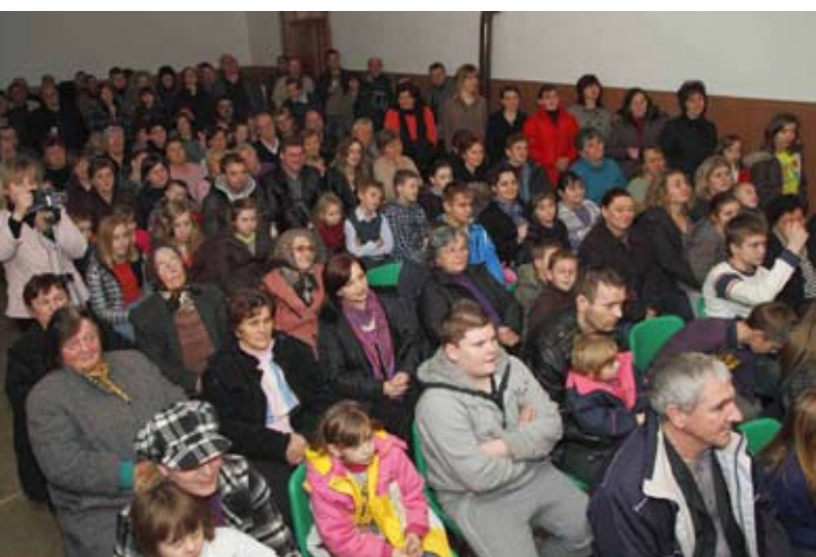
Velik odaziv publike znak je da su zajamčeni dobri dani Stažnjevečkih dana glume

Druženje publike i glumaca potom je nastavljena uz domjenak što su ga domaćini priredili vlastitim snagama. (ljr)