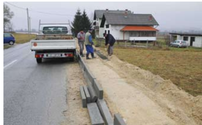
Ivkomovi radnici obavili su pripreme radove za gradnju drugog dijela nogostupa u Salinovcu