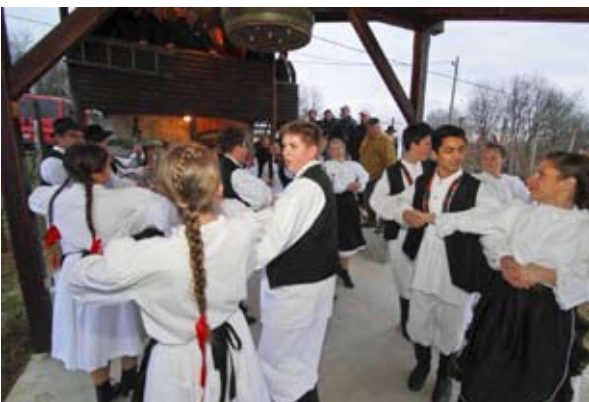
Salinovčani su plesom obilježili Vincekovo na Peščenjaku

Nakon što su folklorši u narodnim nošnjama polkom, valcerom i drmešima „obodriili“ trsje, pa potom svi skupa malo popili i založili, slavlje je nastavljeno na toplom, u prostorima stare škole, uz glazbu Cimbuli benda. (lir)