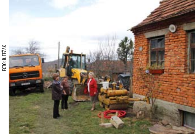
Gradnja nove kućice od 50-ak kvadrata počela je pokraj stare, ruševne, u kojoj su stambeni uvjeti iznimno loši

Stoga iz Udruge Nada mole sve ljude dobre volje da i dalje pomognu u novcu, opremi ili građevinskom materijalu. Pomoć se može uplatiti na žiroračun Ž. Jurića u Zagrebackoj banci broj 2360000-3114796570 ili se dogovoriti na tel. 042-781-788 i 098 9342 592.(ljr)