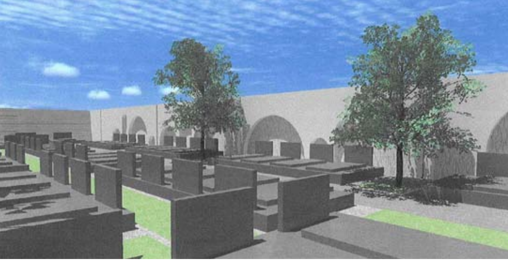
Ovako će izgledati novo groblje u Ivancu

- Kako bismo mogli udovoljiti željama, ali i financijskim mogućnostima rodbine pokojnika, već smo nabavili šesnaest vrsta ljesova. Najjeftiniji stoje