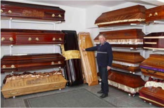
Ivkom je s 1. veljače otvorio novu djelatnost – prijevoz pokojnika i prodaju pogrebne opreme

Groblje je hitno potrebno proširiti radi pomanjkanja mjesta za ukope pokojnika. Stoga će na novoj parceli najviše mjesta biti ostavljeno upravo za klasične ukope. Također, građanima će na prodaju biti ponuđene i grobnice, a iz tih prihoda Ivkom planira prikupiti dio sredstava kojima bi financirao uređenje