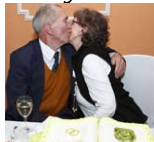
Tek su 50 godina zajedno!

dugi brak? Ak' se dva zemeju, onda se muž i žena trebaju međusobno poštivati i jedan drugome dopuštati! I treba se fest delati, jer čim više delaš, to se bolje i ljepše osjećaš! – rekao je Ivan.