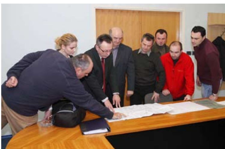
Na radnom sastanku s udrugama u Gradskoj vijećnici

preko Malog i Velikog konja, Prekrižja, Tamnog dola i Šumnja. Dogovoren je i obilazak pravca od Salinovca do Golog vrha i Šuma te od Margečana i Čovrana do Velike ravni i Seljanskog dola i posebno, Gradišća.