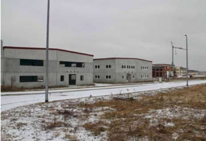
Vrijednost zemljišta u Poslovnoj zoni bila je veća zbog atraktivnije lokacije uz državnu cestu i izgrađene primarne infrastrukture

Obrt Dimgrad u međuvremenu je rad uskladio s odredbama nove odluke te u prilogu donosimo obavijest s okvirnim rokovima o rasporedu čišćenja dimnovodnih objekata. Napominjemo da je čišćenje na području Prigorca, Lančiča i Knapića u međuvremenu završeno. (ljr)