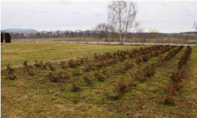
U poslovnom krugu Ivkoma zasađeno je 300 borića za ukrašavanje groblja i zelenih površina