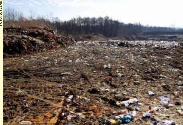
Sanacijski radovi odlagališta smeća u Jerovcu izvodit će se etapno, tijekom nekoliko idućih godina

Razgovori o mogućnostima uređivanja reciklažnog dvorišta u Jerovcu tek predstoje, jer iz kućnog smeća trebalo bi izdvojiti otpad pogodan za recikliranje, pa će se tek vidjeti hoće li se to činiti ručno ili automatskom sortirnicom. Iako je još prerano za kalkulacije o tome koliko će građane koštati zbrinjavanje smeća u Piškornici (Koprivničko-križevačka županija), znalci tvrde da će ono biti mnogo skuplje od sadašnjeg zbrinjavanja u Jerovcu.(ljr)