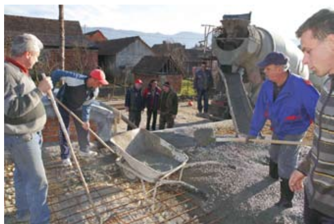
Napreduje gradnja bedenske hiže

Iako su siječnjaški dani bili prohladni, zubato sunce izmamilo je mještane Bedenca, na zrak. Ne želeći propustiti suho vrijeme, naručili su „mikser“ s betonom te uz pomoć majstora izbetonirali podlogu na kojoj će još ove godine sagrađiti svoju izvornu bedensku etnohižu. Glavni dio radova obavili su lani, kad su iskopali temelje, sagradili kamene zidove i boltani podrum od cigle. U njega će, najavljuju, smjestiti stare bačve i nekadašnji pribor za berbu grožđa i njegu vina, a svakako će se pobrinuti da u jednoj bačvici bude i vino.