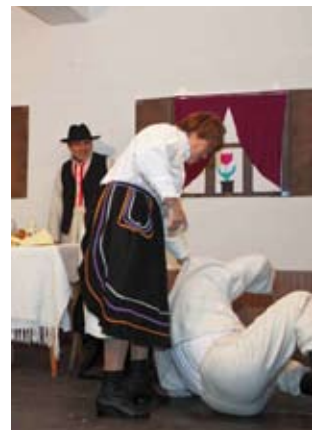
Velik pljesak za duhovite Lepoglavske pušleke