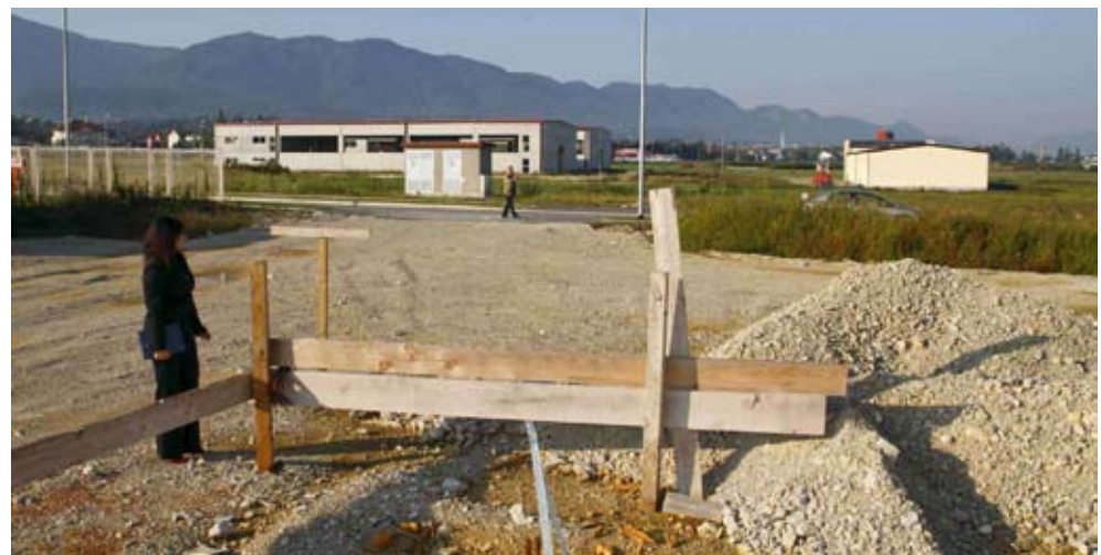
Štromar: Pohvalno je što je Poslovna zona rasprodana i što je Grad Ivanec pokrenuo aktivnosti za formiranje Industrijske zone

decentraliziranih sredstava iz državnog proračuna. Dio proračunskog manjka trebao bi biti nadoknađen 2012. i 2013., a dio i prodajom dionica Poduzeća za ceste i Hidroinga. U tim tvrtkama uloga županije kao vlasnika ionako je samo deklarativna, a njihovom prodajom mogu se srediti županijske financije. Bez obzira na tešku godinu, zadovoljni smo do sada ostvarenim, jer je ova županijska vlast u pr-