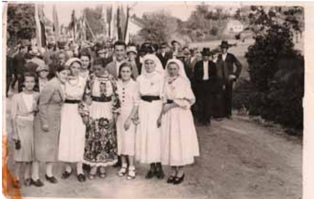
Velik utjecaj HSS-a u Ivancu se ogledao i u veličini proslava rođendana i imendana V. Mačeka

vanja ostavki općinskih odbora u cijelome Kotaru Ivanec u cilju izazivanja prijevremenih općinskih izbora. Nakon što su provedeni, 80% seoskih općina došlo je u ruke HSS-a, čime je započela borba za stvarnu vlast u općinskim poslovima. Prvi zadatak novih odbora bilo je rješavanje problema prevelikoga broja službenika i smanjivanje općinskoga proračuna. Novi Općinski odbor u Ivancu smanjio je ukupni proračun s 981 710 dinara 1935./1936. godine na 718 757 dinara 1937./1938., ostvarujući tako cilj lokalne samouprave u smislu sređivanja financija,