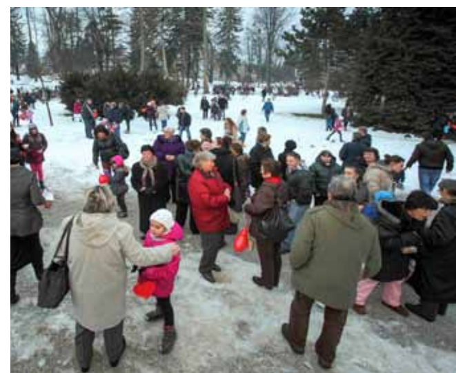
Ptičeki u ivanečkom gradskom parku svadbu su najavili za 12. veljače

Nakon povratka, domaćini su u društvenom domu sve sudionike počastili toplim ručkom, a potom je druženje nastavljeno u neformalnom tonu. Organizatori su zadovoljni što su, i unatoč polarnoj hladnoći, svoju rekreacijsku manifestaciju i ove godine uspjeli održati sa sasvim solidnim brojem sudionika. Inače, ovom pohodu izletnici se masovno odazivaju (preklani ih je sudjelovalo 250!), što se povezuje i s činjenicom da su nakon Božića i Nove godine, kada se obično voli pretjerati s „papicom“, građani naprosto željni kretanja i fizičke aktivnosti. Manifestaciju je podržala Turistička zajednica grada Ivanca. (ljr)