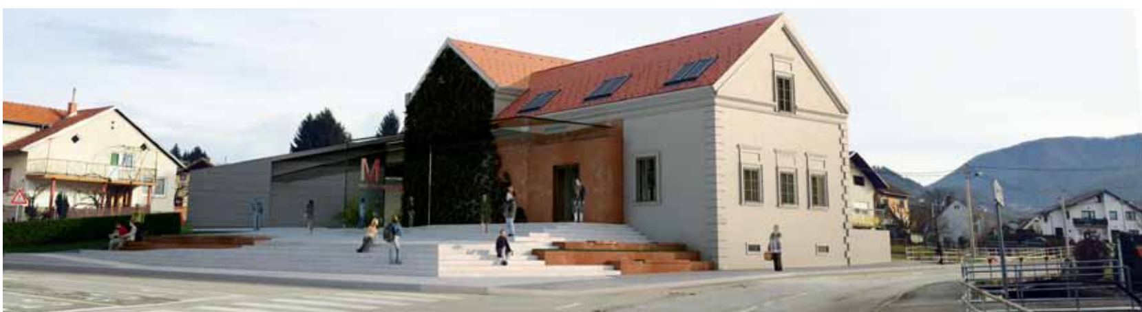
Muzej planinarstva dograđivat će se u još dvije predstojeće faze, a ovaj virtualni prikaz pokazuje njegov konačni budući izgled

–Riječ je o prostoru u prizemlju i podrumskom dijelu braniteljske zgrade, koji je Grad Ivanec dobio na trajno korištenje od države. Građevinski je potpuno neuređen, još je u robau fazi i troškovi njegova uređenja premašuju mogućnosti Grada. U proteklom vremenu vrlo smo