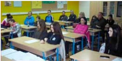
Izborna skupština ŽOK-a održana je u prostorijama Osnovne škole Ivanec

Istaknula je zapažene rezultate u provedenim natjecanjima i ekspanziju odbojkaškog sporta u Ivancu. Druga seniorska ekipa pobijednik je Županijskog odbojkaškog