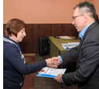
Zahvalnica za 30 godina rada u društvu

„Zbirkat“ aktivnosti koju je po tom pitanju realizirao DŠR gotovo je impozantna, što potvrđuju podaci o tome da su njegovi članovi sudjelovali na cijelom nizu pješačkih pohoda i planinarskih izleta, na brojnim turnirima u malom nogometu, haku, odbojki na pijesku, ribolovu, stolnom te