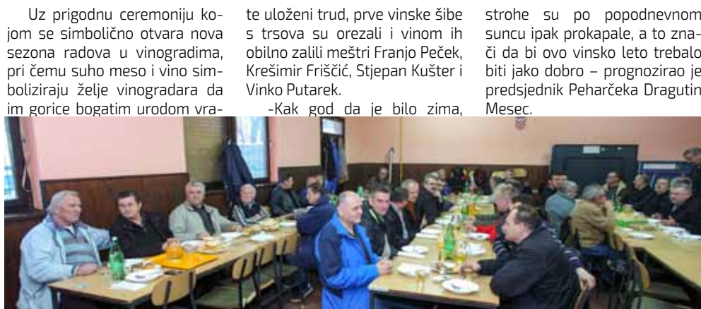
Druženje 90-ak vinogradara i podrumara u društvenom domu u Knapiću

Unatoč nezapamćeno dugom periodu vrlo niskih zimskih temperatura, i ivanečke gorice ovogodišnje su Vincekovo dočekale u skladu s tradicionalnim narodnim regulama. Okićene tablama finog, domaćeg špeka, dimljenim kobasicama i drugim mrsnim obiljem te obilno zalivene vinskom kapljicom koja krijepi tijelo i duh, ponovno su dale obol običajima kojima Ivančani slave sv. Vinka. Vidjelo se to i na središnjoj manifestaciji koju je u povodu Vincekovog u Lančić – Knapiću i ove godine priredila ivanečka Udruga vinogradara i voćara Peharček.