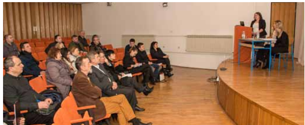
Savjetovanju se odazvalo 40-ak poduzetnika iz cijele Varaždinske i Krapinsko-zagorske županije

Budući da je problematika prijave projekata na EU fondove izrazito složena i da je za pripremu, kreiranje, kandidiranje i praćenje potrebno stručno znanje i iskustvo, svi oni koji se namjeravaju kandidirati za EU sredstva, pozvani su da koriste usluge Projektnog ureda. S obzirom na to da njegov rad novčano sub-