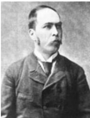
Božidar Kukuljević Sakcinski

Zabilježio je prikaze posvete kapele strica Ladislava, posvete barjaka DVD-a Ivanec u srpnju 1891. i školske zastave 1901. godine. Bio je utemeljitelj Braće hrvatskoga zmaja, predsjednik pjevačkog društva Kolo u Zagrebu i Vila u Varaždinu. U tom društvu istaknuo se kao dobar pjevač, a usto je svirao glasovir i uglazbio nekoliko skladbi. U Ivancu je 1898. godine utemeljio podružnicu Hrvatskog planinarskog društva.