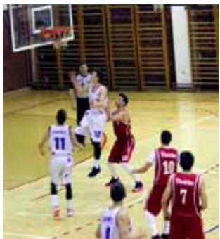
Juniori Ivančice vodeća su momčad na tablici