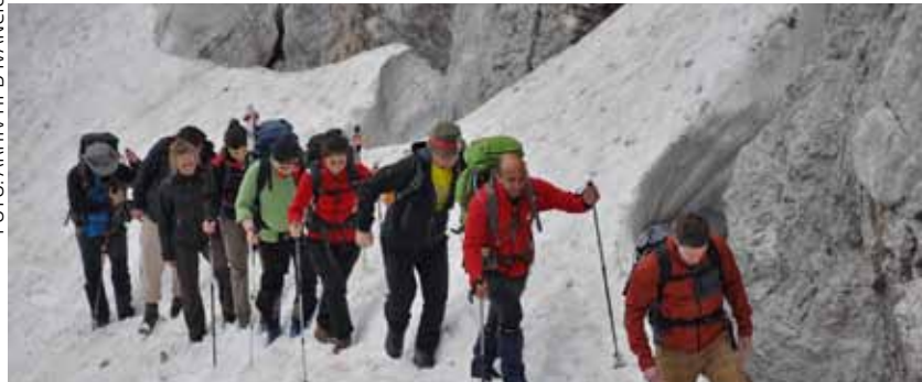
Polaznici koji svladaju program dobit će diplome Hrvatskog planinarskog saveza

obljetnice organiziranog planinarstva u Hrvatskoj. U popisu priznanja HPO-a od 2000. do 2016. godine, najveći skok na tablici je kod planinarskih društava Kapela iz Zagreba, Bilo iz Koprivnice, PK Ivanec, MIV-a iz Varaždina te Svilaže iz Sinja. (nn)