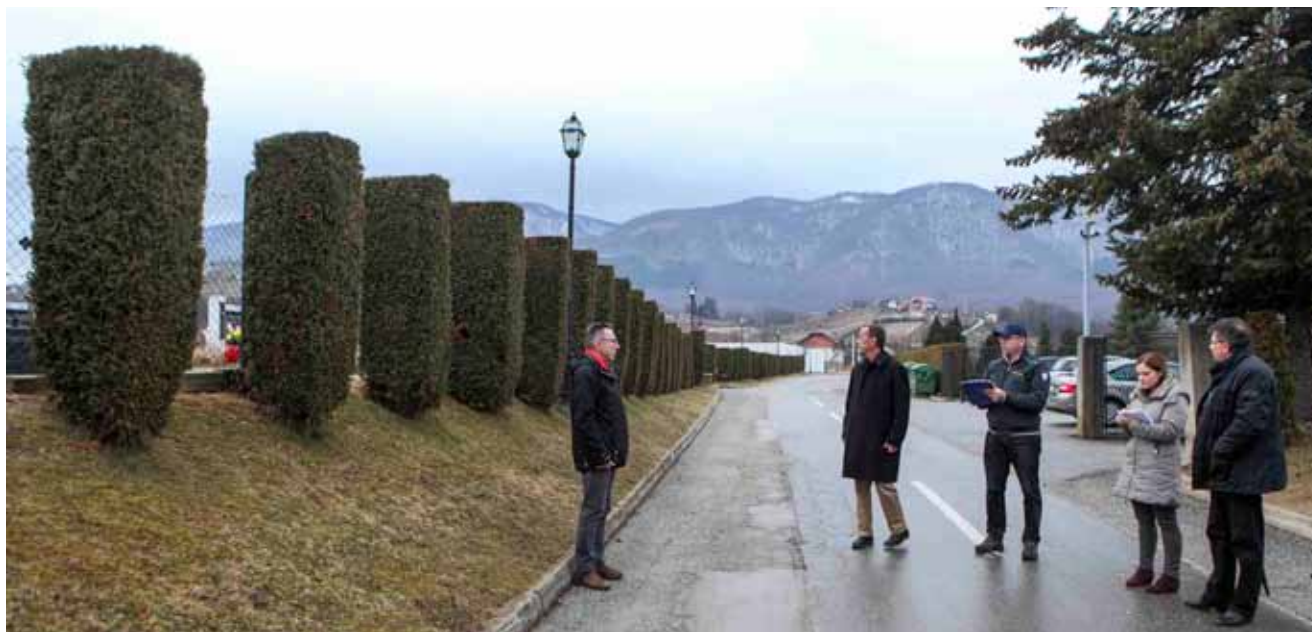
Neophodna je zamjena ograda groblja uz glavnu prilaznu cestu

ulaze divlje i domaće životinje, koje čine nered i štetu na grobovima. Također, predstoji i definiranje smjera i načina budućeg proširenja groblja i gradnje novih parkirališnih površina. Na licu mjesta utvrđena je i potreba uređenja pojedinih staza i zelenih površina