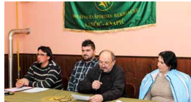
DŠR Lančić – Knapić lani je realizirao gotovo impozantan broj sportsko- rekreacijskih aktivnosti

le u krošnji smreke i samim tim ugrozile sigurnost prolaznika. I da u vremenskoj prognozi nisu bile obilnije snježne padaline (uslijed kojih bi grane sigurno pale na nogostup), opasnost je trebalo hitno otkloniti pa je Ivopolomio jak vjetar. Grane nisu pale na tlo, već su se zaustavi-