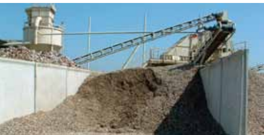
Projekt reciklažnog dvorišta građevinskog otpada kreće ove godine, a realizirat će se po fazama

–Najveći projekt koji će u 2017. Grad odrađivati sa ŽUC-om jest gradnja nogostupa uz ŽC Ivanec – Jerovec. Poznato je da Grad redovito prati ŽUC-ov program radova na način da s 25 posto sredstava sudjeluje u radovima na gradnji nogostupa. Ovogodišnjim programom predviđeno je da se pored izgrađenog nogostupa sagradi i javna rasvjeta, a to je investicija koja će se financirati iz gradskog proračuna. Što se tiče programa modernizacije cesta koja su pod nadležnošću ŽUC-a, on će se definirati naknadno i uvelike će ovisiti o njegovim financijskim mogućnostima.