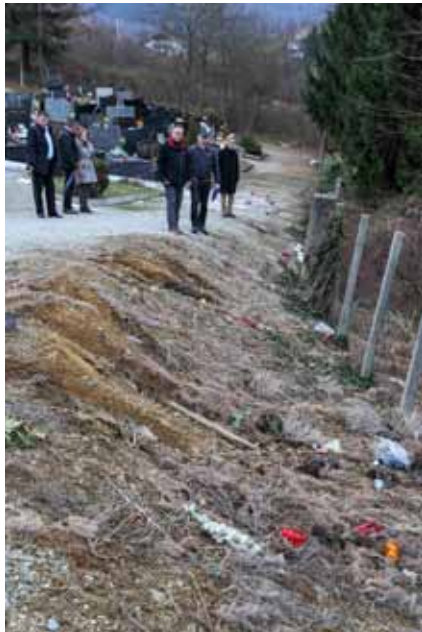
U obilasku ivanečkog groblja – ovako ne može

Kako bi osiguralo da se radovi izvode prema standardima uređivanja groblja i pravilima struke, Grad je zatražio stručnu i tehničku pomoć arhitekata. Nakon što Grad izradi cjeloviti koncept uređenja groblja, projektni za-