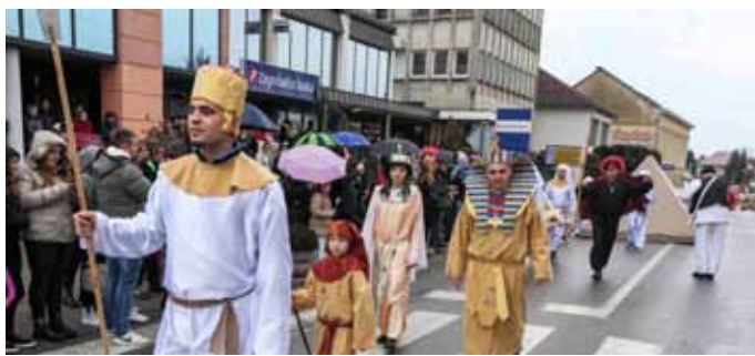
I domaće maskirane skupine redovito sudjeluju u fašničkom veselju

Organizatori pozivaju i sve ostale maskirane građane i djecu, bilo pojedinačno ili u grupama, da se također uključe u fašničku povorku i pridruže ovoj, jednoj od najpopularnijih pučkih manifestacija u našem gradu. (Ijr)