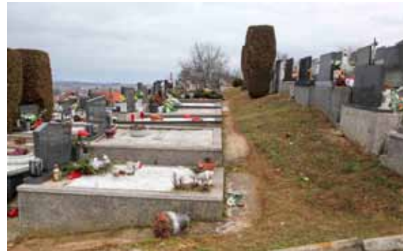
Predstoji estetsko i funkcionalno uređenje površina između grobova, staza i ograda

U cilju definiranja što preciznijeg programa investicijskog održavanja svakog pojedinog groblja, predstavnici Grada obići će i sva ostala gradska groblja. (ljr)