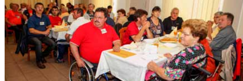
U Programu socijalne skrbi i potpore za udruge koje okupljaju invalidne osobe

Javne potrebe u kulturi Grada Ivanca obuhvaćaju sve programe, kulturne djelatnosti, akcije i kulturne manifestacije, kao i djelatnost ustanova koje doprinose razvitku kulturnog života, uključujući i investicije te druge prijeko potrebne zahvate na objektima kulture.(ljr)