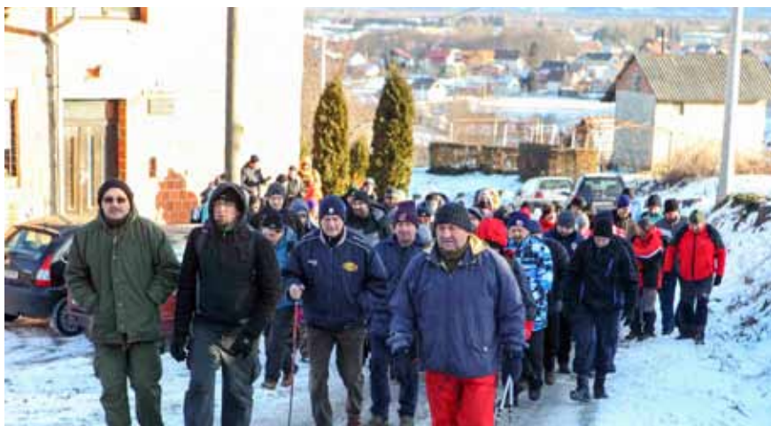
Od pješačkog pohoda izletnike nisu odvratile ni vrlo niske temperature s ledenim vjetrom koji je pojačavao osjet studeni

Iduće okupljanje ivanečki vinogradari imaju 10. veljače, kada će se u KTC-u sastati na svojoj godišnjoj skupštini. Očekuje se dobar odaziv, to više što odmah nakon skupštine slijedi predavanje o temi koja je noćna mora za sve vinogadare, a to je suzbijanje zlatne žutice, bolesti koja vinogradima nanosi goleme štete. (ljr)