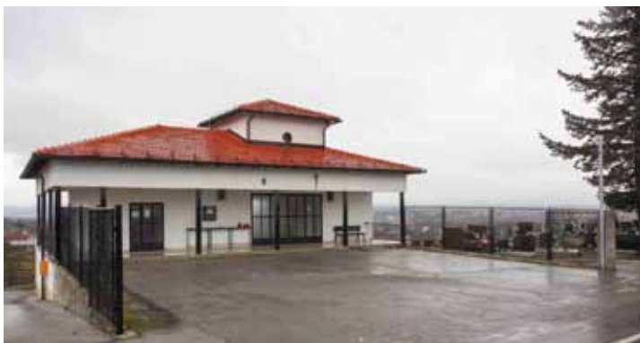
Ispred grobne kuće ove će se godine graditi nadstrešnica

♦♦ Primarna ovogodišnja zadaća bit će gradnja nadstrešnice ispred grobne kuće na gradskom groblju u Ivancu