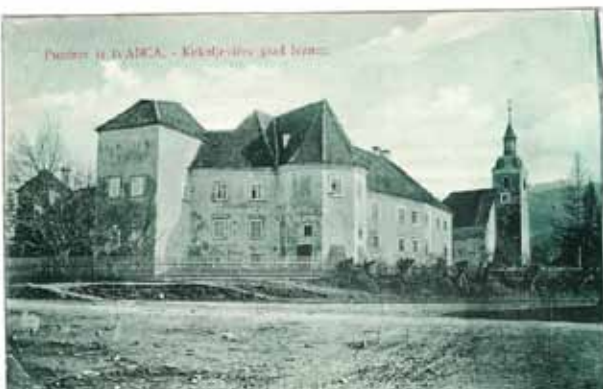
Stari grad Ivanec – razglednica iz 1898. godine