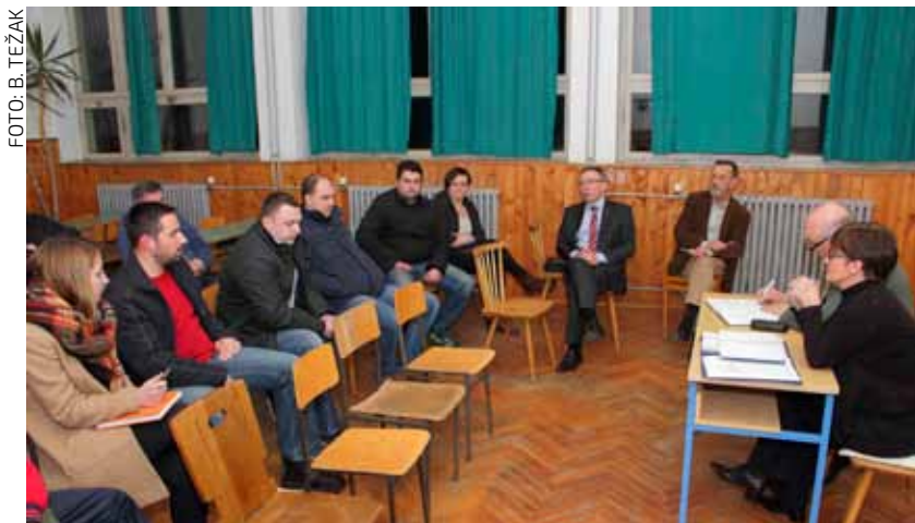
Na radnom sastanku u staroj salinovečkoj školi

SALINOVEC Radni sastanak gradskih čelnika s predstavnicima Vijeća MO-a i svih udruga