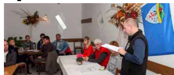
Vodstvo PK Ivanec iznijelo je bogato izvješće o radu u prošloj godini i zacrtalo ambiciozni plan rada za 2017.

Aktivna je bila i Sekcija mladeži koja okuplja učenike škola u Ivancu i Klenovniku, a koja je organizirala više aktivnosti i izleta prilagođenih dačkoj dobi. Mladi planinari posjetili su i NP Risnjak. Radila je i Sekcija za markacije,