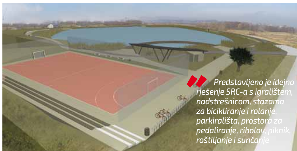
Predstavljeno je idejno rješenje SRC-a s igralištem, nadstrešnicom, stazama za bicikljanje i rolanje, parkirališta, prostora za pedaliranje, ribolov, piknik, roštiljanje i sunčanje

Podsjećajući da je za projekt dječjeg igrališta, čiju je gradnju Grad predlagao na dijelu sadašnjeg parkirališta, bilo i otpora od strane pojedinih ljudi u školi, gradonačelnik Batinić kazao je