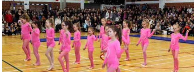
Ljupke plesačice oduševile su publiku

Uz suvremene plesove, mladi su parovi izveli i cha-cha-cha i engleski valcer. Plesači su nastupili u dobi od 3 do 16 godina, svrstani u kategorije mini, djeca, kadeti i juniori. Djecu i mlade u PK Ivančica uvježbale su