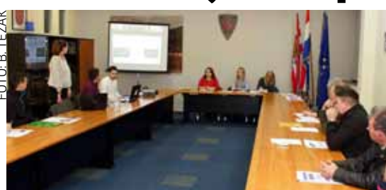
Prezentaciju su pratili vlasnici OPG-ova iz Varaždina, Novog Marofa, Lepoglave, Voće, Maruševca i Ivanca

U četvrtak, 16. veljače, u ivanečkoj Gradskoj vijećnici održana je informativna prezentacija natječaj za provedbu podmjere 6.3.1. Potpora razvoju malih poljoprivrednih gospodarstava iz EU fonda za ruralni razvoj. Prezentaciji se odazvalo petnaestak poljoprivrednika i vlasnika OPG-ova s cijelog područja Varaždinske županije, koji su