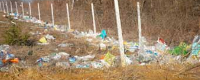
Razneseno smeće izvan ograde odlagališta komunalnog otpada u Jerovcu bit će uklonjeno, a kako bi se spriječilo da ga vjetar raznosi, postaviti će se mreže

Što se tiče drugog dijela pitanja, točno je da jugozapadni vjetar diže lagani otpad i raznosi ga po parcelama izvan ograđenog odlagališta. Praksa je bila da djelatnici Ivkoma taj otpad pokupe najmanje jedanput tjedno unutar kruga odlagališta. Međutim, duga zima i snijeg izazvali su veće probleme i sada je vidljivo da smeća ima u većim količinama. Temeljem konzultacija sa stručnjakom koji je radio prošle godine na odlaganju otpada, predloženo je da se izradi optimalnog rješenja koje će spriječiti raznošenje smeća i onečišćavanje okoliša.