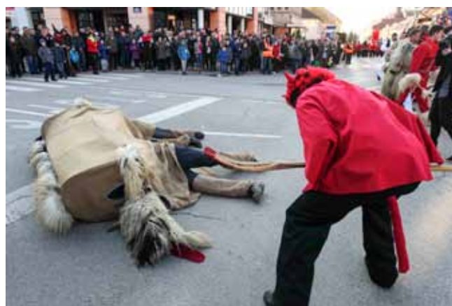
Je l' živ? Ha? Treba li ga bocnuti?