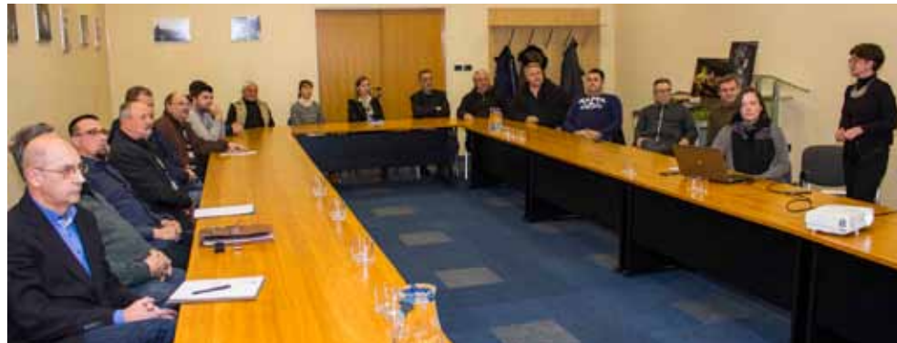
Na predstavljanju Idejnog rješenja SRC-a u Gradskoj vijećnici

Kako bi se što prije moglo prići nastavku aktivnosti, dogovoreno je da mještani, sportski rekreativci i predstavnici SRD-a s arhitektima iz Studija Nexar što prije obidu teren, da jasno definiraju svoje želje i potrebe, da odrede namjene pojedinih površina i definiraju obuhvat i dimenzije staza te da arhitektima daju elemente i smjernice za izradu glavnog projekta. (ljr)