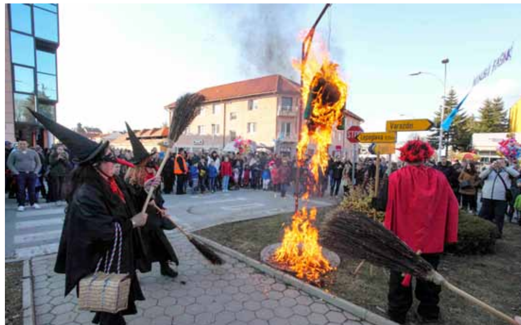
Prije ki sud nije imalo milosti za Princa karnevala