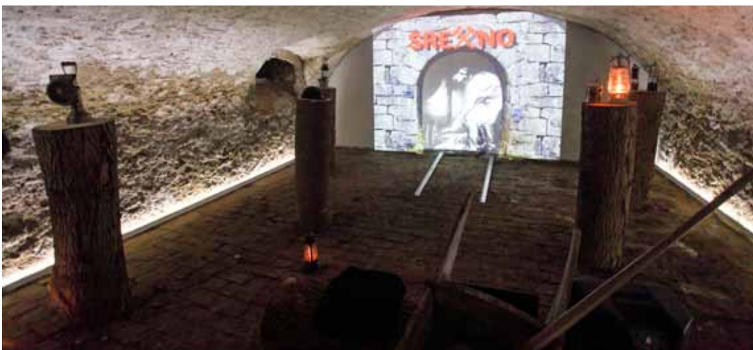
Multimedijalnom prezentacijom je podrum objekta pretvoren u rudarsko okno

Skupu se obratio i gradonačelnik Milorad Batinić: