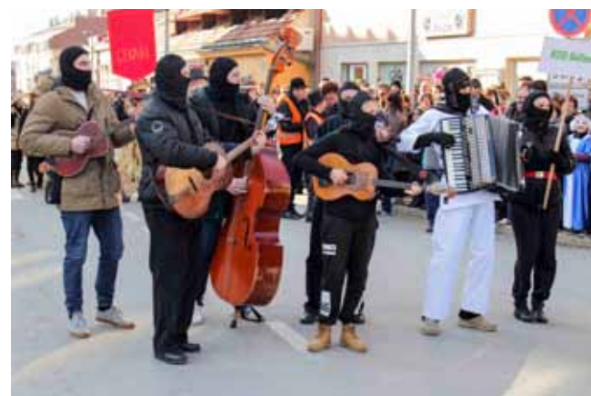
„Prominija san govor pa nisi znala ko je...“

Nakon što su osudile i spalile Princa fašnika, maškare su urnebesnu zabavu nastavile u dvorani KTC-a u Ivancu. Zahtjevu organizaciju ove masovne priredbe potpisuje Društvo Maska, uz novčanu potporu i logističku pomoć Grada Ivanca kao pokrovitelja. Pomoć u poklonima i suvenirima suvenira osigurao je i TZ grada Ivanca, a uključilo se i veliko mnoštvo sponzora. (Ijr)