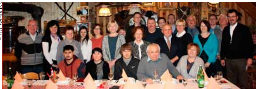
Ivanečki klub kolekcionara na izornoj skupštini 2017. godine

Programom rada za 2017. godinu planirana je živa aktivnost u Ivancu i