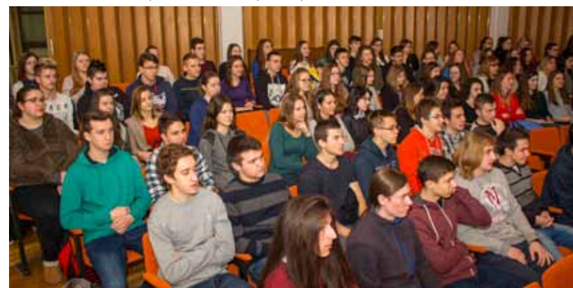
Ivanečki srednjoškolci pokazali su iznadprosječno znanje njemačkog i engleskog

Ovo natjecanje učenicima je pružilo mogućnost da procijene vlastito znanje i sposobnost uporabe engleskog i njemačkog jezika u odnosu na svoje europske vršnjake. Potaknuta odličnim rezultatima, koji pokazuju iznadprosječno znanje ivanečkih srednjoškolaca u poznavanju stranih jezika, ali odražavaju i odličan rad njihovih profesora, ravnateljica Srednje škole Lidija Kozina poručila je da će se u spomenuta natjecanja škola uključiti i u idućoj školskoj godini.