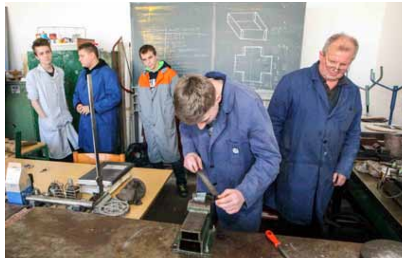
Grad Ivanec i partneri pokreću zajedničku inicijativu usmjerenu prema novoj politici školovanja kadrova za potrebe metaltskih i strojarskih poduzeća

U četvrtak, 16. veljače, u ivanečkoj Gradskoj vijećnici održana je informativna prezentacija natječaj za provedbu podmjere 6.3.1. Potpora razvoju malih poljoprivrednih gospodarstava iz EU fonda za ruralni razvoj. Prezentaciji se odazvalo petnaestak poljoprivrednika i vlasnika OPG-ova s cijelog područja Varaždinske županije, koji su