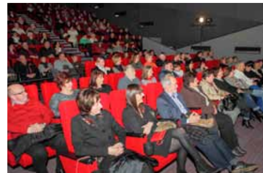
Kinodvorana je bila ispunjena do zadnjeg mjesta