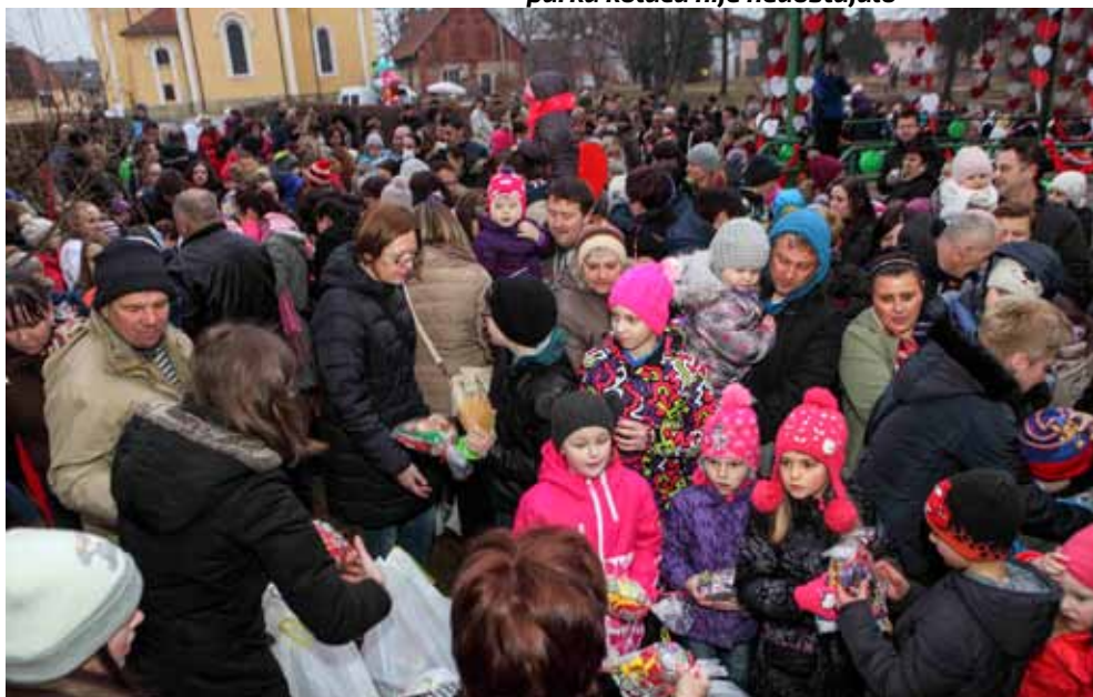
Masovan odaziv djece i roditelja priredbi Ptičeki se ženiju

radnica Nade. Zahvalila je velikom broju sponzora, volontera i građana koji su darovali slatkiše i poklone, a napose Gradu Ivanec koji je i ove godine financijski podupro Ptičke. Zahvaljujući tomu, nijedno dijete nije iz parka otišlo bez slatkog poklona, a ne treba ni posebno spominjati ko-