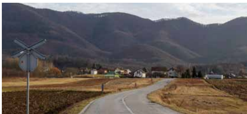
Prema najavi gradonačelnika, javna rasvjeta na potezu od pruge do Kaniže pokušat će se sagraditi još ove godine

U projekte komunalne, prometne i gospodarske infrastrukture ove se godine planira uložiti 4,75 milijuna kuna. Kao glavni projekti navedeni su: rekonstrukcija nerazvrstane ceste u Prigorcu (projekt je prijavljen