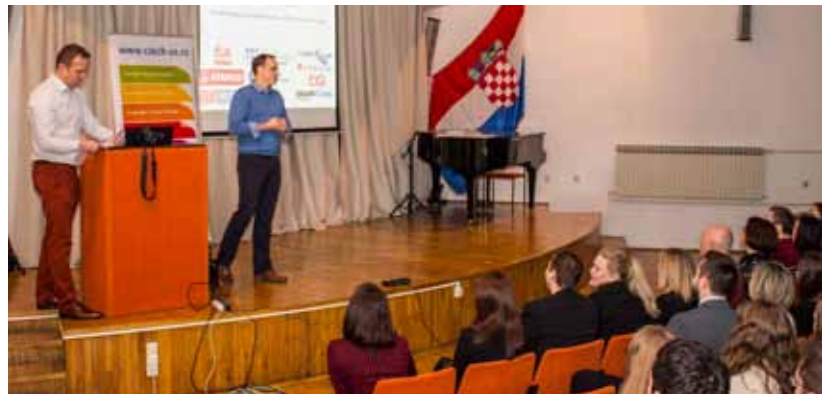
Predstavnici organizatora na odličnim su rezultatima čestitali učenicima i njihovim profesorima

U natjecanje Best im Deutsch sudjelovalo je oko 3.000 učenika iz više od 200 škola diljem Europe. Iz ivanečke škole u natjeca-