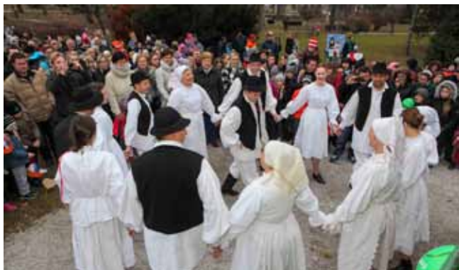
Pučku svadbu prikazao je KUD Salinovec