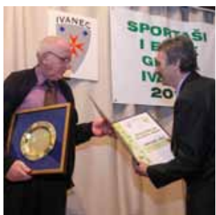
Nagrada I. Geciju za životno djelo

odbojkaškog kluba (prvakinje Županijskog kupa i trećeplasirana ekipa u 2. NOL Centar).