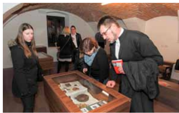
U nekadašnjoj staroj školi otvorena je izložba etnoloških predmeta

–Veseli me što među okupljenim Ivančanima vidim i one iseljene, koji ne žive ovdje, ali ih nostalgija vuče u rodni kraj. Grad Ivanec je mali, ali s velikim srcem, i uvjeren sam da ćemo u ovom zahtjevnom, ali sadržajno bogatom objektu uspeti sačuvati našu prošlost, sadašnjost i budućnost. Nakon deset godina pojačanih ulaganja u komunalnu i gospodarsku infrastrukturu, gradska je uprava odlučila krenuti u drukčijem smjeru. Rezultat toga su nedavno otvoreno kino, a sada i muzej, koji predajem svim građanima Ivan-