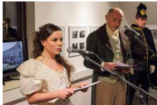
Povijesne tekstove o Ivancu i Ivančici interpretirali su dramski umjetnici HNK Varaždin