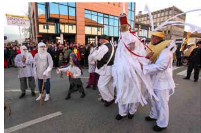
Stažnjevcani su redoviti gosti Ivonjskoga fašnika