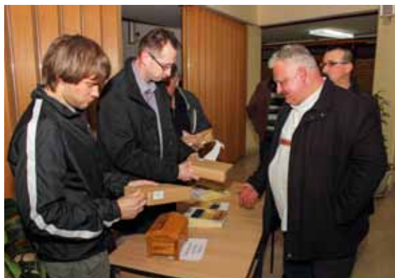
Škrinjica se tiska u nakladi od oko 700 primjeraka, a dijeli se besplatno

IVANEČKI KLUB KOLEKCIONARA 11. izdanje časopisa Ivanečka škrinjica