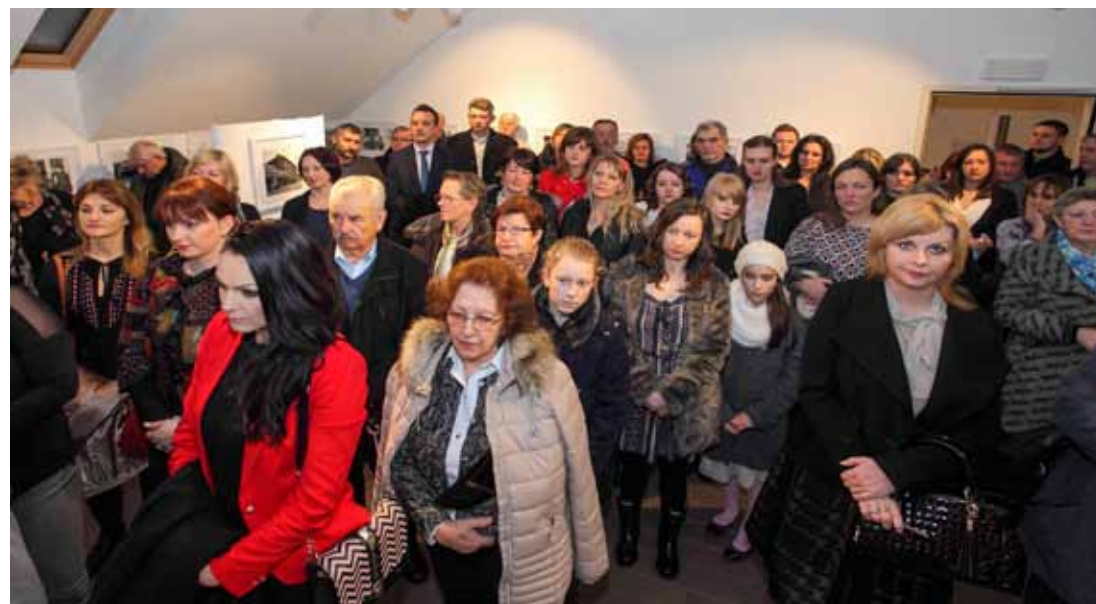
Na svečanosti otvaranja muzeja okupilo se veliko mnoštvo građana i uzvanika