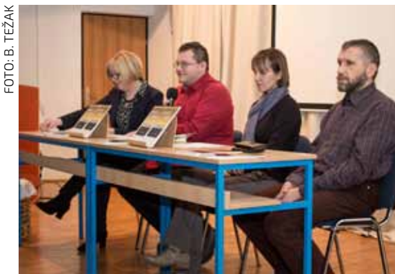
Na svečanosti predstavljanja jedanaestog broja Ivanečke škrinjice

Glavna izložba tim će povodom biti postavljena