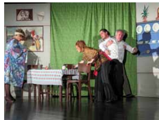
Glumački ansambl Kerekesh teatra publiku je nasmijsao do suza

Ulaznice za predstave mogu se rezervirati telefonom u Pučkom otvorenom učilištu Ivanec (ponedjeljak – petak) od 12 do 14 sati, pozivom na broj 042/770 530 ili svakodnevno na e-mail: ivaneckino@gmail.com, info@uciliste-ivanec.hr