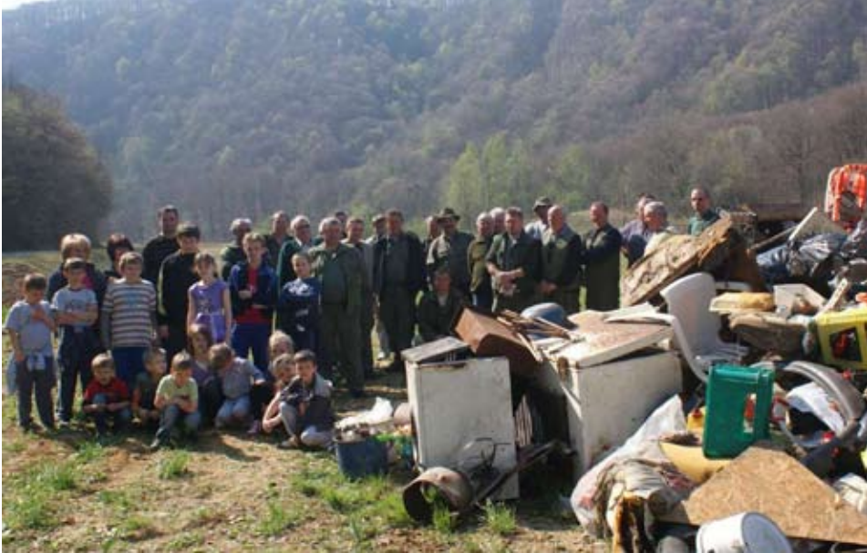
Kad se slože male i velike ruke...

Da zaključimo: kuhinjska napa i drugi ventilatori koji izbacuju zrak u atmosferu ne smiju biti instalirani, ako imamo plinski uređaj s priključkom na dimnjak.