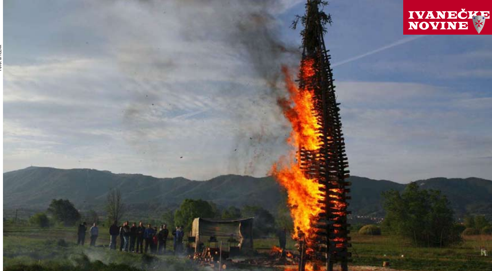
NARODNI OBIČAJI U uskrsnoj noći krjesovi su obasjali cijeli ivanečki kraj Vuzemljica u Bedencu ove godine bila je visoka oko 16 metara