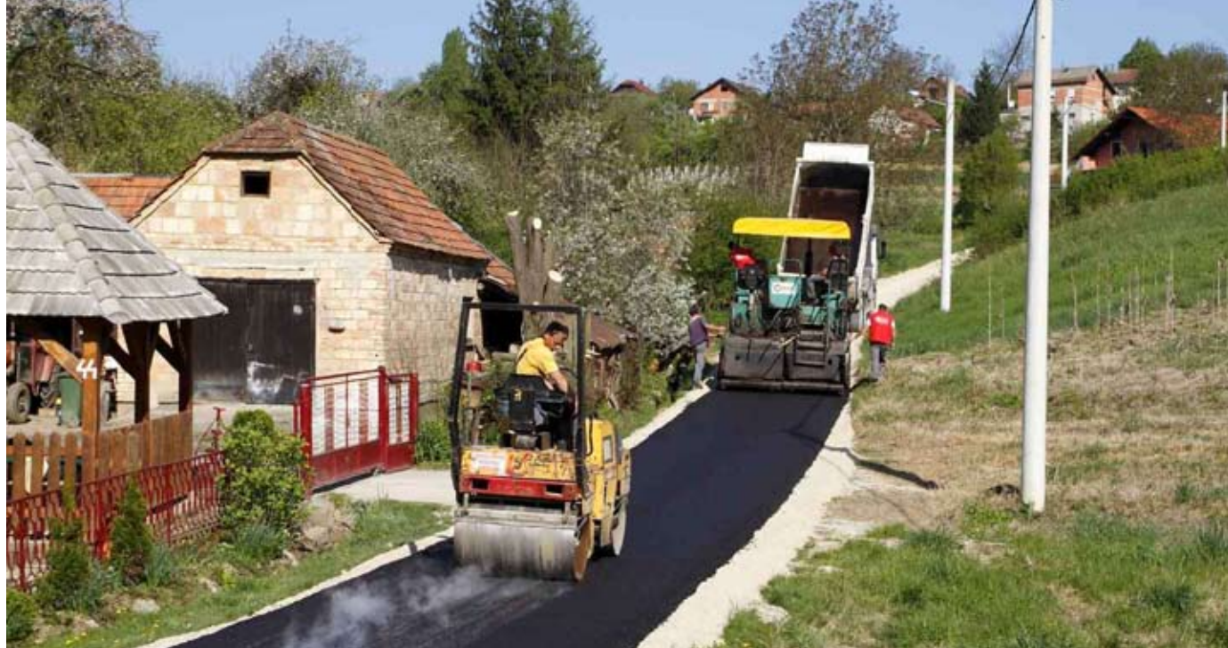
Asfalt je položen i na pravce u Mjesnom odboru Škriljevec

CESTE U NOVOM RUHU Na području grada Ivanca asfaltiraju se nerazvrstani prometni pravci