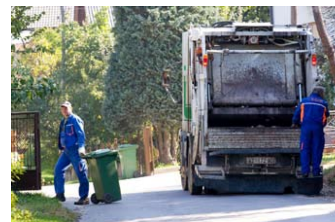
Zbrinjavanje smeća kod nas je dobro organizirano, a odvozom je obuhvaćeno 93 posto građana

- Besplatne vreće za sortiranje Ivkom dijeli već tri godine. Kad komunalci u kućanstvima preuzimaju pune vreće, po „automatizmu“ na istom mjestu