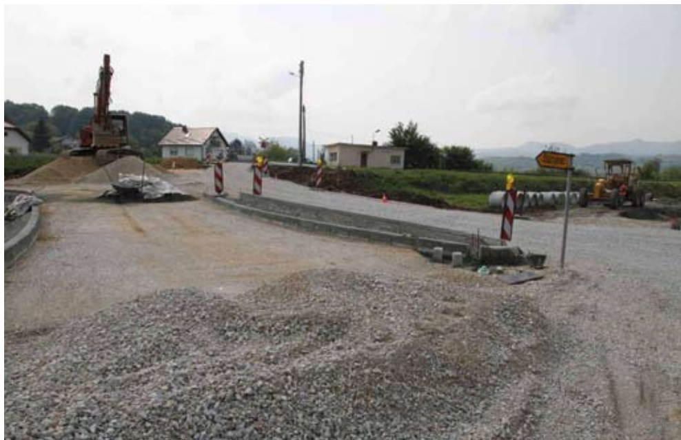
Radovi na uređivanju suvremenog raskrižja s državne ceste D35 prema Stažnjevcu

Pojedini vijećnici zatražili su pojašnjenje o kriterijima po kojima Crveni križ obiteljima dodjeljuje pomoći, o broju obitelji s ivanečkog područja koje ostvaruju pravo na nju, a rečeno je da se za potrebe Grada Ivanca