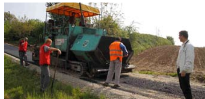
Asfaltiranje u zaselku Kotijaši u MO Lovrečan

VODOTOKOVI Hrvatske vode uređuju potok Lukavec od Cerja Tužnog do Lukavca