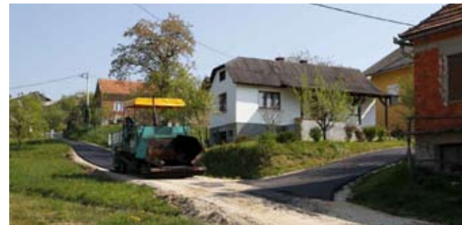
Stigao je asfalt i u zaselak Kučeji u MO Bedenec

Nije je dao samo jedan vlasnik, kroz čije parcele prolazi najveći dio puta, pa će se problem pokušati riješiti dogovorom, s gradskim službama. (ljr)