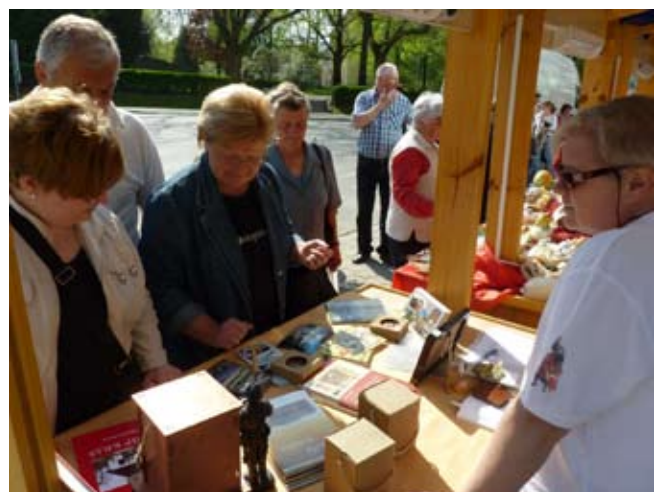
I Turističko društvo Ivanec ponudilo je svoje suvenire, brošure i vodiče

Izložbu je organizirao Grad Ivanec, a jednostušna je ocjena da je „izlazak“ iz četiri zida među građane bio pun pogodak. (ljr)