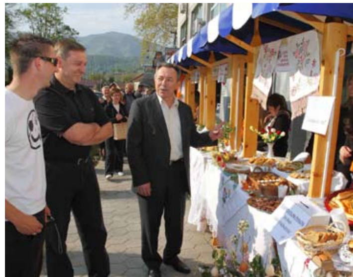
Bogatu uskrsnu izložbu obišli su i gradski čelnici

A slično je raspoloženje vladalo i za ostalih dvadesetak štandova, za kojima su izlagači nudili proizvode koji se ne vidaju baš svaki dan. Tako je Učenička zadruga OŠ Radovana ponudila rukom vezene prekrivače, kojima se prekriva hrana što je žene na uskrsno jutro u crkvu nose na posvetu. Umjetnik Slavko Bunić izložio je mramorna i drvena jaja,