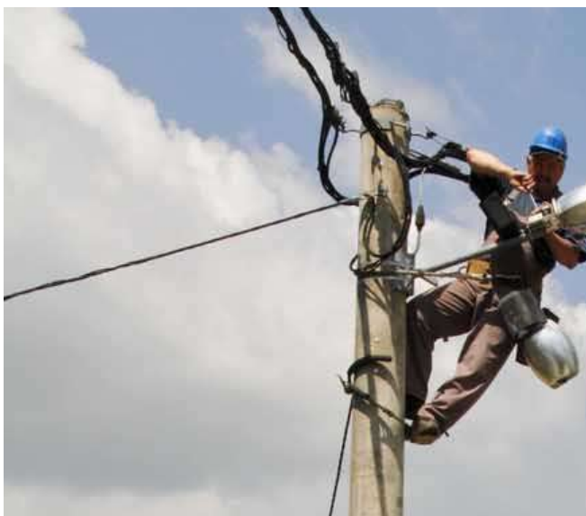
Grad Ivanec dosad je za projekt energetska učinkovite javne rasvjete od države povukao više od 838.000 kuna

Ovim projektom ćemo, laički rečeno, sustav paljenja i gašenja javnom rasvjetom „izvaditi“ iz HEP-ovih trafostanica i montirati u posebne ormariće pod kontrolom Grada. Time bi Grad sam, uvažavajući mišljenje i potrebe mjesnih odbora, određivao vrijeme paljenja i gašenja rasvjete. Sam će određivati koliko će se svjetiljki gasiti, a koliko će ih svijetliti u gluhim noćnim satima, kada je frekvencija prometa slaba, pa nema ni potrebe da rasvijeta radi punim kapacitetom. Na takav način rasvjetnim ćemo tijelima moći upravljati prema