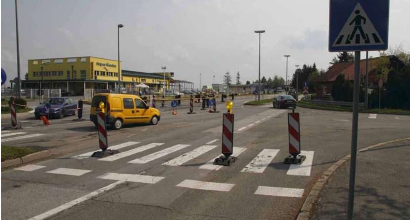
Rotor će se graditi na ivanečkoj obilaznici, a pregovori o tome između Grada Ivanca, HC-a i ŽUC-a u visokoj su fazi

Teme vezane uz radove na obilaznici bile su u središtu interesa gradskih vijećnika