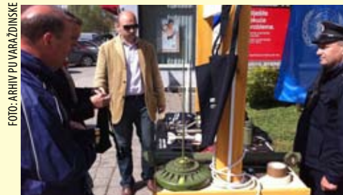
U suradnji policije i Vijeća za komunalnu prevenciju, na gradskoj špići bio je postavljen info-punkt

Akcija je na području Varaždinske županije trajala od 4. do 20. travnja i u tom vremenu građani su dragovoljno predali 37 ručnih bombi, 7 tromblonskih mina, jednu protupješačku minu, jednu poluautomatsku pušku, te više od 1.000 komada raznog streljiva. Time akcija prikupljanja ilegalnog oružja ne završava, pa policija poziva sve građane