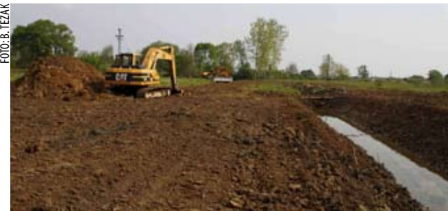
Uređene površine neke će mještane potaknuti da na dosad zapuštenim površinama, opet počnu sijati i saditi

■ Korito nije čišćeno, kažu mještani, dobrih tridesetak godina