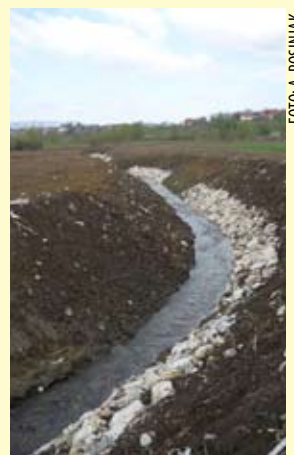
Korito Bistrice mjestimično je obloženo kamenom

Tehničkim uređenjem Bistrice ujedno je očišćen obalni prostor i uređen prilaz parcelama, pa su vlasnici zapuštenih njiva pozvani da ih ponovno počnu obrađivati. Radovi, čiji je nositelj varaždinska Ispostava Hrvatskih voda Plitvica-Bednja, u međuvremenu su nastavljani u pravcu mosta na ivanečkoj obilaznici. (ljr)