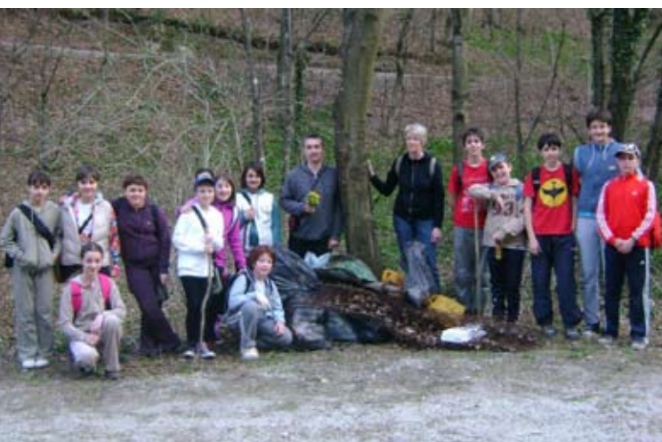
U povodu Svjetskog dana voda, akciji čišćenja pridružila se i sekcija mladih planinara

Prihvaćen je ambiciozan program rada i financijski plan za 2011. godinu. Planinari nisu prihvatili odluku Zajednice sportskih udruga kojom je odbijena zamolba Planinarskog kluba Ivanec za prijam u ravno-pravno članstvo ZSU.(nn)