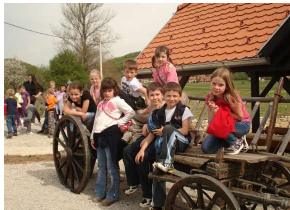
Nakon obilaska brojnih izvora, potoka i stajaćih voda, djecu su svoje veselo druženje završila kod vodenice u Margečanu