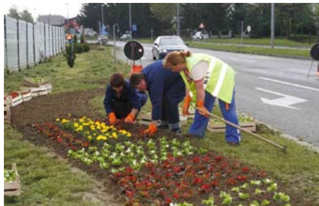
Cvjetne gredice zasadit će se s desetak tisuća proljetnica

- Nakon što zasadimo cvijeće na površinama kod Poljodoma, selimo se nešto niže, gdje ćemo cvijećem oblikovati malteški križ, grb Ivanca. A nakon toga cvijeće ćemo saditi u centru grada – poručila je M. Skroza. Nadamo se da će trud radnica i ove godine doprinijeti da Ivanec ponovno bude proglašen najuređenijim malim gradom Varaždinske županije.(ljr)