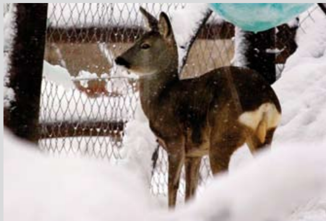
Idila u Prigorcu