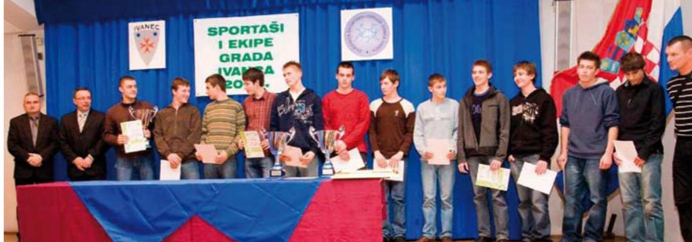
RUKOMET Finale Županijskog kupa RS Varaždin