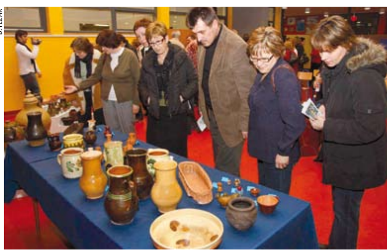
Posjetitelji su s interesom razgledali zbirku tradicijske lončarije

- Nije bio problem samo glinu iskupati i obraditi je, oblikovati i ispeći, već je problem bio i prodati je i tako prehraniti obitelji. Kroz stoljeća na takav način svoju je egzistenciju osiguravalo i lončarijom svoju djecu i obitelji podizalo na stotine lončara. Istražujući lončariju, koja mi je oduvijek bila predmet posebnog