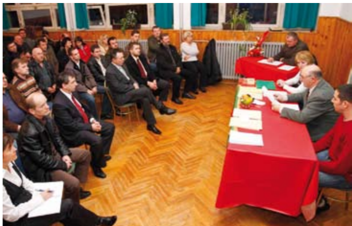
Skupština DSR-a Salinovec održana je u staroj školi