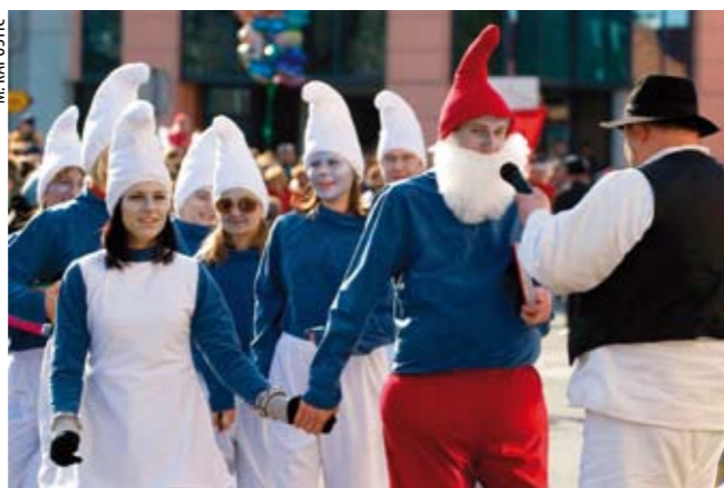
Iz Stažnjeva su došli ljupki štrumpfovi

vrhu glave. Simpatije publike pobrale su vidovečke mažoretkinje kostimirane u mišice i mačke, koje su priredile i poseban plesni program. Dječicu su posebno razveselili mali klaunovi iz Salinovca i skupina štrumpfova iz Stažnjeva. Originalnim maskama predstavila se skupina „neandertalaca“ iz Krapine (TD Krapina), a na Ivonjski fašnik došli su i elegantno odjeveni članovi dvorske svite iz ivaničgradskog društva Žaba. Uz Maskina Krampusa, koji je vi-