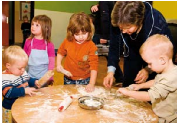
I najmlađi su vrijedno razvlačili tijesto

- Donijela sam slatko medeno tijesto, koje djeca sama mogu rastegnuti, oblikovati, ispeći i pojesti, dok je ovo drugo tijesto namijenjeno pripremi