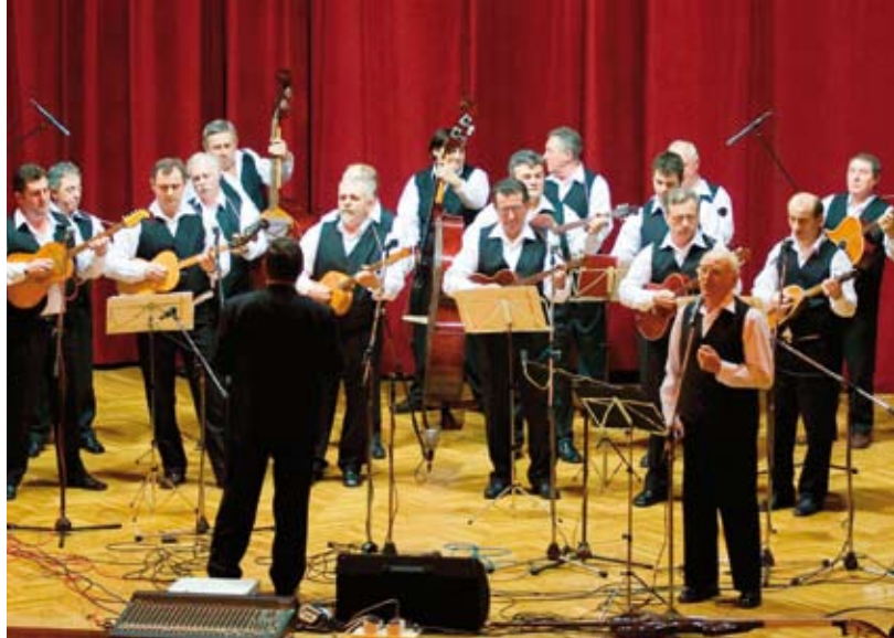
Za pomoć malenoj svirao je i KUD Itas