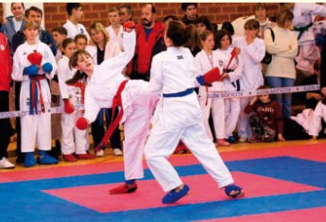
Regionalno karate prvenstvo okupilo je natjecatelje iz šest županija sjeverozapadne Hrvatske

U bajere su bačeni odrasli primjerci štuke, prosječno teški dva kilograma