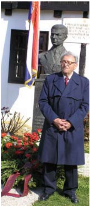
Ivanec Udruga antifašističkih boraca i antifašista