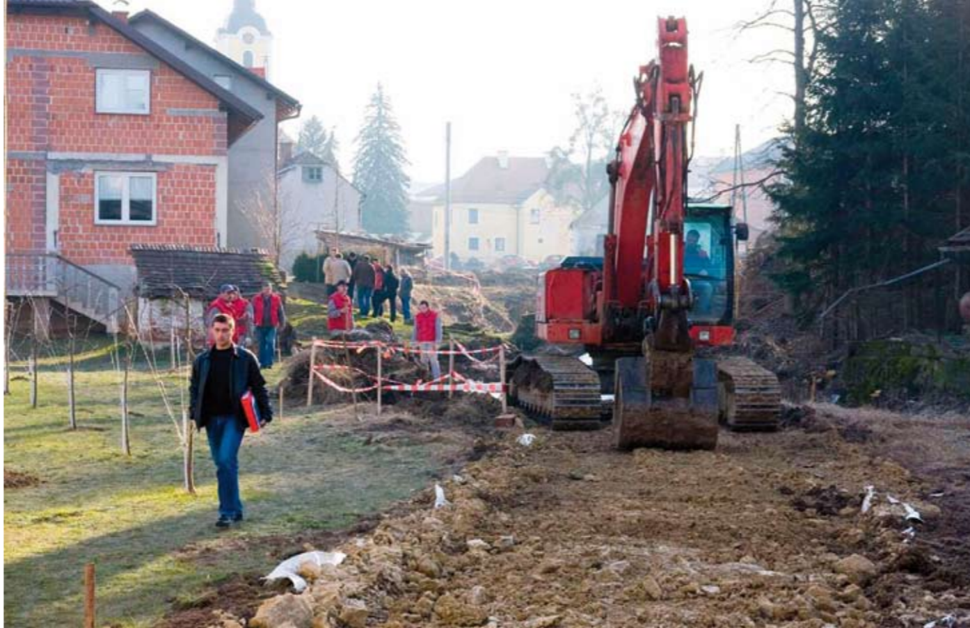
Radove obavlja varaždinska Cesta

U cijelom tom zahvatu naj-složeniji i najskuplji bit će „zaustavljanje“ Bistrice u betonsko korito širine 3,40 metara i visine od 1,60 do 2,90 metara, za što će se utrošiti oko 1.100 prostor-