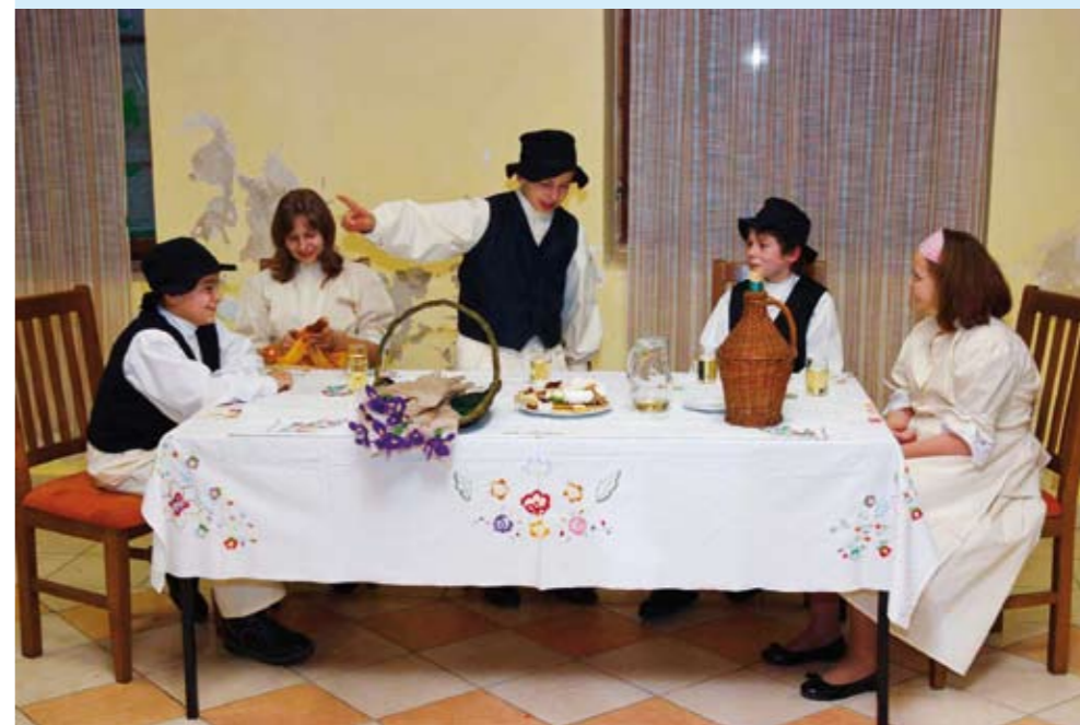
Margečanski učenici izveli su predstavu Kak se nekad vogledašilo

Nakon predstave, druženje je nastavljeno u veselom raspoloženju, a za dobru atmosferu pobrinula se glazbena skupina Lirika. (ljr)