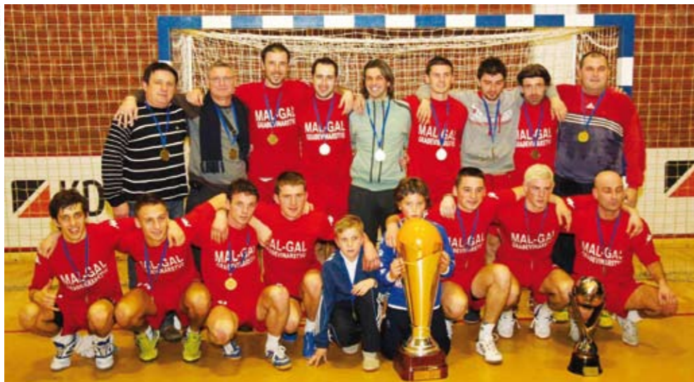
Pobjednik turnira je ekipa Mal Gal&Građevinarstvo