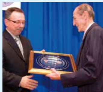
Franja Hrgu nagrada ZŠU-a

stolju. S baš svih dosadašnjih natjecanja u zemlji i inozemstvu, srčana petra uvijek se vraćala s medaljama. Nadalje, nauspješnijom muškom ekipom u 2008. proglašena je momčad RK Ivančice – godište 1992. i mlađi, najbolja generacija u povijesti kluba.