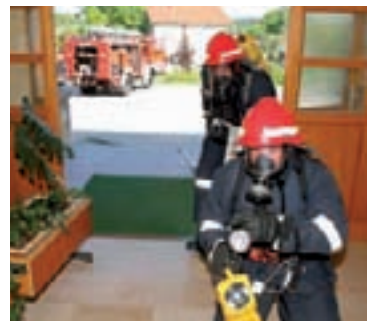
Vatrogasci su vježbu odradili profesionalno

Djeca su rado i s veseljem sudjelovala u vježbi