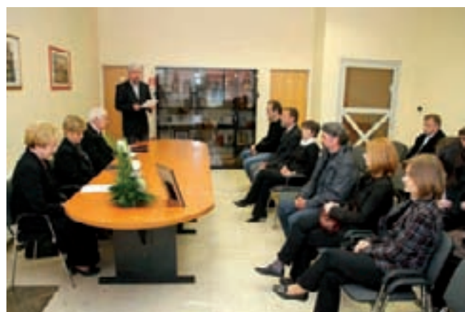
U Gradskoj vijećnici održana je komemoracija

Hrvatskog novinarskog društva, idejni začetnik neformalne skupine Ivanečki pjesnički krug i član Varaždinskog književnog društva . Odlično je poznao ivanečku povijest, a