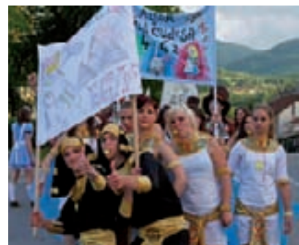
Sretno, generaciju 2010./2011.!

Svačije je srce zadrhtalo kad su na kraju, u svojim šarenim kostimima svi zajedno zaplesali i tako pokazali roditeljima i profesorima da su generaciju 2010./2011. uspješno pripremili za život i izazove kojih su tek – pred njima. (ljr)