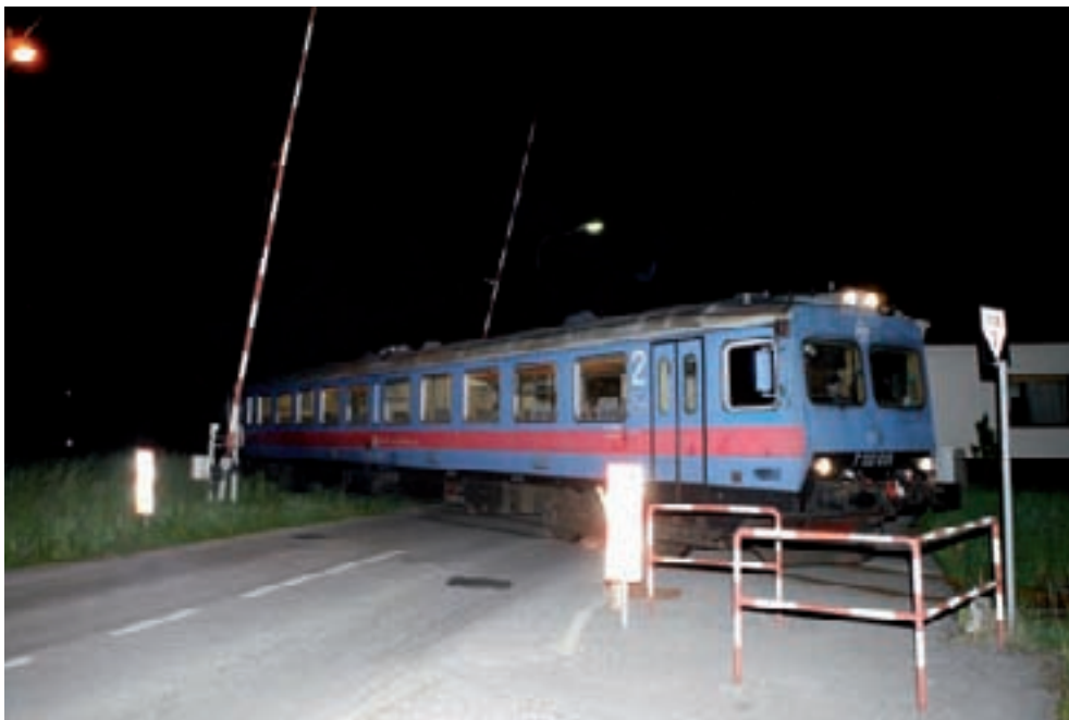
U noćnim satima polubranici se ne spuštaju, pa vozači nailaze na otvorenu prugu, ravno pred vlak

Prije su branike ručno spuštali radnici, ali to ne rade već