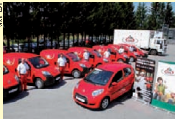
Nova vozna „ergela“ IMI Ivanec; tko će dobiti glavnu nagradu – Citroën C1?