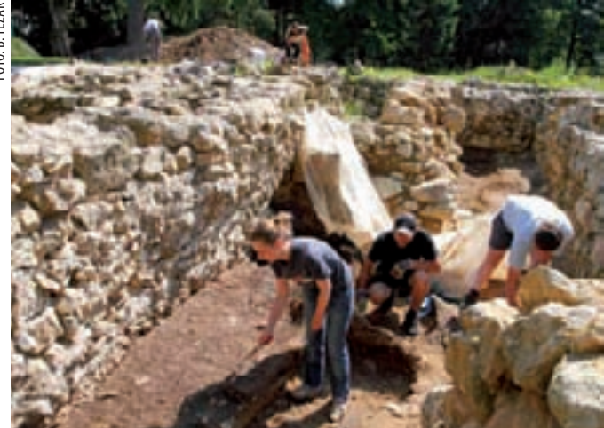
Ove se godine provodi deseta etapa arheoloških istraživanja na lokalitetu Staroga grada Ivanca