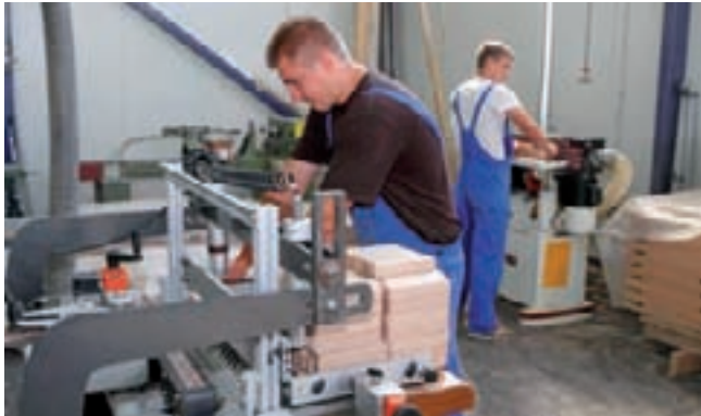
Uspjeh Ivanca rezultat je vlastitih snaga i povoljne poduzetničke klime