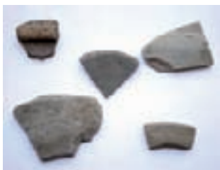
Keramika iz rimskog naselja koje je nekad živjelo u centru današnjeg Ivanca

mo ga prstom pokazati, a nalazi se ispod srednjovjekovnog sloja. Osim ostataka keramike, tu smo pronašli i ulomke rimskih narukvica od plavog stakla i koštanu oplatu češlja kakvi se javljaju tijekom 3. i 4. stoljeća poslije Krista. Budući da je detaljna obrada ulomaka još u tijeku, tek ćemo vidjeti kakvu će nam ispričati priču o povijesti područja na kojemu je kasnije izrastao Ivanec – kazao je dr.