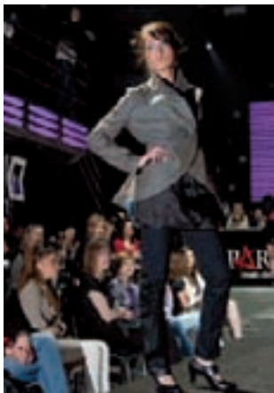
Ivanečka Ivančica vodeći je hrvatski izvoznik obuće, a svoje modele nedavno je predstavila na Fashion Weeku u Nišu

vali najviše potpora iz državnog proračuna po stanovniku, u prosjeku nešto više od 3.000 kuna na godinu. HNS-ovi i IDS-ovi gradovi pak su dobivali upola manje državnih potpora, konkretno, za HNS-ove gradove ta je svota iznosila 1.314 kuna potpora po stanovniku. No, u slučaju Ivanca, u kojemu vlada koalicija HNS-SDP-HSU, te su potpore drastično manje.