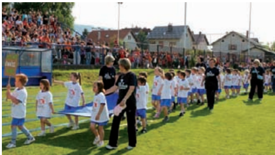
Prva, pa zlatna! Mali ivanečki olimpijci

Pobjednici su klinci iz ivanečkog vrtića Ivančice, druge su Zvezdice iz Marčana, a brončani su mališani lepoglavskog vrtića