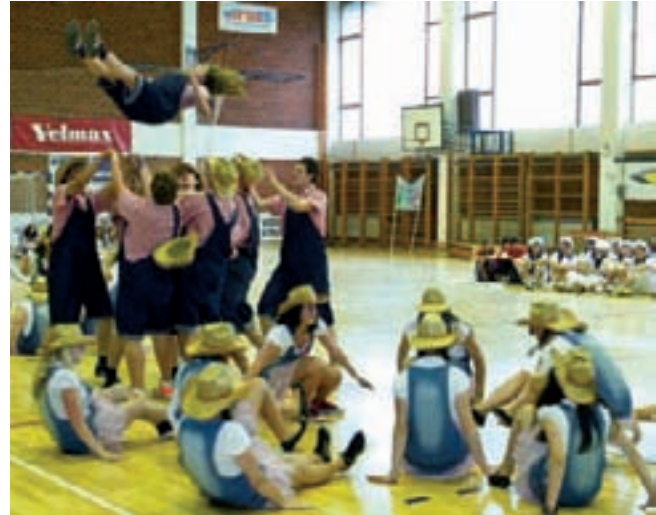
Ivanečki maturanti svake godine priređuju sve maštovitije scenske spektakle