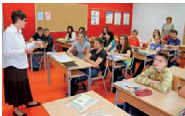
Upisne kampanje su u tijeku (predstavljanje srednjoškolskih programa u OŠ Salinovec)

- Stolare ćemo obrazovati u kombiniranom odjeljenju u Industrijsko-obrtničkoj školi. Koliko god učenika da se javi,