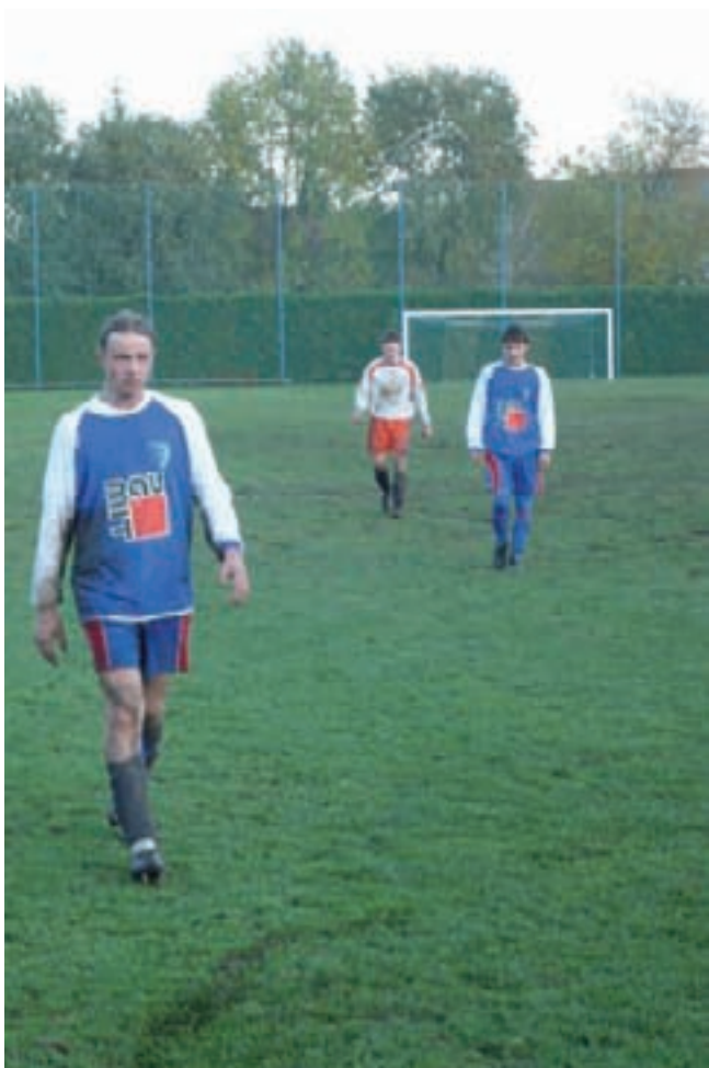
ma, tako da su zbog ozljeda igru napustili Biško i Kupec. Potonji

U gostima u Čakovcu, Ivančica je potom s 2:1 izgubila susret sa Slogom, a onda ju je sustigao još jedan poraz, u Ivancu, gdje je od Sračinca izgubila s 2:1. Domaćin je, doduše, u 15. minuti poveo pogotkom Kocijana, a gosti su uspjeli postići izjednačujući pogodak u završnici 1. poluvremena. Potrebno je istaknuti loše suđenje Nina Vugrinca iz Komarnice, koji je u 1. poluvremenu tolerirao oštru igru gostujuće momčadi, ne sankcionirajući je žutim kartoni-