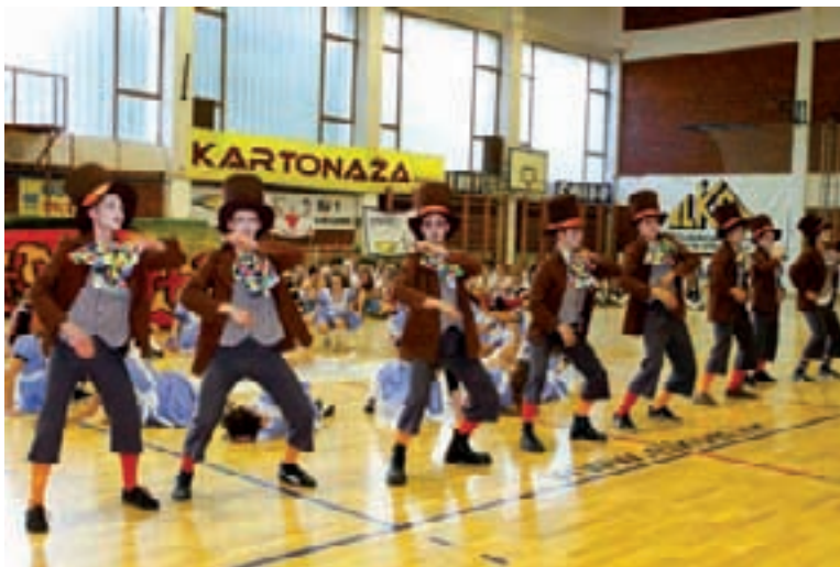
Maštovite odore, u kombinaciji s dobrom koreografijom, dobitna su kombinacija

Prije završnog spektakla u sportskoj dvorani, maturanti su uz pjesmu prodefilirali gradskim ulicama i na noge digli građane, a potom su, uz zvuke Radetzky marša, ušli u sportsku dvoranu te tamo priredili višesatni program.