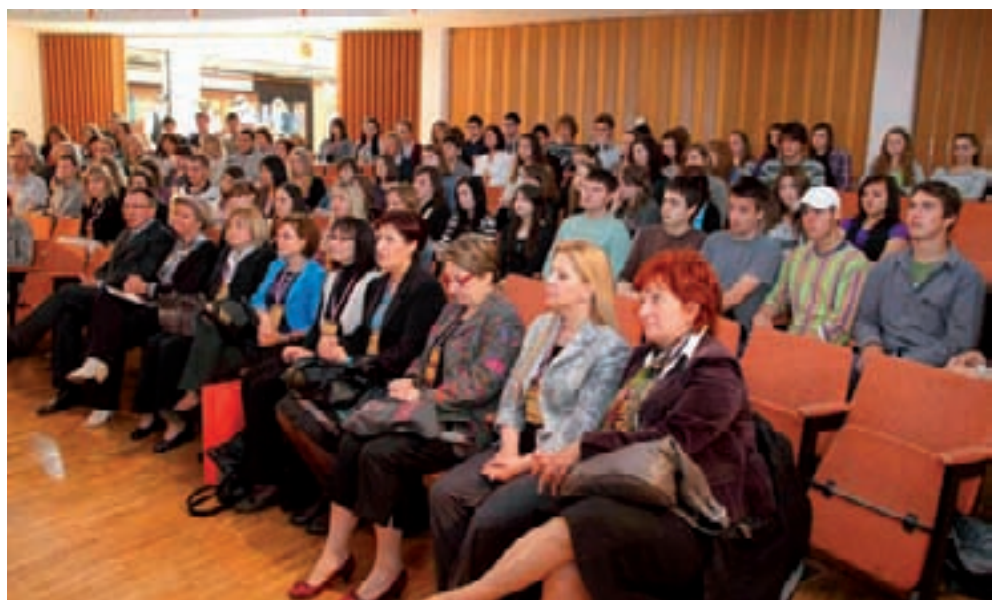
Srednja škola Ivanec na 30. je državnom natjecanju ugostila najbolje knjigovođe iz cijele Hrvatske