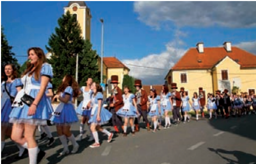
Prštava mladost na ivanečkim ulicama