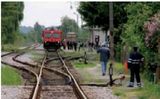
Treba li čekati da se dogodi nesreća?