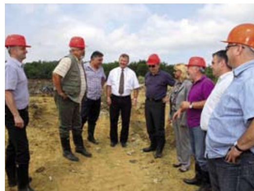
Sudionici skupa obišli su deponij, koji se proteže na 75.000 četvornih metara