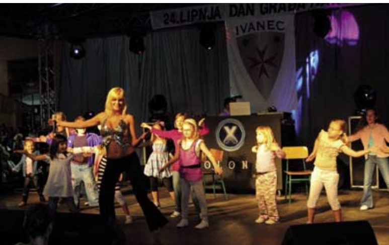
Plesačice grupe Events u program na glavnoj bini uključile su i djecu