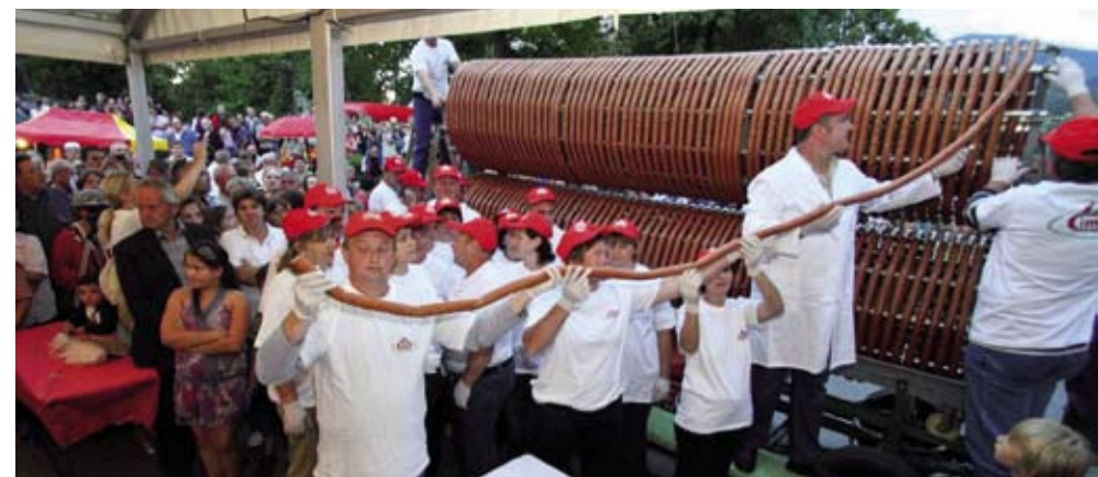
Ivanečki jeger najsimpatičnija je atrakcija Ivanečkih dana