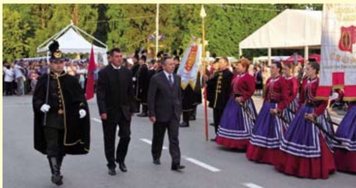
Smotra povijesnih postrojbi na Trgu hrvatskih ivanovaca

ovaj novac upotrijebit ćemo za pomoć onima koji je najviše trebaju – kazao je vitez i propustio putnike. Treba li reći da su se gosti natjecali u tome da zauzmu što bolju poziciju za fotografiranje?