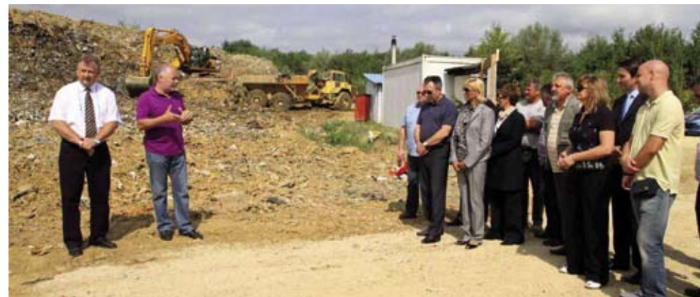
Počela je sanacija odlagališta smeća u Jerovcu