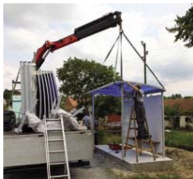
Nove nadstrešnice u Bedencu