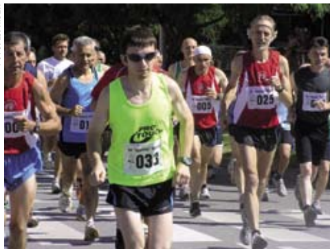
Start utrke s ivanečke gradske špice