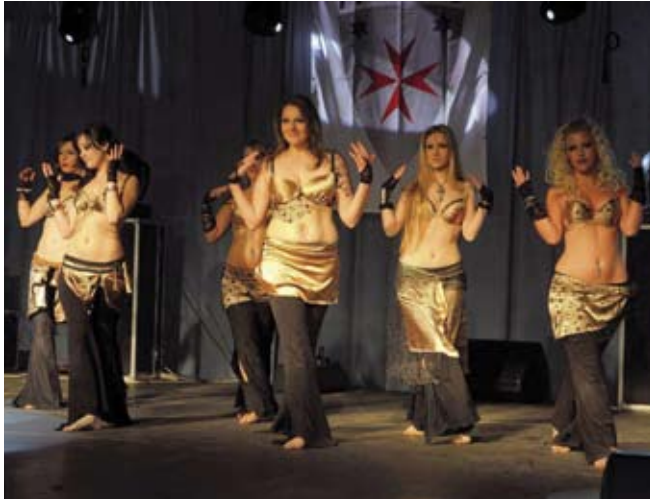
Atraktivne trbušne plesačice iz grupe Narya