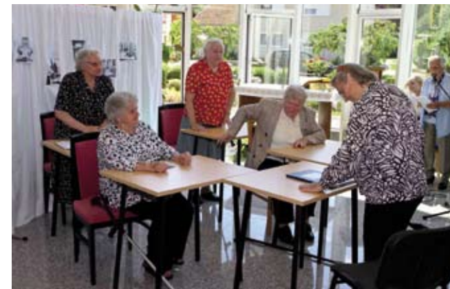
Dramska grupa vremešnih štićenika igrokazom je nasmijala publiku