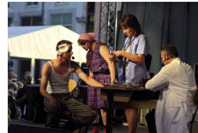
Kroz sva tri slavljenička dana publiku su nasmijavali Komedijaši iz Stažnjevca