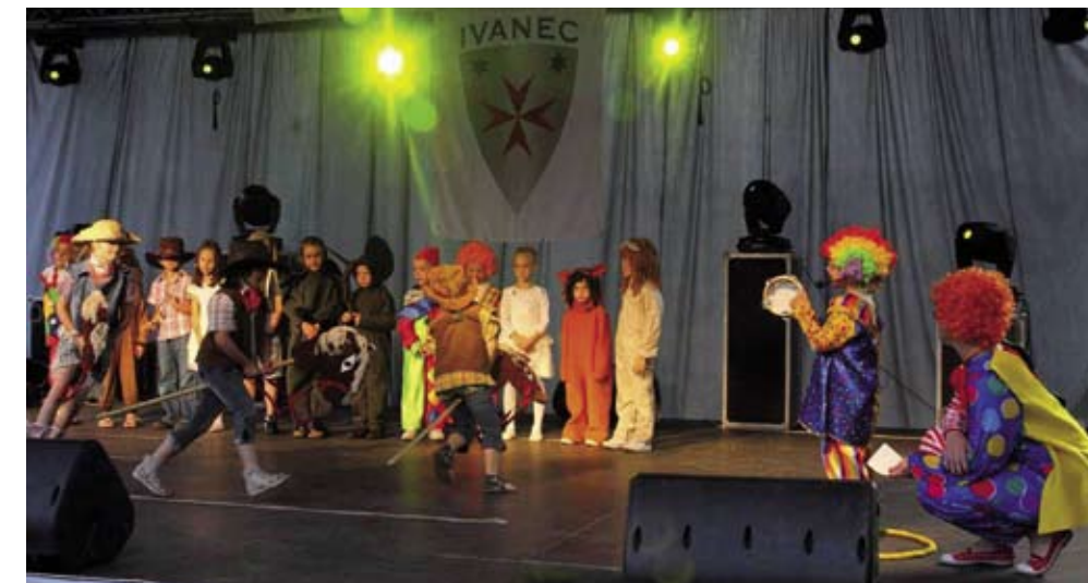
Dio programa izveli su polaznici engleske radionice ivanečkog Dječjeg vrtića Ivančica