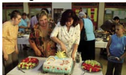
Rođendanskom tortom osladili su se svi članovi udruge

Fotografija za sjećanje uz 10. rođendan Ivanečkog sunca