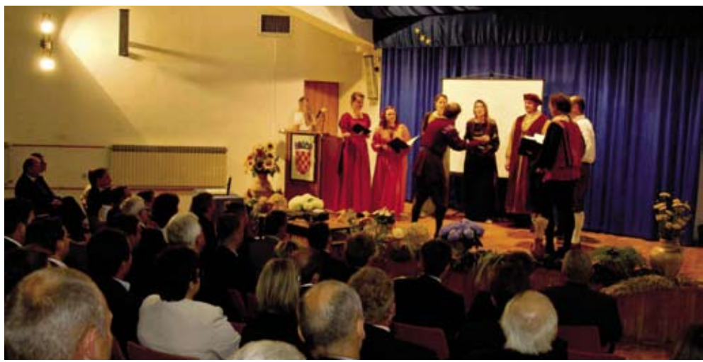
Glazbeni dio programa izveo je Renesansni ansambl Marco Polo iz Zagreba