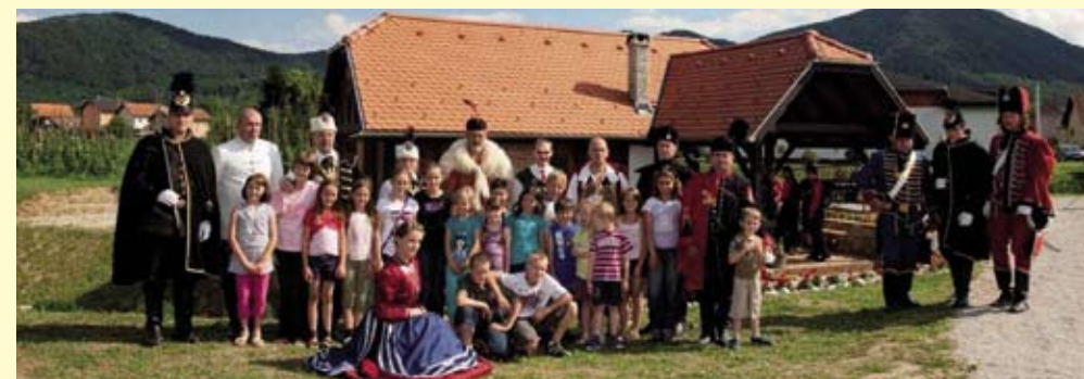
Članove postrojbi lijepo su dočekali članovi margečanske Margarete