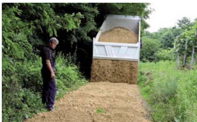
Šljunčanje nerazvrstanih pravaca u Lovrečanu