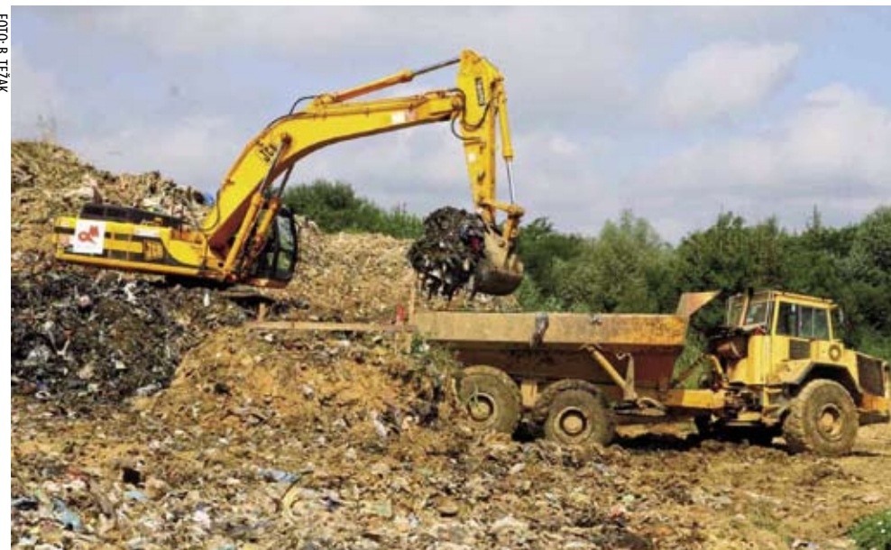
Tijekom prošlih dvadeset godina, u Jerovcu je odloženo, procjenjuje se, oko 80.000 tona kućnog smeća