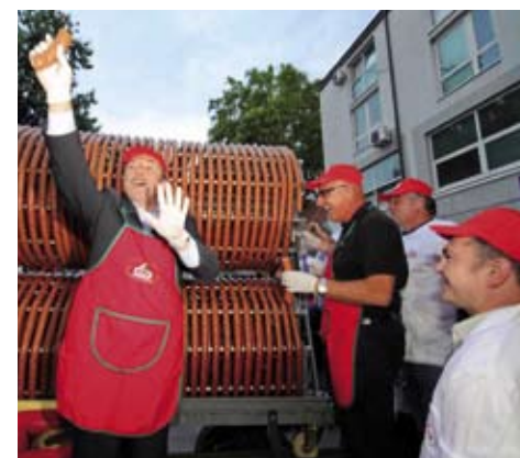
Jegeru valja najprije odrediti mjeru po kojoj će se rezati

Ivanec i njegovi gosti proslavili su Dan grada 2011.! Ovogodišnja proslava ostat će u sjećanju po rekordnoj posjećenosti i „riječama“ posjetitelja koje su tijekom trodnevne proslave uživale u mnoštvu programskih sadržaja, atrakcija i nesvakidašnjih događanja na glavnoj bini. U subotu, 25. lipnja, u nevidenoj gužvi, samo je sat vremena bilo potrebno masi okupljenih građana da na središnjoj proslavi pojedu najduži jeger na svijetu Industrije mesa Ivanec! A jeger, glavna atrakcija koja na gradskim proslavama izaziva najveće simpatije, na središnji trg stigla je namotana poput kabela na specijalno konstruiranim kolicima. Ove godine jeger su na špicu „dopratili“ tamburaši iz skupine Carevi.