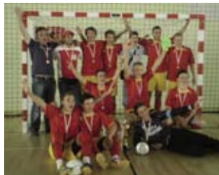
Radost Jerovčana osvojenom broncom na Prvenstvu Hrvatske

■ Na završnicu su došli kao autsajderi, a potom su pokazali da su jedna od najboljih ekipa u Hrvatskoj