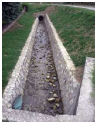
Kamenom su obložene i od erozije zaštićene stranice potoka Bistrice u Ivancu