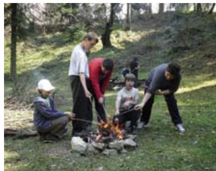
Prehrana i zdravlje u planinama sastavni su dio programa planinarske škole

NOGOMET 4. hrvatska nogometna liga, skupina A