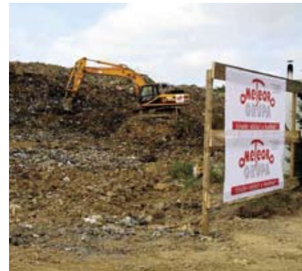
Teškim strojevima Meteor grupa pre-mješta staro smeće na novu kazetu

rektor Ivkoma, kojemu je Grad Ivanec povjerio investiciju. Iako su u zadnjih šest godina sanacijski projekt pratili brojne teškoće i problemi, danas smatram da se trud isplatio. Ovi radovi od interesa su za sve – za okolne mjesne odobre, općine i gradove koji smeće ovdje odlazu, a ponajviše za