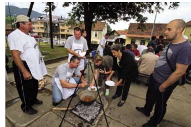
Ivanec kuha – nova manifestacija, natjecanje u kuhanju gulaša u kotliću, izazvala je neviđen interes sudionika