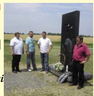
Sjećanja na žrtve stradale u agresiji na Vukovar

Takoder, obišli su Memorijalno groblje u Vukovaru, pa mjesto Tovarnik, legendarnu Trpinjsku cestu, tzv. „groblje