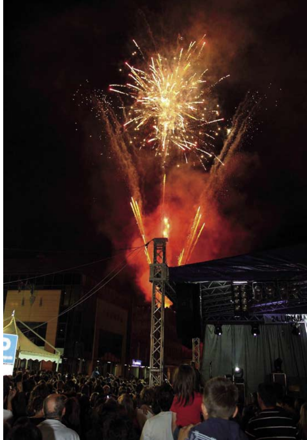
Vatromet u čast 615. spomendana Ivanca