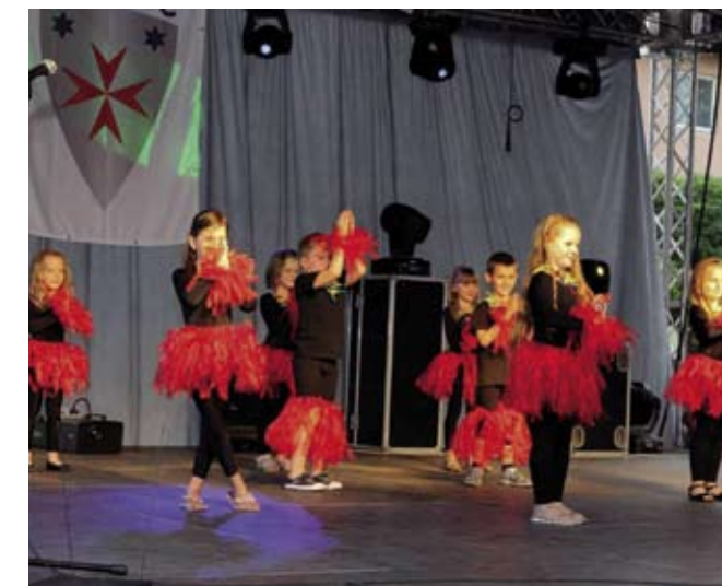
I djeca područnog vrtićkog odjela iz Radovana na glavnoj bini