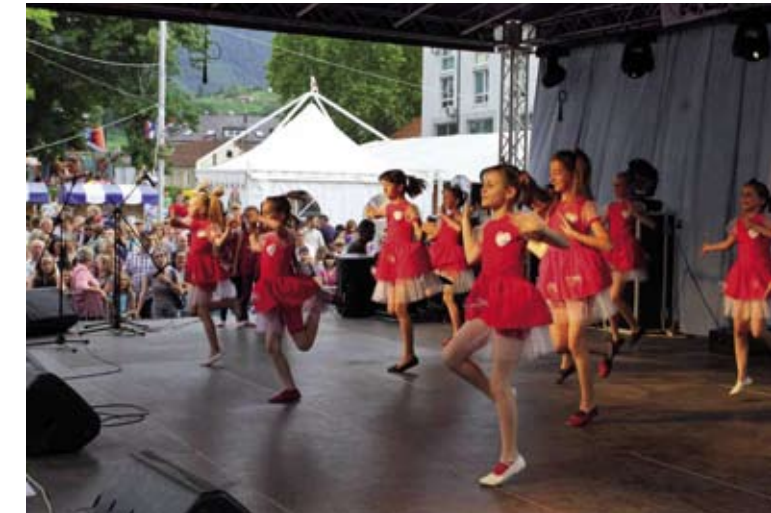
Jedva su dočekale nastup – plesačice ivanečkog Društva Naša djeca