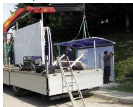
Stigla je nadstrešnica i u Radovan

dva autobusna stajališta u Salinovcu te u Margečanu i Radovanu.