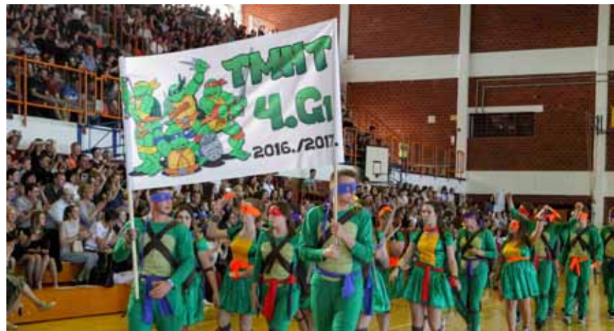
Sretno, generaciju 2016./2017.!

DJEČJA OLIMPIJADA Održan 7. olimpijski festival dječjih vrtića