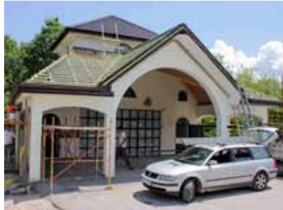
Adaptacijski radovi na grobnoj kući

KAMENICA U tijeku je adaptacija grobne kuće u Kamenici