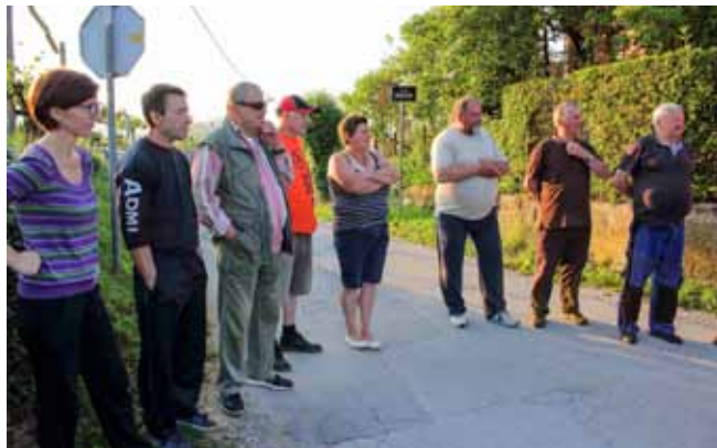
Niz problema opterećuje svakodnevni život Kraševca

–Što se tiče Ulice Jezerski put, koja ima kanalizaciju, iz građevinske će dozvole biti