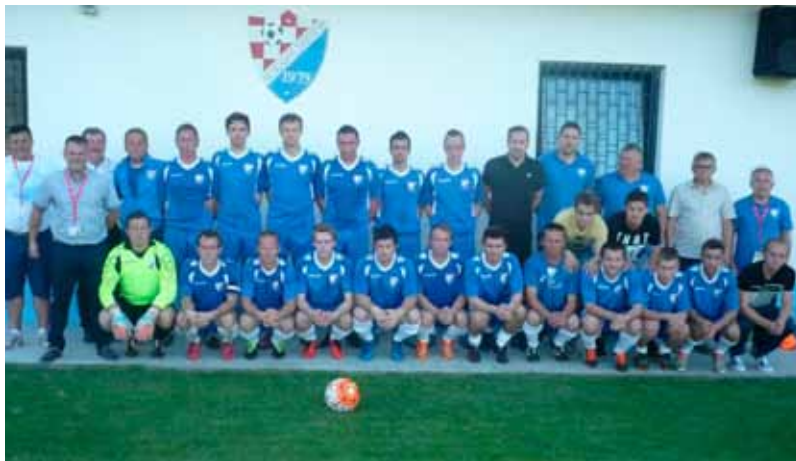
Momčad NK Mladost Margečan