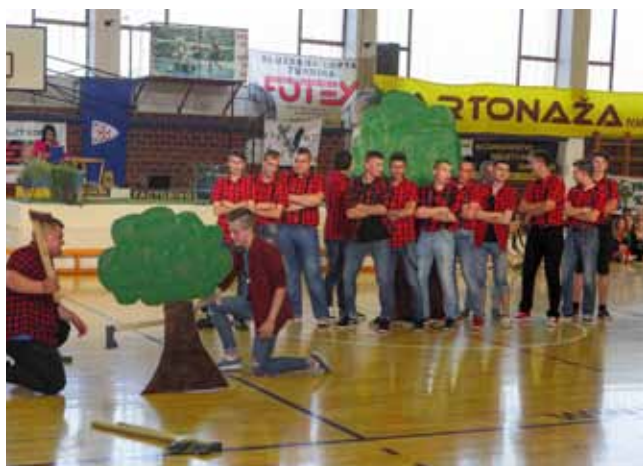
Drvosječe na djelu