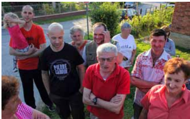
Igrađani iz Mihanovićeve imali su niz pitanja za gradonačelnika

Detaljno o tome što će se i gdje raditi znat ćemo nakon dobivanja građevinske dozvole. Za one kuće koje neće biti obuhvaćene Aglomeracijom, Ivkom – vode će usporedo u svojoj režiji graditi kanalizaciju, jer je cilj da se svaku kući, neovisno o lokaciji, osigurava priključak na kanalizaciju te da se sve otpadne vode usmjere na glavni kanalizacijski kolektor. Ne trebate se brinuti oko toga da će neka kuća ostati izvan obuhvata kanalizacijskog sustava – izvijestio je gradonačelnik stanare Jezerskog, Mihanovićeve,