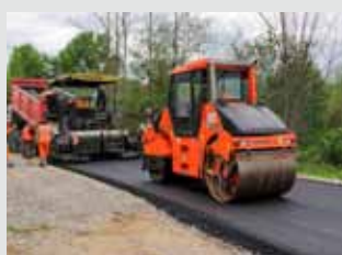
Polaganje asfalta na pristupnu cestu prema odlagalištu otpada

Podsjećamo, dotad je to bila makadamska cesta koja je zbog visoke frekvencije prometa i velikog opterećenja bila u lošem stanju. Rekonstrukcija je bila nužna, to više što je gradski projekt izgradnje reciklažnog dvorišta građevinskog otpada u visokoj fazi dovršenosti (očekuje se izdavanje građevinske dozvole), a to znači da će cesta i dalje biti visoko opterećena. Stoga je sagrađen