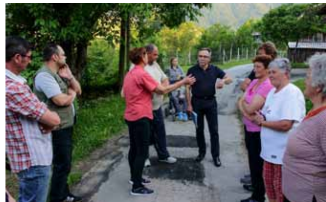
U obilasku Ulice Ivanuševac

MOST Napreduju radovi na gradnji mosta u ivanečkoj Ulici Lj. Gaja