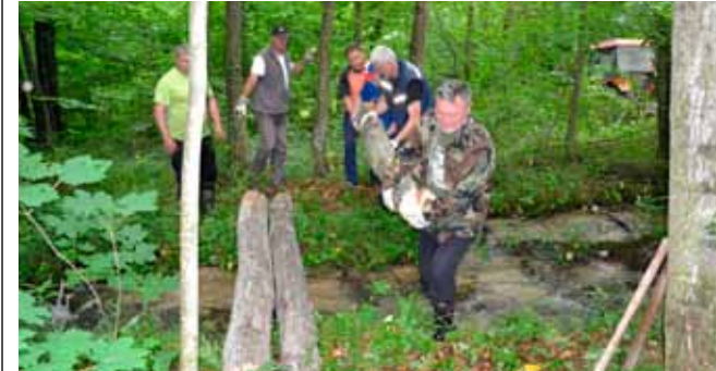
Drveni mostovi planinarima će olakšati prelazak potoka

Postavljena su četiri mostića od balvana duljine od 3,5 do 5 metara, širine do jednog metra, ovisno o konfiguraciji terena i toku potoka koji planinari i izletnici prilikom obilaska trase trebaju preći na više mjesta. Prelazak zna biti problematičan prilikom porasta vodostaja. Nakon završene akcije planinari su nastavili s druženjem, uz tradicionalni planinarski jeger na žaru i kobasice te razgovor o novim izletima i aktivnostima. (nn)