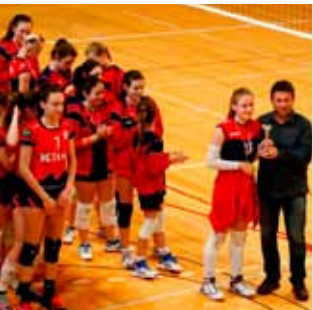
Treće mjesto mladim ivanečkim odbojkašicama na završnici prvenstva

stvo za sve igračice jer igrale su u konkurenciji s prvoligaškim ekipama. Usto, time se ŽOK Ivanec po prvi put u nekoj od starijih kategorija plasirao u završnicu prvenstva Hrvatske, a to je zaista velik uspjeh ostvaren pod vodstvom trenera Ivana Hrga.(nn)