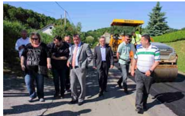
U obilasku modernizacijskih radova na cesti Radovan – Pece

su bile u najkritičnijem stanju te na njima podići stupanj sigurnosti svih sudionika u prometu. U popravak ulažemo gotovo 30 milijuna kuna – poručio je župan Predrag Štromar koji je zajedno s gradonačelnikom M. Batinićem i