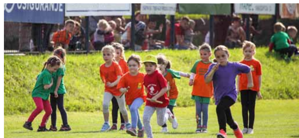
♦♦ Sudjelovalo je 280 djece iz dva ivanečka vrtića te iz Radovana, Vinice, Klenovnika, Ladanja Donjeg, Žarovnice i Črešnjeva