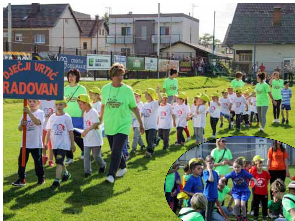
Svečani ulazak na terene, baš kao na pravoj Olimpijadi

DJEČJA OLIMPIJADA Održan 7. olimpijski festival dječjih vrtića