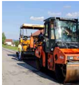
Asfaltiranje ceste Bedenec – Jerovec

Ukupna vrijednost obavljenih radova na tri cestovna pravca je 1,05 milijuna kuna