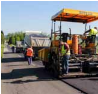
Položen je novi „tepih“ na kilometar ceste Horvatsko – Lipovnik

Nakon toga asfaltirana je 500 metara duga cestovna dionica Radovan – Pece, čija je modernizacija stajala 200.000 kuna.