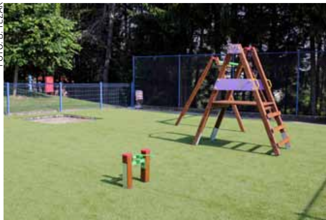
Finalni radovi na dječjem igralištu u Radovanu

Igralište je ograđeno, a s obzirom na konfiguraciju terena i blizinu ceste, sigurnosna ograda sa strane je povišena