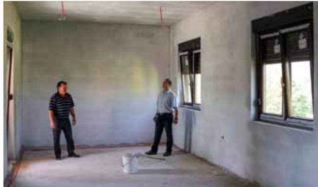
Radovi na objektu društvenoga doma u Osečkoj

U društvenom domu u Kaniži radovi su za našeg posjetu bili u punom jeku. Postavljala se stolarija, izvedene su električne i vodovodne instalacije, a obavljale su se i pripreme za žbukanje i keramičarske radove.