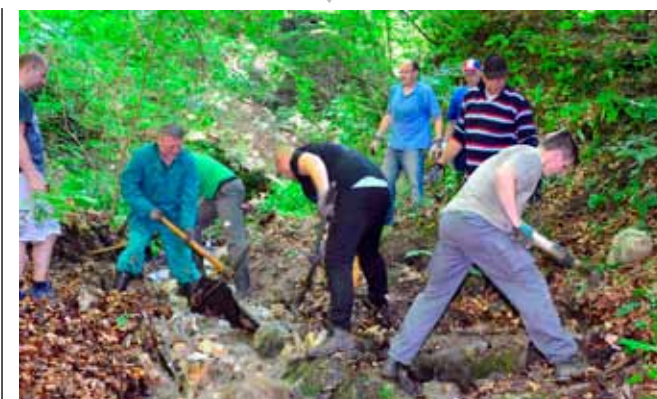
Planinari su krupni otpad izvlačili iz potoka i ispod nanosa zemlje, granja i lišća

cateljima i ove godine pružila svu potrebnu organizacijsku i logističku potporu. Dječja olimpijada u Ivanču ponovno se potvrdila kao vrijedan pedagoški projekt koji promiče izvorne vrijednosti olimpiizma i potiče rano razvijanje rekreacijskih navika. (lj)