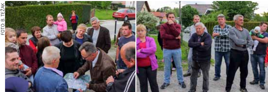
Stanari Jezerskog puta razmišljaju o opciji uvođenja jednosmjernog prometa ulicom

♦♦ Od Hrvatskih voda kao nositelja investicije čeka se dostava kompletne dokumentacije i građevinske dozvole iz koje će biti vidljivo što će se i u kojoj ulici raditi