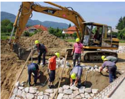
Obale Bistrice učvršćuju se kamenom

Investicija je vrijedna 397.600 kuna, a financira je Grad Ivanec. Radovi teku po planu, a izvodi ih varaždinski Hidroing. (ljr)