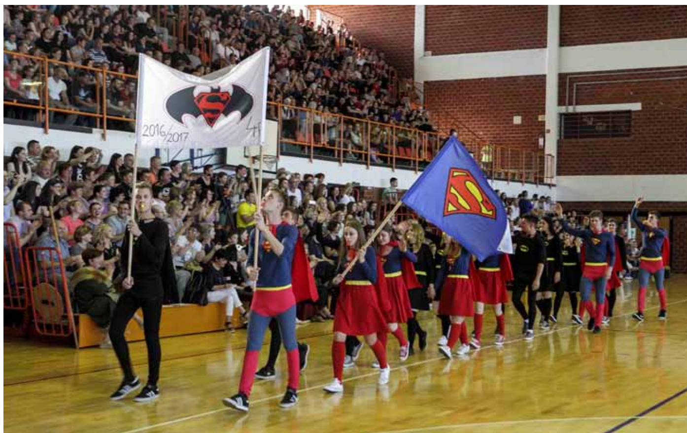
Ulazak u dvoranu uz taktove Radetzky marša