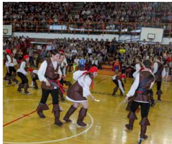
Piratska priča 4. G3