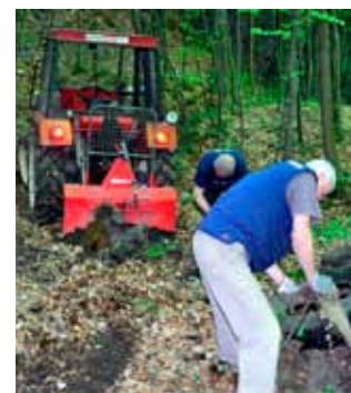
Rješenje za teške gume – traktor i vitlo

♦♦ U trosatnoj akciji sudjelovalo je 15 planinara, a zbog teškog terena otpad se iz kanjona vadio vitlima i lancima