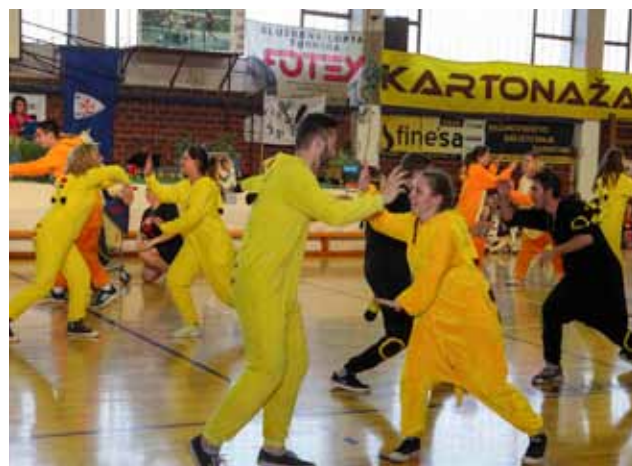
Ples Pokemona: Game over!