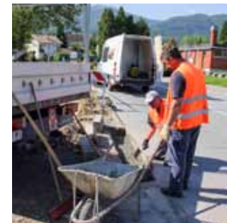
Gradnja nogostupa u dijelu Gundulićeve ulice

U tijeku su radovi na proširenju nogostupa u Varaždinskoj ulici, od odvojka prema Industriji mesa do skretanja za Gundulićevu ulicu. Na tom potezu je prije par godina zasaden drvored, pri čemu je nakon radova ostala neuređena uska stazica. Kako bi se prostor uredio i uljepšao,