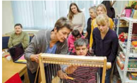
Dodijeljenim bespovratnim sredstvima Sunce je nabavilo tkalački stan