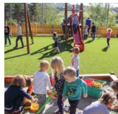
Podloga – umjetna trava