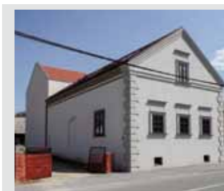
Dodijeljene potpore omogućit će nastavak izgradnje Muzeja planinarstva

Projektom će biti obuhvaćeno 147 učenika partnerskih škola i 65 nastavnika. Uključivanjem u novi EU projekt, već peti u nepune dvije godine, što je čini jednom od najpulpulzivnijih škola u Hrvatskoj u privlačenju i korištenju EU sredstava za moderno obrazovanje 21. stoljeća, Srednja škola Ivanec nastavlja europskim novcem provoditi mini reformu obrazovanja.