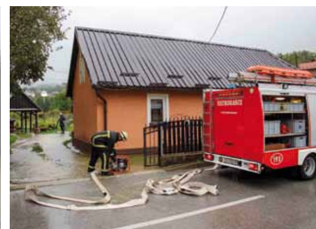
DVD Ivanec na intervenciji spašavanja obiteljske kuće u žrtava hrvatskih domovinskih ratova