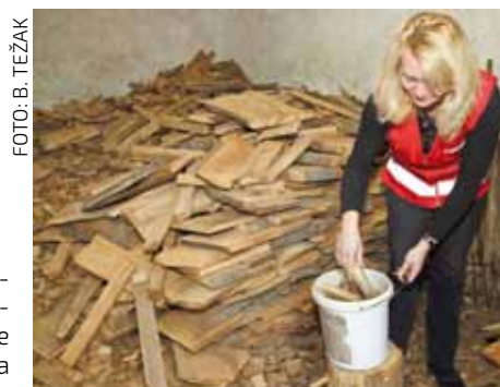
Na poslovima pomoći bolesnim i nemoćnim osobama bit će zaposlene četiri žene s područja grada Ivanca (ilustracija)

Zaposlene žene brinut će se za starije, bolesne i nemoćne osobe, a sredstva za njihovo zapošljavanje se najkasnije do studenog očekuju iz Europskog socijalnog fonda