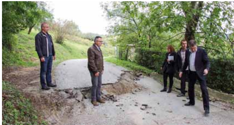
Ogromno klizište uništilo je stotinjak metara ceste Salinovec – Šatornjak

– Bit će potrebno sanirati 9,3 kilometara