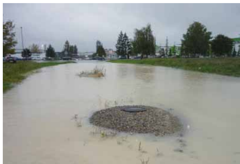
Poplavljena Preradovićeve ulica u Ivancu