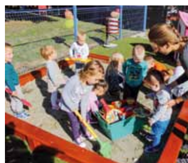
Gužva u pješčaniku

A koliko se igralište dopalo klincima, najbolje svjedoče prizori njihovih nasmijanih lica i pune ruke posla u pješčaniku. (lir)