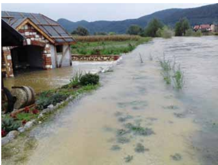
Razlivena Bednja poplavila je vodenički objekt u Margečanu