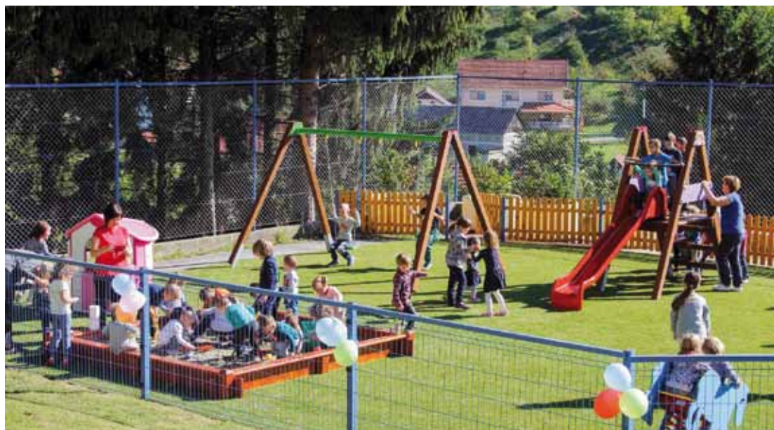
Odmah nakon otvorenja maleni su poletjeli na ljuljačke, klackalice, u pješčanik...

– Dječji osmijesi govore više od svega! Sigurno je da će moderno igralište nadomak škole uvelike olakšati odgojno – obrazovni rad, to više što smo dosad, u nedostatku takvog prostora, morali pribjegavati raznim improvizacijama – naglasila je odgojiteljica Marija Gužvinec.