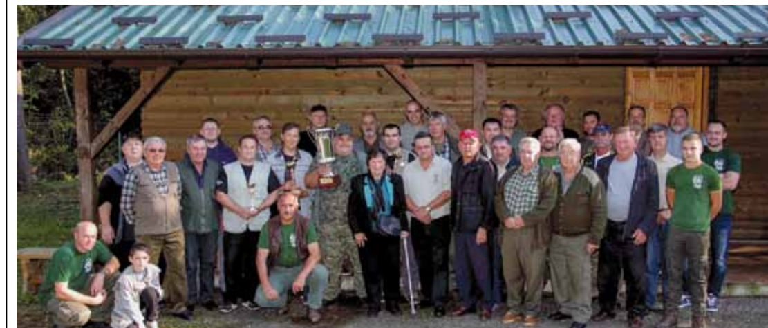
Lovci LD-a Jelen i ove godine na memorijalnom kupu za poginulog ratnog druga

LOVAČKI MEMORIJAL U organizaciji Lovčkog društva Jelen