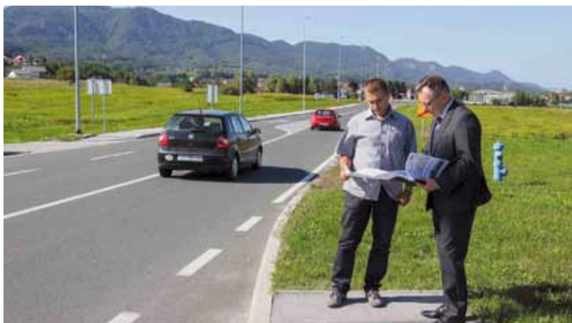
Izgradnja brze ceste za Grad Ivanec jedini je strateški i realni prometni projekt kojemu dugoročno nema ozbiljnije alternative

Dovršetak njegove izrade očekuje se do kraja travnja 2018. Odmah nakon toga slijede aktivnosti oko ishođenja lokacijske dozvole te raspisivanje natječaja za izradu glavnog projekta, koja će trajati oko godinu i pol dana. Usporedo će rješavati imovinsko – pravni odnosi i otkup zemljišta. Početak radova na izgradnji ceste može se očekivati u drugoj polovici 2020. ili početkom 2021. U prvoj fazi radova cesta će se graditi od Varaždina do Ivanca, u dva traka, dok se projekt izrađuje za gradnju ceste u četiri traka - naglašava M. Batinić.