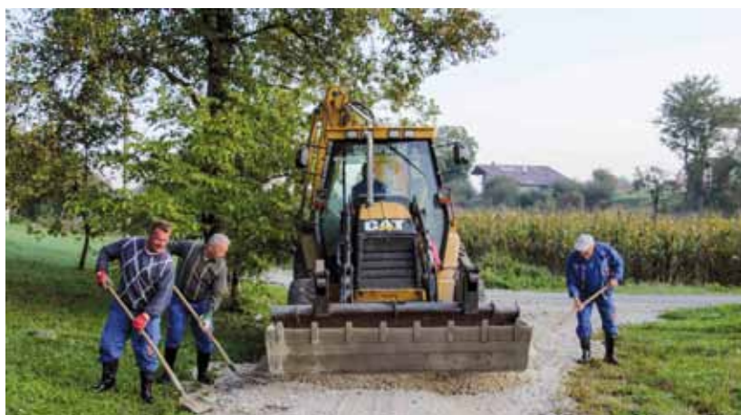
Ivkom obavlja popravke na oštećenim cestama na cijelom gradskom području

ra makadamskog zastora i bankina NC-a, pročistiti i osposobiti oko 4,5 kilometara cestovnih jaraka i sanirati pet cijevnih propusta – ističu u Upravnom odjelu za komunalne poslove.