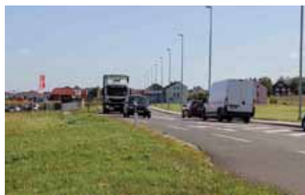
Predmet razgovora u HC-u bila je i gradnja nogostupa sa sjeverne strane D35 Ivanec- Ivanečko Naselje

Naš je prijedlog da se novi spoj brze ceste i obilaznice izgradi s izlaskom na Gundulićevu ulicu, gdje bi se onda izgradio novi, glavni rotor. Drugi novi rotor gradio bi se na raskrižju Nazorova – Kovačićeva (gdje se sada promet regulira semaforima), a još jedan novi rotor izgradio bi se na spoju Preradovićeve i Kova-