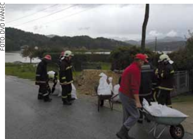
Gradnjom nasipa vatrogasci su spriječili poplavlivanje privatnih kuća i pogona