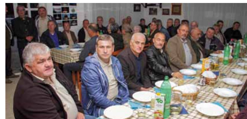
Osamnaesti rujna ubuduće će se obilježavati kao Dan 2. ivanečke bojne 104. brigade Hrvatske vojske

Uspješno opisana rudarska prošlost Ivanca, koja je prepoznata kao temelj identiteta i razvoja modernoga grada, kroz jedan stari rudarski recept za rudarski trempač – specifični rudarski kruh,