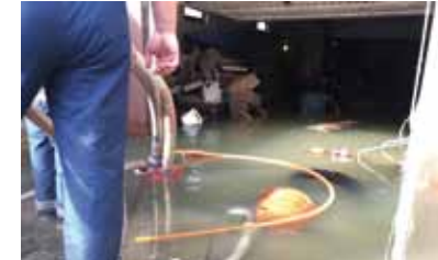
Vatrogasci su ispumpavali desetke poplavljenih podruma i garaža

Ivanec je bio najugroženije područje u Županiji, što potvrđuje podatak da je trećina ukupnih intervencija bila na području grada Ivanca