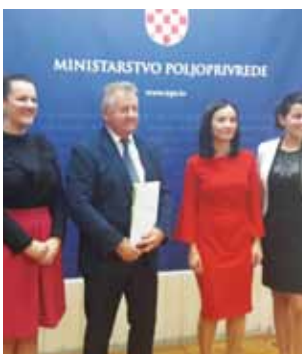
Potpisan ugovor „težak“ je 4,36 milijuna europskih kuna

♦♦ Prema informaciji iz Ivkom – Voda, radovi trebaju početi polovicom listopada