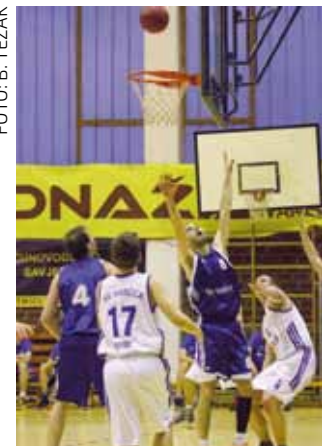
Nova košarkaška sezona počinje 21. ovog mjeseca

U 1. kolu Regionalne odbojkaške lige Sjever odigranoj u Čakovcu, juniori su startali pobjedom nad momčadi Čakovca od 86:52. U momčadi Ivančice najefikasniji igrač bio je Koljnrekaj s 20 koše-