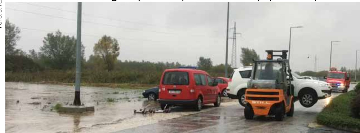
U zadnji čas: Spašavanje vozila od bujice koja je gotovo poplavila parkirana vozila kod pogona We-Kr-a

VATROGASTVO Vatrogasci ponovno prvi u obrani od poplava i bujica