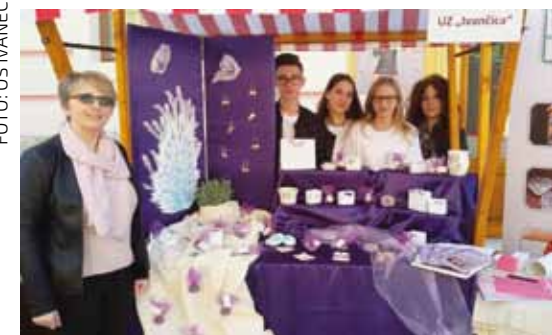
Ivanečki učenici na županijskoj smotri u Varaždinu

NAŠI UČENICI Ivanečki osnovnoškolci na smotrama u Zadru i Hvaru