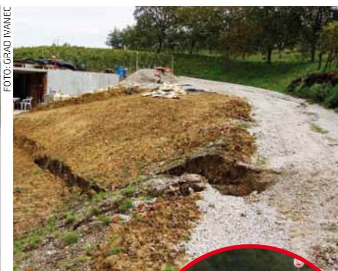
Teško stradala makadamska cesta kod Severina