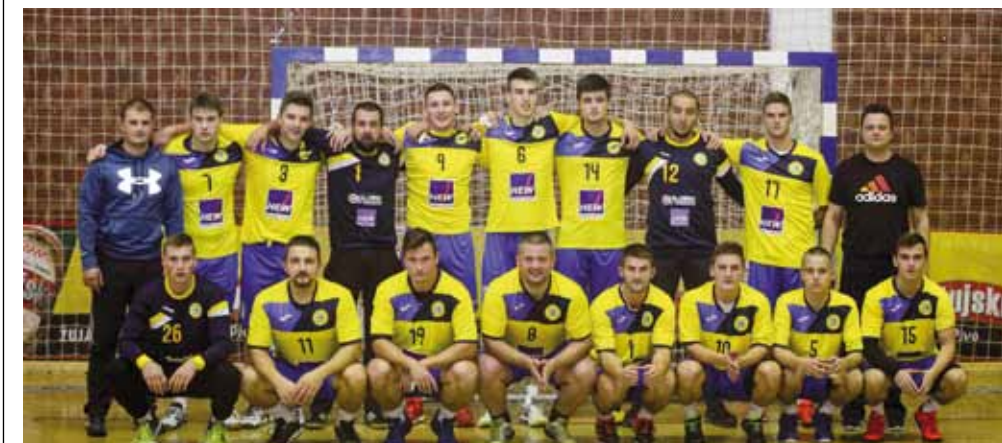
Ivanečki rukometaši zasad stoje solidno - u gornjem su dijelu prvenstvene tablice

U ligi nastupa devet ekipa i to: Prelog, Bjelovar III, Zrinski II (Čakovec), Veliko Trojstvo, Garešnica, Radnik (Križevci), Ludbreg, Pitomača II i Ivanec. Prvenstvo počinje 7. listopada, a u 1. kolu Ivanec igra s Garešnicom.(nn)