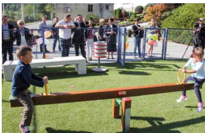
Veselje i velikih i malih uspješno provedenom akcijom uređenja novog igrališta