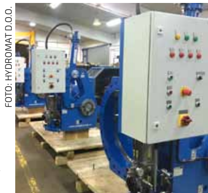
High tech proizvodi iz pogona Hydromata prošlog su mjeseca isporučeni u Egipat

Ovo je još jedan dokaz da je naš “know-how” prepoznat širom svijeta, jer radi se o isporuci opreme za najveći egipatski projekt poslije gradnje Sueskog kanala! Ukratko, na prekrasnim obalama Crvenog mora gradi se cijeli jedan potpuno