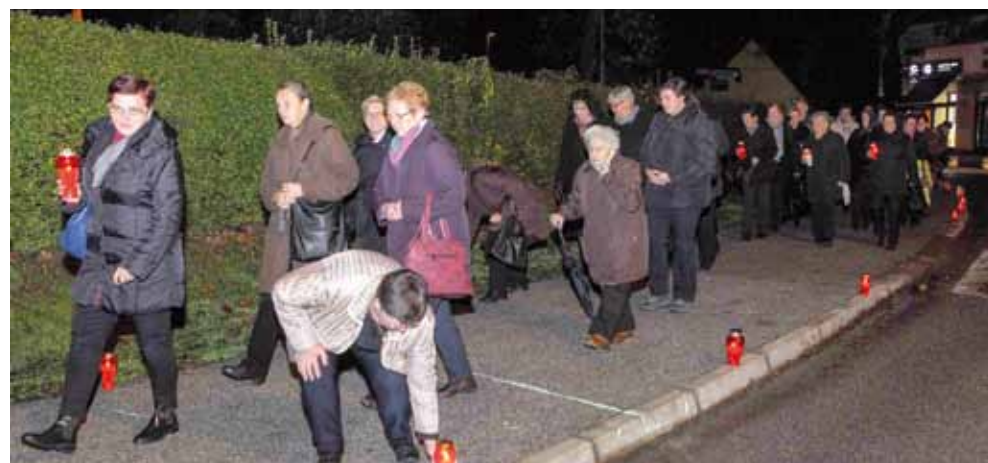
Svijeće za Vukovar