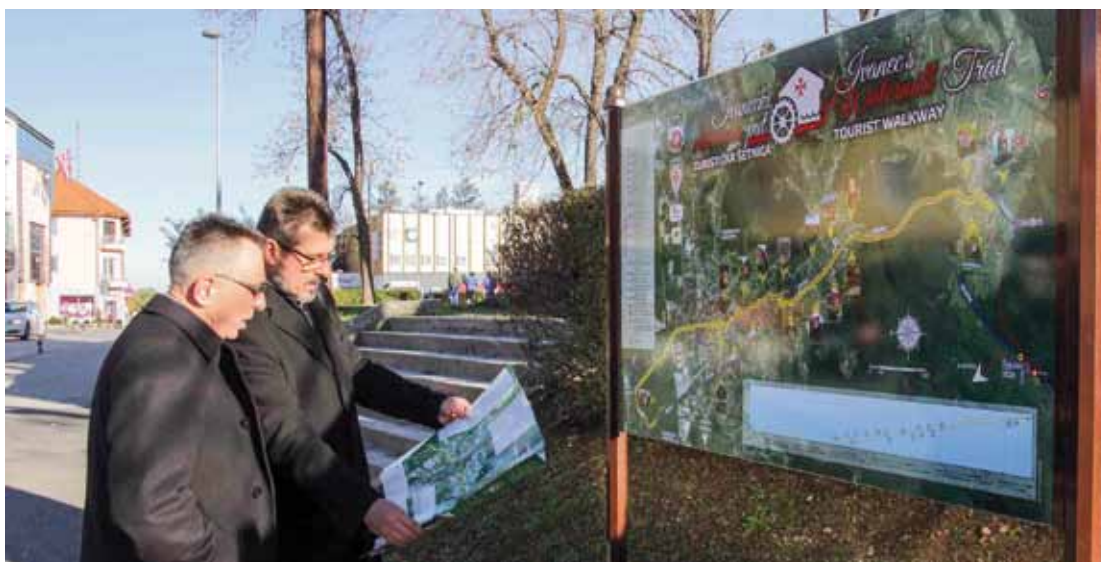
Na tabli su ucrtane lokacije nekadašnjih mlinova na šetnici dugoj 6,7 kilometara

Šetnja od jedne do druge lokacije šetnicom dugom 6,7 kilometara (od nekadašnjeg Stankova