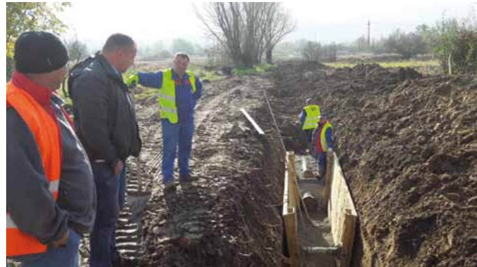
Izveden je dio Kanala 1 u dužini 255 metara, profila cijevi 300 milimetara

Na novi sustav odvodnje, koji će se u prvoj fazi graditi najvećim dijelom uz županijsku cestu kroz Bedenec, moći će se priključiti veći dio kućanstava toga kraja te time trajno riješiti problem odvodnje sanitarnih i fekalnih voda. Radove izvodi HIS iz Višnjice.