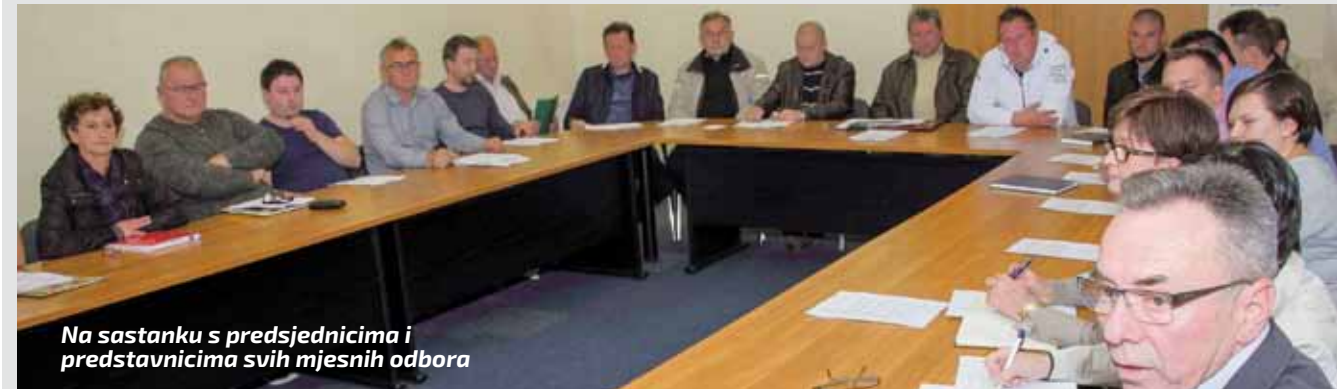
Na sastanku s predsjednicima i predstavnicima svih mjesnih odbora