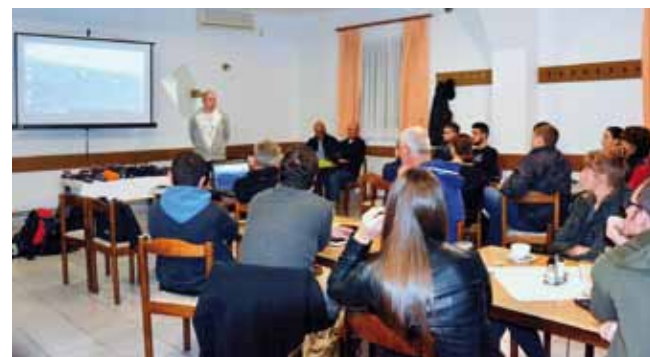
Završena Opća planinarska škola preduvjet je za upis u tečajeve iz pojedinih specijalnosti

ŠKOLA ZA PLANINARE U organizaciji Planinarskog kluba Ivanec