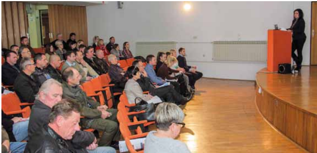
Na skupu u Srednjoj školi okupilo se više od 70 građana te predstavnika udruga i lokalne poslovne zajednice

♦♦ Pojašnjeno je zašto se pojedini projekti u naselju Ivanec nisu mogli kandidirati na pojedine mjere iz EU Fonda za ruralni razvoj (ograničavajući moment – broj stanovnika veći od 5.000)