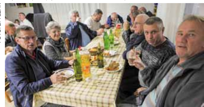
Ivanečki vinari u dobrom martinjskom raspoloženju

Uz viceve, šaljive komentare, puno smijeha i dobrog raspoloženja, u ceremoniju su se uključili i svi nazočni pa je moštek na kraju kapitulirao – „pokršten“ je i pretvoren u mlado vino. Krštenje se odvijalo u narodskom duhu, po starinskim štatutima i regulama, uz odavanje počasti „dragoj jagodici“ i „moćnoj punoj kupici“ koja krije i hrabri.