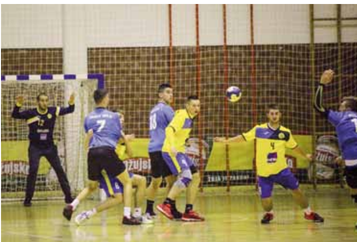
Ivančica i dalje sjajna u 2. HRL Sjever

lova, Maloić i Zoran Vidoni postigli su po 5, Matija Kušen 4, a istaknuo se i vratar Geci s 10 obrana. Bio je to praznik rukometa u Ivanču i podsjećanje na protekla vremena, kada je Ivanec imao svog prvotigaša.(nn)