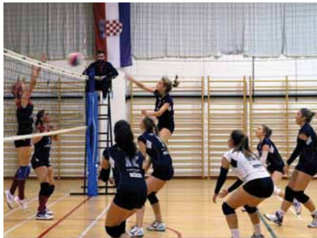
Seniorke Ivanca pete na prvenstvenoj tablici