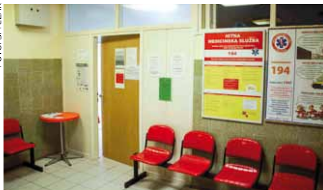
Iz županijskog Zavoda za hitnu medicinu odbijaju mogućnost da se nadstandard provodi u ambulanti sadašnje Hitne u Ivancu

Podsjećamo, tada je, nakon razmatranja potrebe i mogućnosti uvođenja nadstandarda koji bi osiguravala Županija i/ili Grad Ivanec, zaključeno da je organiziranje posebnog dežurstva s doktorom i medicinskom sestrom vikendom i blagdanom stručno najopravdanije rješenje koje se može realizirati odmah uz ugovaranje s HZZO-om. Također, da posebno dežurstvo u Ivancu sukladno važećim propisima može organizirati i ugovoriti Dom zdravlja Varaždinske županije uz prethodno određivanje lokacije posebnog dežurstva od strane Županije.