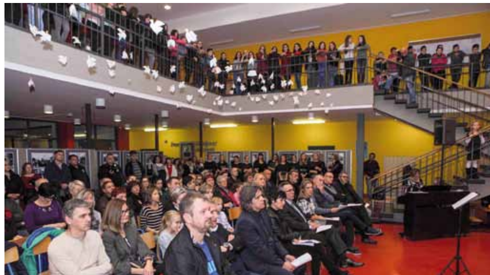
Izložba ratnih fotografija održana je u prepunom školskom holu