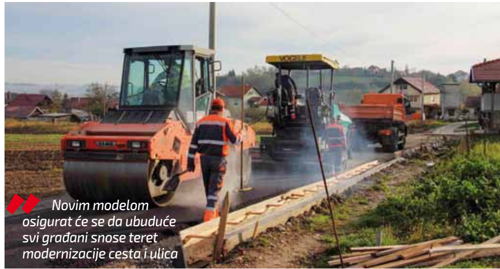
Novim modelom osigurat će se da ubuduće svi građani snose teret modernizacije cesta i ulica

Novom odlukom komunalna naknada raste u visini 6 lipa po m 2 . Sredstva skupljena od povećanja usmjeravat će se strogo namjenski, isključivo za modernizaciju nerazvrstanih cesta na cijelom gradskom području u idućih 15 godina, od 2018. do 2032. Time se ujedno uvodi pravedniji model sufinanciranja cesta od onog koji je dosad bio na snazi. Poznato je da su mnogi građani dosad odbijali ili izbjegavali sufinanciranje, a ceste su koristili i „habali“ ih kao i svi drugi. Ovakav model osigurao je da ubuduće svi građani snose teret modernizacije cesta – kazao je Batinić. Ovim povećanjem godišnje će se skupiti dodatnih 400.000 do 450.000 kuna koje će se, uz ostala sredstva, direktno usmjeravati na asfaltiranje cesta i gradskih ulica.