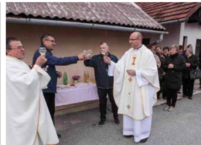
Blagoslov mošta i prva zdravica mladim vinom na Šatarnjak bregu