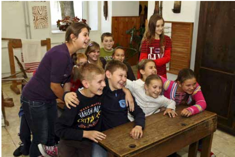
Njihov osmijeh govori sve

strukciju kanalizacijsko-oborinskog kolektora za odvodnju otpadnih voda iz škole (50.000 kuna), gradnju pješačke staze od škole do igrališta (13.200 kuna), na iscrtavanje igrališta ispod škole (6.400 kuna), gradnju temelja autobusne nadstrešnice (6.760) i drugo. (ljr)