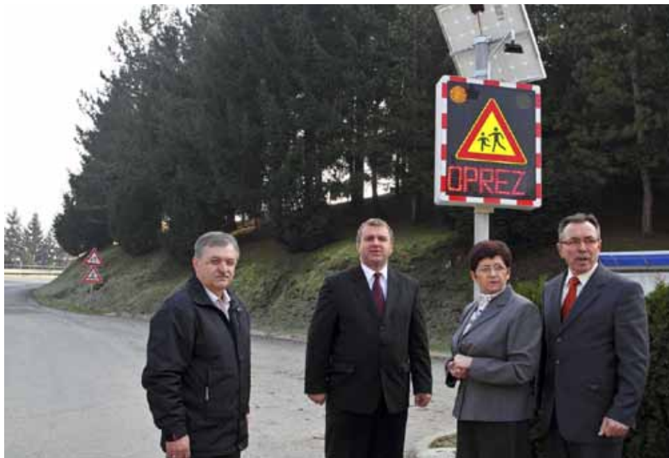
U blizini škole postavljena su dva preventivna radara

Svi dobitnici stipendija bit će tijekom prosinca pozvani na potpisivanje ugovora u Gradsku vijećnicu, a do kraja godine bit će im isplaćene stipendije za listopad, studeni i prosinac. (ljr)