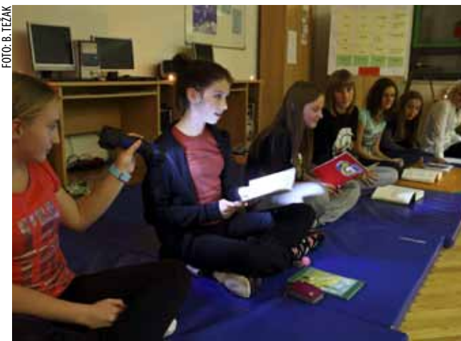
Čitanje iz užitka u carstvu knjiga školske knjižnice

Nakon čavljanja s vršnjacima iz cijele Hrvatske, učenici su zajedno pogledali film, a potom – da bi doživljaj druženja bio što potpuniji – u vrećama za spavanje proveli noć u školskoj knjižnici. (ljr)