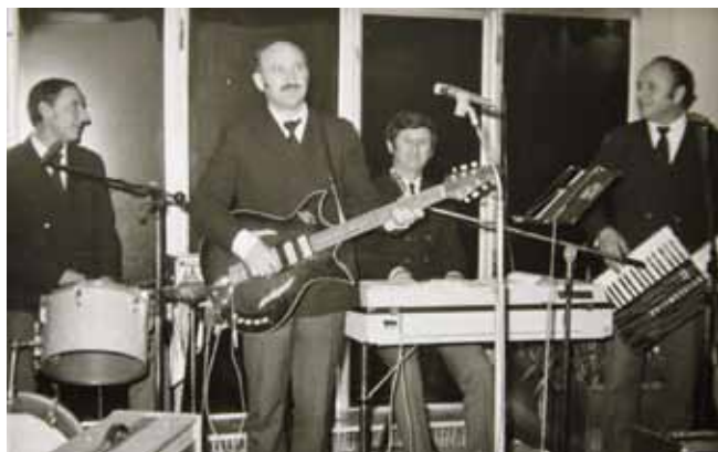
Sastav 99 svirao je u Kavani