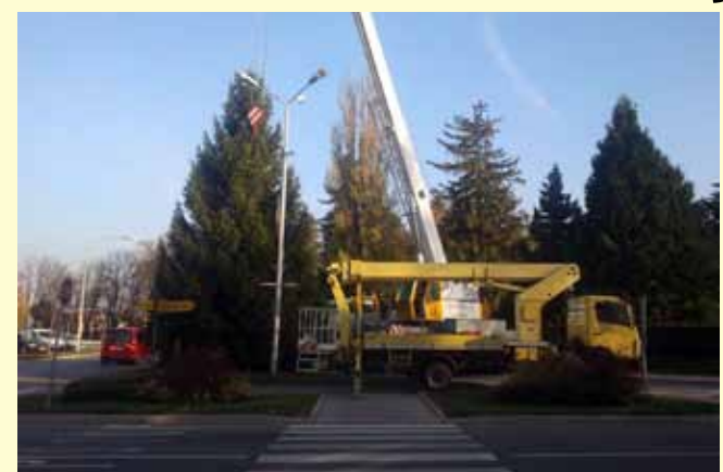
U gradskom centru postavljen je bor od trinaest metara