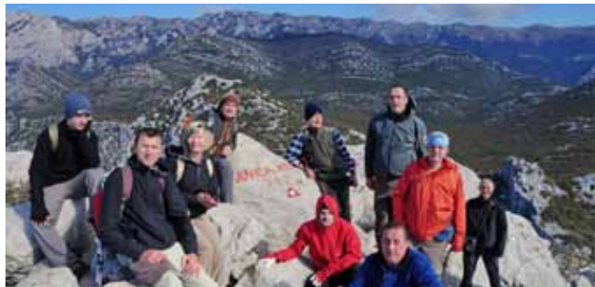
Ivanečki planinari na Anića kuku

Dvadeset i osam članova Planinarskog kluba Ivanec pohodilo je Nacionalni park Paklenica.