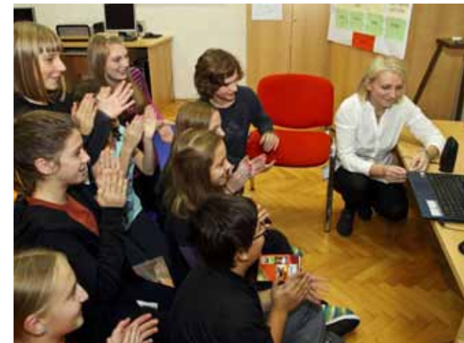
Dobra večer kolegama iz Osnovne škole braće Radića u Zagrebu!