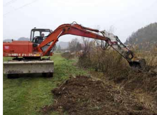
Radovi u Bedencu

Na gradskom području Ivanca tijekom studenog obavljani su radovi na uređivanju i čišćenju pojedinih zamuljenih i zapuštenih potočnih korita i kanala. Tvrtka Geoputar iz Vuglovca s radovima je počela u Ulici Bistrica u Ivancu, gdje je teškim strojevima pročišćeno 380 metara korita potoka Bistrice. Potočno korito pretходно je bilo puno mulja, naseos i raslinja, koje je uvelike otežavalo protok vode. Nakon čišćenja, takvih problema više nema, Bistrica već lakše „diše“, a usput rečeno, mještane veseli što su se u potok ponovno vratile – pastrve!