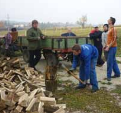
Radna akcija stažnjevečkih entuzijasta

Želeći osigurati dovoljne količine ogrjeva za zagrijavanje prostora u staroj školi, koje često koriste za probe i uvježbavanje programa dječjih sekcija i Glumačke skupine, mještani su u šumi