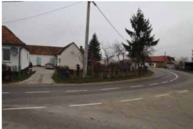
Iduće godine nastavit će se gradnja nogostupa uz županijsku cestu u Salinovu, do zadnje kuće u naselju Vargovec