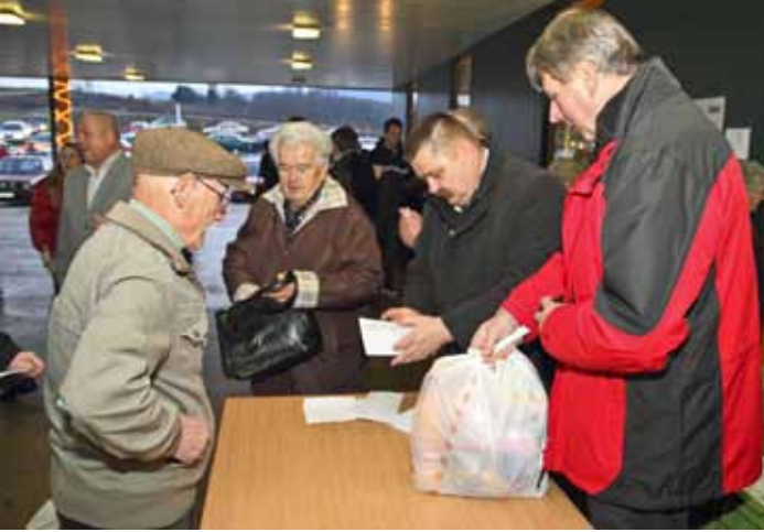
Gradski vijećnici podijelili su poklon-pakete našim najstarijim sugrađanima

puna su više nego očite. Potpuno su očuvana sva tvrda zubna tkiva (nema brušenja!), postupak je apsolutno bezbolan i kratkotrajan pa ga dijete dobro podnosi, a vjerojatnost pojave karijesa je minimalna. Stoga, imajte na umu, radi dobrobiti svoga djeteta, poznatu izreku "Bolje spriječiti, nego liječiti!".