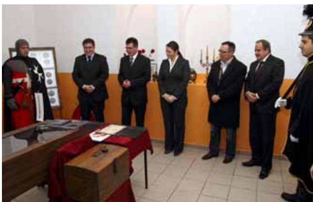
Udruga Ivanečki vitezovi u Zagrebačkoj je banci dobi-la snažnog sponzora

Predstavnici ZaBe pohvalno su se izrazili o projektima što ih provodi udruga te izrazili nadu