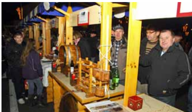
Ponudu su izložile gradske udruge i pojedinačni izlagači