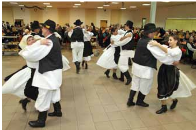
E, da su mlađe noge u djedova i baka, pa da i oni sa KUD-om Salinovec zaplešu polke i drmeše!

da su poneki bake i djedovi, bojeći se da će ostati bez svog poklona, na podjelu došli čak dva sata prije zakazana roka!