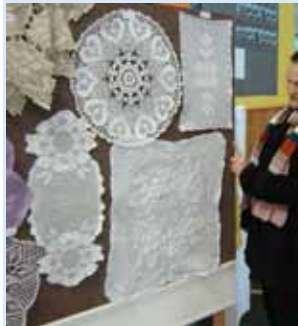
Zadivljuje ljepota ručnih radova što ih žene samozatajno izrađuju u svojim slobodnim satima

Učenička zadruga Igllica radovanske Osnovne škole Metela Ožegovića u petak je, 16. prosinca, u suradnji s Društvom prijatelja glazbe i narodnih običaja Lompuš, u školskom predvorju priredila izložbu ručnih radova