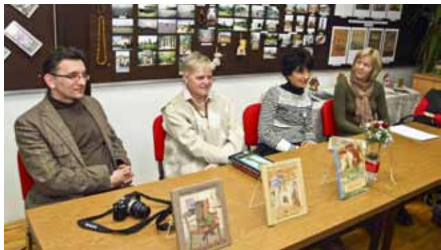
Zanimljiva kulturna večer u Gradskoj knjižnici