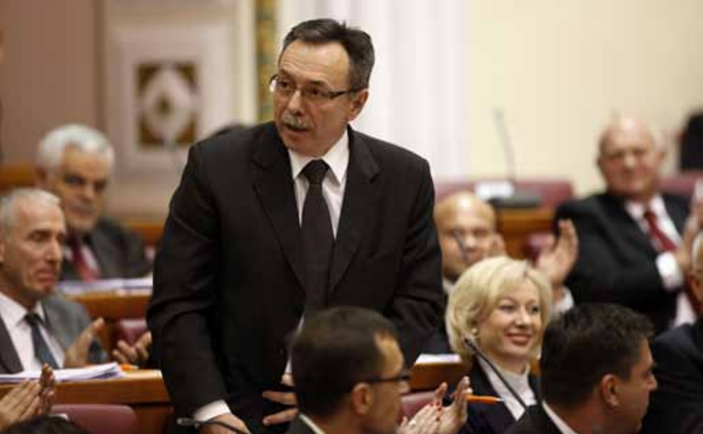
Pljesak za potpredsjednika Hrvatskoga sabora