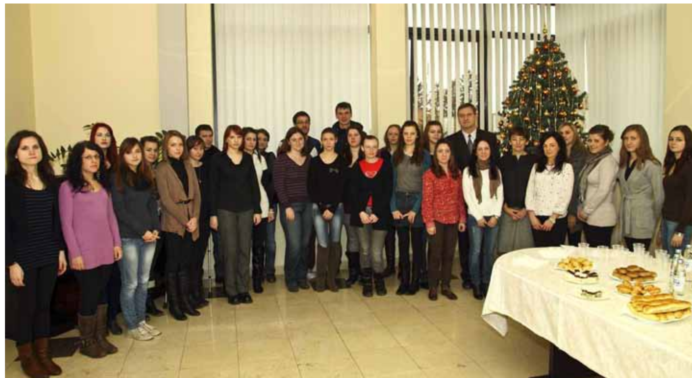
Za 36 gradskih stipendista Grad će izdvojiti 180.000 kuna