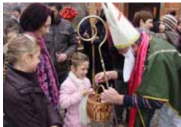
Na nikolinjskom dočeku u Lančiću

Uz pjesme, hrabriji su mališani sv. Nikolu obradovali stihovima. Nikolinjski doček organizirao je DSR Lančić-Knapić,