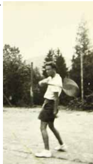
Na igralištu kod Rudnika, sagrađenim prema međunarodnim standardima, igrao se tenis

imati bazen s vodom, netko se sjetio: Kad se već gradi, neka se sagradi bazen u kome će se moći plivati. Tako je izgrađen prekrasan olimpijski 50-metarski bazen. Da li zbog neznanja