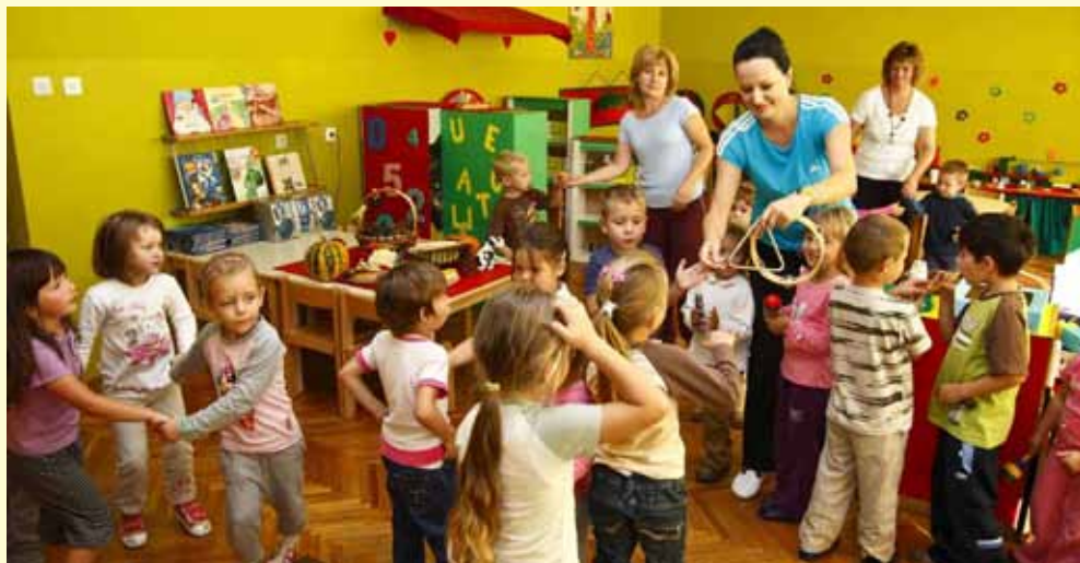
Radovanski vrtić je „prebukiran“

žavanju javnih i zelenih površina, održavanje nerazvrstanih cesta, igrališta i groblja, zimska služba, čišćenje kanala, potrošnja struje za javnu rasvjetu i njeno održavanje, namijenjeno je 3,15 milijuna kuna. Donesen je i plan gradnje komunalnih vodnih građevina, vrijedan 12,84 milijuna kuna.