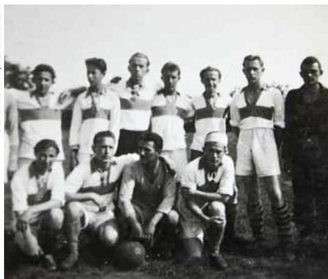
Momčad Viktorije iz 1942. g.

U to doba, odmah nakon rata, dobili smo i pravi olimpijski bazen. Kako je rudnik, radi zaštite od požara, trebao