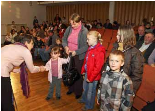
Svečanosti darivanja odazvale su se, većinom, cijele obitelji

Kao i svake godine, darivanju su se većinom odazvale