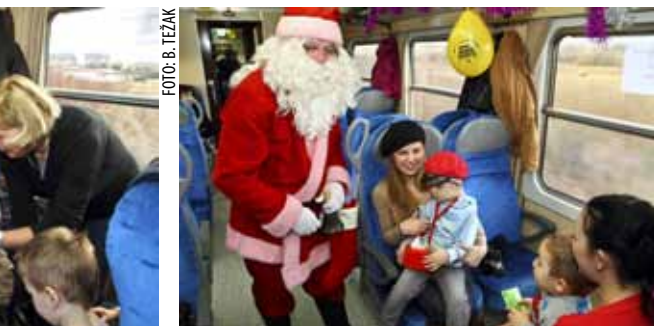
U raspjevanom vlaku djecu je razveselio Djed Mraz

Veselju ivanečke dječice, koja su širom otvorenih očiju