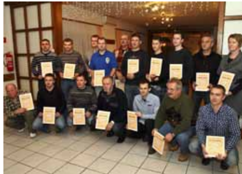
Članovi PK Ivanec uspješnu radnu godinu obilježili su dodjelom priznanja