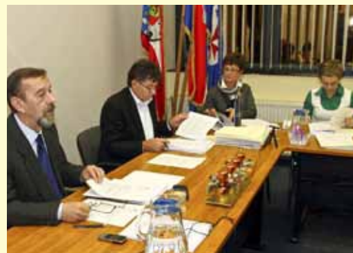
I za predsjednika Vijeća Č. Bračka donošenje proračuna uvijek je tema broj jedan

Proračunom su raspoređena i sredstva za socijalnu skrb, blizu 696.000 kuna. Kulturnim ustanovama i programima u 2012. godini namijenjeno je 1,67 milijuna kuna, dok je za sport osigurano 1,35 milijuna i to 743.500 kuna za financiranje programa preko Zajednice sportskih udruga te još 610.000 kuna za gradnju, održavanje i programsko korištenje sportskih objekata od strane udruge. Značajna sredstva, oko 1,1 milijun kuna, planirana su i za razne gospodarske programe. Za rad Dječjeg vrtića osigurano je 2,42 milijuna kuna, dok je programima iznad standarda u školstvu namijenjeno 1,29 milijuna (400.000 za sufinanciranje srednjoškolaca te dodatnih 170.000 kuna za prijevoz učenika osnovnih škola i Srednje škole Ivanec, zatim, 180.000 kuna za stipendije, pola milijuna kuna za sufinanciranje najma škola u Radovanu i Salinovu, 42.000 kuna za školu plivanja, školske sportske klubove, učeničko zadrugarstvo i nagrade učenicima i mentorima itd.).