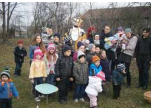
Sv. Nikola došao je i djeci Ribić Brega

Sv. Nikola sa svakim je djetetom porazgovarao, darivao ih i oduševio, pa i ne čudi da je zajednički susret zakazan i dogodine, u još većem broju! Mještani se nadaju da će doskora i njihovo naselje dobiti dječje ili sportsko igralište, kako