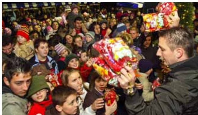
Sv. Nikola trebao je i pomoć u podjeli darova

Sveti Nikola – koji je ove godine poradio na svom imidžu (nabolje!) - potom se družio s