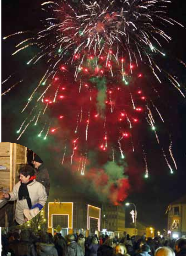
Prve sekunde Nove, 2012. godine na gradskoj špici

Sretnu Novu 2012. svim građanima želi i uredništvo Ivanečkih novina! U Novo lje-to ušli smo, na zahtjev mnogih građana, s povećanom nakladom od 4700 primjeraka, a u toj nakladi naš će se gradski list tiskati i ubuduće! (ljr)