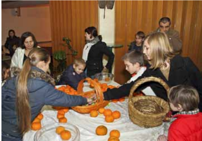
Mališane su posebno razveselili - slatkiši

cijele obitelji, među kojima su i one troje, petero, osmero, čak i dvanaestero djece. Dakako da starija djeca nisu skrivala zadovoljstvo novčanim darom, a i mnogim roditeljima poklon je pao kao dar s neba, omogu-