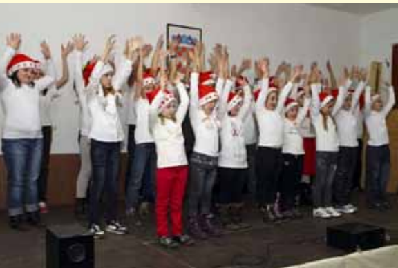
Dođi, sveti Nikola! – pjevale su stažnjevečke Zvezdice