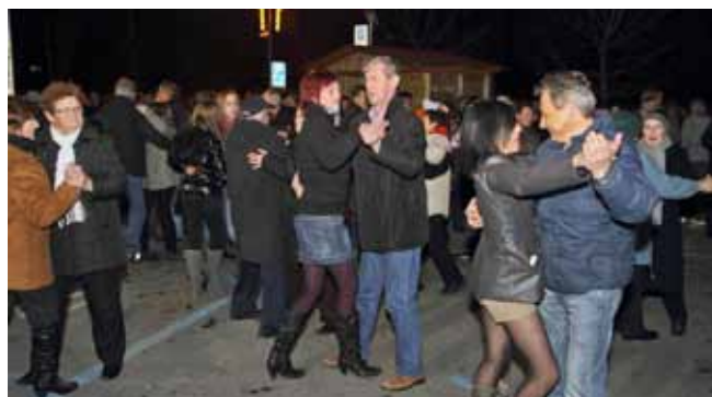
Ivančani su u Novu godinu doslovce – uplesali

SPONZORSTVO Udruga Ivanečki vitezovi sa Zagrebačkom bankom potpisala je ugovor o sponzorstvu