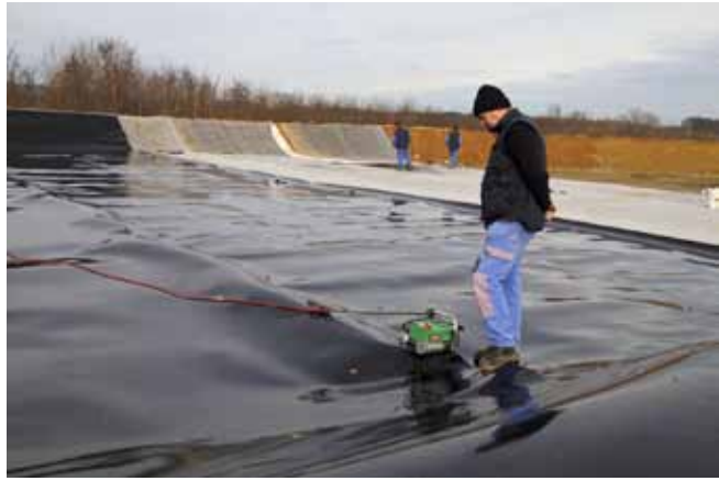
U novu kazetu neškodljivo će se odlagati svježe smeće

Od ukupno tri predviđene kazete, ova je najmanja i procjenjuje se da će se napuniti za godinu dana. Potom će se ona na propisan način (također ge-