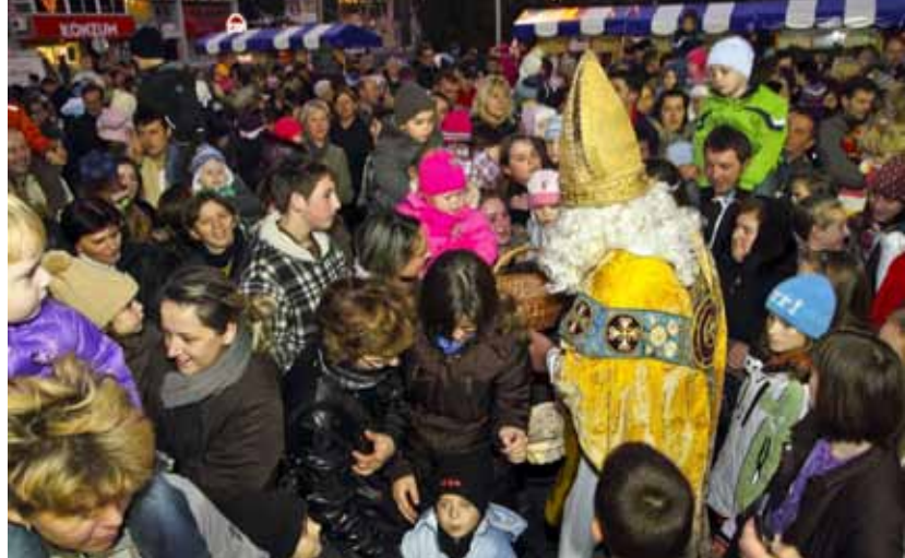
Djeca su radosno okružila sv. Nikolu

mladih i stažnjevečke Udruge za kulturu i sport te svima podijelili slatke darove. Doček su organizirali ivanečki Dječji vrtić Ivančice i Grad Ivanec, koji je pokrio troškove nabave tisu-