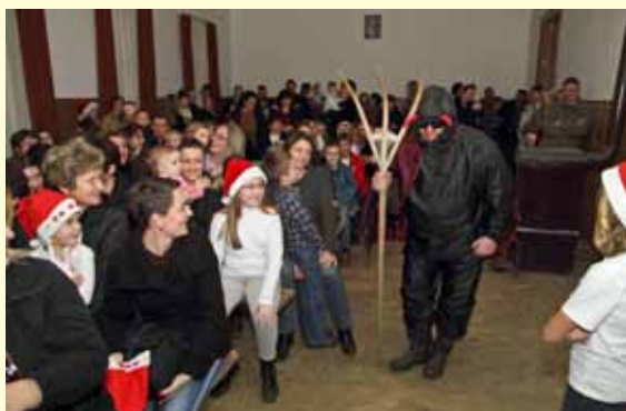
Došao je i Krampus!

Kao pedagoški podsjetnik, podijeljene su im šibe, koje je, rekoše nam, zlatnom bojom špricala poznata stažnjevečka Štefa, članica Glumačke družine Komedijaši Ivana Sekelj. Na dočeku se okupilo 75 djece u pratnji roditelja, a za dječje veselje uspješno su se pobrinuli – a tko bi drugi – marljivi članovi mjesne Udruge za sport i kulturu. (ljr)