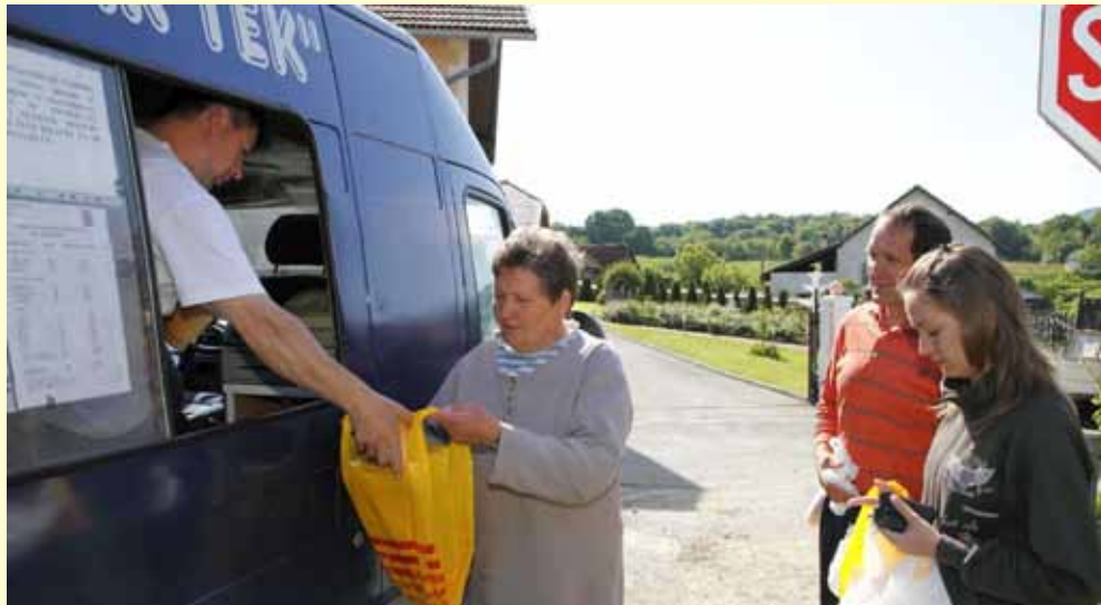
Novom odlukom reducirani su koridori prodaje putujućim trgovinama

Nadalje, održavanju komunalne infrastrukture – a tu ulaze radovi na čišćenju i odr-