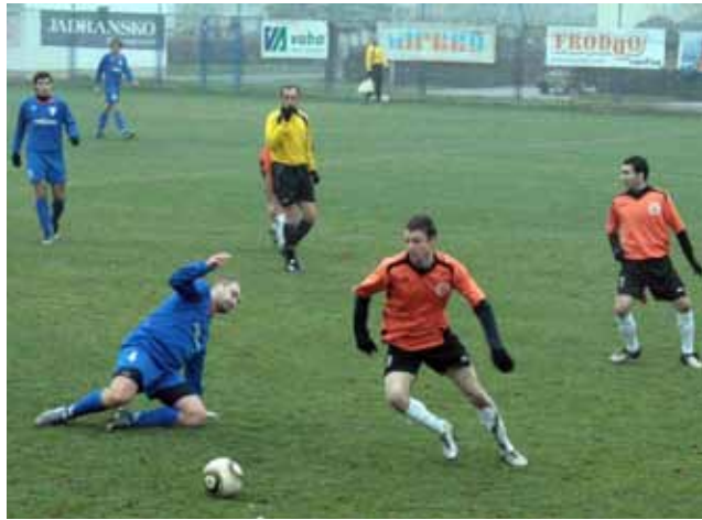
Ivančiči će u nastavku prvenstva glavni cilj biti ostanak u gornjem dijelu tablice