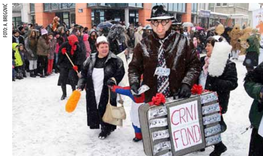
KUD Salinovec u karnevalskom raspoloženju