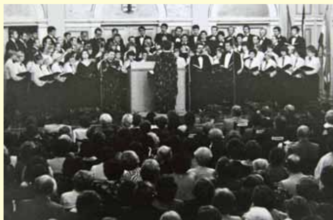
Nezaboravan nastup ivanečkog zbora u varaždinskoj katedrali 1981. godine