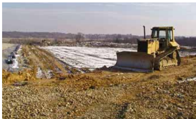
Prostor odlagališta u Jerovcu predviđen je za uređenje reciklažnog dvorišta

Tužno 3 i 4) definiran u skladu sa zahtjevom za prenamjenom postojećih građevinskih područja, kao i u Lovrečanu (za pilanu). Područje napuštenih eksploatacijskih polja u Jerovcu predviđeno je za gospodarske namjene (buduća pretovarna stanica), a dijelom i za sportsko-rekreacijsku zonu.