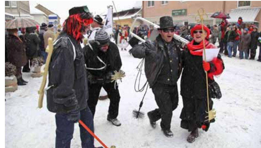
Fašnička Republika je proglašena!

Impresivan program priredili su Orači pri Etnografskom društvu Leskovca. Larmali su i Pikači iz Selnice „odjeveni“ u slamu i izvorne glinene maske, kao i članovi KUD-a iz Domašince, Napuhanci iz Turčišća, lafre iz Salinovca koje su izvrgle ruglu praksu korumpiranih političara, kosmati Demoni iz Vidma, lepglavski Nogometasi iz Remetinca, lijepe gejša iz Sv. Jurja na Bregu te Cestari iz Gornje Voće i Prvi ljudi iz Bratovštine sv. Josipa u Donjoj Voći. (ljr)