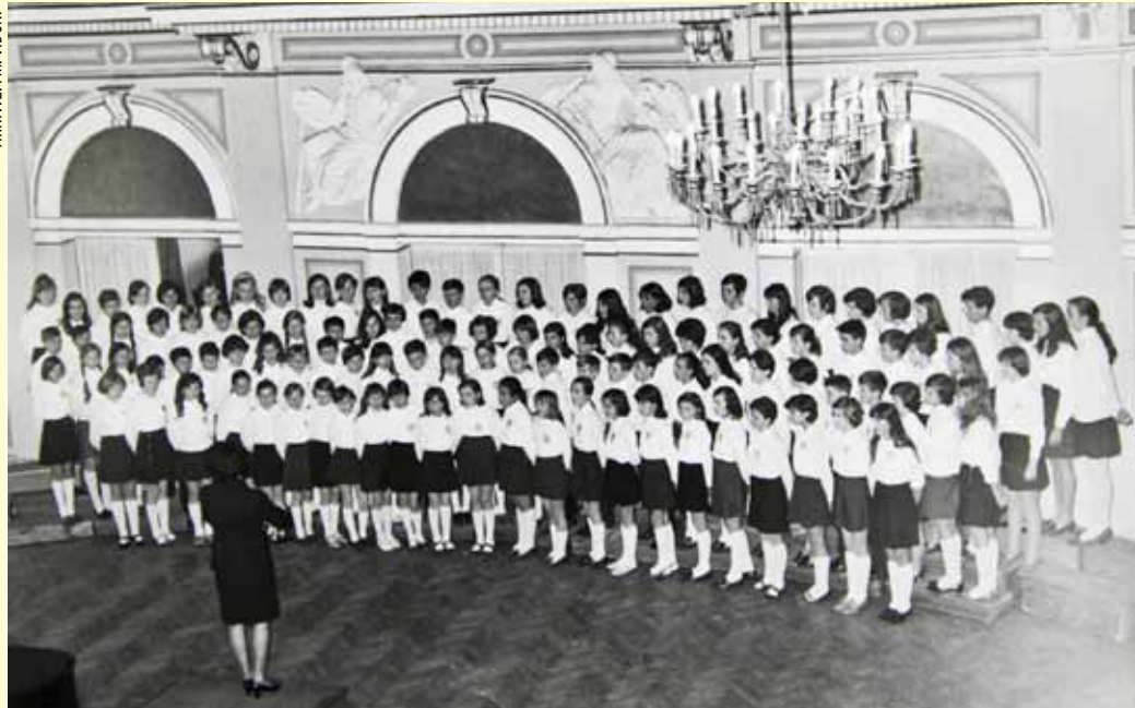
Godine 1956. školski je zbor imao stotinu pjevača!