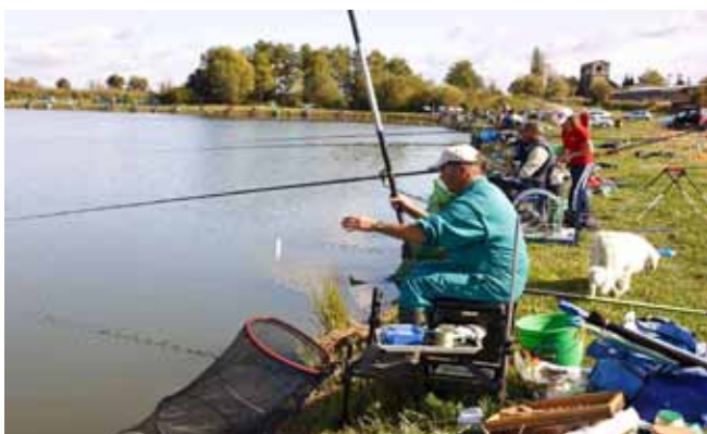
Područje bajera predviđeno je za malu turističku zonu

Što se tiče elektroničko-komunikacijske infrastrukture, izloženi su prijedlozi zona za postavljanje novih antenskih stupova i za smještaj Sunčevih elektrana. Predstavljeni su i prijedlozi koji se odnose na zaštitu voda, odvodnju otpadnih voda i vodoopskrbu, s gradnjom novih vodospremnika Pilana 2 i Prigorec. Prikazani su i potezi gradnje zaštitnih nasipa na rijeci Bednji. (ljr)