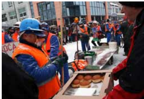
Graha, doduše, nije bilo, ali i krafne su dobro „sjele“