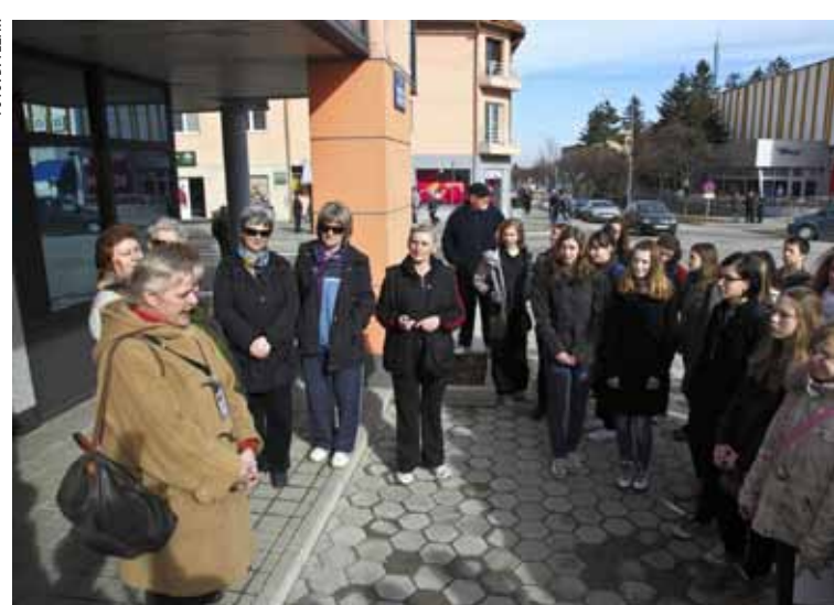
Turistički obilazak „Ulicama kružim“ počeo je kod Gradske vijećnice