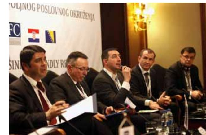
U Beogradu su prezentirana i ivanečka iskustva u stvaranju povoljne klime za poduzetnike, a Ivanec je doživio dosad najveću međunarodnu promidžbu

na zadaće države i lokalne samouprave u unapređenju ekonomske suradnje, mobilnosti kapitala i konkurentnosti regije, a iznio je i neka konkretna