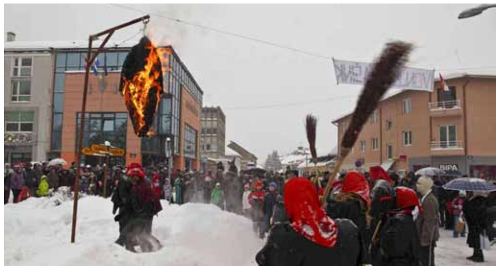
Fašnik je glavom platio za prouzročene nevolje

No, to je bila tek šaljiva uvertira u veselje koje nije izostalo ni unatoč obilnom snijegu i minus 7 stupnjeva Celzijevih ispod nule. Maskiranu povorku na špicu su uveli domaćini – članovi Društva prijatelja narodnih običaja Maska, s rasklepetanim gumilama i razigranim copricama s crvenokosim vragecom. Iz Ludbrega su se došuljali odlični članovi Čr-