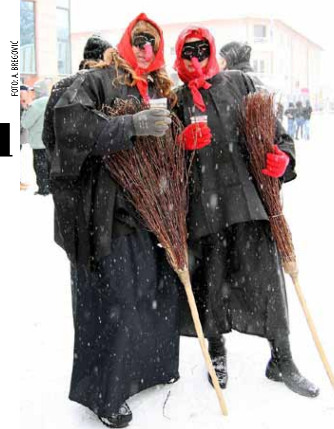
I copricama je zatrebao predah...

Veselju na špici pridružili su se i pojedini gradski vijećnici, članovi Savjeta mladih i Udruga za sport i kulturu iz Stažnjeva, koji su građane počastili s 1500 krafni i vrućim vinom. Fašnik su organizirali Društvo prijatelja narodnih običaja Maska i Grad Ivanec, a suorganiziralo ga je Turističko društvo Ivanca. A ta lijepa manifestacija i ove se godine – unatoč hladnoći, velikom snijegu i manjem broju posjetitelja no inače - potvrdila kao jedna od najomiljenijih narodskih priredbi. (ljr)