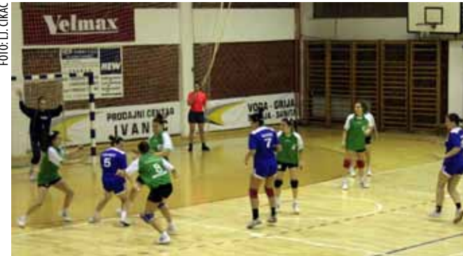
Ženska rukometna ekipa natječe su u 2. HRL Sjever

Ekipa Ivanca nastavak prvenstva u 2. HRL počela je porazom. Ivančanke su u prvenstvenoj utakmici 12. kola