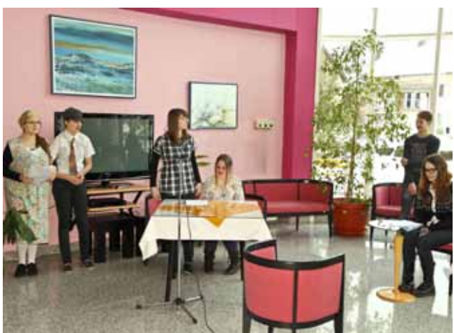
Skupina osmaša u Romantičnom sijelu