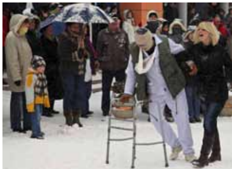
Satirom na verbalne „bisere“ političara...

nog mačka, a potom i velike skupine kurenata i drugih maski iz slovenskih Dražena-ca i Leskovca.