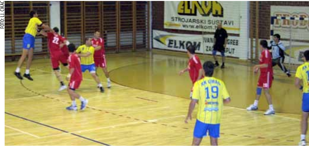
U nastavku prvenstva Ivančica je loše startala (ilustracija)

Ivančica je zatim u dvorani Srednje škole Ivanec s ekipom Đakova prvenstvenu utakmicu 15. kola odigrala neriješeno, 20:20. Ivančani su u utakmi-