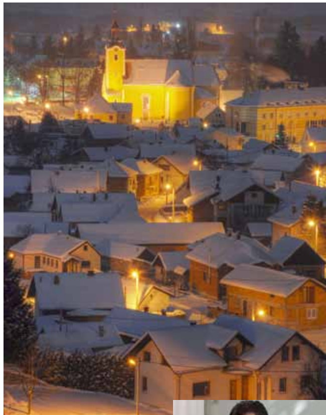
Nakon uvođenja novog sustava i u Ivanec, uštede struje povećat će se još za najmanje desetak posto

- Napominjem da je riječ o uštedama ostvarenim u svim naseljima osim Ivanca, u kojemu štedne žarulje nisu montirane. Sigurno je da ćemo dodatne uštede struje ostvariti u drugoj fazi toga projekta, o kojemu se