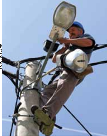
Štednim žaruljama uštede – no je 220.000 kWh struje

S obzirom na činjenicu da je riječ o ulaganjima u gradskom