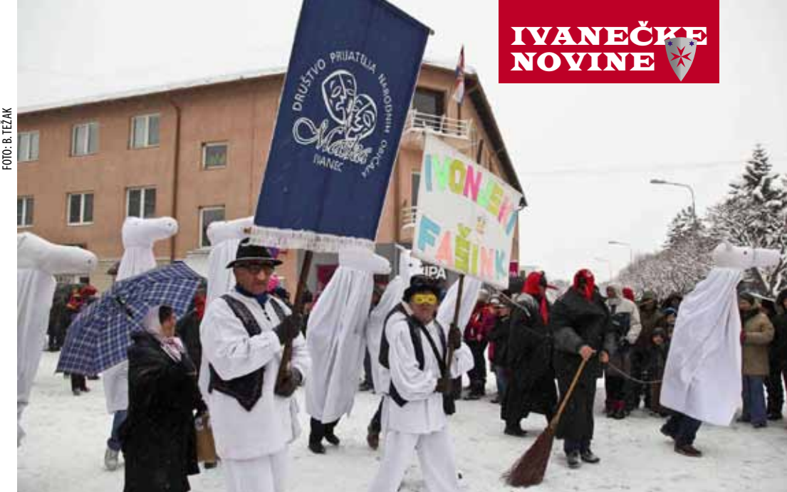
Povorku su predvodili domaćini iz Društva prijatelja narodnih običaja Maska