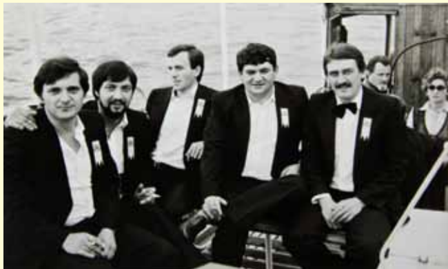
Na brodu za Iž: Neveru na povratku zboraši prepričavaju do danas