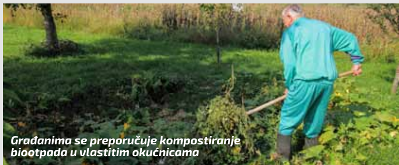
Građanima se preporučuje kompostiranje biotopada u vlastitim okućnicama

Biotopad bogat ugljikom: lišće, usitnjeno granje, ostaci od orezivanja voćki