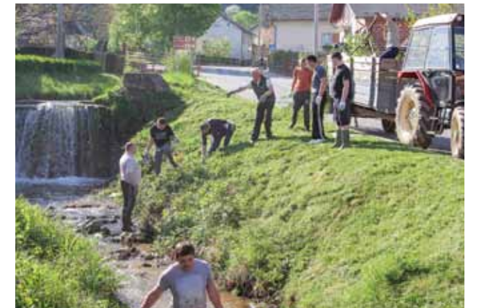
Trnju i vrbama nije mjesto u potoku