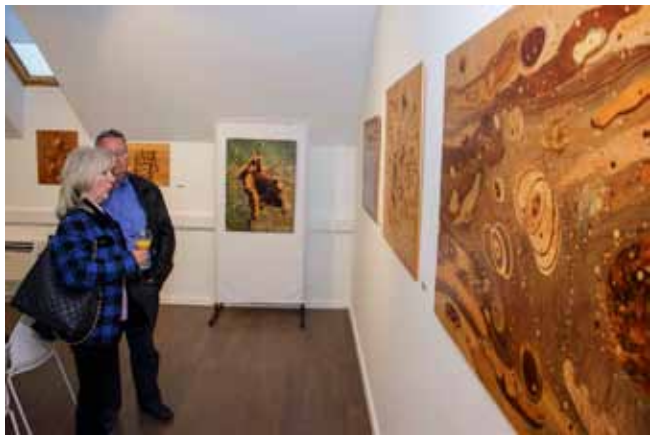
Radovi koje može razgledati publika u Ivancu prethodno su izloženi u galerijama više europskih zemalja

Na njegov umjetnički rad i specifičnost stvaralaštva osvrnula se povjesničarka umjetnosti Ivančica Peharda, a izložbu je otvorila v. d. ravnateljice Muzeja planinarstva Marina Držaić: