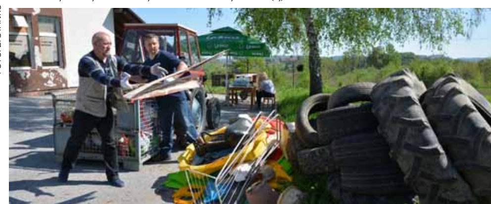
Sve se to besplatno može odložiti u Ivkomu

MO Jerovec Gornji i Glazbena udruga Canticum cordis