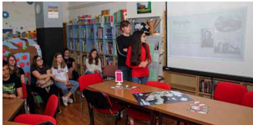
Zanimljivi sadržaji Noći knjige u ivanečkoj Gradskoj knjižnici

NOĆ KNJIGE Popularizacija knjige i čitanja u Knjižnici