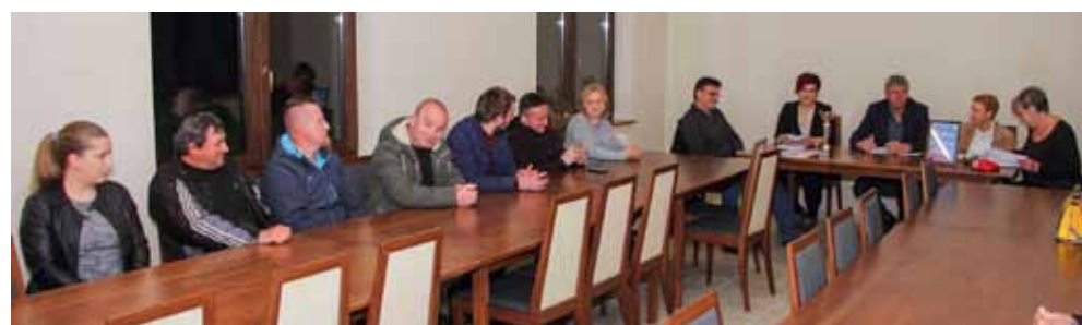
Skupština, kojoj se odazvalo 24-ero mještana, održana je u vedrom tonu i opuštеноj atmosferi

NOVA UDRUGA Održana osnivačka skupština prve udruge na području MO-a Kaniža