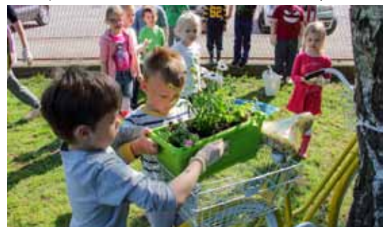
I stari bicikl ukrašen je cvijećem

Zelena čistka traje cijelu godinu, baš kao što i priliči vrtiću koji uživa eko status.