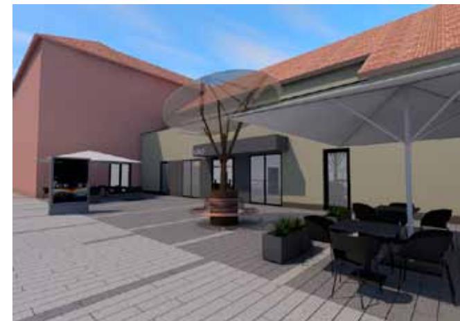
Ukupna vrijednost ovih radova je oko 300.000 kuna

Ukupna vrijednost ovih radova je oko 300.000 kuna. Ovim projektom uredit će se lijep prostor s ljetnom pozornicom za održavanje različitih glazbenih i drugih društvenih događanja.