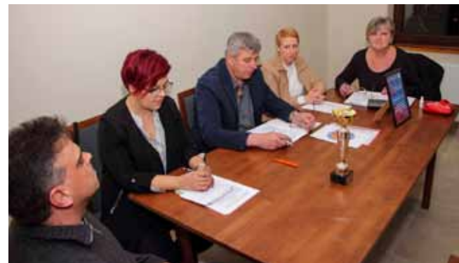
S osnivačke skupštine Udruge za sport i rekreaciju Kaniža

Za ugodnu atmosferu pobri nut će se Vokalni ansambl Sakin-ski. Svaku ženu očekuje iznenađe-