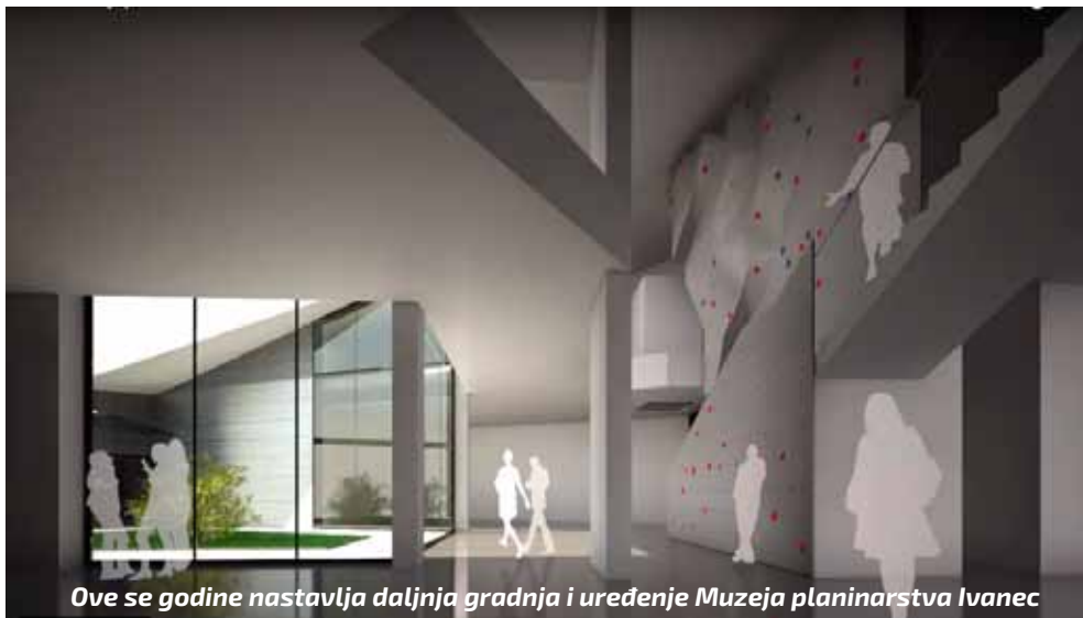
Ove se godine nastavlja daljnja gradnja i uređenje Muzeja planinarstva Ivanec

STRATEŠKI PROJEKTI Donijet Plan strateških projekata Grada