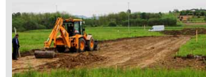
Probija se i uređuje put do gradilišta proizvodne hale

Vlasnik izgradnju hale planira završiti do kraja ove godine te u nju preseliti kompletnu proizvodnju iz sadašnjih pretjensnih prostora u Stažnjecvu. U pogonu će raditi 28 radnika, a tijekom iduće dvije godine otvorit će se još 7 do 8 novih radnih mjesta. U novim prostorima odvijat će