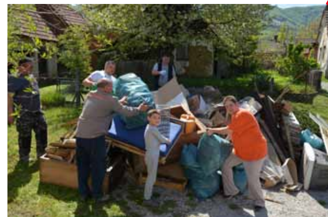
Mještani Vuglovca ove su godine Čistku proveli u Kraševoj spomen kući

I doista, j e živo. Dok su djeca bila zaposlena oko kola, članice Margarete uredile su cvjetne gredice. Više rada i truda, najavile su, trebat će uložiti u čišćenje zidica kod vodenice kojeg je za zadnjih velikih oborina Bednja poplavila i djelomično ga oštetila. U svakom slučaju, udružena Zelena čistka u Margečanu je rezultirala uzorno uređenim mjestom za koje se doista može reći da je lijepo i baš proljetno čisto i „umiveno“. (lir)