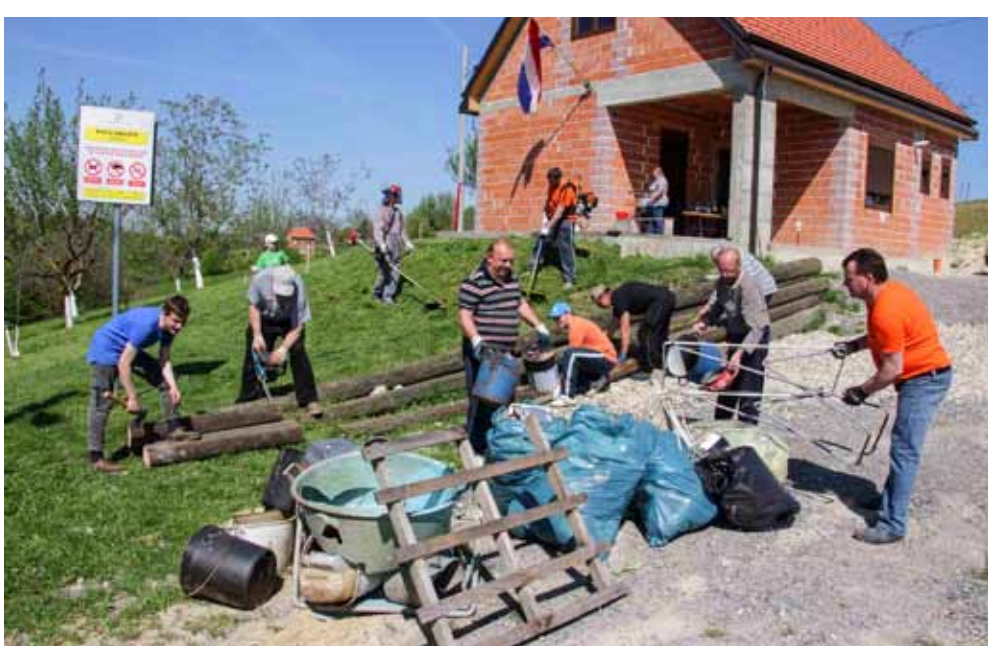
Nakon provedene čistke po šumama u okolici Osečke, mještani su uredili okoliš doma te pilili drvenu građu za ogradu

GAČICE Mjesni odbor i DVD zajedno u akciji čišćenja okoliša