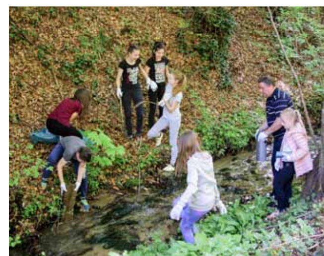
Kušteljega: Bistrica iznad pilane prepuna je smeća

A dotle su članovi Planinarskog kluba Ivanec skupljali otpad do izvora Žganog vina te uredili izvor pitke vode u Vuinovu. Akciji se odazvalo 30 članova koji su, nakon obavljenog posla, po prekrasnom danu zasluženo predahnuli uz Vuinovec. (Ijr,nn)