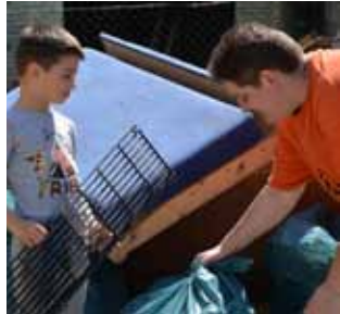
I ovaj malac rado je pomogao starijima

otpada, procjenjuje se, čak osam kubičnih metara.