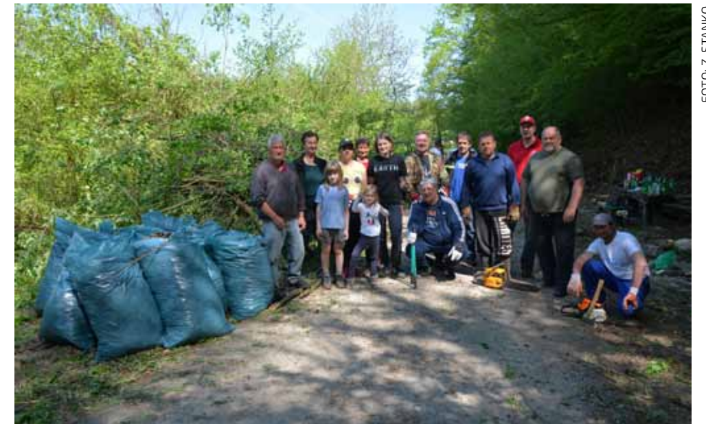
Sudionici Zelene čistke kod mosta Gajec