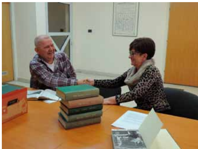
Toplo hvala za donaciju časopisa u kojima je i niz zapisa iz povijesti ivanečkog planinarstva