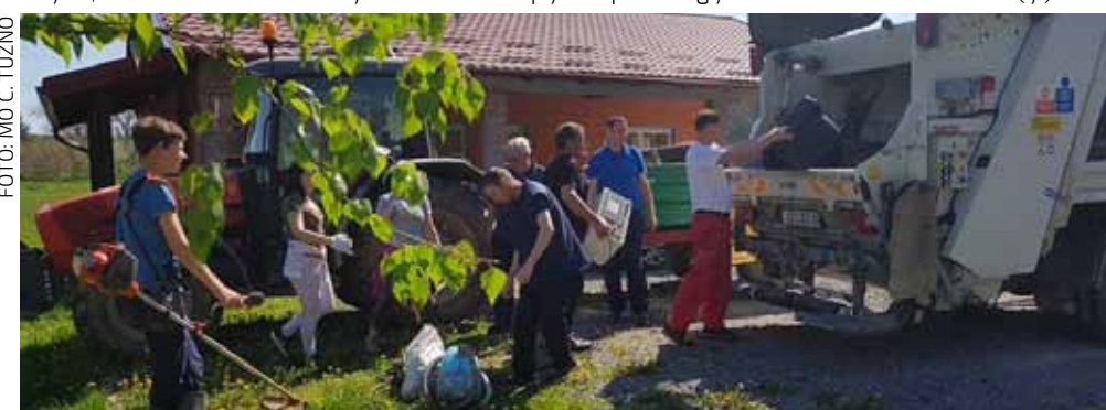
Iako su lani izrazili nadu da neće ponovno morati kupiti tuđi otpad, volontere su na istim mjestima i ove godine dočekale nove gomile smeća