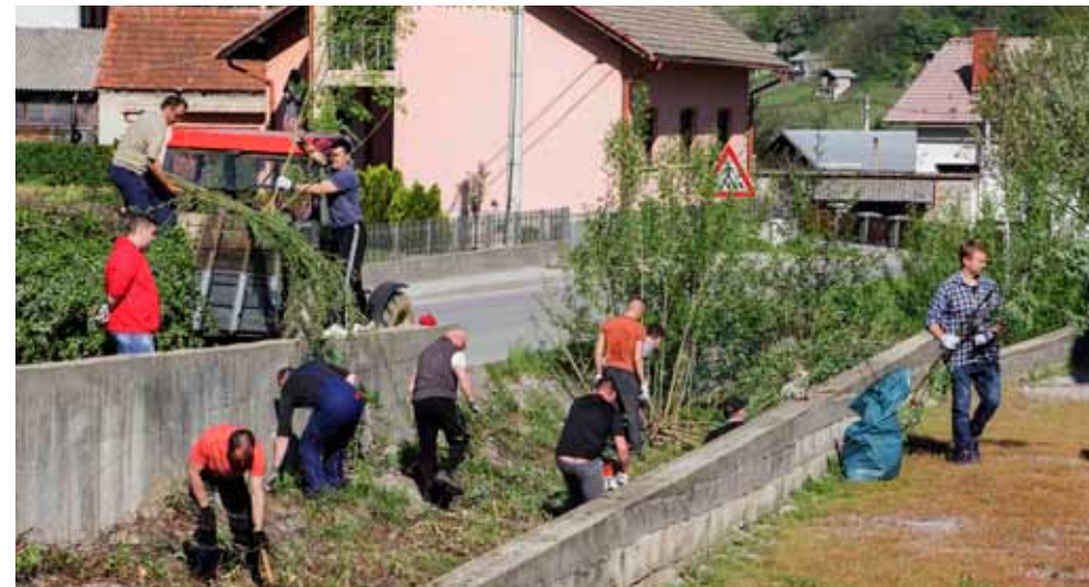
Akcija je održana na Bistrici kod restorana BVB

Trideset građana ivanečkih mjesnih odbora II i III, kojima se pridružila i skupina štićenika Odgojnog doma Ivanec, na Bistrici u Rajterovoj ulici proveli su jednu od većih i organiziranih akcija u ovogodišnjoj Zelenoj čistki. Akcija je naišla na dobre komentare građana. S razlogom, jer okupljeni volonteri posjekli su stabla i raslinje na obalama potoka te ono niknulo na mulju i nanosima, a koje je velikim dijelom otežavalo protok vode. Usto, vegetacijom zarasla Bistrica i nije pružala baš najljepšu sliku