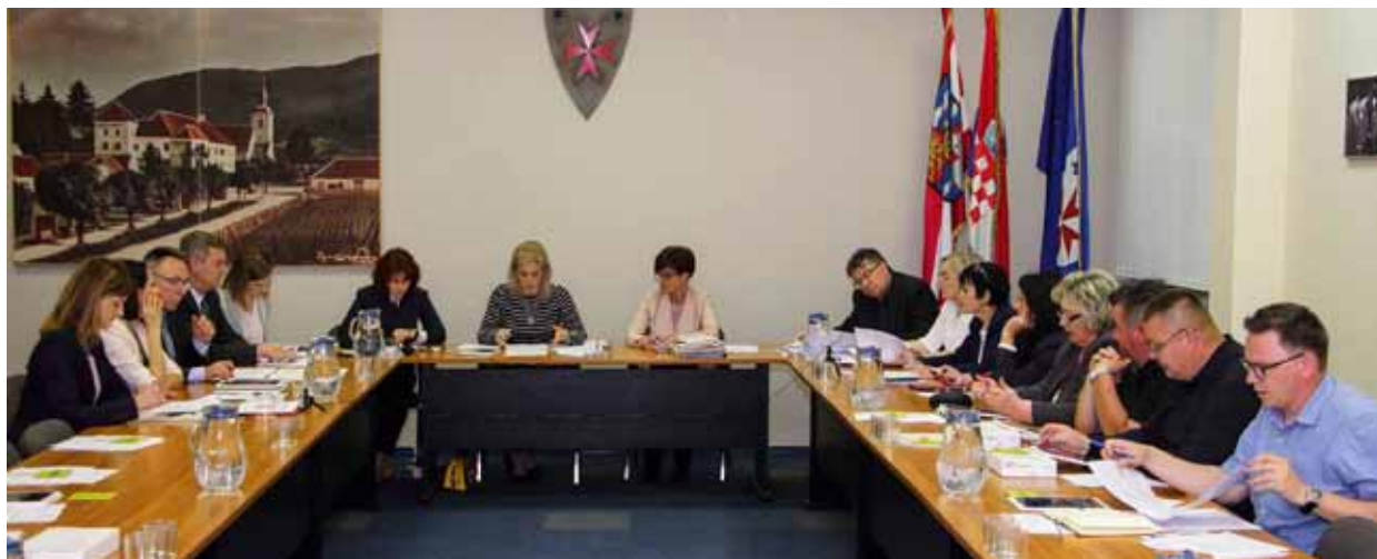
S 12. sjednice Gradskog vijeća Ivanec