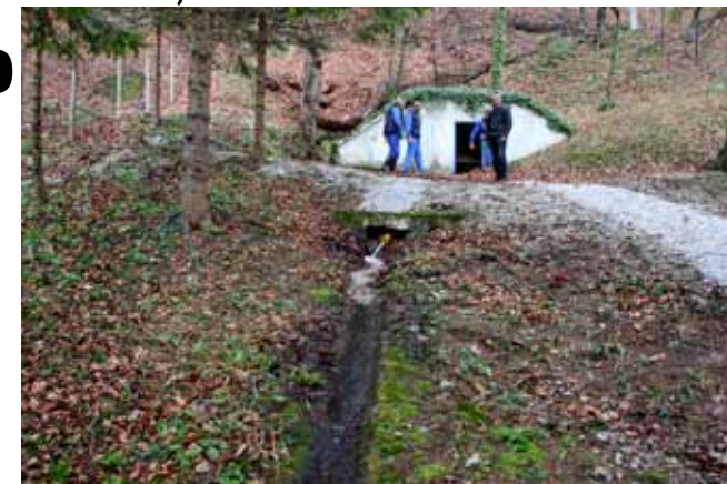
Prva faza rekonstrukcijskih radova - od Žganog vina do vodospremnika u Pahinskom

Slijedom kupoprodaje čestica u Poslovnoj zoni, investitor koristi i sve predviđene i odobrene benefite koji će mu bitno pojeftiniti ukupnu investiciju. Trenutačno se izvode radovi na otvaranju puta prema gradilištu. (ljr)