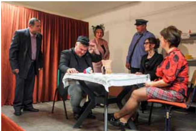
Stažnjevcani su oduševili na ovogodišnjoj županijskoj smotri kazališnih amatera