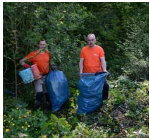
Zadnji deponij? Neka tako i ostane!