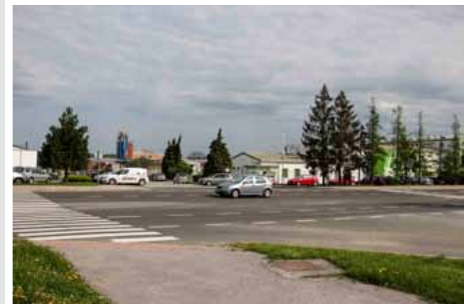
Ove godine otvara se veliko gradilište na ivanečkoj obilaznici, u kojoj će se graditi novi rotor

Treba napomenuti da je programom modernizacijom nerazvrstanih cesta predviđeno da se ove godine asfaltiraju i glavne prometnice u toj zoni, i to od Ulice Ljudevita Gaja do državne ceste, tj. do novog rotora. Na taj način smanjit će se i prometno zagušenje u jutarnjim satima oko Osnovne škole i Dječjeg vrtića, jer će se „otvoriti“ dodatni pravac.