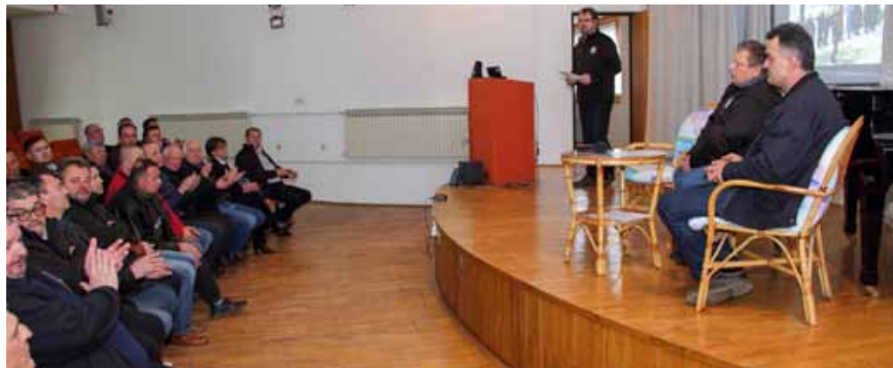
Iza udruge je 20 godina aktivnog rada i angažmana na problematiki vezanoj uz braniteljsku populaciju

Svečanost je bila popraćena galerijom ratnih fotografija koje su se smjenjivale na interaktivnom zaslonu, a koju je priredio tajnik udruge Dražen Geček. (lir)