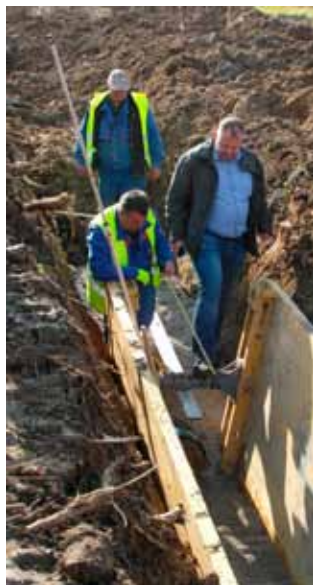
Ivkom vode: Početkom svibnja nastavljaju se radovi na izgradnji kanalizacije u Bedencu

Najveći projekti u ovom segmentu bit će rekonstrukcija nerazvrstane ceste u Prigorcu vrijedne 3,58 milijuna kuna (fi-