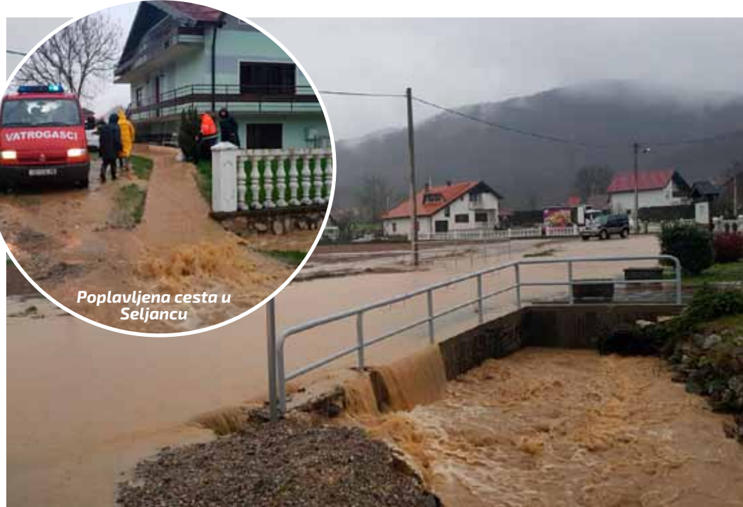
Poplavljena cesta u Seljancu

Na terenu je bio i pročelnik gradskog Upravnog odjela za komunalne poslove Stanko Rožman sa suradnicima te s predsjednikom MO-a Seljanec Ivanom Vidačekom obišao poplavna mjesta – u Selskoj ulici i u Savici, gdje je izlivanje vode na gradsku cestu prouzročio cijevni propust premalog promjera koji kod jačih oborina ne može „guta“ svu vodu. Dogovoreno je da će se propust rekonstruirati