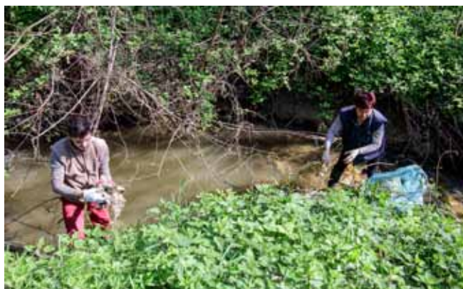
U akciji je čišćen potok Željeznica...