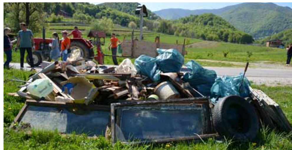
Vitešinčani su i ove godine uklonili mnogo otpada iz prirode

–Skupili smo četiri kubika većinom glomaznog otpada – stolarije, žljebova, guma, stolaca, plastike, stakla i metala – istaknuo je Gotal. Za prijevoz otpa-