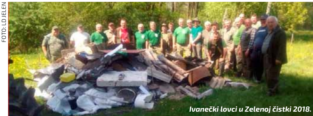
Ivanečki lovci u Zelenoj čistki 2018.