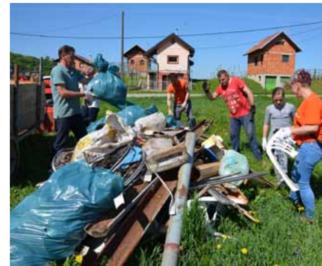
Ponovi li se ovako nešto, tolerancije više neće biti