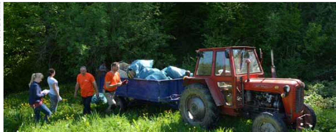
Smeće se ručno izvlačilo iz šuma i tovarilo na traktor

MJESNI ODBOR IVANEČKI VRHOVEC Gomila glomaznog otpada u predjelu Topolje