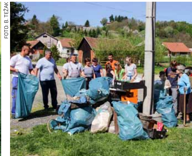
I ove godine hrpa otpada u Lukavcu

MJESNI ODBOR VITEŠINEC Ekipa mjesnih veterana i ove godine u Zelenoj čistki