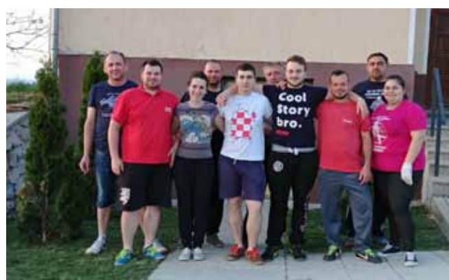
Volonteri Zelene čistke u Gačicama 2018.

GAČICE Mjesni odbor i DVD zajedno u akciji čišćenja okoliša