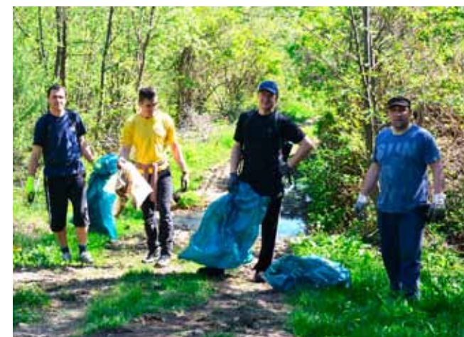
Planinari PK Ivanec u zelenoj patroli

PRIGOREC Zajednička akcija Mjesnog odbora, Udruge građana, Područne škole i Planinarskog kluba