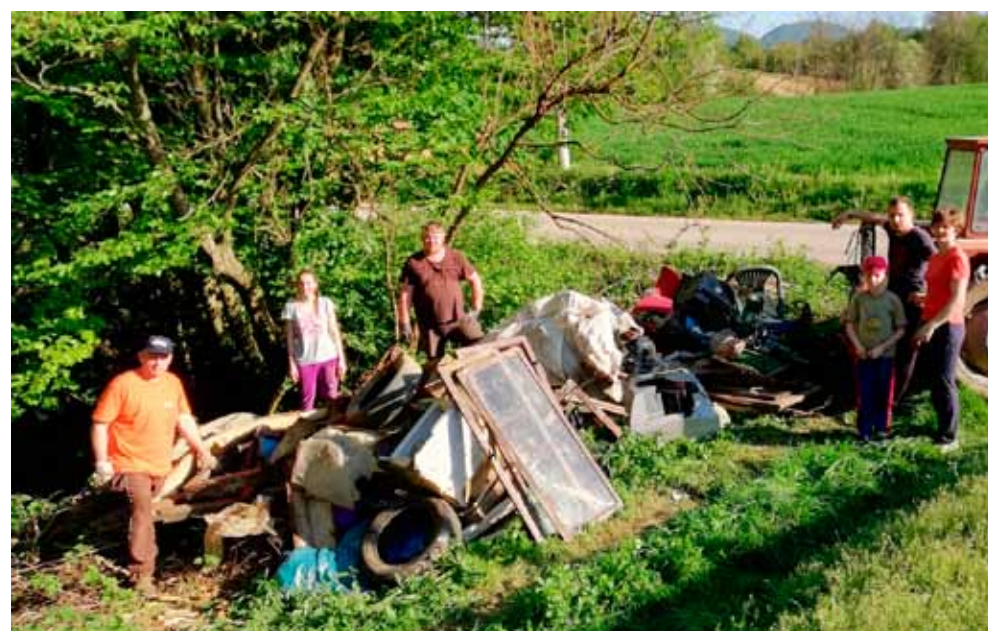
Nevjerojatno! Vrste i količina odbačenog otpada neugodno je iznenadila Stažnjevčane

S obzirom da s teško pristupačnog mjesta vaditi sav taj otpad nije bilo nimalo lako, i ne čudi ogorčenje mještana ovakvom praksom. Zatražit će od Grada da tu postavi tablu s istaknutom zabranom odlaga-