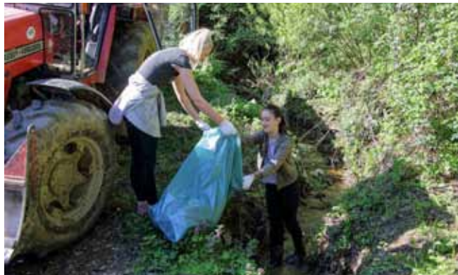
... i pritoci koji se slijevaju u njega

kao što je u donjem toku, gdje su okolni stanovnici njegove obale uzorno uredili, zasijavši ih travom i cvijećem.