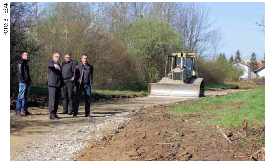
Probijeno je 150 metara potpuno nove makadamske ceste kojom su spojene Varaždinska ulica i Jezerski put

Poznato je da se Ivanec i okolica vodom snabdijevaju iz triju glavnih izvorišta u podnožju Ivančice - Bistrice, Žganog vina i Šumija. I dok su cjevovodi od Bistrice i Šumija razmjerno novi, cjevovod od Žganog vina potpuno je dotrajao, a gubici vode na njemu su veliki.