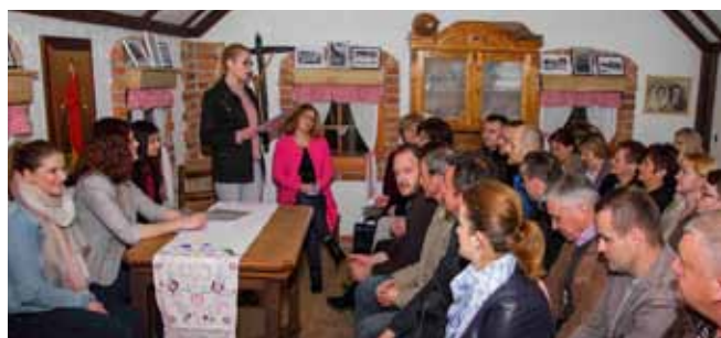
Udruga građana Margareta je spiritum movens društvenog i kulturnog života margečanskog kraja

Na uspješnom radu domaćinima je čestitala resorna pročelnica Marina Držaić te poručila da će Grad Ivanec i dalje podupirati aktivnosti Margarete. Pozdravne riječi Margareti su uputili i predstavnici srodnih kulturnih te svih mjesnih udruga koje djeluju u Margečanu. (lir)