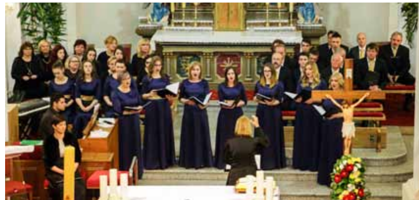
Zbor KUD-a R. Rajter i VA Sakcinski svojim su umjetničkim nastupom dali osobitu notu ovogodišnjim uskršnjim danima