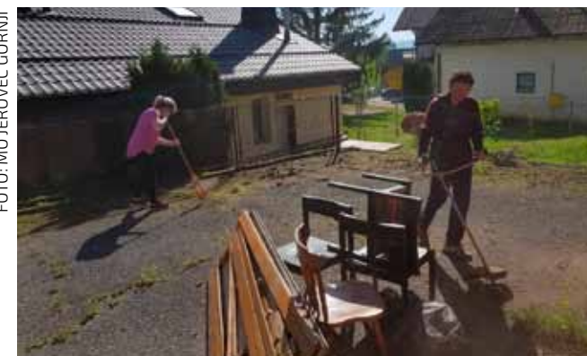
Akcija uređivanja društvenog doma i okoliša