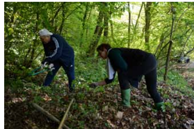
Očišćen je i uređen okoliš izvora

- Ove godine akciji su se odazvali građani i iz susjednih ivanečkih mjesnih odbora. Dobro nam ide i stvarno smo puno napravili. Naime, ovo je ruta koja vodi prema downhill stazi na Ivančici pa nam je u interesu da