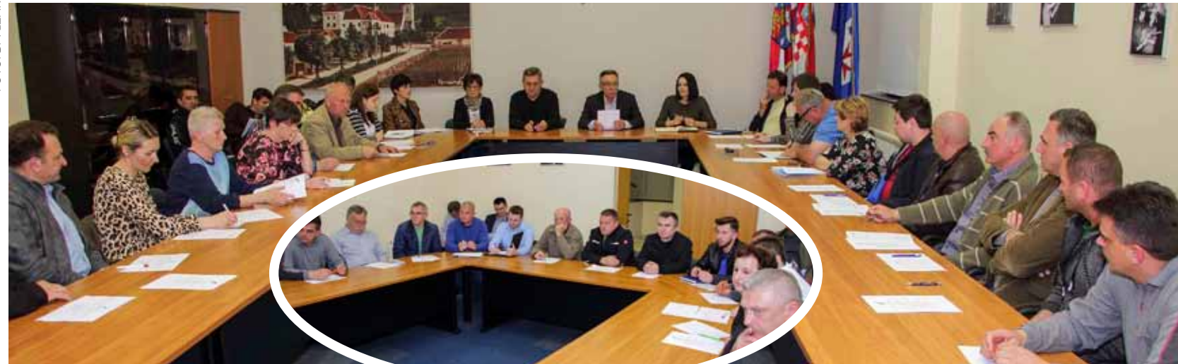
Velik odaziv koordinacijskom sastanku u Gradskoj vijećnici

ZELENA ČISTKA Ivanec je 21. travnja bio najmasovnije radilište u Hrvatskoj