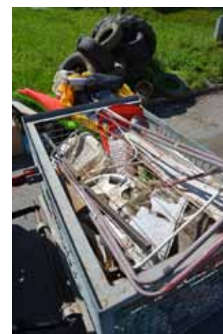
Mjesni odbor Punikve već se godinama bori s krupnim otpadom nelegalno odloženim u okolne šume