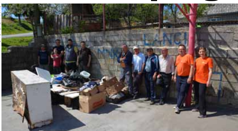
Lančić – Knapić dosad nije propustio nijednu Zelenu čistku

Mještani i rekreativci su pokosili i uredili površine uz nerazvrstane ceste