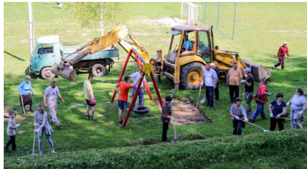
U akciji uređenja igrališta i postavljanja gumenih podloga ispod sprava za igru djece

A nakon obavljenog posla, akcijaši su druženje nastavili uz lonac s 30-ak litara graha. Kakav je bio? Odličan, jer pripremao ga je Filip Lukavečki!, profesionalni kuhar u Cimpletu!(lir)