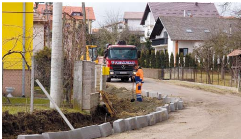
Nakon završetka gradnje nogostupa, ŽUC će o svom trošku asfaltirati kolnik

Najsloženiji radovi odvijaju se na budućem raskrižju nove ceste s Frankopanskom ulicom, gdje građani prvi put dobivaju uvid u vizuru novog prostora, koji će svojim urbanim izgledom posve promijeniti sliku toga predjela, dosad obrasla u trnje i koprive, punog smeća, mulja i nanosa. Gradnja betonskog korita i obala visine 1,60 do 2,90 metara najskuplji su dio radova na probijanju nove ulice kojom će se spojiti Rajterova i Malezova ulica. Samo ti radovi će, prema troškovniku, stajati 3,38 milijuna kuna, bez PDV-a. Bistrice, koja je na tom dijelu zbog pada vrlo brza, usporit će se i gradnjom dviju kaskada. S obiju strana Bistrice bit će postavljena zaštitna ograda. (ljr)