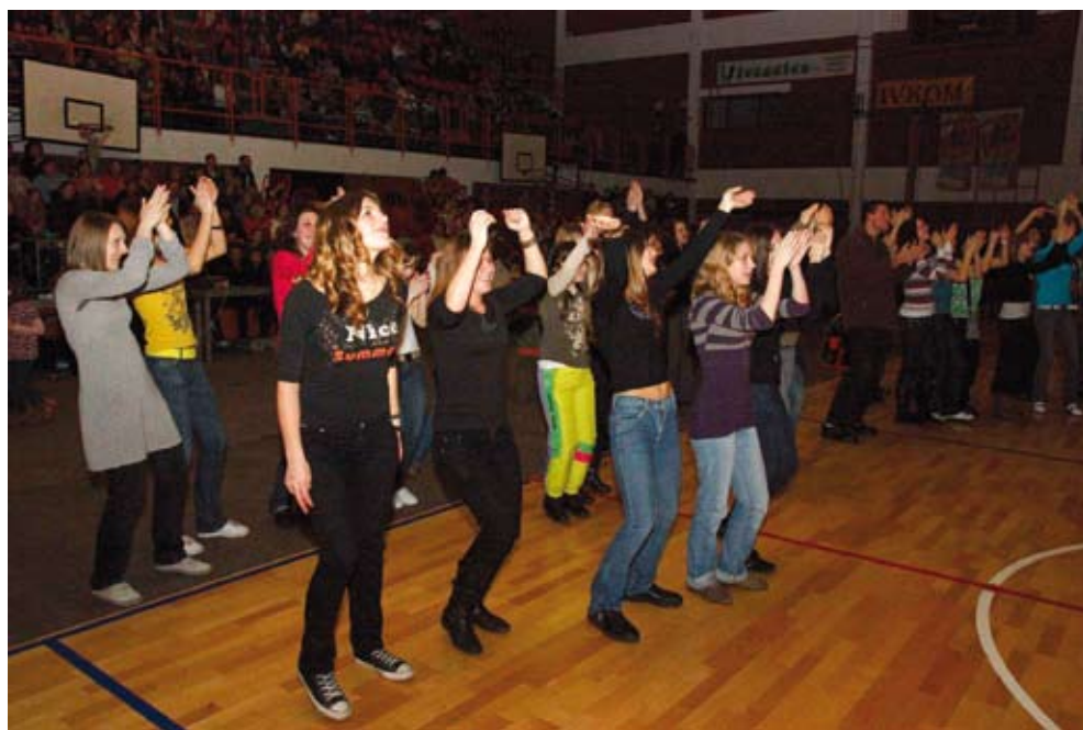
Mladi su plesali pred binom