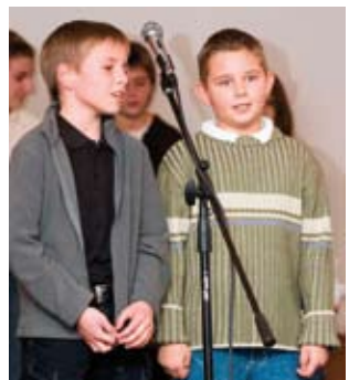
Najteže je nastupiti pred domaćom publikom