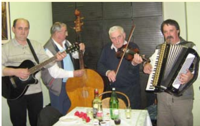
Za glazbu se pobrinula klupska tamburaška sekcija

klupske tamburaške sekcije, a svaka žena na poklon je dobila cvijet. Time je nastavljena tradicija obilježavanja Dana žena koju ivanečka Udruga umirovljenika njeguje već niz godina.(ljr)