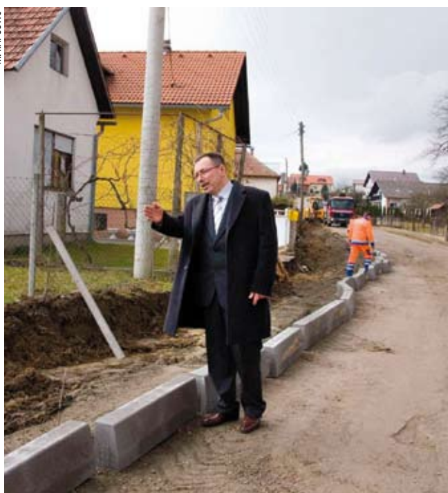
U Jerovcu se gradi nogostup dug 625 metara

Budući da je postavljanje kanalizacije i vodovoda dovršeno, radnicima Trgoingrada iz Zeline omogućeno je da počnu sa sljedećom etapom radova, pri čemu nogostup grade na trasi dugoj