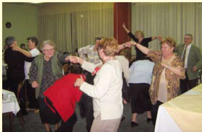
Proslava Dana žena protekla je u dobrom raspoloženju

Prigodan program za umirovljenice priredili su članovi Društva Naša djeca, koji su im i zapjevali. Druženje je nastavljeno večerom, pjesmom i plesom uz pratnju