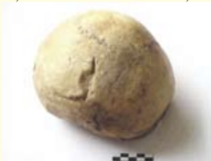
Lubanja s ozljedom uzrokovanom udarcem mačem ili sabljom (prema Belaj J. - Ivanec kroz slojeve prošlosti, Ivanec, 2008.)

prema gospodaru posjeda, plaćali su i desetinu crkvi. Osnovni način preživljavanja i izvor prihoda bila je poljoprivreda. Iz navedenog izvora vidljivo je da su uzgajali žitarice (najvjerojatnije pšenicu i zob), vinovu lozu, svinje te se bavili pčelarstvom. Iako su obaveze bile nešto manje nego na brojnim drugim lokalitetima, i ovdje je kvaliteta života bila vrlo niska, a preživljavanje upitno. Posebice se to vidi po veoma visokoj smrtnosti djece u dobi između dvije i