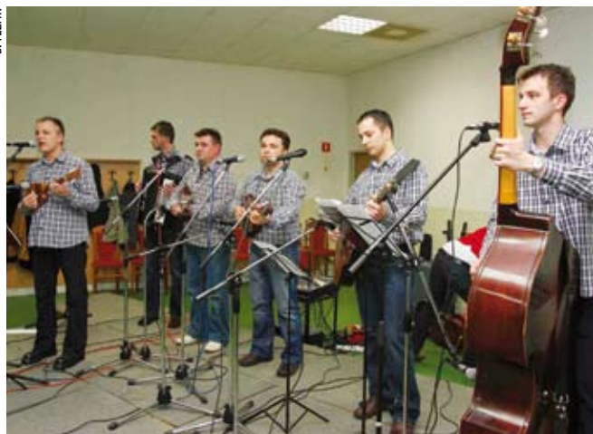
Zasvirali su i prvi tamburaši Društva Lompuš, sada okupljeni u sastavu Lirika