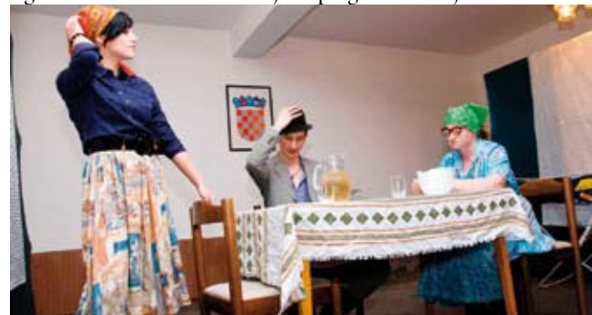
Nema dvojbi u to da će „Pusel“ biti među traženijim pučkim predstavama u našoj županiji

- Mogu samo obećati da most prek' Bednje budemo napravili, pak Štef bu mogel do svojih gužvica – kratko je nakon završetka programa Stažnjevčanima kazao