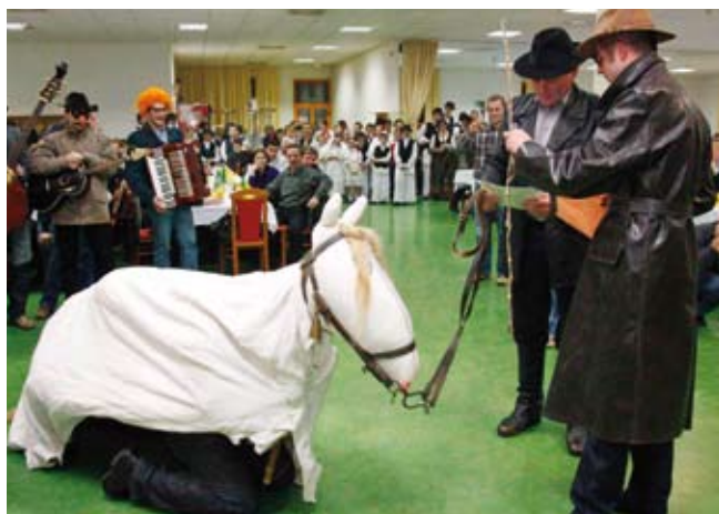
Radovanski trgovci muku su mučili s neposlušnom kobilom