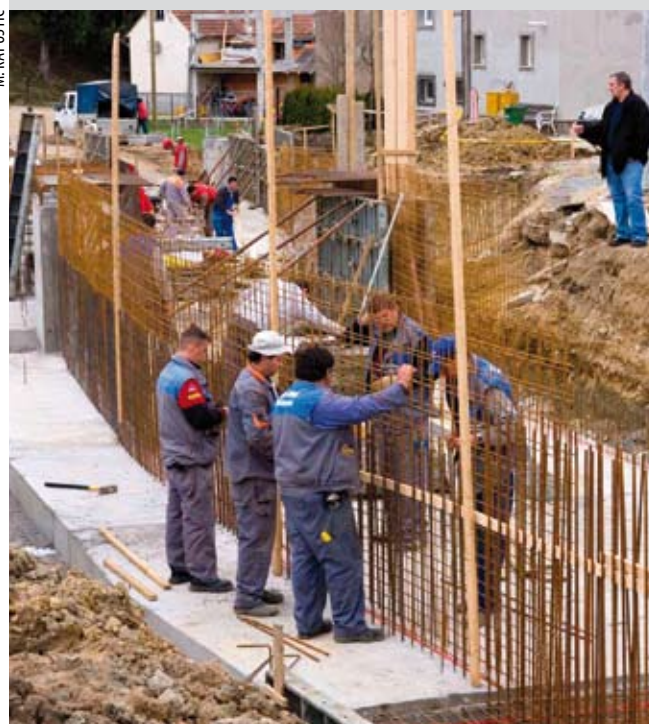
Radnici tvrtke Bauing-Rožman izvode radove na betoniranju korita i gradnji temelja buduće ceste