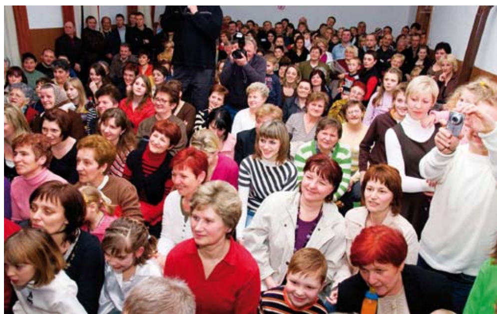
Publika je s veseljem pratila zbivanja na bini

eni događaj, pa je u staru školu pohrlilo više od 250 mještana