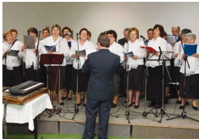
Župni zbor izveo ariju iz Verdijeve opere Nabucco

Dan žena obilježile članice Udruge umirovljenika Ivanec