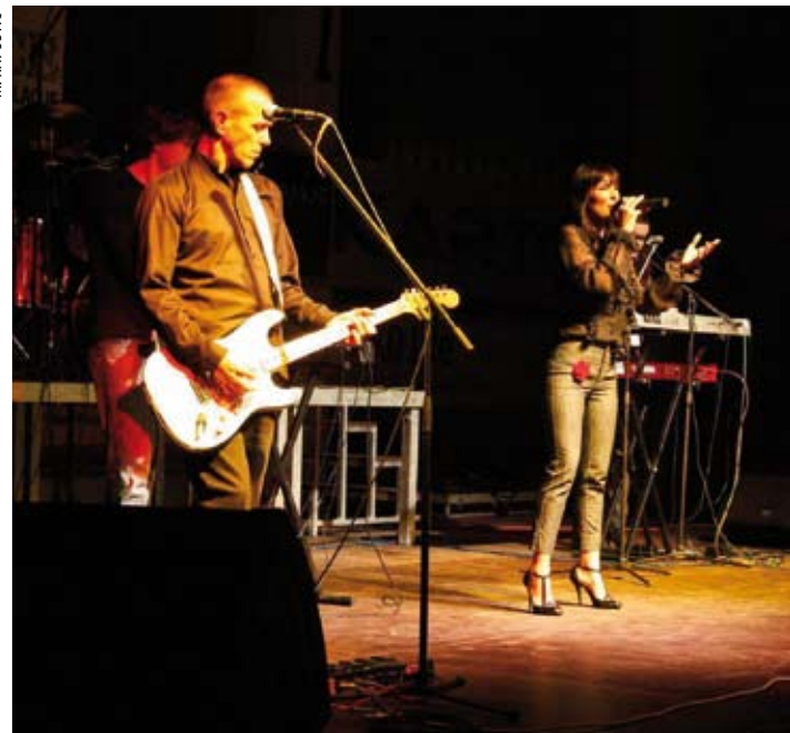
Deseci hitova nizali su se puna dva i pol sata

RADOVANSKI LOMPUŠ Članovi društva i gosti pjevali i plesali pred 450 posjetitelja