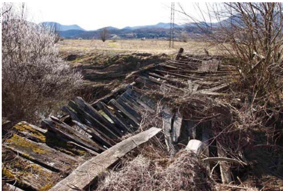
Stari most u Stažnjevcu uskoro će biti srušen, a na njegovu mjestu gradit će se novi

- Radovi će stajati oko 4 milijuna kuna, a obuhvaćaju uređivanje obala, čišćenje nanosa, dok će se u krivinama rijeke, gdje su udari vode i erozije naj-