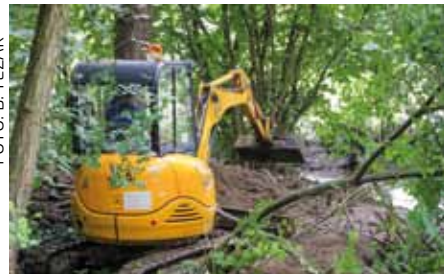
Ivkom je obavio hitne radove na potoku Ivanuševec