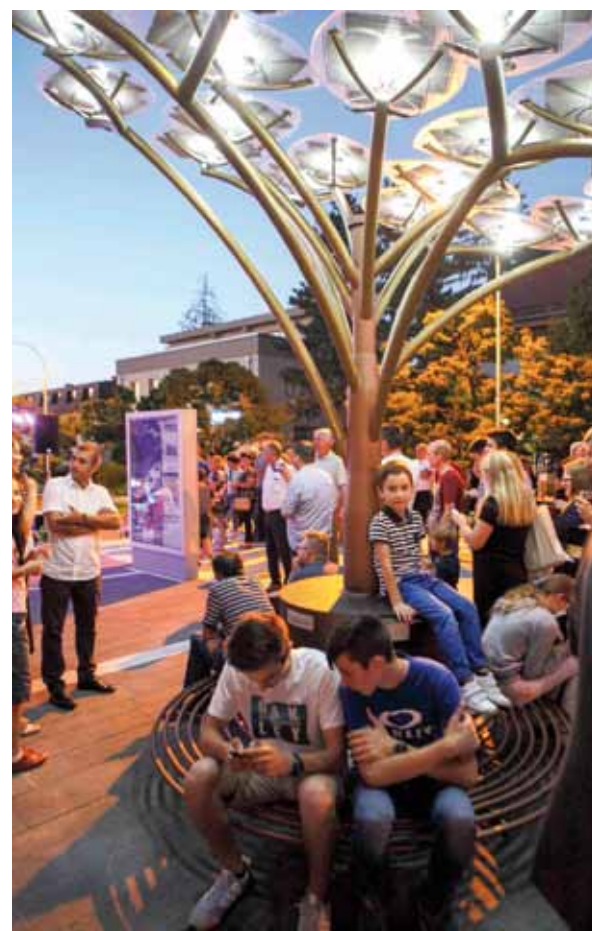
Solarno drvo opremljeno je priključcima za punjenje baterija mobitela, laptopa i električnih bicikala

Projekt uređenja Kinotrga potpisuje Arhitektonski studio Nexar. Uređenje trga, koje je uključivalo odstranjivanje starih opločnika, zemljane radove, postavljanje novog opločenja, sanaciju stuba i uređenje oborinske odvodnje, kao i nabavu i montažu solarnog stabla, financirao je Grad Ivanec, a ukupna investicija iznosila je od pola milijuna kuna. (ljr)