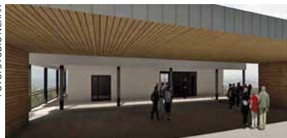
Za gradnju nadstrešnice Grad Ivanec je privukao vanjska sredstva