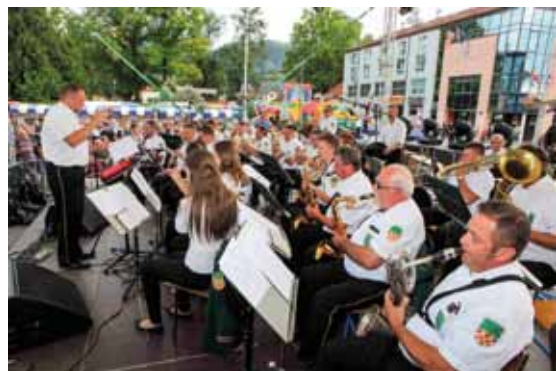
Limena glazba premijerno je izvela Planinarsku koračnicu posvećenu HPD-u Ivančica