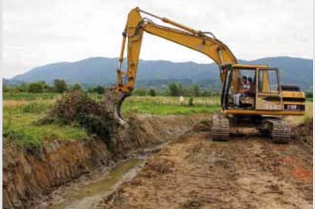
Na zahtjev Grada Ivanca: Hrvatske vode i Hidroing na problematičnom kanalu prema potoku Kamenica u MO Bedenec

U međuvremenu su, odazivajući se pozivu Grada, ŽUC i Hrvatske vode počele s radovima na više kritičnih dionica. (ljr)