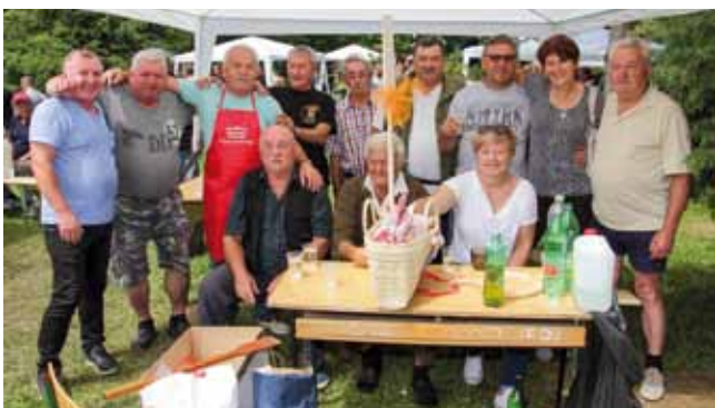
Zlatna kuhača i prva nagrada mesnice Pivac ekipe Skrajskih pajdaša i KUD-a Salinovec

Slična atmosfera vladala je kod ekipe Taležnjak brega.