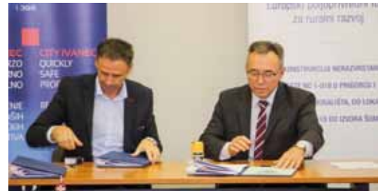
Ugovori o izvođenju radova na tri kapitalna gradska projekta vrijedni su 9,2 milijuna kuna

Sagradit će se oko 1,2 km asfaltirane prometnice (do Izletišta Jarki), dok će ostatak od 1.700 metara prema izvoru Šumi biti uređen kao kvalitetna