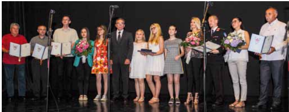
Dobitnici javnih priznanja Grada Ivanca 2018. godine

–Izmjenom zakonskih propisa, od 1. siječnja ove godine snažno su povećani proračuni gradova i općina, a proračun Grada Ivanca u odnosu na lani veći je za 10,5 milijuna kuna. Bilježio i pojačano povlačenje sredstava iz