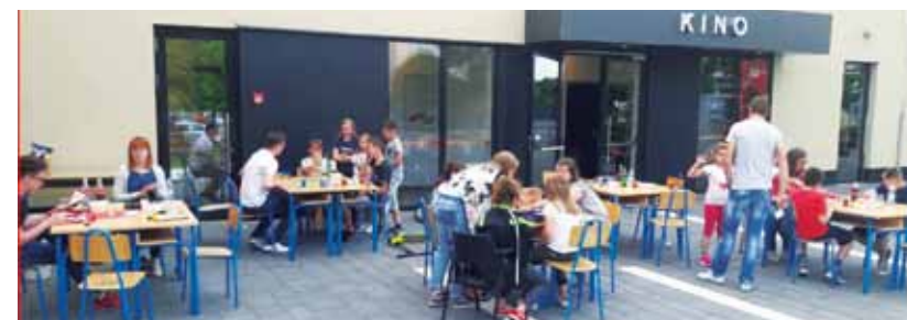
Mladi su na Kinotrgu priredili improvizirani „dnevni boravak“

MLADI Savjet mladih uključio se u proslavu Dana grada