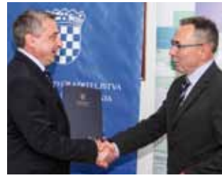
Potpore od 430.000 kuna omogućit će sanaciju klizišta u Gačicama

–Doista nas veseli što je Ministarstvo graditeljstva prepoznalo konkretne probleme i potrebe lokalne i regionalne samouprave te za njih osiguralo sredstva iz EU fondova. Posebno se to odnosi na rak ranu hrvatskoga Sjevera, a to su klizišta koja priči-