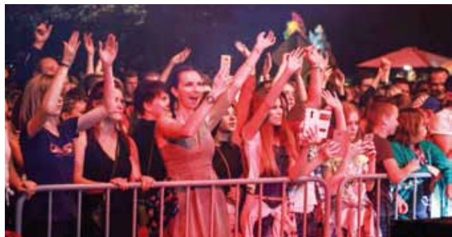
Publika je s oduševljenjem pratila nastupe svojih fanova

Šteta što su u petak, najprije neugodna kiša, a onda i velik pad temperature i prohladno vrijeme pokvarili ugodaj, što je rezultiralo manjim odazivom posjetitelja na inače sjajan koncert grupe De-tour, a onda i Grette banda. No, ni to nije spriječilo njihove fanove u uživanju u odličnoj koncertnoj atmosferi, a onda i u plesu na špi-ci do sitnih sati. No, zato je atmos-fera u subotu, 23. lipnja, bila odlična. U sjajnoj atmosferi održan je Ivančki kotlić, kao i 26. među-narodna brdska utrka, pa onda