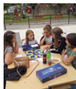
Ivanču manjka klub mladih, ali sudeći po najnovijim inicijativama, na dobrom je putu da ga dobije

U takvom entuzijastičnom raspoloženju nastavio je i poslijepodnevno druženje na Kinotrgu. Organizacijom događaja Youth Living Room, odnosno „mladenačkog“ (improviziranog) dnevnog boravka, Savjet je od posjetitelja htio prikupiti