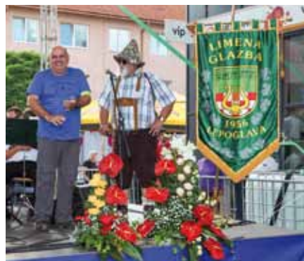
Detalj sa svečanosti otvaranja Dana hrvatskih planinara