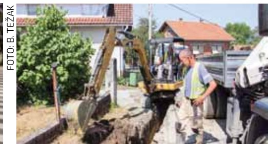
Nakon rekonstrukcije vodovoda, u ivanečke ulice, kao i na ceste u Škriljevcu, Salinovcu, Vuglovcu i Prigorcu stiže novi asfalt

Potpisan je i ugovor za modernizaciju nerazvrstanih cesta vrijedan 2,37 milijuna kuna, čime