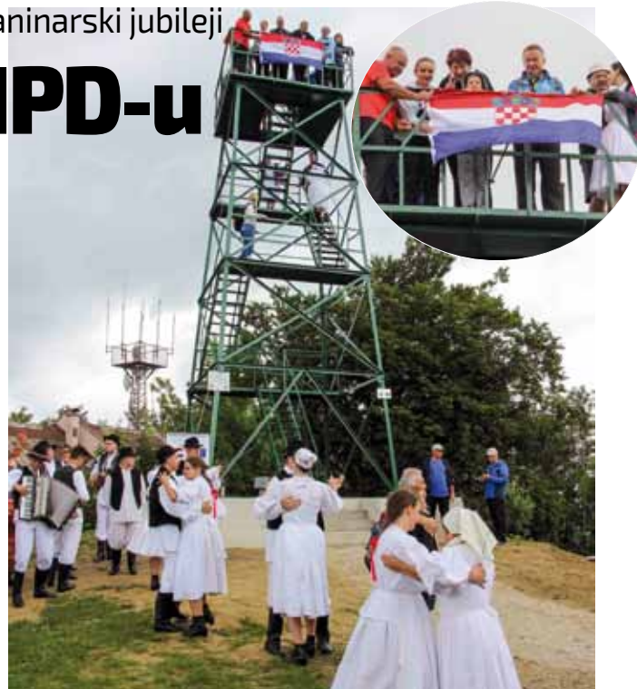
U čast otvaranja – plesni program raspoložениh folklorasa KUD-a Salinovec - i prva skupina posjetitelja na vidikovcu