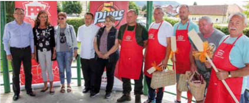
Pobjednici Ivanečkog kotlića 2018. s predstavnicima sponzora i pokrovitelja