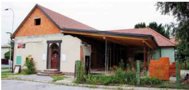
Bivši Retro više neće biti ugostiteljski objekt, već će se staviti na raspolaganje mladima grada Ivanca