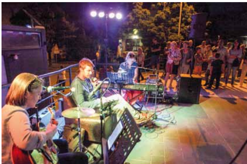
Decentna glazba i Balaševićevi hitovi – atmosfera kao stvorena za ugodan ambijent Kinotrga

♦ ♦ Na otvaranju Kinotrga svirao je glazbeni sastav Neki Novi Klinci – Balašević tribute band te decentnom glazbom naznačio buduću namjenu ovog prvorazrednog kulturnog prostora