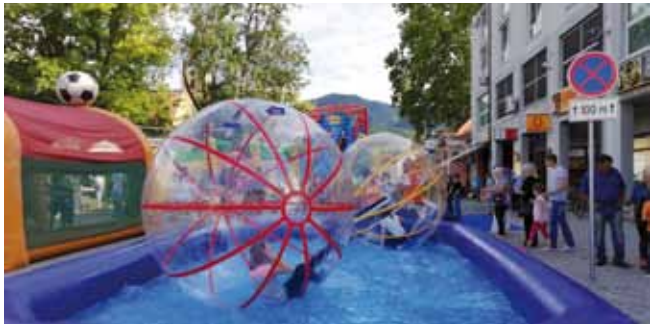
Vodeni park pred Gradskom vijećnicom

DANI GRADA 2018. Niz kulturnih, estradnih, zabavnih i popularnih manifestacija na ovogodišnjim Danima grada Ivanca