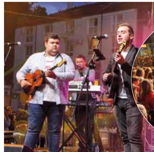
Tamburaši Elite priredili su odličan program

U sklopu proslave je Savjet mladih grada Ivanca na Kinotrgu uredio svojevrsni Youth Living Room sa sadržajima prikladnim za mlade, a ovogodišnja početna iskustva iskoristit će za na-dogradnju i obogaćivanje svog