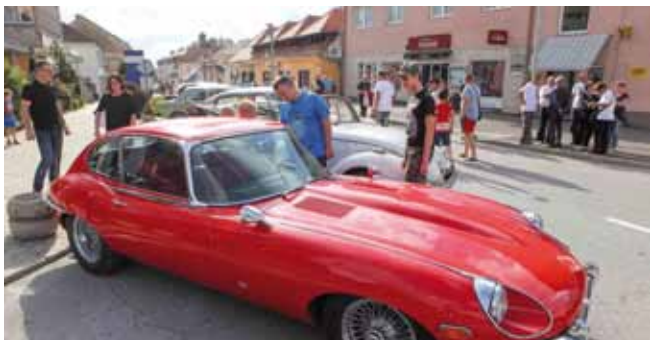
Sjećanje na stara dobra vremena na izložbi oldtimer vozila