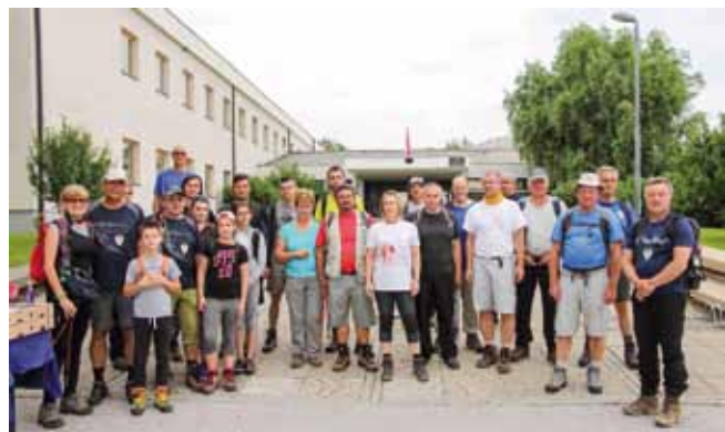
Na početku 8. pohoda Tragom vitezova rekreacija