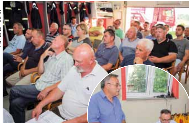
Na sastanku su građani potaknuli rješavanje niza problema na lokalnoj infrastrukturi

Takvo raspoloženje potaknuto je ponajviše velikom štetom koju su na njihovoj imovini i na javnoj infrastrukturi počinile protokle oluje, odnosno razlivenje bujične vode koje neočišćeni potoci i kanali (u ingerenciji ŽUC-a i Hrvatskih voda) nisu mogli „progutati“ pa su poplavljeni privatni objekti i dvorišta, a ispran je i sav šljunak s bankina i makadamskih putova. O tome kako je to izgledalo u „špic“ oluje, kada su podivljale bujice pojurile prema najnižim dijelovima mjesta, građani su prikazali video snimkama. Okupljeni mještani gradonačelniku su postavili mnoštvo pitanja i dali isto toliko prijedloga za poboljšanje stanja. Zahtijevali su da se kanali hitno očiste od raslinja i mulja, da se na problematičnim mjestima odstrane cijevi premalog profila i ugrade veće. Razgovaralo se o i problemu nereda na cestama nakon nevremena koji cestarske službe ne otklanjaju, o korištenju kosilica i flakerica za održavanje javnih površina, o sporazumu DVD-a Bedenec i Grada Ivanca o uređenju i korištenju vatrogasnog doma, o razbijenom ormaricu na igralištu, o nadležnosti oko održavanja zelenih površina