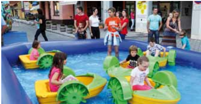
Djeca su se ove godine sjajno zabavljala