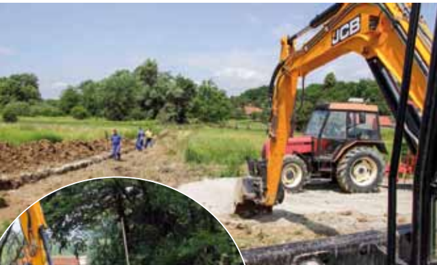
Radovi trebaju završiti u svibnju 2019. godine Položiti će se blizu pet kilometara kanalizacijske mreže

BEDENEC Drugi sastanak gradonačelnika Batinića s građanima