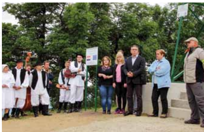
Otvaranje Piramide na Ivančici, obnovljene sredstvima iz EU fondova

Obnova Piramide stajala je ukupno 78.231,88 kuna. Projekt je s intenzitetom potpore od 100% prihvatljivih troškova, u iznosu od 75.731,88 kuna, sufinanciran iz EU poljoprivrednog fonda za ruralni razvoj, od čega je 85% bespovratnog EU novca, a 15% iznosa čine bespovratna nacionalna sredstva. Preostala sredstva potrebna za uspješnu provedbu i završetak projekta osigurao je HPD Ivančica.