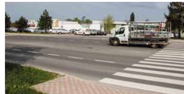
Počinje rekonstrukcija raskrižja Kovačićeve i Preradovićeve u Ivancu (novi rotor)

♦ ♦ Ugovori su potpisani za izvođenje radova na rekonstrukciji ceste u Prigorcu i gradnju parkirališta na Rapikovcu, za gradnju rotora na obilaznici te za modernizaciju 7,5 km gradskih cesta