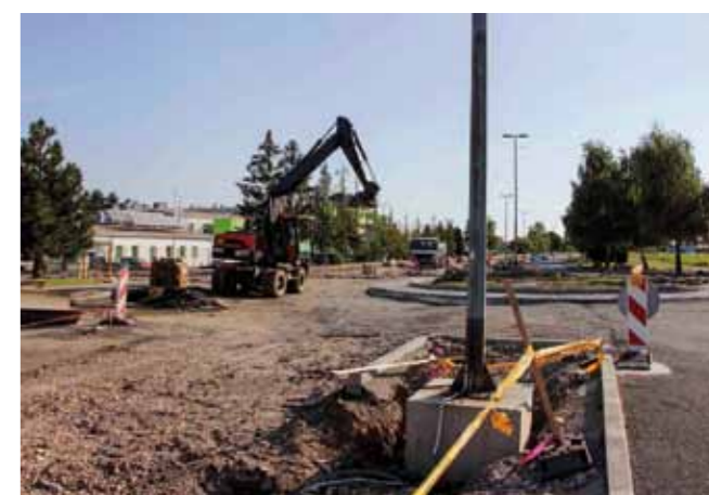
Rekonstrukcija raskrižja velik je građevinski zahvat i jedna od ovogodišnjih kapitalnih investicija koju Grad realizira u suradnji s MUP-om Hrvatske

Vrijednost ove investicije je gotovo 2,7 milijuna kuna, od čega je sa 70 posto sufinancira MUP Hrvatske, a ostalo osigurava Grad Ivanec. Grad je ova sredstva povukao temeljem uspješnog kandidiranja na MUP-ov javni poziv za dostavu projekata