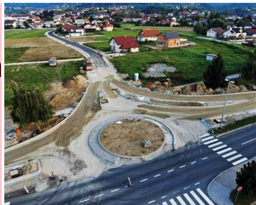
Pogled na gradilište s ptičje perspektive: Rotor i uređene kontaktne prometnice prilag su urbanom i modernom prometnom uređenju grada

Potvrđujući dobru suradnju Ministarstva i predstavnika Grada Ivanca, Marić se vrlo pohvalno izrazio o kvalitetnoj organizaciji sastanka u Gradskoj vijećnici. – Kad bi i druge gradske i općinske uprave organizirale ovako učinkovite sastanke, bilo bi znatno lakše i brže rješavati otvorena pitanja, a država bi nam bila puno bolja – naglasio je ministar. (ljr)