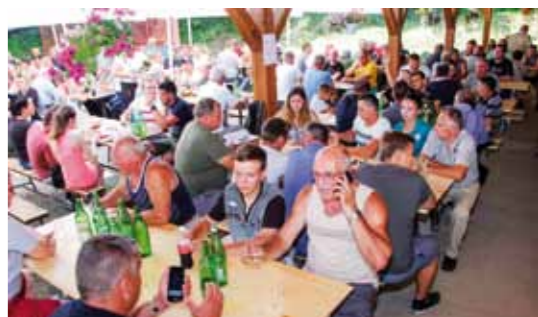
Tisuću posjetitelja uživalo je u delicijama iz kuhinje Šumskog zeca

LOVAČKI TURNIR Na tradicionalnom turniru LD-a Šumski zec