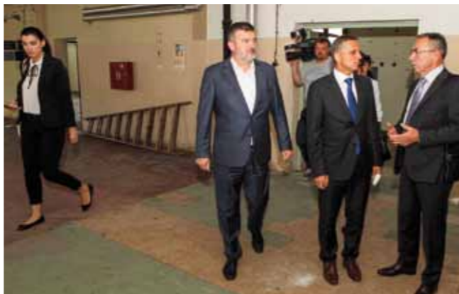
U obilasku bivšeg pogona Varteksove Konfekcije u Ivancu

–Planiramo ga adaptirati, djelomično opremiti i staviti ga na raspolaganje za proizvodno-uslužne svrhe prvenstveno mladim poduzetnicima u projektu koji razvijamo kao Poduzetnički inkubator II. Također, Grad će u