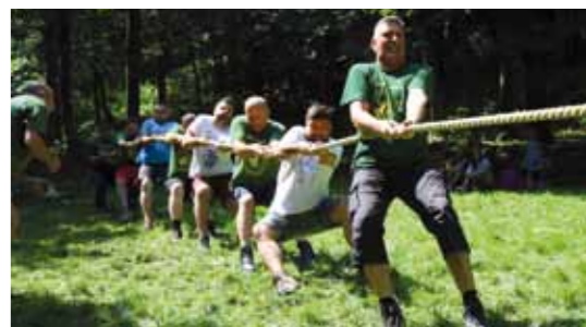
DŠR Lančić – Knapić i ove je godine uspio obraniti naslov pobjednika tradicionalnih sportsko – rekreativskih nadmetanja na vrhu Ivančice

I ovogodišnje igre održane su pod pokroviteljstvom Grada Ivanca koji ih je proglasio manifestacijom od posebnog interesa i koji ih podržava novčano i organizacijski. Održavanje igara pomogli su i Varaždinska županija, Zajednica sportskih udruga, Turistička zajednica, županijski Savez sportske rekreacije i dr.(aj,ljr)