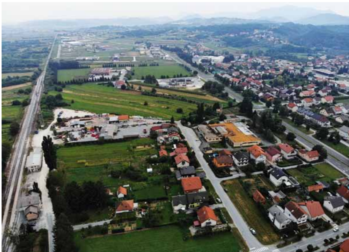
Kreće izrada izmjena i dopuna gradskih prostorno – urbanističkih planova