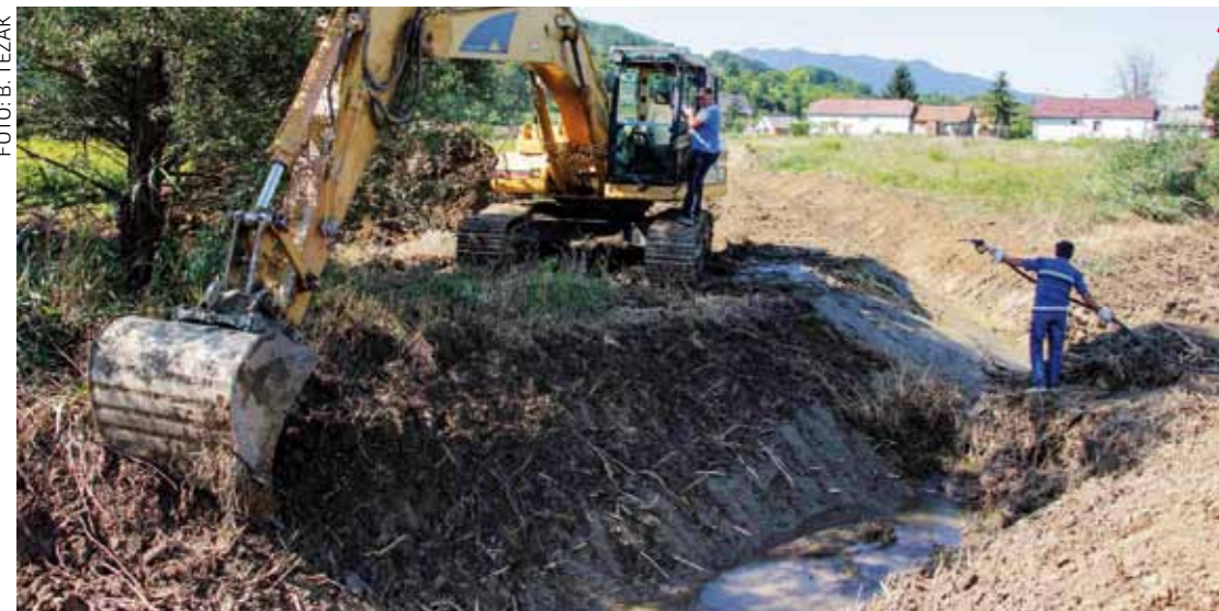
Vodotehnički radovi u Salinovu