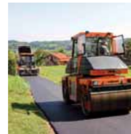
Novi asfalt do zaseoka Graheki u Salinovu