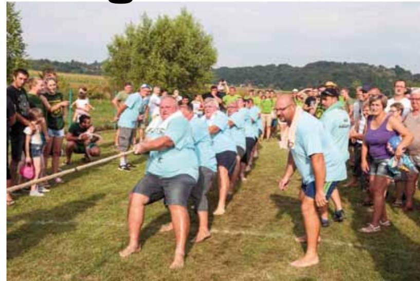
Za pobjedu u potezanju užetom potrebna je snaga, ali i tehnika