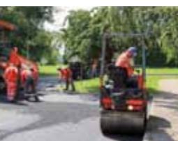
Moderniziran je i spoj Nazorove i Šabanove ulice