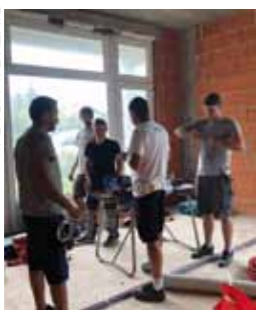
Prije početka obrtničkih radova, prostori se opremaju kompletnim instalacijskim sustavima

Temeljem provedenog postupka javne nabave koji je proveo Grad Ivanec, radove izvodi tvrtka Instalacijski sustavi Fištrek, a u ovoj fazi vrijedni su blizu 75.000 kuna. (lir)