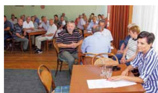
S redovite godišnje izvještajne skupštine Udruge umirovljenika Ivanec

♦♦ Rebalansom gradskog proračuna će se još ove godine nastojati povećati sredstva za umirovljeničku populaciju te obogatiti paketi kojima Grad Ivanec svake godine daruje svoje najstarije sugrađane