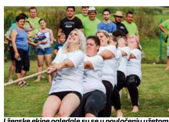
I ženske ekipe ogledale su se u povlačenju užetom