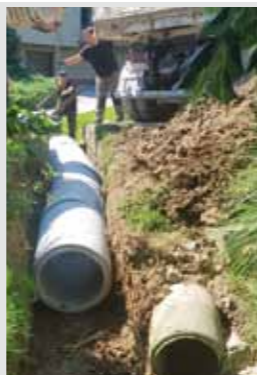
Radovi u Ul. Savica u Margečanu, koja je proljetos teško stradala u poplavama

Iz Vodnogospodarske ispostave za mali sliv Plitvica – Bednja najavljuju da će se još ove godine raditi na 1.100 metara potoka Bitoševlje i to na dionici koja većim dijelom prolazi kroz područje grada Ivanca. U planu su i 300.000 kuna vrijedni radovi na uređenju potoka Bistrice, i to od Friščićeve mlina u Prigorcu uzvodno. Međutim, kako je Bistrica uvrštena u popis područja na kojima vrijede posebni propisi vezani uz zaštitu prirode, u Hrvatskim vodama ističu da je za ovu dionicu najprije potrebno izraditi elaborat procjene utjecaja radova na okoliš, a to znači da će radovi početi tek nakon što izrađeni elaborat dobije „zeleno svjetlo“ mjerodavnih tijela. (lir)