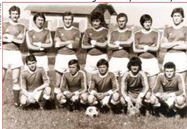
Legendarna ivanečka nogometna momčad

pobjedom protiv Zagorke iz Beđekovčine s 1:0 u gostima i 6:1 na domaćem terenu, a potom je postignut i uspjeh u kvalifikacijama za Zagrebačku nogometnu zonu protiv momčadi Daruvara. Ivančica je na gostovanju poražena s 0:1, a u uzvratnoj utakmici, odigranoj u Ivancu pred rekordnih 2000 gledatelja, zabilježila je