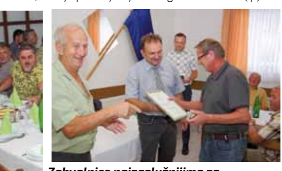
Zahvalnice najzaslužnijima za dugogodišnji rad u Fauni

mladih ljudi koji bi se željeli posvetiti uzgajivačkom radu, uvjeren sam da se i tomu može doskočiti i sadašnje negativne trendove preokrenuti boljim marketingom i popularizacijom vašeg rada – istaknuo je gradonačelnik.