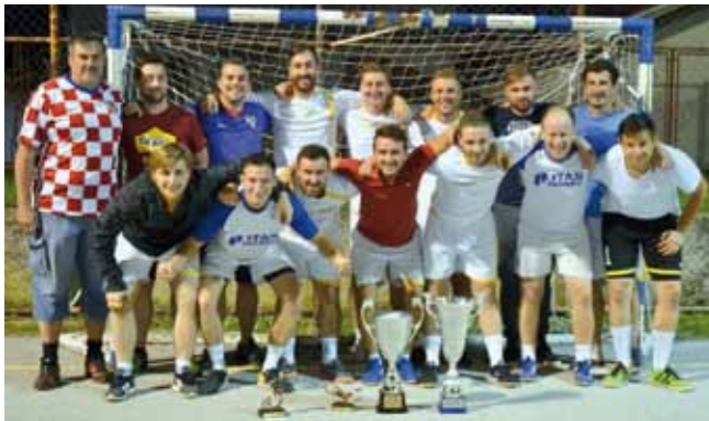
Turnir je osvojila momčad Itasa