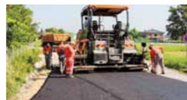
Asfalt na dosadašnji makadam u Preradovićevoj ulici