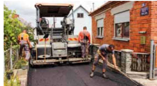
Asfaltiranje Ulice kralja Tomislava u Ivanu