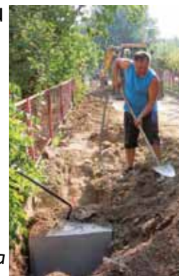
Pripremni radovi u odvoju Nazorove ulice u Ivanu

Programom modernizacije ceste za 2018. ujedno je krenuo i srednjoročni program 2018.–2022. kojim je predviđeno da se u 4 godine asfaltira 32 km ulica i nerazvrstanih cesta na cijelom gradskom području, što će stajati više od 20 milijuna kuna. (lir)