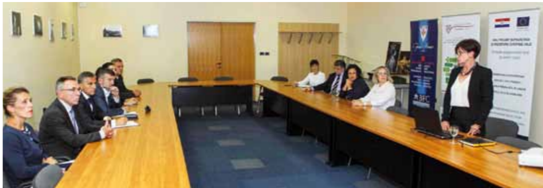
Ministar Marić pohvalio je kvalitetu sastanka u Gradskoj vijećnici

Smatrajući nedopustivim da pogon i dalje propada zbog neadekvatnog gospodarenja, Grad je zatražio od resornog ministarstva da mu ga daruje u kompletnom obuhvatu.