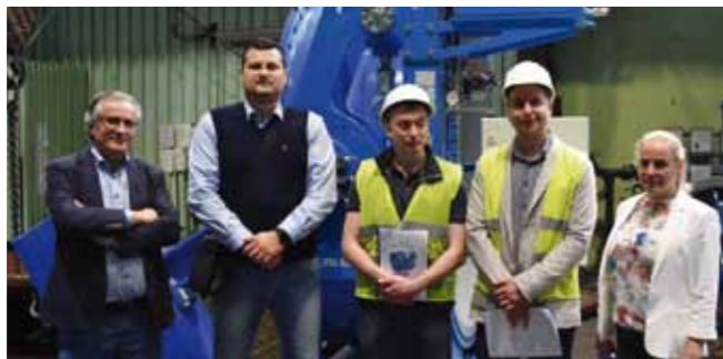
Hydromatov ventil ugrađuje se u naftno postrojenje u Basri

O veličini projekta svjedoči podatak da na izgradnju novog postrojenja trenutno radi čak 11.000 ljudi iz 50 zemalja (!), a ponajviše iz turskih, južnokorejskih, engleskih, ruskih, kineskih