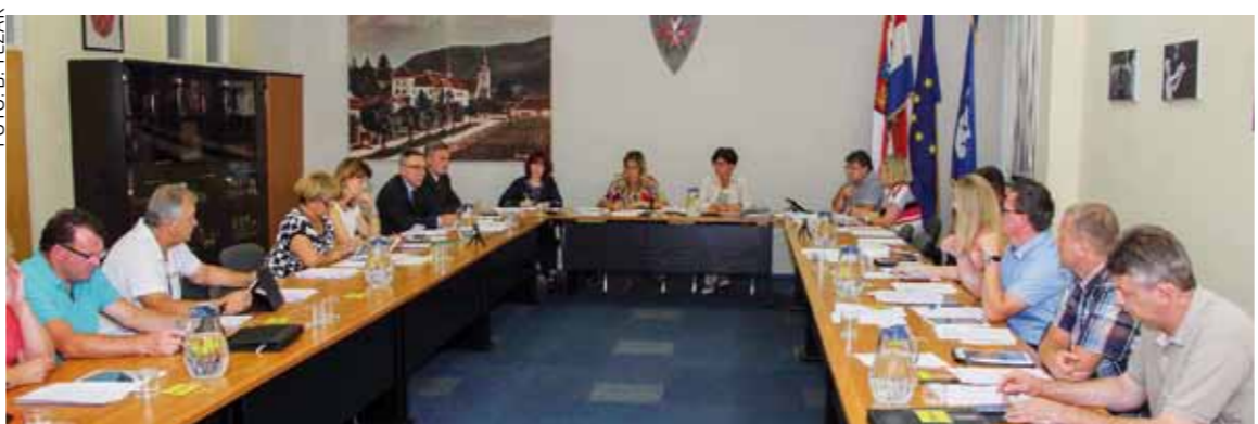
S 15. sjednice Gradskog vijeća Ivanec