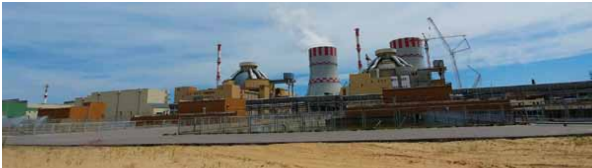
Poslovodstvo Hydromata isporučilo je opremu i za rusku nuklearku u Novovoronežu

VISOKA TEHNOLOGIJA Novi uspjeh obiteljske tvrtke iz Horvatskog