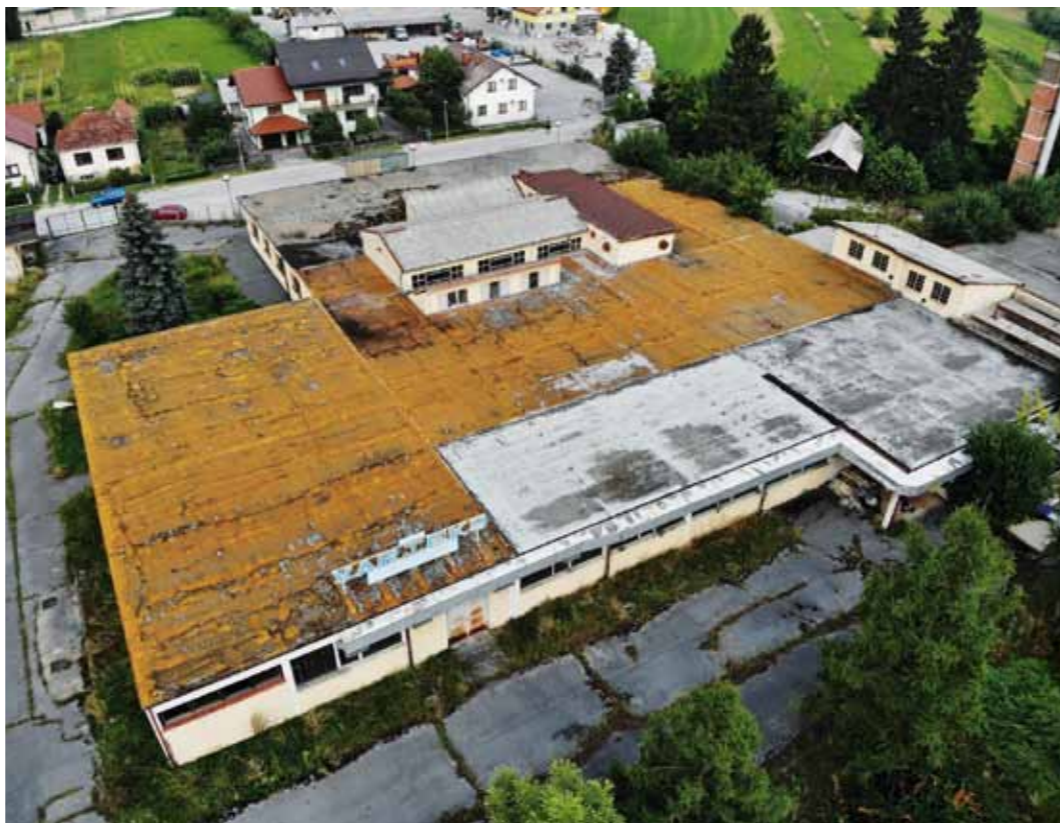
Ugovor o darovanju cijelog kompleksa Varteksa Gradu Ivancu će, prema najavi ministra, biti potpisan za mjesec do dva