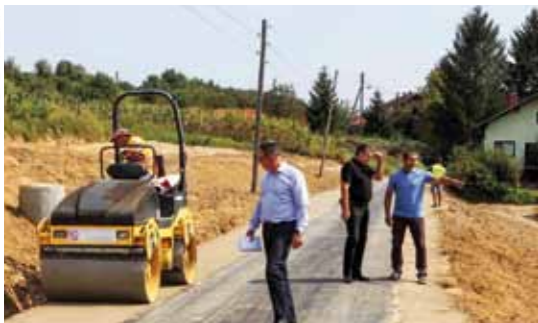
Razlog za zadovoljstvo – kvalitetno obavljani radovi iz potpornih sredstava Ministarstva graditeljstva

KLIZIŠTE Sanirano veliko klizište u zaseoku Kuštri u MO Gačice