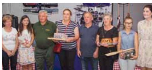
Održano je tradicionalno natjecanje u pečenju domaćih zljevki

Posebno zanimljivo bilo je na Sajmu starih zanata koji je