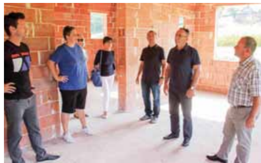
Domaćini već naveliko planiraju uređenje unutrašnjosti objekta

Radovi su počeli potkraj srpnja, a objekt je u međuvremenu izgrađen i stavljen pod krov, na ve-