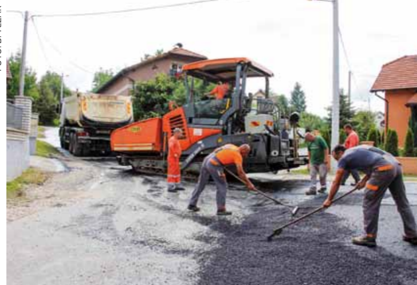
Radovi u Ulici Stjepana Vukovića