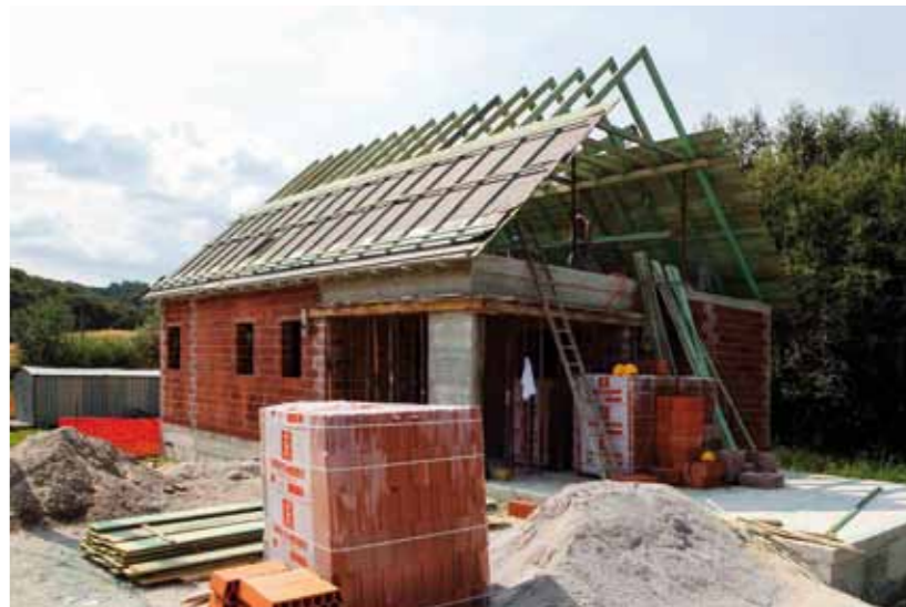
Škriljevec već ove godine dobiva novi društveni dom u rohbau formi, nastavak radova slijedi iduće godine

nje objekta te postavljanje krova i fasadne stolarije. Predstavnicima gradske uprave s gradonačelnikom M. Batinićem u par su navrata obišli gradilište, pri čemu