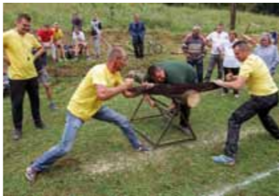
Za pobjedu u piljenju drva najvažnija je – tehnika