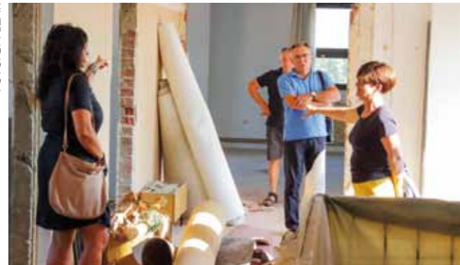
Cijeli drugi kat zgrade pretvoren je u veliko radilište

ZA MLADE PODUZETNIKE Opsežni radovi u poslovnoj zgradi u Nazorovoj 6