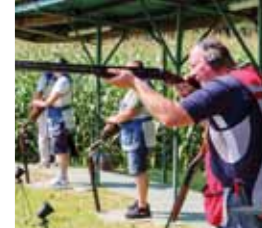
Sigurna ruka i oko sokolovo presudno za pobjedu u gađanju letećih meta

Čak 288 strijelaca iz 48 ekipa sudjelovalo je na tradicionalnom turniru u gađanju letećih meta koji organizira LD Šumski zec iz Margečana. Turnir s 30-godišnjom tradicijom posljednjih se godina profilirao kao jedan od najvećih u Hrvatskoj, a domaćini su ugostili ekipe iz Varaždinske, Međimurske, Krapinske i Zagrebačke županije. Najboljim strijelcima i ekipama pehare je dodijelio predsjednik LD-a Darko Čaklec. Turnir je pratila i sjajna gastro ponuda. Uz srneći gulaš i razna pečenja nudile su se i palačinke koje su pekli članice KUD-a