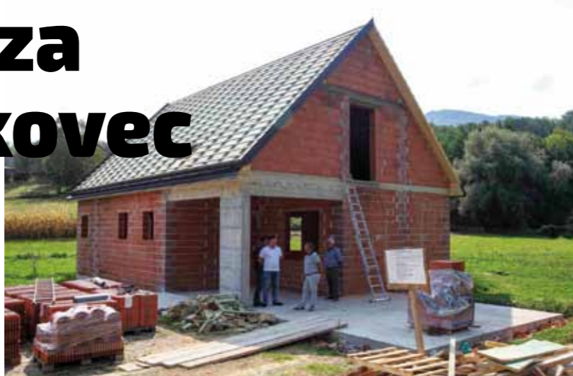
Za potrebe dvaju mjesnih odbora sagrađen je dom površine 145 m 2

predsjednice MO-a Marine Putar, koji su gotovo svaki dan boravili na gradilištu i s pažnjom pratili tijek ra-