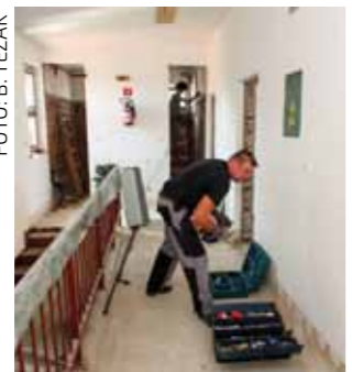
Dosad zapušteni prostori adaptiraju se u prvorazredni poslovni prostor u centru grada

Sredinom kolovoza počeli su i radovi u unutrašnjosti objekta pri čemu se stari prostori radikalnijim zahvatima preuređuju u moderne i funkcionalne urede i poslovne prostore. Dio će koristiti zaposlenici Projektnog ureda za EU fondove, dok će ostale Grad Ivanec – u sklopu projekta Poduzetnički inkubator I – staviti na raspolaganje mladim tvrtkama i poduzetnicima-početnicima te