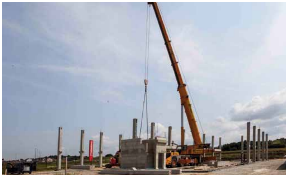
Ukupna površina objekta bit će 2.600 m 2 , a pogon će bit stavljen u funkciju još ove godine

– Proizvodimo tekstilne dijelove pogrebne opreme, točnije setove (jastuke, madrace, pokrove i sl.) za opremanje ljesova koje izvozimo u Italiju, Njemačku, Francusku i druge zemlje EU, a njima opskrbljujemo i cijelo hr-