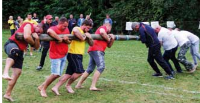
Ovakvo se „bikuju“ stažnjevečki momci i muševi