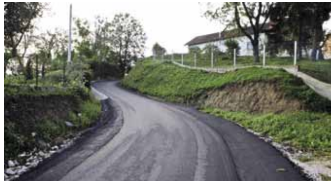
U Margečanu preostaje uređenje bankina na dvije dionice

U zadnjem rujanskom tjednu počelo je asfaltiranje