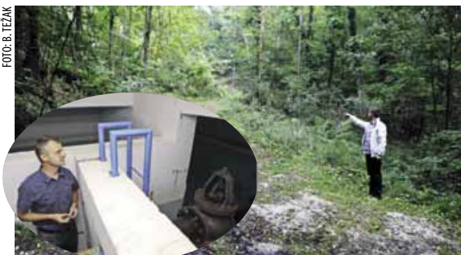
Na ovom će se mjestu graditi vodospremnik vrijedan gotovo 3 milijuna kuna

Slobodno se može reći da je iz više razloga riječ o strateškom vodoopskrbnom projektu za Ivanec i širu okolicu. Potvrđuje to i zamjenik tehničkog direktora Ivkoma Dalibor Patekar: - Dva najveća vodospremnika za područje grada Ivanca, Pilana i Pahinsko, ukupnog su kapaciteta 1000 prostornih metara, oba po 500 „kubika“. Svi vodovodni sustavi u Ivancu sada su međusobno povezani, pa dode li do kvara na jednome od njih, u sva trenutku može ga se snabdjeti vodom iz drugog sustava. Ako bi iz nekog razloga došlo do više kvarova odjednom, količina od 800 „kubika“ vode iz Pilane II bila bi dovoljna za nepresta-