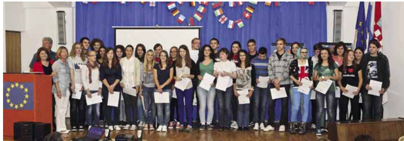
Njemačke jezične diplome dobila su 33 maturanta ivanečke Gimnazije