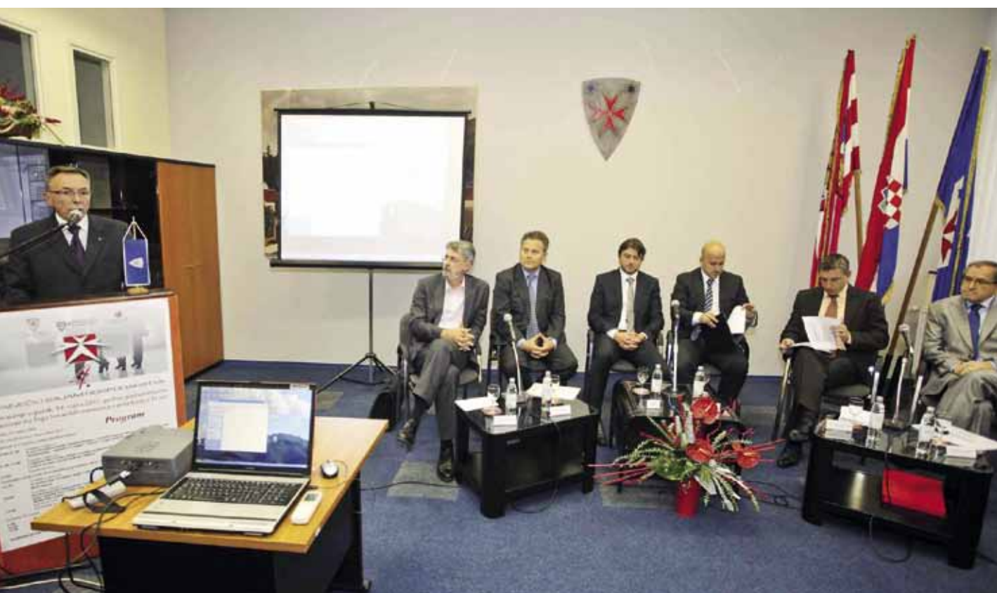
Sudionici Gospodarskog foruma