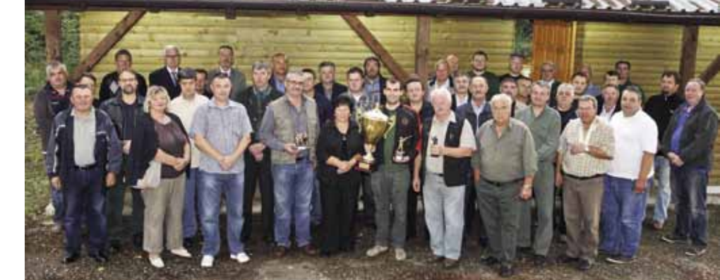
Okupljanje u Lovačkom domu u Tiglinu

Poznato je da se otada njegovi suborci svake godine okupljaju i odaju počast poginulom kolegi, a oslobođanje