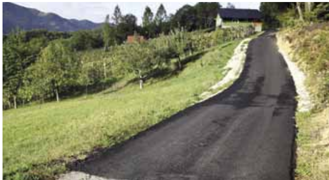
Nova cesta u Ivanečkoj Željeznici

kako bi se postigla tražena nosivost podloge.