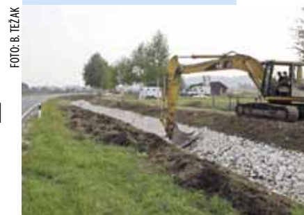
Obale potoka učvršćene su kamenom