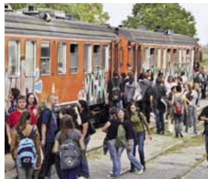
Zahvaljujući Vladi, Varaždinskoj županiji i Gradu, srednjoškolci ove godine prijevoz plaćaju samo 10, odnosno, 30 kuna

Odgovor na to pitanje je potvrđan, pa stoga i ne čudi da je više od stotinu roditelja učenika Srednje škole Ivanec, koji do škole putuju manje od pet kilometara, u utorak, 25. rujna, pozdravilo odluku Grada Ivanca da na sebe preuzme gotovo cijeli teret financiranja prijevoza za te skupine srednjoškolaca. Evo i zašto: mjesečna autobusna karta za takve, kraće relacije, stoji 400 kuna. Želeći im smanjiti trošak, Grad im je i proteklih godina pomagao i to tako da su roditelji prijevoz plaćali fiksnih 100 kuna na mjesec, dok se ostatak troškova prijevozniku plaćao iz gradskog proračuna.