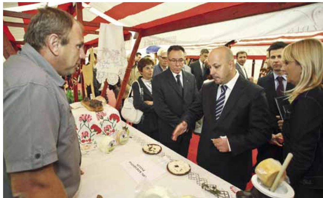
Gosti i domaćini u obilasku sajma