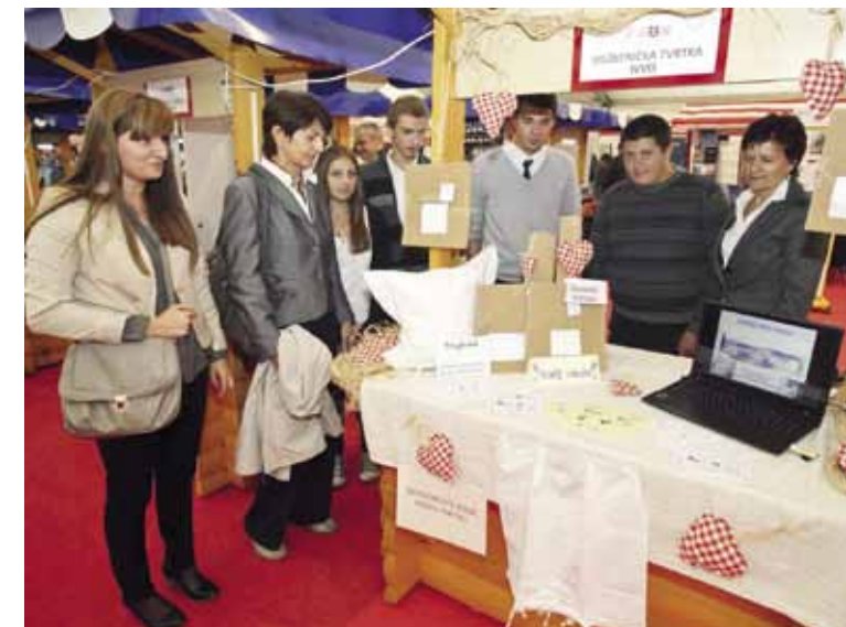
Na štandu Vježbeničke tvrtke Srednje škole Ivanec

Izvoz Varaždinske županije za više od 200 milijuna dolara veći je od poslovično jake Rijeke. U nas nema gospodarske grane koja ne izvozi, a sam Ivanec izvozi više od mnogih hrvatskih županija. Njegov izvoz vrijedan je 54 milijuna dolara. Na žalost, unatoč svim tim rezultatima i ogromnom rastu izvoza, od toga nemamo puno koristi, jer plaće u našoj županiji i dalje su na hrvatskom dnu – naglasio je predsjednik Županijske gospodar-