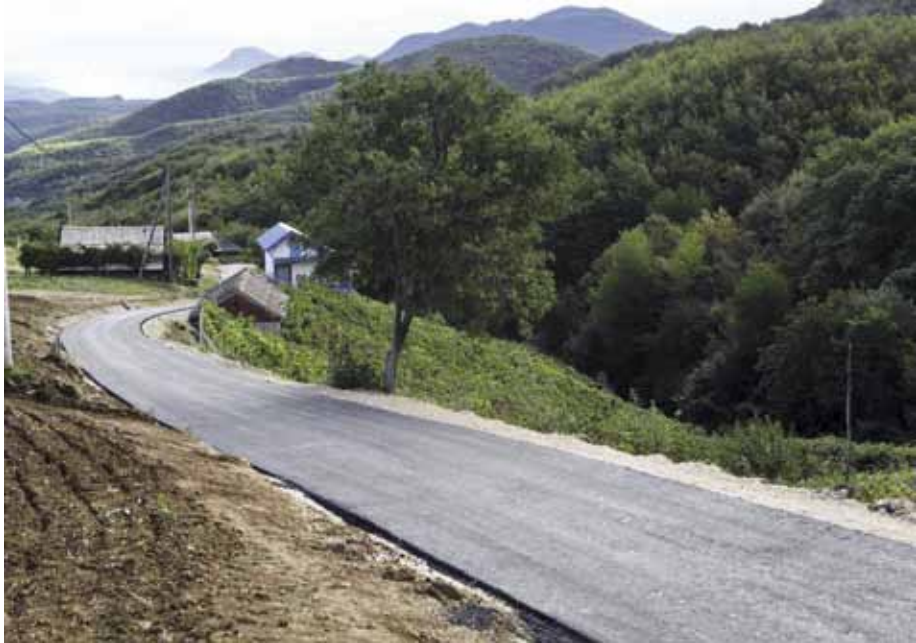
U Prigorcu je asfaltiran veći broj kraćih dionica

230 metara) naišlo se na teren slabije nosivosti i podzemnih voda, što je odužilo pripremu podloge, pa je bilo potrebno obaviti radove na zamjeni materijala i dodatnom nasipavanju kamenim materijalom,