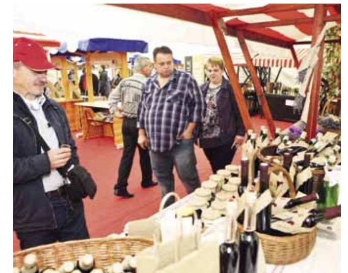
Bogatstvo svojih proizvoda ove je godine prikazalo više od 20 OPG-a