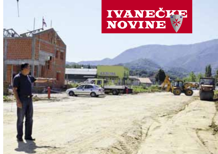
Batinić: I bez HDZ-ovih potpora, Grad Ivanec imao je više investicija od mnogih drugih sredina!

- Nadalje, ne stoji prigovor da je u Gradu previše zaposlenih. Primjerice, prošlih dana predstavnici Grada Novog Vinodolskog, s 5500 stanovnika, kazali su da u gradskoj upravi imaju 42 zaposlenih. Bili su