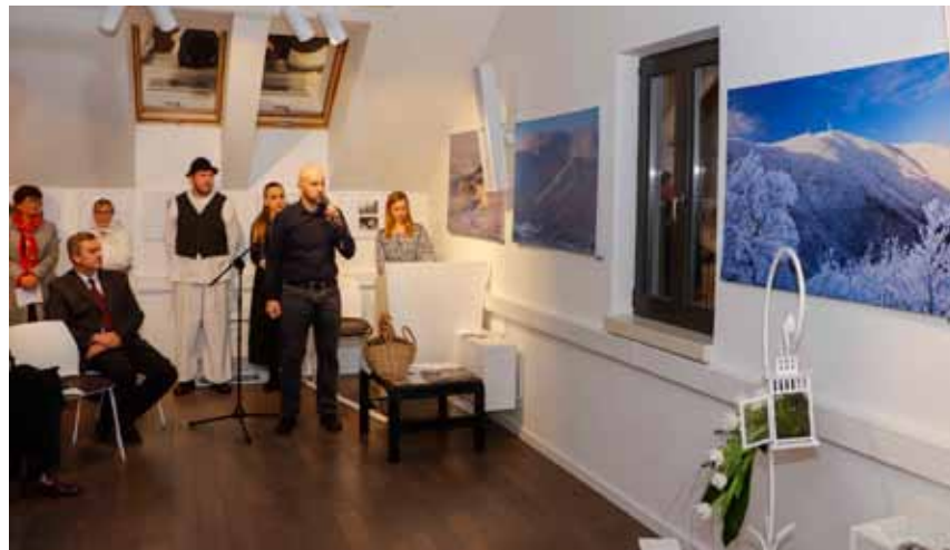
Zoran Stanko autor je izložbe fotografija Snježna prostranstva