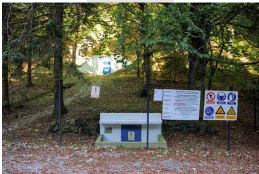
Bude li zatrebalo, Ivanec će svoja izvore na Ivančici braniti referendumom

Ivkom vode su uredna i ekonomski održiva tvrtka