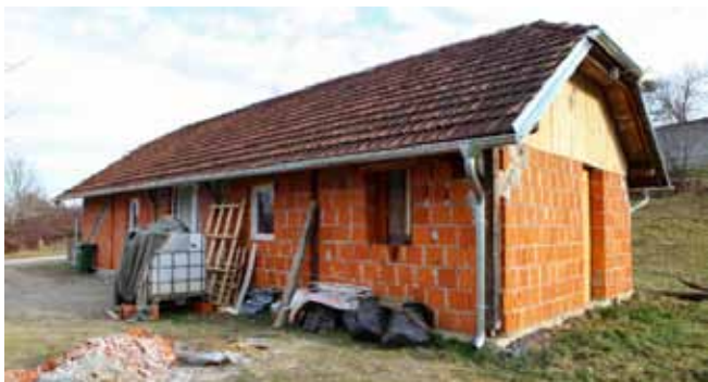
Objekt, koji je godinama stajao otvoren i nedovršen, u prvj je fazi građevinski zatvoren

U proračunu za 2019. osigurano je dodatnih 150.000 kuna na nastavak radova u drugoj fazi