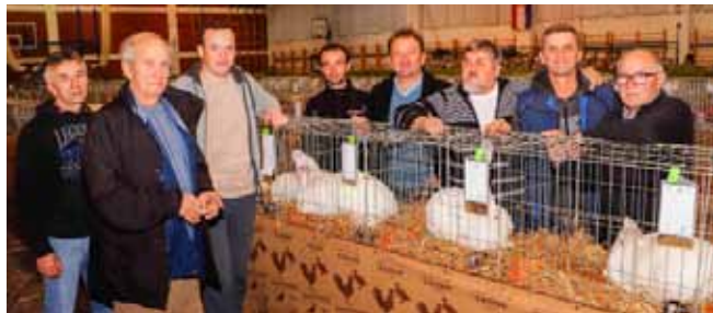
Ako se dan po jutru pozna, onda bogata izložba kojom su započeli 2019. članovima Faune donosi optimizam

– Na ovoj izložbi predstavio sam svoje najljepše primjerke papigica, zebica, papagaj zebica te grlica i prepelica. Uzgoj ptica nešto je što pravim uzgajivači-