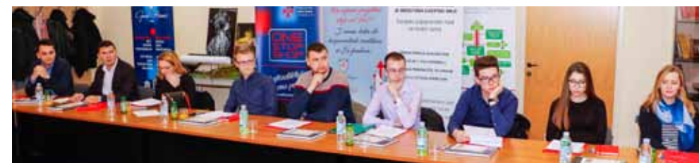
Članovi ivanečkog Savjeta mladih aktivno su sudjelovali u radu skupa

Poslužilo je i vrijeme; druženje je potrajalo do ponoći, a ovogodišnja Noć muzeja, s jedinstvenim ugođajem, zasigurno će brojnim posjetiteljima ostati u dugom sjećanju. (ljr)