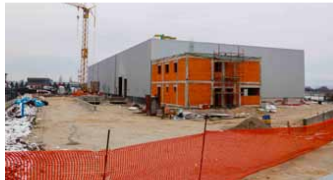
Ivnčića d.d. Ivanec gradnju logističko – distributivnog centra planira završiti tijekom proljeća

gradnje novih proizvodnih pogona najavilo je još nekoliko poduzetnika, međutim, u ovoj fazi oni još ne žele s detaljima izlaziti u javnost. Također, Gradu se javilo već nekoliko poduzetnika i potencijalnih investitora koji pokazuju velik interes za ulazak u prostor bivšeg Var-