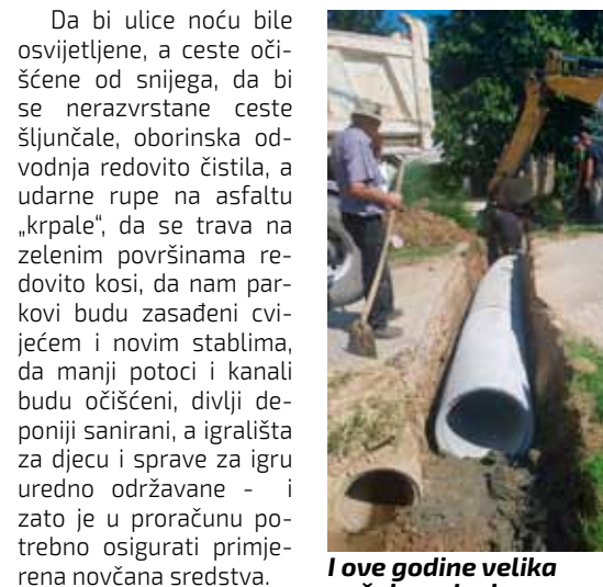
I ove godine velika pažnja radovima na uređenju oborinske odvodnje radi sprečavanja poplavlivanja

Velika većina od ukupno potrebnih 3,7 milijuna kuna za održavanje osigurat će se iz sredstava komunalne naknade