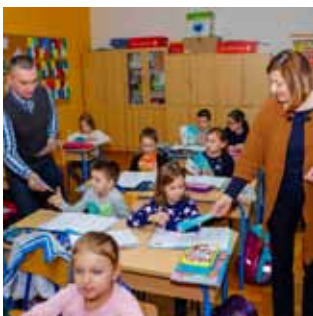
Poučni leci podijeljeni su učenicima i u Osnovnoj školi Ivanec

PODUZETNIŠTVO Industrijska zona i Poslovna zona Ivanec – istok