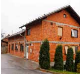
Društveni dom u Knapiću: Ove godine novo ruho „od glave do pete“

Zahvaljujući europskim i gradskim sredstvima, društveni dom u Knapiću (izgrađen 1985. godine), bit će potpuno energetski obnovljen (termo fasada, unutarnja toplinska izolacija, izolacija krova, ugradnja energetske učinkovite stolarije, novo grijanje s termostatskim ventilima, solarni kolektori itd.).