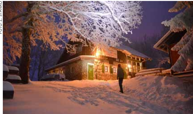
Udio Ivanca u dolascima i noćenjima u Varaždinskoj županiji iznosi 5,52%, što je rezultat koji raduje, ali i upućuje na potrebu razvika prepoznatljivih turističkih proizvoda

eVISITOR Ivanec u 2018. ostvario najveći porast noćenja na području Varaždinske županije