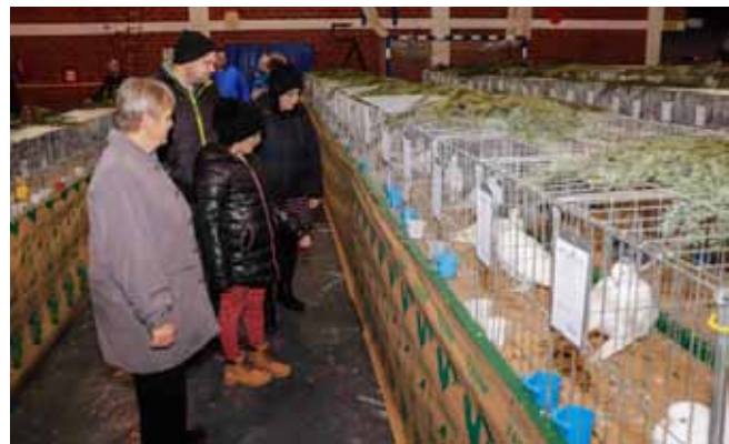
U dva izložbena dana brojni su posjetitelji razgledali svijet malih životinja