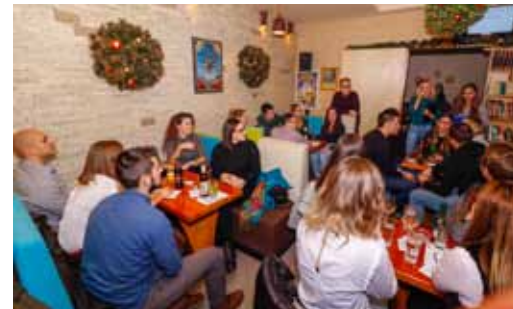
Ivanečka mladež sama je počela kreirati sadržaje svoje društvene scene

Velik odaziv pub quizu pokazao je da se u Ivancu profilirala skupina mladih koja pokazuje interes da sama organizira zanimljive i kreativne sadržaje i urbane evente za mladež te da njima ujedno obogati i društveni život cijelog grada.