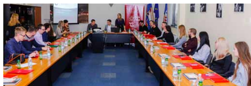
Ivanec je bio domaćin 2. sjednice Mreže savjeta mladih Varaždinske županije

Usvojili su i strategiju kojoj je glavni cilj uključivanje mladih u procese donošenja odluka kroz poticanje osnivanja savjeta mladih na lokalnoj razini. To se planira postići edukacijama članova savjeta i predstavnika JLS-ova zaduženih za njihov rad kao i predstavljanjem savjeta mladih u školama i medijima te prezentiranjem primjera dobrih praksi.