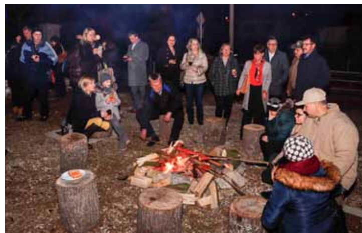
Uz planinarsku vatru ispred muzeja pekao se jeger, a na šandovima su se nudile ring torte i kruh s kosanom masti