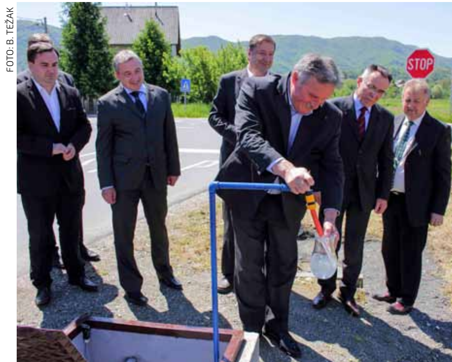
Prije dvije godine stanovnicima dijela ivanečkih i lepoglavskih naselja omogućena je opskrba ivanečkom vodom; Varkom im je lani – bez obrazloženja! – zatvorio ventil