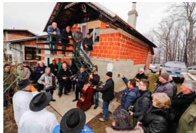
Vesela proslava Vincekovog na Vrhima

– Lijepe su te stare navede. Na žalost, mladi se u njih ne uključuju. Mi, stariji, bumo ih držali dok bumo mogli, a ipak se nadamo da se bu našlo i onih koji tradiciju budu nastavili – poručio je I. Lončar. (lir)