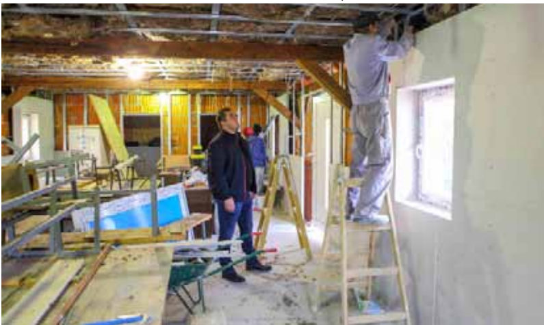
Opsežni radovi u unutrašnjosti društvenog doma (postavljanje izolacije)

Leci iste tematike, ali različitog sadržaja, bit će djeci vrtićke