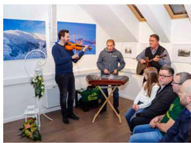
Na Ivonjšćicu s Faringašima iz Prigorca