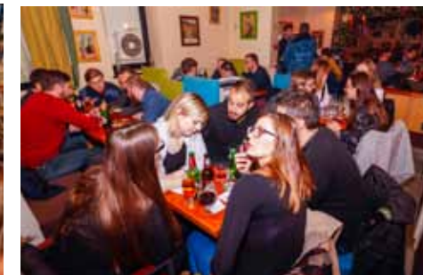
Mladi su odmjerili znanje u prirodnim i društvenim područjima