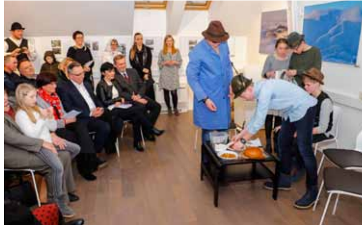
Skeč ivanečkih učenika