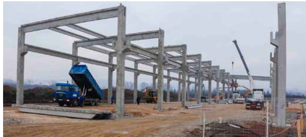
U Industrijskoj zoni u tijeku je investicija tvrtke Wenker – Križanec