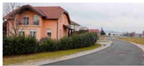
U Preradovićevoj ulici gradit će se rasvjeta

Najvažniji projekti i programi sadržani su u gradskom Programu gradnje objekata i uređaja komunalne infrastrukture koji je za 2019. godinu "težak" 11,72 milijuna kuna