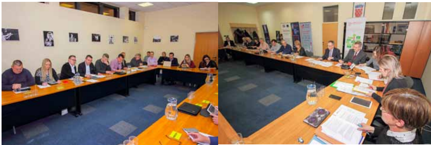
HDZ i SDP suzdržani, jedan nezavisni vijećnik (za kojeg je u međuvremenu Gradu stigla pismena potvrda da je član Narodne stranke – Reformista) - protiv

školu mogao otplaćivati, podsjetio je da Grad čeka još jedno veliko izdvajanje, a to je sufinanciranje Aglomeracije Iva-