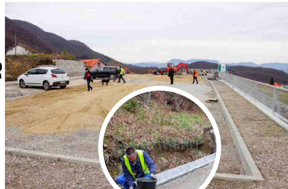
Kanalice za prihvat oborinskih voda postavljaju se duž cijele cestovne trase

Javna rasprava o projektu obnove parkova dostupna je na web stranici Grada Ivanca www.ivanec.hr – rubrika Savjetovanje sa zainteresiranom javnošću. (aj,ljr)