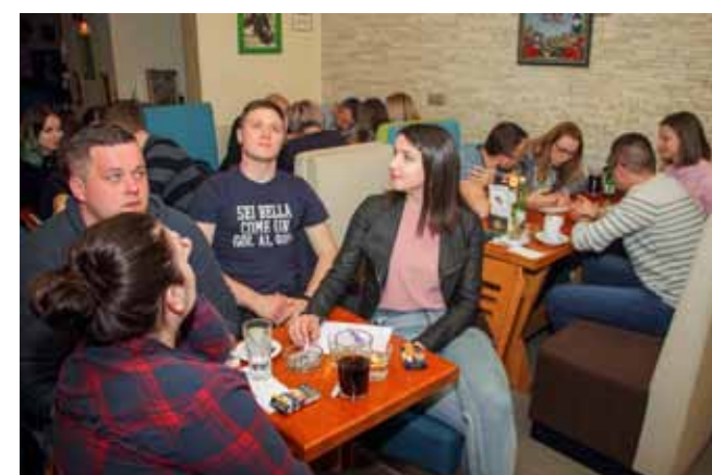
I ovoga puta tražilo se mjesto više za novi Pub Quiz Kluba mladih