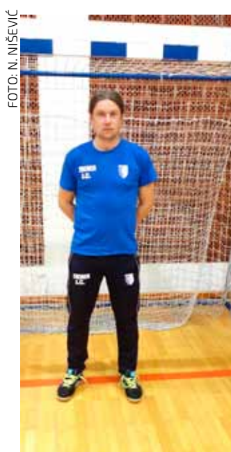
Cikač je bio dugogodišnji igrač NK Ivančice, jedan od ključnih igrača i istaknuti strijelac

Nogometaši Mladosti iz Margečana u startu proljetnog dijela prvenstva u Varaždinu su poraženi od Slobode Škole Nogometa s 0:1. Novi poraz sustigao ih je od Poleta iz Tuhovca s 1:2 u utakmici 15. kola odigranoj u Margečanu. Nakon završetka utakmice pregledana je snimka spornog detalja iz 90. minute, pri čemu je uočeno da pomoćni sudac nije podigao zastavicu, unatoč činjenici da je bilo zalede. K tomu je vratar Čiček istrčao i bio prije u dodiru s loptom od gostujućeg igrača, ali sudac je dosudio prekršaj vratara na navalnom igraču Poleta i dosudio jedanaesterac. Tijekom igre sudac je dodijelio čak 9 žutih kartona, a nakon utakmice ostao je gorak dojam da je oštećio domaćina za nepostojeći kazneni udarac iz kojeg je gostujuća momčad izborila pobjedu.(nn)