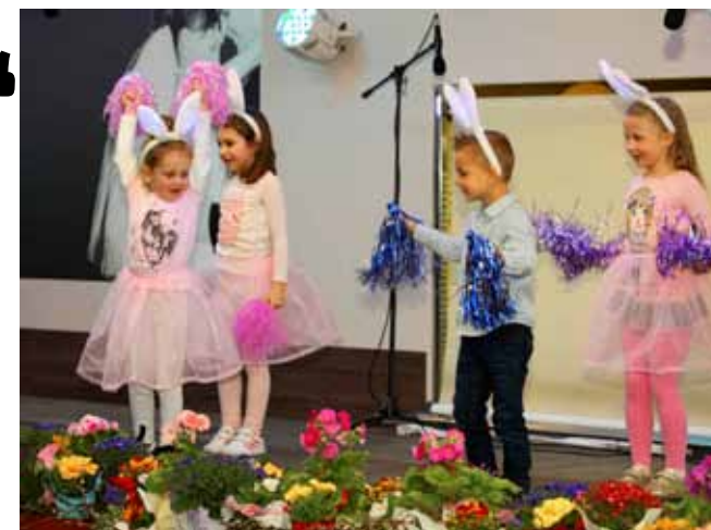
Djeca su govorila stihove, plesala, glumila...