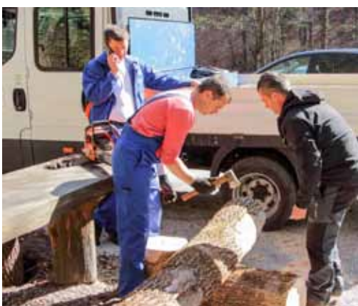
Grada je stigla, valja izraditi nove klupe