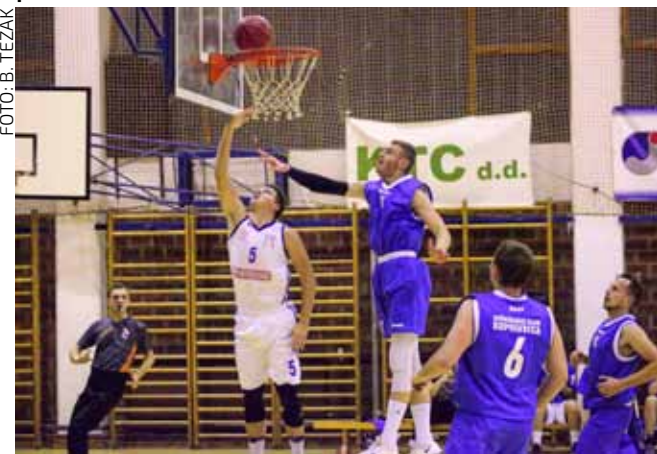
S obzirom na ozljede i druge probleme, šesto mjesto KK Ivančice u skladu je s realnim očekivanjima uprave kluba

KOŠARKAŠKI KLUB IVANČICA Završila prvenstvena sezona 2018./2019.