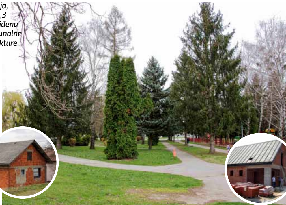
Akcijskim planom predviđena je rekonstrukcija zapuštenog poligona kod Osnovne škole

M. Batinić: Iz projekta Aglomeracije proizlazi da tamo nisu predviđeni radovi na kanalizacijskoj mreži. Objekti su spojeni direktno na kanalizaciju u Ul. Zeleni dol, ili u V. Jagića, ili preko internih priključaka. Za Ul. Jezerski put je prije 7-8 godina izrađena projektna dokumentacija kojom se planirala rekonstrukcija prometnice za dvosmjerni promet i izgradnja nogostupa s jedne strane ceste. Međutim, zbog pre-