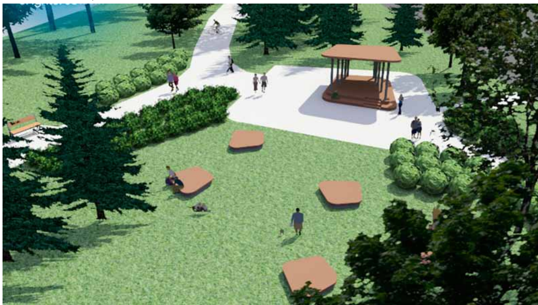
Prijedlog uređenja novog paviljona i okolnih površina

Na sadašnjoj ogoljeloj površini u malom parku uz Malezovu ulicu zasadit će se loror višnja, koja će brzo narasti u živu zelenu ogradu