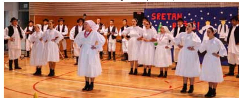
KUD Salinovec: Novi predsjednik najavljuje pojačan rad na uključivanju novih članova, posebno djece

Čestitke na uspješnoj protekloj godini, kao i čestitke novoizabranom vodstvu KUD-a, uputili su izaslanica gradonačelnika Ivanca Marina Držaić, predsjednik MQ-a Salinovec Stjepan Četrtek te predstavnici svih salinovečkih i pojedinih srodnih udruga iz susjednih mjesta.