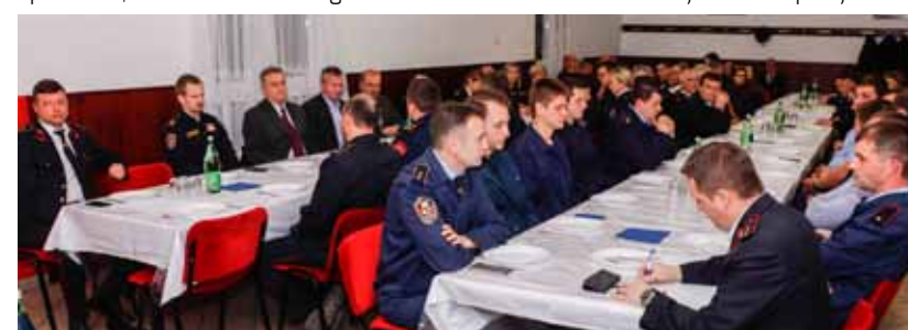
Vatrogasci očekuju da će ove godine DVD Radovan napokon dobiti novo navalno vozilo

Naglasio je također da je Grad Ivanec u 2018. B za vatrogastvo izdvajao 912.500 kuna, dok su za 2019. sredstva povećana za čak 30% i iznose 1,19 mil. kn. pa će, slijedom toga, više novaca biti i za DVD Radovan. Povrh toga, Grad je za DVD Radovan osigurao i dodatnih 260.000 kn za nabavu novog vozila. (lir)