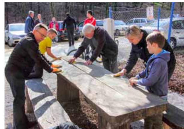
Masivne stolove prvo je trebalo očistiti brusnim papirom