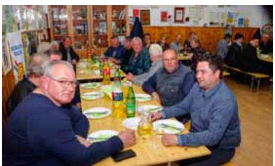
Sa skupštine Skrajskih pajdaša

Sedam zlatnih i 10 srebrnih odličja osvojila su vina članova ivanečke Udruge vinogradara i vinara Pe-harček i Poljoprivredne zadruge Ivanec na ocjenskom kušanju mladih vina berbe 2018., koje je u Zagrebu organizirao Hrvatski poljoprivredni zadružni savez.