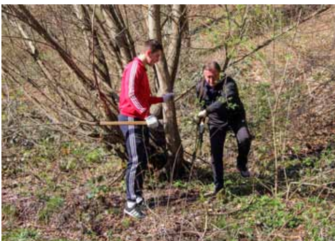
Suho raslinje i stabla uz cestu treba posjeći