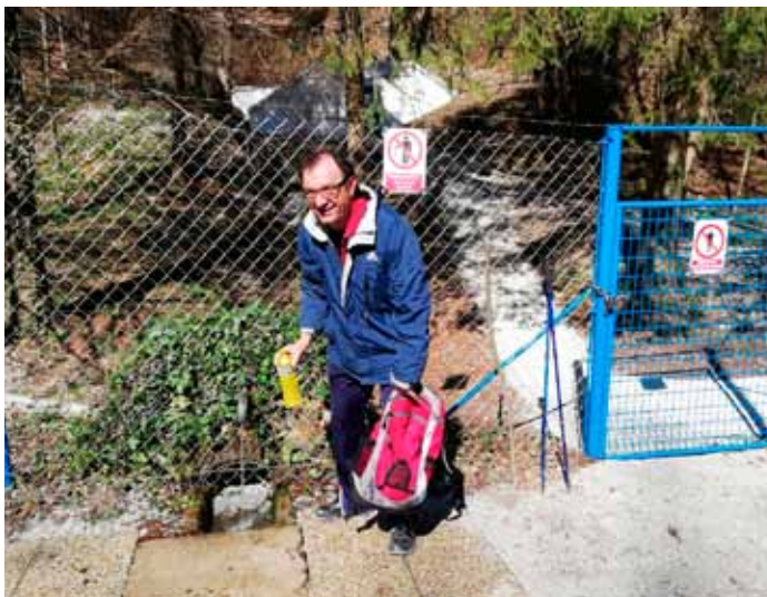
Doma se ne dolazi bez vode sa Žganog vina!