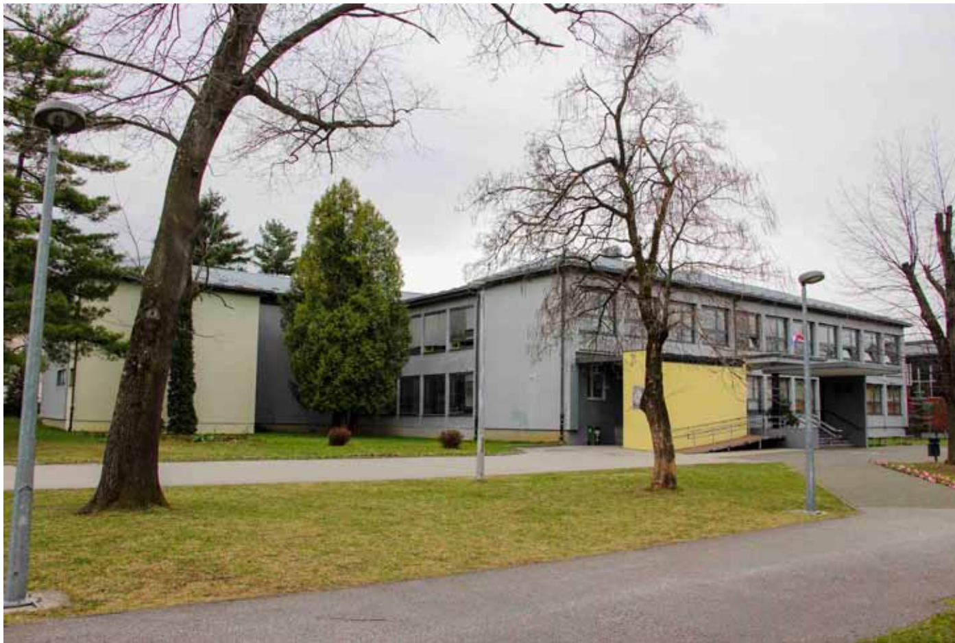
Kad će dogradnja ivanečke škole?

Iako su, ocijenio je, fiskalni kapaciteti Grada u ovom trenutku takvi da bi se navedeni kredit za