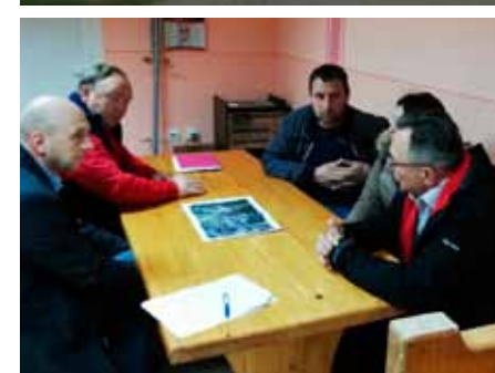
Ove godine ova će se dionica proširiti i asfaltirati, a slijedi i uređenje oborinske odvodnje