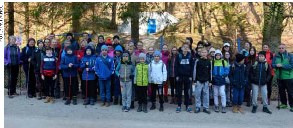
Na Žganom vinu okupili su se mladi i stariji planinari, učitelji i roditelji. Uspon je počeo preko Mrzljaka, groba neznalog junaka i Beliga grebenom do Oštrcgrada.