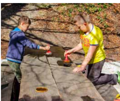
I klinci su se prihvatili posla