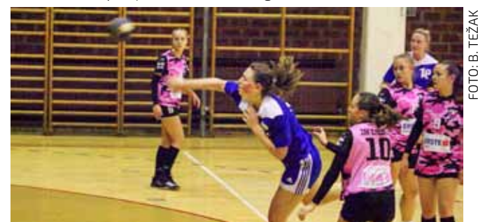
Ivanečke rukometašice u gornjem dijelu prvenstvene tablice