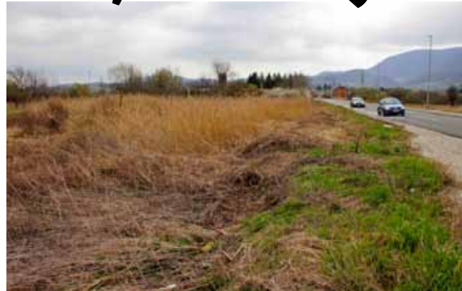
Zapuštene površine: Jedino rješenje – poljoprivredno redarstvo i poljoprivredna inspekcija