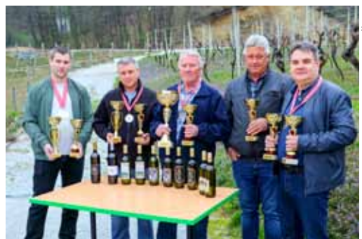
Zlatna vina ivanečkog vinogorja