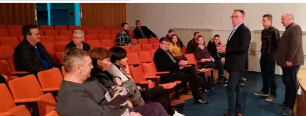
S javne prezentacije projekta obnove parkova i zelenih zona u Ivancu

Zdravstveno stanje biljaka u predjelu zelenih zona u Arnoldovoj i Kumičićevoj ulici je dobro, prvenstveno zato što su nakon sječe starih, bolesnih i neadekvatnih drvo-reda, zasadeni mladi drvoredi. Međutim, problem je sadašnje zastarijelo, pregusto i zakorovljeno grmlje. S obzirom na to da je riječ o urbanim stambenim zonama, stručnjaci preporučuju uklanjanje dijela sadašnjih grmova i sadnju novih te uređenje dviju novih boravišnih zona sa po dvije klupe. (aj)