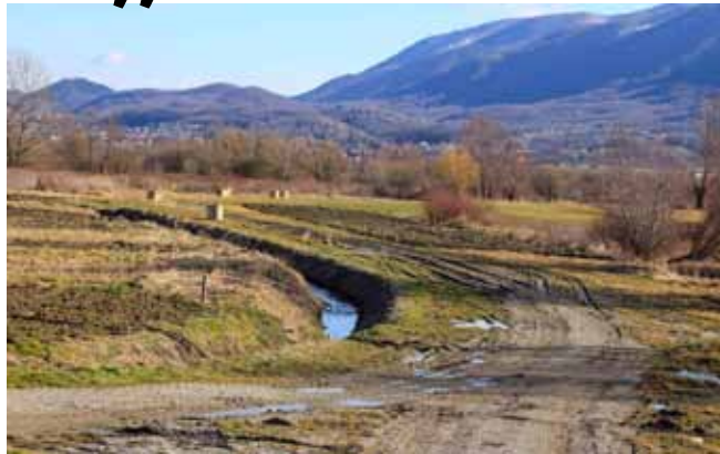
Mještani su zainteresirani da se što prije krene u uređenje zapuštenih poljskih putova

Dio projekata navedenih u Akcijskom planu Grad će financirati vlastitim sredstvima, dok će se dio njih provoditi uz učešće