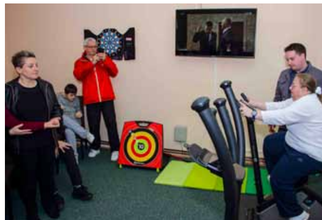
A sada možemo početi vježbati!

Kako bi vježbe rezultirale pozitivnim učinkom za zdravstveno stanje korisnika, s njima po programu prilagođenom njihovim individualnim potrebama i