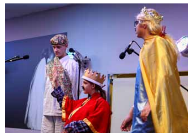
Nastup najmladih uvijek prate posebne simpatije