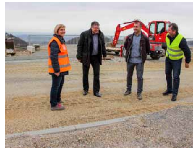
Gradi se novo, moderno parkiralište na kome će se moći parkirati 50 vozila

U srijedu, 27. ožujka, gradilište je obišao pročelnik gradskog