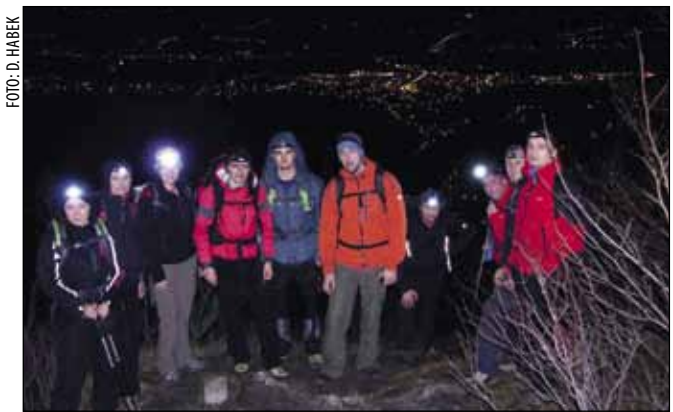
Čar noćnog uspona s pogledom na rasvijetljeni Ivanec

panorami Ivanca, Varaždina i okolnih naselja. Nakon odmora i okrepe u Planinarskom domu, većina ih se preko Konja vratila u Ivanec, a ostali su prenoćili u domu. (I. Borovečki)