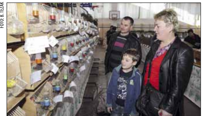
Među raspjevanim ptičicama