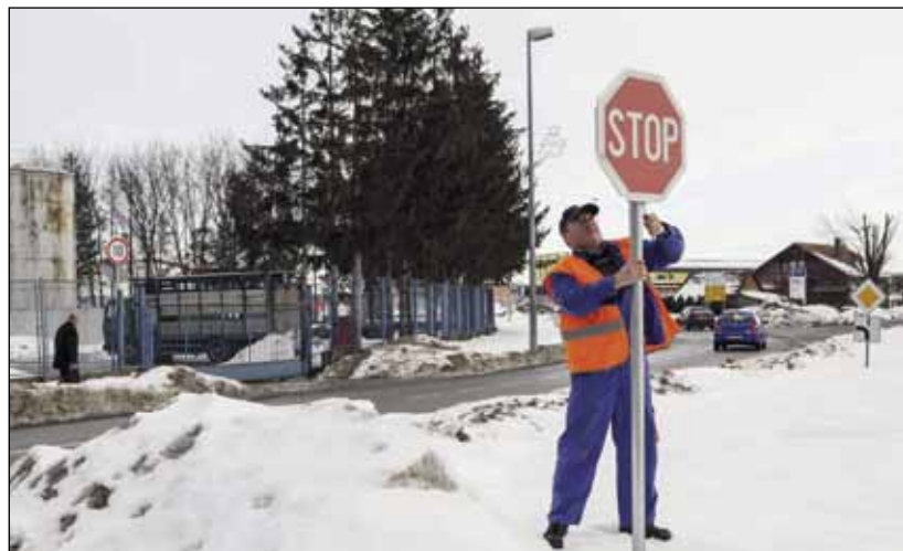
Za nove prometne znakove iz proračuna je izdvojeno 25.000 kuna

Vrijednost toga posla je 25.000 kuna, a novčana sredstva osigurana su u gradskom programu održavanja komunalne infrastrukture. Također, postavljene su table s nazivima novih ulica u Ivanču - Josipa Kraša i Ulice Kozjak. (lir)