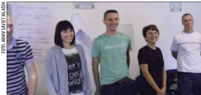
Ivanečki predstavnici na EU-osposobljavanju

Broj gradskih stipendista dodjelom novih stipendija povećan je na ukupno 44, što je vrlo respektabilan broj. Za stipendije će se u proračunu izdvojiti 220.000 kuna. (ljr)