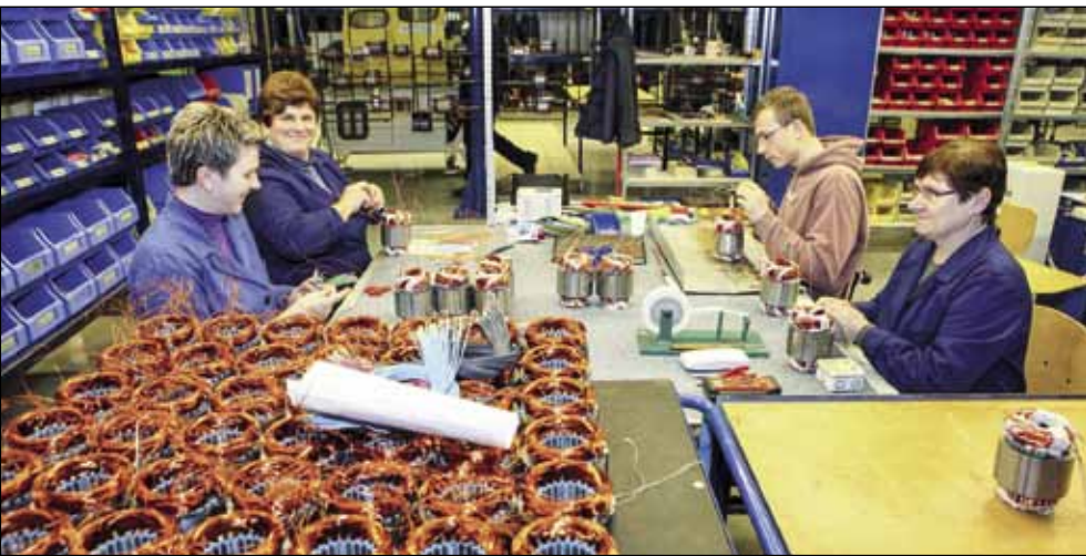
Suvremeni radni uvjeti u novoj hali preporod su za radnike