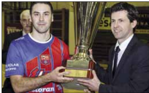
Veliki pehar slavodobitnicima iz Črešnjeva