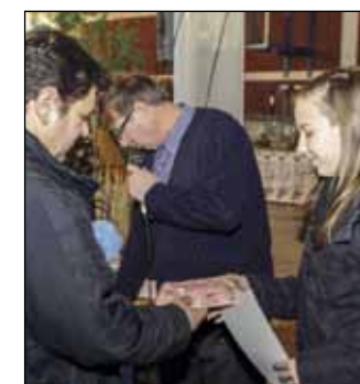
Organizatori su prigodno nagradili učenike – autore najljepših likovnih radova