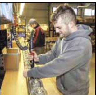
Proizvodnju većim dijelom nose mladi radnici