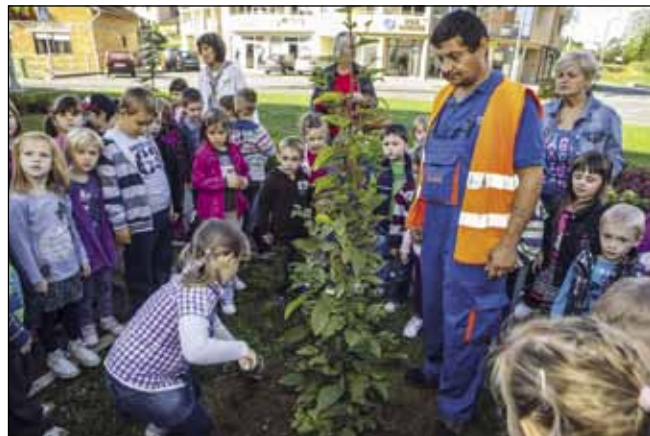
Djeci u vrtiću se u odgoj usađuju „zeleni“ vrijednosti