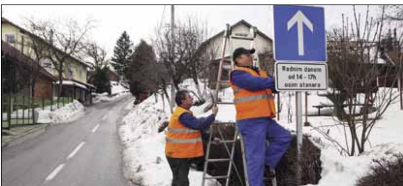
Znakovima je reguliran tok prometa radnim danom od 14 do 17 sati

na plinsko gorivo vrste C (koji nisu ovisni o zraku iz prostorije) kontroliraju se i čiste jednom u dvije godine - dimovodni objekti i uređaji za loženje na kruta i tekuća goriva čiste se i kontroliraju jednput godišnje prije sezone loženja - po potrebi obavljaju se izvanredna čišćenja i kontrole na zahtjev korisnika - u prvoj polovici 2013. godine sukladno Odluci o organizaciji i radu dimnjačarske službe za grad Ivanec obavezno se čiste i kontroliraju dimovodni objekti uređaja na plinsko gorivo vrste B - u drugoj polovici 2013. godine, odnosno, prije početka sezone loženja kontroliraju se i čiste dimovodni objekti i uređaji za loženje na kruta i tekuća goriva i ostali dimovodni objekti sukladno Odluci S obzirom na specifičnost djelatnosti i drugih utjecaja (vremenske prilike) koncesionar zadržava pravo izmjene ovog plana. Za drugu polovicu 2013. godine plan obilaska kućanstava bit će naknadno objavljen.