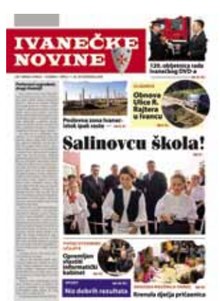
Prvi broj Iwanečkih novina

puno tema. Među ostalim, ove godine kraju privodimo višegodišnji program modernizacije nerazvrstanih cesta, pa slijedi donošenje novog. Bit će i gradnje sportskih terena i dječjih igrališta te cijeli spektar zahvata na uređenju i održavanju infrastrukture. Grad će i ove godine velik dio radova operativno vezati uz Ivkom. Kapitalni radovi započeti lani, nastavit će se ove godine (vodospremnik Pilana II, vodovod u Prigorcu). Pilana II važna je zbog toga što će se njome dugoročno osigurati vodoopskrba građana šireg područja Ivanca, s mogućnošću opskrbe i građana Jerovca,