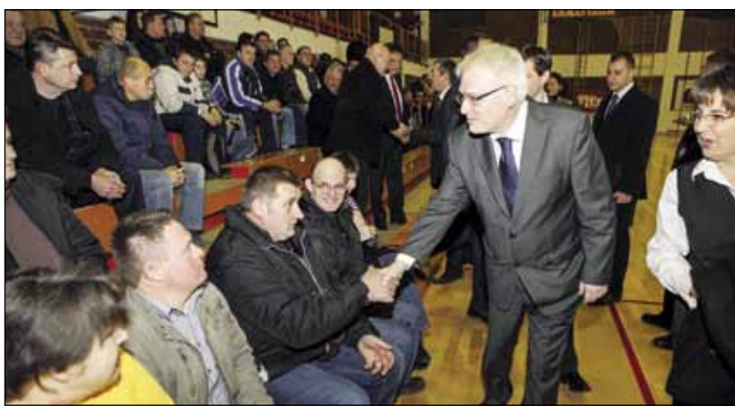
Predsjednik Republike nakon ulaska u dvoranu prvo je pozdravio članove Udruge osoba s mentalnom retardacijom Ivanečko sunce