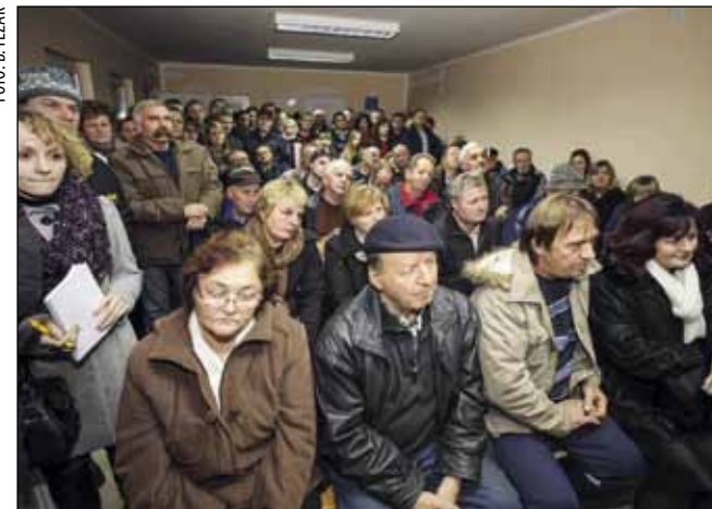
Prostor društvenog doma u Cerju Tužnom bio je pretijesan za mnoštvo prosvjednika

- Nismo došli zatvarati ciglanu, jer u njoj rade naši ljudi! Ali došli smo štiti i braniti ono