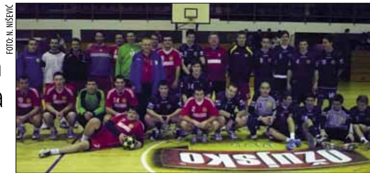
Prva utakmica u nastavku prvenstva ivanečke rukometaše očekuje u gostima kod Borova

Hrg je domaćoj javnosti po-znat kao istaknuti sportaš i više-trener prvak Ivanca u tenisu te kao trener teniskih škola za mlade uzraste. (N. Nišević)