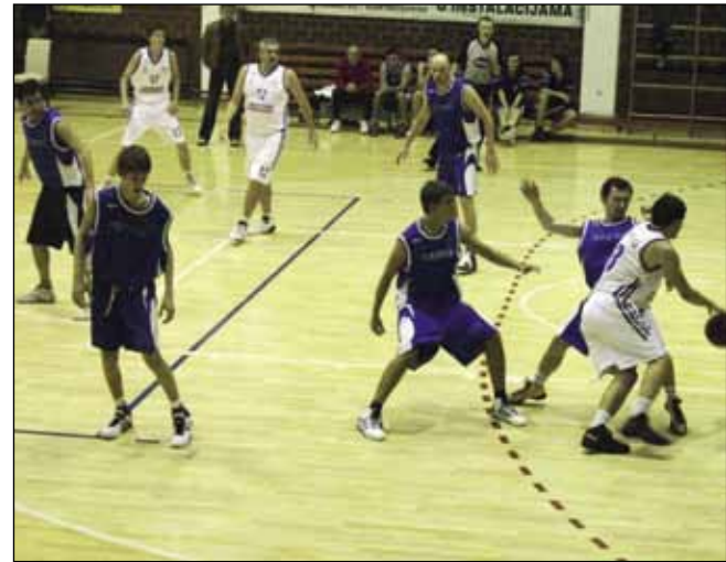
Ivanečki koškarkaši igraju s promjenljivim uspjehom

U sljedećoj utakmici u Ivan-čici Ivančica je poražena od Gra-fičara sa 67:81. U listu strijelaca upisali su se Sayemeldahr (17), Morović i Mikac sa 13, Kapu-štić 9, Skupnjak 8 i J. Putarek sa 7 koševa. (N. Nišević)