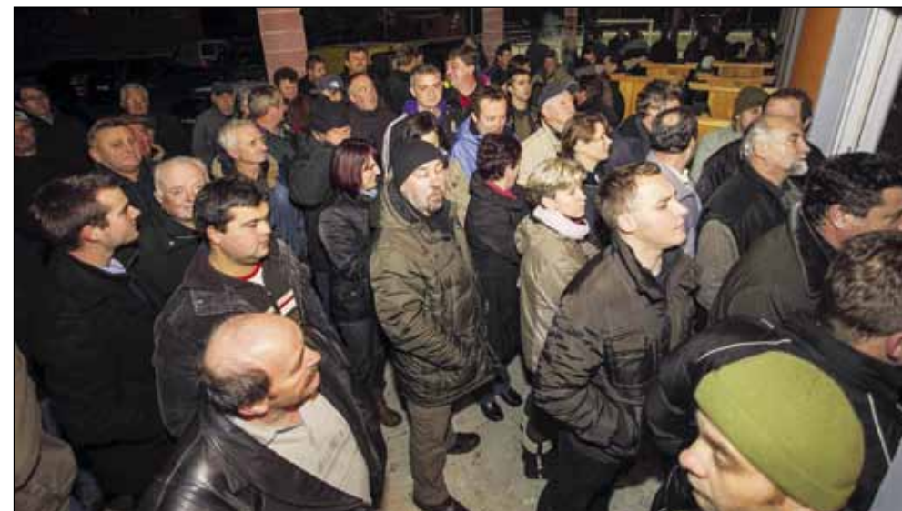
Mnogi su skup pratili izvana