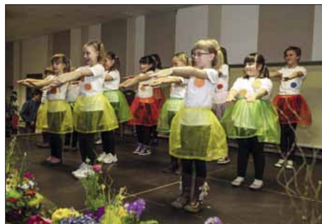
Zvijezdice su izmamile buran pljesak publike

građenog stažnjevečkog mosta i nepostavljene rasvjete, ali i predstojećih izbora. Posjetitelji su se do suza nasmijali i dosjetkama u skeču Keramičar, u kojemu je Kata naumila renovirati kuću, a šaljivih seoskih tema nije nedostajalo ni u trećem skeču, naslovljenom Čist račun – duga ljubav. Novina je bila i nastup malih komedijaša nazvanih Drageci, koji su izazvali salve smijeha prisutnih.