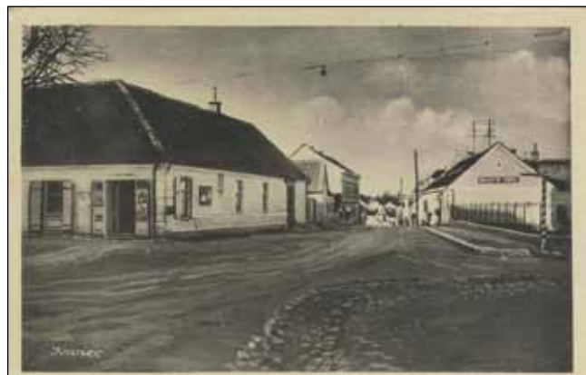
Bukovčeva je trgovina bila u jednom od najljepših ivanečkih zdanja, koje je „preživjelo“ do danas

Literatura: Mjesta u podnožju Ivančice kroz razglednice, Boris Jagetić Daraboš, 2005.