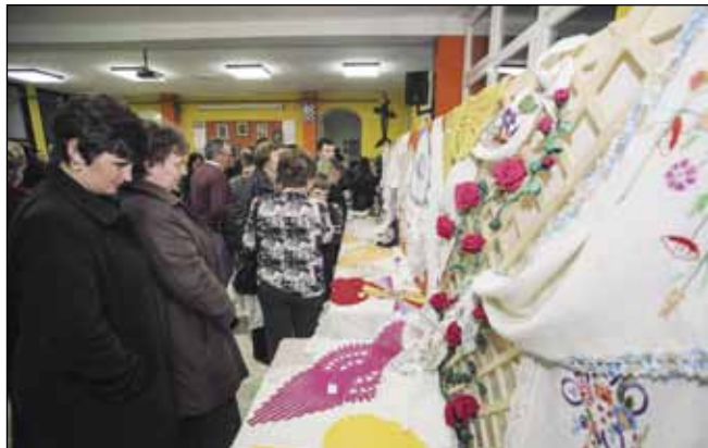
Raskoš radova žena i učenica radovanskog kraja

iz ormara izvade rukotvorine što ih čuvaju kao nasljede ili ih same izrađuju u slobodnim sa-