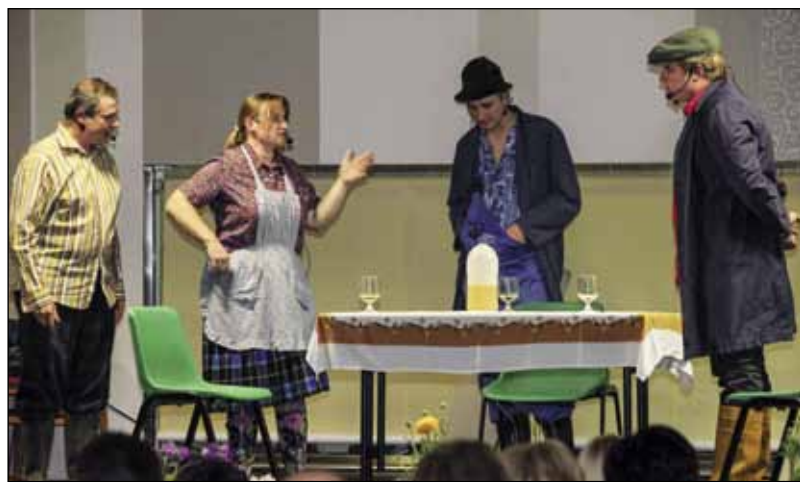
Komedijaši su publiku do suza nasmijali s čak četiri predstave

Drageci su razgalili publiku, a Stažnjevečke su zvijezdice Gangnam stylom izmamile gromoglasan pljesak publike