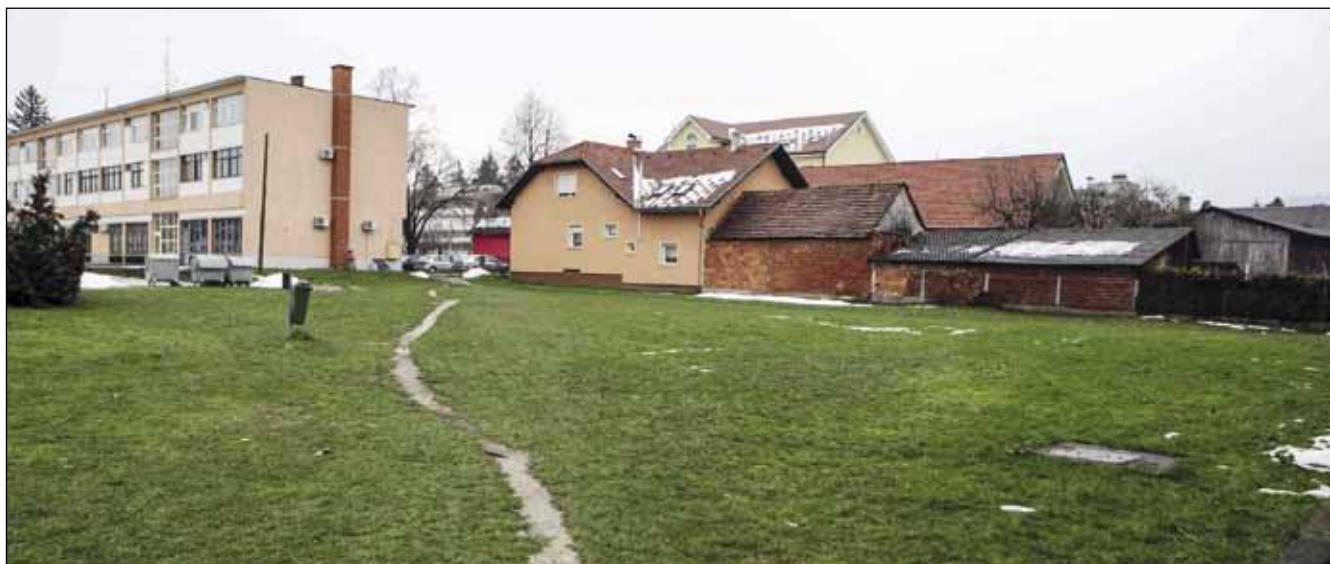
Igralište s pratećim površinama javne namjene gradit će se još ove godine

Podsjećamo, Grad Ivanec i Poslovna zona Ivanec d.o.o. lani su izlagali na REXPO-u Zagreb, koji je u dva dana okupio više od 1200 poslovnih ljudi iz više od 20 zemalja. (ljr)