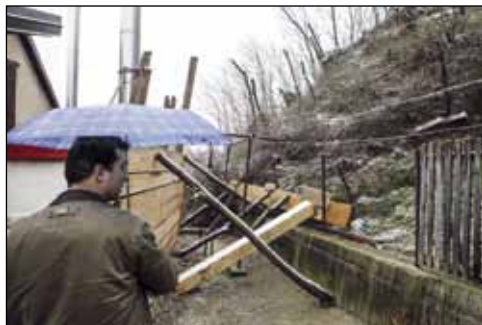
Veliko klizište u Ulici Bistrice u Ivanu

Prema prvim procjenama koje je potvrdilo i Županijsko povjerenstvo, ukupne štete na području naše županije iznose 27,38 milijuna kuna, a u toj svoti čak 4,21 milijun kuna (bez PDV-a) odnosi se na štete od devet klizišta nastalih na području grada Ivanca. U gradskom Upravnom odjelu za urbanizam i komunalne poslove ističu da je ponovno „proradilo“ staro klizište uz nerazvrstanu cestu u Vuglovcu koje je vrlo opasno, jer ugrožava obližnje stambene objekte i prometnicu.