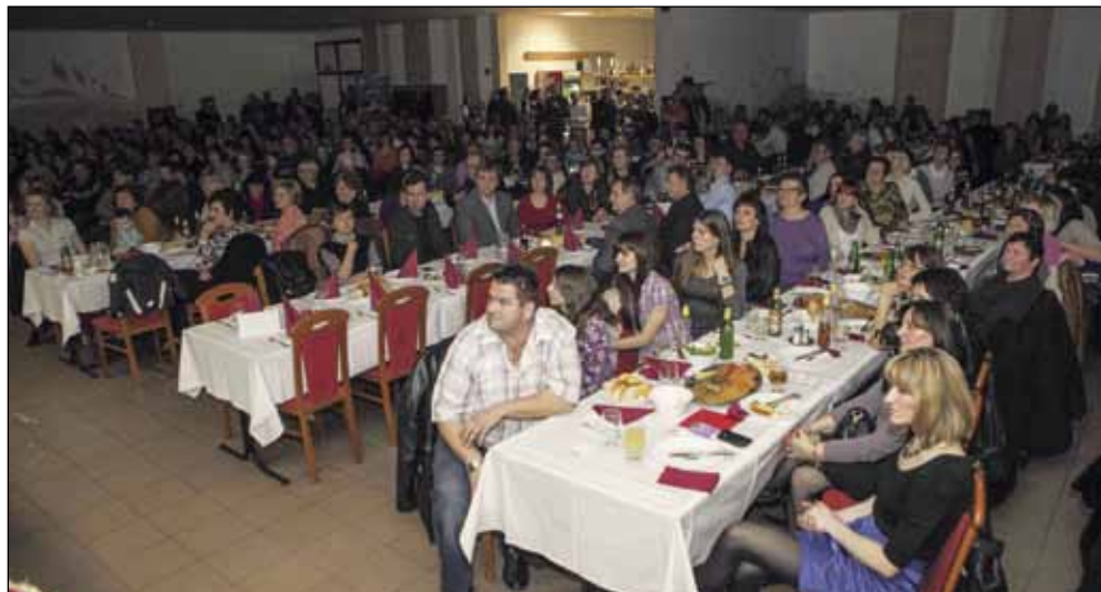
Dvorana je bila gotovo pretijesna za sve koji su željeli uživati u sjajnom štimungu stažnjevečkih glumaca

Zvijezde večeri ipak su bili Komedijaši koji su izveli čak četiri predstave. Prva je bila već tradicionalna Stažnjevečka kronika u kojoj su se dotaknuli neizbježnih i uvijek aktualnih lokalnih tema poput još neiz-