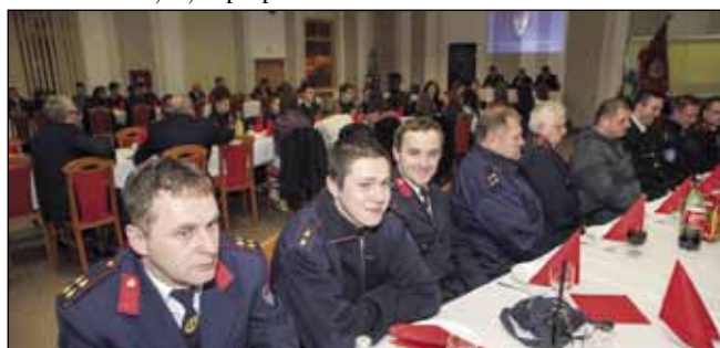
Ivanečki vatrogasci lani su na terenu proveli skoro 4200 sati

Lani su ivanečki vatrogasci djelovali 127 puta, a od toga su požare gasili 48 puta