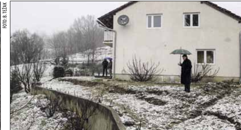
Ugroženi objekti u Bedencu