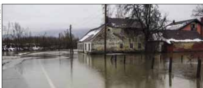
Je li netko od odgovornih za ovakvo stanje bio na terenu i razgovarao s vlasnicima poplavljenih kuća?

Odgovor na to - tko je odgovoran za stalno razlijevanje Bednje na tom pravcu i tko će