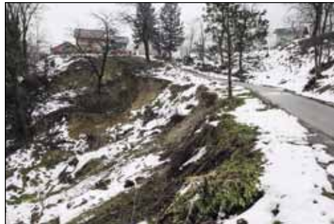
Nanovo se aktiviralo klizište u Vuglovcu