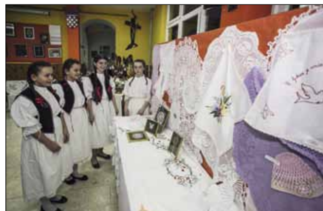
Radovanska mladež čuva običaje svoga kraja

tima naišao na plodno tlo, pa su izložbeni stolovi osvanuli u bogatstvu motiva, boja i radova