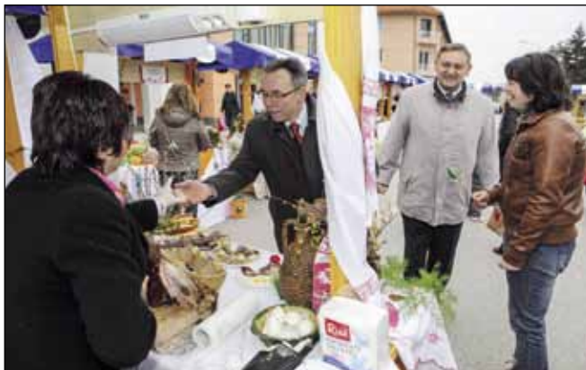
Štandove izlagača obišli su i gradski čelnici