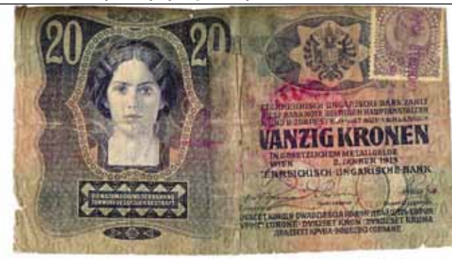
Ivanečka štedionica imala je ovlasti izdavanja obilježenih novčanica