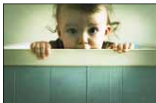
D. Sever: Children Are The Only Brave Philosophers

Svi zainteresirani mogu se učlaniti u Foto klub Oto na e-mail fotootoivanec@gmail.com ili se javiti jednom od njegovih članova. Radovi se mogu vidjeti na Facebooku u grupi F(oto) amateri Oto Ivanec.