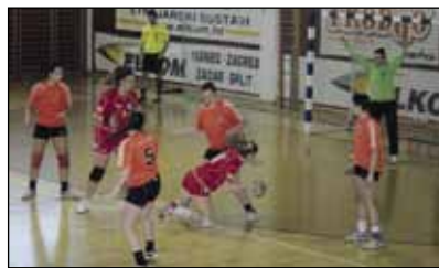
S 30:28 Ivančanke su porazile rukometašice Darde

U nastavku prvenstva u 2. HRL Sjever Ženska rukometna ekipa Ivanca poražena je od Bjelovara sa 17:32. I dok je taj susret izgubila, nadmoćnija je bila u igri s rukometašicama Darde koje je u utakmici 12. kola porazila s 30:28. Ta je utakmica bila važna za obje ekipe u borbi za očuvanje drugoligaškog statusa.