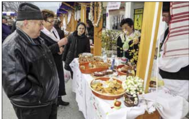
Pučke uskrsne delicije na štandovima udruga

Izložbu je organizirao Grad Ivanec uz logističku potporu Ivkoma i Poslovne zone Ivanec d.o.o. (aj, ljr)