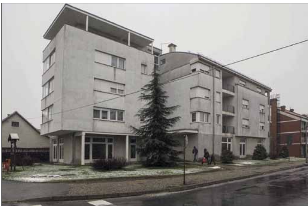
U prizemlju i podrumu zgrade u Gajevoj ulici Grad Ivanec na korištenje na neodređeno vrijeme bez naknade od države je dobio više od 400 četvornih metara prostora