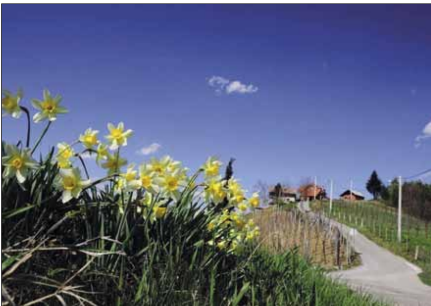
Cvijećem do nagrada u akciji Cvijet za ljepši grad 2013.

Dodajmo da Ivanec već niz godina drži primat u ukupnoj uređenosti manjih gradova na području Varaždinske županije te da u županijskoj akciji Zelena čistka redovito osvaja najviše priznanja u različitim natjecateljskim kategorijama. S obzirom na to da je lani visokom razinom ulaganja kroz program Betterment te prateća ulaganja Grada Ivanca i ŽUC-a u uređenje infrastrukture i pratećih površina te kontaktnih zona uvelike podignuta razina ukupne uređenosti našega grada i prigradskih naselja, ne čudi što u ovogodišnjoj županijskoj akciji Ivanec ulazi kao favorit. (ljr)