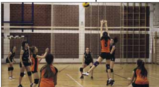
Ženska odbojkaška ekipa Ivanca