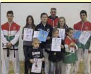
Uspješni natjecatelji TK Hwarang iz Ivanca