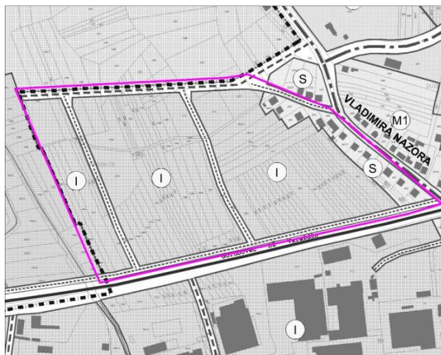
Slika 1. Područje izmjena Industrijske zone

Ovim ciljanim izmjenama i dopunama Urbanističkog plana uređenja Ivanca izvršila bi se izmjena prometnih rješenja u dijelu Industrijske zone u Ivancu (slika 1.) i dijelu zone pretežito poslovne namjene u Preradovićevoj ulici (slika 2.), te uskladila ostala infrastruktura vezana uz nova rješenja, a ujedno bi se izvršila korekcija granica Detaljnog plana uređenja površine sportsko-rekreacijske namjene „Jezera“ u Ivancu, uz Varaždinsku ulicu, sukladno namjeni površina iz važećeg UPU-a Ivanca (slika 3.).