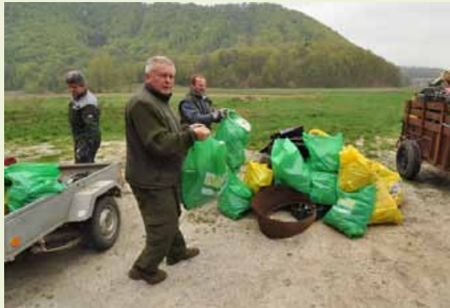
Lovci Šumskog zeca čistili su lovište i dovozili smeće na sabirno mjesto u blizini lovačkog doma

Životinjske iznutrice, kože, madraci, plastika – je li tome mjesto u prirodi, i to pokraj sportskog igrališta?