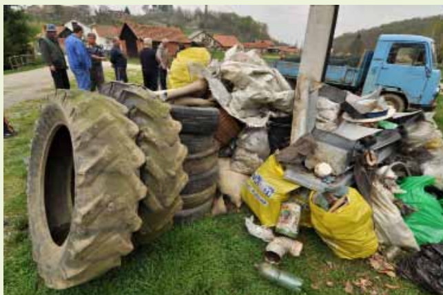
Sve su to mještani izvukli s Risnjaka i ispod Brezovca

Ipak, pozitivni učinci Zelene čistke vidljivi su i u Lukavcu. Otpada je manje nego lani, ali volonteri bi ipak bili sretniji da im se iduće godine pridruži još više mještana i mladih, kako bi sa skrivenih mjesta po šumama i potocima odstranili otpad što narušava ljepotu ovoga kraja. Vrijedne žene i djevojke uredile su oko-