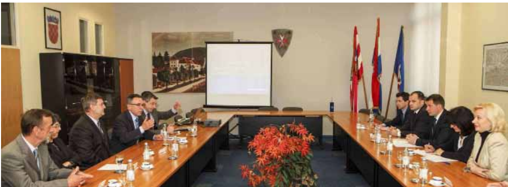
Na sastanku u Vijećnici razgovaralo se o projektiranju brze ceste i predstojećem otkupu zemljišta od građana za potrebe njene gradnje