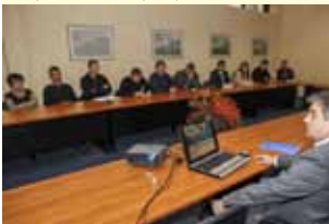
Savjetovanje su pratili lokalni poduzetnici i predstavnici gradskih tvrtki

ra toga zakona, on je iz prve ruke pojasnio i osam novih mjera za poticanje investicija koje su namijenjene različitim