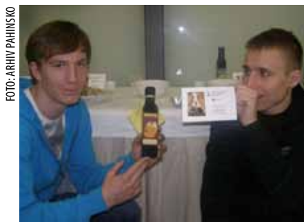
I mnoge Ivančane iznenadila je vijest da zadrugari Pahinskog proizvode vrhunsko bučino ulje

Zadrugarima Pahinskog priznanje je uručila krapinska županica Sonja Borovčak, a pohvale za svoj rad dobili su i od broj-