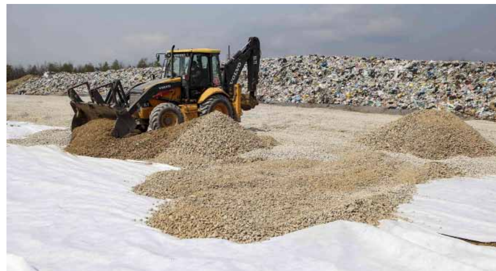
Radovi na novoj kazeti površine 7.000 četvornih metara

U tom velikom projektu koji u omjeru 60:40 financiraju Fond za zaštitu okoliša i energetske učinkovitosti i Grad Ivanec ugovoreno je i izvođenje niza drugih radova, među kojima i uređenje asfaltirane ceste i reciklažnog dvorišta, sanacija više od 16.000 četvornih metara starog odlagališta, gradnja ukupno 13.730 četvornih metara novog odlagališta te razne vrste hidrotehničkih radova. Cilj je u potpunosti sanirati jerovečko odlagalište i nakon otvaranja Piskornice u potpunosti ga zatvoriti za dalje odlaganje otpada. (ljr)