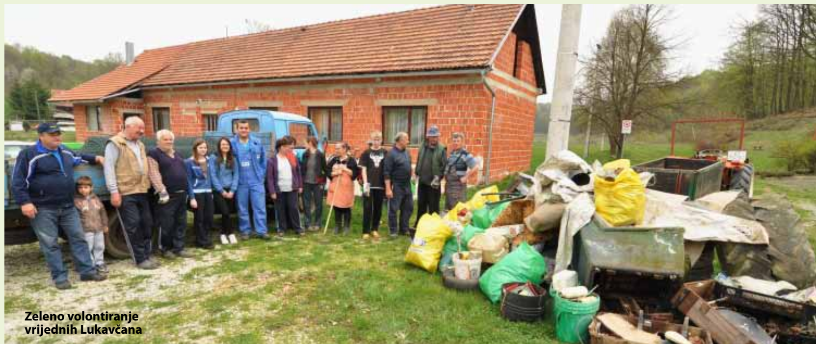
Zelena volontiranje vrijednih Lukavčana

MJESNI ODBOR LUKAVEC S područja Risnjaka i Brezovca akcijaši su odstranili gomilu krupnog otpada