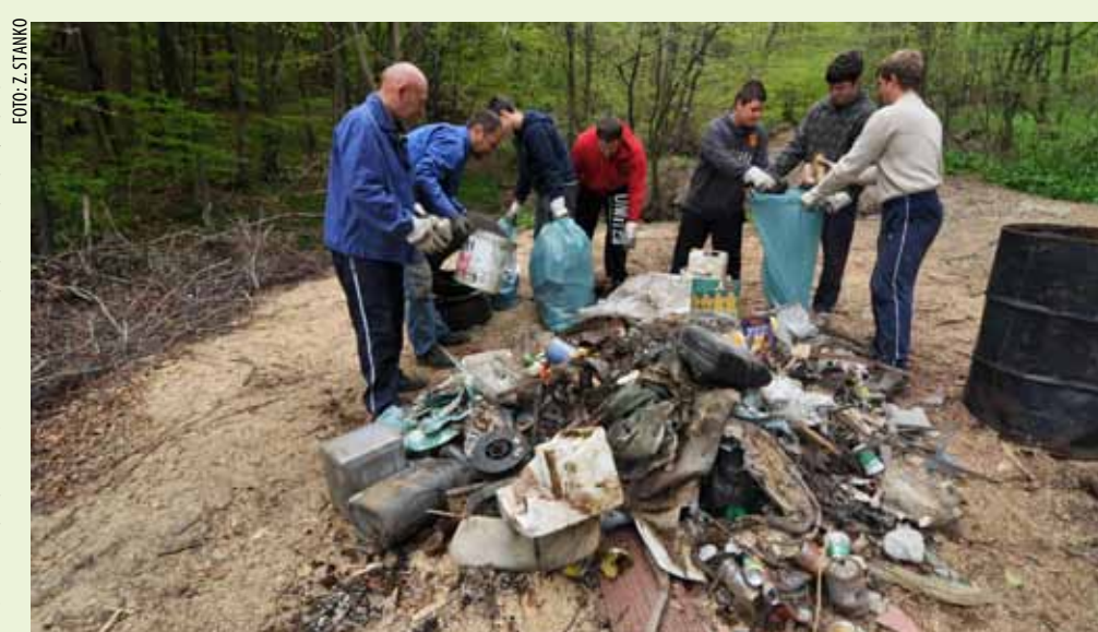
Brdo plastike, guma, metala, kanistara i drugog smeća očišćeno je na području Prijelasca

- Imamo lijepu drvenu kućicu u šumi, pa ćemo nakon akcije tamo predahnuti – otkrio je Šošćarek. Sasvim zaslužno, dodali bismo, jer o trudu mještana koji su se odazvali Zelenoj čistki najviše svjedoči gomila smeća što su ga izvukli iz prirode i time omogućili da Prijelasc ponovno može disati punim plućima! (ljr)