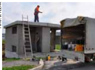
Gradnja nove trafostanice u Poslovnoj zoni

Trafostanica se može nadograditi do ukupne snage od 900 kilovata, što će biti dovoljno i za buduće potrebe ulagača