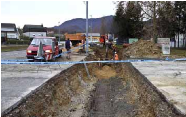
Gradnja odvodnje u sklopu Aglomeracije Ivanec bit će najveći infrastrukturni projekt u povijesti Ivanca (ilustracija)

za više naselja na području grada Ivanca koja pripadaju slivu Bednje. Prema preli-