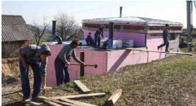
Prošlog su mjeseca radnici uređivali objekt i obavljali zemljane radove

Završetak radova na vodospremniku, gradnji precrpnih stanica i polaganju dva