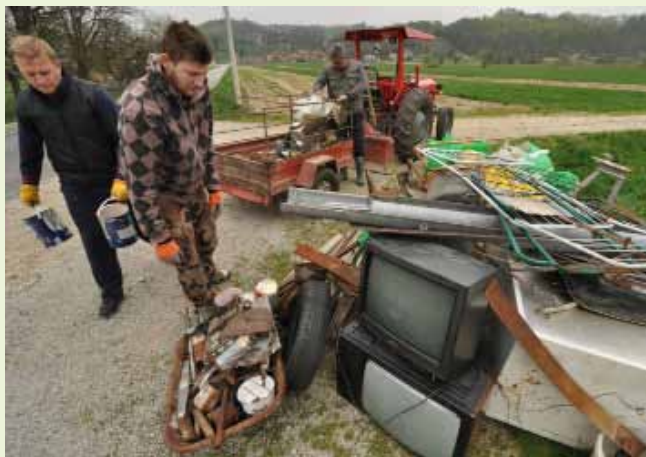
Stigla je gomila otpada iz Seljanskoga dola

MJESNI ODBOR SELJANEC Mještani iz prirode uklonili gomile krupnog otpada