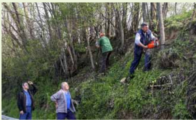
Posječena stabla poklonili su bolesnoj susjedi

dobro djelo: posječena stabla očistili su od granja te ih traktorom otpremili bolesnoj sumještanki, za ogrjev. Bude li potrebno, kažu, ispilit će ih i potvrditi se da njihova susjeda, koja je za vrijeme trajanja akcije bila u bolnici, ne oskudijeva ogrjevnim drvom.