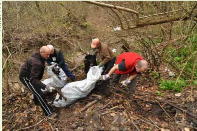
Članovi Planinarskog kluba Ivanec i mještani u akciji čišćenja Tamnog dola