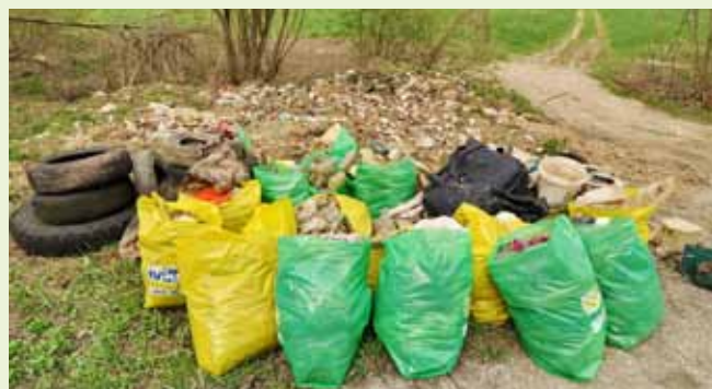
Volonteri su iz starog rukavca izvukli poveliku hrpu otpada, ali – ima ga još puno