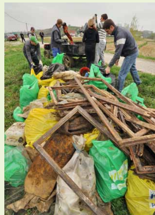
Ribjak i Botušje puno su čišći nego prije

Vrijedni mladi ljudi za tren oka su ispraznili prepun motokultivator, pa se hrpa skupljena otpada prilično povećala i potvrdila da su volonteri toga dana obavili velik posao.