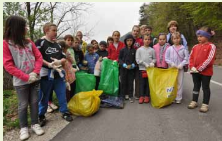
Djeca su ozbiljno shvatila svoju eko - zadaću

Inače, poznato je da PŠ Margečan u suradnji s Udrugom Margareta već godinama pojačano radi na ekološkom odgoju učenika. Učiteljice djecu redovito uključuju u akcije uređivanja mjesnih izvora, a u suradnji sa Zavodom za javno zdravstvo proveli su ispitivanje kvalitete vode s izvora Curek. (ljr)