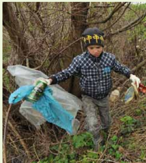
Djeca su bila najvrjedniji akcijaši

Mladi akcijaši sa svojim su voditeljima skupili velike količine otpada u Prigorcu i na pravcu prema Šumima