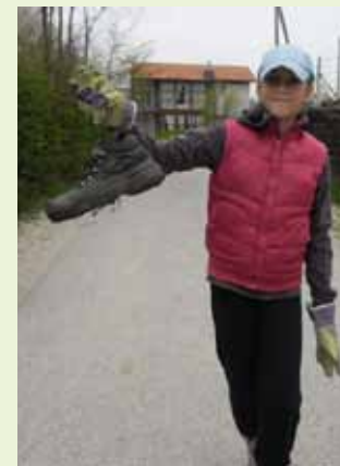
Halo, je li to vaša cipela?

Harjač – građani su Mjesnog odbora Lančić – Knapić i članovi mjesnog DŠR-a koji su se pridružili Jednom danu za čišćenje.