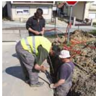
Postavljeno je 800 metara srednjenaopsonskog kabela od TS Lančić-Knapić do nove TS Knapić 2

S proljepšanjem vremena počeli su i skupi radovi na gradnji nove elektroenergetske infrastrukture na području Ivanca. Radnici Elektrina kooperanta, tvrtke Hrančić DDV, prošlog su mjeseca od trafostanice Lančić-Knapić do nove trafostanice Knapić 2 (koja je sagrađena uoči Božića, pa su radovi nakon toga morali biti obustavljeni zbog snijega) položili srednjenaopsonski priključni kabel. Položeno je oko 800 metara kabela.