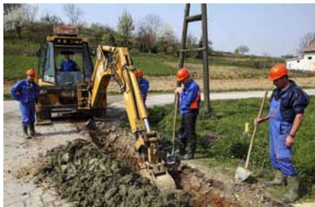
Novi vodovod u Gaćicama

Posluži li vrijeme, krajem svibnja završit će opsežni vodovodni radovi što su u Gaćicama počeli polovicom prošlog mjeseca. Rekonstrukcija starog, dotrajalog vodovoda što je građen još početkom 70-tih godina bila je neophodna, a cijevi od salonita i PVC-a bile su daleko od suvremenih vodoopskrbnih standarda.