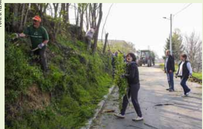
Vegetacija je tako gusta da se na ortofotosnimku cesta u Vrhovcu uopće ne vidi

Petnaestak volontera Mjesnog odbora Ivanečki Vrhovec Zelenu je čistku provelo u nedjelju, 21. travnja. Oni su na obroncima uz županijsku cestu počistili gusto raslinje i posjekli bagremove i druga stabla koja su se svojim krošnjama nadvila nad cestu te otežavaju vidljivost u prometu. Pokazali su nam i ortofotosnimak na kojemu se, zbog bujne vegetacije, ta cesta uopće ne vidi!