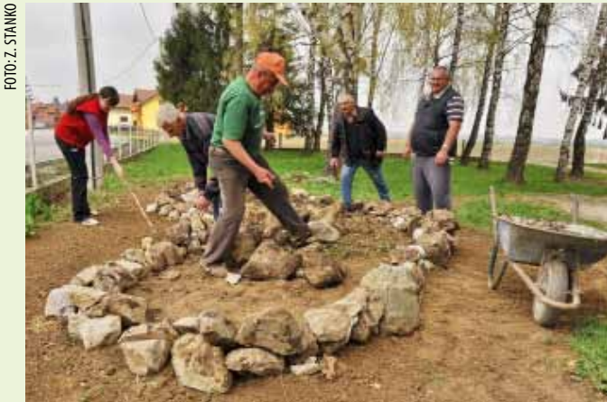
Grupa Salinovčana uređivala je površine pokraj stare škole