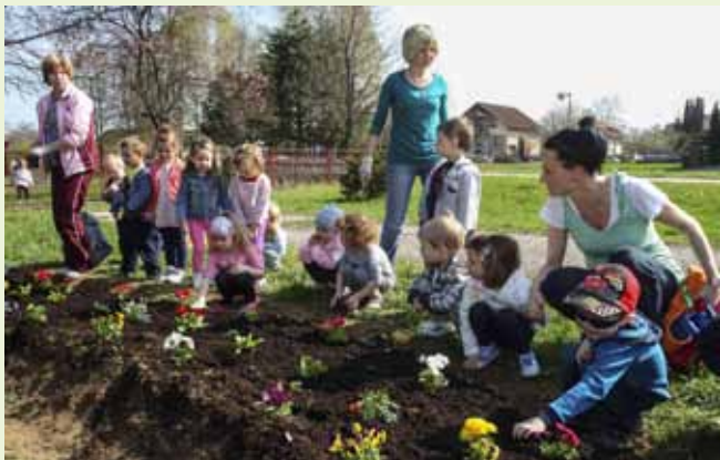
Jedno dijete – jedan cvijet! Dostojno vrtića koji će ovog mjeseca dobiti Zelenu zastavu

Zelena čistka ni ove godine nije prošla bez aktivnog angažmana lovaca. Dok je dvadesetak lovaca ivanečkog Jelena uklanjalo smeće uz Bednju na potezu od mosta u Kuljevčici do mosta u Jerovcu, članovi LD-a Šumski zec iz Margečana od smeća su čistili područje svoga lovišta. Na kraju su priredili i svoj čuveni grah s lovačkim „dodacima“, a zakuci i druženju u domu pridružili su im se i akcijaši iz Margečana i Seljanca. (ljr)