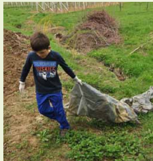
E, pa više ne može tako!

Za sobom su ostavili mnogo vreća do vrha napunjenih skupljenim smećem