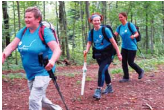
U dobrom raspoloženju: Do vrha Ivančice u majicama s logom Ivanca kao Planinarskog grada