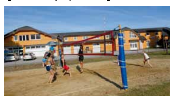
Odbojkaški turnir u znak sjećanja na poginule ivanečke branitelje