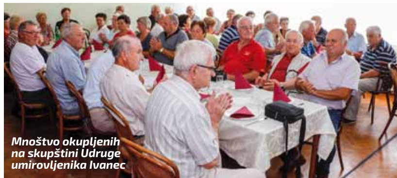
Mnoštvo okupljenih na skupštini Udruge umirovljenika Ivanec

NAŠI UMIROVLJENICI Redovita godišnja skupština Udruge umirovljenika Ivanec