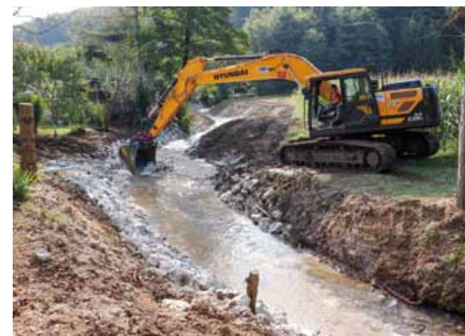
Sanacija odrona na potoku Željeznica

U međuvremenu su Hrvatske vode završile s radovima čišćenju potoka Bukovec (Rakovec) na području MO-a Kaniža. Radovi su obavljeni na potezu dugom oko 600 metara, od ulca u Bednju do pruge. U uređenje ovoga potoka nakon toga se uključio