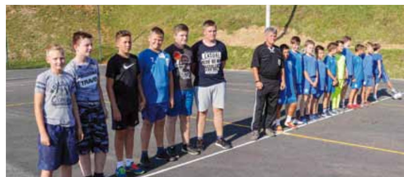
Snage na nogometnim terenima u Gačicama ogledale su ekipe djece iz Margečana i NK Ivančice