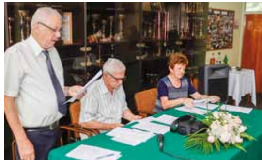
Vodstvo udruge izvijestilo je o provedenim aktivnostima u 2018. te donijelo program rada za 2019.

Domaćinima su se obratili i predstavnici srodnih i prijateljskih udruga iz Vidovca, Lepoglave, Bednje te predstavnik Udruge tjelesnih invalida ILO Ivanec. (aj)