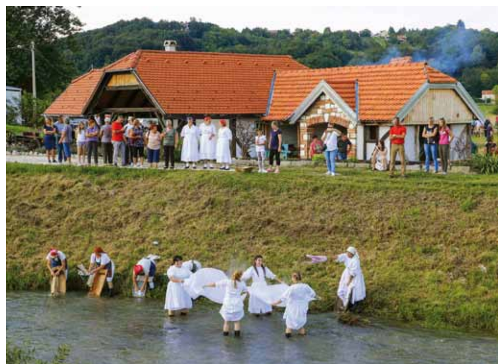
Pranje rublja na Bednji