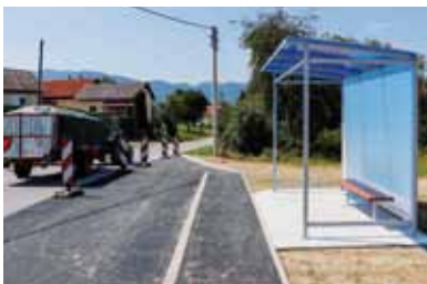
Novo autobusno stajalište i nadstrešnica na Ribić Bregu