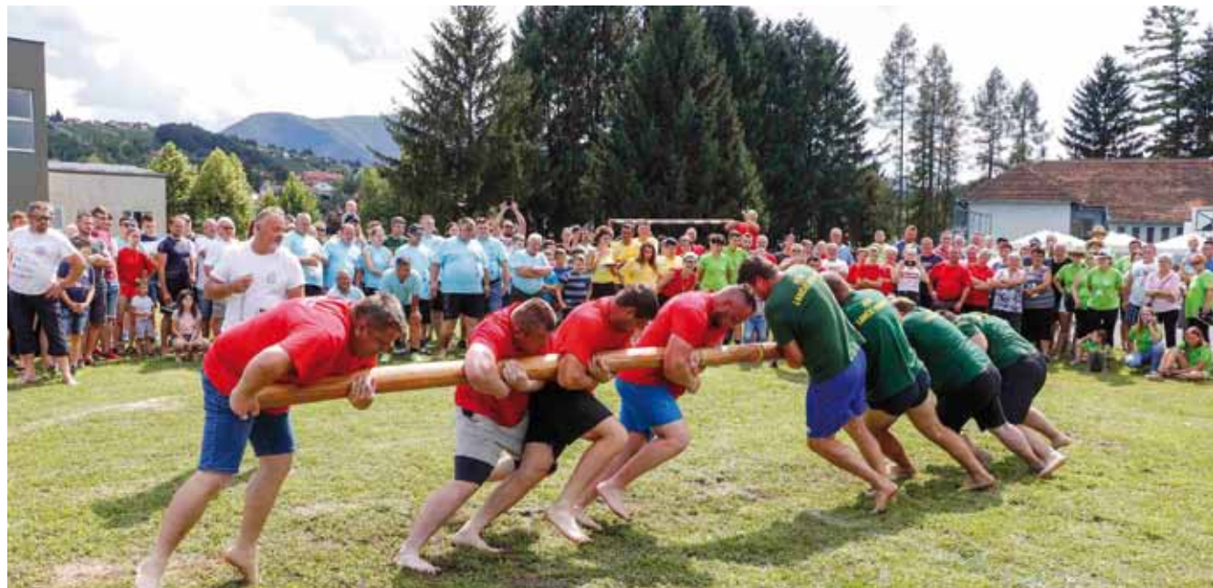
Bikovanje je nekad bila disciplina u kojoj se seoski dečki i muševi pokazivali snagu svojih mišića

STARI SPORTOVI U seoskim igrama srčano su se nadmetali članovi sedam ekipa