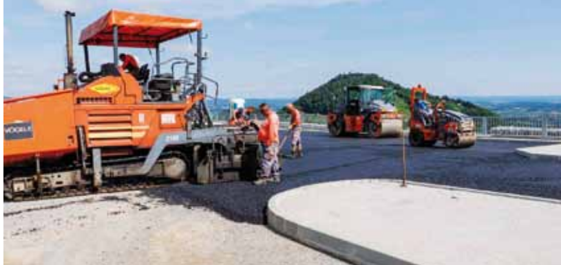
Asfaltiranje parkirališta na Rapikovcu

nijskom cestom LC 25118 do parkirališta, izgrađen je nogostup s istočne strane prometnice. Novim asfaltom presvučen je i odvojak Strugari u duljini od 160 metara.