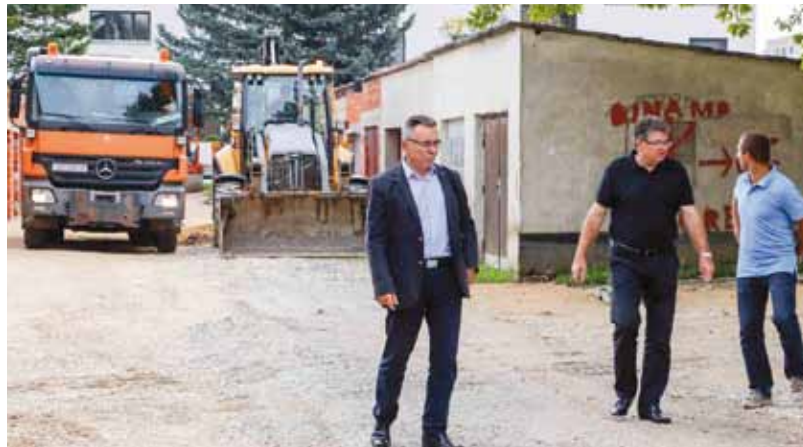
Nova cesta namijenjena je samo pješacima, a za pristup vozilima moći će je koristiti isključivo vlasnici garaža

UREĐENJE GRADSKOG CENTRA Radi budućeg zatvaranja gradske špice za promet