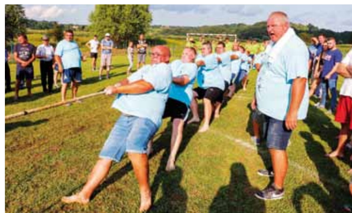
Povlačenje užetom jedna je od najtežih disciplina seoskih igara