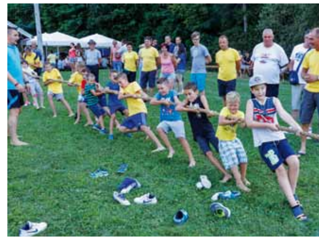
Najsrčaniji i najžustriji – klinci iz Stažnjevca

Pehare pobjednicima uručio je gradonačelnik Milorad Batinčić te domaćinima čestitao na