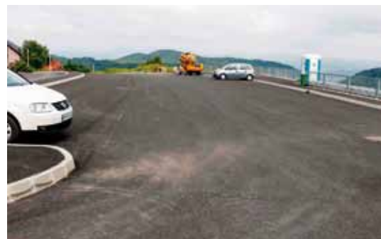
Posjetiteljima je na raspolaganju 50 parkirnih mjesta na Rapikovcu, plus 15 dodatnih mjesta uz prometnicu

Nadalje, na dijelu dionice od raskrižja sa župa-