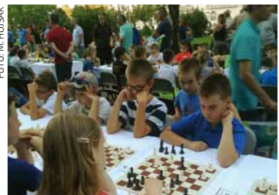
Naši šahisti na Croatia Grand Chess u Zagrebu

Članovi Šahovskog kluba Ivanec su, nastupajući za OŠ Ivanec, osvojili prvo mjesto na turniru Croatia Grand Chess Tour u Zagrebu, najjačem pojedinačnom natjecanju u svijetu u 2019.