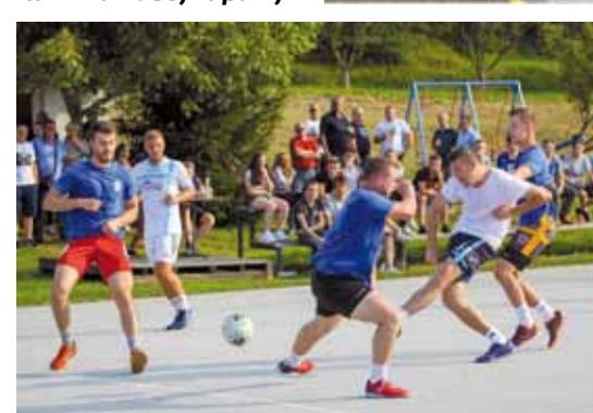
Djelić natjecateljske atmosfere

MNT za Nenada prerastao je u najjači turnir u našoj županiji