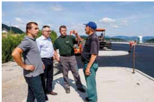
Za projekt osuvremenjivanja turističke infrastrukture u Prigorcu Grad je iz EU fondova privukao 3,65 milijuna kuna

Investitor je Grad Ivanec koji je većinu sredstava, 3,65 milijuna kuna, povukao uspješnim kandidiranjem projekta na EU poljoprivredni fond za ruralni razvoj