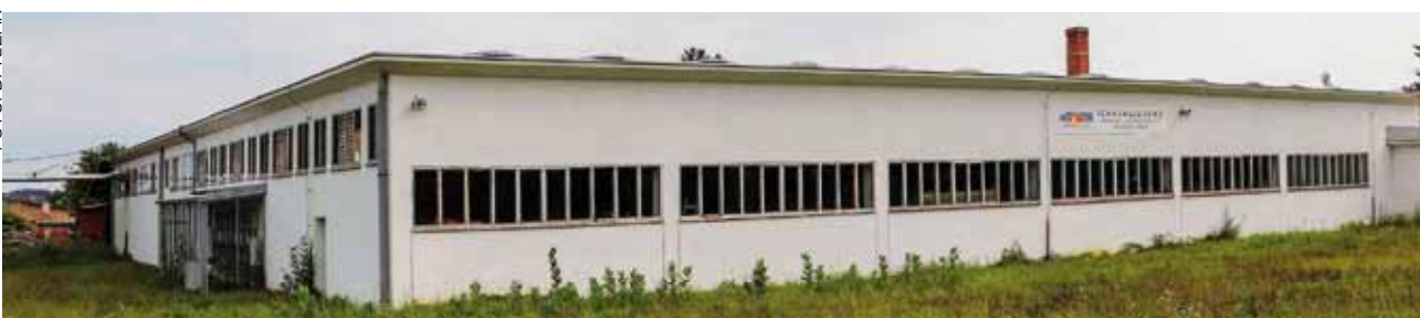
I napuštena hala nekadašnje VIS-ove Svilane bit će uređena i ponovno stavljena u poslovnu funkciju

Što se tiče navoda da na sastanke pozivam samo podobne, mislim da nitko od vas ne ulazi u unutarstranačke aktivnosti drugih političkih stranaka, pa tako ni ja nikomu ne dajem pravo da me proziva ako na sastanke svoje stranke pozovem predsjednike MO-a iz redova HNS-a.