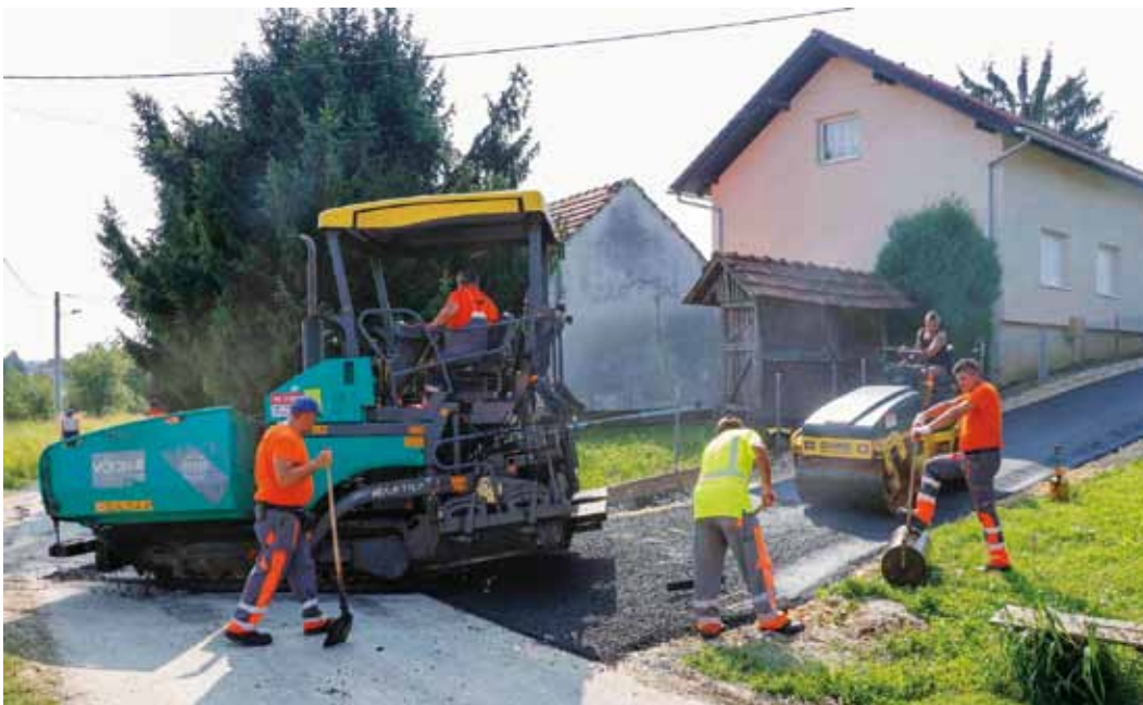
Asfalt je položen na tri odvojka u zaseoku Krtnjeki u MO-u Jerovec Gornji

Iz gradskog proračuna ove se godine u asfaltiranje ulaže 3,36 milijuna kuna, gotovo milijun kuna više nego lani