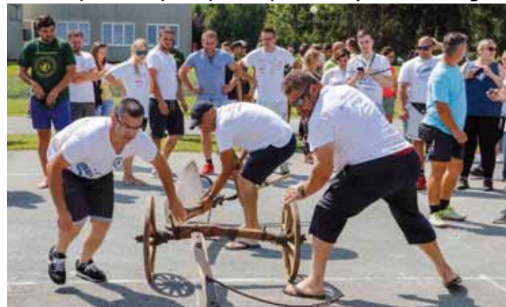
Sastavljanje pluga – vještina koja tone u zaborav i upravo zato valja je sačuvati

STAŽNJEVEČKI SUSRETI Dvanaestu godinu za redom