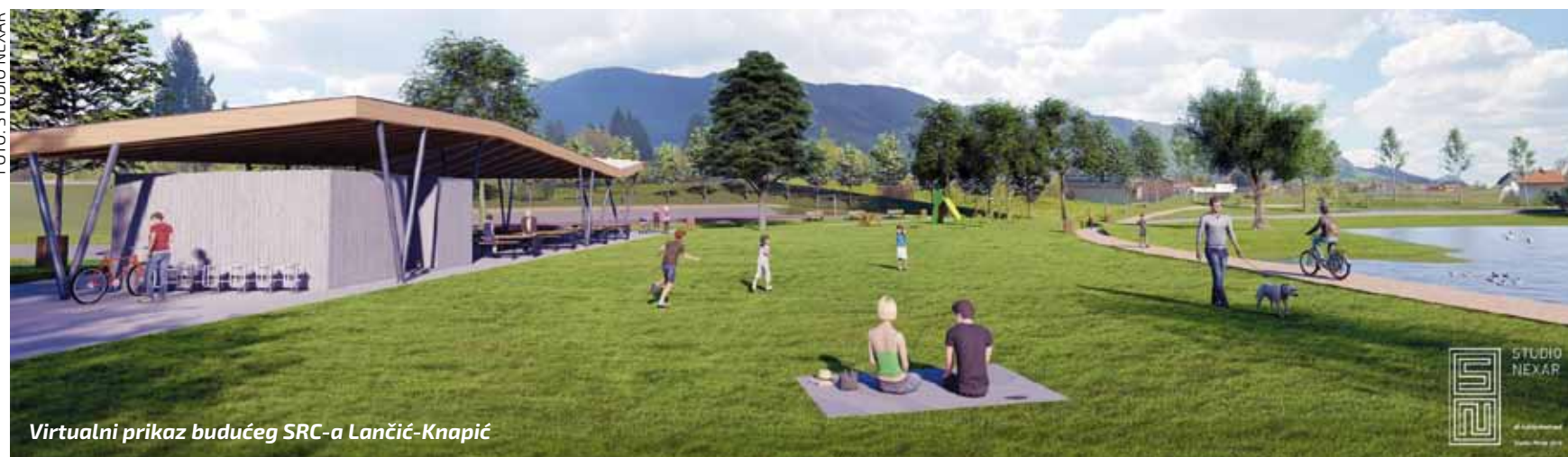
Virtualni prikaz budućeg SRC-a Lančić-Knapić