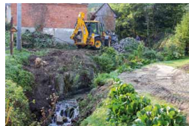
Uređuje se oko 300 metara Bistrice koja je pod nadležnošću Hrvatskih voda

Grad Ivanec, koji je financirao nastavak radova, točnije čišćenje 260 m na dionici od pruge do državne ceste i uzvodno.