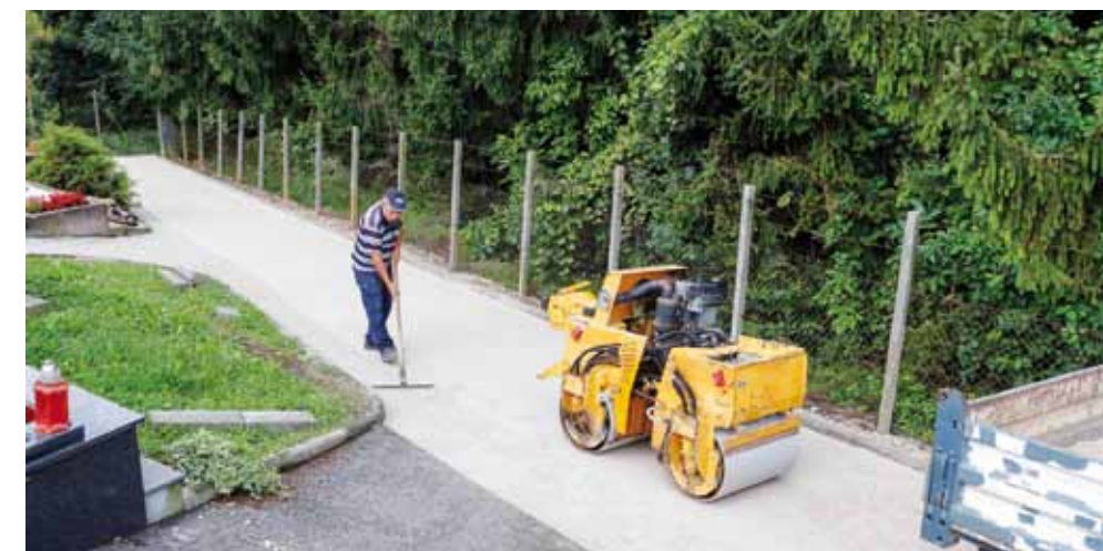
Na groblju Ivanec ove se godine glavina radova odnosi na uređenje glavnih i sporednih staza

dene i sporedne staze, a također će se postaviti i nove klupe i koševi za smeće. Groblje je u me-