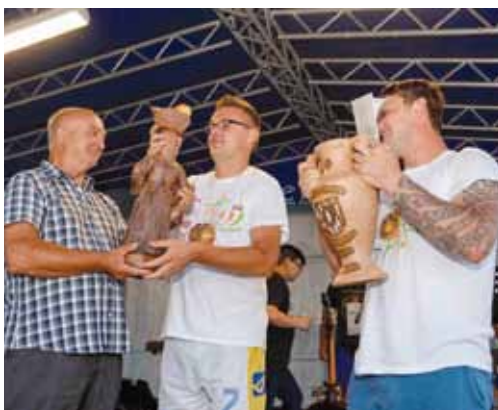
Oduševljenje u pobjedničkoj ekipi UŠR-a Stažnjevec

♦♦ S. Hudoletnjak: Salinovečki rekreativci tradiciju Seoskih igara prenijeli su na mlade generacije te ih time sačuvali za budućnost