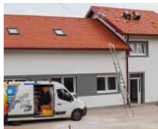
Obrtnički radovi na objektu u Jerovcu Donjem