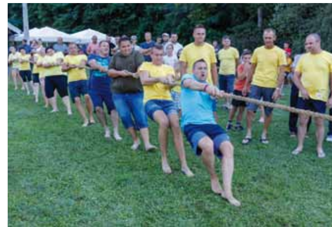
Za pobjedu nije važna samo snaga, već i tehnika!