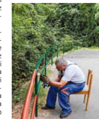
Kod grobne kuće u Prigorcu postavljena je zaštitna ograda

Na svim grobljima najesen će se zasaditi odgovarajuće zelenilo te groblja hortikulturno urediti