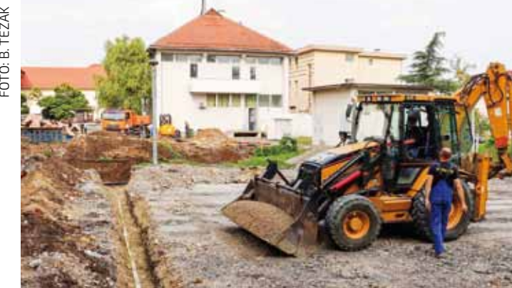
Uređenje budućih parkirnih površina iza zgrade FINA-e

Radi se na dijelu Bistrice koja je pod nadležnošću Hrvatskih voda, a slijede i radovi na potoku kroz Ivanec, koje će financirati Grad Ivanec