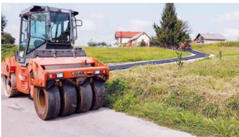
Asfaltiranje cestovnih dionica u Mjesnom odboru Horvatsko

Iz gradskog proračuna ove se godine u asfaltiranje ulaže 3,36 milijuna kuna, gotovo milijun kuna više nego lani