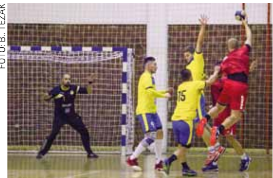
Ivančički rukometaši pripremaju se za novu prvenstvenu sezonu