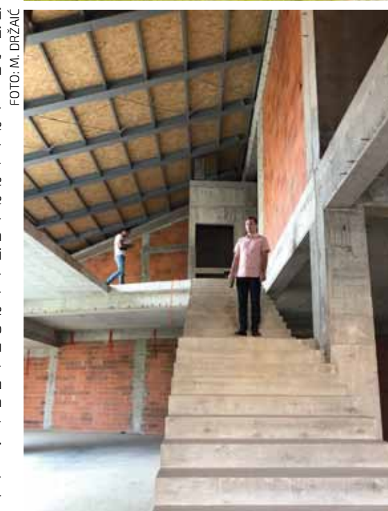
Gradnja objekta je završena, a sada predstoje radovi u unutrašnjosti

U idućim fazama slijedi uređenje unutrašnjosti, opremanje prostora te uređenje okoliša i pristupa muzeju