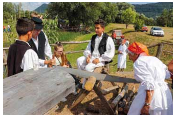
Tak su se negda pilila drva