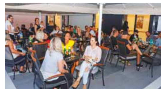
Djelić ugodne ljetne zabavne atmosfere

Ivanca i Kluba mladih Ivanec. Dogovorena je suradnja koja će početi projektom „Financijska pismenost i poduzetništvo“. Uz radionice u škola-ma, ona će uključiti i pub kvizove koji su se dosad, kroz aktivnosti Kluba mladih, pokazali kao sjajan način okupljanja mlade generacije.