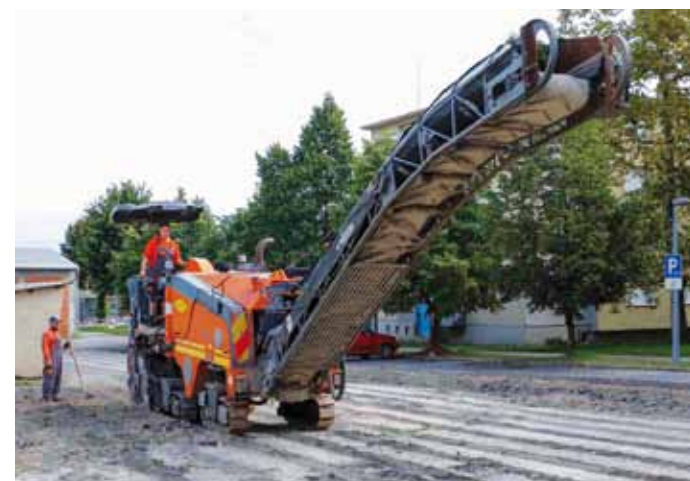
Stari asfalt je „preoran“, a prije uređenja parkirnih površina radove su obavili HEP i Ivkom - Plin

Građani Ivanca s velikim interesom prate radove koji se odvijaju u strogom gradskom centru, iza zgrade FINA-e i robne kuće, a koji obuhvaćaju probijanje nove pristupne prometnice i uređenje parkirališta. Ovaj zahvat najnoviji je u nizu povezanih projekata koje Grad Ivanec već nekoliko godina provodi u cilju predstojećeg uređenja glavnog gradskog Trga hrvatskih ivanovaca i njegova djelomičnog zatvaranja za promet te pretvaranja u pješačku zonu.