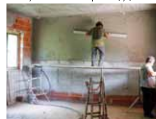
Žbukanje unutarnjih prostora društvenog doma u Škriljevcu

Takva praksa dosad se pokazala i više nego pozitivnom. To potvrđuju primjeri malih naselja u kojima se, nakon gradnje društvenih domova, mjesni društveni život doslovce preporodio. Osim što su mladi u njima našli mjesto za druženje i društvene igre, domovi su se pokazali i kao mjesta u kojima lokalno stanovništvo rado održava i manja obiteljska slavlja i slične skupove. (ljr)