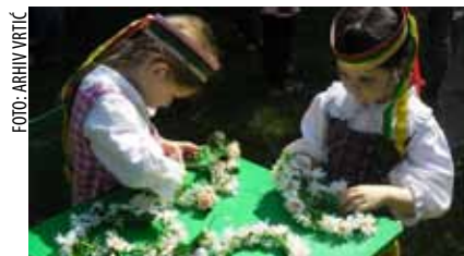
Ivanečka djeca znaju da Litavci obožavaju raženi kruh i palačinke s krumpirom (bliynas)

i kratku video poruku u kojoj se ukratko predstavio te naznačio najvažnije informacije o Hrvatskoj. Njihovu snimku Veleposlanstvo će poslati u jedan od litavskih vrtića, a sličan odgovor malih prijatelja očekuje se – dogodine. (ljr)