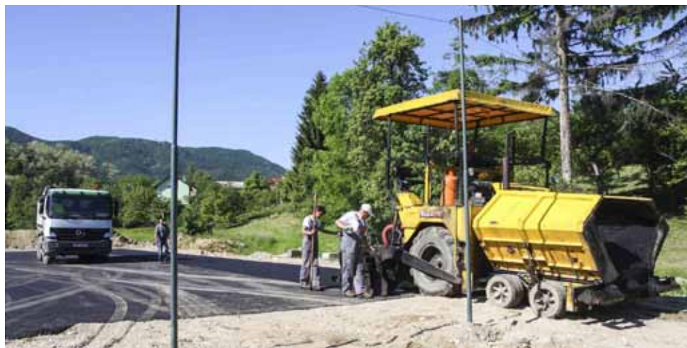
Asfalt na bivše travnato igralište u Vuglovcu

U Punikvama, gdje su sprave postavljene na neuređenoj površini (prethodno su kopani rovovi za potrebe postavljanja električnog kabela za rasvjetu igrališta), zemljište će se poravnati i zasijati travom te primjerenom urediti. (ljr)