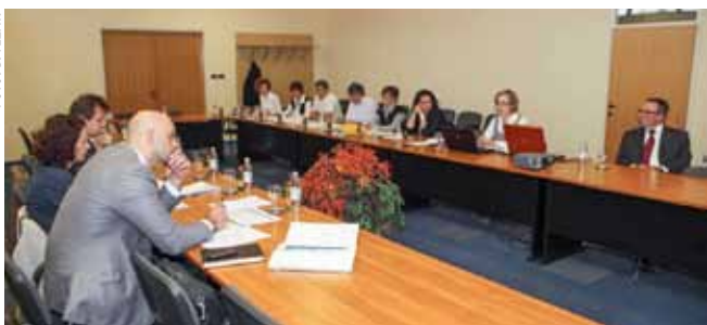
Višesatni sastanak u Gradskoj vijećnici

Opći je dojam Verifikacijske komisije da je gradski tim s Odsjekom za lokalni ekonomski razvoj, s Poslovnom zonom i gradonačelnikom