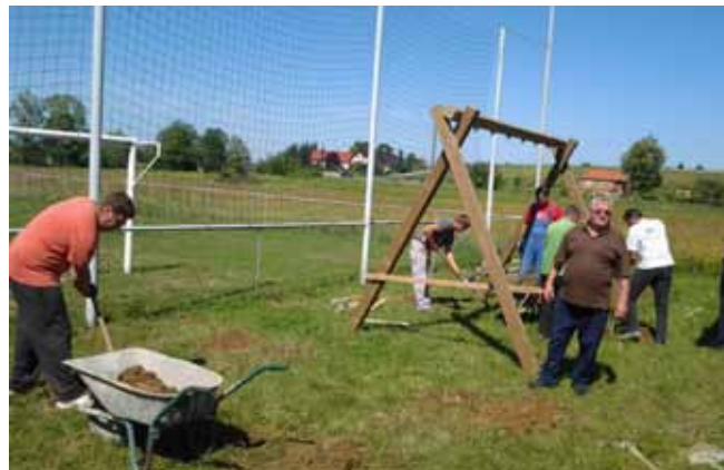
Postavljanje sprava u Cerju Tužnom

Troškove nabave sprava je s 73.625 kuna financirao Grad Ivanec