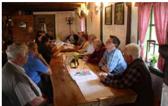
Klub okuplja članove koji dijele ljubav i strast prema starini i baštini

vodstvom dosadašnjeg predsjednika B. Krznara zaslužan i za zapaženu izložbenu djelatnost i sudjelovanje na cijelom nizu kulturnih manifestacija. Takve će se aktivnosti i nastaviti.