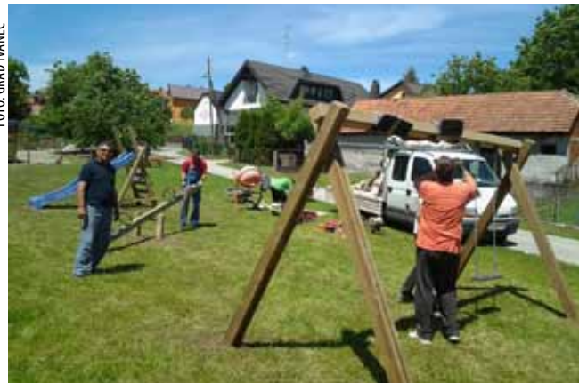
Nekadašnja neuređena površina u centru Ivanečkog Vrhovca pretvorena je u lijepo dječje igralište

Daljnji korak u Vitešincu bit će gradnja društvenog doma, a isto je u planu za Vuglovac i Gečkovec, gdje će se, nakon otкупа dodatnog zemljišta, dom sagrađiti za potrebe oba mjesna odbora. (ljr)