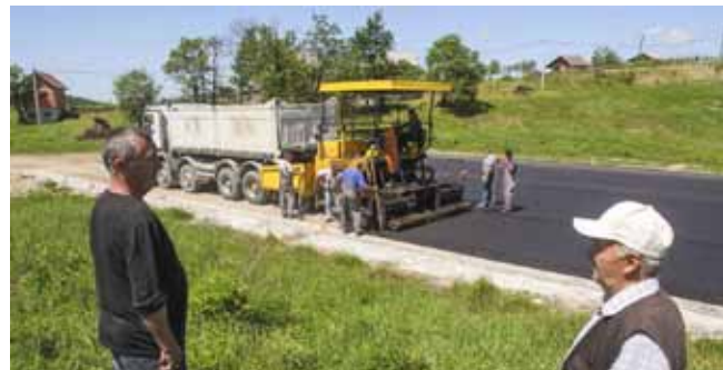
Novo igralište u Vitešincu

VINA Pojačane društvene aktivnosti ivanečke Udruge vinara i vinogradara Peharček