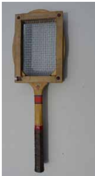
Originalni reket u zaštitnom okviru od hrastova drva

ska takmičenja. U svojim organizacijama imali su glazbene sastave, a ustroj im je bio podijeljen na muške članove (sokole), ženske članice (sokolice) i djecu (sokolice). S obzirom na to da Ivanec ima zavidne sportske aktivnosti i rezultate te je rasadnik sportskih kadorova, osvrnimo se na doprinos Steinera razvitku sporta u našem gradu.