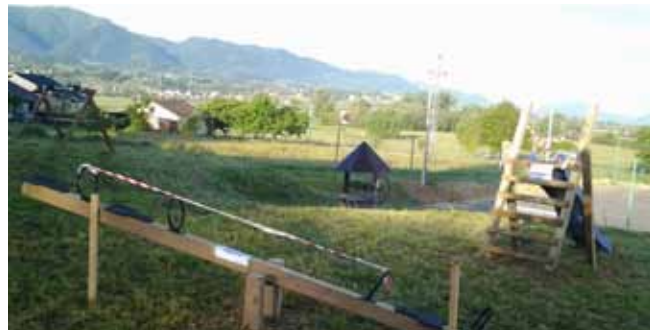
Tek postavljene sprave na igralištu u Stažnjevcu

IGRALIŠTA Uređena nova sportska igrališta