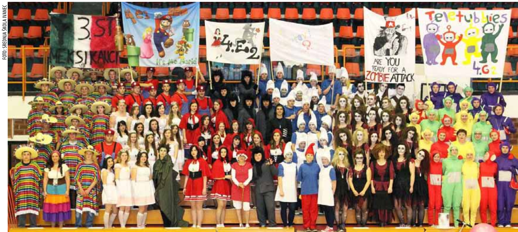
135 ivanečkih maturanata nastavilo je tradiciju svojih prethodnika te u sportskoj dvorani priredilo maštovit plesni i scenski program

kraju. Vinogradari su obišli i čuvenu vinariju Belje, Obiteljsko gospodarstvo Josić i vidikovac s kojeg puca predivan pogled prema nepreglednim vinogradarskim nasadima. To je bio tek prvi u nizu sličnih izleta što ih Peharček planira realizirati ove i idućih godina. U planu su i izleti u Kutjevo, Istru, Sloveniju i Austriju. (zs)