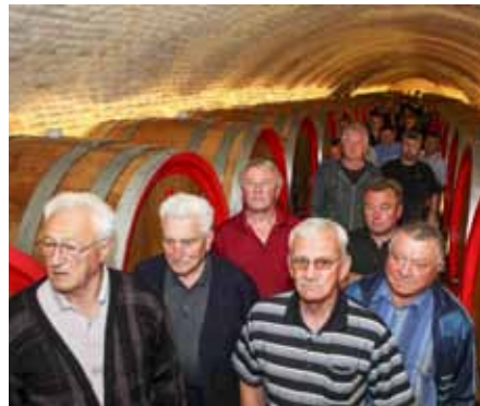
Ivanečki vinogradari u Baranji

VINA Pojačane društvene aktivnosti ivanečke Udruge vinara i vinogradara Peharček