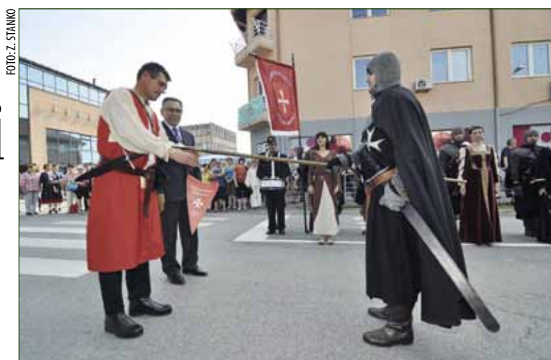
Zastavica s koplja za spomen na 1. dane vitezove ivanovaca

U ivanečkom TZ-u su pripreme za realizaciju te manifestacije obavljane tijekom prošlih nekoliko godina putem raznih projekata, od izrade i nabave odora i opreme do uspostavljanja suradnje s postrojbama u zemlji i inozemstvu, prvenstveno s onima koje djeluju u mjestima u kojima su nekad obitavali ivanovci. Inače, domaćini su svoje goste proveli atraktivnim ivanečkim turističkim destinacijama u sklopu projekta Nemreš fulat, a kruna njihova boravka u Ivancu bila je manifestacija Dan vitezova ivanovaca kojom je brojnim posjetiteljima omogućen pogled u srednjovjekovnu prošlost naše grada. (zs,ljr)