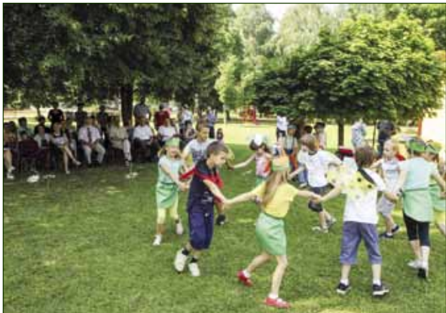
U ivanečkom vrtiću provodi se najpriznatiji model eko- odgoja na svijetu