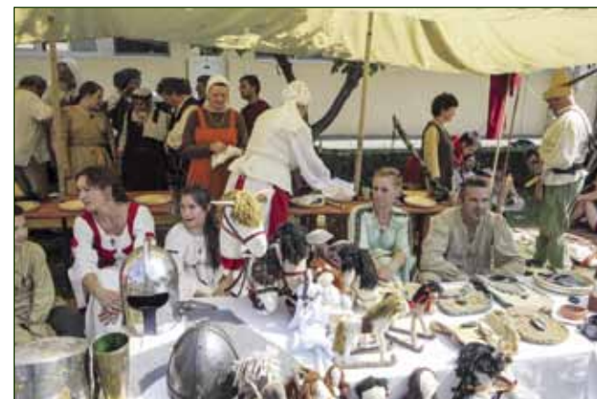
Nesvakidašnje - sajam srednjovjekovnih igračaka