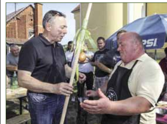
Zlatna kuhača ekipi Peharčeka za najbolji gulaš

Kuharske boje Udruge za šport i rekreaciju Stažnjavec