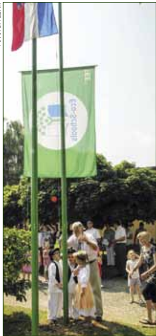
Podizanje Zelene zastave

i ponos odlukom Nacionalnog ocjenjivačkog suda o dodjeli Zelene zastave, čime se vrtić u Ivancu svrstao među samo trideset ustanova u Hrvatskoj koje se mogu pohvaliti eko – statusom.