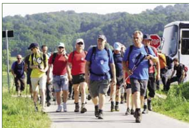
Ove godine na pohodu je sudjelovalo više od 80 planinara i izletnika

BRDSKI BICIKLIZAM Održana je 3. brdska utrka Downhill Ivanščica 2013.