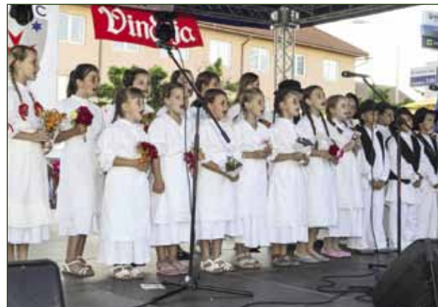
Kao cvjetići: Margaretice iz Margečana