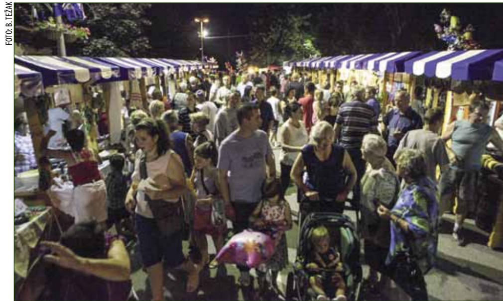
Posjetitelji su preplavili ivanečki gradski trg

Iako su, zbog ograničenog budžeta, u estradnom dijelu programa izostala zvučna „zvjezdana“ imena, svi se slažu da su domaći Peti element i Rockabilikum iz Varaždina bili pun pogodak, jer uz njih se plesalo i zabavljalo, atmosfera je bila naprosto sjajna. Da se i ne govori o Navihankama! Atraktivne Slo-