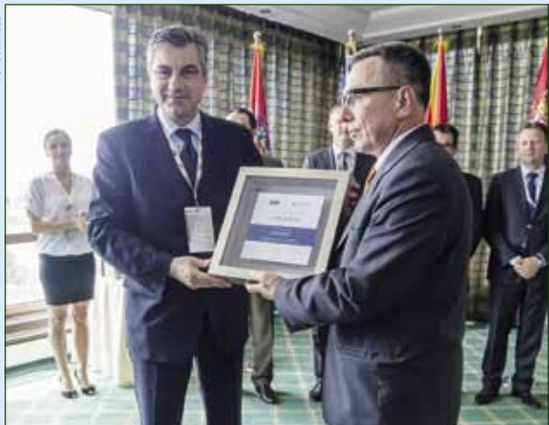
U Europsku Uniju Ivanec ušao s međunarodnim certifikatom

BFC znak signal je ulagačima da se lokalna zajednica maksimalno prilagodila njihovim potrebama, da raspolaže potrebnim bazama podataka, da je ažurna u registraciji no-