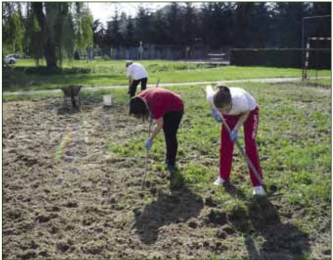
Motika im nije strana - odbojkašice su same uredile pješčano igralište

sportšaš prepoznali su prednosti tog sporta, pa je igralište svakodnevno posjećeno.