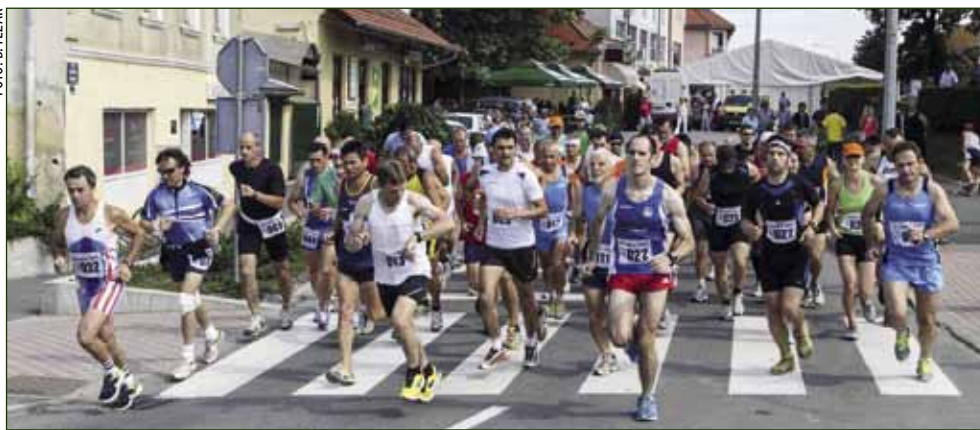
Put vrha Ivančice startala su 53 trkača iz Hrvatske, Slovenije i Rumunjske

BRDSKA UTRKA 21.međunarodna brdska utrka Ivančica 2013.