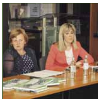
Program unapređenja stanja u poljoprivredi '13.