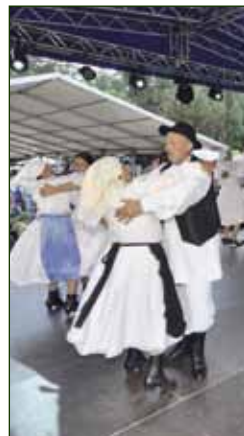
U živom ritmu salinovečkog folklor