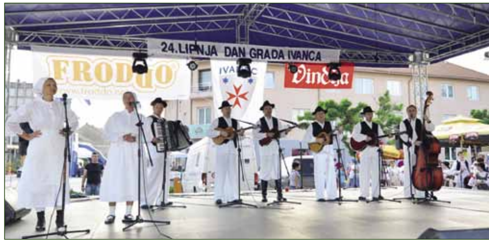
Društvo prijatelja glazbe i narodnih običaja Lompuš iz Radovana