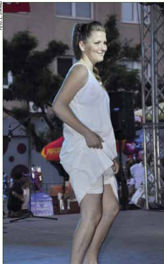
Bjelina nekadašnjeg donjeg rublja na djevojačkom tijelu

RASPJEVANA MLADOST Društvo Naša djeca uspješno je organiziralo dječju festivalsku manifestaciju