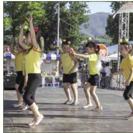
Dječje nastupe publika uvijek nagrađuje najburnijim aplauzom