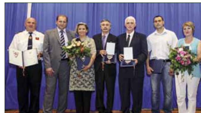
Dobitnici Priznanja Grada Ivanca

Ocijenivši da je Grad Ivanec u proteklih godinu dana ostvario nov, kvalitativan iskorak u realizaciji novih projekata te da su pripremljenost za EU i znanje najveći kapital s kojim ulazi u modernu zajednicu europskih naroda, gradonačelnik je posebno naglasio i važnost partnerstva države s regionalnom i lokalnom samoupravom. Zahvaljujući tomu, Ivanec je, kazao je, samo u godinu dana za