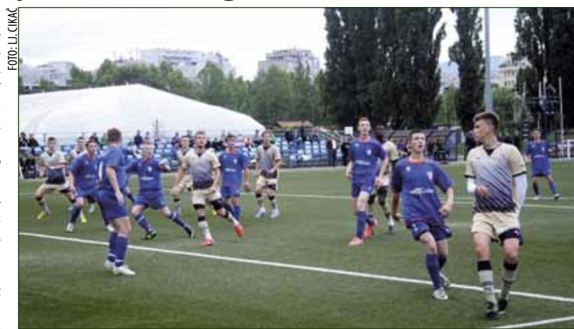
Utakmica na zagrebačkom Maksimiru

Suradnja NK Dinama i NK Ivančice bit će nastavljena, pa se već početkom kolovoza u Ivanec očekuje dolazak juniora i kadeta NK Dinamo, ovogodišnjih doprvaka i prvaka HNL u svojim uzrastima.(Lj. Cikač)