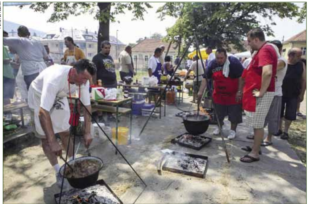
Vruće je bilo uz ovogodišnje kotliće na staroj ivanečkoj tržnici