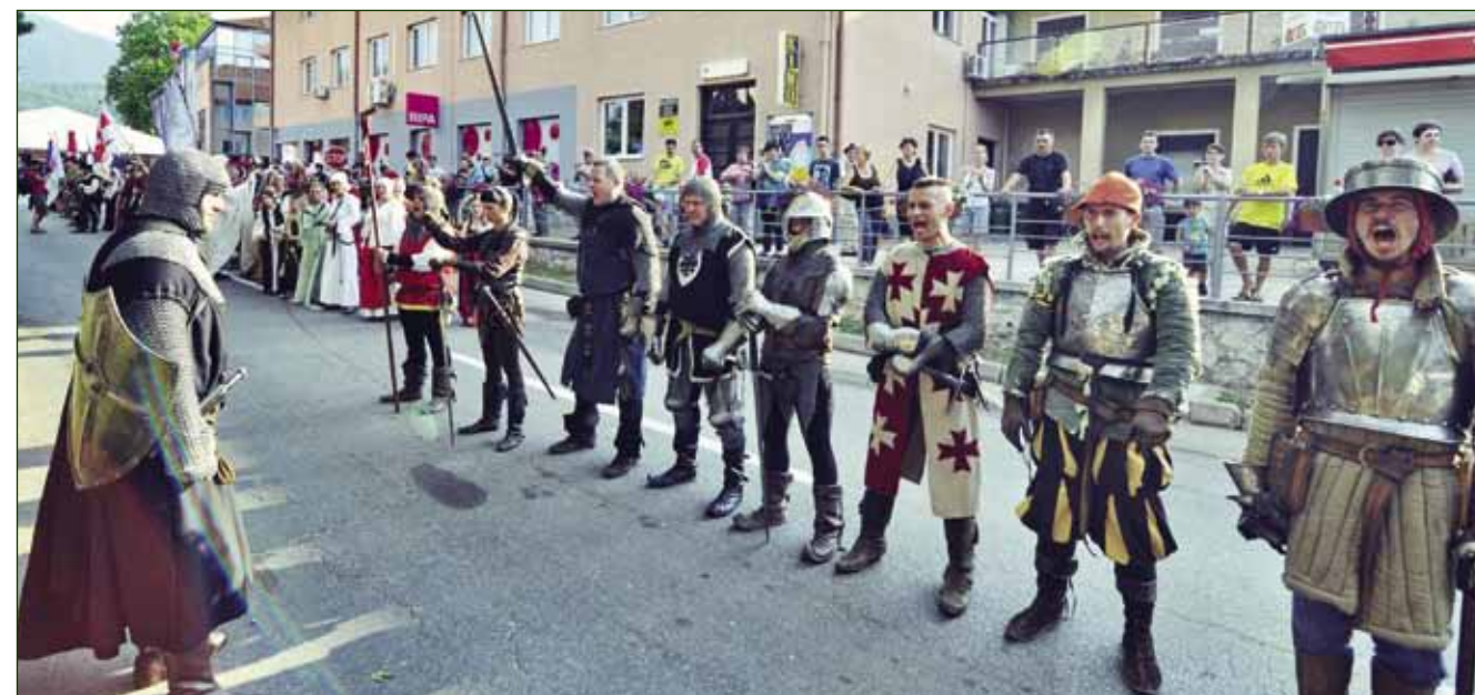
Atraktivne postrojbe iz zemlje i inozemstva pokazale su svoje odore i specifičnosti svoga djelovanja