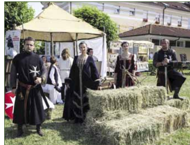
Ivanečki vitezovi u društvu dama pred svojim taborom