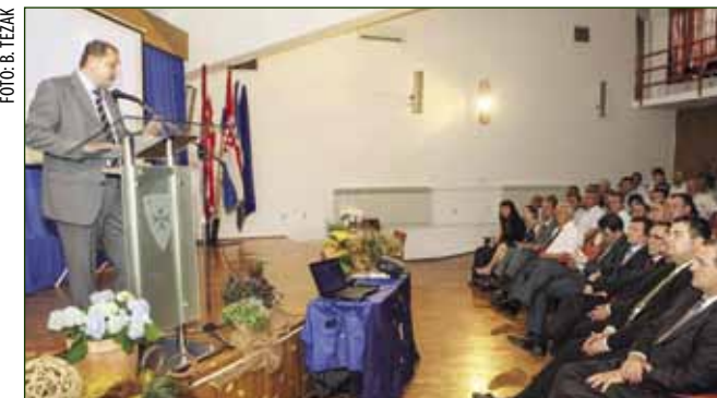
Mnoštvo gostiju na svečanoj sjednici Gradskog vijeća

Čestitke gradu uputili su i varaždinski župan Predrag Štromar i zamjenik ministra gospodarstva Alen Leverić koji je kazao da je Grad Ivanec jedan od rijetkih gradova u Hrvatskoj koji je potpuno pripremljen za ulazak u EU te najavio da će ga resorno ministarstvo i dalje podupirati, pogotovo u