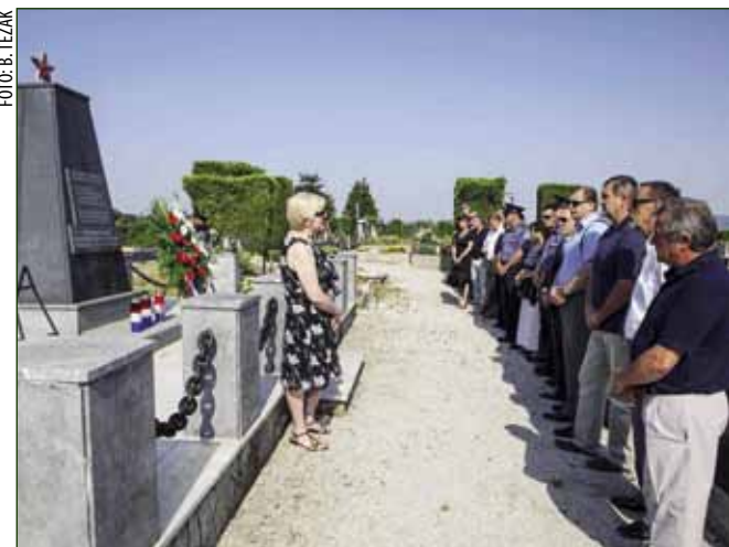
Vijenci su položeni na spomen – obilježja u Ivancu, Radovanu i Margečanu

Izaslanstvo Grada Ivanca potom je položilo vijence i na spomen – obilježja poginulim antifašističkim borbama u Radovanu i Margečanu. (lir)