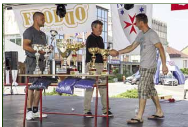
Proglašenje rezultata Malonogometne lige grada Ivanca

Rezultati 10. kola: Drvodjelac – Learta 4:2, DSR Ivanec – Jerovec 4:3, Sloga – DSR Lancić - Knapić 4:4, Prigorec – ITAS 2:1, Bo-lji svijet – Lukavčan 78 3:7. Rezultati 11. kola: ITAS –Bolji svijet 3:6, Prigorec –DSR Lancić Knapić 4:2, Sloga – DSR Ivanec 6:4, Jerovec – Drvodjelac 1:5, Learta – Lukavčan 78 4:2.