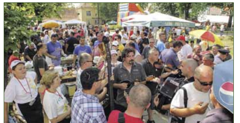
Ivanec kuha manifestacija je namijenjena druženju i dobrom štimungu