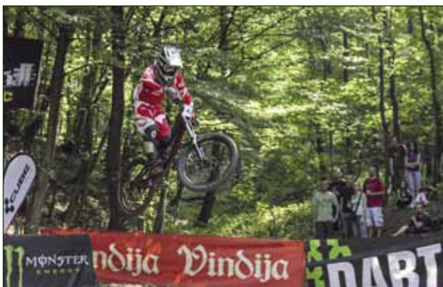
Downhill staza na Ivančici jedna od najcjenjenijih u Europi