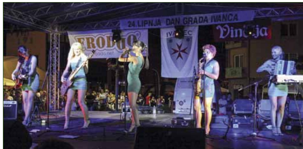
Sjajno raspoloženje uz atraktivne Navihanke