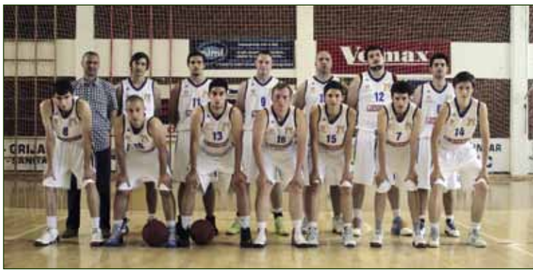
Košarkaška momčad Ivančice pobjednica je Otvorene lige